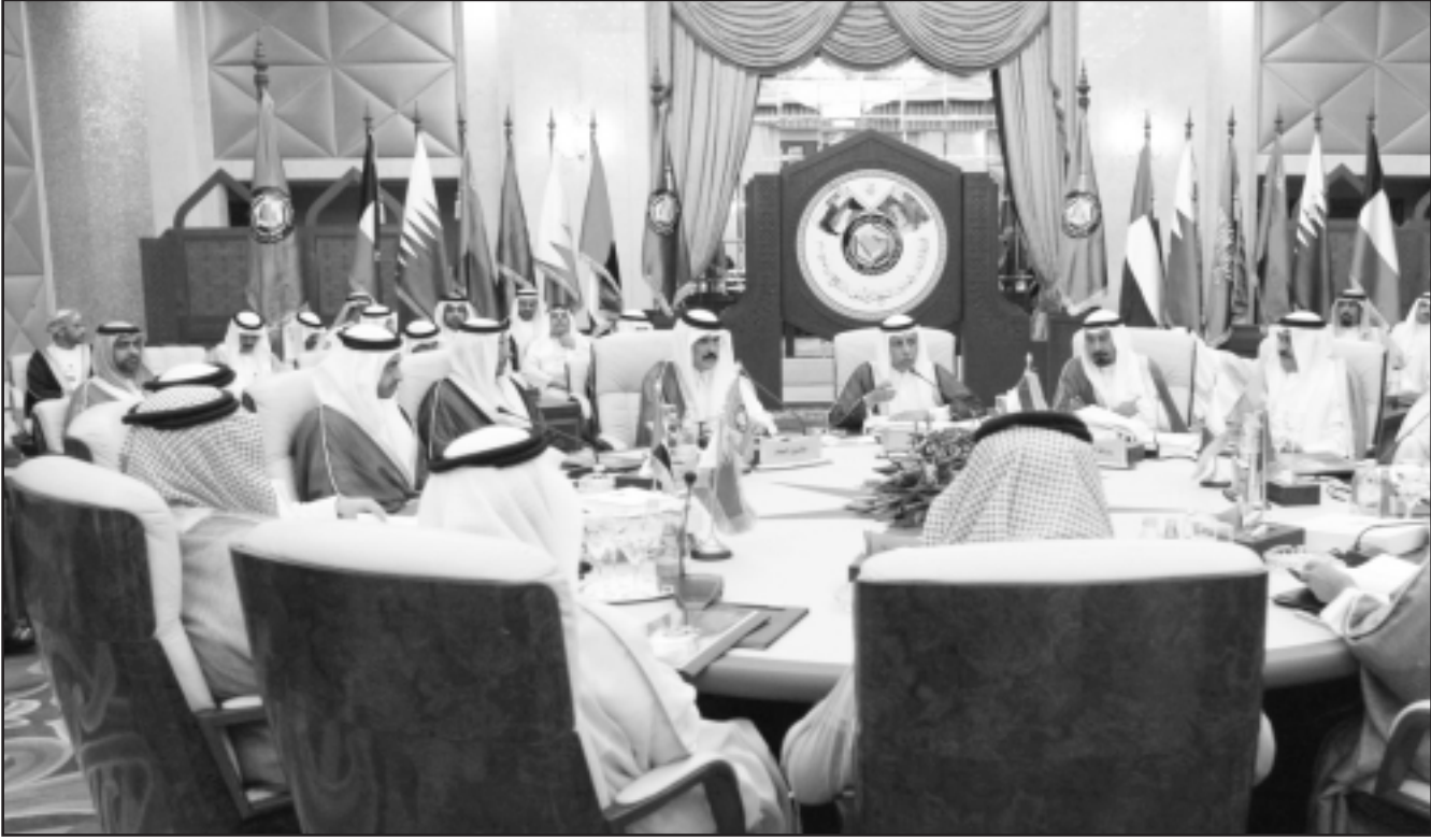
وزراء خارجية دول مجلس التعاون الخليجي خلال اجتماعهم في الدوحة امس

الخليجين بما تفكر به القيادة الايرانية حول ما يتعلق بالتهديدات الامريكية لها ولا سيما مسألة القواعد الامريكية، في دول الخليج. واوضح ان الرئيس الايراني سيجمل رسالتين الى الخليجين «الاولى هي ان ايران لن تتخلي عن تخصيص اليورانيوم ونتاج ال وقود النووي على اراضيها الثانية هي ان ايران لا تشكل اي خطر عليهم.