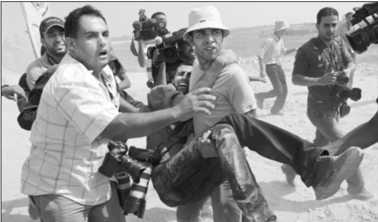
فلسطينيون يسعفون شابا أصيب برصاص الاحتلال الإسرائيلي بقطاع غزة

تحقيق مكاسب واهداف ضد القضية الوطنية من خلال العدوان والضغط على سكان القطاع، واعتبر ان الروايات الإسرائيلية التي تزعم حجم القوة العسكرية لدى النشطاء في غزة، مجرد «قرعات اعلامية لكسب التعاطف الدولي الى جانب اي عنوان قادم».