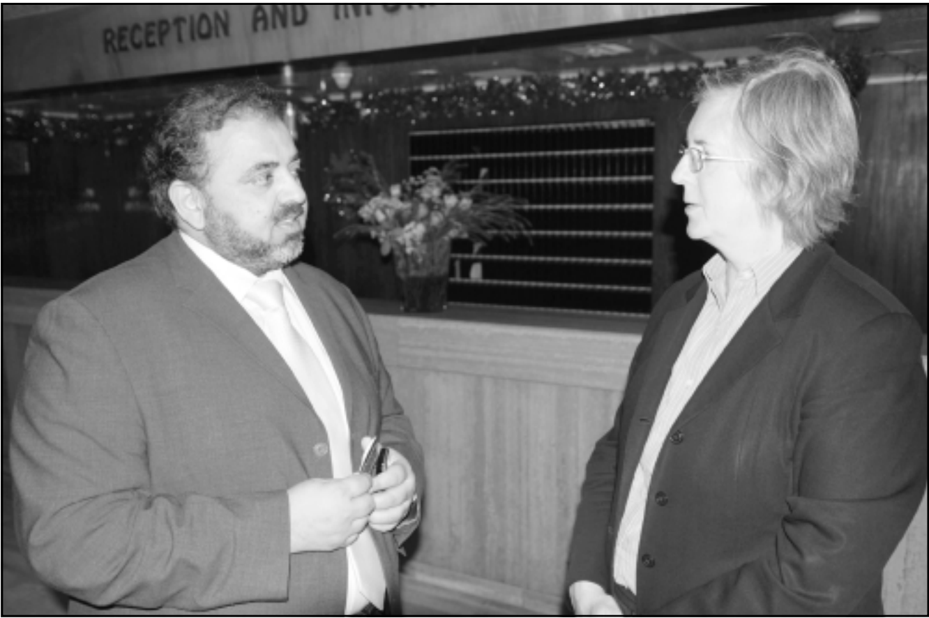
اللورد احمد مع السفيرة البريطانية في السودان روزاليند مارسدين في الخرطوم