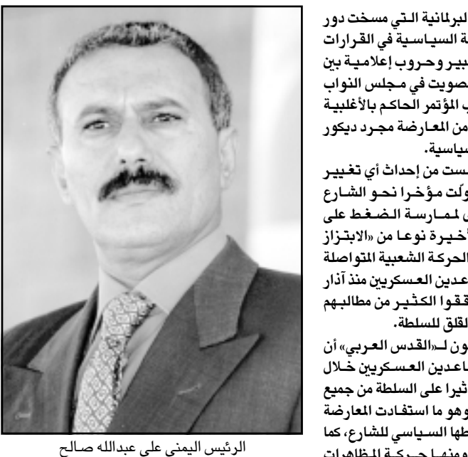
الرئيس اليمني علي عبدالله صالح

صنعاء - «القدس العربي» - من خالد الحمادي: خلقت الخلافات السياسية المتصاعدة في اليمن بين السلطة وأحزاب المعارضة أجواء من التوتر وأثرت سلبا على الحياة اليومية للمواطنين البسطاء كما أثرت كذلك على الاحتمالات السياسية الأربعة لرحيل الاستعمار البريطاني من عدن وبقية المناطق الجنوبية اليمن التي صادفت الثلاثين من تشرين الثاني (نوفمبر) الماضي.