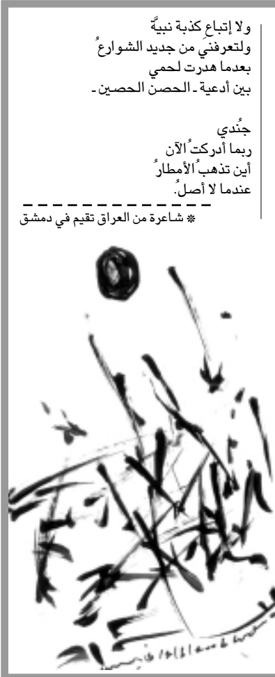
شاعر من العراق تقيم في دمشق

منمضا الى افتتاح مغرض .. سبان ان تنتظر منه هاتفا .. تهذر به ظنونك .. سبان ان تنتظر لا يطعمك منه او لحد .. بل لسرعة .. او بطيء تتاف من .. طول .. تلهيه، وتنتهي القصيدة بأسطر في قعر الصفحة الأخيرة تبدو كأنها تمنى انها خلاصة التجربة فقاتي بيروت لا يذبحها شيء ولو تمل بفضدي امرأة .. يحتم الشاعر بالقول «من الصعب على .. ان ابكر صيفا .. أشد لزوجة من فخذيك .. ذلك اني بلغت من الحب .. ما جعل في الوحيد /هو/ الأدي ..»