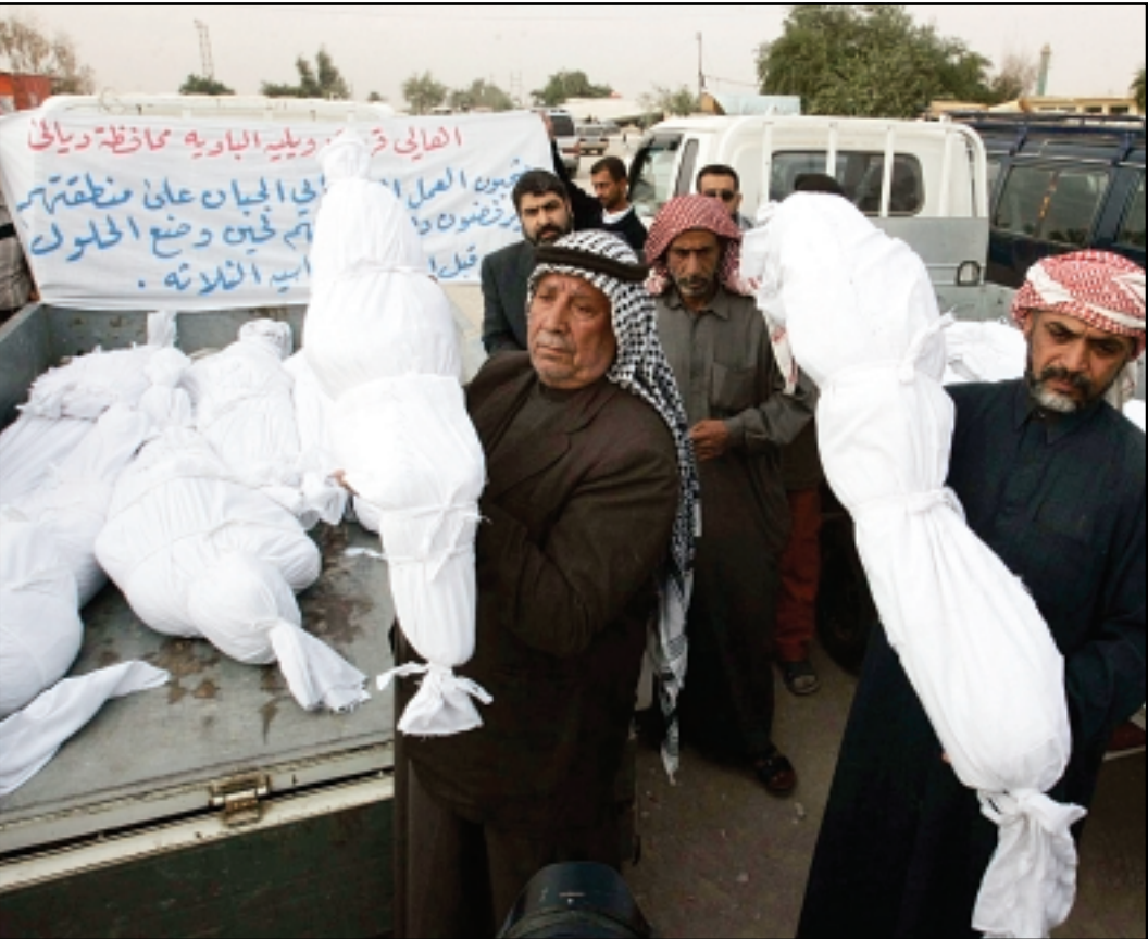
عراقيون يشيعون في مدينة النجف جنائمين اطفال قتلوا باعمال عنف في قرية بمحافظة ديالى