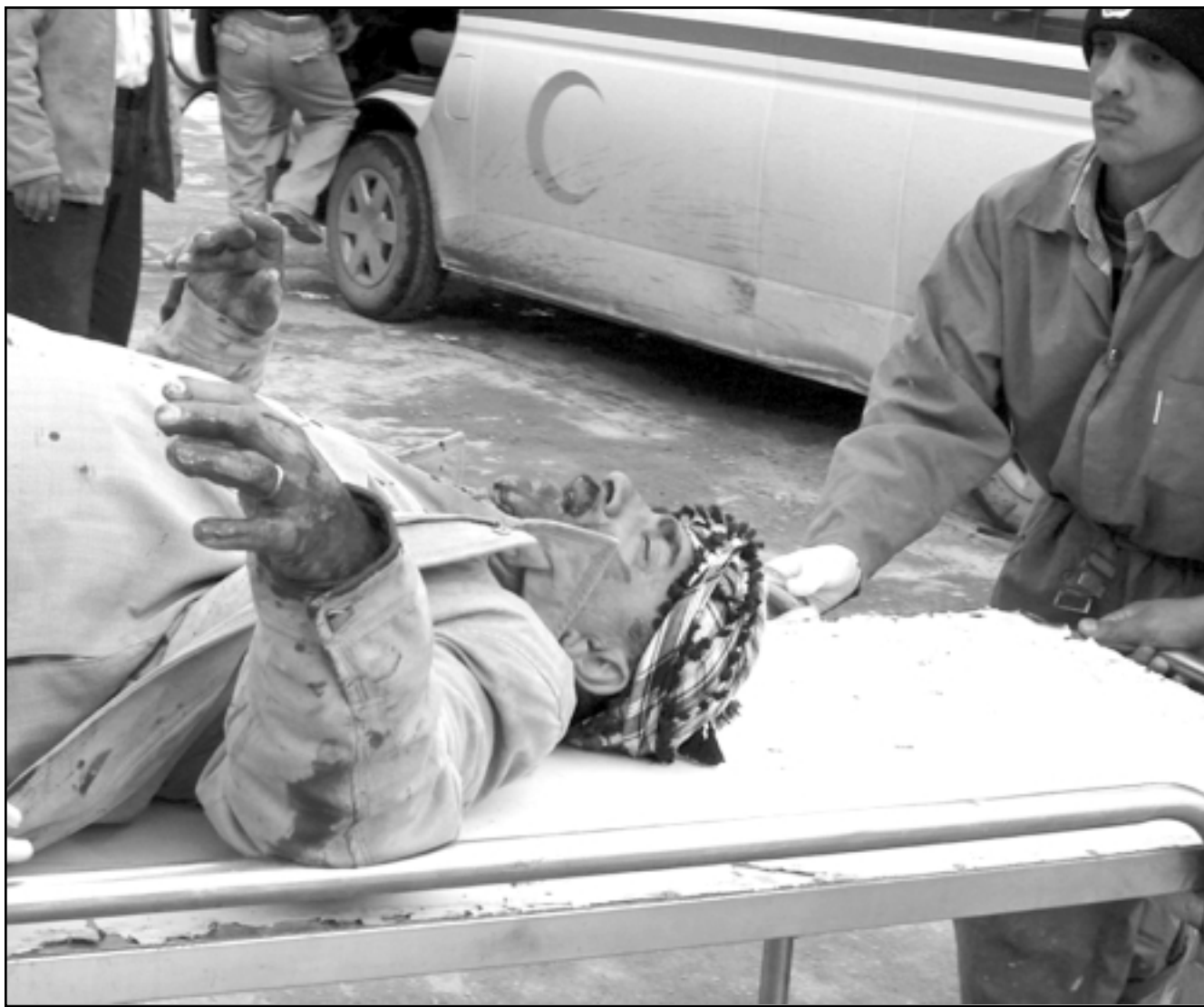
عراقي أصيب بجروح جراء انفجار استهدف مركزا للشرطة في يعقوبية امس (رويترز)

عناصر الحراسة المفروضة على منزله ابلغته بأوامر منعه من المغادرة».