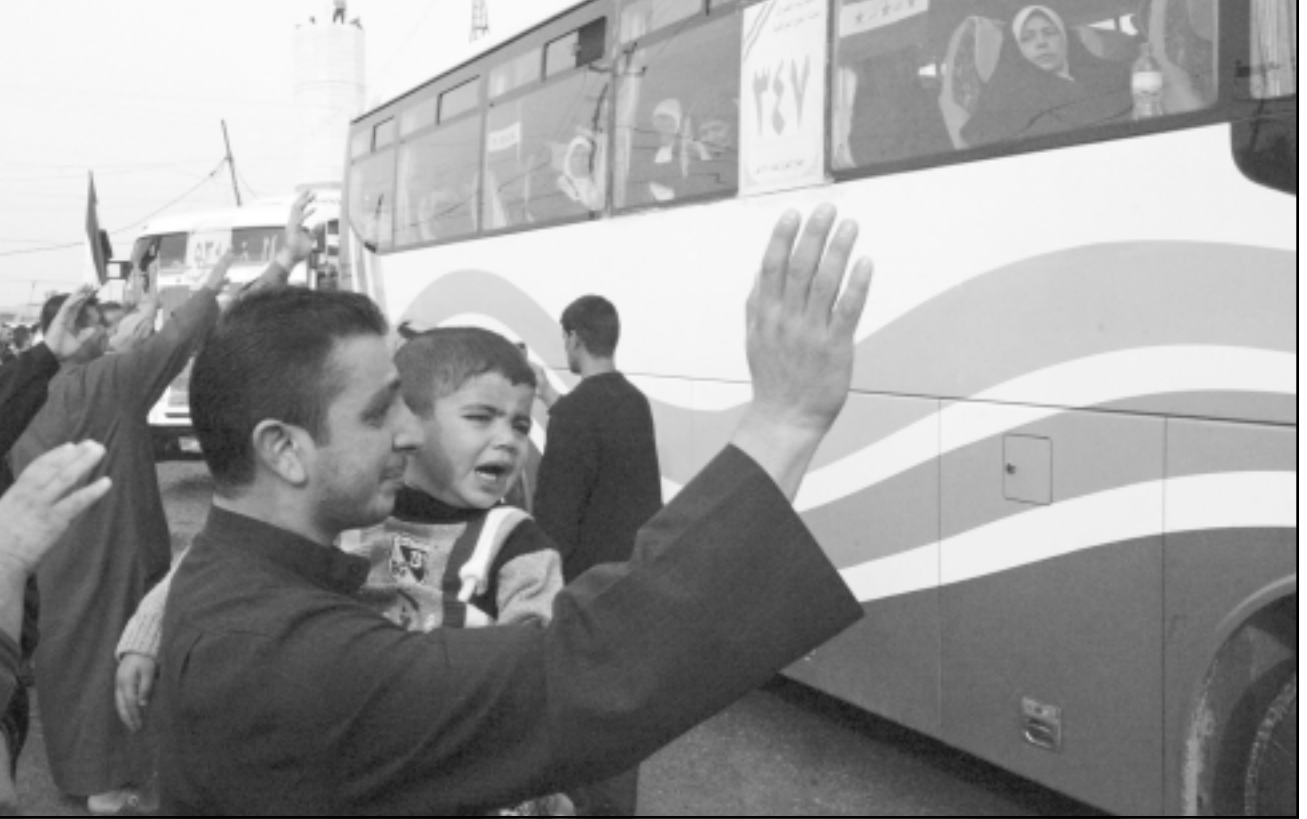
عراقيون يودعون اقاربهم المتوجهين لاداء فريضة الحج في الفلوجة

كركوك - «القدس العربي»: اعلن رئيس مجلس محافظة كركوك زكاري علي ان مجلس المحافظة قرر رفع دعاوى قضائية ضد رئيس الوزراء الحالي نوري المالكي والسابقين ابراهيم الجعفري وايباد علوي بتهمة التفسير المتعدد في تنفيذ خطوات المادة 140 من الدستور العراقي. وقال في تصريح صحفي ان مجلس المحافظة كان قد قرر في اجتماعه المنعقد