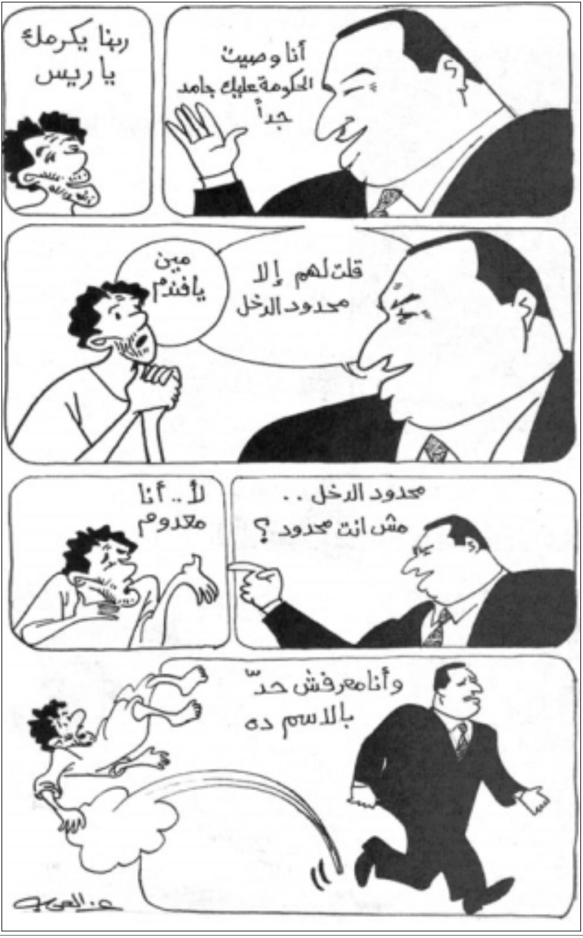
عن صحيفة «البديل»

لا، هذا ما نسمح به أبدا، وترفضه ملتفا رفض المؤرخ القبطي الكبير الدكتور يونان لبيب رزق في نفس العدد المطالب بنسبة للأقباط في المجالس النيابية بقوله: «إن وضع مكتوات، للأقباط في المجالس النيابية، سوف