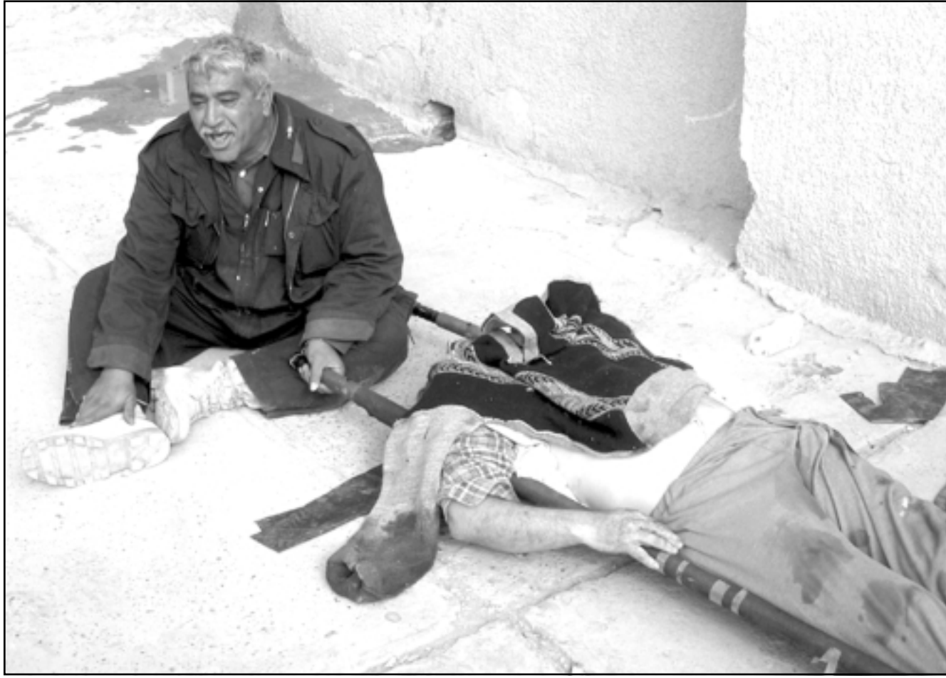
عراقي يبكي امام جثة قريب له في مشرحة في بغداد