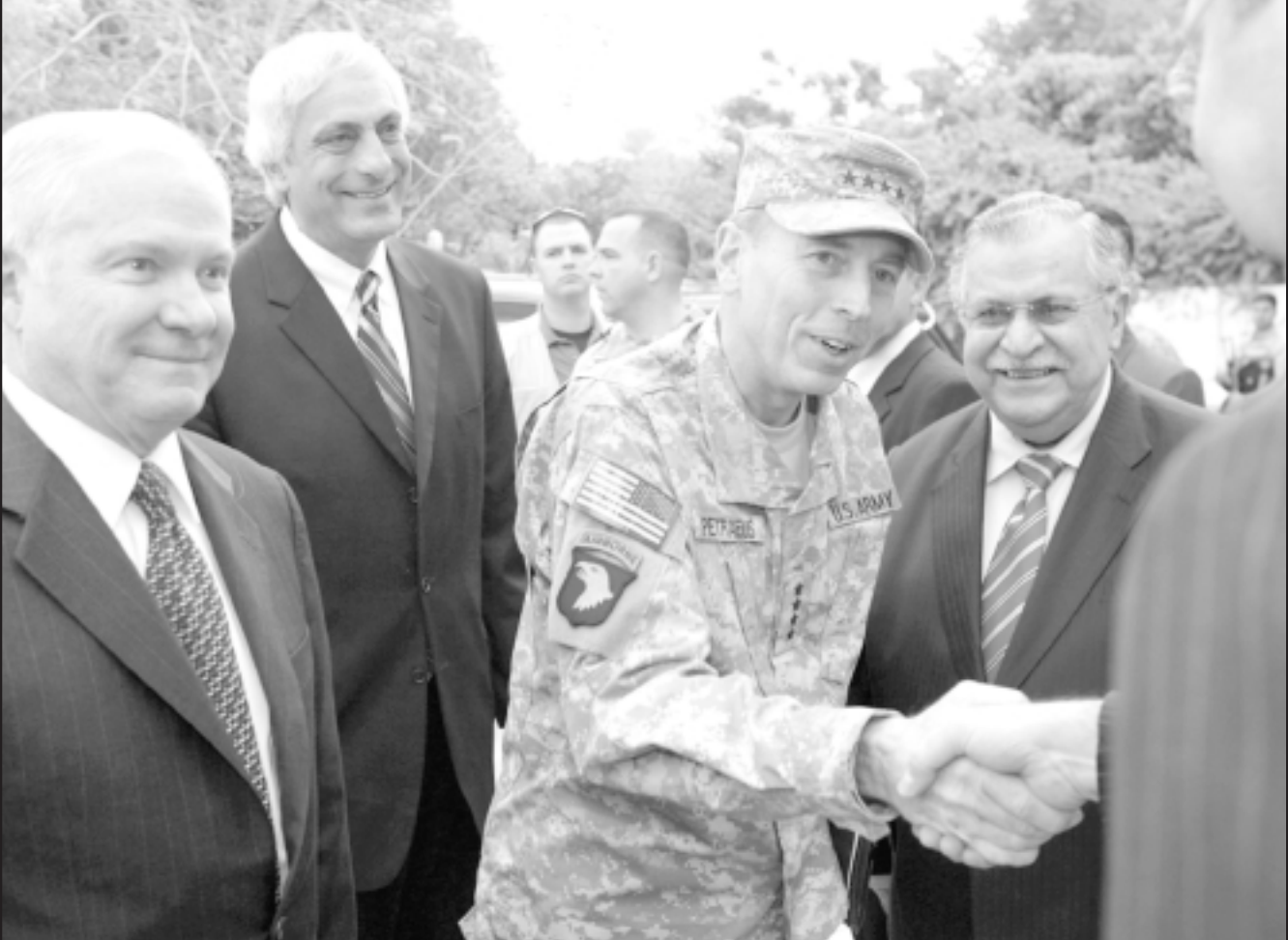
وزير الدفاع الأمريكي روبرت غينس «الى اليسار» والجنرال ديفيد بترينوس مع الرئيس جلال الطالباني أمس

وقالت (يونامي) انها ستقدم مساعدتها للحكومة العراقية في جهودها المبذولة لتنظيم وتنفيذ العودة الطوعية للعراقيين. وأضافت يونامي ان «التدفق الطوعي للعائدين هو علامة ايجابية تستحق ردا بنفس القدر من الاجابيه ومساعدة فورية لدعم عودة كريمة وأمنة، وهذا هو هدف خطة الاستجابة العاجلة المشتركة بين الحكومة والأمم المتحدة». وتظهر المؤشرات أن التدفق الحالي للعائدين والنازحين داخليا يقدر بحوالي 40.000 عائلة من اللاجئين والنازحين من النازحين داخليا معظمهم في محافظة بغداد. وقالت بعثة الأمم المتحدة انها «اتخذت تدابير فعالة لدعم السلطات العراقية في تلبية الاحتياجات والمساعات التي يتعين تقديمها لهؤلاء العائدين والاعداد لتقلات منظمة». وتهدف الخطة لمساعدة 5000 عائلة، ما يقارب 30.000 شخص، وتوفير حزمة اغاثة طارئة للاسر المحتاجة.