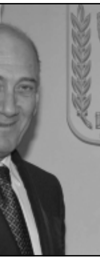
اولرت متقاتل بمصريه ومتشائم من مصير الدولة

5- مثل هذا الأمر لم يحدث في اسرائيل من قبل.