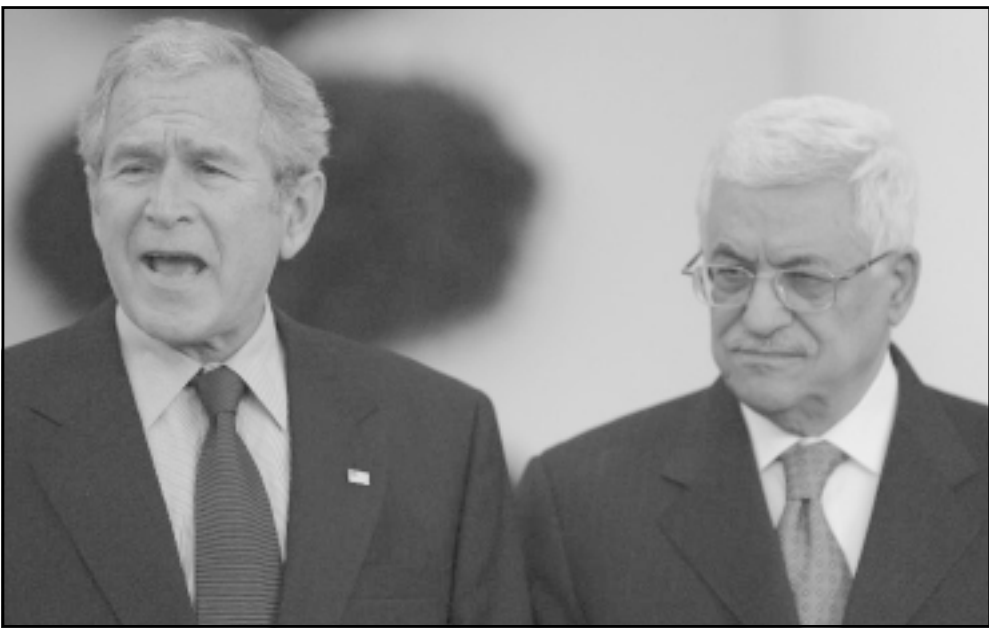
جديد المؤتمر: مكافحة للارهاب ومسيرة سياسية في الوقت نفسه

* رئيس مركز بيرس السلام، عضو الوفد المفاوض في اوسلو يديوت 2007/12/4