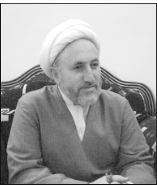
الشيخ جواد الخالصي

وفي اشارة الى موضوع عودة بعض اللاجئين العراقيين من سورية الى العراق فقد أكد الشيخ الخالصي أن الأوضاع الأمنية والسياسية في العراق غير مستقرة والمصالحة الوطنية جامدة وعوامل الأزمة ما زالت مؤثرة في الداخل ولكن صعوبة ظروف اللجوء بالنسبة للاجئين وصودر تعليمات جديدة للاقامة من سورية دفعت الكثير منهم للعودة اضطراراً الى البلد. وتضمن الى التعامل مع أجزاء منه. وبالنسبة لموضوع الفتنة الطائفية في العراق فقد شكر الشيخ الخالصي الله على أن الذين تبنا الفتنة الطائفية في ظل الاحتلال تراجسوا ولو في الاعلام على الأقل وأخذوا يعلنون عن رفضهم للفتنة، كما أن أبناء الشعب العراقي أدركوا مخاطر هذه الفتنة، وبدأوا يعلنون على إعادة العلاقات بين جميع طوائف الشعب العراقي التي سابق عهدا بعيدا عن تأثيرات الجماعات الطائفية، مشيرين الى سعادته بكل التقارب الذي يجري بين أبناء العراق في كل مكان وهو الأمر الذي سعت اليه المدرسة الخالصية وتبنته منذ