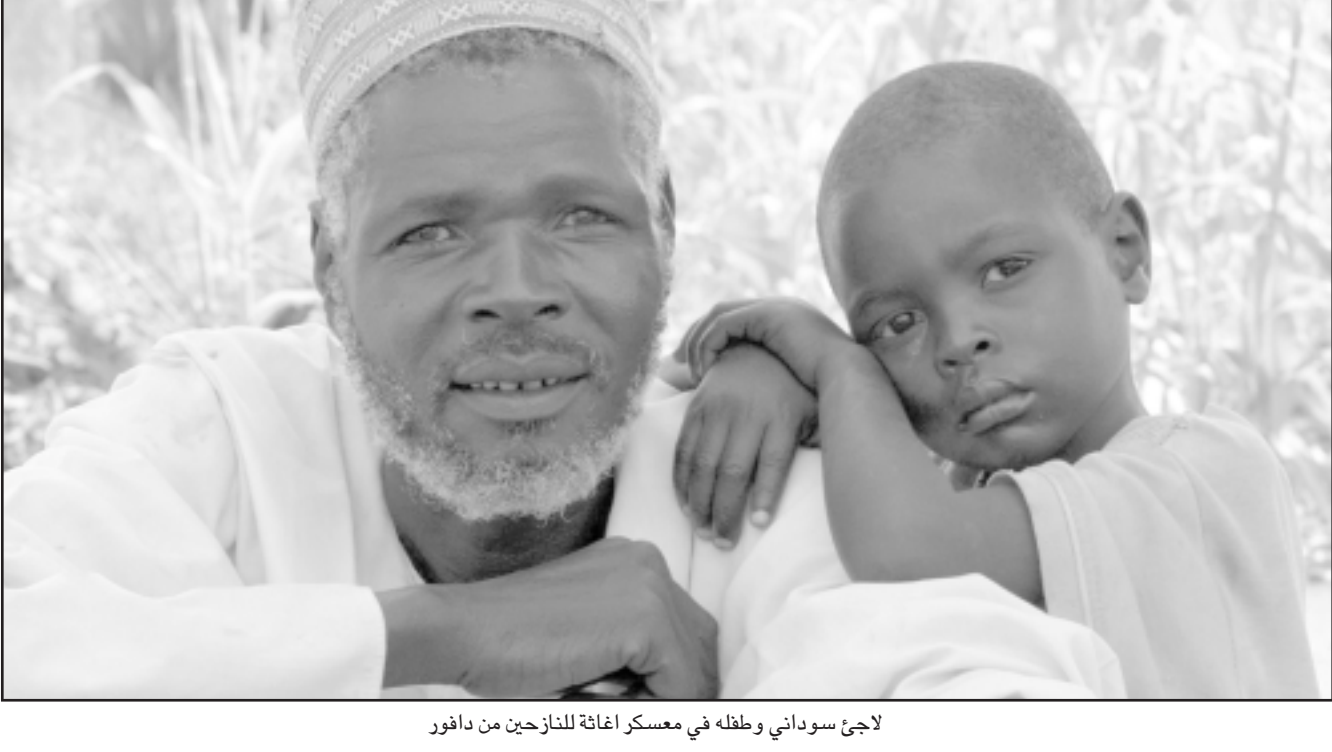
لاجئ سوداني وطفله في معسكر اغاثة للاجئين من دارفور