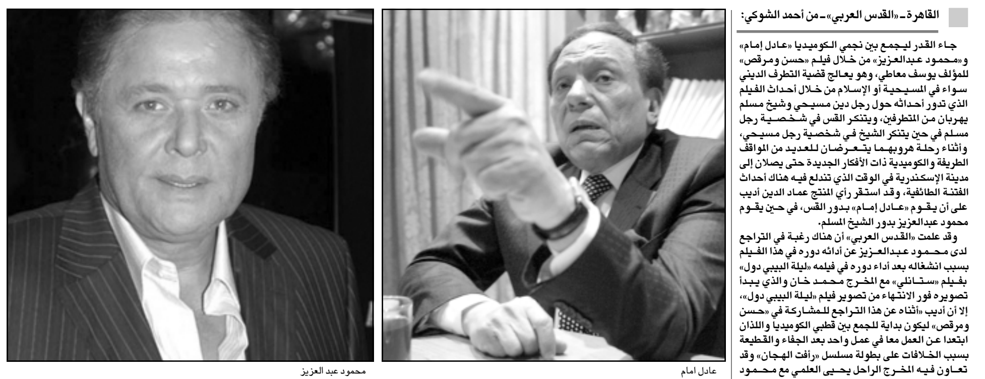
عادل امام محمود عبد العزيز

القاهرة - «القدس العربي» - من أحمد الشوكي: جاء القدر ليجتمع بين نجمي الكوميديا «عادل إمام» و«محمود عبدالعزيز» من خلال فيلم «حسن ومرقص» للمؤلف يوسف معاطي، وهو يعالج قضية التطرف الديني سواء في المسيحية والإسلام من خلال أحداث الفيلم الذي تدور أحداثه حول رجل دين مسيحي وشيخ مسلم يهربان من المتطرفين، ويتنكر القس في شخصية رجل مسلم في حين يتنكر الشيخ في شخصية رجل مسيحي، وثناء رحلة هروبهما يتعرضان للعديد من المواقف الطريفة والكوميديا ذات الأفكار الجديدة حتى يصلان إلى مدينة الإسكندرية في الوقت الذي تنقل فيه هناك أحداث الفتنة الطائفية، وقد استقر رأي المنتج عماد الدين أديب على أن يقوم «عادل إمام» بدور القس، في حين يقوم محمود عبدالعزيز بدور الشيخ المسلم.