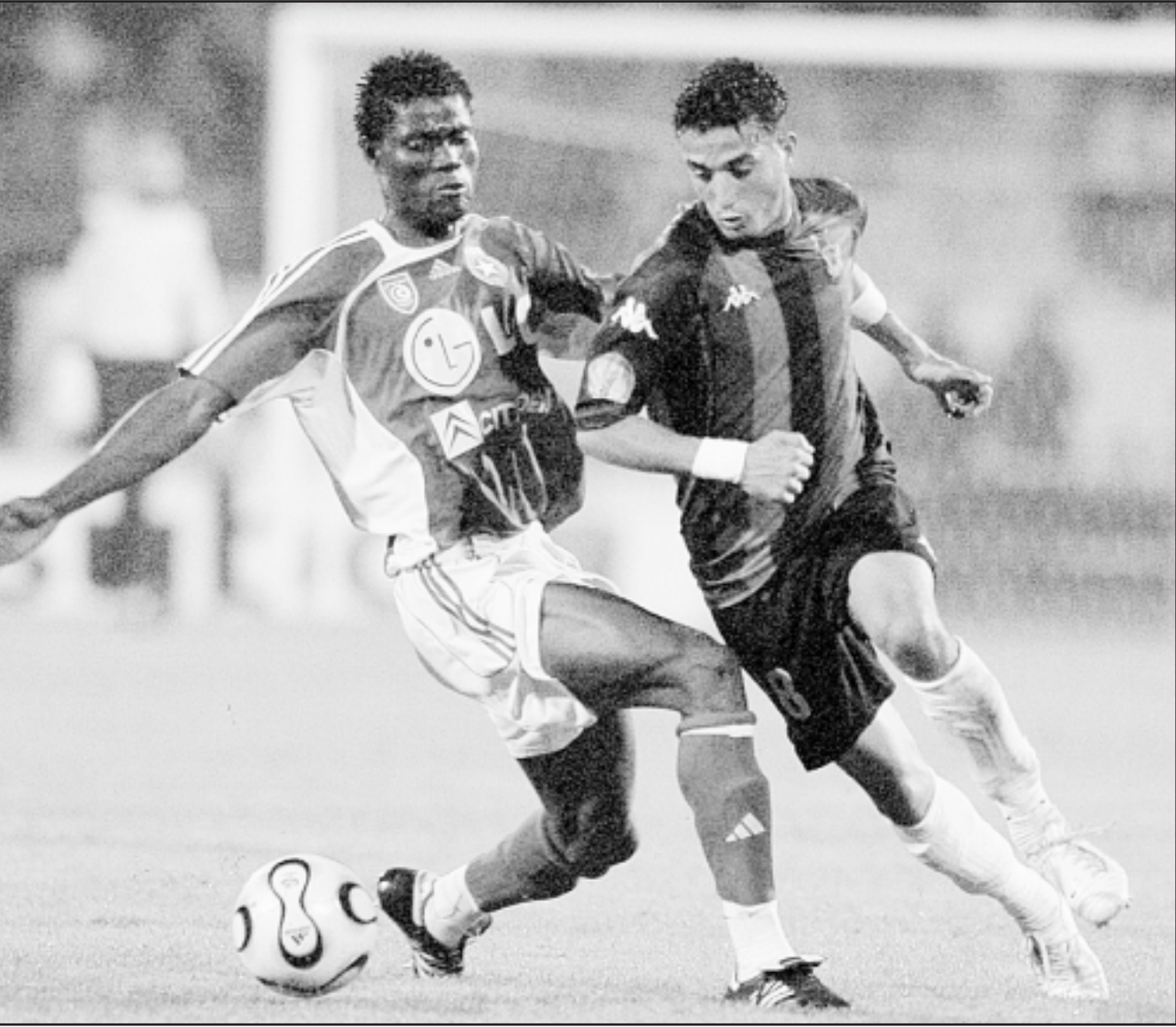
النجم الساحلي في احد لقاءاته