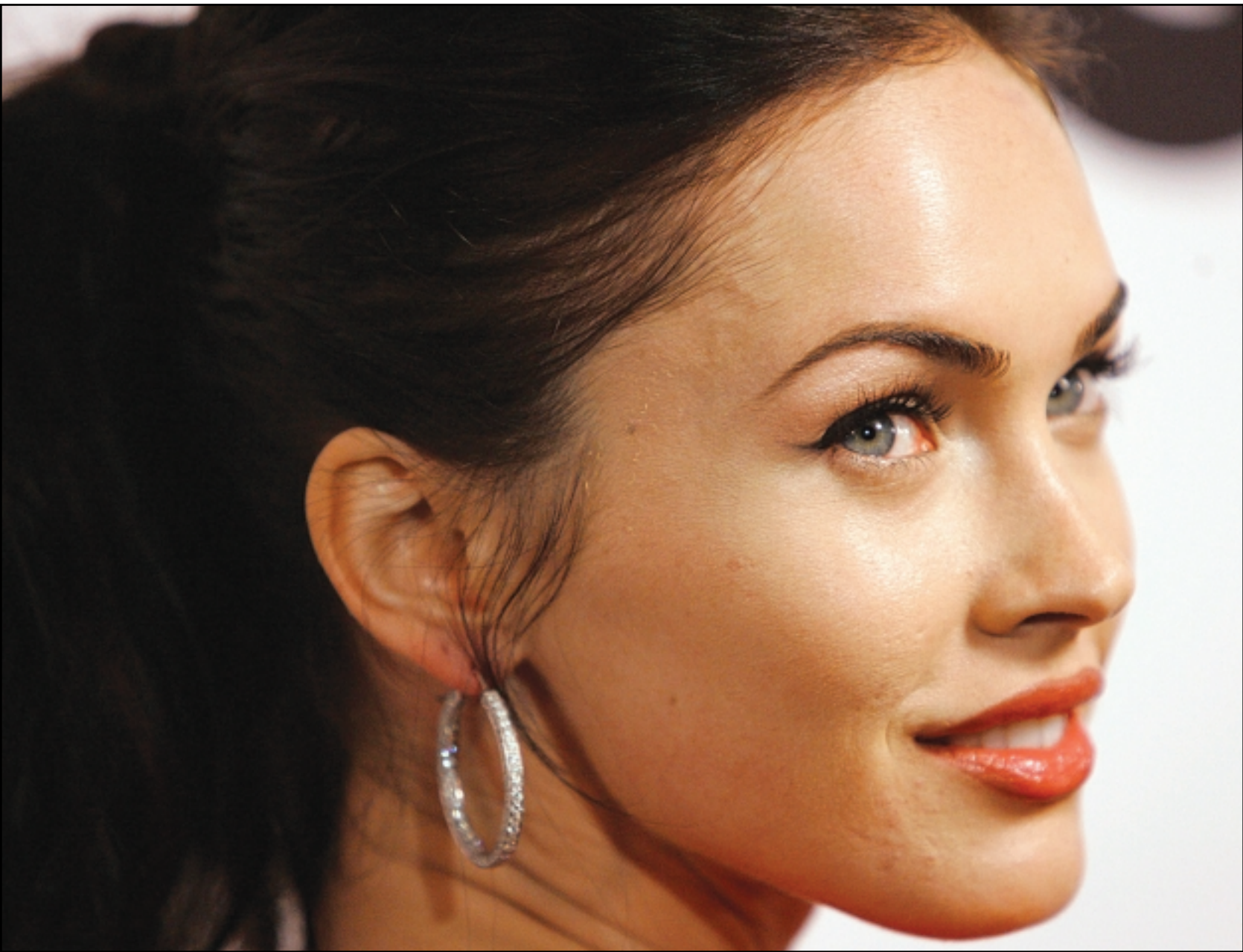
النجمة ميغان فوكس حضرت حفل الذكرى الثانية عشرة لإطلاق مجلة GQ الأمريكية مسابقة اختيار «رجال العام» في لوس انجلس (كاليفورنيا).

■ روما - يو بي أي: توصل عالم إيطالي إلى طريقة لمنع انتشار الخلايا السرطانية في الجسم وذلك بمنع وصول الدم إليها. وقال العالم نابوليون فيرارا من «مختبرات جينتكس إنك» في سان فرانسيسكو إنه بالإمكان استخدام أجسام مضادة لوقف نشاط جزيئة في نقي العظام اسمها آه 8 تساعد الاورام في الحصول على عمية الدماء التي تحتاجها للنمو. وذكرت وكالة الانباء الايطالية (انسأ) أن فيرارا سبق أن اكتشف جزيئة أساسية مسؤولة عن نمو