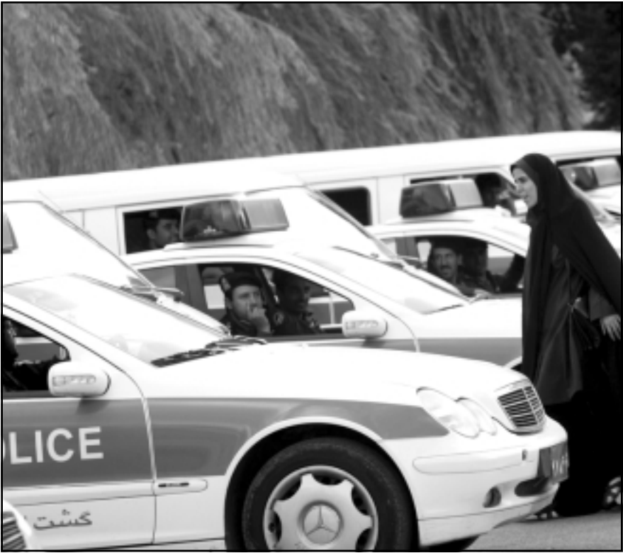
سيارة إيرانية تمر امام سيارات للشرطة في طهران امس

يبقى مبررا بالرغم من صدور تقرير عن وكالات الاستخبارات الامريكية افاد ان ايران اووقت برنامجها النووي العسكري عام 2003. وجاء في بيان صادر عن قصر الايزيه ان الرئيس الامريكي جورج بوش اتصل بساركوزي الاربعة لمناقشة «العناصر الجديدة» في التقرير، ولا سيما النشاطات النووية العسكرية التي قامت بها ايران في الماضي. وتابع البيان ان ساركوزي «قال انه في حال تاكد ذلك، فان المخاوف الدولية المستمرة منذ 2002 بشأن اهداف نشاطات ايران النووية ستتعزيز». واعتر ساركوزي ان «مطلب الاسرة الدولية هي بالتالي مبررة» على ايران ان تتعاون بالكامل مع الوكالة الدولية للطاقة الذرية وتعلق نشاطات التخصيب منملا طالب به مجلس الامن الدولي في ثلاث قرارات متتالية منذ ستة ونصف السنة. ورأى ان «رفض ايران الامتثال لها يبرر قرارا جديدا عن مجلس الامن يعزز العقوبات». واعتبرت وكالات الاستخبارات الامريكية الاثني تقريرها نقضت فيه سياسة البيت الابيض حيال ايران ان افادت في ان ايران اووقت عام 2003 برنامجا نوويا لصنع السلاح النووي وتبدو اليوم اقل عسكريا لصنع السلاح النووي وتبدو اليوم اقل تصميما على حيازة القنبلة الذرية. وصدر التقرير في وقت تبذل الولايات المتحدة جهودا لاستصدار قرارات دولية جديدة بحق طهران. وشددت فرنسا موقفا حيال ايران وتقربت من الولايات المتحدة بعد انتخاب ساركوزي في سدة الرئاسة في ايار (مايو).