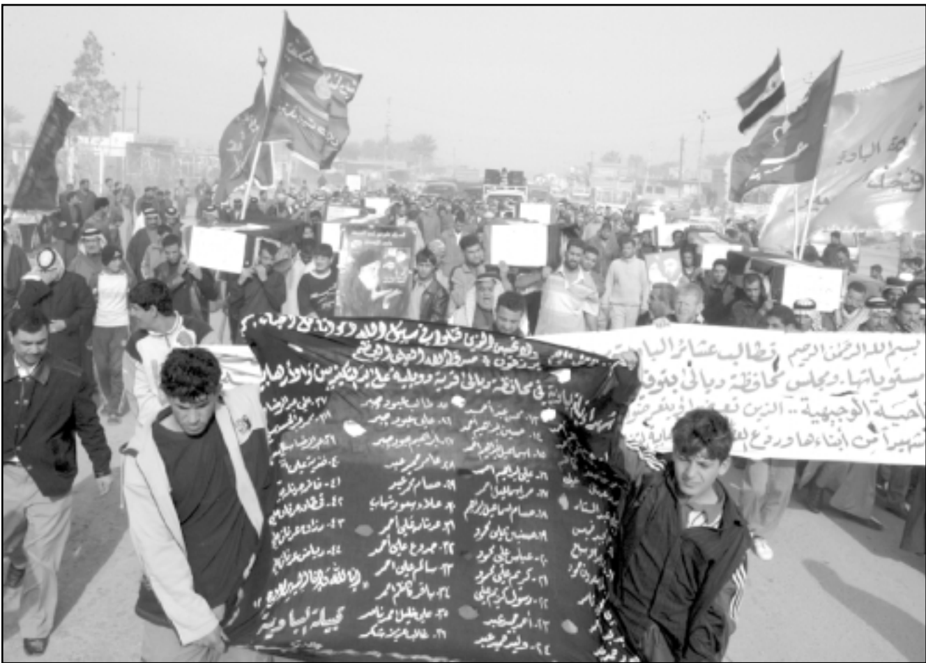
مظاهرون عراقيون اثناء تشييع رمزي في بغداد لضحايا هجمات في قرية بمحافظة ديالى

وقال الكابتن برايان جيلبرت قائد سرية من الجيش الأمريكي تحرس المنطقة انه قبل خمسة أشهر كان المشي في شوارع جسر ديالى مغامرة غير محسوبة. وأضاف «عندما جثنا إلى هنا للمرة