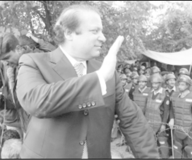
نواز شريف يلوح يمينه خلال تظاهرة في اسلام اباد امس

جويد هاشمي وهو مسؤول كبير في حزب شريف جرت الإشارة اليه كمرشح محتمل لرئاسة الوزارة «لا حول وسعنا في هذه المسألة» نقول ان هذا يجب ان يحدث قبل الانتخابات، وحزب الشعب الباكستاني يقول ان ذلك يجب ان يحدث بعد الانتخابات» مشيرا الى حزب بوتو، وقال هاشمي «هذا هو الشيء الوحيد الذي لم نستطع ان نتفق عليه حتى الان»، وقال مجلس رابطة المحامين الباكستانيين ان عشرات الآلاف من المحامين امتنعوا عن الحضور امس الخميس امام الحاكم من كراتشي في الجنوب الى بيشاور في شمال غرب البلاد مطالبين باعادة القضاة، واشتد مندات المحامين مع الشرطة في مدينة مولتان الجنوبية الشرقية، وأعلنت بوتو ان حزبها سيسشارك في الانتخابات الباكستانية على مضم مع الاحتفاظ