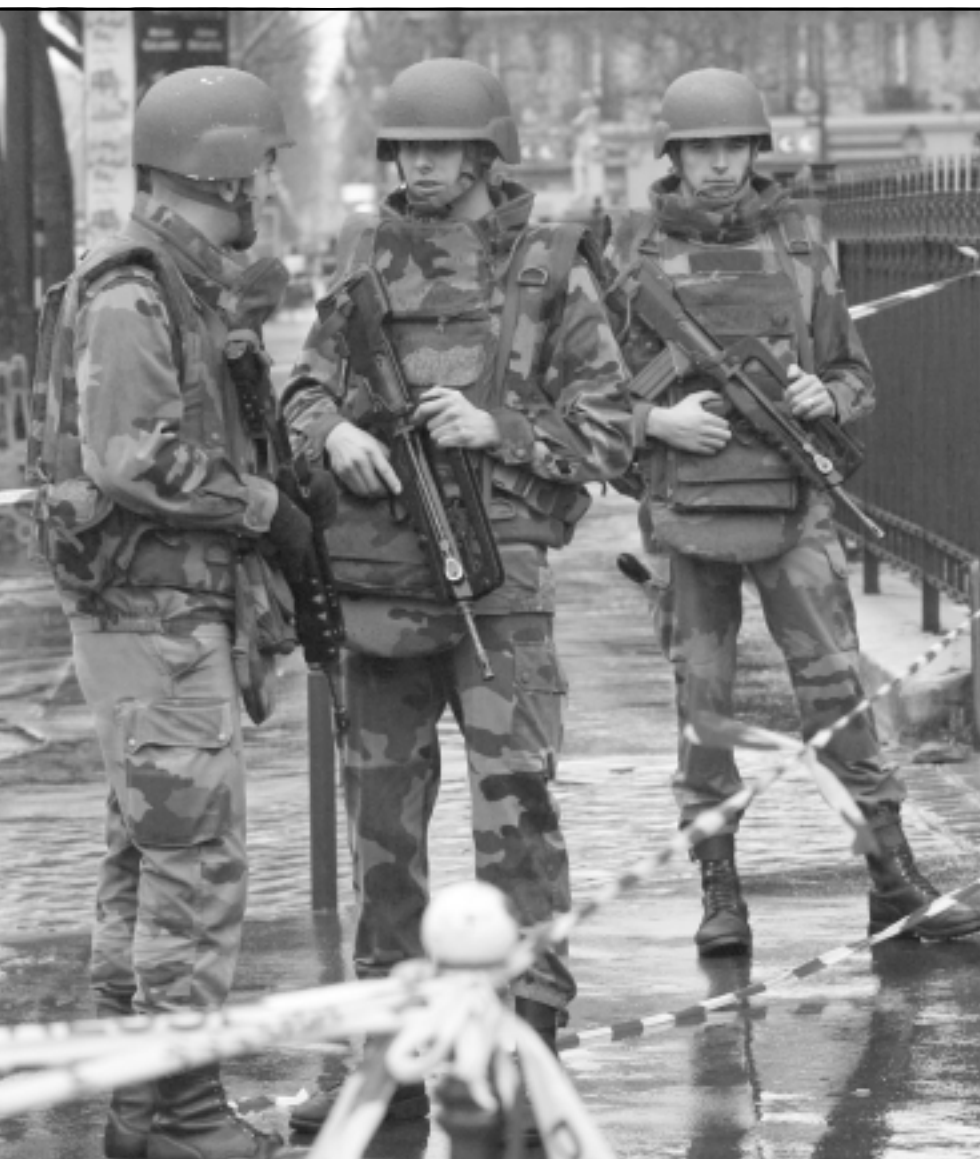
الجيش الفرنسي يطوق مكان الانفجار

وبالإضافة إلى ذلك، فإن موريتانيا، يقول ولد زيدان، تمثل وجهة واعدة للاستثمارات الخصوصية بحكم استقرارها