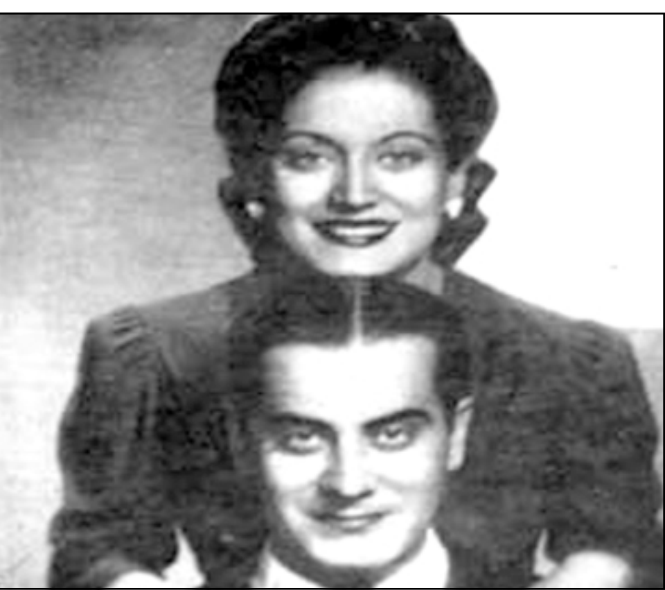
اسمهان وفريد الأطرش

وقد أقامت الفنانة العربية الكبار في هذه الدار مع زوجها الأمير حسن الأطرش لسنوات في مسقط رأسها