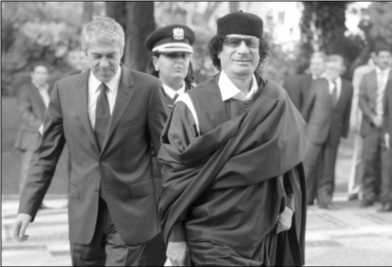
القذافي يصل امس الى لشبونة وفي استقباله رئيس الحكومة البرتغالية جوزيه سقراتس

باريس - اف ب: اعلن الرئيس السابق لبعثة المفوضية الأوروبية في ليبيا مارك بيريني امام لجنة تحقيق برلمانية فرنسية الخميس ان المحادثات بين باريس وطرابلس حول «التسلح والموضوع النووي» شكفت «عنصرا حاسما» في الافراج عن الفريق الطبي البلغاري الذي كان محتجزا في ليبيا.