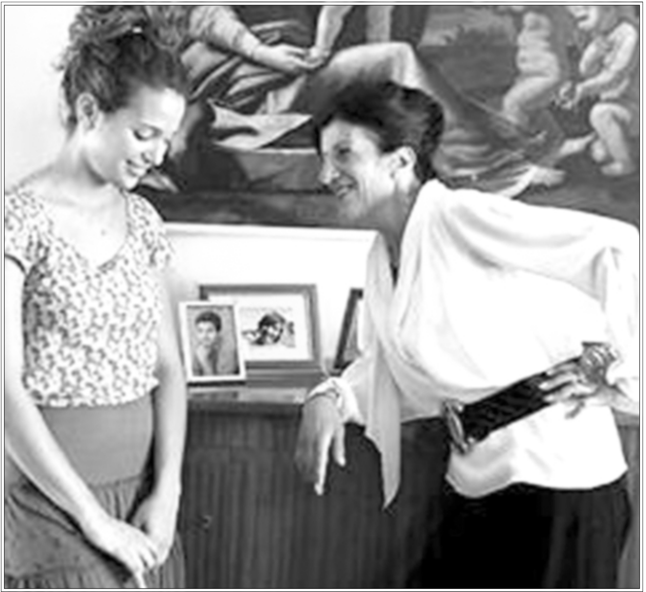
لقطة من فيلم «بهجة بالوما»

وكان القائم بأعمال بعثة المفوضية الأوروبية في لبنان مايكل ميلر أشار الى ان البعثة تمنح للسنة السابعة جائزة لأفضل فيلم لبناني قصير (1500 يورو) وجائزة خاصة من لجنة التحكيم لفيلم قصير آخر (500 يورو)، وذلك بهدف تشجيع المواهب الشابة، وتتألف لجنة التحكيم من مكلفين بشؤون الثقافة في بعثة المفوضية