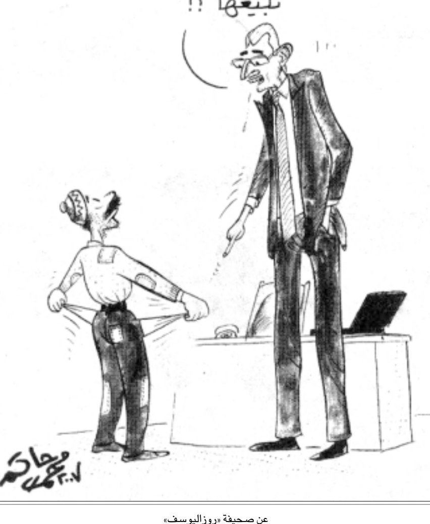
عن صحيفة «روز اليوسف»

«المزين كان مستودع أسرار القرية كلها وهو وحده الذي عنده الخبر اليقين، وهو كاتم الأسرار والمكشوف