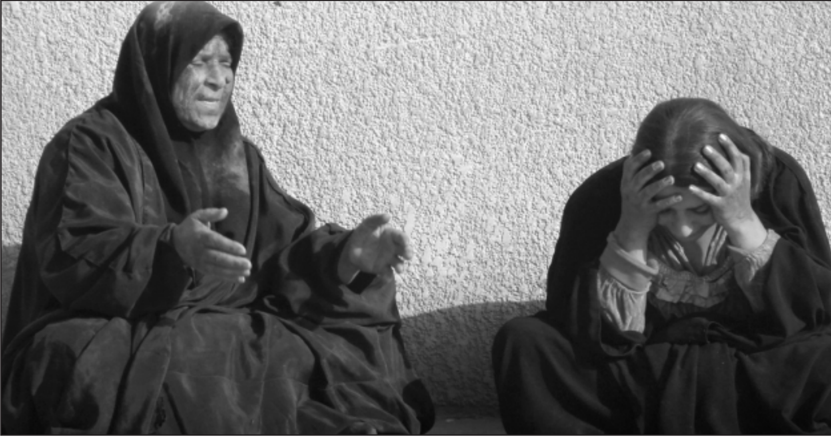
سيدتان عراقيتان تكيبان قريبا لهما في محافظة ديالى امس (رويترز)