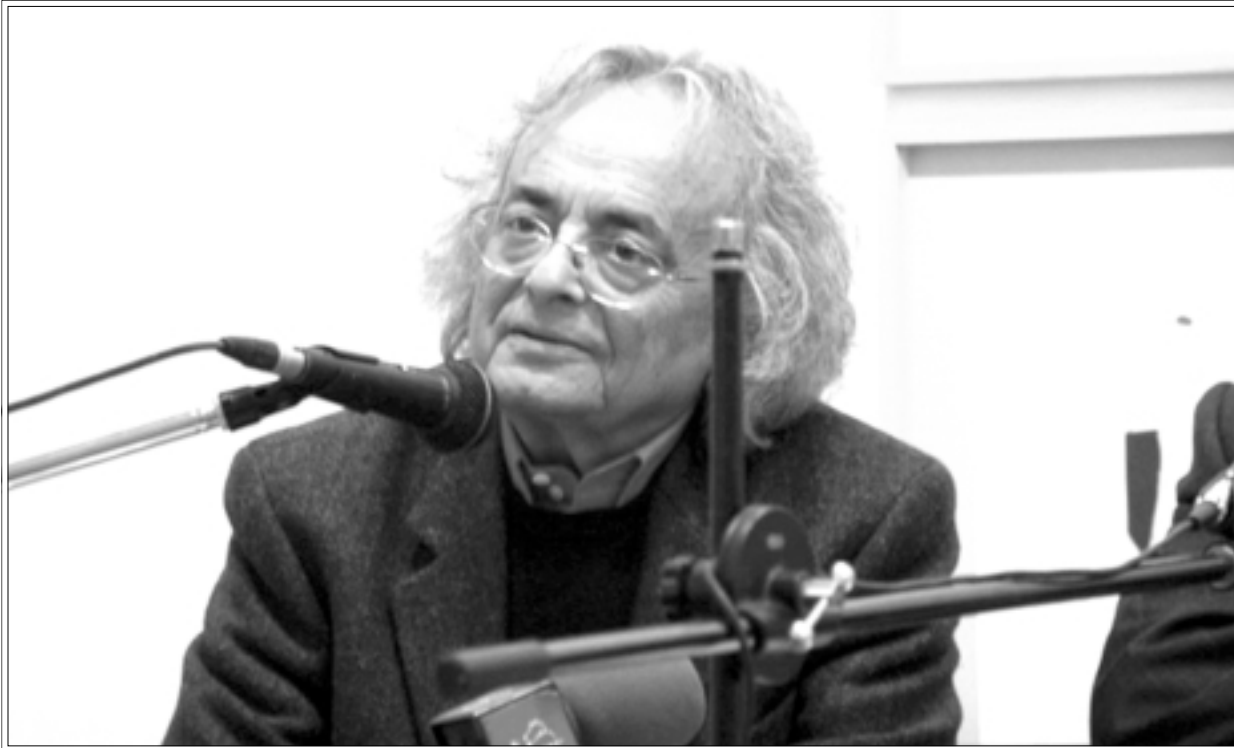
ادونيس في معرضه