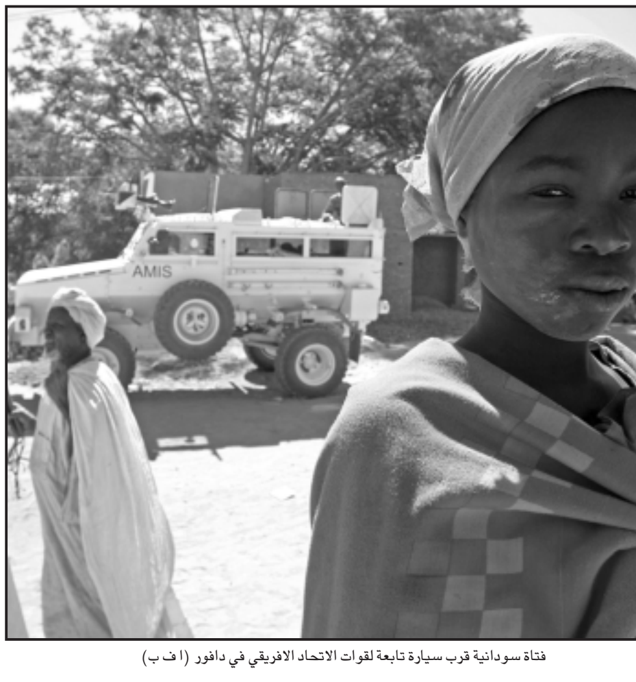
فتاة سودانية قرب سيارة تابعة لقوات الاتحاد الافريقي في دارفور

الفلوجة - رويترز: يشهر ياسر يعقوب بالسعادة بعودته الى مدينته بعدما فر منها منذ 18 شهرا مع أسرته إذ عاد الى عمله في ورشة لصالح هياكل السيارات حيث قتل مسلحون شقيقه لكونه شيعيا. ويعقوب هو أحد افراد اقلية شيعية صغيرة في مدينة الفلوجة التي تسكنها اقلية عربية سنية تقع على الغرب من بغداد والتي كانت حتى العام الماضي معقلا لتنشطاء القاعدة الذين أعلنوا حربا على الشيعة والامريكيين على السواء. وقررت أسرته من المدينة انها عادت الشهر الماضي باطمئنان بعدما انقلب قبائل محلية بدرجة كبيرة على الثوريين. وتقول السلطات المحلية ان عودة الاسر الشيعية المهجرة الى الفلوجة وبقية مناطق محافظة الانبار بغرب العراق واحد من اوضح المؤشرات على ان