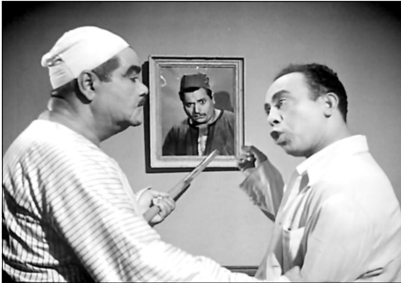
اسماعيل ياسين في أحد أفلامه