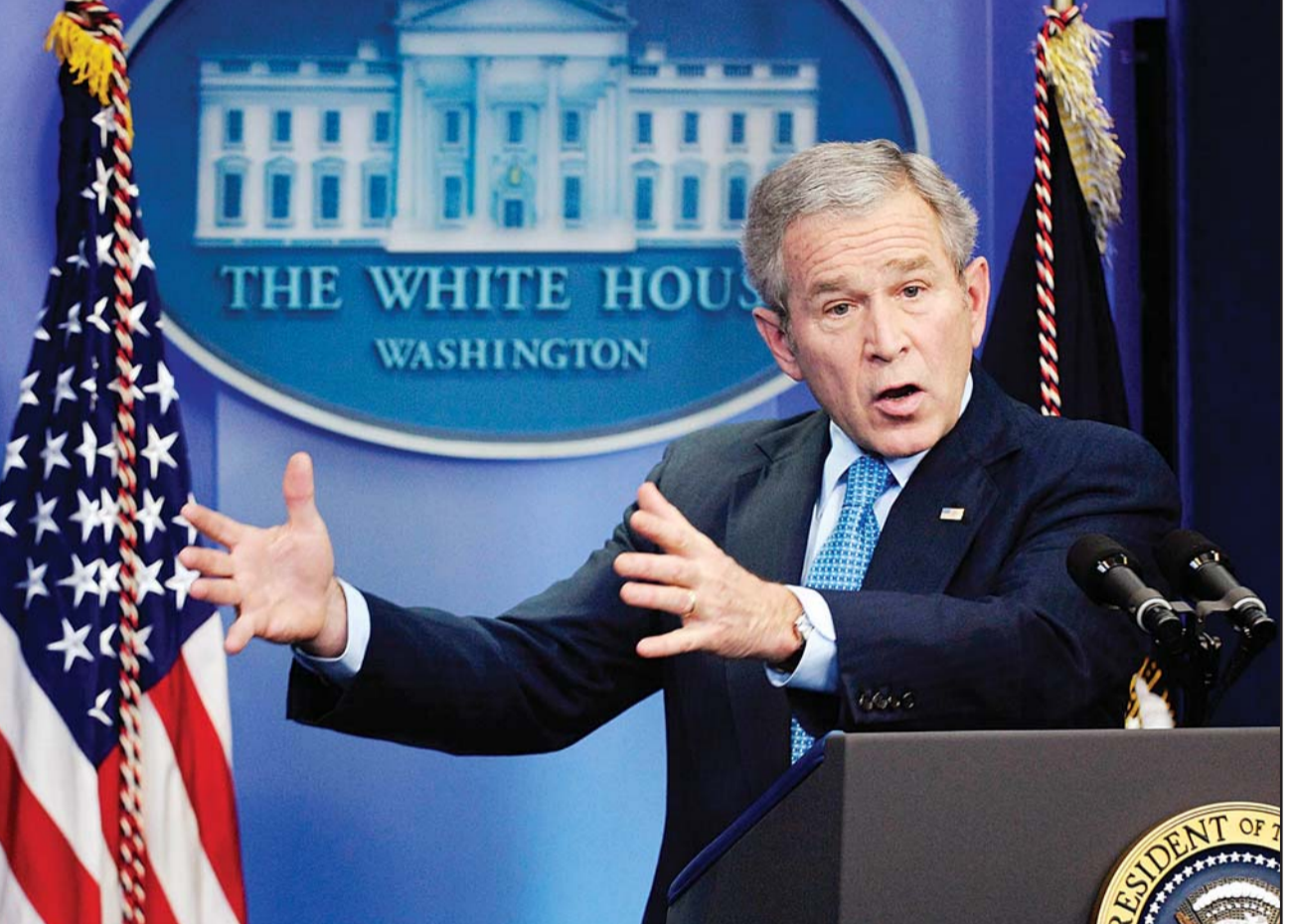
الرئيس الامريكى جورج بوش يتحدث للصحافيين في البيت الابيض امس

■ واشنطن - دمشق - لندن - القدس العربي - ف ب: صعد الرئيس الامريكى امس الخميس من ضغوطه على الرئيس السوري بشار الاسد، مستبعدا اجراء اي محادثات مباشرة معه، ومؤكدا ان «صبره نفذ بشأن الرئيس الاسد منذ وقت طويل»، و اضاف بوش «لقد نفذ صبري بشأن الاسد منذ وقت طويل والسبب هو انه يؤذي حماسا ويسهل (الامور) لحزب الله، ويتوجه الانتحاريون من بلاده الى العراق ويعمل على زعزعة استقرار لبنان».