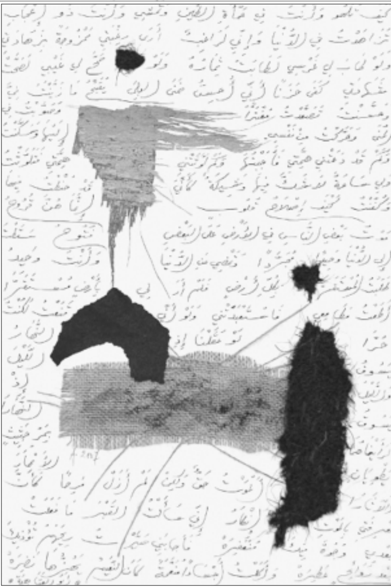
من اعمال ادونيس (القدس العربي)

الطويل هو المسؤول عن جرأة ادونيس في الدخول إلى عوالم الصورة بل الدخول إليها من أخطر أبوابها ألا وهو التشكيل ويغض النظر عن أولميته لهذا الدخول من عدمها فإنه قد رمى حجرا في هذا السانك التشكيلي الذي غابت عنه الروى بعد مساهمات الرواد الأولى إذ ان التشكيل العربي المعاصر اليوم بحاجة إلى جهد تنظيري وتأسيس فكري لم يتوجه إليه أحد وأصبح هم الفنان العربي اليوم هو عرض أعمال حدثية مكررة ومقلدة وإذا كان حضور ادونيس التشكيلي الحالي فساطول منه أن يدخل جازما لا مترددا كما أشار في الندوة والمطلب أن يكون جادا ومستعدا لهذا الدخول لأن ثقافة الصورة هي التي تحتل مركز الصدارة اليوم بينما أصبحت الكلمة والصوت والتأثيرات الحسية الأخرى مجرد مكمل لها وكان بودي لو أن الغضاء الشعري في لوحاته العروضة قد جاء مكملًا للون والشكل من حيث الإحالة والمعنى عضوية من حيث كونه خلفية ترد على التكوين وتسدنه على أي حال نرحب باودونيس وبحجراته التي يلقبها بين الفينة والأخرى في فضاء الثقافة الساكن عليه ينتقل بنا وتنقل به إلى فضاء تشكيلي متحرك).