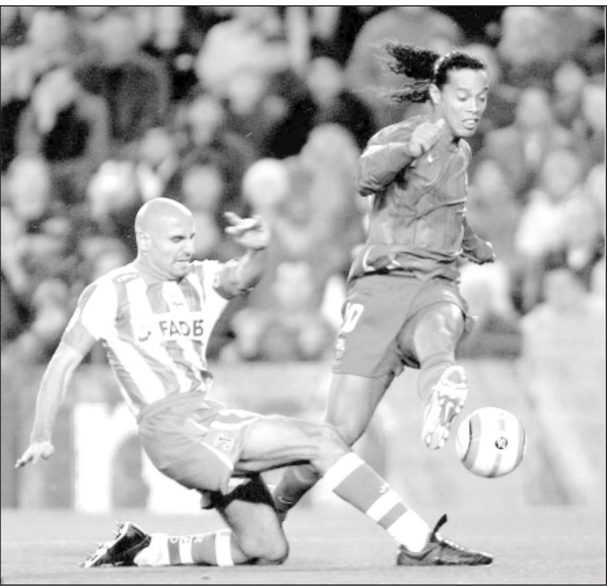
رونالدينيو هداف برشلونة في احد لقاءاته

وستعرض هذه الميداليات في مزاد لجمع أموال لصالح مشروع «أهداف وأجل الحياة» الذي يشرف عليه احد مستشفيات الاطفال في البرازيل. وأضاف بيليه «لكن انكلترا جريت اريكسون كما لا يجب ان ننسى انها سعت قبل عامين لاستقدام (المدرّب البرازيلي لويز فيليبي) سكو لاري. كايبلو مدرب جيد جداً وملك خبرة كبيرة لذا دعونا ننظر لنرى ان كان بإمكانه الفوز بالقب مع انكلترا.» لكن بيليه قال انه لا يتصور اجنياياً مدرباً للمنتخب البرازيلي. وقال «سيكون هذا امراً صعباً جداً.. ربما يمكن لارجنتيني بسبب التشابه الكبير.. لكن سيكون الامر صعباً جداً لمدرب اجنبي في البرازيل.» وودا على سؤال عما اذا كانت انكلترا غير قادرة على ايجاد مدرب وطني لمنتخبها قال بيليه ان الثقة باتت ضعيفة في المدرّبين المحليين. وأضاف