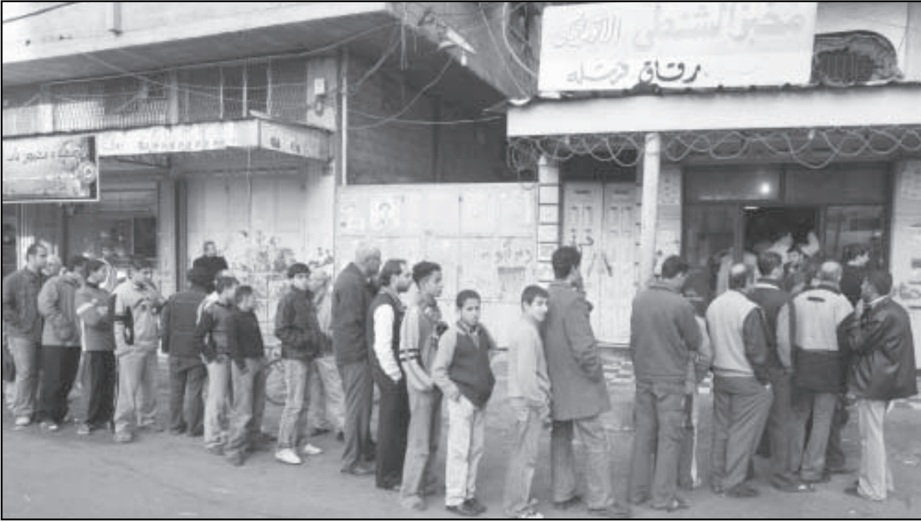
فلسطينيون يصطفون بطابور أمام احد المخازن في غزة لشراء الخبز قبل نفاذه