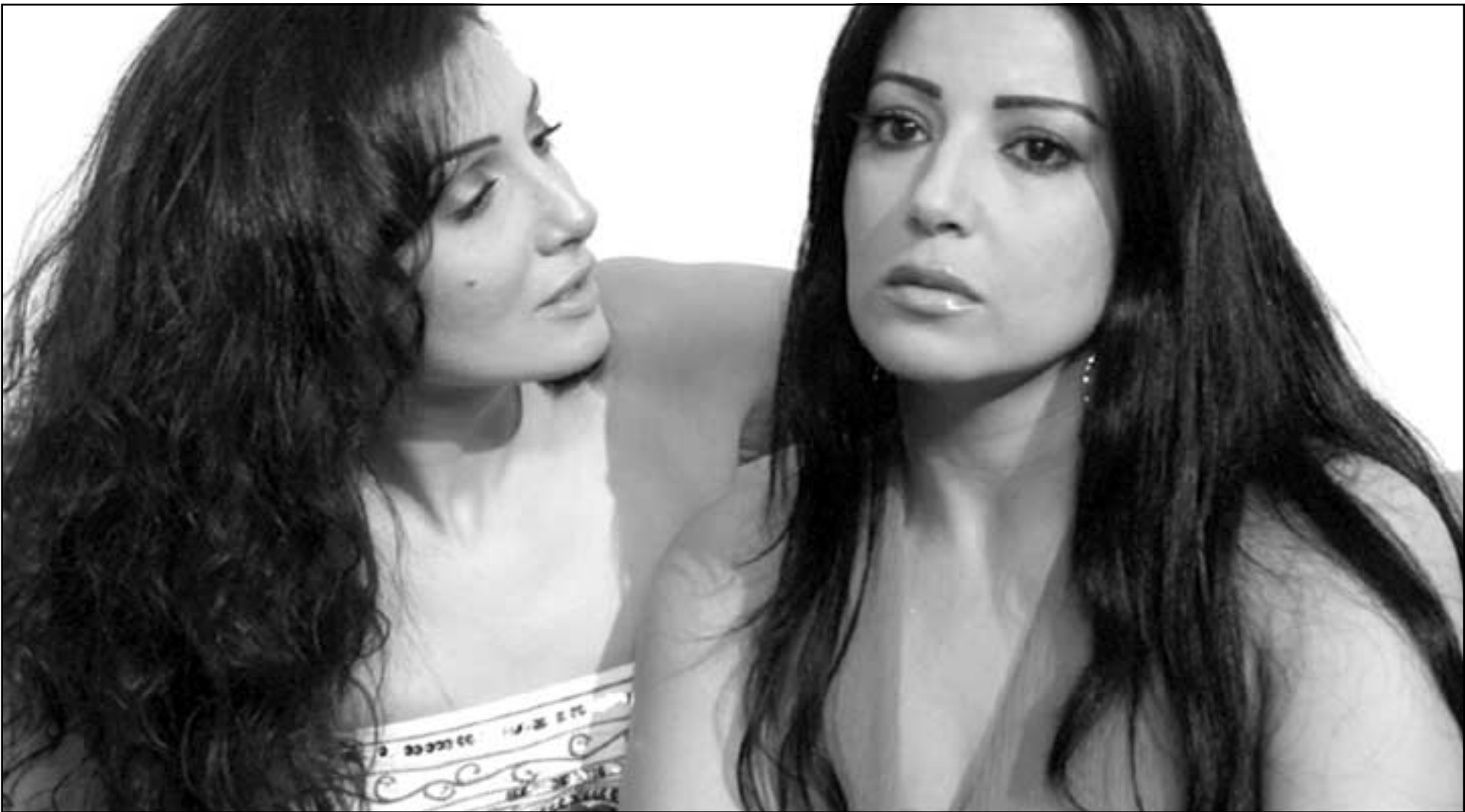
لقطة من فيلم «حين ميسرة»