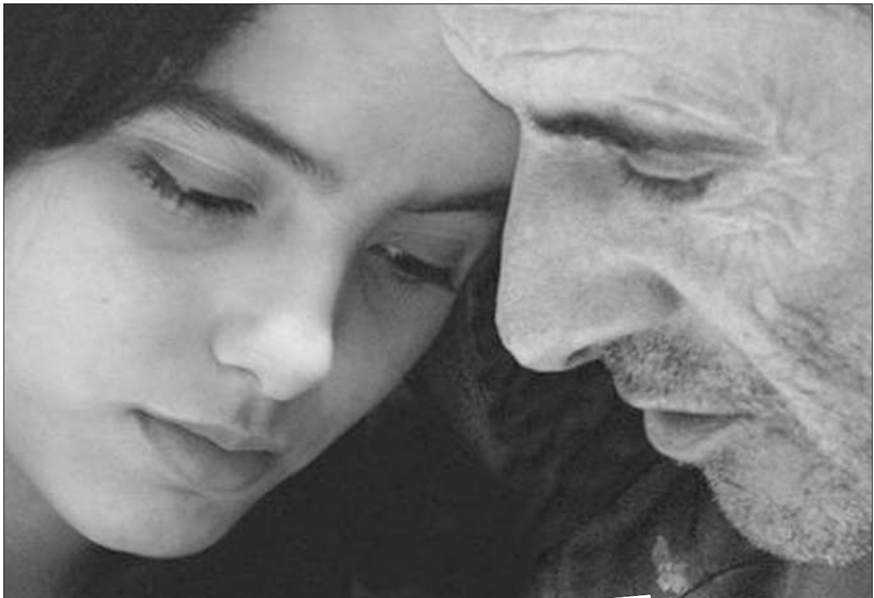
لقطة من «الكسكي بالسّمك وأساراه»