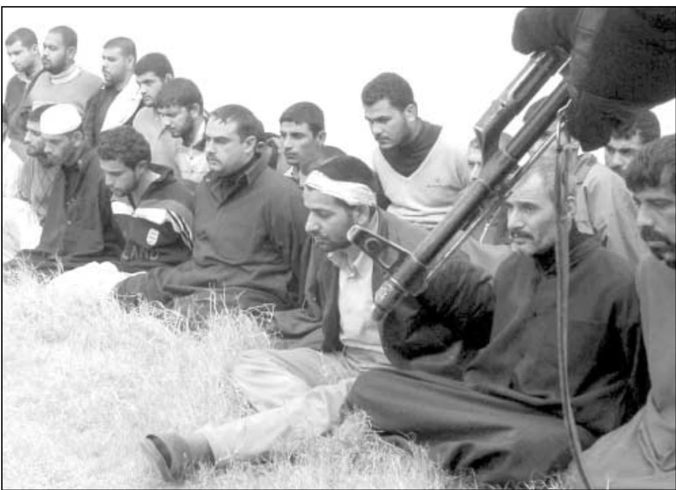
شرطي عراقي يقوم بحراسة مشتبته بهم في النجف امس

في الوقت الذي يعلن فيه قائد الشرطة في البصرة ان المهاجمين يتعاونون لتنظيم