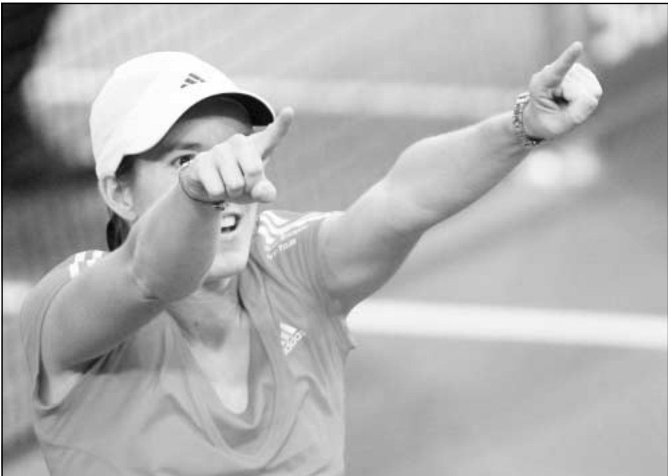
البيجيكية جوستين هينان

وسجل الفرنسي جان كلود دارشغيل الهدف الوحيد قبل دقيقة واحدة من انتهاء الوقت الاصلي (89) فارتفع رصيده رينجرز الى 50 نقطة واتسع الفارق من جديد الى 4 نقاط بينه وبينه سلتيك بطل الموسم السابق الذي تغلب بالنتيجة ذاتها على ضيفه كيلمارنوك في الافتتاح السبت.