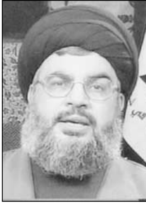
الشيخ حسن نصر الله

وعلى دراية بان اشلء عشرة جنود اسرائيليين موجودة