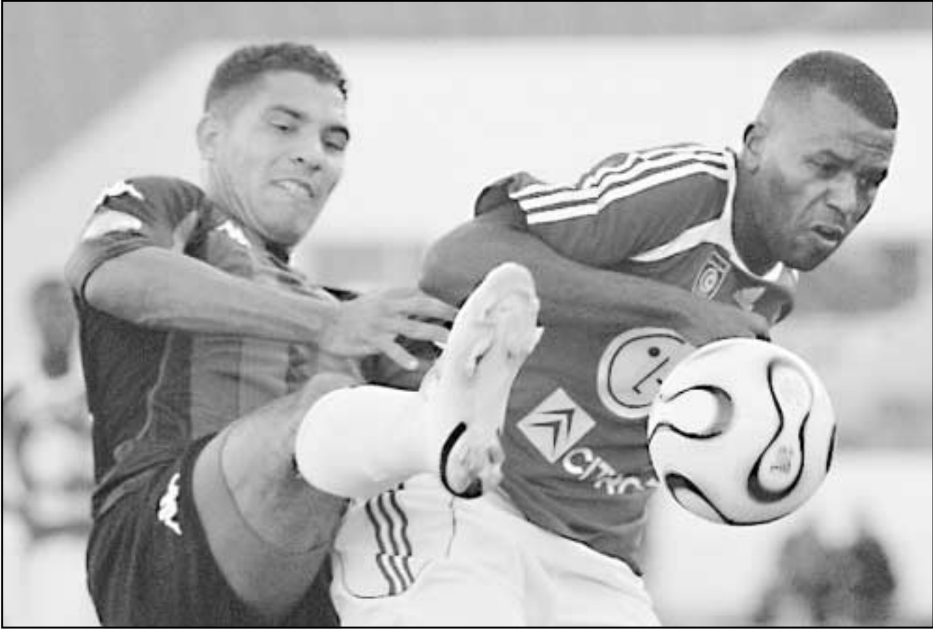
لقطة لمنتخب المغرب خلال احدى المباريات

في المقابل، تسعى ناميبيا الى قلب الطاولة على منتخبات المجموعة الاولى التي ستحاول اعتبار الناميبيين «جسر» عبور، لكسب 3 نقاط في صراعها على احدى بطاقتي المجموعة، وستكون البداية امام المنتخب المغربي الذي هزمها 2-صفر وديا قبل 3 اشهر، وهي المباراة الاولى ضد ناميبيا لانها مفتاح البطولة. اذا حققنا نتيجة ايجابية وهو ما نسعى اليه فان مسيرتنا ستكون رائعة. اما اذا حدث العكس فيسكون الامر مخيبا للامال وان تبقى امامنا فرصتان للتعويض امام غينيا وغانا».