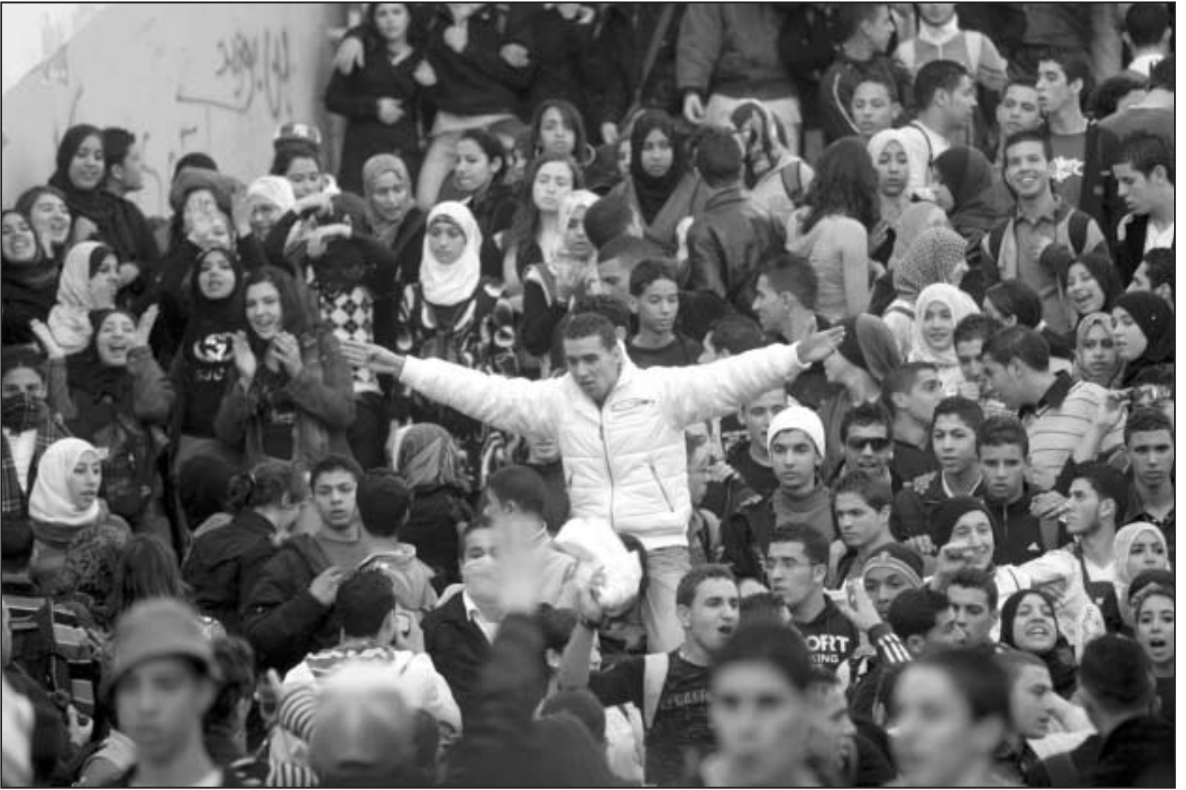
جانب من مظاهرات طلبة الثانويات بشوارع العاصمة الجزائرية امس

الجزائر - «القدس العربي» - من مولود مرشدي: