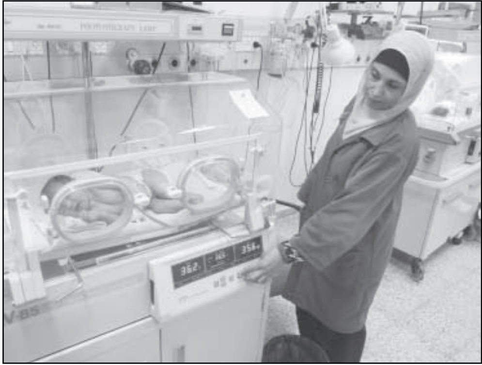
معرضة فلسطينية تتفقد حاضنات الاطفال قبل انقطاع التيار الكهربائي