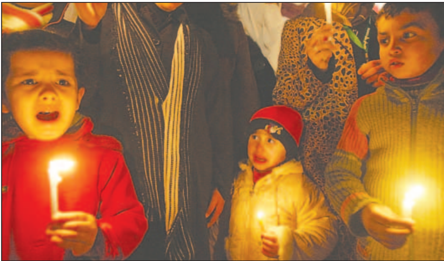
اطفال فلسطينيون يحملون الشموع أثناء مظاهرة في مدينة غزة احتجاجا على الحصار الإسرائيلي للقطاع (ا ف ب)