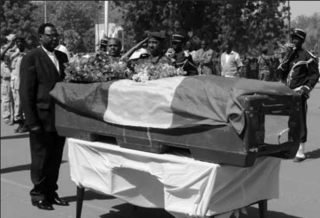
رئيس الوزراء التشادي لوه كاسير اثناء حضوره تشييع رئيس الركان الذي قتل بالمواجهات مع المتمردين في جاينينا الجمعة

وقال «فور وصول وحدات الشرطة التي تم تشكيلها فنن نقوم بالدوريات فقط وانما ستعشيق مع المنازحين في اماكن اقامتهم مع تقديم الحماية لهم». وسيكون للبيعة وجود دائم لمدة 24 ساعة في اليوم. وكانت عملية انتشار القوة المختلطة طويلة ومرهقة، واستغرق الامر شهورا من الاقتناع والتهديد والحادثات حتى قبلت الخرطوم قوة مشتركة لحفظ السلام كحل وسط. واستمرت المناقشات بعد ذلك حول قواعد العمليات وعدد القوات الافريقية التي ستكون جزءا من القوة. ووقعت الخرطوم يوم السبت في النهاية على قواعد العمليات للقوة الجديدة ومن المأمول ان تبدأ قوات اضافية في الانتشار في الشهر القادم.