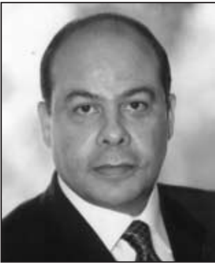
وزير الإعلام المصري أسى الفقي

تجاوزت كل الحدود والقيود وأصبح العالم قرية صغيرة..