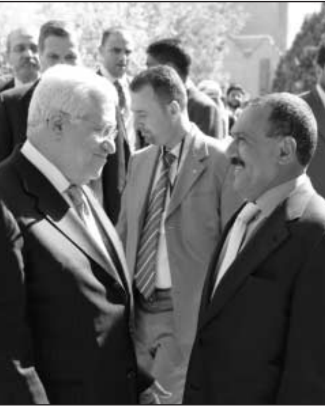
الرئيس اليميني علي عبد الله صالح لدى لقائه نظيره الفلسطيني محمود عباس