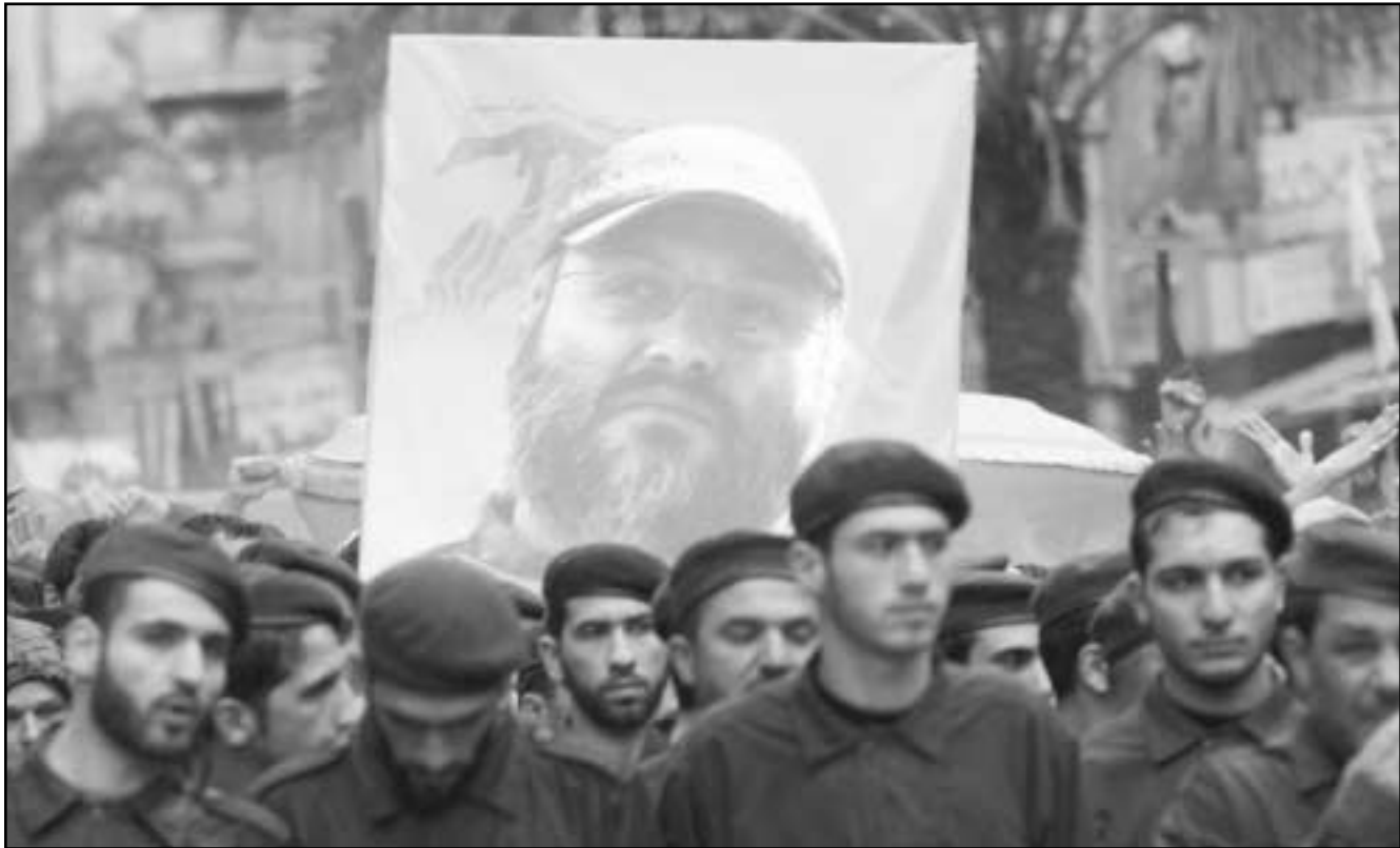
لبنانيون يشاركون في تشييع جثمان الشهيد عماد مغنية

تريدونها هذا النوع من الحرب المفتوحة فليسمع العالم كله، فلتكن هذه الحرب المفتوحة. نحن نملك، كما كل البشر، حقاً مقدساً في الدفاع عن النفس، وكل ما يؤدي هذا الحق في الدفاع عن بلدنا وأخواننا وقادتنا وشعبنا سنقوم به إن شاء الله. رابعة: في الرابع عشر من شباط اليوم نذكرى الرئيس الشهيد رفيق الحريري، كنا نود أن تجمع هذه الأسماء بين الساحات ولكن بشيء البعض أن يحول المناسبة دائماً إلى حفلة شائكة وسباب وإهانات لا تليق منها ولا يكفي أن يتناوب الخطباء على الشتم لتنتهي حفلة الشتم بيد ممدودة، اليد الممدودة عندما نرى أنها صادقة لن نجد منا إلا يد ممدودة ولكني أرى بأنها مناسبة، بمناسبة نذكرى الرئيس الشهيد رفيق الحريري وأرى بمناسبة هذا التشيع المبارك والحليل لقتل كبير من قادتنا في المقاومة أن ارد على حفلة الموسوي وراغب حرب وعماد مغنية ورفيق الحريري. وبعد ذلك، أمّ نائب العام للحزب الشيخ نعيم مسعود الصلاة عن روح الشهيد ثم جرت مراسم التشييع قبل أن يوارى الجثمان في روضة الشهداء.