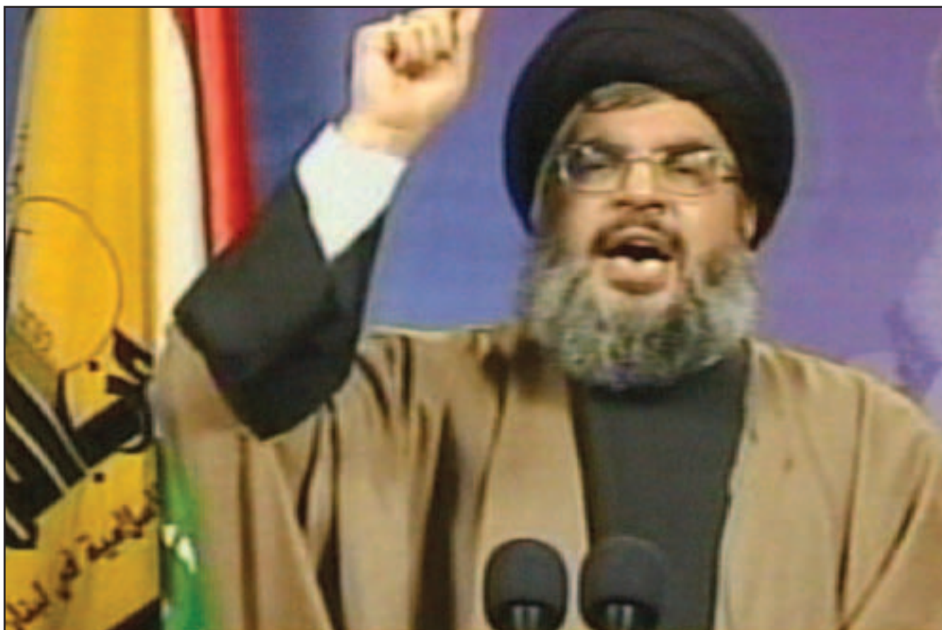
زعيم حزب الله السيد حسن نصر الله يلقي خطابيه في قاعة مجمع سيد الشهداء في الضاحية الجنوبية في بيروت أمس