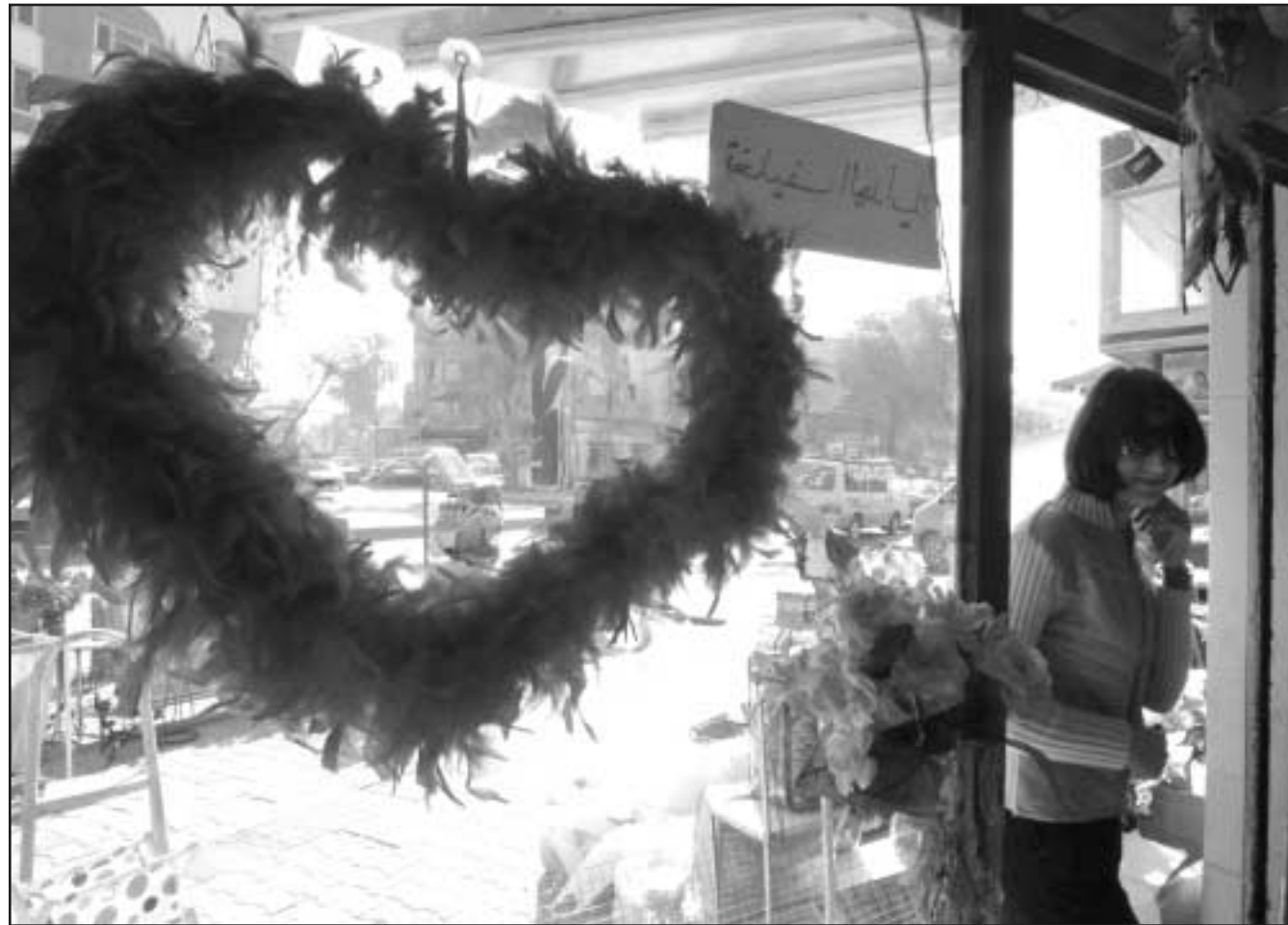
سيدة عراقية في محل يبيع هدايا عيد الحب في بغداد الجمعة