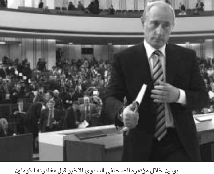
بوتين خلال مؤتمره الصحافي السنوي الأخير قبل مغادرته الكرملين

واشنطن - أف ب: أكدت السيدة الأمريكية الأولى السابقة هيلاري كلينتون ان زمن الفضائح التي احاطت بزوجها بيل كلينتون قد انتهى وذلك بعد مرور عشر سنوات على الفضيحة التي أثارها علاقة الرئيس السابق بومبينا لونسكي والتي كانت ان تسبب في اقالته. وقالت هيلاري التي تخوض حملة شرسة لانتزاع ترشيح الحزب الديموقراطي للرئاسة الأمريكية في تشرين الثاني (نوفمبر) الماضي «ي لا تحدث فضيحة أخرى». تعلمون ان لا احد يستطيع التنبؤ بالمستقبل (...). لكنني على ثقة كبيرة بان ذلك لن يحدث». وكانت هيلاري ترد بذلك على سؤال في حديث تلفزيوني في واحدة من المرات النادرة التي اثيرت فيها فضائح عهد كلينتون خلال هذه الحملة.