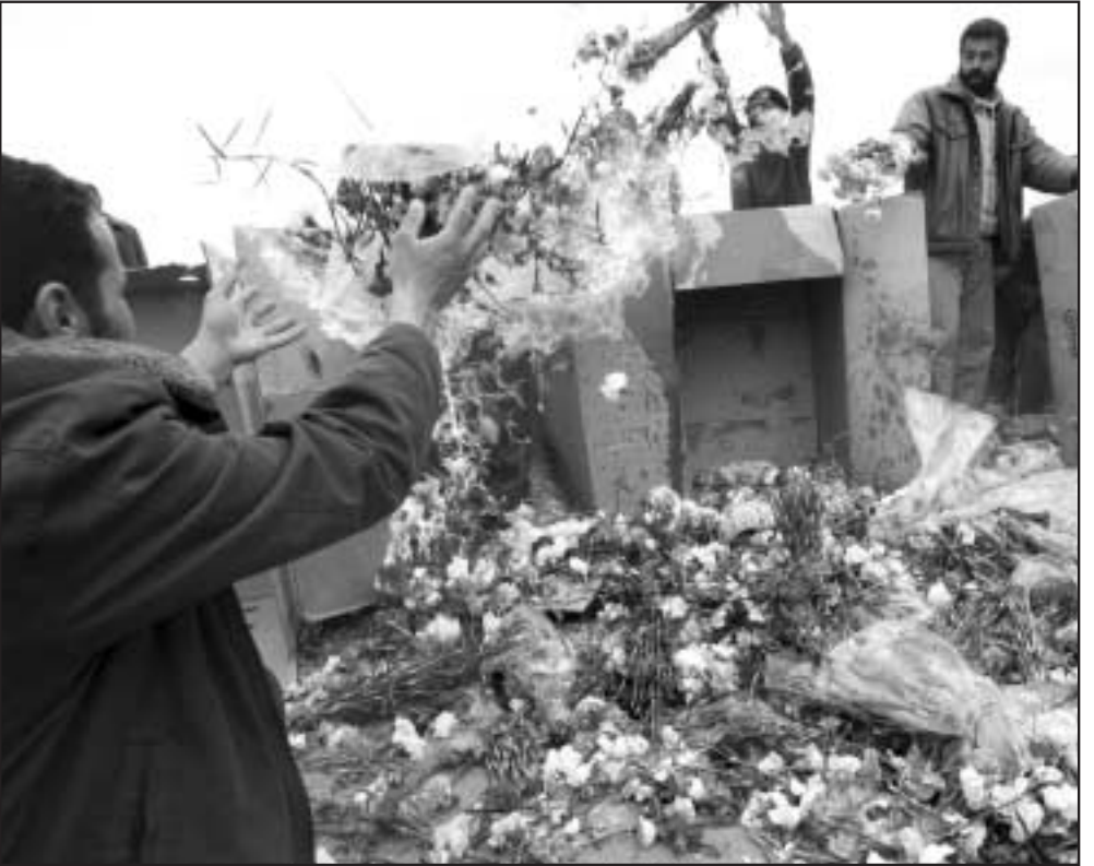
مزارعون فلسطينيون يحرقون باقات الورود بعد منع اسرائيل من تصديرها الى الخارج

من ناحية قال المحلل العسكري في الصحيفة رونين برغمان، المعروف بصلاته الوطيدة مع الاجهزة الامنية الاسرائيلية، ان مغنية