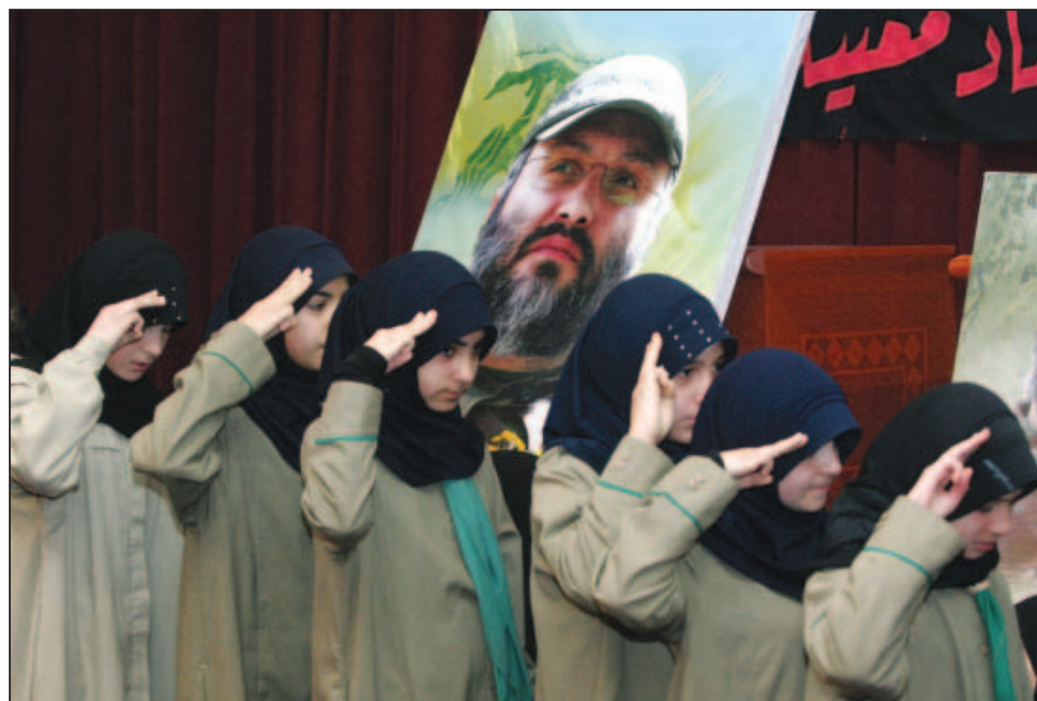
طالبات يشاركن بنشاطات اثناء تابين الزعيم العسكري لحزب الله عماد مغنية

الناصره - «القدس العربي» - من زهير اندراوس: قالت صحيفة «صندي تايمز» البريطانية الاحد القيادي في حزب الله عماد مغنية استشهد في انفجار عبوة ناسفة خبثت في دعامة كرسي القيادة، ونقلت الصحيفة البريطانية عن مسؤولي استخبارات اسراييليين ان دعامة الراس في كرسي القيادة لجيب الممتسوبيشي باغريو تم تغييرها باخرى، وتابعت الصحيفة أن حزب الله يتهم اسراييل بالانفجار الا ان المسؤولين يعتقدون ان التفجير نفذ بواسطة تفجير عبوة ناسفة وضعت في سيارة أخرى وقتت الى جانب سيارة مغنية وتم تفجيرها عن طريق قمر صناعي.