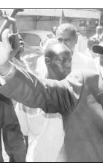
النائب الاول للرئيس السوداني سلفاكير يحيي انصاره

يكون مزودا تماما بالمعدات وفقا لمعايير الامم المتحدة فإن الامر سيستغرق وقتا ايقع على الحدود مع تشاد، وخلال أقل من شهرين على الأرض التقى كيتا بكل الأطراف المعنية وهي الحكومة والمتمردون وزعماء القبائل العربية، ويقوم بجولات في كل بقعة من الأحياء من سكان دارفور في منطقتهم ليقدم لهم رقم هاتفه كإجراء عاجل في بناء الثقة. وقال «كيتا ان هدفه على المدى الطويل هو حماية سكان دارفور واقناع الفصائل من جنوب افريقيا والتي سيستغرق وصولها ستة شهور».