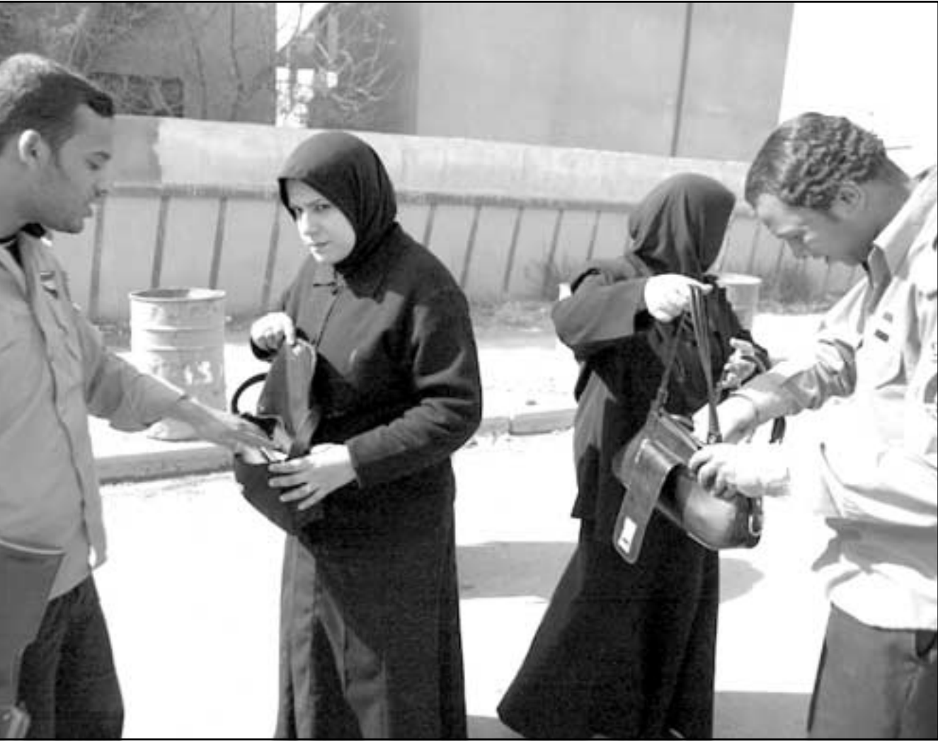
رجال امن يفتشون نساء عراقيات في حي الكرادة عقب العملية الانتحارية أمس