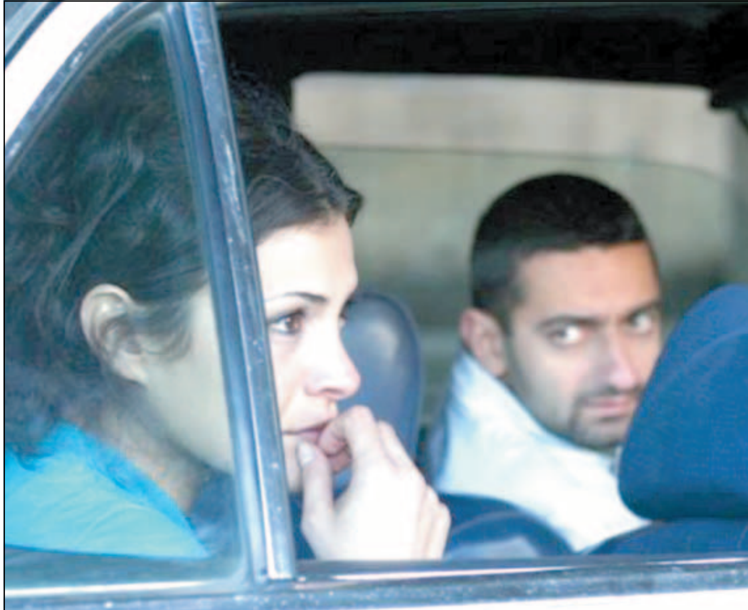
جورج خباز في لقطة من فيلم «تحت القصف»

■ وتعلق جمانة: هذه هي السنة الثانية التي نشارك في هذا المهرجان وكان بالنسبة لنا حلماً رائعاً يتحقق، وفي هذه كان أجمل، كل سنة يكون البرنامج أزوع من الذي سبقه، شاركتنا في المهرجان ونحن نغطي وجوهنا بالأقنعة الرائعة. وبعدها انتقلنا إلى العديد من المناطق في إيطاليا واستمتعنا بكل لحظة من كوننا معاً ومن جمال الطبيعة والكناش... شعور غريب ينتابني في هذا البلد، مدينة رومانسية ساحرة الجمال، نرى العشاق يجلسون هنا وهناك وفي كل مكان.. شعب مميز له حضارة راقية ويجب كل ما فيه جمال.. تمشينا بين الأزقة الرومانسية، لا شيء حولنا سوى السماء والبحر.. المراكب تنتقل من مكان إلى آخر من تحت الجسور، ونحن كما في الأفلام!!