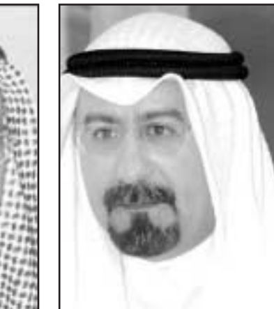
الشيخ جابر الخالد

واضاف قائلا: «نحن نرفض هذه الفتنة التي تحدثت. وفي الوقت نفسه اتخذنا اجراءاتنا والاعتزازات الامنية. نعم لم نبلغ رسميا بوجود مثل هذا التجمع في المكان المذكور في الرسائل، ولكننا نقوم بواجبنا وتدابير». ووجع من هذه الرسائل، قال الوزير جابر الخالد: «نحن نتابع مصدر هذه الرسائل.. وفور معرفتنا بمن وراء الاعتراض وانعقاد هذا التجمع ومن وراء الرسائل سيحال الى الجهات الاختصاص» و اضاف الخالد الى القول في تصريح صحيفة «السياسة» «شرف الين ان