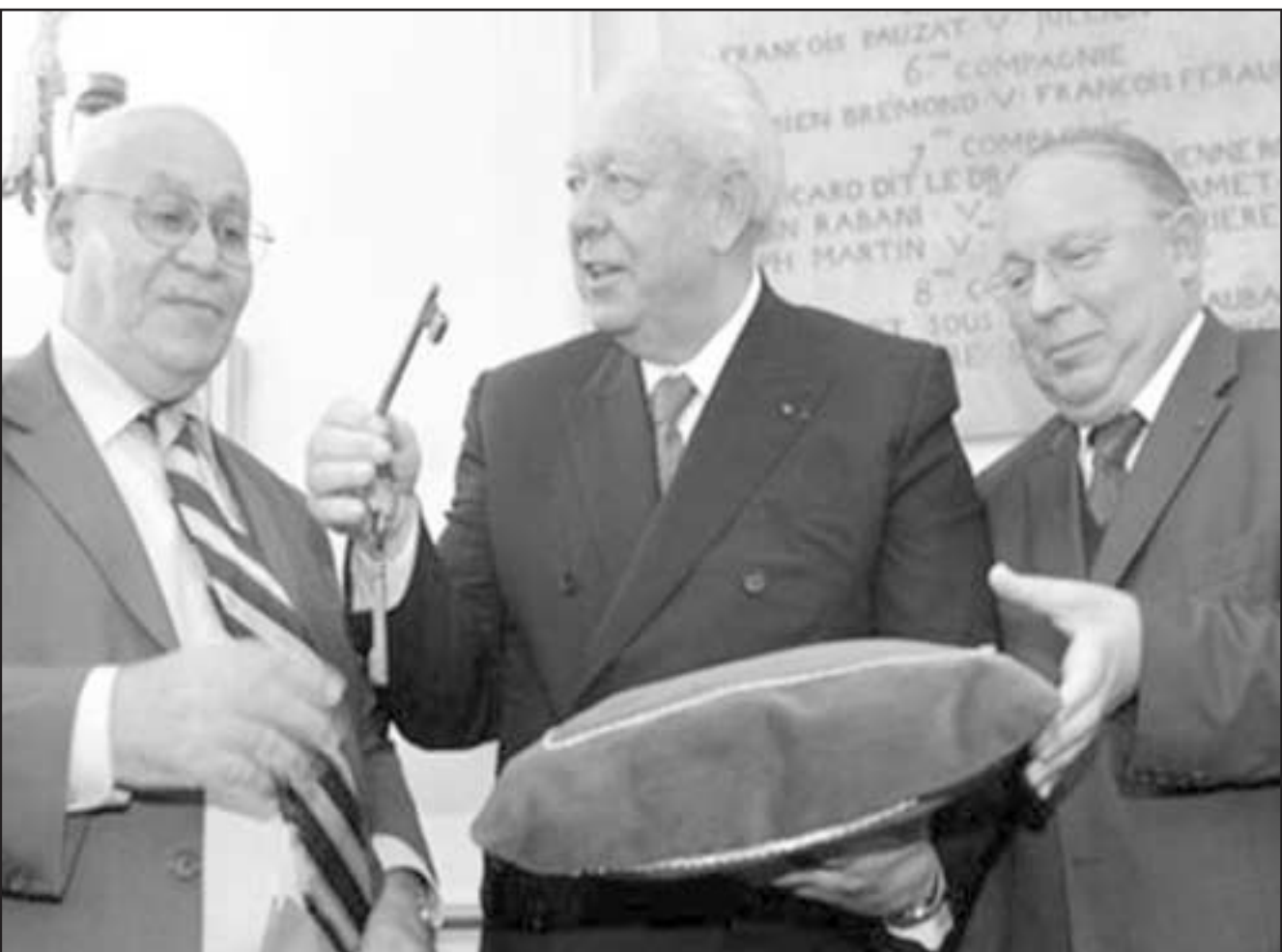
جون كلود غودان عمدة مرسيليا (وسط) يسلم داييل بوبكر، رئيس المجلس التمثيلي للديانة الاسلامية بفرنسا، مفاتيح المبنى الذي سيبني على انقاض الجامع الكبير لمرسيليا