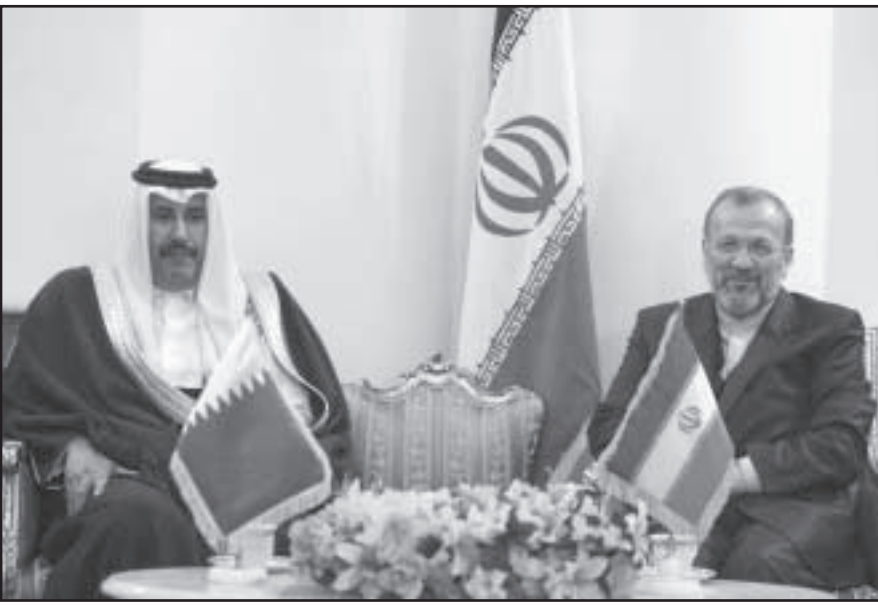
وزير الخارجية الإيراني منوشهر متكي مستقبلاً رئيس الوزراء القطري الشيخ حمد بن جاسم في طهران أمس

ورأى أن «كل الدول تقر بدور إيران في إقرار الأمن في المنطقة». ولفت إلى أن إيران «صمدت اليوم 30 عاماً أمام المؤامرات». واعتبر أن «نظام الجمهورية الإسلامية الإيرانية نظام شعبي ويسود البهوه والأمن والاستقرار في أنحاء البلاد». وشدد عادل على أن «الدفاع عن السيادة أمام أطماع الأعداء من مهام الجيش».