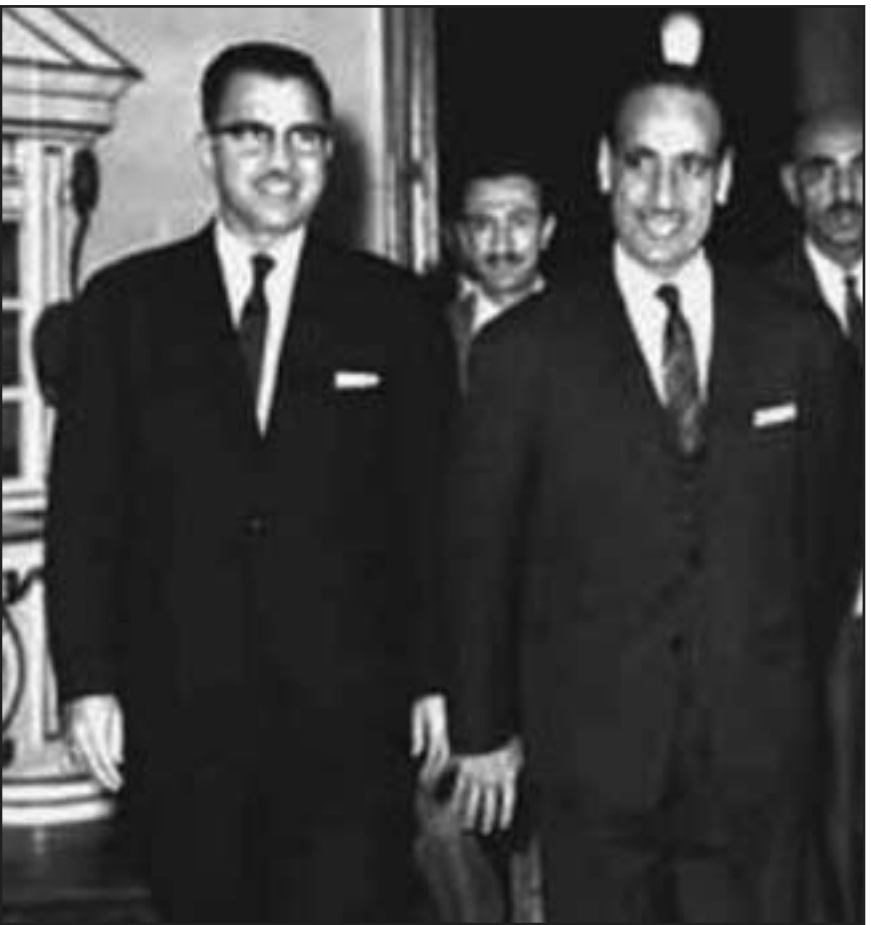
عبد السلام عارف مع عبد الرحمن البرزاز

بعض المكر، وقد علمت بمرور الايام أنه كان ضابطاً في الجيش برتبة رئيس (تقيب) في تموز (يوليو) 1958 عندما اشترك مع العقيد الركن عبد السلام محمد عارف في الثورة التي اطاحت بالحكم الملكي، وراقبه في زيارته لألوية (محافظات) العراق بعد نجاح الثورة، وشارك في ثورة 14 رمضان (8 شباط) 1963 وحركة 18 تشرين الثاني (نوفمبر) 1963 إذ عينه عبد السلام بهذا المنصب ذي الدرجة الخاصة بمرسوم جمهوري، فاعتبر –طوعاً محالاً على التقاعد.. أما صفه في الجيش فقد كان الهندسة الآلية الكهربائية.