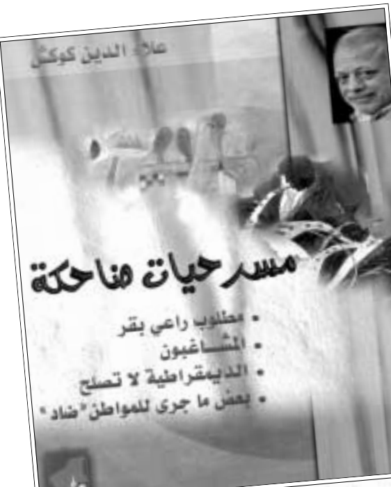
مسرح حيات فهاحكة

استطاع أن يحقق حضوراً ابداعياً مهماً فيها. أما عن علاقته بالكتابة فقد كتب عن هذه العلاقة يقول يوماً: «في البدء كانت الكلمة... في البدء كان المعنى... لا فرق بين الإيماء والحرف، أحدهما يرفع الآخر على كتفيه، الفيت نفسي صغيراً أكتب... لم... وكيف؟ لم أكن أدري... لكن عندما تسرب لي روعي وعي ما، عرفت بأنني أكتب وأمثل لأن هناك قداماً أسود، علينا أن نقف في وجهه بصلاية وحكمة».