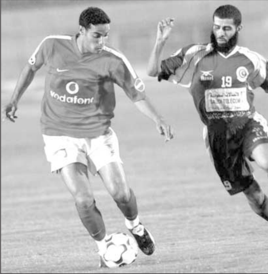
النادي الاهلي في إحدى لقاءاته

المصري هدف الانتصار لاسمعت السويس في الدقيقة 76 من ضربة رأس. وواصل اسمعت السويس بهذا الفوز رحلة الهروب من ذيل الترتيب وتقدم للمركز الحادي عشر في ترتيب الدوري المصري يضم 16 ناديا بعدما رفع وصيده الى 19 نقطة بينما تجدد رصيد المصري عند 16 نقطة. وكان اسمعت السويس فاز في المرشحين السابقين على ملائح الجيش والاولومنيوم على الترتيب.