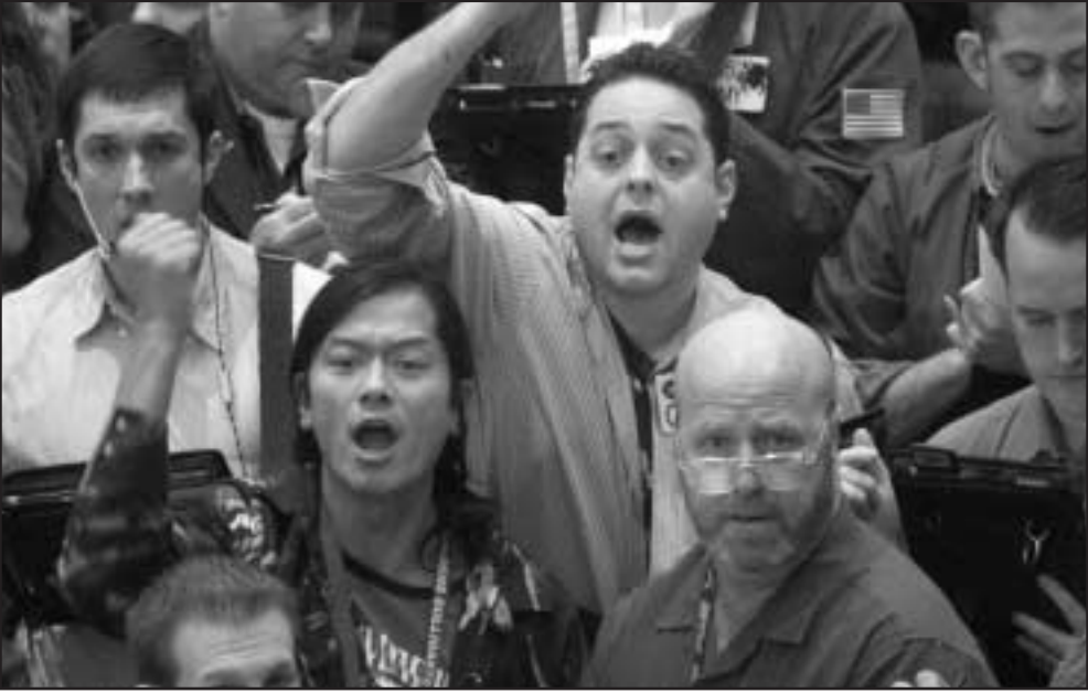
تتماملون في عقود النفط الآجلة في بورصة نيويورك التجارية (نايمكس) أمس عندما تجاوز سعر البرميل 102 دولار