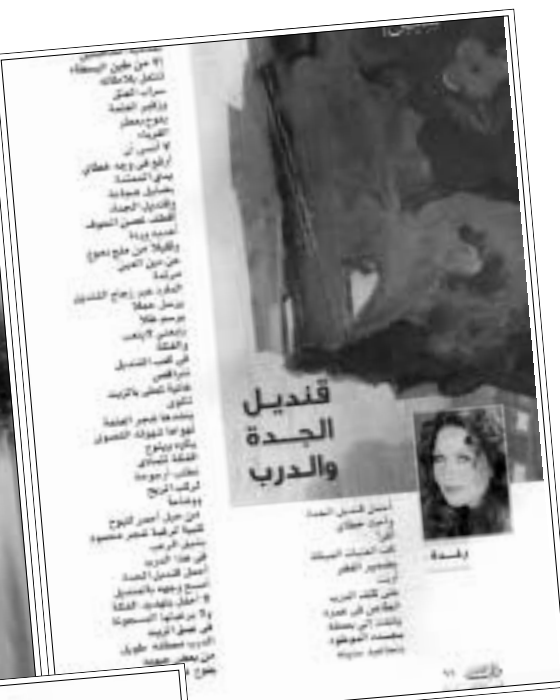
فقديل الجدة والدرج

السينمائية السورية الأصل (رعدة) أن تعلق أيضاً، وأن تحقق نجوميتها التي تكرست لها في السينما المصرية... وقد أصدرت ديوانها الأول (موسم العشق) في القاهرة عام 1989... إلا أن اشتغالها بفن التمثيل حرمها من أن تحقق أحلامها الأدبية، مما دفعها للقول في إحدى حواراتها الصحافية (منشورة: خنت الأدب لحساب السينما).