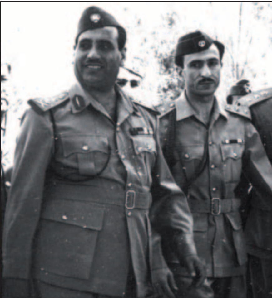
عبد السلام عارف مع عبد الله مجيد

كنّا في القصر الجمهوري قد أنذرتنا في احد ايام منتصف شهر كانون الاول (ديسمبر) 1964 عن احتمال حدوث حركة انقلابية، إذ يتطلب الامر اتخاذ الحيطة والحذر من لندن الجميع.. وكان من ضمن الاجراءات التي نتخذها في مثل هذه المواقف تحديد دخول الاشخاص غير المخولين الى القصر. كنت في غرفة التشرiffsات قبل المغيب عندما أخبرني أمر حرس باب الدخول الى القصر هاتفياً