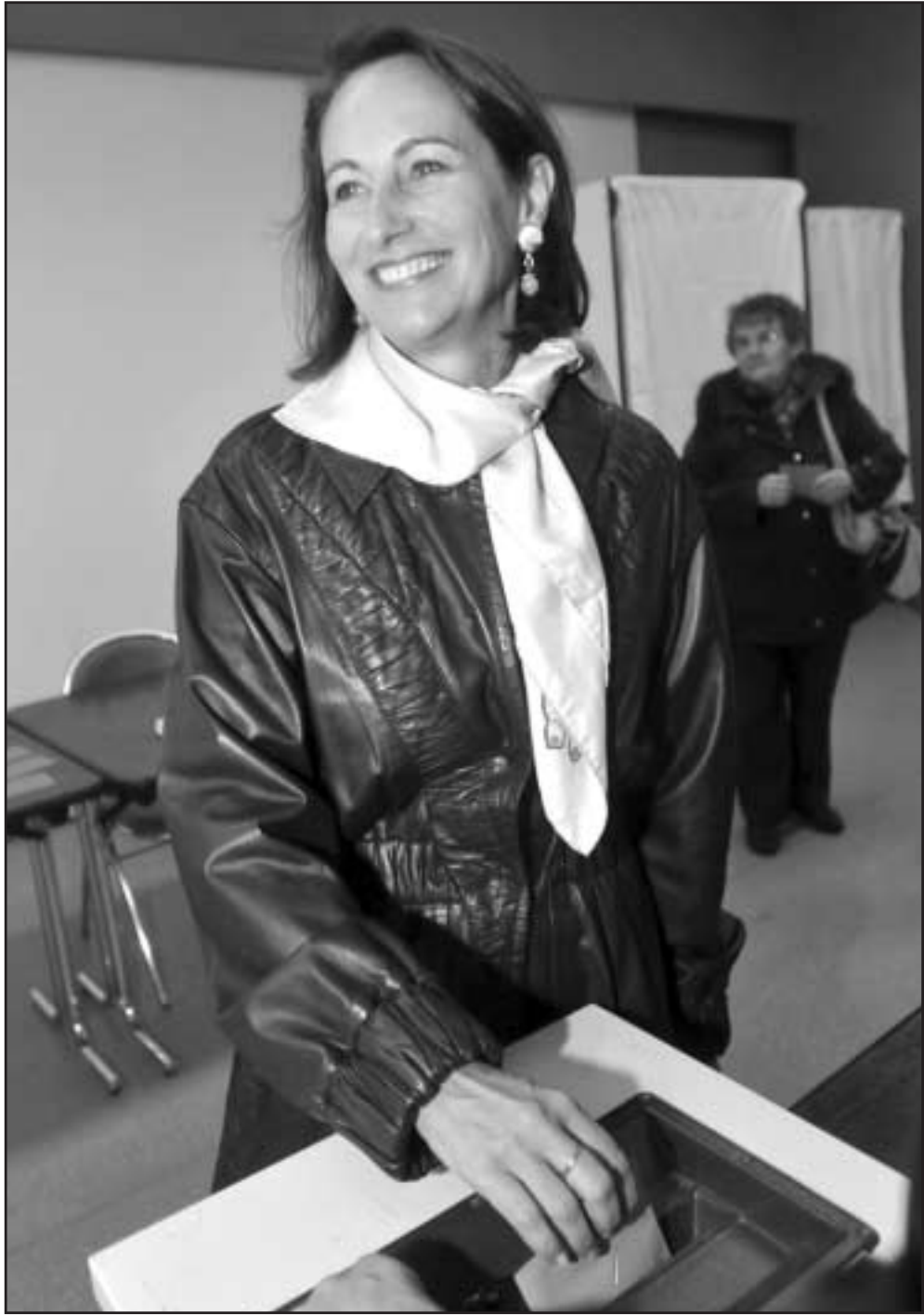
الاشتراكية سيغولين رويبال تدلي بصوتها امس في انتخابات تريدها ان تكون بوابة للانتقام من اليمين الحاكم

المواطن من حقوقه المدنية بسبب عدم معرفته للغة اجنبية يعد اكبر انتهاك لحقوق الإنسان.