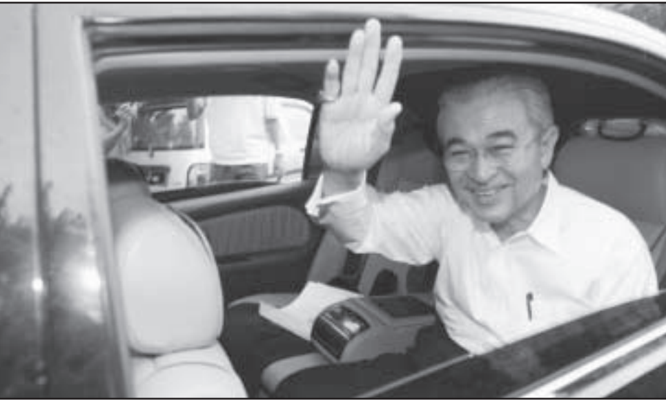
رغم الخسارة رئيس الوزراء عبد الله احمد بدوي يحيى انصاره أمس

وقالت تريشيا يوم مديرة مركز دراسات السياسة العامة