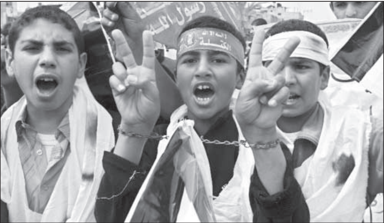
اطفال فلسطينيون يتظاهرون ضد الحصار الاسرائيلي لقطاع غزة