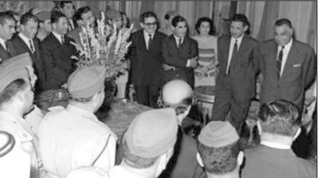
الرئيس عبد الناصر والمشير عامر يستقبلان وفداً سياسياً وعسكرياً عراقياً - القاهرة 1966