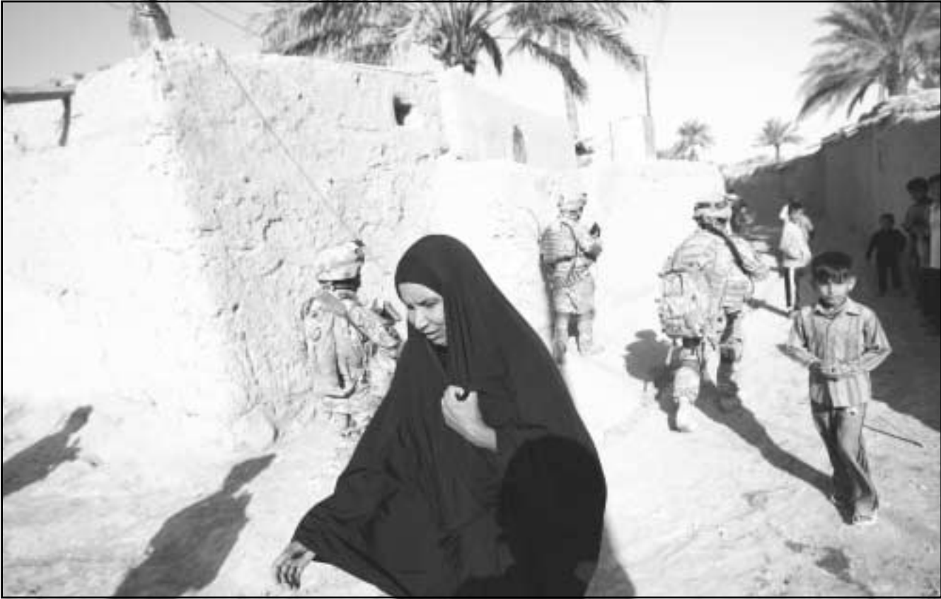
سيدة عراقية تسير إلى جانب جنود امريكين في محافظة ديالى

عام 2003 و 291 في عام 2004 و 778 في عام 2005 و 812 في عام 2006، كما تزداد ظاهرة ختان النساء وهذا جديد في العراق خاصة في كردستان. كما وجدت مقبرة جماعية للنساء في ديالى تضم 8 نساء مجهولات. وقالت ترمين عثمان وزيرة شؤون المرأة بالوكالة إن ظاهرة انتحار الفتيات حرقاً في إقليم كردستان، سببها أن القانون والتغييرات الفكرية لم تكن متوازنة، وتغيير القوانين في الاقليم لم يصبحه تغيير اجتماعي. وأضافت عثمان، أن جرائم القتل التي توصف بجرائم الشرف موجودة موجودة وتؤديها الأرقام التي تنشرها حكومة الاقليم. وأكدت عثمان أن تغيير القوانين في اقليم كردستان بتخليط العقوبة على مرتكبها واعتبارها جريمة جنائية مثلها مثل باقي جرائم القتل، لم يكن كافياً لإنهاء هذه الظاهرة. وتشير وزيرة شؤون المرأة إلى أن تغيير القانون لم يصبحه تغيير في الفكر الاجتماعي أو الموروثات الاجتماعية وخصوصاً في الأوساط العشائرية الريفية، قائلة: ما زال الأخ أو الأب يفرض على قريباته قيمه الموروثة، وهذا ما أدى إلى قيامهم بإجبار الفتيات على إحقاق نفسها، تخنبا للوقوع أمام المحكمة بتهمة القتل العمد. من جانبها أكدت زهراء الشبيخي الناطقة النسوية ووزيرة شؤون المرأة في حكومة إقليم الجعفرى، إن ظاهرة ختان الفتيات عادت إلى الظهور في بعض مناطق العراق. وقالت الوزيرة ترمين عثمان إن ظاهرة ختان الإناث عادت إلى الظهور من جديد في المناطق التي كانت قد اختفت فيها في السابق، إلا أنها تجري الآن في السري في بعض مناطق كردستان والمحافظات الأخرى، مؤكدة أن هناك حملات توعية تقوم بها حكومة الإقليم ومنظمات المجتمع المدني للفضاء على هذه الممارسات نهائياً.