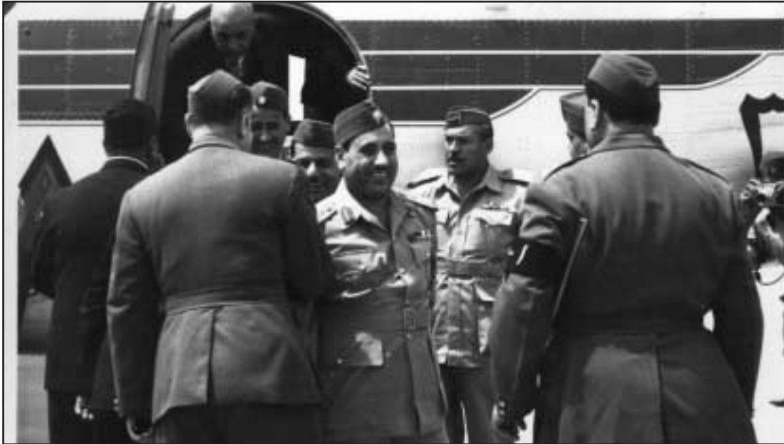
عبد السلام في زيارته الاولى للبصرة عام 1964