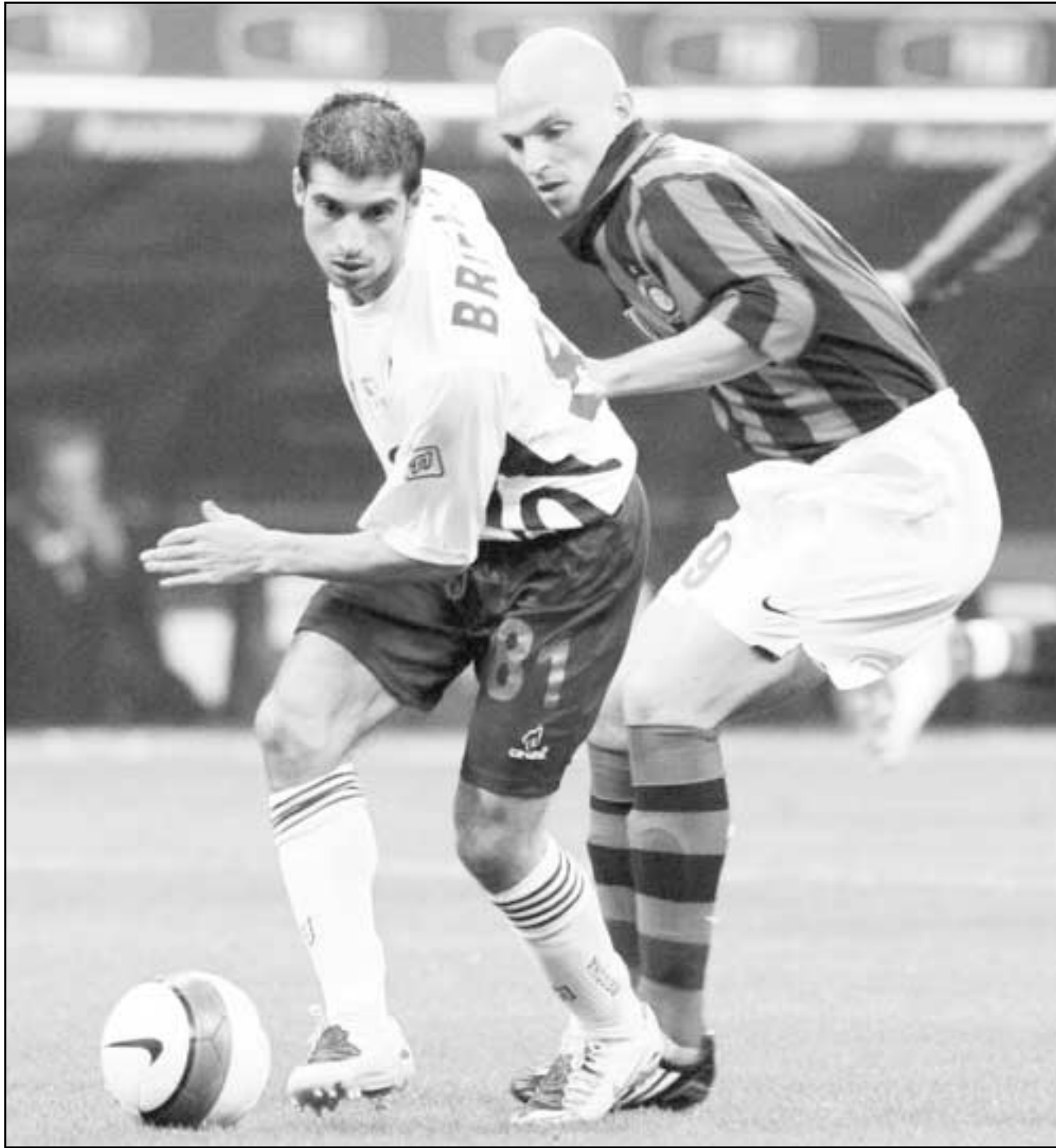
انترميلان خلال احدي المباريات

■ روما - ا ف ب: واصل روما الصيف ضغطه على انتر ميلان المتصدر وحامل اللقب في الموسم الماضي عندما تغلب على مضيفه نابولي 2-0 صفر أمس الأحد في المرحلة السابعة والعشرين من الدوري الإيطالي لكرة القدم.