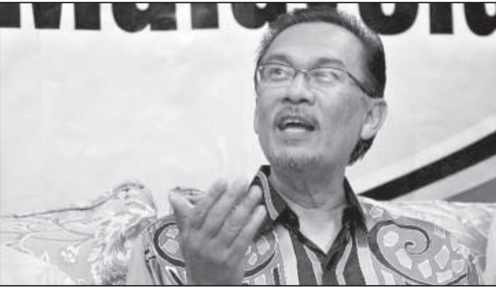
زعيم المعارضة أنور ابراهيم العائد بقوة