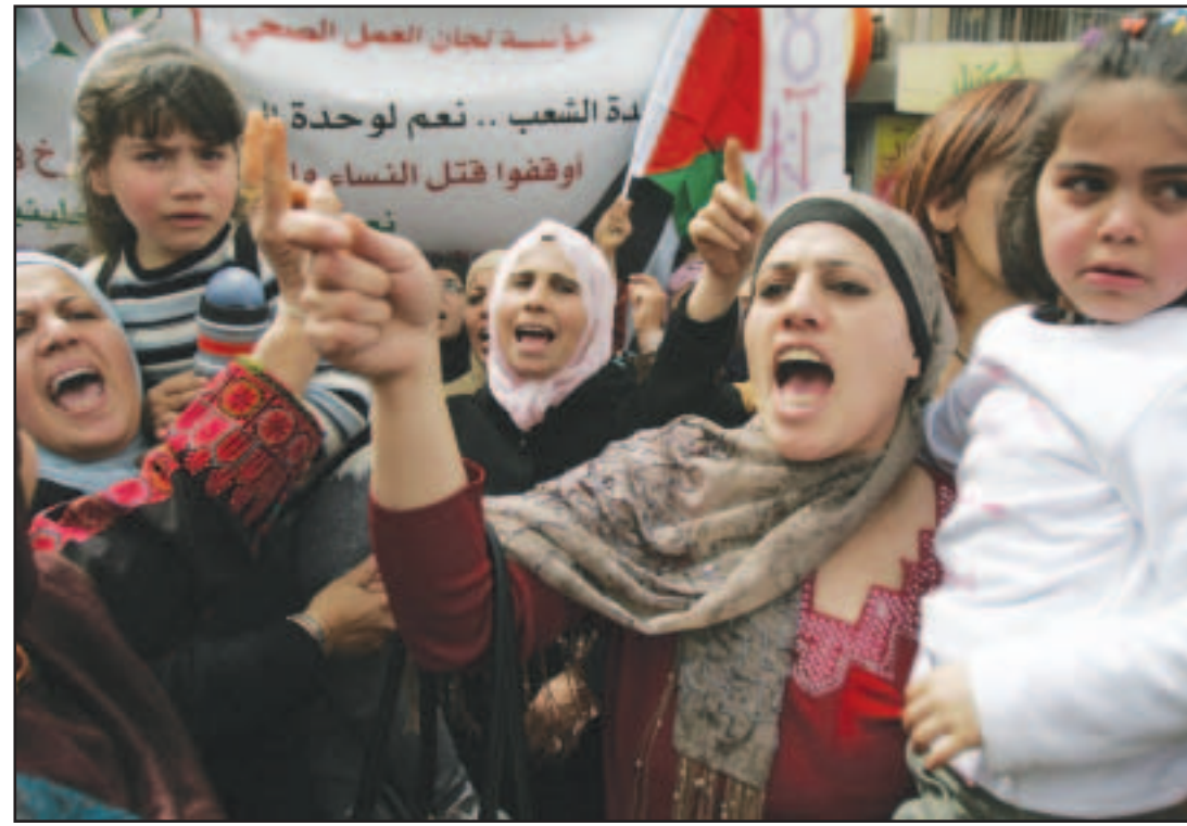
سيدات فلسطينيات يتظاهرن للمطالبة بحقوق المرأة في مدينة رام الله احتفالات بيوم المرأة العالمي امس الاول

ولم يستبعد جلعاد في تصريحات للقيادة الثانية في التلفزيون الاسرائيلي اتفاق تهدئة تتفاوض بشأنه مصر. ان الان جلعاد وضع شركتين لوقف الغارات الاسرائيلية على قطاع غزة هما «الوقف التام لإطلاق الصواريخ من قطاع غزة على اسرائيل ووقف تهريب الاسلحة من مصر الى قطاع غزة». وكان مساعدين لسليمان اجروا الاسبوع الماضي مباحثات مع قادة من حماس والجهاد الاسلامي بشأن احتمالات التوصل الى هدنة مع اسرائيل. ويعاود الجانب الاسرائيلي والفلسطيني خلال الاسبوع الحالي استئناف الاتصالات بينهما. ونقلت اذاعة الجيش الاسرائيلي امس الاحد عن مصادر سياسية اسرائيلية مسؤولي السلطة الفلسطينية ومراقبي الاتحاد الاوربي الى معبر رفح المخصص لعبور الأشخاص.