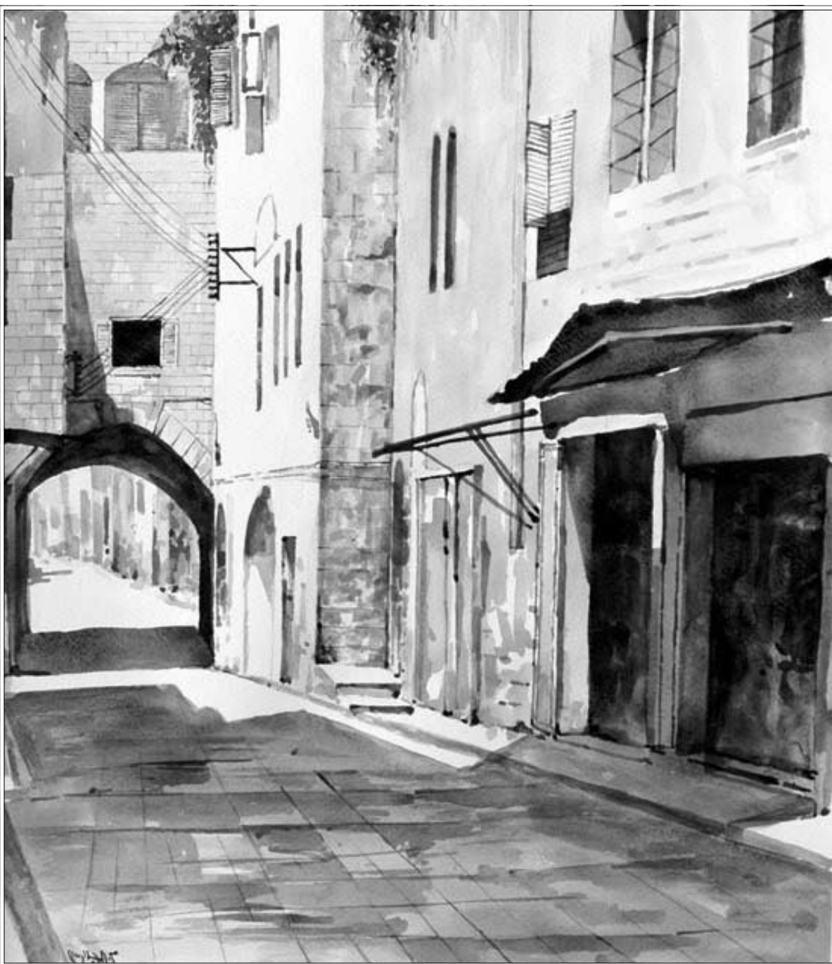
لوحتان لمدينة نابلس (القدس العربي)

حارة قديمة، بيوتها مزينة بالأقواس، كانت الأتفة تستدرجني شيئاً فشيئاً، استسلمت للظلال التي ارتخت خيوطها الهادئة على أرض معبدة بالإسمنت، الممرات تعقب برائحة الياسمين، القباب التي تظلل الممرات، الأبواب التي تقابل في ذات الرقاق، كأنها بيت العائلة، أبواب هنا وأبواب هناك، انعطفت إلى اليمن، وكنت تائه الخطي، هل أدخل هذه الحسارة المعتمة، أم استمر بالسير في الرقاق المضى؟ قلت لنفسي: لأجرب هذا الطريق الضيق العتم، عله يقضي إلى بيوت قديمة أخرى.