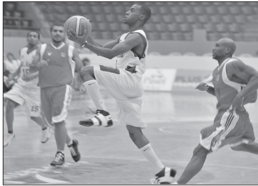
من مباراة فريق «الكويت» الكويتي ضد فريق «النصر» الاماراتي

بعد ثلاثة انتصارات على الفاسي المغربي 67-07 و70-67 والحداد السعودي 28-18، ودي لاسال الفلسطيني 58-37. بهزيمته الاولى في البطولة.