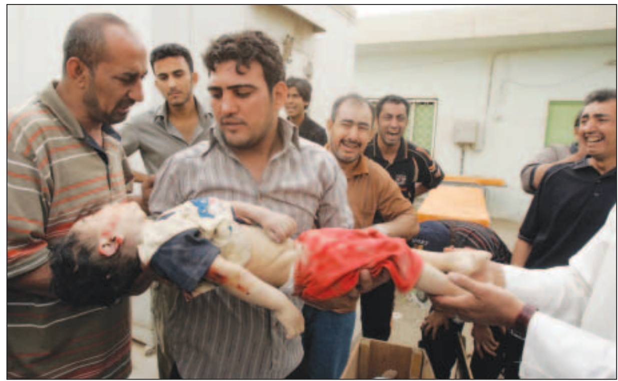
جثمان طفل من ضحايا القصف الأمريكي بمدينة الصدر في بغداد امس

الناصر - «القدس العربي» من زهير اندراوس: تواصل وسائل الاعلام الاسرائيلية باللغة العبرية التركيز على المفاوضات التي قد تبدأ بين الدولة العبرية وسورية، وتوحي بوجو من التفاؤل بقررب التوصل الى اتفاق سلام بين الدولتين. وقال المحلل السياسي لصحيفة «معاريف» الاسرائيلية بن كاسبيت، المعروف بصلاته الوطيدة جدا مع ديوان رئيس الوزراء الاسرائيلي، ان ايهود اولمرت ذاق طعم ثمار السلام، ان ان الرئيس الفلسطيني محمود عباس، حمل هدية من دمشق هي عبارة عن حلويات من نوع البقلادة الشامية المشهورة، وذلك بعد ان شارك عباس في مؤتمر القمة العربية الذي عقد في نهاية الشهر الماضي في العاصمة السورية، دمشق. وأضاف المحلل الاسرائيلي أنه بعد عودة الرئيس عباس من دمشق الى الأراضي الفلسطينية عقد مباشرة لقاء آخر مع رئيس الوزراء الاسرائيلي في القدس الغربية، وفوجئ الاسرائيليون عندما أخرج الرئيس الفلسطيني عليه من الخشب مزينة ومصنعة في دمشق وبها بقلادة شامية، وقال موظفون رفيعو المستوى ذاقوا طعم البقلادة الشامية انها اطيب والذ بقلادة ذاقوها في منطقة الشرق الأوسط. كما كشف النقاب عن ان الرئيس الفلسطيني أحضر هدية مماثلة للوزيرة الخارجية الاسرائيلية تسيبي ليفني، واللائح ان الصندوق الصغير الذي كان محملا بالبقلادة حمل ايضا رسالة هامة جدا، فقد كان ملصقا على الصندوق وثيقة مكتوبة باللغة العبرية وهي عبارة عن القرارات التي اتخذت في مؤتمر القمة العربية في دمشق وعلى الرسالة جميع اعلام الدول العربية التي شاركت في مؤتمر القمة. يشار الى ان القمة العربية في دمشق صادقت على قرارات سابقة اتخذتها الجامعة العربية، ومن أهمها موافقة القمة العربية على المبادرة