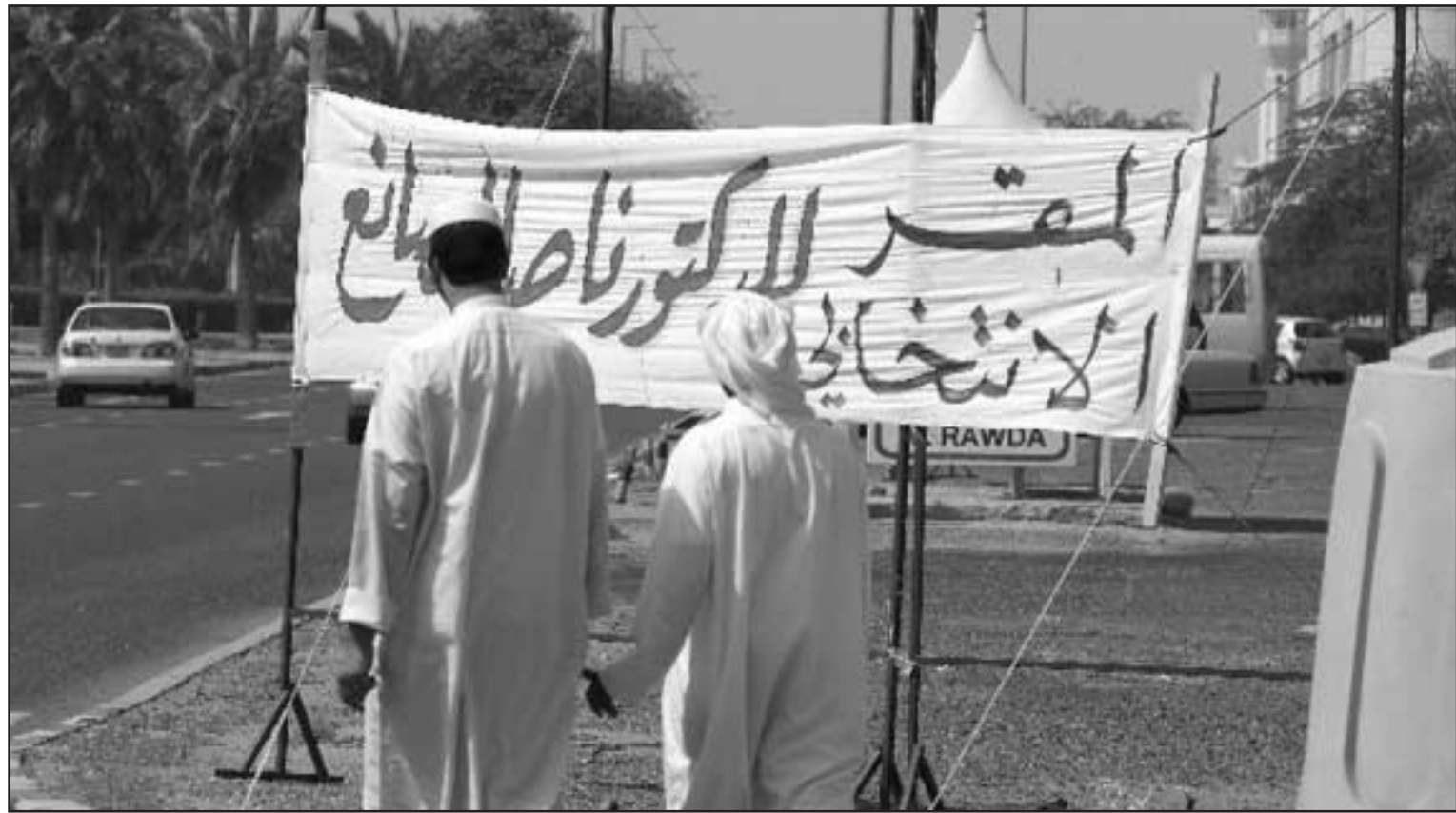
شباب كويتيون امام مقر الحملات الانتخابية في العاصمة الكويت

الجمع مشيرا الى ان ارتفاع اسعار الاعلانات في ظل قانون الانتخاب الجديد ساهم بشكل غير مباشر بارتفاع سقف الاسعار فاصبح سعر السنتيمتر في الجريدة بقيمة 50 دينارا.