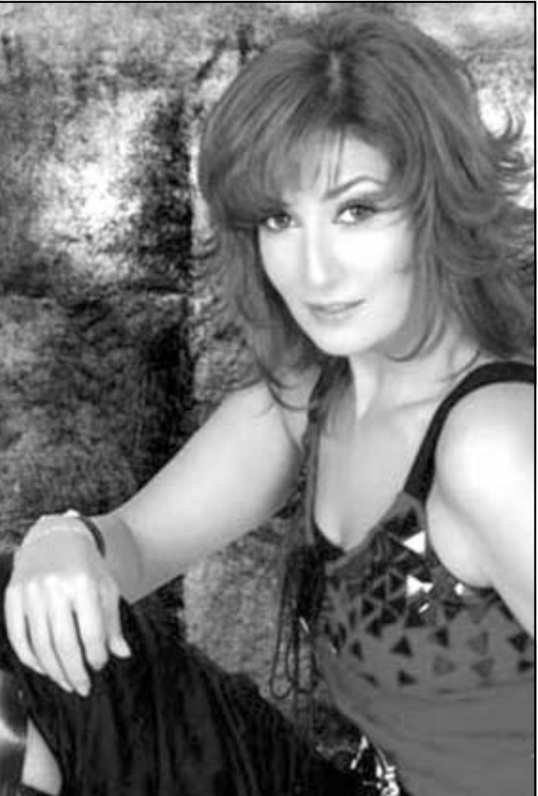
غادة عبد الرزاق

وشخصيت المسلسل يواجهون مصائرهم وسط اجواء من الخطر والمخوض الدائم، والاسرار الضخمة والحقوق الخفية بفعل قاعل ون ذلك من