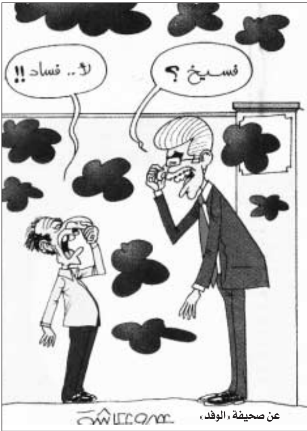
عن صحيفة «الوفد»