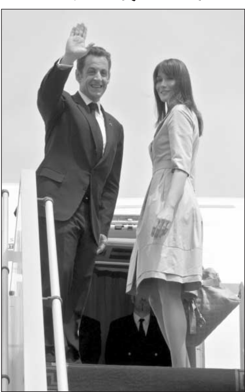
ساركوزي وزوجته كارلا برونيا يغادران تونس امس

الخارجي الذي لم يكن على الاطلاق له الاولوية عنده.