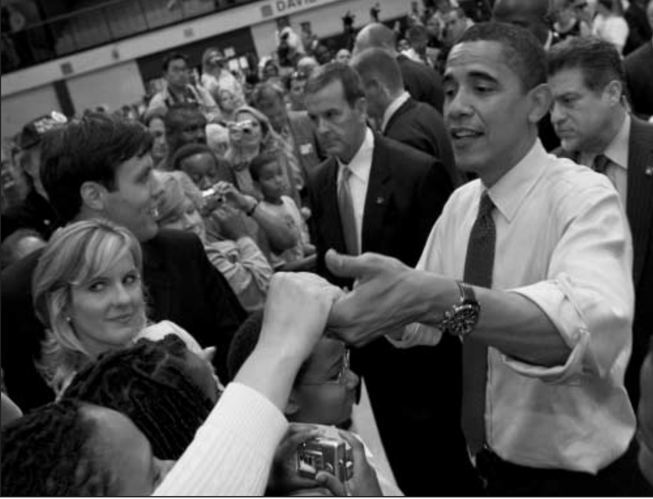
اباما يصافح مناصريه في احد حملته الانتخابية

واقطع باراك اباما الثلاثاء «بحزن» و«غضب» علاقته مع مرشده الروحي السابق القس جبريما رايت منددا بتصريحاته «الرعية» وسط تصاعد جدل مرشح عند ابواب المرحلة النهائية من الانتخابات التمهيدية للحزب الديموقراطي لاختيار مرشحه للبيت الابيض. وقال اباما في احدى محطات حملته الانتخابية في ونستون-ساليم (كارولينا الشمالية، جنوب شرق) نقلتها الشبكات التلفزيونية «لا توجد اعداء» للترشيح «المشينة» التي ادلى بها القس رايت. واذ اضاف المرشح لتمثيل الحزب الجمهوري في الانتخابات الرئاسية في تشرين الثاني (نوفمبر) ان هذه التصريحات «تؤلمني وتؤلم جميع الامريكيين وهي تستوجب الالامة» واصفا كلام جبريما رايت الاستغزافي بانها «نقيض» ما يمثله المرشح.