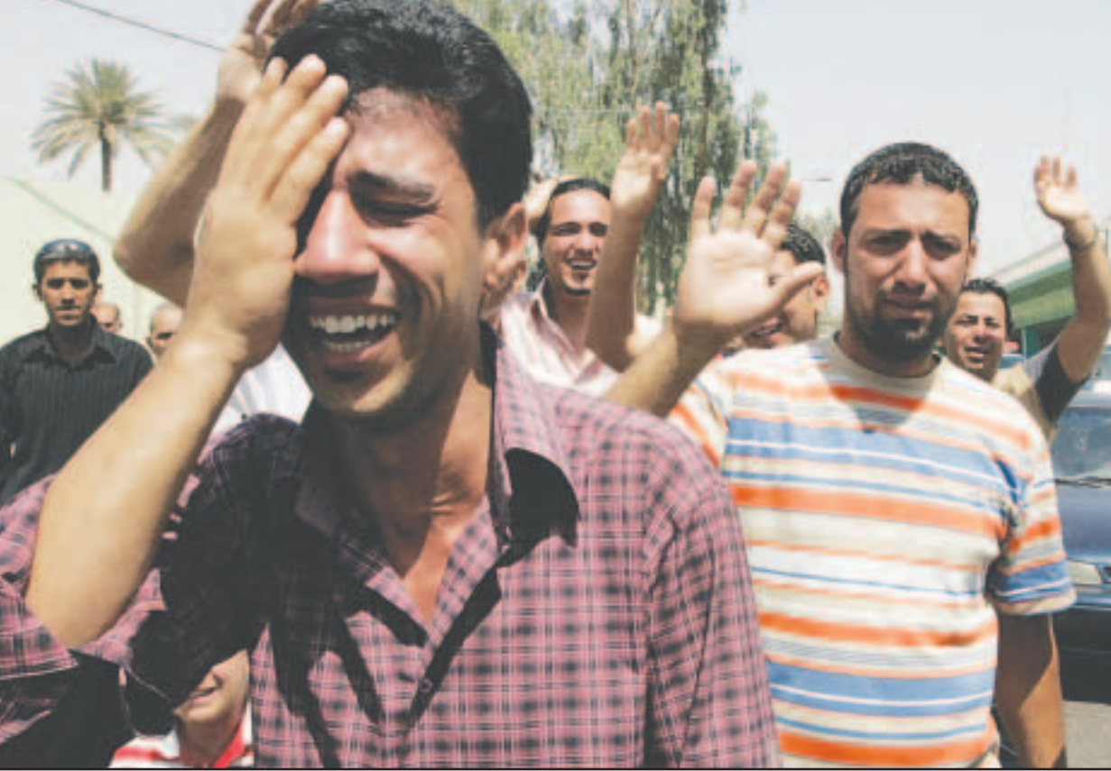
صحافيون عراقيون يشيعون زميلا لهم قتل على ايدي القوات الامريكية في بغداد امس

انه إذا تبين أن أي من هذه الوثائق غير سليمة تلغى التأشيرة كما حملت الأثر «كامل المسؤولية» على صحة المعلومات والبيانات المقدمة وأي أخطاء فيها تلغى التأشيرة».