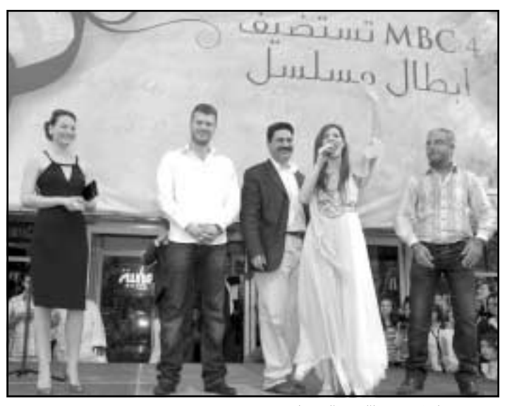
نجوم مسلسل «نور»