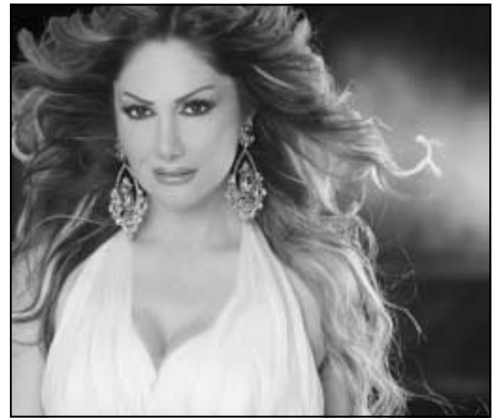
نجوى سلطان (القدس العربي)

لم تستطع العديد من الفتيات تماكك أنفسهن فانتجرتن بالصراخ، واستسلم بعضهن للاغواء ما ان شاهدن النجم كيفانش تاليتوغ «مهند» بطل مسلسل نور ذلك الشاب الوديع الطويل القامة صاحب العيون الزرق، يقف أمامهن شخصياً في مقر مجموعة mbc. حيث احتشد عشاق نجوم المسلسل التركي المذيع «نور» بالآلاف بانتظار وصول أبطاله المفضلين لالتقاط الصور التذكارية معهم. وقد تزامنت الحشود البشرية التي ضمت أعداداً كبيرة من الفتيات والشبان المنتمين لمختلف الشرائح العمرية والجنسيات للحصول على صور خاصة موقعة من «مهند»، والحديث مع أبطال «نور» بشكل مباشر وشخصي بعدما أتيت لهم فرصة توجية الأسئلة إليهم والتواصل معهم، وبدوره لم يستطع النجم مهند، أمام هذه المحبة العارمة التي أحيط بها إلا ان يبدي تقاضيه من مدى انتشار شعبيته، ورواج مسلسل «نور» في العالم العربي. ولم يخف «مهند» إعجابهم الحستائات العربيات اللواتي وجد فيهن سحراً خاصاً، عزاه «مهند» الى تمازج المواصفات الجمالية التركية بنظيرتها العربية. وقد حاولت بعض الفتيات أحرار «مهند» باستفساراتهن عن حياته الشخصية، كعلاقته السابقة بملكة جمال العالم لعام 2002 «أزرا أكين»، أو مدى إمكانية ارتباطه بفتاة عربية يعرض معها حياته، غير أن «مهند» بادى الى الاجابة بكل شفافية وصدق قائلاً: «ان الفتاة العربية معروفة باخلاصها ومشاعرها الجياشة. أنا رجل متزوج وسعيد بحياتي الزوجية، وانتمى الى اولئك الذين يؤمنون بالحب من النظرة الأولى»، كما أجاب مهند عن أسئلة تناولت حياته المهنية ومشاريعه المستقبلية خاصة وأنه قد نال لقب «أفضل عارض أزياء في العالم»، وأفضل عارض أزياء في تركيا».