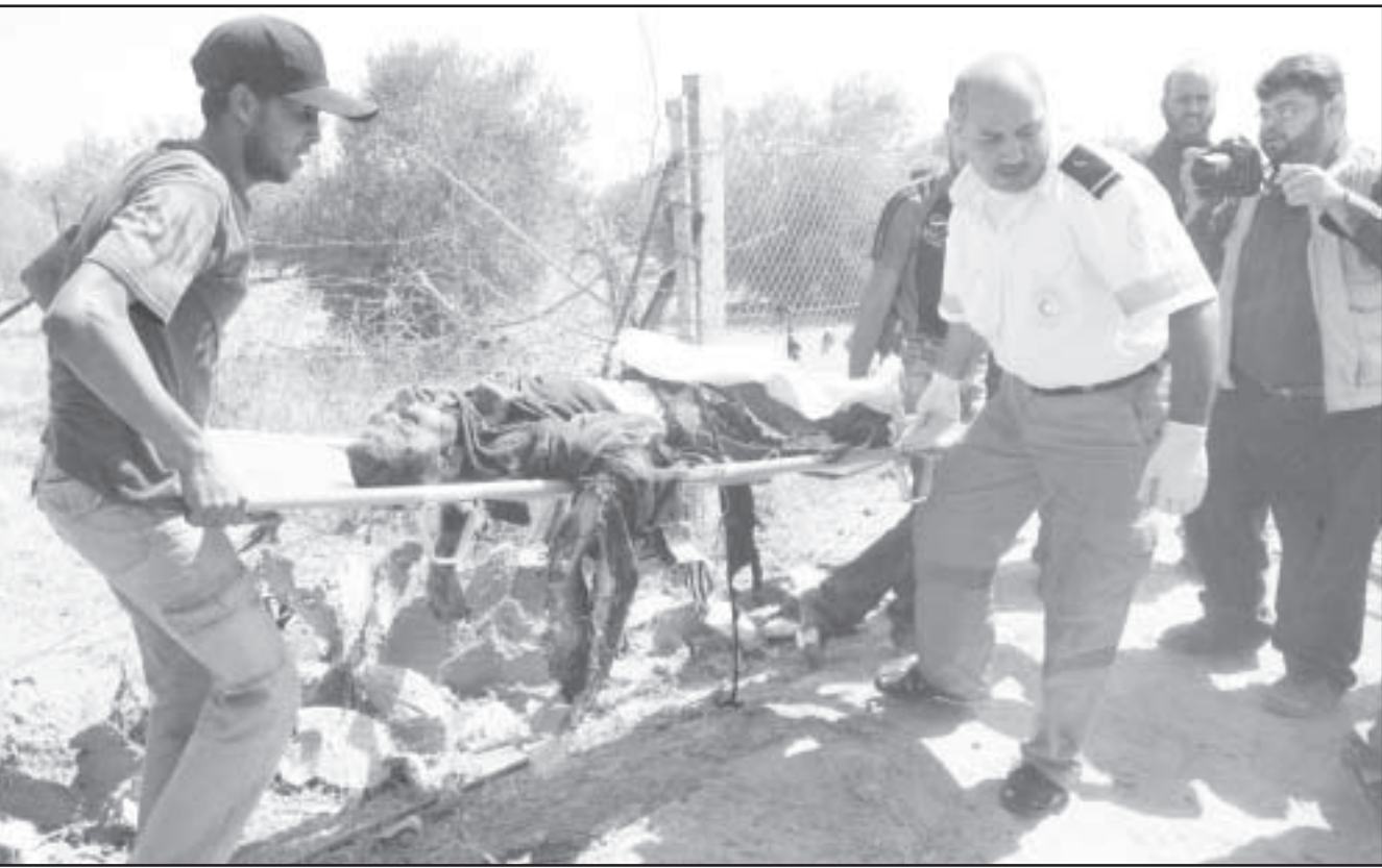
رجال اسعاف ينقلون جثمان شهيد فلسطيني في رفح

قطاع غزة نتاج المباحثات التي دارت خلال الأيام الثلاثة الماضية بين وفد من حركة حماس ومسؤولين مصريين بشأن احلال التهدئة مع اسرائيل، وتفيد التقارير ان هذه الجهود المصرية ما زالت تراوح مكانها، بعد ان وضع قادة تل أبيب شروطا جديدة على عملية التهدئة.