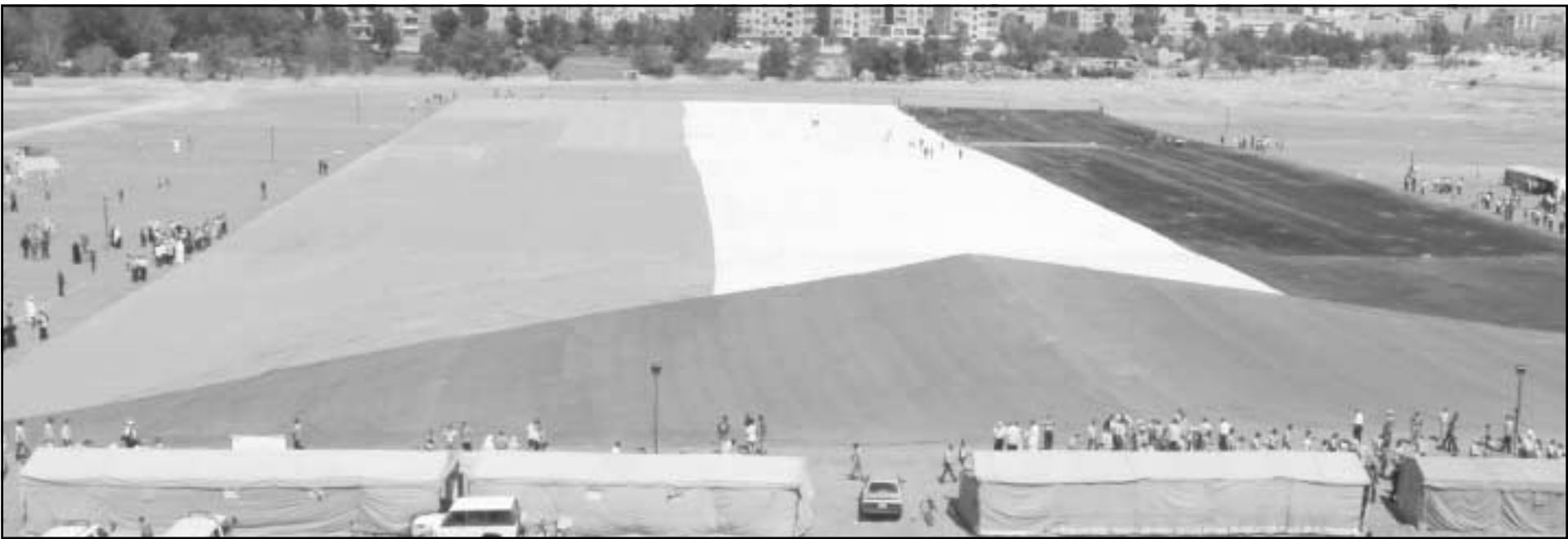
فلسطينيو سورية يجمعون علما فلسطينيا طوله 116 مترا لحياء ذكرى النكبة الـ 60 قرب دمشق

يستجيب للمطالب الدنيا، بما فيها اعادة علاقات سورية مع لبنان ويفتح الابواب للعلاقات الطبيعية مع سورية.