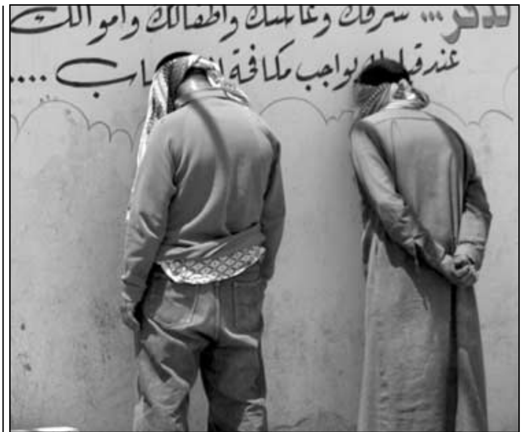
متهمان اللي القبض عليها في الموصل الجمعة (رويترز)

وقررت الحكومة الدنماركية الليبرالية - المحافظة اخيرا طرد 11 لاجئا عراقيا حكم عليهم في الدنمارك لارتكابهم جرائم كبيرة مثل القتل