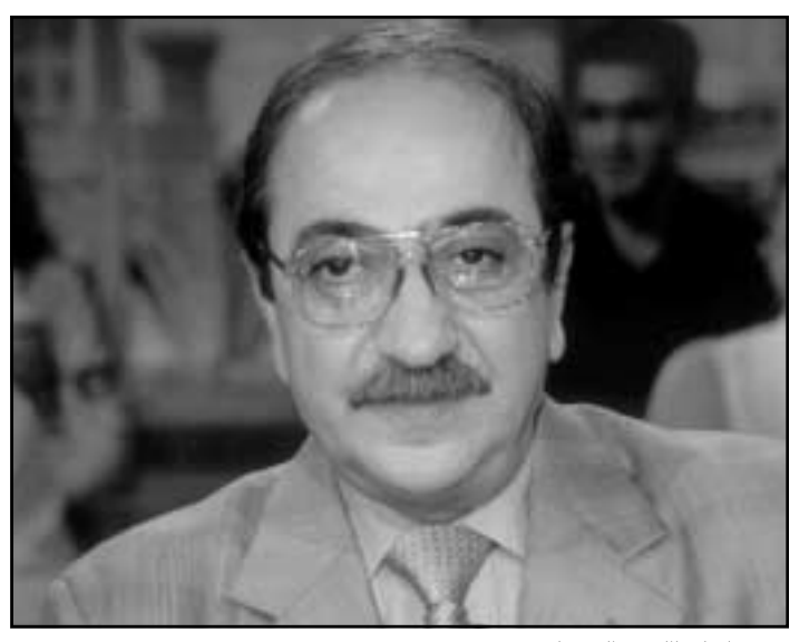
دريد لحام

خيالات لا يتركها غيبي ريم، شممت رائحة الجليل في شعرها وجاكيت الجينز والكوفية الفلسطينية المرقطة التي تلفها حول رقبتها بأسلوبها الموسيقي، وفي الكلمات الأولى التي لفظتها بلهجة فلسطينية تصراوية نقية. كان كل شيء حقيقياً، كان لها رقم تلفون هنا في الإمارات، أكبسه رقماً رقماً