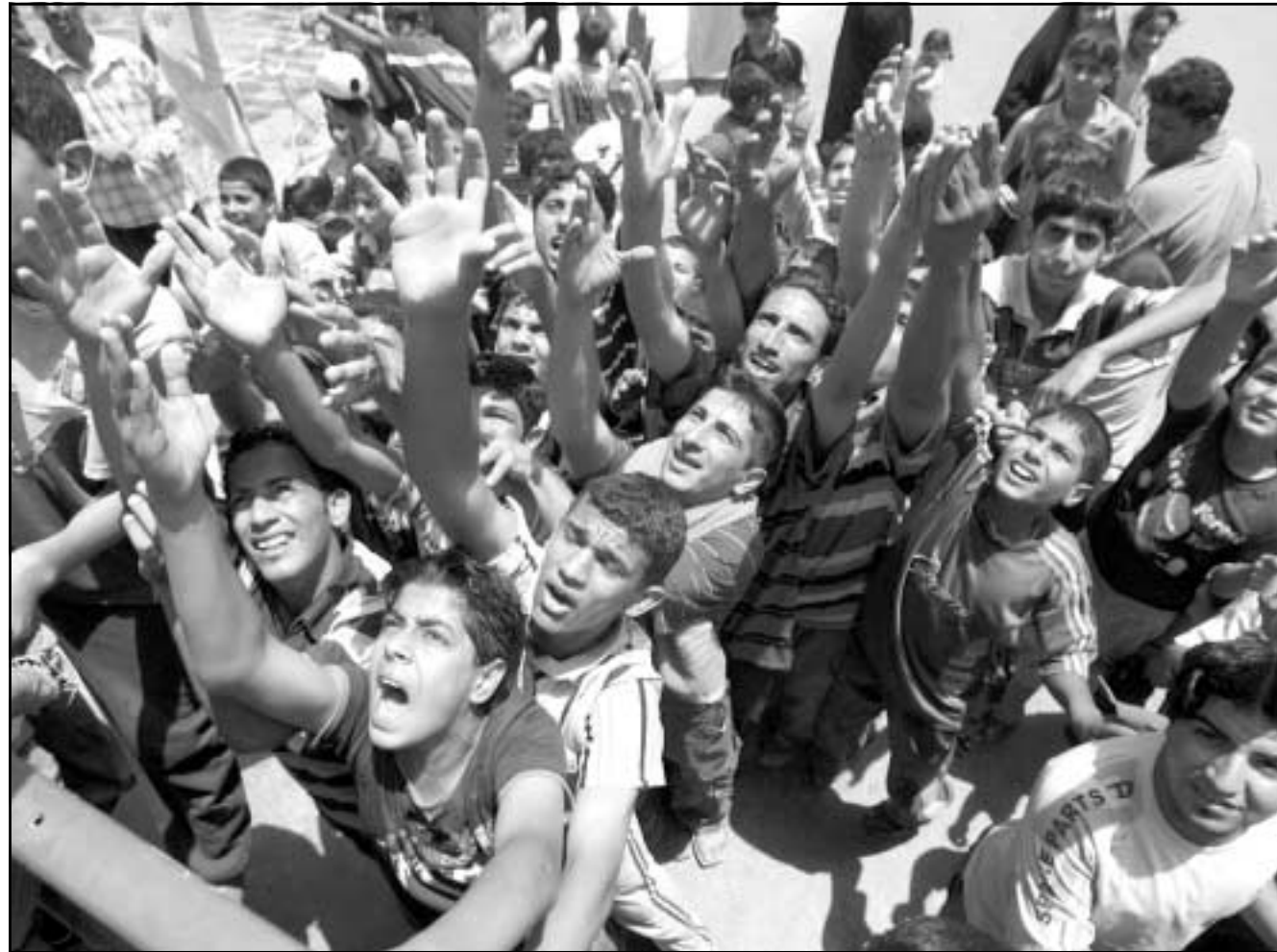
عراقيون يتلقون مساعدات غذائية من الجيش العراقي في مدينة الصدر الجمعة

ولكن بوش اكد ان القادة والجنرالات سيتم تزويدهم بكل الجنود والصادر المالية لتحقيق الانتصار في العراق. وحدث بوش هذا الانتصار بحرمان القاعدة من ملجأ آمن في العراق وعندما يشعر العراقيون بالامان، ولكن