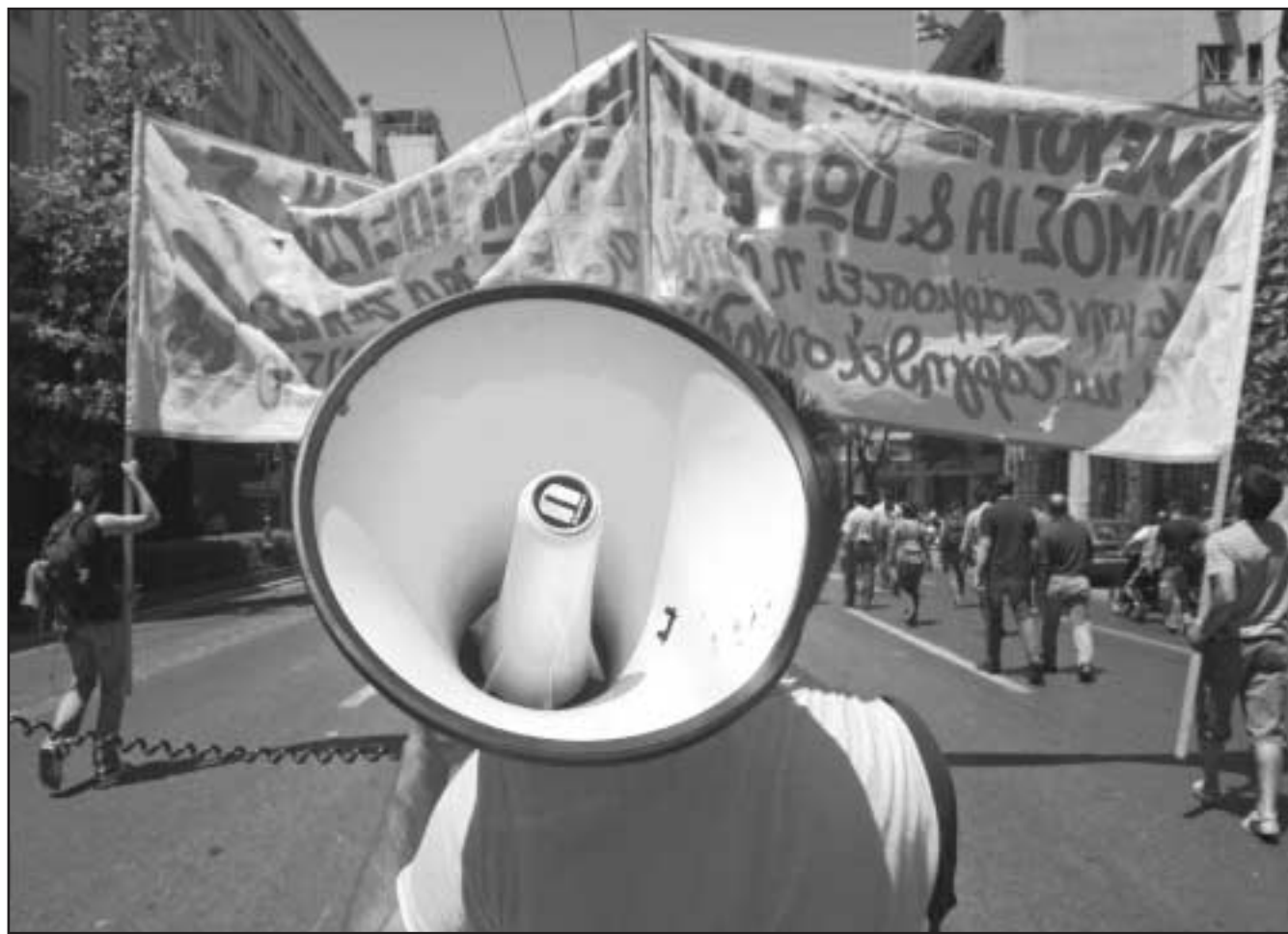
طلاب يونانيون خلال احتجاجات في العاصمة أثينا الجمعة