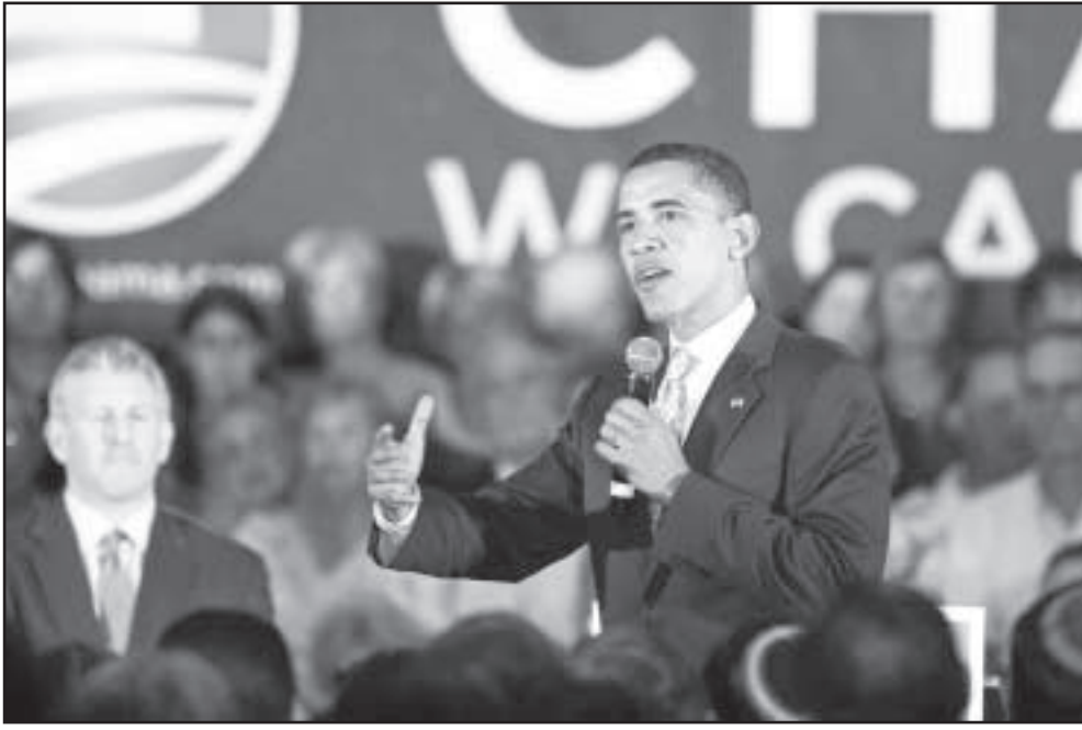
باراك أوباما يتحدث لانصاره في احد حملاته الانتخابية الجمعة

■ نيويورك-يو بي آي: تذكر تقرير الجمعة انه في حين تصير السيناتور الديمقراطي عن ولاية نيويورك هيلاري كلينتون ومستشاروها على الفوز بتسمية الحزب الديمقراطي في الانتخابات الرئاسية، إلا ان اصداقها ال كلينتون يقولون ان الرئيس السابق بيل كلينتون هو المرشح الثاني، وانه يعتقد ان خيار باراك أوباما على البطاقة الانتخابية الديمقراطية في المرتبة الثانية، ونكرت صحيفة «نيويورك تايمز» الجمعة ان التقارير حول توجهات الرئيس الأمريكي السابق ظهرت بعد الالتهاب التي اشارت إلى ان مخيم السيناتور عن ولاية ايلينوي بدأ مسيرة البحث عن شريك له على البطاقة الانتخابية الديمقراطية.