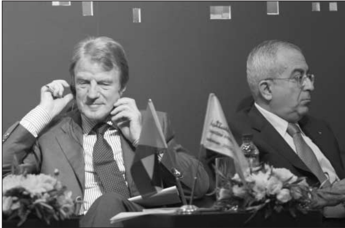
رئيس الوزراء الفلسطيني سلام فياض ووزير خارجية فرنسا برنارد كوشنر خلال مؤتمر صحافي في بيت لحم الجمعة

■ بيت لحم (الضفة الغربية) رويترز: أبلغ سلام فياض رئيس الوزراء الفلسطيني مؤتمرا صحافيا الجمعة أن المشاركين في مؤتمر استضافته بيت لحم هذا الاسبوع تعهدوا بـ 1.4 مليار دولار في مشاريع فلسطينية. وقال فياض انه يتوقع أن يوفر الاستثمار في المشاريع التي يقام الجانب الاكبر منها في الضفة الغربية المحتلة ويغطي قطاعات متنوعة من العقارات الى التكنولوجيا ما يصل الى 35 ألف فرصة عمل. واستضاف فياض والرئيس الفلسطيني محمود عباس المؤتمر في محاولة لجذب ما يصل الى ملياري دولار من أجل تمويل أكثر من 100 مشروع في الضفة الغربية وقطاع غزة الذي تديره حركة المقاومة الإسلامية (حماس) على أمل تعزيز الاقتصاد الفلسطيني في وقت يجريان محادثات سلام بوساطة أمريكية مع إسرائيل. ويتضمن المبلغ الاجمالي 550 مليون دولار من مستثمرين عرب كبار لاقامة مدينة سكنية جديدة ومجمع تجاري في الضفة الغربية. وحضر المؤتمر في بيت لحم التي تقع الى الجنوب مباشرة من القدس مئات المستثمرين المحتملين من القطاع الخاص. وكان ماثون دوليون اجتمعوا في باريس في كانون الاول (ديسمبر) للتعهد بتقديم 7.7 مليار دولار من المساعدات الحكومية بغية تعزيز موقف عباس ومفاوضات مع إسرائيل بشأن اقامة دولة فلسطينية. وقال فياض ان رسالة المؤتمر هي العزم على تحسين الاوضاع من أجل غدا أفضل بدون نقاط تفتيش أو مستوطنات أو جدران مشيرا الى القيود التي تفرضها إسرائيل على الضفة الغربية. وشدد مسؤولون من الضفة الغربية والحكومة الفلسطينية بما في ذلك فياض نفسه على أن الاستثمار في الاراضي الفلسطينية أمر ضروري الا أن الاقتصاد لن يزدهر ما لم تخفف إسرائيل القيود