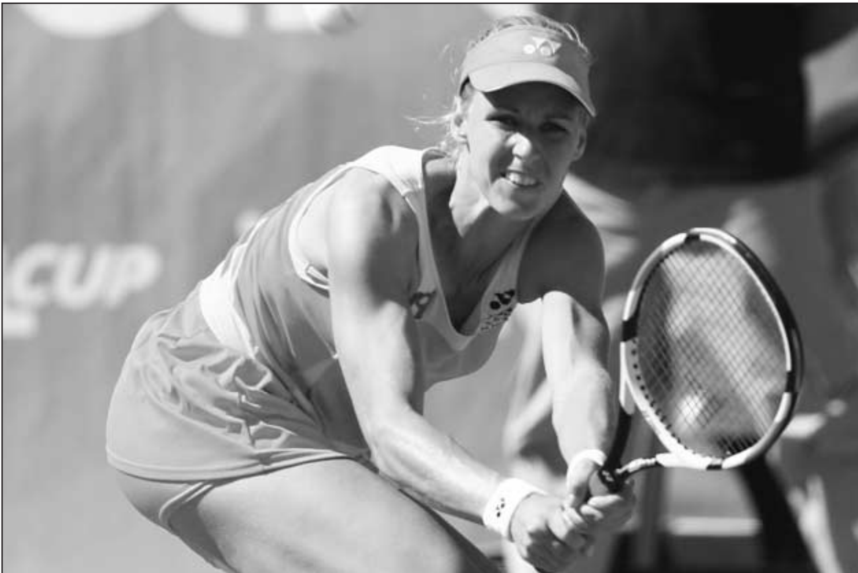
الروسية ايلينا ديمنتيفا

■ اسطنبول - ا ف ب: بلغت الروسية ايلينا ديمنتيفا المصنفة اولى وحاملة اللقب المباراة النهائية لدورة اسطنبول التركية الدولية في كرة المضرب البالغ مجموع جوائزها 200 الف دولار، بفوزها على الازبكستانية اكفول امانزادوفا السادسة 2-6 و6-4 في الدور نصف النهائي للجمعة. وتتبقى ديمنتيفا في النهائي مع البولندية انيبسكا رادفنسكا الثانية التي تغلبت على البلغارية تسفيتانا بيرونكوفا الثامنة 7-6 (1-7) و3-6 و6-1. وانسحب الفرنسي سباستيان جروجان الجمعة من بطولة فرنسا المفتوحة للتنس ثاني البطولات الاربعة الكبرى للموسم الحالي بسبب اصابة في الكتف، وقال اللاعب الفرنسي في مؤتمر صحفي «اعاني من اصابة في الكتف منذ ثلاثة اشهر». واضاف جروجان «الطبيب لم يمنحني الضوء الاخضر لتنفيذ ضربات الانسال بشكل طبيعي، افضل التركيز على موسم الملاعب الخضراء». وكان جروجان وصل لقبل نهائي البطولة في 2001، وسيشارك لاعب جديد بدلا من جروجان في البطولة التي تستمر اسبوعين. وسيتم في وقت لاحق من الجمعة سحب قرمة البطولة التي تنطلق الاحد المقبل في ملاعب رولان جاروس بالعاصمة الفرنسية.