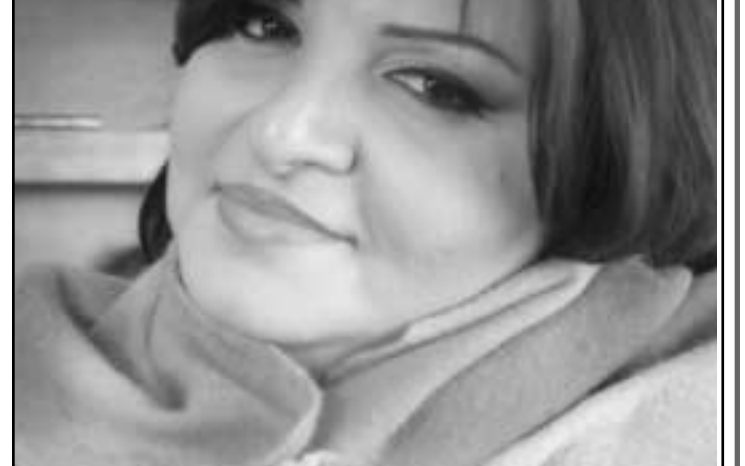
جاهدة وهبة (القدس العربي)

وفي اتصال معها قالت نيكول ان قلبها قوي وليست خائفة وهي تنتظر هدوء الأحوال للباشرة بالتصوير. وأخبرت أنها تأخرت عن الالتحاق بفريق عمل مسلسل «عدا النهار» في مصر، كما أنها لن ترافق زملاءها في فيلم «بيبي دول» الى مهرجان كان والذي كان مقرراً في 14 الجاري، لكنها تأمل أن تكون في مصر في 28 الجاري لدى افتتاح الفيلم في الصالات المصرية.