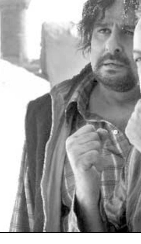
لقطة من فيلم «بيلة البيبي دول»

■ لقد اقترن ذوبان الجسد، واختفاءه الأولي بتنامي الحنين الدفين للخطيئة / قتل بالحصيد / في العداة / سوف أذبح كليتمسترا... / لكي يعود لي أبي / وها أنذا ألم وجه شقيقي / ليبرك الجمال المختبئ الأثوي / في طلة الصبيان».