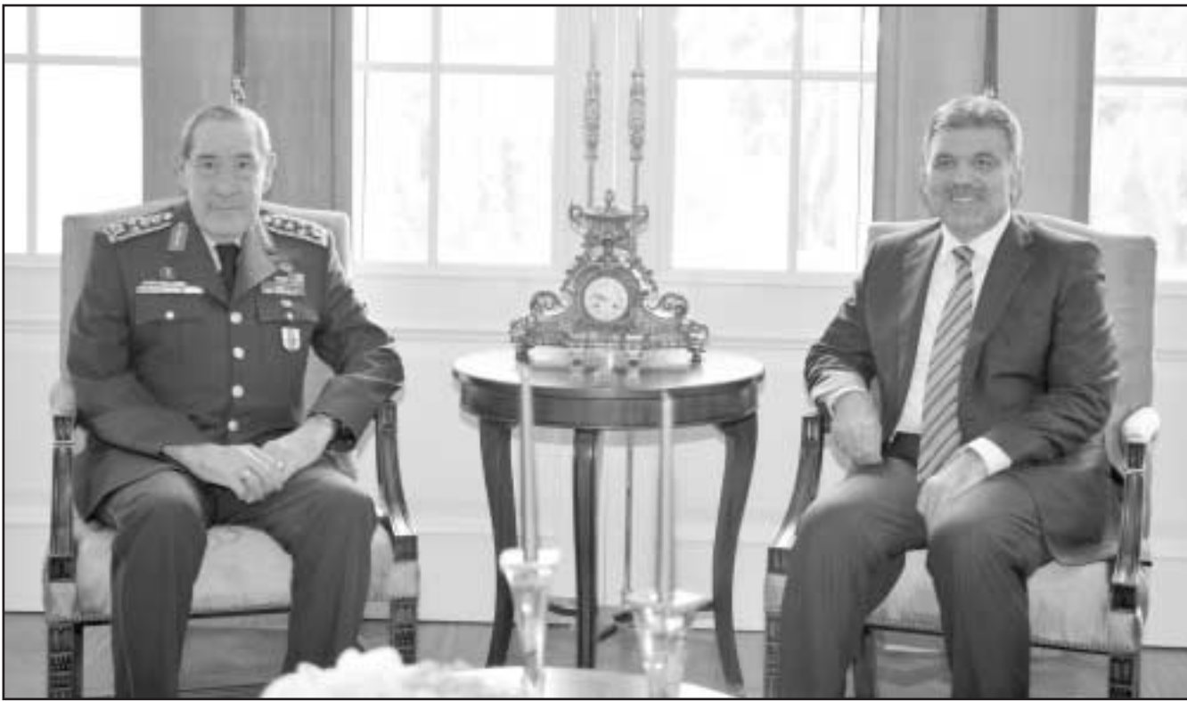
الرئيس التركي عبد الله غول (يمين) والقائد العام للقوات المسلحة التركية يسار بويوكنت

المسائل تكشف أنه جرى التلاعب بالقانون». ورأى أن ما من معارضة في تركيا تساهم في تقوية الديمقراطية، مضيفاً «إنه من واجبنا (حزب العدالة والتنمية) أنه نمثل كل الحراك في تركيا». لكن فيرات طلعن إلى أن الأزمة بين الحكومة والنظام القضائي في البلاد لن تصل إلى «بوامة لا تنتهي». وكانت المحكمة العليا في تركيا، بدعم من مجلس الدولة وغيره من الهيئات القضائية انتقدت بقوة محاولات الحكومة التي يسيطر عليها الحزب الإسلامي الحاكم لجعل النظام القضائي تحت سلطة إدارية مستقلة. وفي سياق آخر، أعلن «مجلس الجامعات التركية» دعمه امس للمحكمة العليا. واعتبر رئيس المجلس مصطفى أكاديمين في مؤتمر صحفي أنه جرى انتقاد النظام القضائي بطريقة غير عادلة من قبل الحكومة ومن الخارج. ورأى أكاديمين أن قوى خارجية، داخل البلاد وخارجها، حاولت التدخل في النظام القضائي التركي.