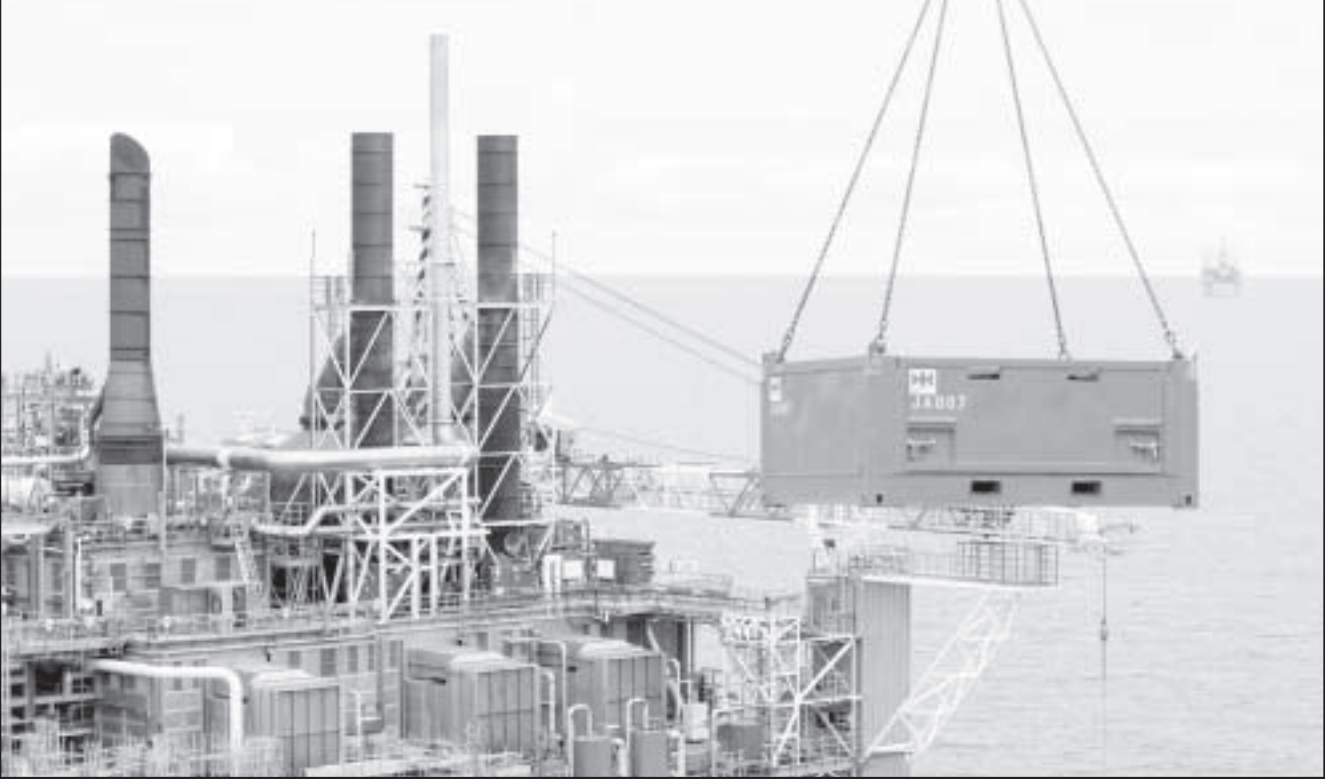
أحد حقول النفط في بحر الشمال أمام سواحل النرويج