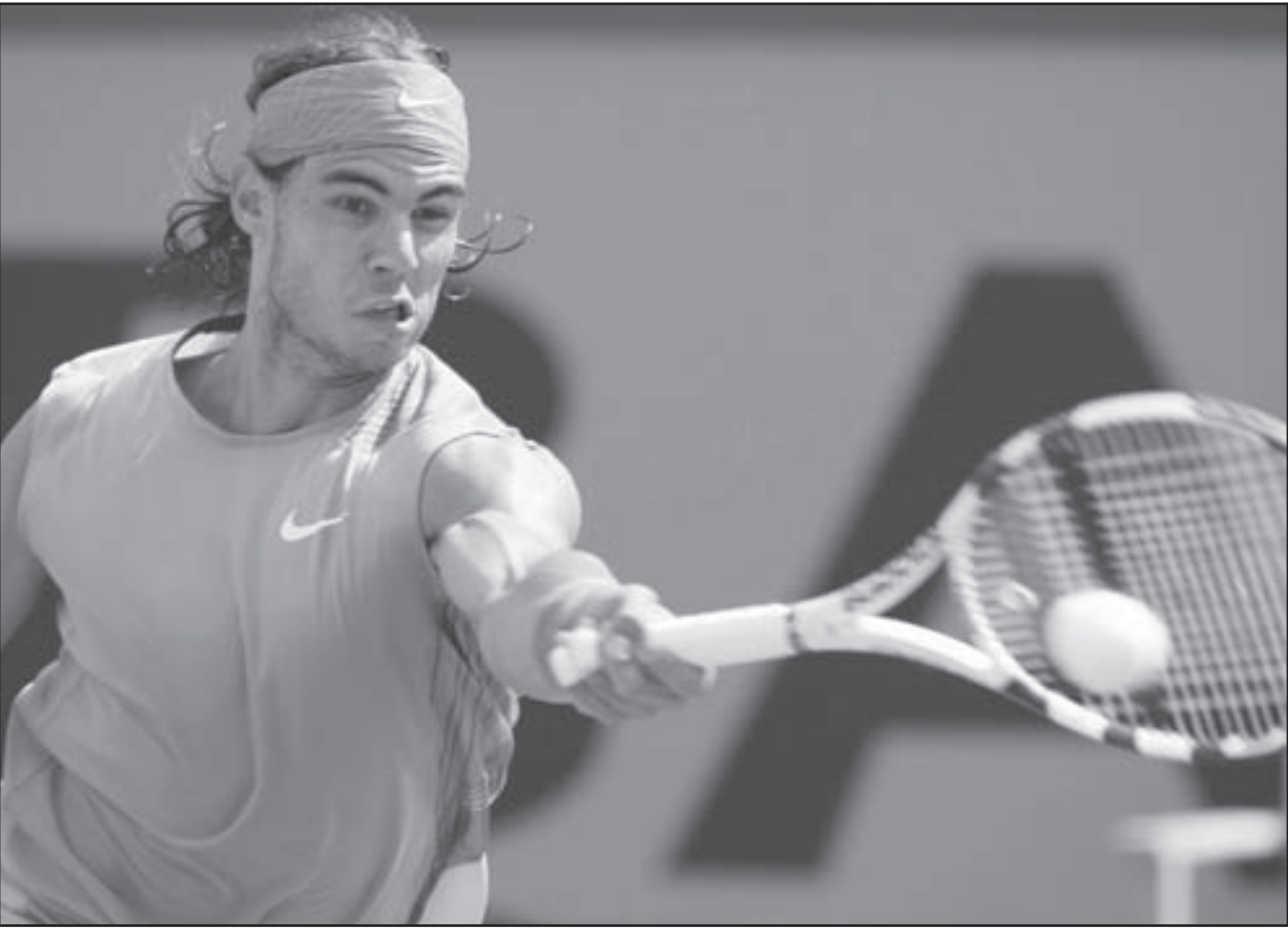
الاسباني رفائيل نادال

ومن بين اللاعبين الذين تاجلت مبارياتهم أيضا بسبب الامطار الاسباني ديفيد فيرير المصنف الخامس وخوان كارلوس فيريرو الفائز بالبطولة عام 2003، وسيلفتي فيرير مع البلجيكي ستيف دارسيس غير المصنف فيما يواجه فيرير منافسه