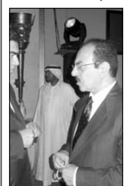
الصحاف مفاجأة مهرجان الختام

وقد التقطت «القدس العربي» للصحاف هذه الصورة اثناء وقوفه مع جورج قرداسي في حديث ودي، أعاد لي أذهان البعض الحديث عن العلو والطراير وأناب الاستعمار وسوى ذلك من التعابير الشعبية التي ميزت حديثه الاعلامي اثناء الحرب الأمريكية على العراق!