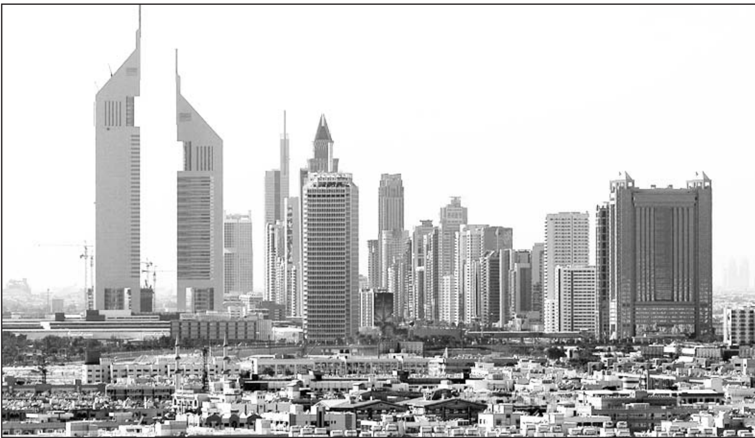
منظر عام لمدينة دبي

«نق تحت وطأة ضغط تنمية الاراضي ... لكننا