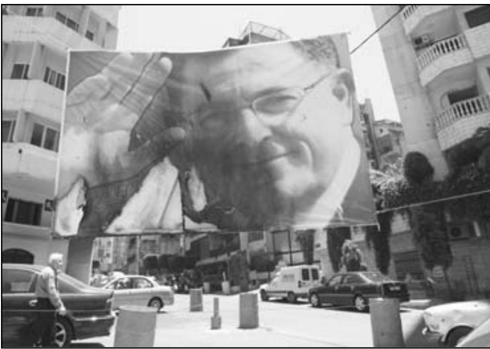
ملصق ضخم للسنيورة معلق على بنايات وسط بيروت

درس في الجامعات اللبنانية الامريكية التي تخرج منها حاملاً شهادة دراسات عليا في ادارة الاعمال والاقتصاد، فؤاد النوردة، سني هو محرق جدا من عائلة الحريري والتي باسمها اول كلمة بعد اغتيال رفيق الحريري.