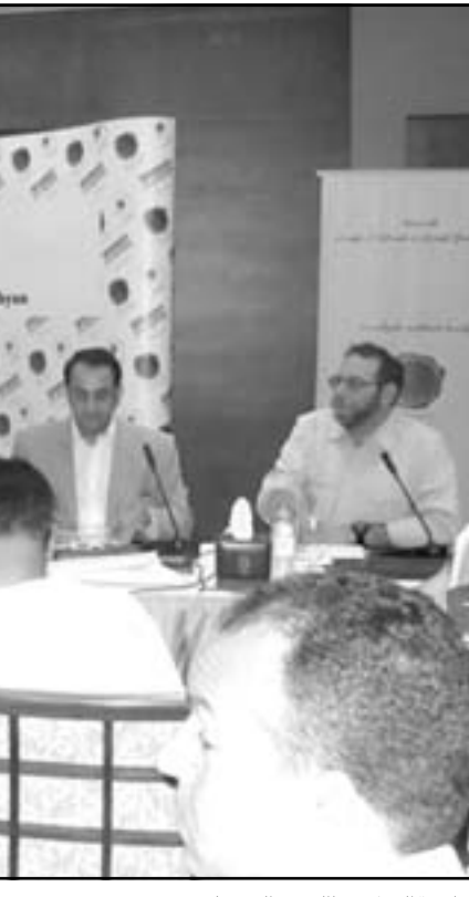
لجنة التحكيم

وبعيداً عن هذه الاشكالات الجوهرية والمؤلمة، بدت