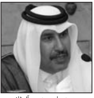
حمد بن جاسم بن جبر آل ثاني

■ الكويت - اف ب: دانت محكمة في الكويت صحيفة «الوطن» الكويتية بتهمة التشهير برئيس الوزراء القطري الشيخ حمد بن جاسم بن جبر آل ثاني عبر الادعاء بأنه ابرم صفقات مع إسرائيل، على ما افاد محامي الشيخ حمد الاربعة. وقال المحامي حسين الغريب لوكالة «فرانس برس»، «لقد رفعتنا ثلاث دعاوى ضد الصحيفة بسبب سلسلة من المقالات التي اتهمت الشيخ حمد زورا بإبرام صفقات دبلوماسية وتجارية مع إسرائيل». وتكتب هذه المقالات التي هزنت ايضا بالشيخ حمد، الكاتب الصحافي فؤاد الهاشم العام الماضي. وحسب الغريب، حكمت المحكمة على الصحيفة بدفع تعويض قدره الفا دينار (7550 دولارا) عن الدعوىين الاولى والثانية، وبدفع تعويض مؤقت قدره 5001 دينار (18870 دولارا) عن الدعوى الثالثة. ويمكن استئناف الاحكام التي