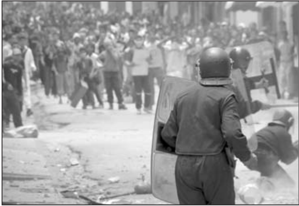
جانب من واجهات تواصلت امس بين شبان من هيران، ثاني المدن الجزائرية، وقوى الامن. وبدأت الاجهات اثر مباراة كرة وتوسعت رقعتها فأسفرت عن اصابة نحو 70 رجلا من واعتقال اكثر من 150 متظاهرا

القضايا الخلافية يجب ان تحل بالطرق الدبلوماسية، ولكنها لا يمكن مساومتها في مبادئها او التكتل لها، في اشارة الى مساندة حركات التحرش في العالم التي ما افككت الحكومة الجزائرية كترها. واضاف: ولذلك يتعين احترام ارادة الشعوب بما فيها الشعب الصحراوي الذي ينتظر لصفاء، وفي سياق العلاقات المغربية قال مدلسي ان الجزائر «ليس في نيتها الخروج من الاتحاد المغربي بدليل علاقاتها مع جيرانها في مجال الطاقة ووجود خطوط الضغط العالمي لنقل الكهراء الى تونس وانابيب النفط والغاز العابرة لاراضي الدولتين الجارتين تونس والغرب، بالإضافة الى حرية الأشخاص ومئات الالف الجزائريين الذين يتوجهون سنويا الى مدين البدين». وقال ان هذه العلاقات يجب ان تراعي توازن المصالح، وأشار في ذلك الى رغبة الجزائر في رؤية مغاربة وتونسيين يتوافدون على الجزائر بمثل تدفق الجزائريين على الدولتين الجارتين.