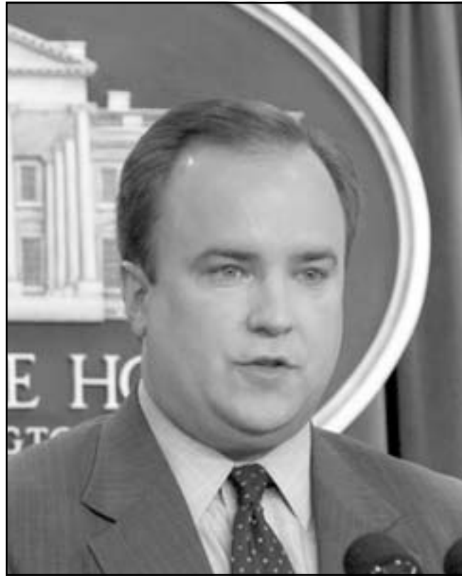
سكوت ماكليان

يقود السياسة الامريكية من خلف الاضواء بدون ان يترك اي اثر، وعلى الرغم من اتهام الكاتب هنا الادارة ورتبسيها الا انه يتوقف دون توجيه اتهام واضح لبوش وادارته بانهم كذبوا على الرأي العام خاصة الرئيس. وقال انه لم يكن وغيره من الموظفين الصغار في البيت الابيض يطبقون منهجاً مبرمجاً للخداع من أجل اقتناع الرأي العام الامريكي وتقديم مبرر لغزو العراق عام 2002، ولكنه يلجأ الى وجود سياسة خداع وذلك في فصل يحمل عنوان «تسويق الحرب» واتهم فيه ادارة بوش بانها قامت وبشكل مستمر بخداع الحقيقة وان «بوش قام بادارة الأزمة بطريقة ضمن فيها ان استخدام القوة سيكون الخيار الوحيد». ويقول ان ادارة بوش قامت بادارة حملة بدأت في صيف عام 2002 لتسويق الحرب، ووصف الحملة ومزاجها بالاستمرار وانها كانت عن التلاعب بالمعلومات والرأي العام من أجل ان تصب في صالح الرئيس. والكتاب يقدم تحولا في مواقف ماكليان الذي كان مدافعا صلبا عن الحرب ودواعيها حين يقول ان ما يعرفه هو ان الحرب نشأت عندما تستدعي لها الضرورة ولكن «حرب العراق لم تكن ضرورية»، وكان ماكليان قد استقال من منصبه في البيت الابيض في نيسان (ابريل) 2006 بعد ان عمل ثلاثة أعوام كسكرتير اعلامي لبوش، وكان رحيله جزءا من اعادة ترتيب البيت الابيض الذي قام به مدير الراسم في البيت الابيض جوشوا بولتون، مما ادى ايضا لرحيل كارول روف، وفي رسالة بالبريد الالكتروني كتب ماكليان للصحيفة قائلا انه مثل كل الامريكانيين فانه