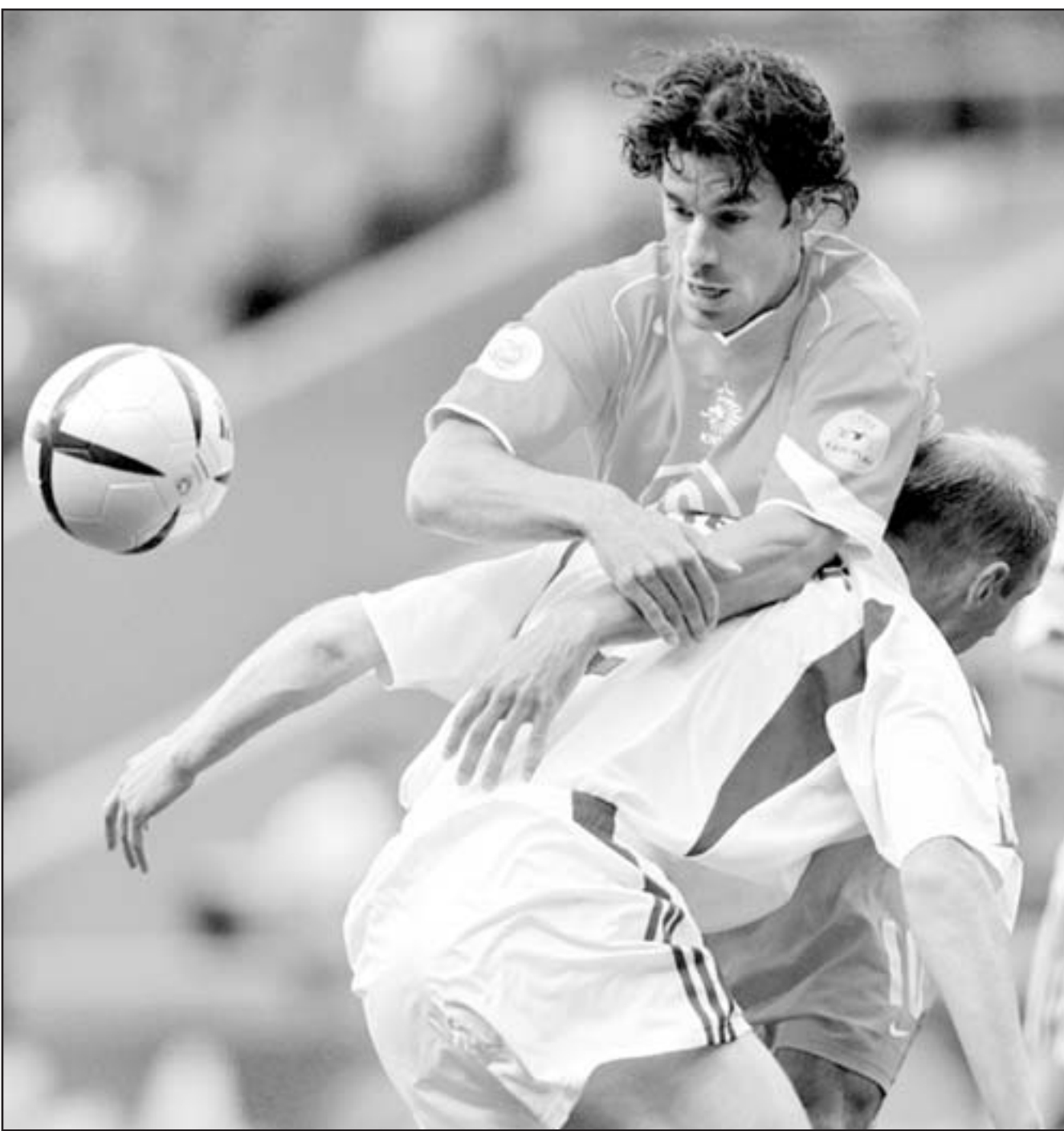
صورة ارضيفية لمنتخب هولندا

غياب النتائج الجيدة لم يضع فان باستن في مرمى السهام ميوكا، ان ساعدته سمعته الذهبية في تحطى المطبات، لكن صبر الجمهور نفذ فاقطل على المدرب الشباب القابا قاسية مثل «دمية يوهان كرويف» (مستشاره)، والمدرب «القاسي والعنيد»، وخصوصا بعد تجامله رود فان نيستلروي اهداف مانتشستر