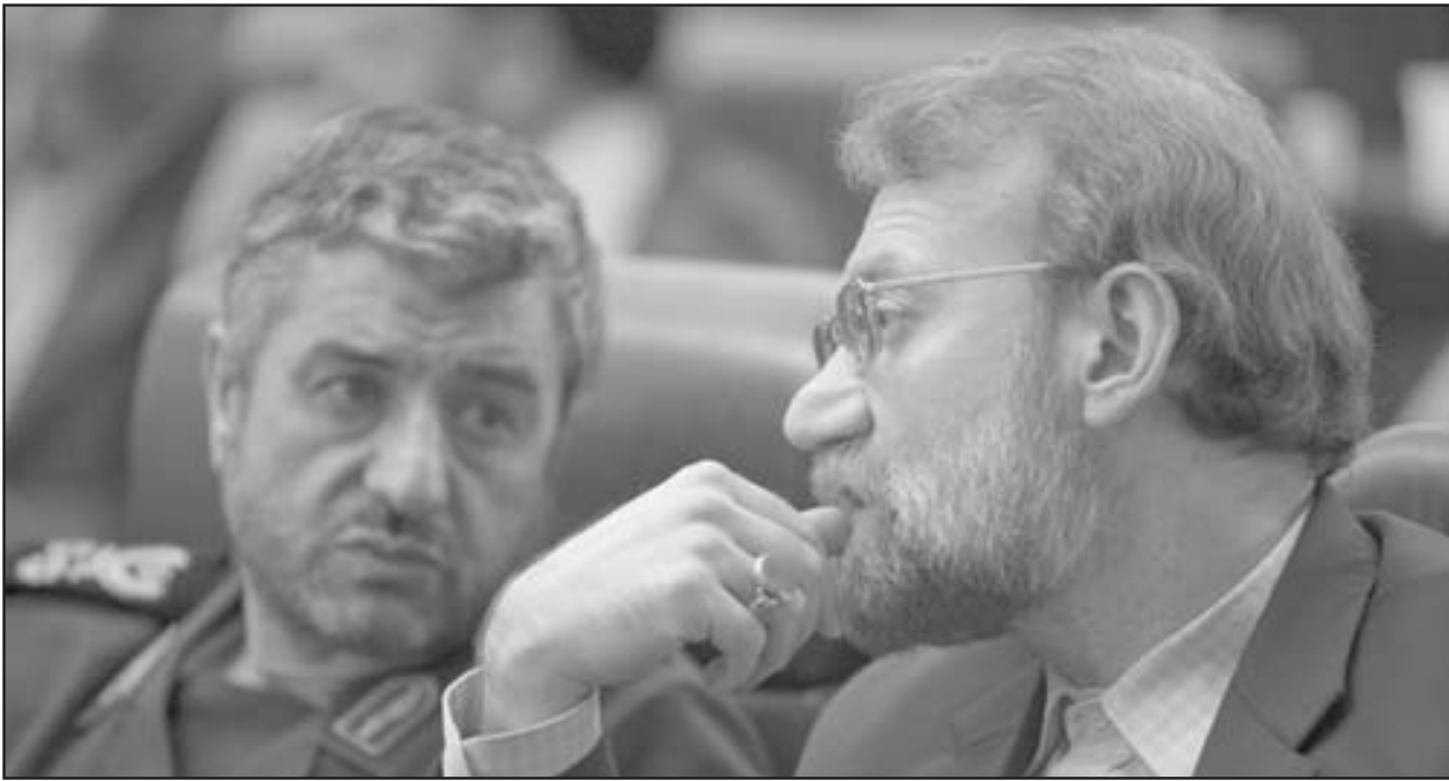
رئيس البرلمان الإيراني علي لاريجاني يستمع الى قائد الحرس الثوري

واشنطن وحلفاؤها قلقون ازاء رفض طهران التجاوب مع وكالة الطاقة الذرية