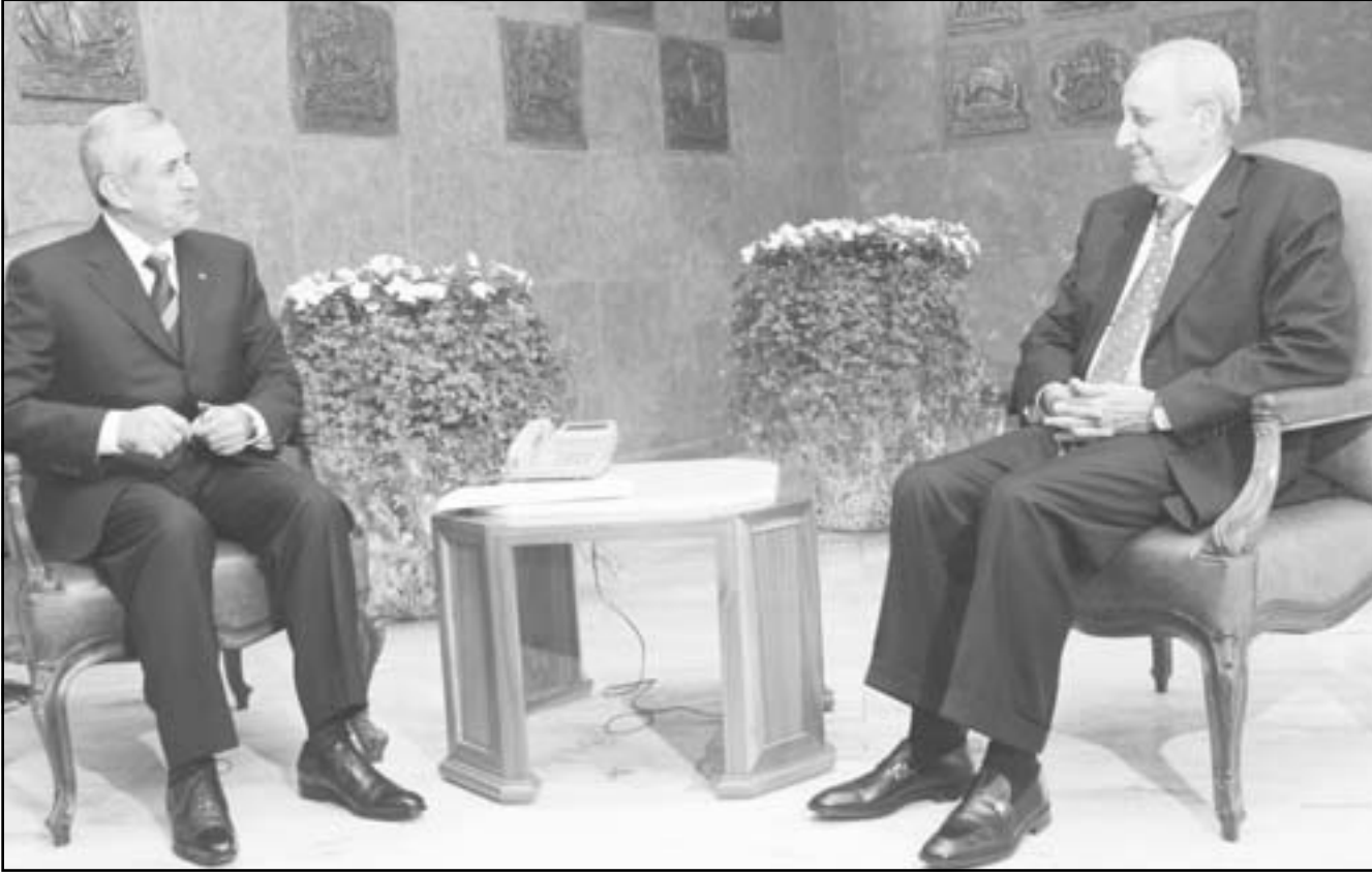
الرئيس اللبناني ميشال سليمان مستقبلاً رئيس البرلمان نبيه بري

المؤسسات في إطار توافقها وينهض البلد، ولكن الحقيقة أصبنا بخيبة أمل، كنا مع اللبنانيين نأمل باندفاع التوافق لانقاذ لبنان ولم نسم احداً، وتواتر الاستشارات بعد الظهر ولغت فيها افتراق النائب بهيج طبارة عن «كتلة المستقلين» وتسمية النائب الحريري وليس السنيورة، وفي ختام الاستشارات استدعي الرئيس بري لاطلاعه على نتيجة الاستشارات كما استدعي الرئيس السنيورة حيث تم تكليفه رسمياً.