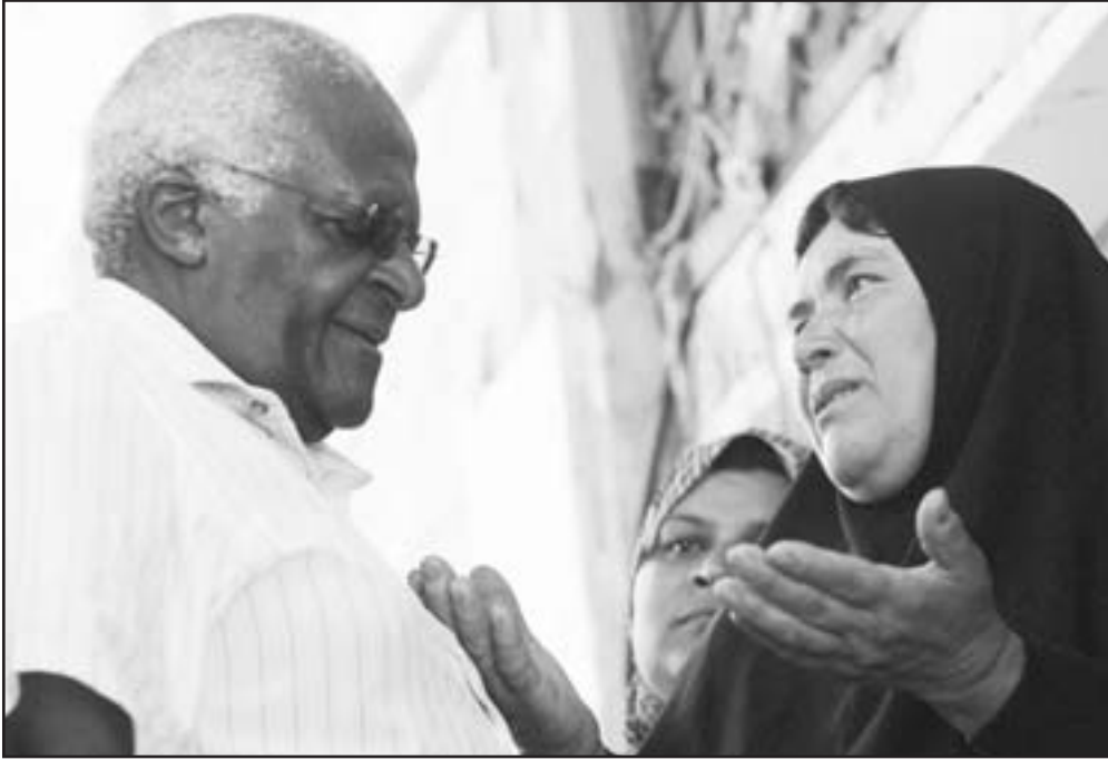
الأسقف الجنوب أفريقي ديزموند توتو يتحدث لنساء فلسطينيات في غزة

يذكر أن الأسقف توتو التقى الثلاثاء في نادر لنظام الرادار التابع للمدفعية، وذكر أن المدفعية الاسرائيلية نتجته الخلل قصفت بين سكتين بينما كان المطوب قصف منطقة كان ناشطون فلسطينيون يطلون منها الصواريخ الى اسرائيل.