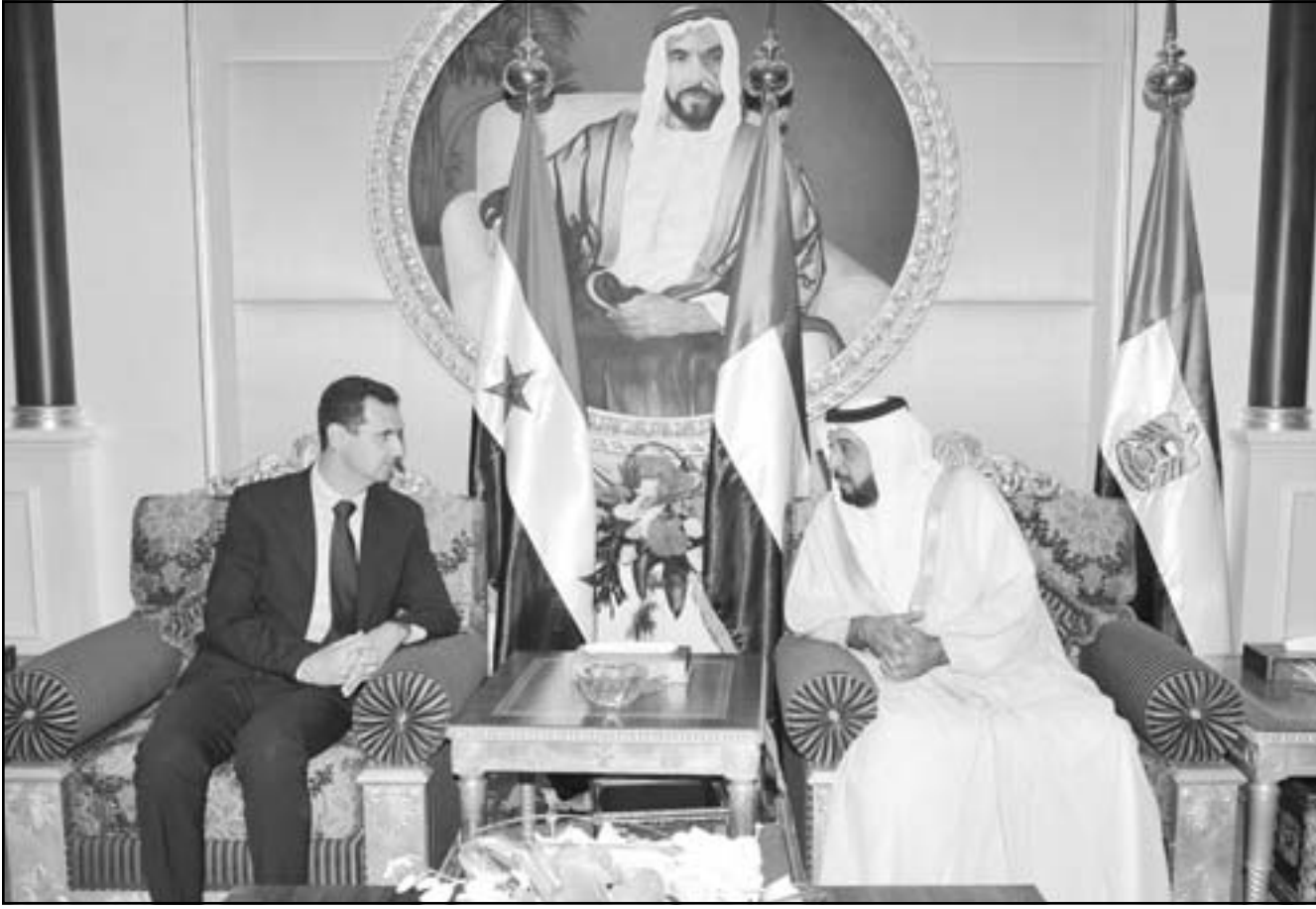
الشيخ خليفة بن زايد آل نهيان رئيس دولة الامارات العربية لدى استقباله الرئيس السوري بشار الاسد في ابو ظبي امس