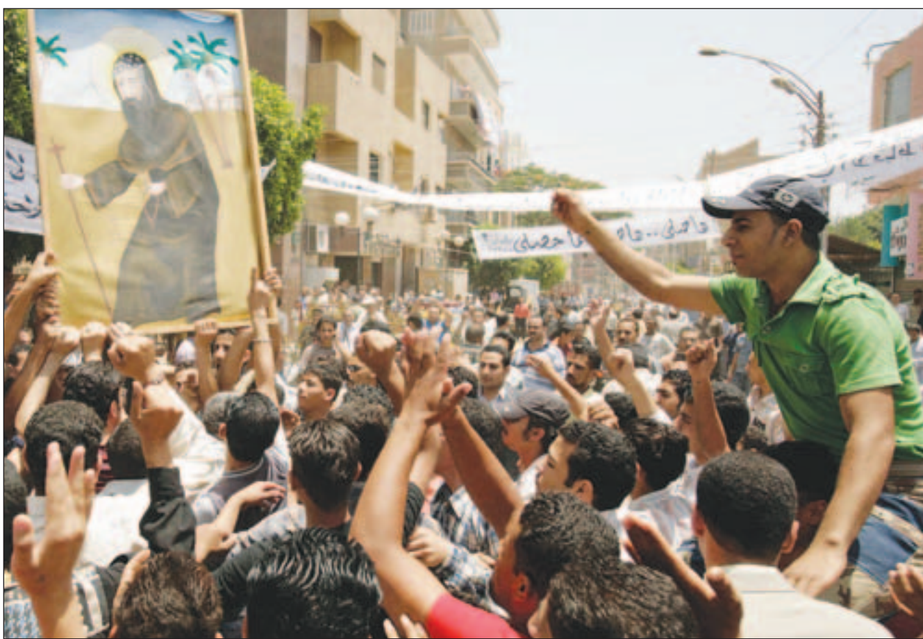
اقباط يتظاهرون في محافظة المنيا بصعيد مصر امس احتجاجاً على مهاجمة دير في بلدة ملوي