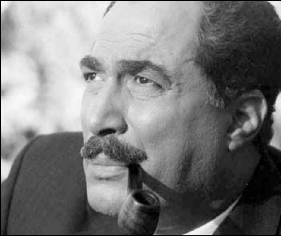
أحمد زكي في دور «السادات»