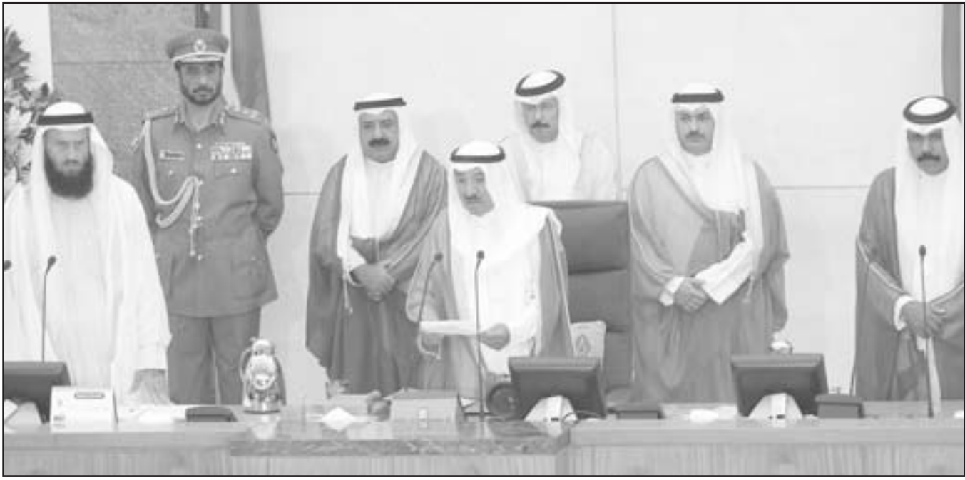
امير الكويت الشيخ صباح الاحمد الصباح اثناء الغاء خطابه في افتتاح الجلسة الاولى لمجلس الامة الكويتي امس

■ الكويت - اف ب - رويترز: افتتح امير الكويت الشيخ صباح الاحمد الصباح الاحد الدورة البرلمانية الجديدة موجها تحذيرا صارما الى النواب لجهة ضرورة التعاون مع الحكومة، كما عاد مجلس الامة لانتخاب جاسم الخرافي رئيسا للمرة الرابعة على التوالي، كما دافع الشيخ صباح بقوة عن اختياره لرئيس الحكومة وتشكيلها الذي انتقده نواب وحدة وشدد على صلاحياته الحصرية ضمن هاتين المسألتين، وذكر الشيخ صباح في كلمة امام مجلس الامة الذي عقد اولي جلساته الاحد، بأنه اتخذ قرار حل مجلس الامة السابق «ازاء مظاهر الانحراف والتجاوزات التي باتت تهدد مصلحة الوطن (...)» وبعد ان استندت كافة السبل والتضحيات والدعوات التي لم تجد نفعا،