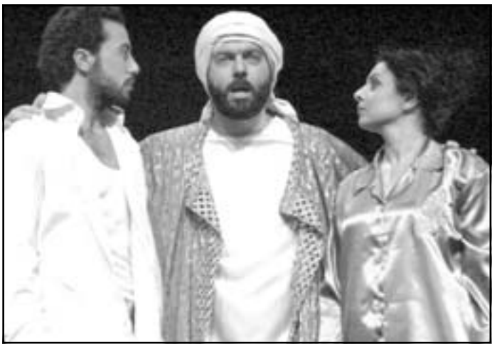
مشهد من المسرحية