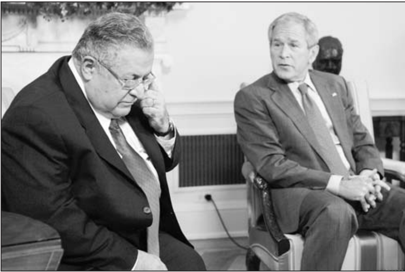
الرئيس الأمريكي جورج بوش مستقبلاً جلال الطالباني في البيت الابيض امس