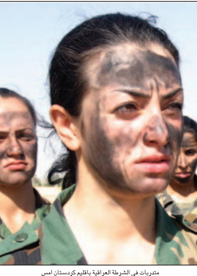
متدربات في الشرطة العراقية بالقمم كردستان امس (تفاصيل ص 3)

لندن - من مارك تريفلان: قال رئيس الامن العام بوزارة الداخلية البحرينية امس الأربعاء ان التوتر الدولي بشأن ايران يمثل تهديدا خطيرا لامن البحرين وان المملكة الخليجية تريد من حلفائها ان يعطوها انذارا مبكرا بأي تصعيد مزعج. وكان رئيس الامن العام اللواء عبد اللطيف بن راشد الزياني يشير فيما يبدو الى احتمال تحرك عسكري امريكي ضد البرنامج النووي الايراني. وقال في كلمة في لندن امام المعهد الملكي للدراسات الدفاعية والامنية «مستوى التوتر حاليا فيما يتعلق بايران يمثل تهديدا كبيرا آخر». وأضاف «اذا تطور الوضع سيكون هناك اثر كبير في البحرين حيث تتبع نسيه من ساكنات الشيعة القيادة الدينية لايران بصورة عمياء وبدون سؤال فيما يبدو». وقال الزياني «في هذا الصدد.. وبصورة اعم.. من المهم القول ان تصرفات حلفائنا تؤثر غالبا على مستويات التهديد في البحرين. وكشركاء فاننا نساءل.. بدافع الامن وليس خوف.. ان نستشار او اعلاق نعطى انذارا مبكرا بتصعيد كبير او تحركات اخرى» قد يكون لها اثر داخلي على المملكة. وتعكس تصريحاته توتر عرب الخليج بشأن ايران والقلق ازاء خطر ان يأخذهم عمل عسكري على غرة وهو خيار ترفض واشنطن استيعاده.. ويزيد عدد سكان البحرين على مليون نسمة اقليتهم من الشيعة مثل ايران لكن السنة يحكمون المملكة المتحالفة مع الولايات المتحدة. وقال الزياني لـ «رويترز» في وقت لاحق ان الطريق السليم لمعالجة الأزمة الإيرانية يكون من خلال حل دبلوماسي، وأضاف «في كل الحالات حين يتخذ تحرك نود