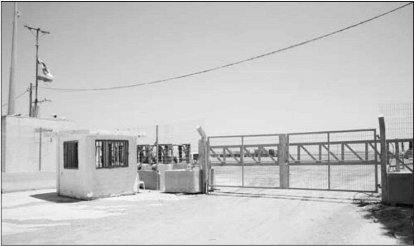
معلم صوفا بعد اغلاقه من قبل القوات الاسرائيلية امس