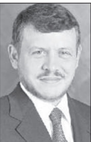
الملك عبدالله الثاني