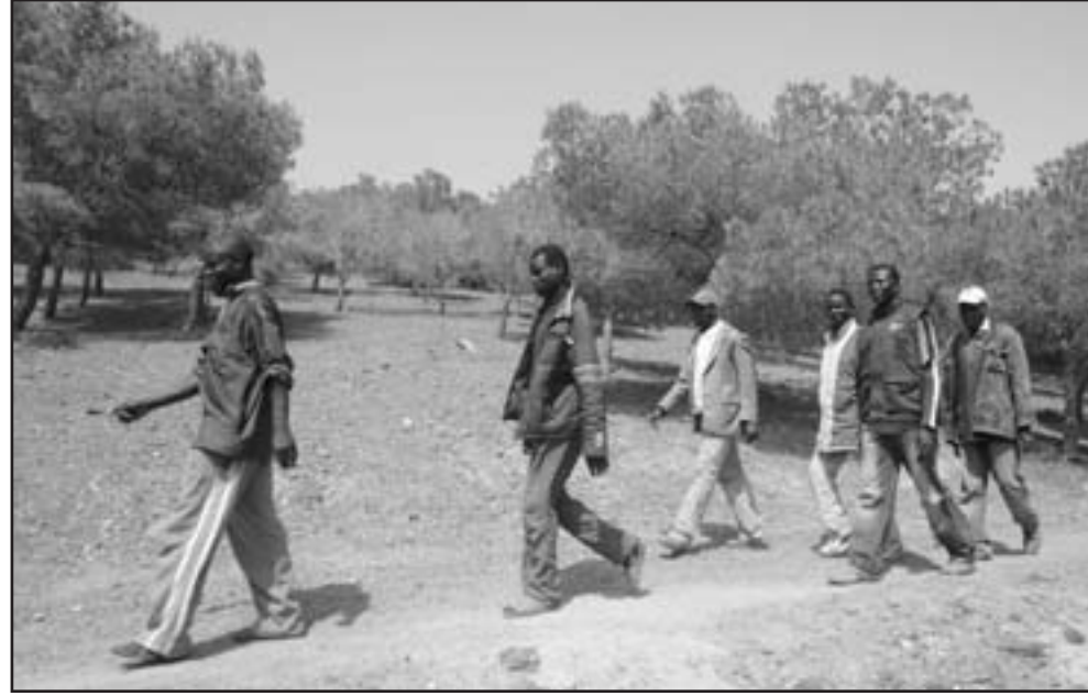
صورة التقطت الثلاثاء مهاجرين أفارقة بغابات الناظور في شمال المغرب ينتظرون فرصة للابحار الى اسبانيا

اعترف وزير العمل والهجرة في الحكومة الإسبانية سيسلتنو كورباتشو بوجود نسبة كبيرة من المهاجرين غير القانونيين في اسبانيا، وطالب بإجراءات للحد من ذلك، في حين ما زالت تتفاعل سياسيا عملية اقتحام المهاجرين الأفارقة لسياج المحيط بمدينة مليية المحتلة شمال المغرب. وبالموازاة مع الأزمة الاقتصادية التي تعيشها اسبانيا، ارتفع الحديث بقوة هذه الأيام عن الهجرة غير القانونية التي يعثرها البعض بمطابق كيش فداء، في هذا الصدد، أبرز وزير العمل والهجرة الإسباني كورباتشو أمس الثلاثاء خلال تقديم المعليات الجديدة حول ارتفاع البطالة أنه يوجد في اسبانيا الكثير من المهاجرين غير القانونيين وكذلك المهاجرين الذين يعانون من البطالة بحكم أن الأزمة ضربت قطاعات استوعبت في الماضي اليد العاملة المهاجرة مثل قطاع البناء، وتابع أنه يجب اتخاذ إجراءات قانونية وسريعة للعمل من تراجع المهاجرين غير القانونيين من الحد من الموضوع، وكانت جمعيات مغربية قد حذرت من قبول حكومة الرباط لسياسة الهجرة التي ستقدم عليها اسبانيا. ويحضر مجددا ملف الهجرة السرية في العلاقات الثنائية بين مدريد والرباط،