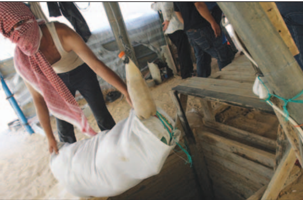
شاب فلسطيني يسحب بضائع مهروبة عبر نفق في مدينة رفح على الحدود المصرية