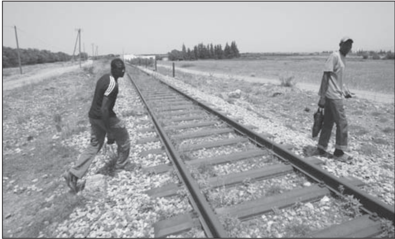
مهاجران افريقيان ظهر يوم الخميس في المنطقة الحدودية بين الجزائر والمغرب بحثا عن فرصة او سبيل للتسلسل الى اسبانيا

وتذكر اويحيى ان مساندة حزبه للرئيس بوتفليقة ليست وليدة اليوم ولكن تعود الى سنة 1999، وقال «لقد ساندناه حتى في الظروف السياسية العصيبة التي مرت