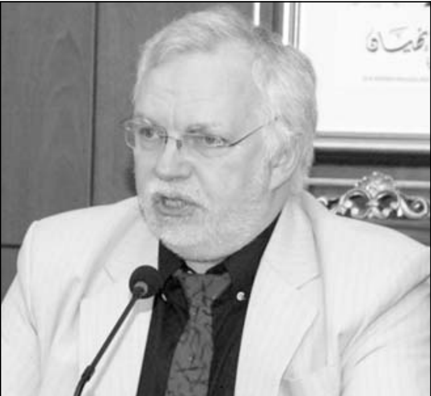
سيرجي شيريوف (القدس العربي)

عدد كبير من المسنين وقليل من العمال الذين يدفعون الضرائب. وتطرق الخبير في الشؤون الديمغرافية إلى مستقبل ظاهرة الشيخوخة في العالم، مبيئاً أن ثلث سكان أقاليم العالم سيصل إلى ما فوق سن 60 خلال هذا القرن، إذ أن هناك احتمال 98% بأن تصل اليابان ومنطقة الأقيانوس إلى حاجز الشيخوخة، أما النسخة لأوروبا الغربية فيصل هذا الاحتمال إلى 82% بينما يصل إلى 69% في إقليم الصين، وقيل ان أمريكا الشمالية ستعبر حاجز الشيخوخة في ستينيات هذا القرن، وفقاً لاحتمال يصل إلى 50%، وذلك راجع إلى ان سكانها لا يزالون في الوقت الحالي أكثر شباباً بالإضافة إلى تأثير الهجرة المحتملة في المستقبل.