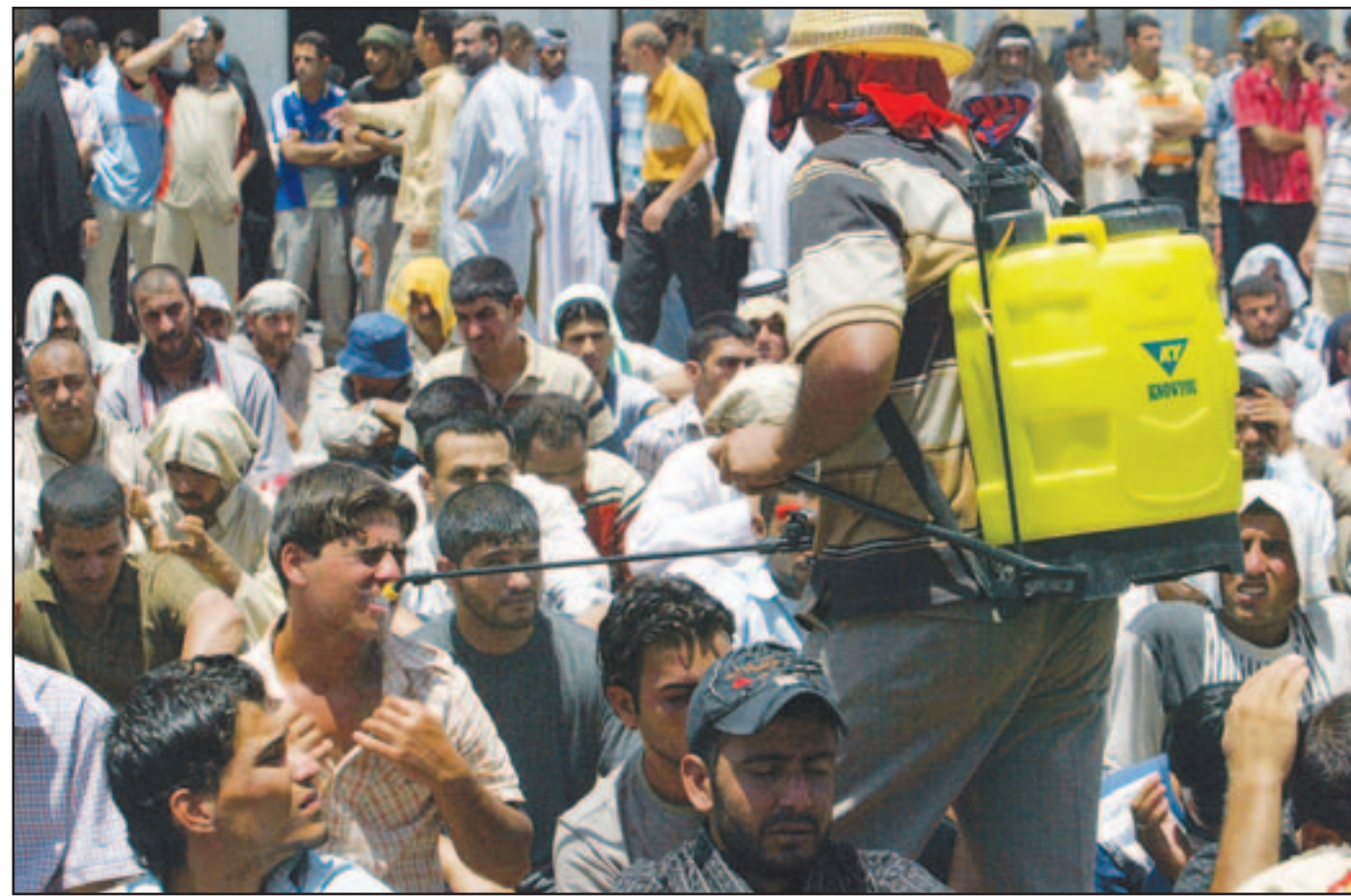
يرش المياه على المصلين في مسجد الامام الكاظمي ببغداد التي تعرف صيفا شديد الحرارة

وكان ماكين قال إن هناك شيئا أسوأ من قصف إيران، وهو امتلاك إيران سلاح نووي. وينتقد ماكين في حلقاته الخاصة تردد الرئيس بوش في عبور الحدود من