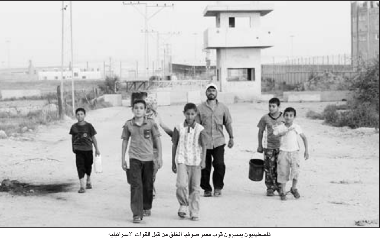
فلسطينيون يسيرون قرب معبر صوفيا المغلق من قبل القوات الاسرائيلية

عليه أن يحترم هذا التوافق ومن يشذ عن هذا الإجماع عليه أن يتحمل تبعات ذلك، لأن هذا يصب في خدمة الاحتلال وليس من مصلحة الشعب غزة. واعتبر إطلاق الصواريخ من قبل كتائب الأقصى «كان خروجاً على النظر في اتفاق التهدة». ونقلت الإذاعة الإسرائيلية عن رامون قوله «إذا لم ترد إسرائيل بصرامة وبإغلاق المعابر الحدودية مع قطاع غزة بصورة تامة وبعمليات عسكرية محدودة فسنترى القذائف والصواريخ مرة أخرى تسقط على المنطقة المحيطة بقطاع غزة». واتهم رامون الفلسطينيين بأنهم يحاولون «إملاء وضع جديد على إسرائيل يتم فيه إطلاق قذائف في أعقاب أي عملية تقوم بها إسرائيل في الضفة». وطالبت وزيرة الخارجية تسيبي ليفني بقيام بالادها بـ«الرد فوراً بالوسائل العسكرية على الهجمات الصاروخية الفلسطينية». في سياق متصل نقلت الإذاعة الإسرائيلية عن مصادر سياسية كبيرة قولها أن «زوال التهدة في الوقت الحاضر بأن أصبح مسألة وقت». وفي غزة أيدت حركة حماس اهتمامها باستمرار التهدة، وقالت أنها تحقّق المصالح الفلسطينية». وطالب سعيد صيام وزير الداخلية في الحكومة المقالة التي تديرها حماس «العقلاء» في الفصائل الفلسطينية تحمل مسؤولياتهم فيما يخص التهدة في إسرائيل، في أعقاب تساقط القذائف الصاروخية على جنوب إسرائيل. وقال عقب عقده اجتماع مع لجان المقاومة «من كان جزءاً من التهدة