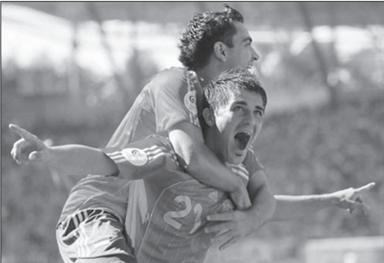
لقطة من مباراة منتخب اسبانيا