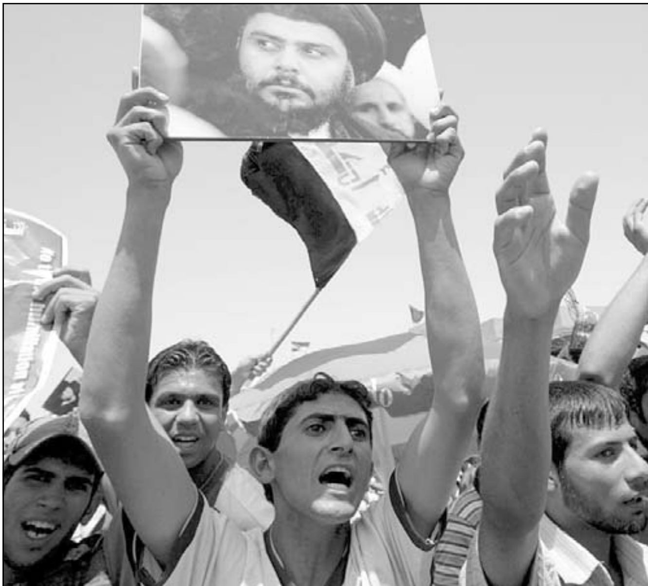
عراقيون يرفعون صور مقتدى الصدر بعد صلاة الجمعة في مدينة الصدر ببغداد