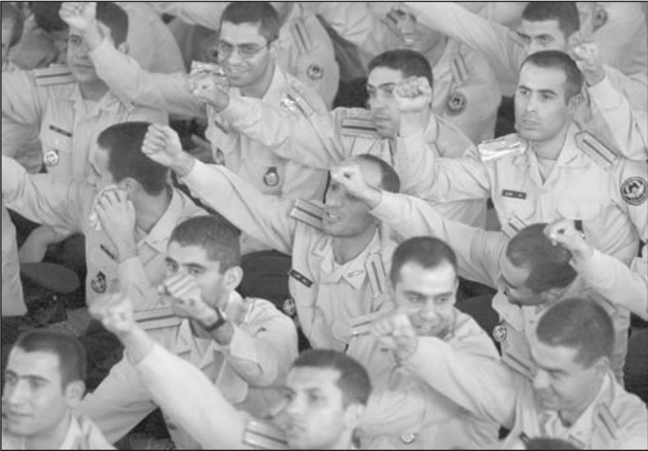
مجموعة من قوات الجو الإيرانية يتحققون ضد أمريكا وإسرائيل خلال صلاة الجمعة في طهران

■ طهران - يو بي أي: طالبت وزارة الخارجية الإيرانية الجمعة المجتمع الدولي القيام بإجراءات عملية للقضاء على الأسلحة الكيميائية في ترسانات الدول الكبرى، والتعويض على الشعب الإيراني الذي اعتبرته الضحية الأكبر لهذه الأسلحة خلال الحرب الإيرانية-العراقية. وأوردت وكالة أنباء «مهرو» الإيرانية شبه الرسمية أن وزارة الخارجية أصدرت بياناً بمناسبة اليوم الوطني لمكافحة الأسلحة الكيميائية والجرفومية دعت فيه الأوساط الدولية والمجتمع الدولي إلى بذل جهودها الحثيثة للقضاء على جميع الأسلحة الكيميائية ومحاكمة ومعاقبة مرتكبي الجرائم الكيميائية. وأعربت وزارة الخارجية الإيرانية في بيانها الجمعة عن مواساتها لعوائل الضحايا والجرحى الذين أصيبوا بالأسلحة الكيميائية خلال الحرب العراقية - الإيرانية بالأسلحة التي استمرت من العام 1980 وحتى العام 1981. وأسفت الوزارة «لأن ما يسمى بالعالم المتحضر لم يتمكن من معاقبة منفذي هذه الجرائم المعادية للبشرية»، وقالت «إن أمريكا وعددا من الدول الأوروبية تحاول الهروب إلى الأمام وجعل المتهم في مكان الضحية، حيث لم يسمحوا بإدانة صدام على جرائمه وبدلا من ذلك بكل وقاحة وجها اتهامات لا أساس لها ضد إيران». واتهم البيان الولايات المتحدة وبعض الدول الأخرى التي لم يسما بإعطاء الضوء الأخضر للنظام العراقي