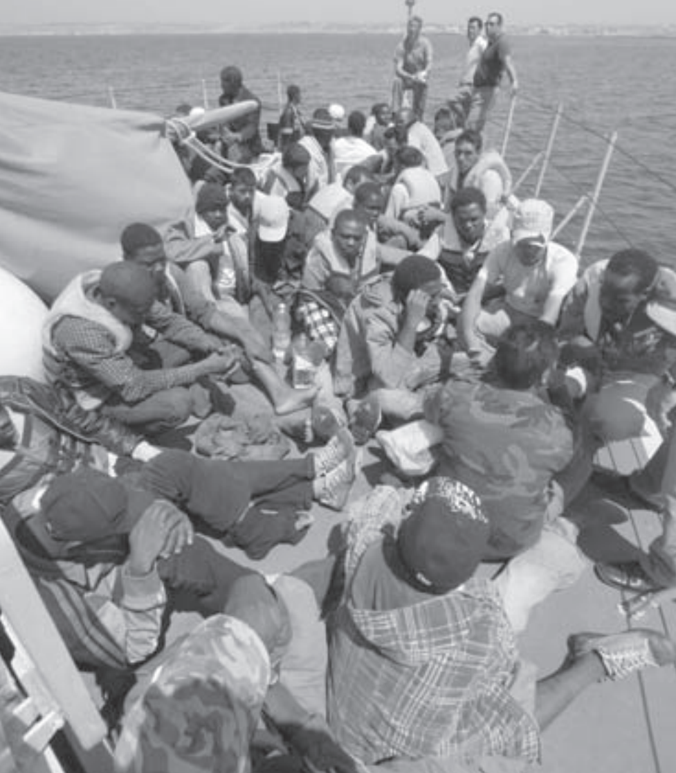
عشرات المهاجرين من دول مختلف وصلوا الخميس الى سواحل ايطاليا التي عجزت عن ايجاد حل نهائي لهذا التدفق المستمر

وسمحت الدولة للنشطاء مدافعين عن حقوق الإنسان بأن يؤسسوا منظمات تحمل أسماء مثل