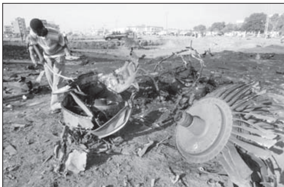
سوداني امام حطام الطائرة التي سقطت في الخرطوم امس

سقطت طائرة شحن جوي فور اقلاعها من مطار الخرطوم صباح امس الاثنين وهي متجهة الى مدينة جوبا بجنوب السودان. وقد هرعت سلطات الطيران المدني السوداني على الفور الى الطائرة التي سقطت على بعد اقل من مطار الخرطوم والطائرة من طراز (البيوشن) 76 وهي تتبع لشركة اباييل للطيران وقد قتل على الفور طاقم الطائرة المكون من اربعة افراد يحملون الجنسية الروسية . وقال الفريق يوسف ابراهيم مدير مطار الخرطوم انه بمجرد اقلاع الطائرة حدث خلل فني في الطائرة واصطدمت بعמוד للكهرباء وتحطمت واشتعلت فيها النيران. وأشار الى انه سيتم تشكيل لجنة لمرعة ما لبسات الحادث وكان قد خف الى موقع الحادث المهندس محمود حامد ابراهيم وزير الداخلية والفريق اول عبد الرحيم محمد حسين وزير الدفاع وعدد من كبار المسؤولين بالدولة. ويشار الى ان هذا الحادث هو الرابع خلال الشهرين الماضيين والثاني خلال اسبوع والثالث خلال الشهر الحالي.