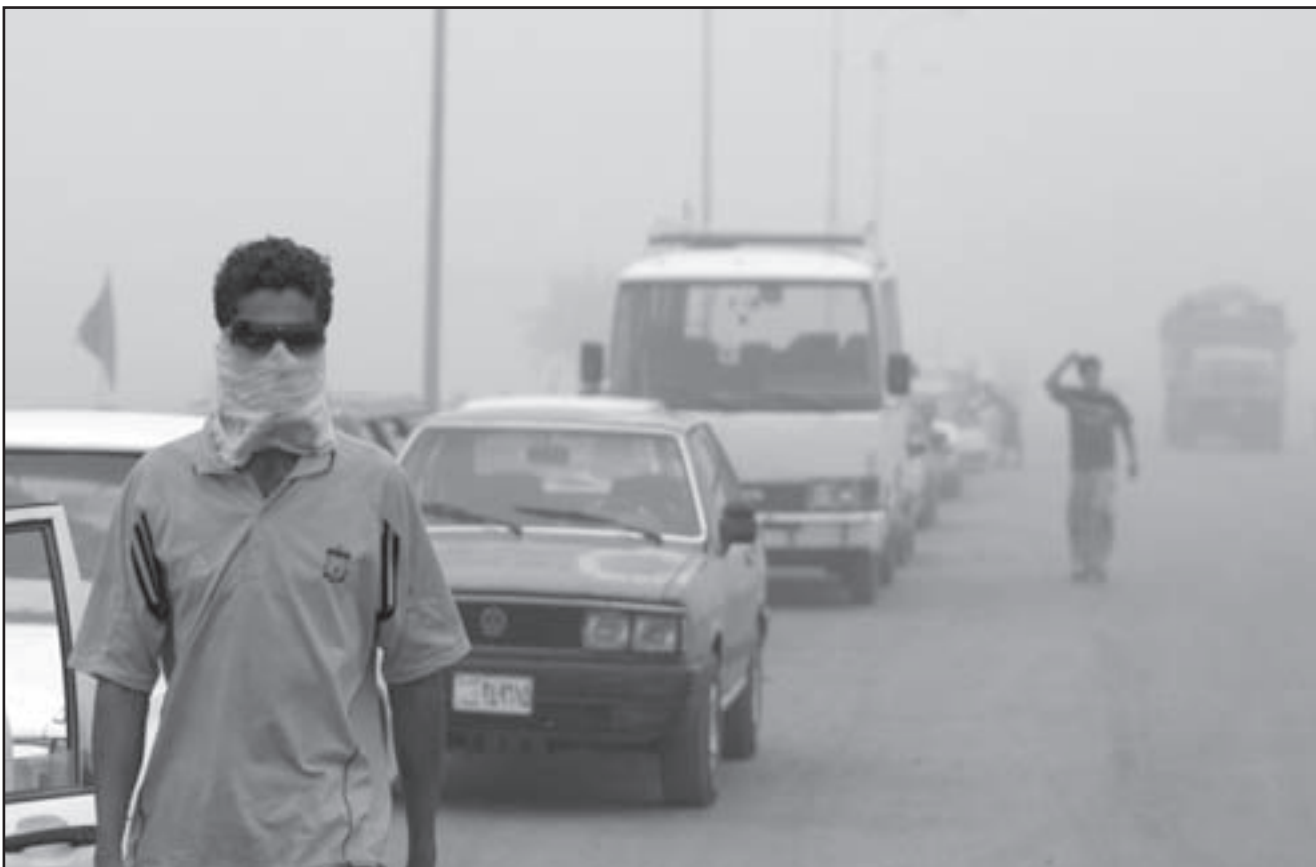
عراقي في وسط بغداد حيث هبت عاصفة رملية شديدة