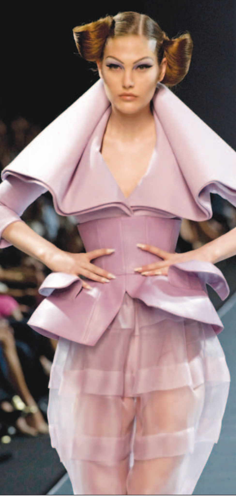
تصميم عرض امس ضمن مجموعة ميكرات المصمم البريطاني جون جاليانو موسمي الخريف والشتاء خلال عرض اقيم في باريس لصالح بيت الازياء الفرنسي «ديور»

■ لندن - بريطانيا - يو بي اي: ارتفع عدد الذين ألقعوا عن التدخين خلال الاشهر التسعة الأولى من فرض الحظر على هذه العادة داخل الاماكن المغلقة إلى 22 ٪ خلال العام الماضي. وقال خبراء صحيون لصحيفة «الاوزبرفر» البريطانية ان قرار حظر التدخين كانت له في الواقع نتائج ايجابية على المدخنين السلبيين وعلى المدمنين أنفسهم.