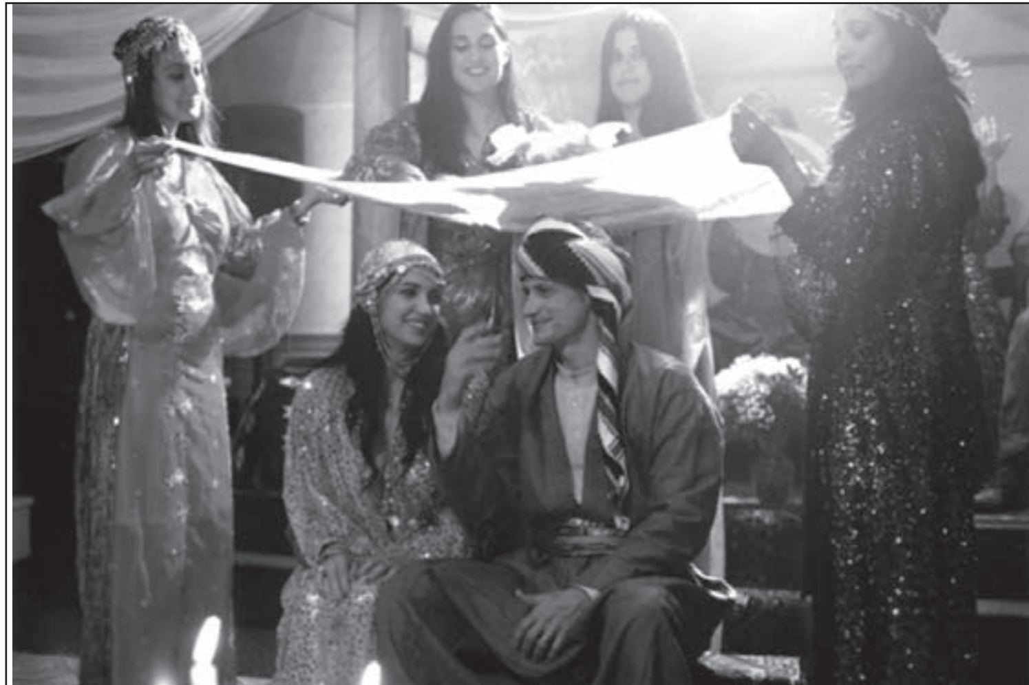
لقطة من الفيلم الإيراني «الدفتر»

وخلال الحفل الختامي للمهرجان الذي احتضنه مسرح