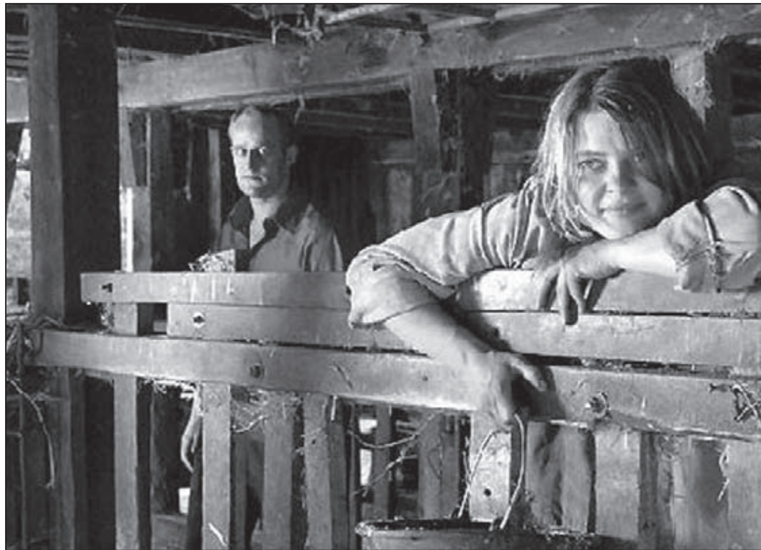
لقطة من الفيلم الأمريكي «داود وليلى»