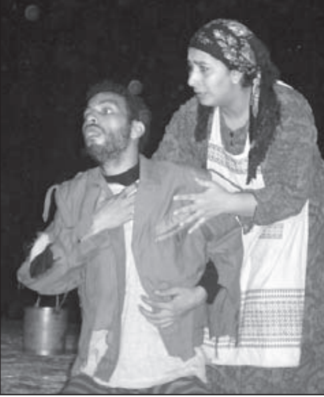
مشهد من «نيغاتيف»

أحد رواد السينما الغربية الذي اشتهر بأفلام معروفة بدأ بهشمس الربيع، وصولا إلى «سميرة في الضيعة»، وأيضا الإعلامية والممثلة المغربية بديعة ريان. كما سلم المهرجان جائزة للنجم المصري فاروق الفيشاوي، وقبل بضعة أيام، أقيم أيضا حفل تكريم للنجمة نادية الجندى، وتميزت سهرة إعلان النتائج بحضور عدد من نجوم الدراما المصرية من ضمنهم أشرف عبد الباقي وكذا ثلة من الفنانين المغاربة والإجانب.