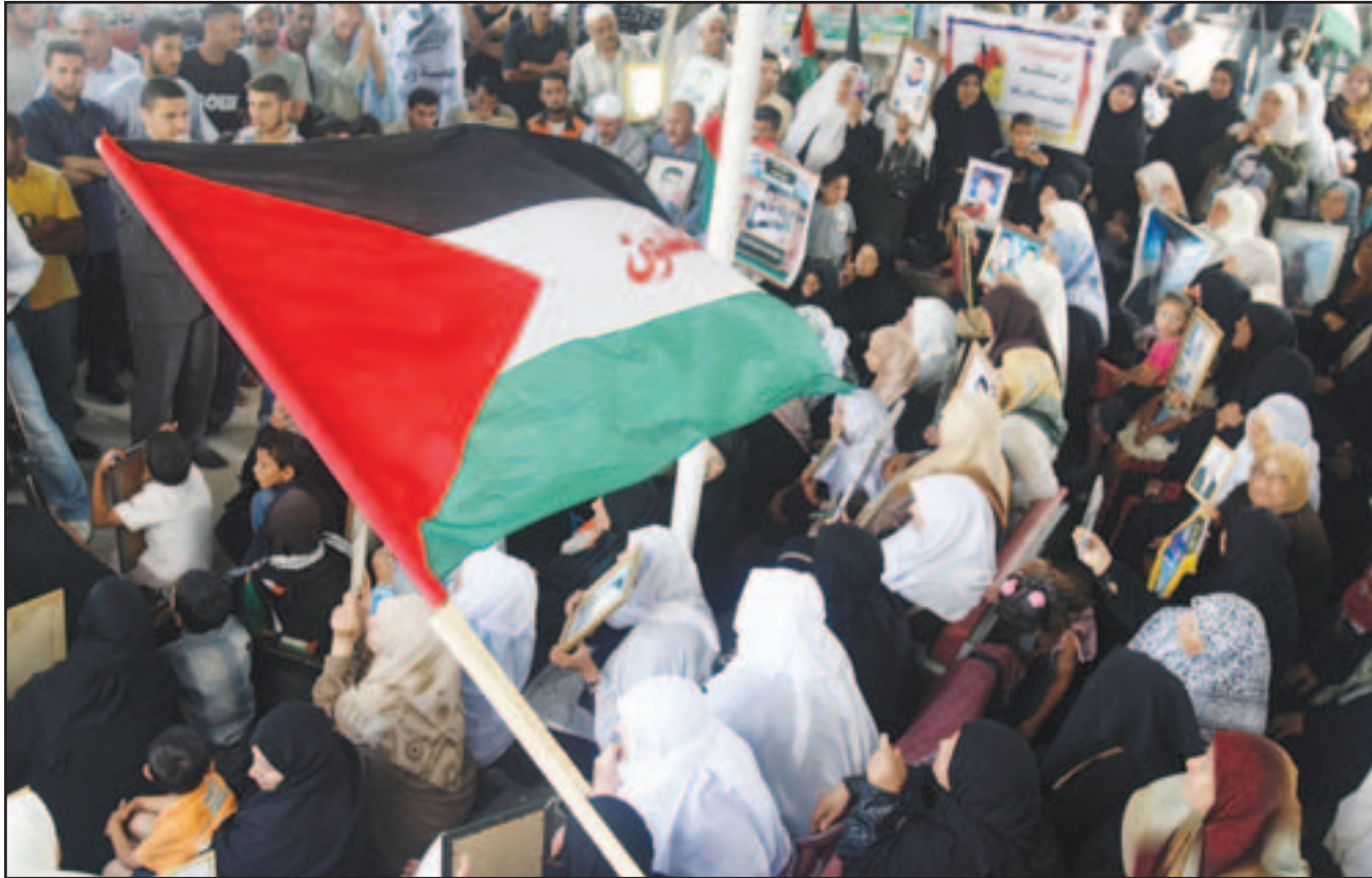
فلسطينيون يشاركون في احتجاجات امام مقر الصليب الاحمر في غزة للمطالبة باطلاق المعتقلين في السجون الاسرائيلية