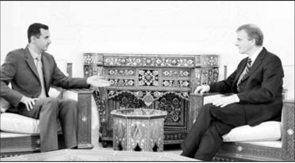
الرئيس السوري بشار الأسد لدى اجتماعه بوزير الخارجية النرويجي يوناس غارستور في دمشق أمس