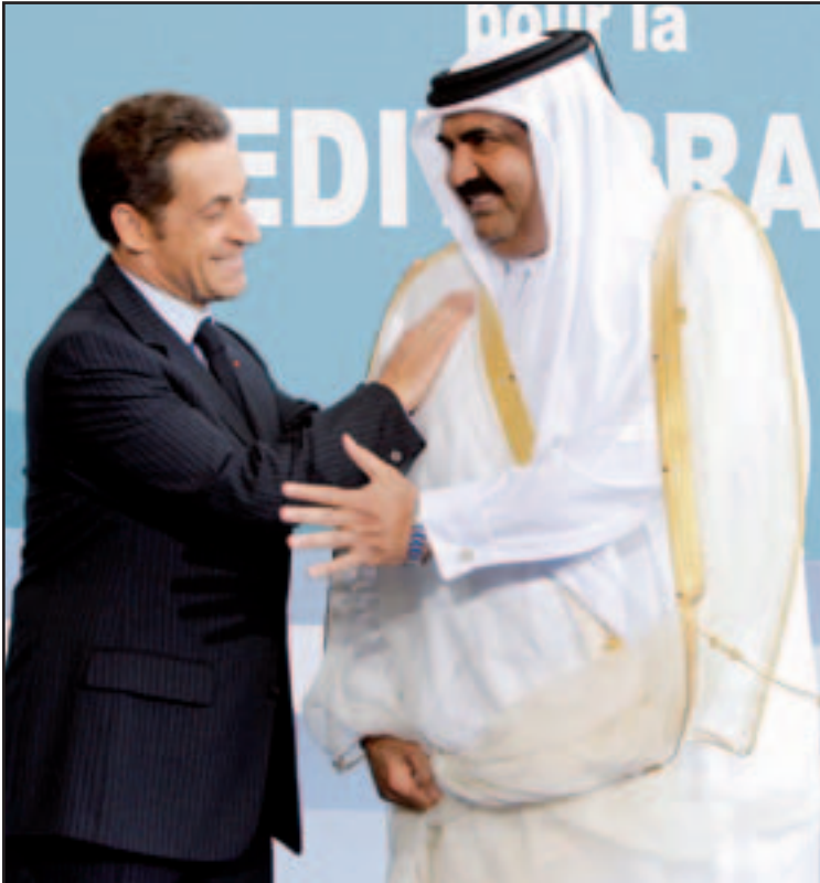
.. وعلى هامش المؤتمر الفرنسي وأمير قطر يتبادلان الحديث

مبارك يدعو لاحتلال السلام في الشرق الاوسط.. و اردوغان لديه «امل كبير» في نجاح المفاوضات بين اسرائيل وسورية