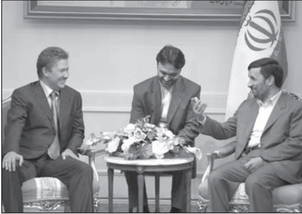
الرئيس الإيراني احمدي نجاد خلال لقائه رئيس شركة غاز بروم الروسية اليس ميلر في طهران أمس

يعود يوم من اعلان مسؤول إيراني بارز ان ايران ستستجيب اسرائيل وقواعد امريكية في الخليلج اذا هوجمت الجمهورية الاسلامية على سلاح للشرطة والخيرات العسكرية اذا فشلت الدبلوماسية في تهدئة الخلاف بشأن المبادأة الكريمة والخيبرة التي قام بها ضفره صاحب الجلالة الملك حمد بن عيسى آل خليفة عاهل البلاد لدى الأشقاء في المملكة العربية السعودية وعلى رأسهم خادم الحرمين الشريفين بالإفراج عن المواطنين البحرينيين الثمانية المحتجزين لدى السلطات السعودية منذ فبراير/ شباط». وأوضحت الوكالة أن القرار جاء توجيها لاجتماع الملك البحرين مع نائب العاهل السعودي الجمعة. وفي الوقت الذي قالت فيه الوكالة إنه تم الاتصال بأهالي الموقوفين وإبلاغهم بالإفراج عن أبنائهم تمهيدا لعودتهم في أسرع وقت ممكن، قالت مصادر بحرينية إن الرياض أطلقت الموقوفين فعلا السبت. وتكثفت الضغوط البحرينية من أجل إطلاق سراح