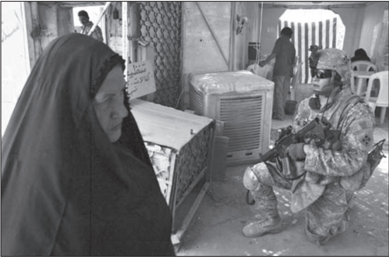
جندي امريكي امام سيدة عراقية في بغداد امس