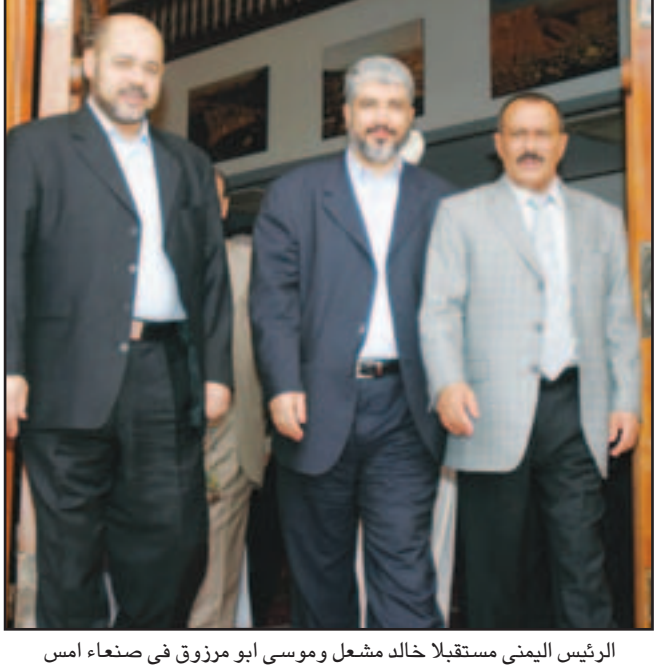
صنعاء - رام الله -