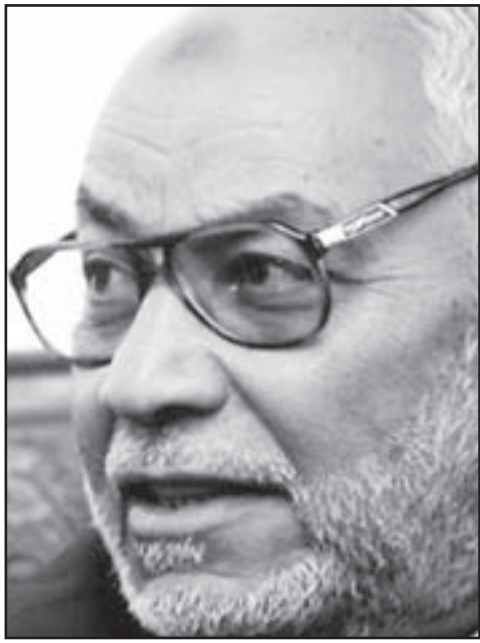
مرشد الإخوان مهدي عاكف