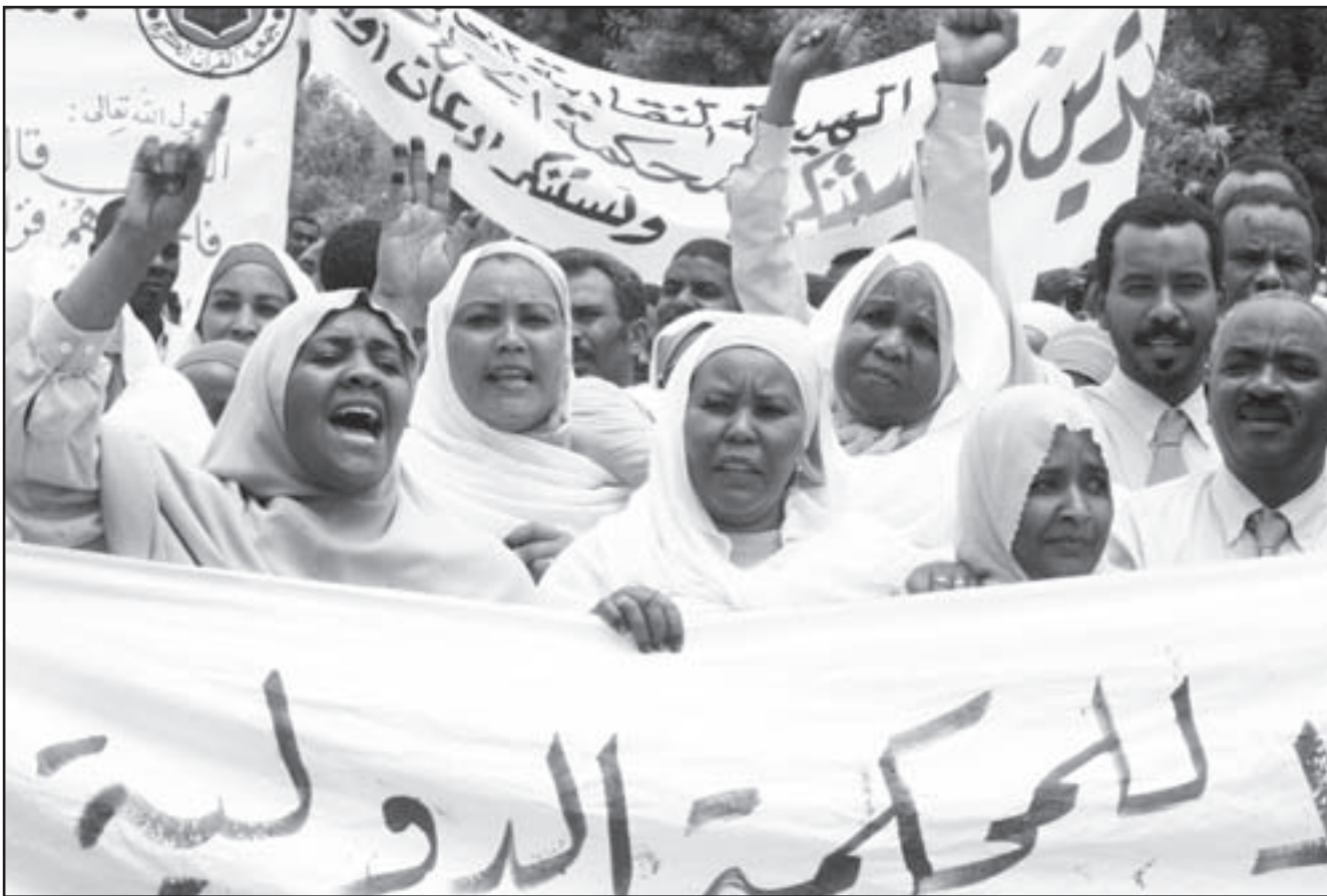
سودانيون اثناء المظاهرة في الخرطوم أمس