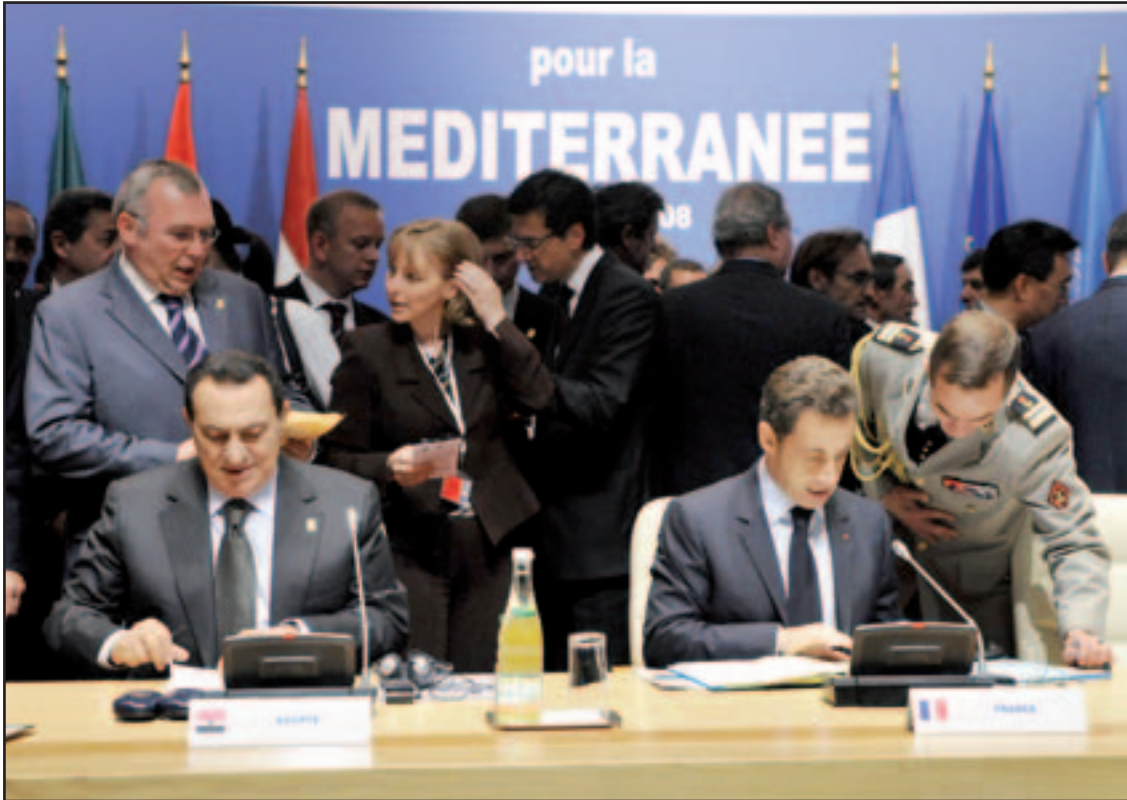
الرئيسان الفرنسي والمصري لدى افتتاح مؤتمر الاتحاد من أجل المتوسط في باريس

اجل المتوسط فرصة لاوربيا عموماً وفرنسا خصوصاً لإعادة النظر في دورها في المنطقة بعيداً عن تأثير أجندة المشروع الأمريكي وسياسات العزل والضعف التي تنتهجها الأوروبية للعلاقات الخارجية بيننا وبيننا فاندثر امس الاحد باعلان لبنان وسورية اتفاقاً على حصول تبادل دبلوماسي بينهما. وقالت المتحدثة باسم سولانا، كريستينا غلاش، لوكالة فرانس برس «انه امر ايجابي جدا، انها خطوة تستدعي على استقرار الوضع ليس فقط في لبنان انما في كل المنطقة».