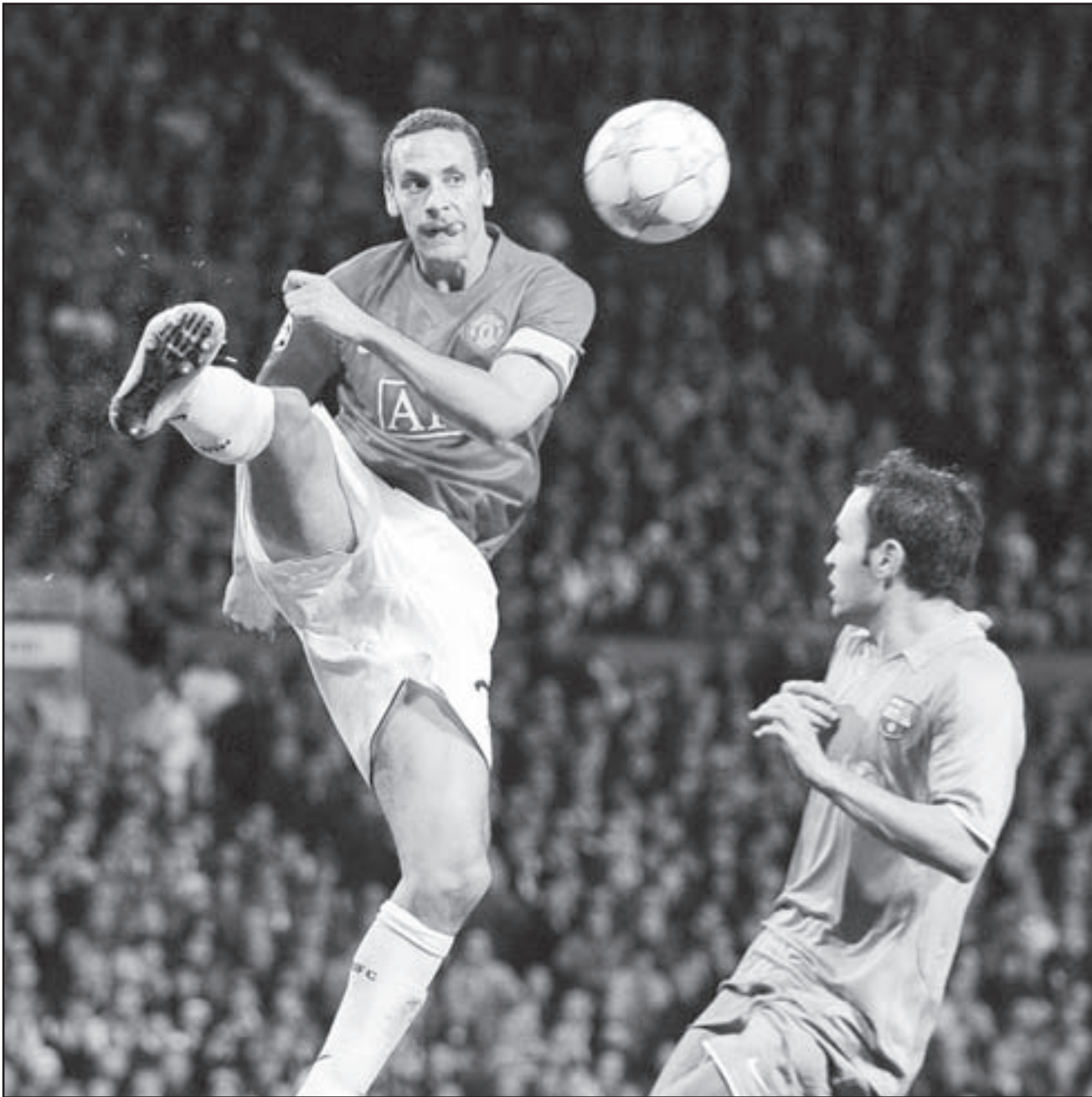
مانشستر يونايتد خلال إحدى المباريات

لندن - ا ف ب: رصد نادي مانشستر يونايتد الإنجليزي 20 مليون جنيه استرليني لضم مهاجم توتنهام هوتسبر الدولي البيلغاري ديميتار برباتوف بحسب ما ذكرت صحيفة «دي صن» الانكليزية. وازافت الصحيفة ان مدرب الشياطين «الحمراء» السير اليكس فيرغوسون يتوقع انتهاء الصفقة هذا الاسبوع ، ليضم الهدف البيلغاري الى الدولي الانكليزي واين رونو في هجوم مانشستر. وقال اميل دانتشيف مدير اعمال برباتوف: «لا يمكنني ان اعلق حتى تاكيد الخير رسميا من قبل توتنهام او مانشستر».