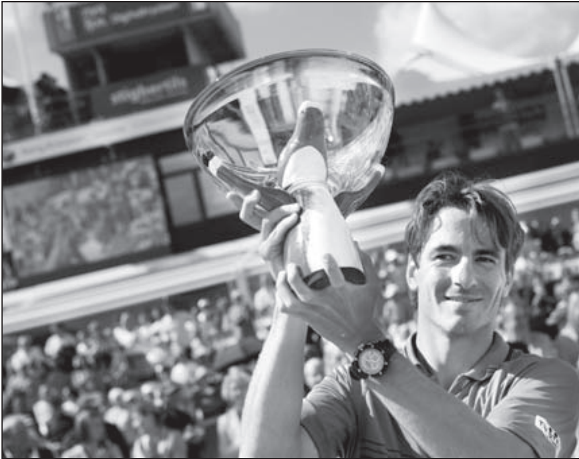
الاسباني طومي روبريدو

باشتاد (السويد) - ا ف ب: احرز الاسباني طومي روبريدو المصنف ثالثا لقب بطل دورة باشتاد السويدية الدولية لكرة المضرب البالغة جوائزها 326 الف يورو، اثر فوزه على التشيكي توماس برديتش الرابع 6-4 و6-1 في المباراة النهائية الاحد.