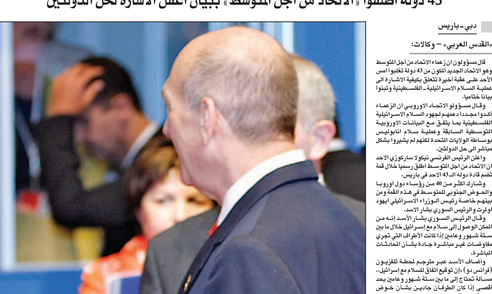
الرئيس السوري بشار الاسد يحاول اخفاء وجهه اثناء مروره الى جانب رئيس الوزراء الاسرائيلي ايهود اولمرت في مؤتمر الاتحاد المتوسطي بباريس امس

فيها داخل نفوس القاعة معاً، ومع ان سورية أحييت مؤخرًا المفاوضات غير المباشرة مع عدوها اللدود فان الأسد يعتبر بوضوح انه من المبكر جدا الحديث عن التصافح او تبادل الحديث او حتى مجرد الائمة الى اولمرت. وتوضح الصور الاسد وهو ينظر للجدار البعيد حيث يجلس المتجموع داخل كعشك زجاجي عندما التفت اولمرت ليحدث الى احد اعضاء الوفود، وظهرت خريطة الجلسو ان اولمرت خصص له مقعد يواجه الاسد مباشرة تقريبا خلال مناقشات المائدة المستديرة. وهذه المرة الاولى التي يلتقي فيها زعيما سورية واسرائيل في قاعة واحدة.