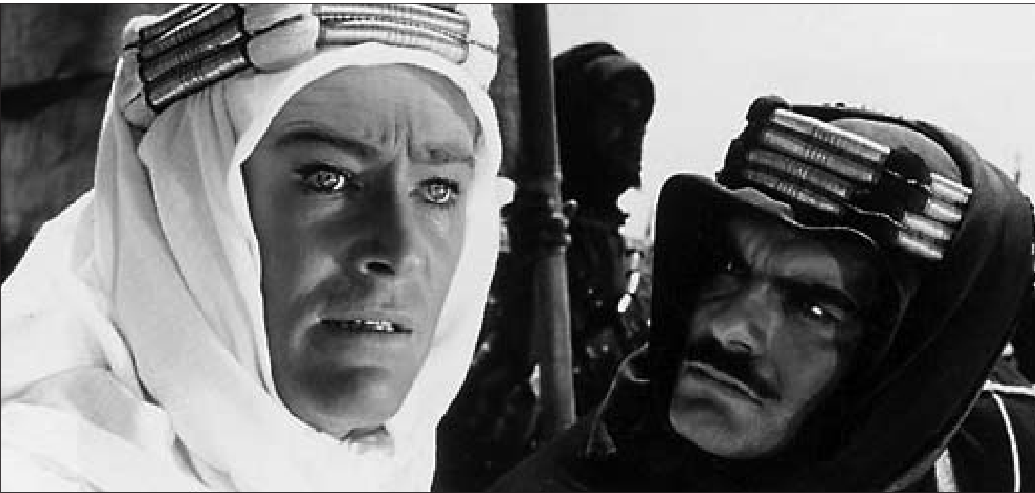
لقطة من فيلم «لورنس العربي» لديفيد لين

وكما وصفه قريب عمل معه في فيلّم « من نخدم؟» (1942) فإنه كان جدبا لدرجة كبيرة ومخلصا لعمله، وكما يقول صنع افلاما، افلاما تاريخية، لم يكن هناك شيء اخر في حياته».