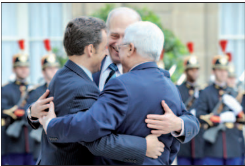
الرئيس الفلسطيني ونظيره الفرنسي ورئيس الوزراء الإسرائيلي بعد استعراض حرس الشرف في باريس امس

واضاف المعلم ان الاسد وبارن ناقشا ايضا «اطلاق المحادثات السورية الاسرائيلية (غير المباشرة) بواسطة تركية وتبادل الاسرى بين حزب الله (اللبناني) واسرائيل بواسطة ألمانيا والامم المتحدة».