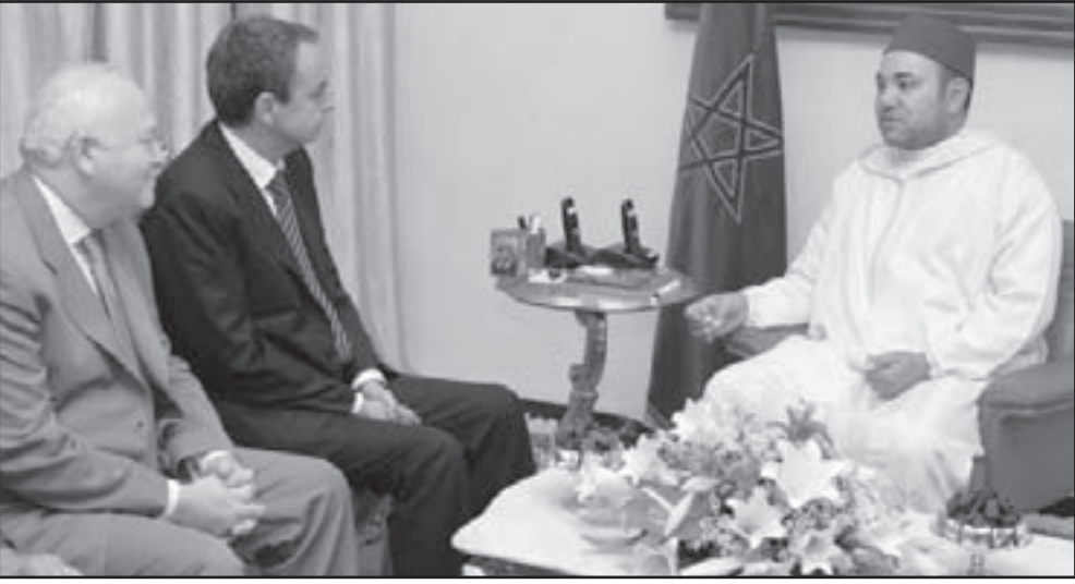
الملك محمد السادس مستقبلا رئيس الحكومة الاسبانية خوسيه لويس سبتيرو ووزير خارجيته ميغيل انخيل موراتيوس، يوم الجمعة بوجدة قرب الحدود الجزائرية

لا تقبل لكم ولا لبلدنا، والشعب المغربي الجاديين، قلته باننا والمعتدين على حرماتنا ومقدساتنا التي تحمل المغرب مسؤولية جسيمة في حمايتها وتحريها من خلال رئاسة جلالة الملك للجنة القدس ولن يقبل احد ان يراكم جنبا الى جنب مع اكبر الإرهابيين على مدى العصور، وانتم تؤسسون سويا اطرا دوليا وتعقدون الاتفاقيات والصققات وتبادلون القبلات».