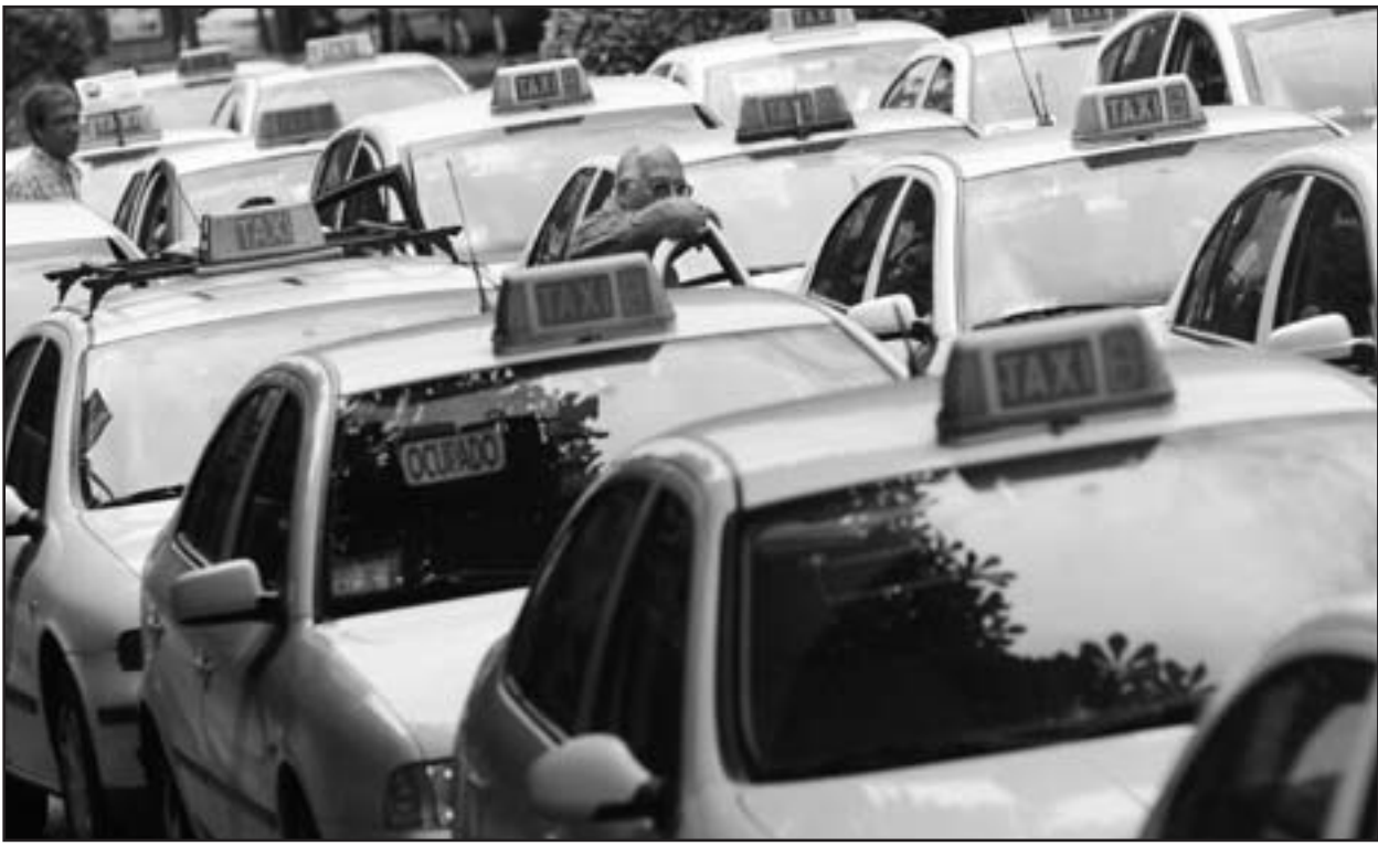
اضراب لاساتكي التاكسي في العاصمة الاسبانية مدريد احتجاجا على رفع أسعار الوقود

بدأت تيرة أسئلة سائق السيارة تهدأ مع اقترابنا من المطر حيث أمل أن تعود بي طائرة -تزداد بوقود ايهض ثمتنا- إلى بريطانيا دون ان استمع لوعظة من قائدها.