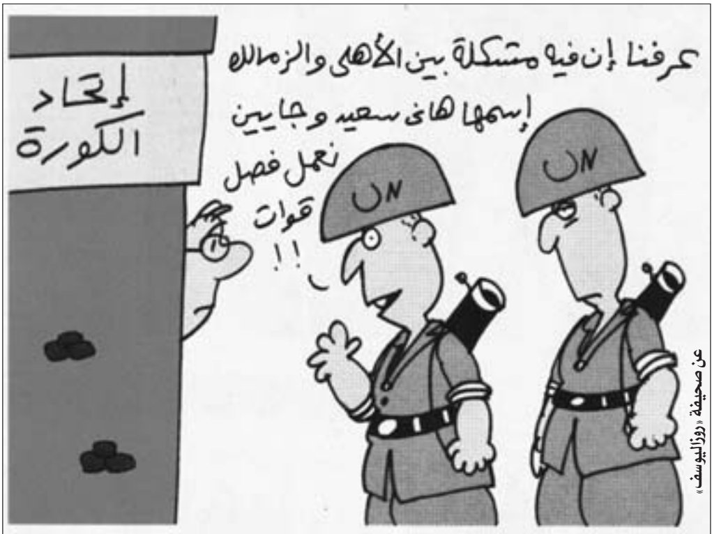
عن صحيفة «روز اليوسف»

ويخش النظر عن أنه قبل أن يتم إطلاق «حكاية فيلم السادات» وإعادة إحيائه من مرقد، إذ تم نتاجه من قبل فإن العدوان الإعلامي الإيراني كان واضحا من خلال عدد من الصحف وثيقة الصلة بالنظام الفارسي خاصة «جمهورية إسلامي» ومن ثم فإن ما يتردد عن أن الفيلم ليس من فعل الدولة الفرنسية، وإنما هو نتاج ما يوصف بأنه من فعل الحزب الحرية الإيراني، هو كلام فارغ، بل إنه حتى لو كان هذا الفيلم لا يعبر عن خطة إيرانية حقيقية ومتكاملة تعرف ماذا تريد، لم تكن إيران لتصعيد ردود الأفعال تجاه مصر بعد أن انتقدته الصحف المصرية وعلت رأسها «روز اليوسف».