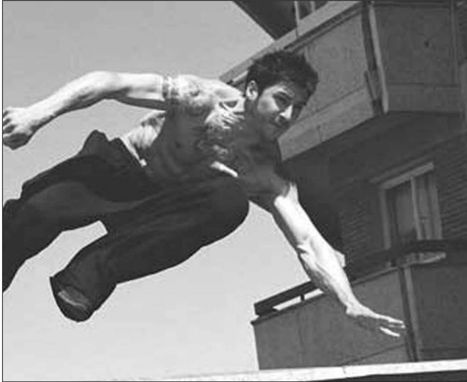
لقطة من فيلم «الريس عمر حرب»