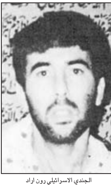
الجندي الإسرائيلي رون اراد

وعقب القمة الرباعية قيام الرئيس الاسد بالتوجه في سيارته واحدة مع نظيره اللبناني الى مقر اقامة الرئيس سليمان في فندق «ريتز» حيث عقدا خلوة استمرت اربعين دقيقة تحدث