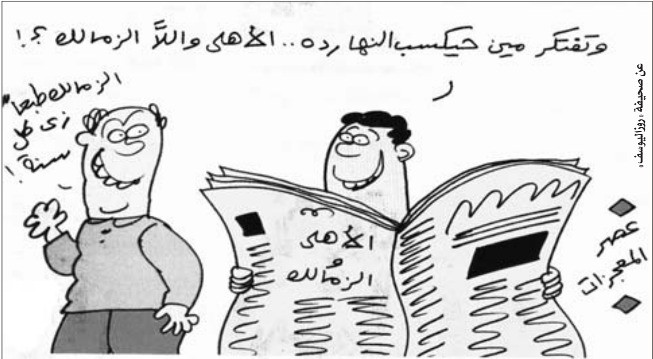
عن صحيفة «روزاليوسف»

«من المنظر أن نستمتع قريبا إلى مطرب المرحلة شعبان عبدالرحيم يعني لنا «وضحكتا على إسرائيل وبعنا لهم الغاز كنا بنحرقه، ولولوني بنقبض دو لارات، هيه، هيه، وضحكتا على إسرائيل»، وطبعاً سوف يشدو مطرب المرحلة بهذا الأغنية تخليداً لذكرى اليوم الذي فاجأنا فيه الدكتور أحمد نظيف رئيس الوزراء وأعلن أننا ضحكتا على على إسرائيل في اتفاقية الغاز، قال أحمد نظيف في رده على أحد الأسئلة «أن موضوع تصدير الغاز لإسرائيل يجب أن ننسى أن فيه جانبين هما