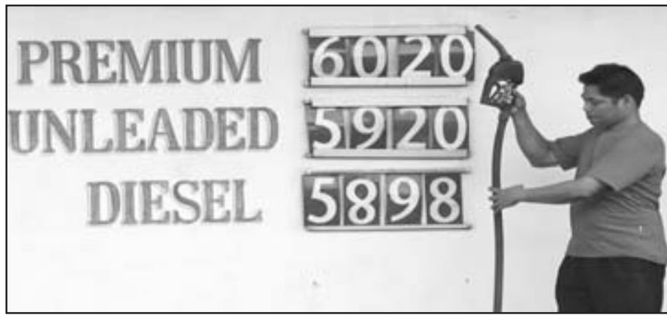
عامل في احد محطات الوقود امام لوحة تظهر ارتفاع اسعار الديزل

■ واشنطن - رويترز: قال وزير الخزانة الأمريكي هنري بولسون امس الأحد إن الاقتصاد الأمريكي يحتاج شهوراً للتعافي من تباطؤ النمو نتيجة أزمة القروض العقارية والاضطرابات في الأسواق المالية وارتفاع أسعار الطاقة.