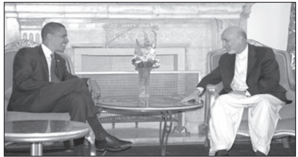
الرئيس الافغاني حميد كرزاي مجتمعاً بالمرشح الامريكي باراك اوباما

■ كابول - اف ب: التقى المرشح الديموقراطي الى الانتخابات الرئاسية الامريكية باراك اوباما، الذي جعل افغانستان احد اولويات حملته على صعيد السياسة الخارجية، الاحد في كابول الرئيس الافغاني حميد كرزاي بعد زيارته جنودا امريكيين. وكان اوباما وصل السبت الى افغانستان، المحطة الاولى من جولة خارجية سيقوده ايضا الى العراق والاردن وسريلانكا واوروبا. واعلنت الرئاسة الافغانية ان اوباما وكرزاي تناولوا الغداء معا واستغرق اللقاء بينهما نحو ساعتين، لافقة انه اثنى على كرزاي خصوصا على موضوعي الارهاب وتهريب المخدرات في افغانستان، وبحث الرجلان الصعوبات التي تعوق اعادة بناء افغانستان، حيث تواصل طالبان تمرداها الديموقراطي. ويتعتبر اوباما ان «الجيبة المركزية للحرب على الارهاب» ليست في العراق انما في افغانستان. وقد وعد في حال انتخابه بإرسال عشرة الاف جندي اضافي الى هذا البلد لمساعدته في التغلب على تمرد طالبان. وقد انتقد اخيرا الرئيس الافغاني، وقال في حديث الى شبكة «سي ان ان» التلفزيونية الاخبارية ان «حكومة كرزاي لم تخرج بعد من الملاجئ الحصنة للمساعدة على اعادة تنظيم افغانستان والحكومة والقضاء وقوات الشرطة بشكل يعيد الثقة الى الناس»، وأضاف «ثمة انا مشاكل كثيرة هناك». وتسببت له تعليقاته بانتقادات في اوساط الحزب الجمهوري التي اتهمته بالتعرض لحليف اساسي للولايات المتحدة في «حربها على الارهاب» وبتجاهل محاولات الاغتيال العديدة التي تعرض لها الرئيس كرزاي. وقبل لقائه كرزاي، تناول المرشح الديموقراطي الذي يرافقه عضوان في مجلس الشيوخ الامريكي، طعام الطيور مع جنود