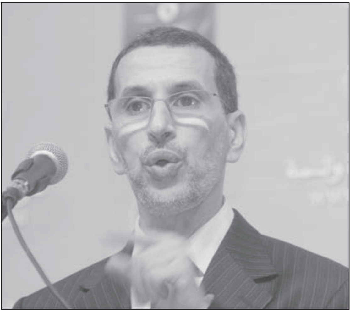
العثماني يلقي كلمة في افتتاح مؤتمر حزبه يوم السبت

دون مشاغبة أو مزيدة ضمنّت وجودا فاعلا للحزب في المجتمع واحتراما من لدن صانعي القرار وجنب البلاد أزمات ومخاطر عنف لم تكن بعيدة عنه.