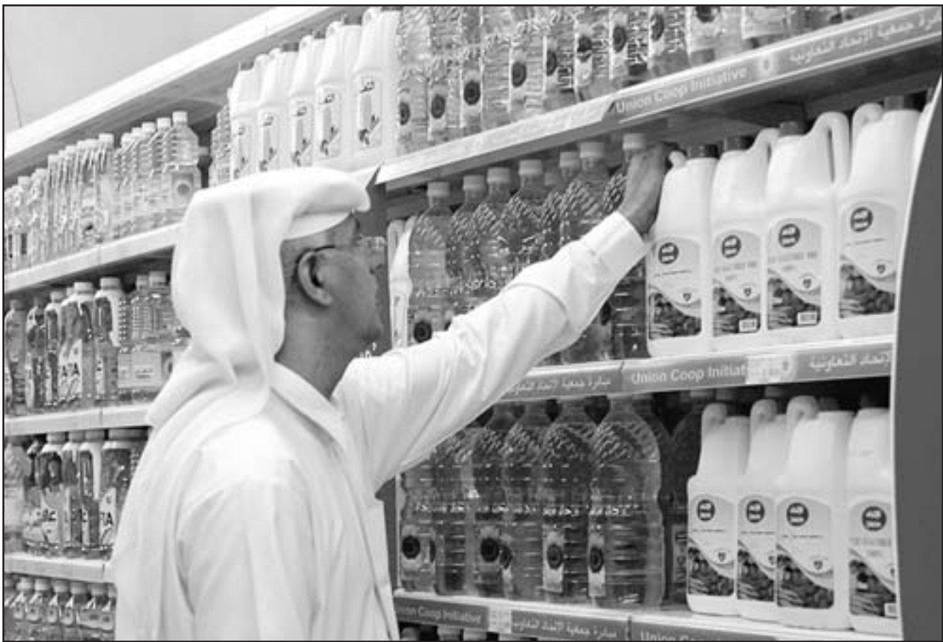
تاجر اماراتي يتفقد أسعار الزيوت النباتية في ابوظبي