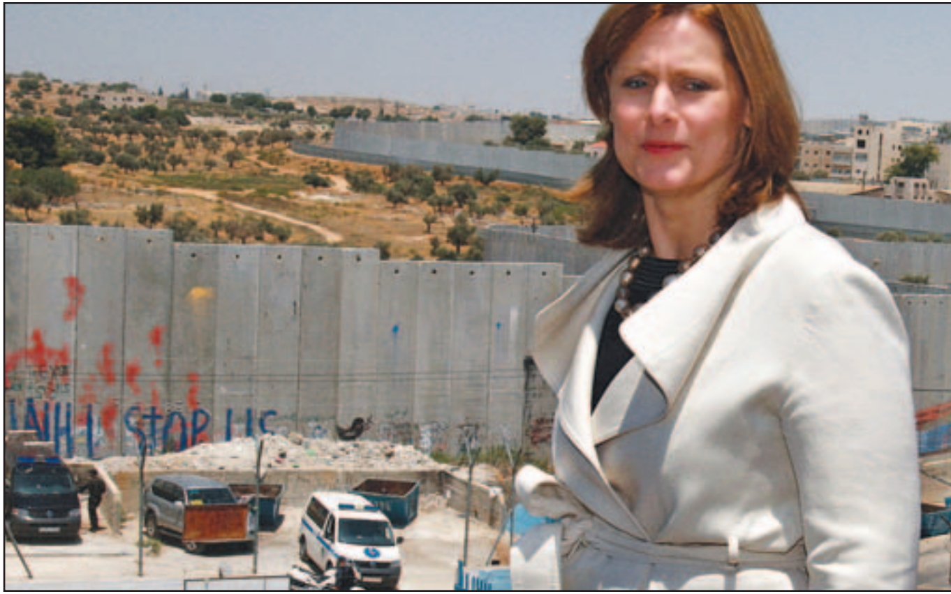
قريبة رئيس الوزراء البريطاني اثناء تفقدها الجدار العازل في الضفة الغربية امس