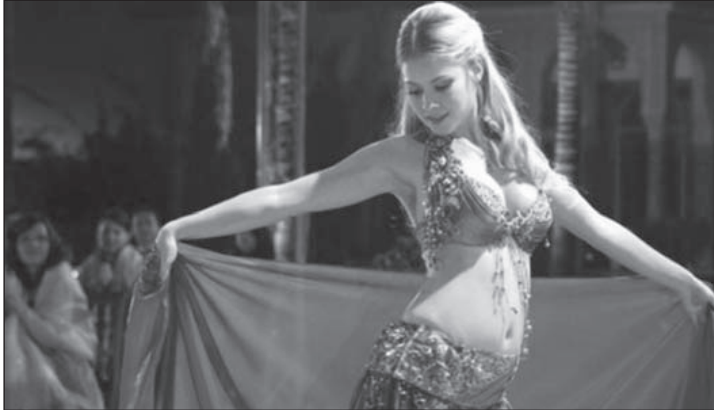
لقطة وملصق فيلم "لولا"

إن فيلم "لولا" يرغب أساساً في إبهاننا وهو ينجح في شدنا بانسيابته أحياناً وبرقصاته الجميلة وموسيقاه وأغانيه الجذابة أحياناً أخرى مذكرة إياننا بأجواء