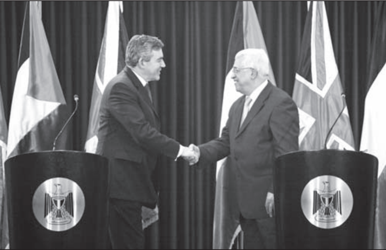
الرئيس الفلسطيني يصافح رئيس الوزراء البريطاني مع بدء المؤتمر الصحافي المشترك في بيت لحم