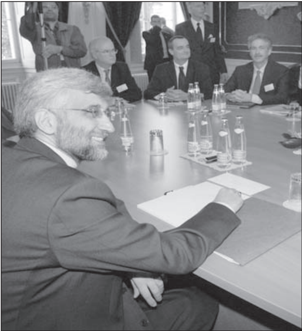
مسؤول عن الملف النووي الإيراني سعيد جليلي يسار وليام بيرنز يمين