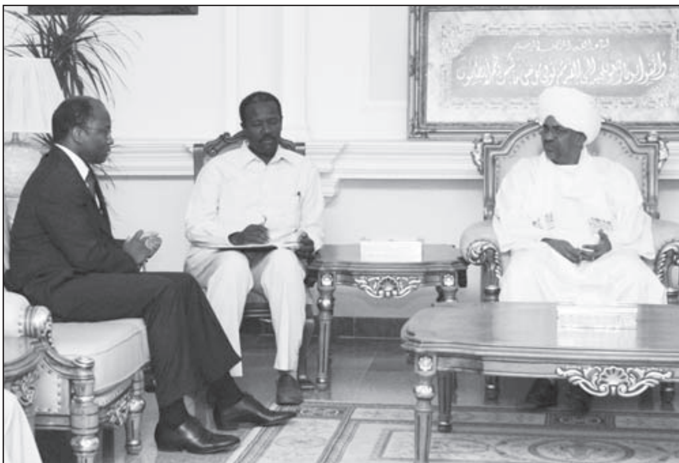
الرئيس السوداني عمر البشير مستقبلاً وسيط الامم المتحدة لآزمة دارفور

على المسؤول في ظل تواجد أكثر من جماعة متمردة وجماعات كثيرة للنهب المسلح. ويرى ناقدون طاماً انتقدوا الحكومة (يوليو) الحالي هو السلطة الاولى في رد الاتحاض صحيفة «واشنطن بوست» الى ان الاتهامات تهدد عمل قوات حفظ السلام المشتركة في الاقليم مشيرة لهجوم الثامن من الشهر الحالي الذي قتل فيه سبعة جنود وجرح 22 شخصاً. وتلقت عن مسؤول في الامم المتحدة تحذيره من تزايد تدريجي في العنف، واكد انه من الصعوبة بمكان التعرف