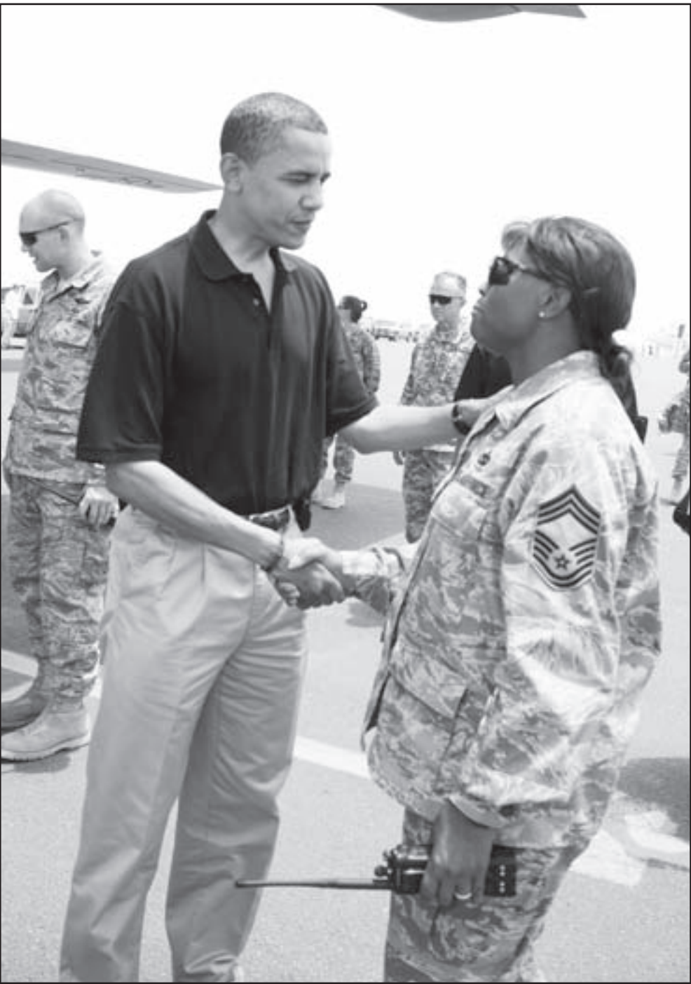
المرشح الديمقراطي باراك اوباما مصافحا جندياً أمريكية في أفغانستان امس

على أهمية اوباما في السياسة المحلية البريطانية، وتحدثت الصحف البريطانية عن سحر اوباما، خاصة ان براون ينتظر بحسب التحليلات زيارة المرشح الديمقراطي لبريطانيا مع انه كان يبدو أكثر تناسبا مع المرشحة الخاسرة، هيلاري كلينتون. وكان براون قد اعلن عن خطة محتملة لسحب ما تبقى من القوات البريطانية في الجنوب العراقي وتتضمن اربعة عناصر وهي زيادة تدريب عناصر الامن العراقي وتكثيف عمليات اعادة الاعمار وتقوية الاقتصاد العراقي وخلق الظروف للامانة امام العراقيين للسيطرة على الامن في مطار البصرة وهو المقر الحالي للقوات البريطانية. حيث الخطة لم تفت معلقى «اوبزيرفر» لكن قال احدهم ان الحديث عن سحب القوات البريطانية يدور منذ عام 2006 لكن يعد مضي عامين نجد انفسنا امام اربعة آلاف جندي بريطاني لا زالوا هناك، ويشكك الكاتب في خطة براون مشيراً الى ان القوات البريطانية المتواجدة ليست معزولة عما يحدث في افغانستان التي يتواجد فيها عدد اكبر من القوات وفي حالة فشل التوصل لاتفاق يحدد وضعية القوات البريطانية في العراق بنهاية العام الحالي فان هذا ستكون له آثار سلبية على القوات هناك. لكن صحيفة «صاندي تلغراف» أشارت الى تصريحات المالكى الذي قال انه يرغب بحلول العام المقبل، وترى الصحيفة في تصريحات المالكى، التي ادلى بها الى صحيفة «دير شبيغل» الألمانية، تعزيزاً لخطة براون واوباما اللذين يرغبان بسحب قواتهما من العراق في أقرب وقت ممكن. ومع ان براون لم يحدد جدولاً لانه حسب «اندينت» اون صاندي» يتوافق مع اوباما على ضرورة اعطاء افغانستان الاولوية، لكن مصادر الحكومة العراقية تقول ان براون لم يح امكنة تحقيق سحب كامل من العراق بحلول صيف عام 2009 لكن لم يتم الحديث عن جدول زمني.