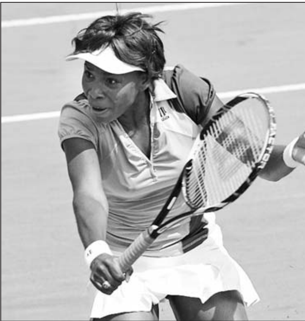
الامريكية سيرينا وليامس

ديفنهورت التي أعلنت انسحابها من الدورة بسبب اصابة في ركبته. وخرجت حاملة اللقب الروسية انا تشاكفيتادزه المنصقة ثانية امام الفرنسية ماريون بارتولي 3-6 و4-6، لتواصل نتائجها الخيبة هذا الموسم. وعانت السلوفاكية دومينكا تشيبولكوفا من سوء الحظ امام اليابانية أي سوغوياما، إذ اضطرت للانسحاب بسبب شد عضلي في قدمها اليسرى في المجموعة الحاسمة بعدما كانت الاخيرة تتقدم بصعوبة 4-7 و7-5. وقالت سوغوياما التي انقذت 3 كرات حاسمة في المجموعة الثانية: «لم اشعر بالتعب وكنت اتحرك جيداً طوال المباراة...حتى في نهاية اللقاء حافظت على لياقتي ونشاطي».