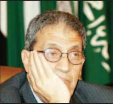
الخرطوم - «القدس العربي» -