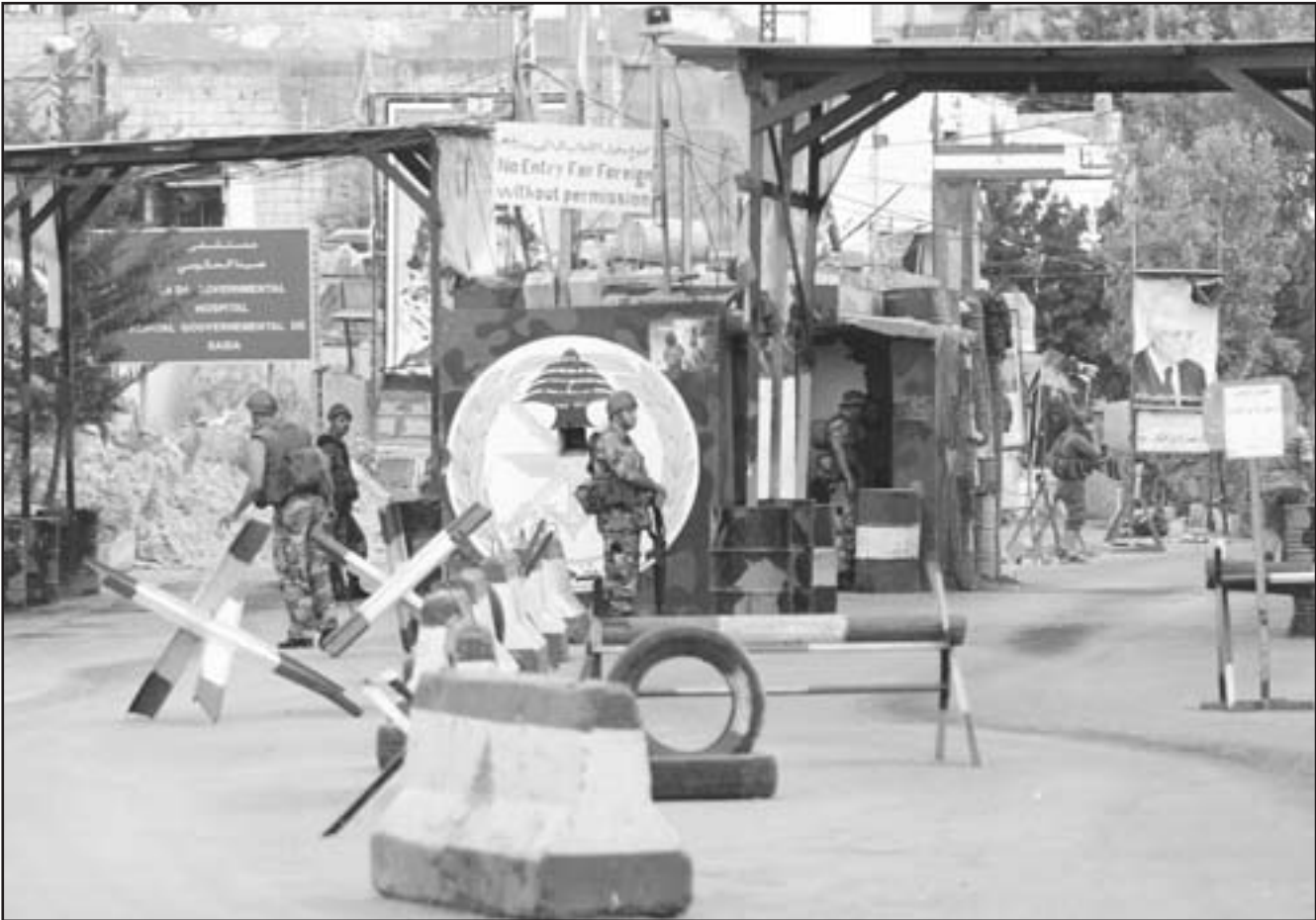
قوات الامن اللبنانية تغلق معبر مخيم عين الحلوة الفلسطيني بعد اشتباكات أدت الى مقتل ثلاثة

بالمشروط للعثمانية بين لبنان وسوريا» وقال الوزير صلوخ: «ما زلنا في أول الطريق، وهناك امور قانونية وادارية يجب ان تؤخذ في الاعتبار بين البلدين وهناك معاهدات واتفاقات سنجتجها». وراى الثنائية بين الرئيسين الاسد وسليمان، علينا انتظار الزيارة والاتفاق فيها على جدول الاعمال، عندئذ يبدأ الحديث عن جدول الاعمال. سيتم البحث في القعة الموسعة في جدول الاعمال عبر فريقين ينتقلان من هذه القعة الموسعة، ونتمنى ان تعطي القعة الثنائية المرتبة بين الرئيسين ثمارا جيدة وطيبة للبلدين الشقيقين. وما هو اكيد ان لدى الطرفين النية والارادة الصادقة لتطوير العلاقة الاخوية ويبحث كل ما من شأنه تسوية الملفات في جو من التفاهم وبما يصون العلاقة الاخوية المبنية على الاحترام المتبادل وسيادة كل من الدولتين، هذا هو الاساس الذي منه ننتقل وبعد ذلك يصبح كل شيء يسيراً».