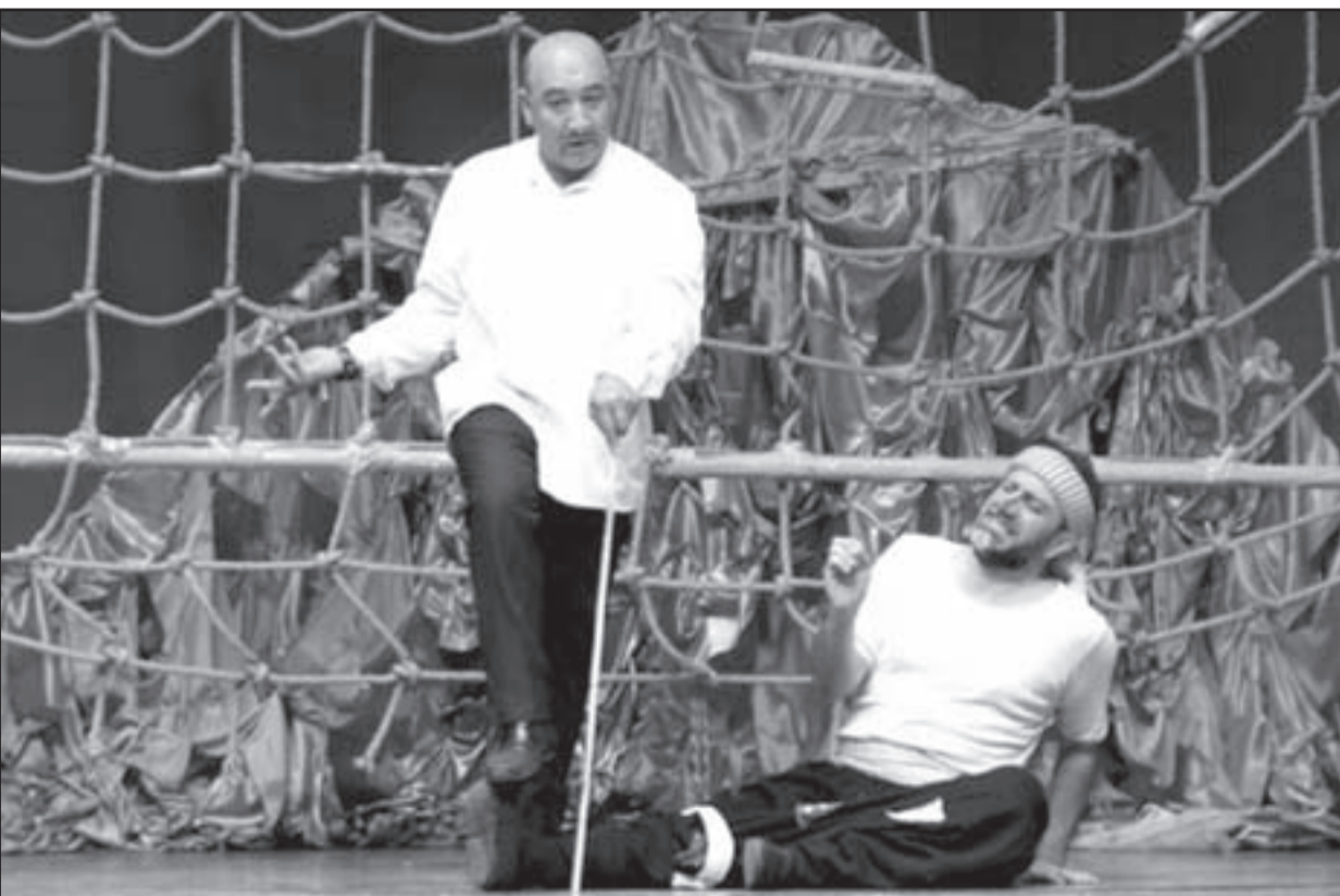
لقطة من «محاولة طيران»