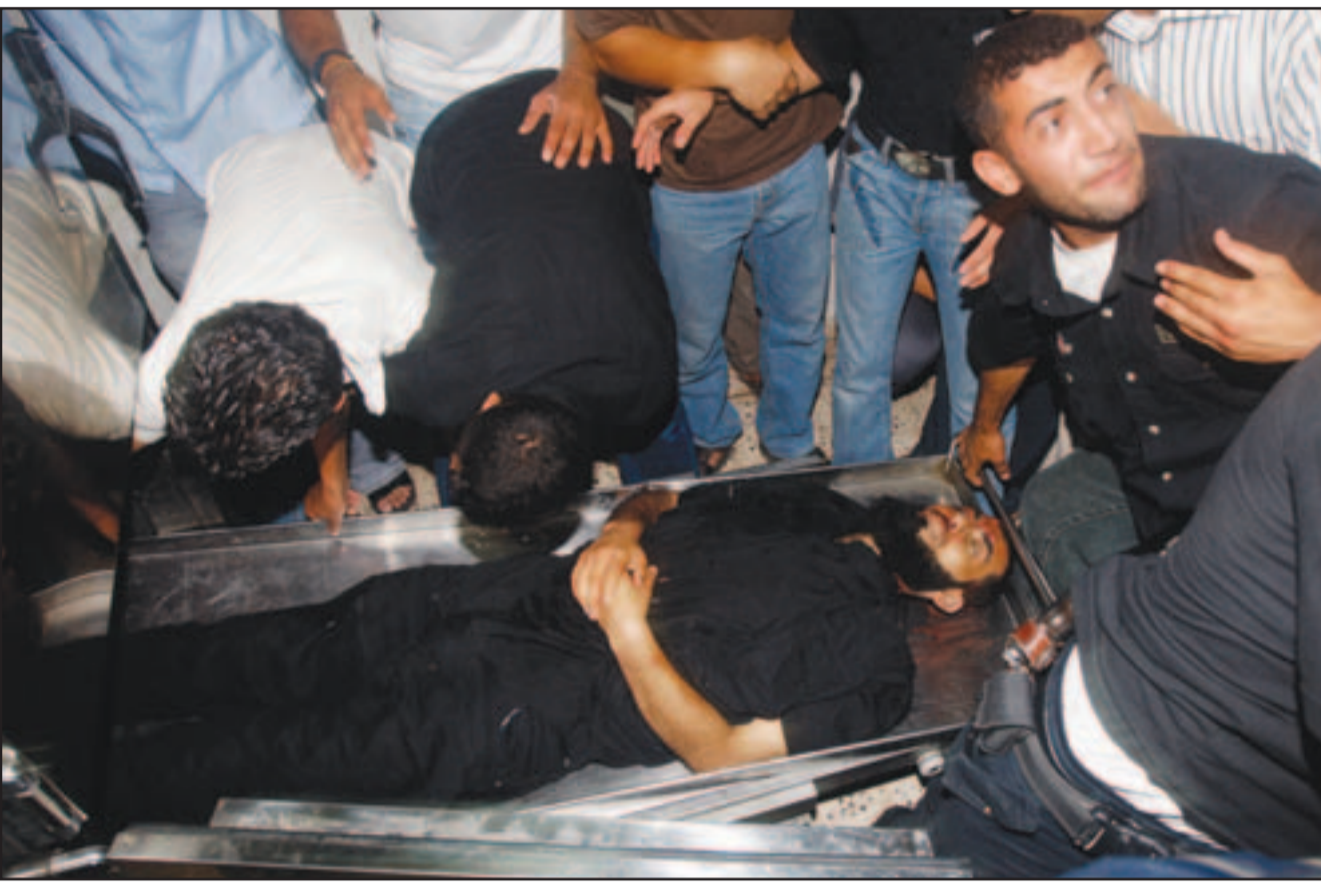
جثمان احد قياديين حركة حماس الذي استشهد في انفجار استهدف سيارته يوم الجمعة