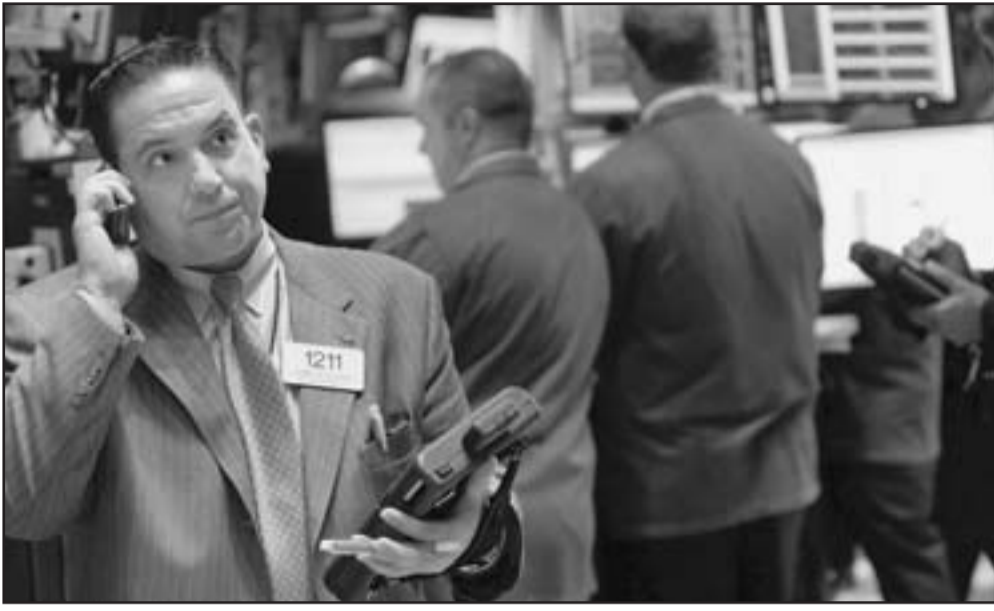
متعاملون في بورصة نيويورك يتابعون حركة الاسهم الجمعة