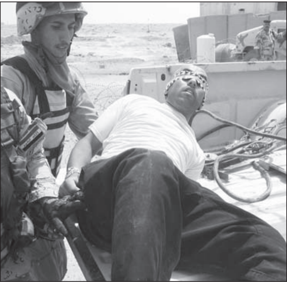
جندي عراقي يعقل متهما قرب بعقوبة امس (ا ف ب)

الامن الداخلي اليمني. ويبدو ان الصحيفة قد اقامت تحليلها على فكرة ان عدد، من اليمنيين الافغان قد شاركوا في هزيمة اليسار اليمني الانفصالي في حرب عام 1994 وكانوا عاملا مهما في الهزيمة. وكانت صحيفة امريكية قد لحت الى وجود تعاون او غرض طرف على بعض المتهمين في تفجير «كول»، حيث حفرنا نفقا من سجن صنعاء وتمكنوا من الهرب عام 2006، وتشير الى ان عددا من الحاذير والضوابط لدى السلطات اليمنية. وقد قتل سائحان بلجيكيان في بداية العام الحالي لكن الحادث الاسوأ هو تفجير سياح اسبان وسائقهم اليمني قرب مارب، وحسب احد مساعدي الرئيس اليمني علي عبدالله صالح فان الارهاب يتم التعامل معه بأكثر الطرق مناسبة وبناء على المصادر المتوفرة لدى السلطات، مشيرا الى ان السعوديين لديهم الامكانيات لشراء ما يريدونه من اجهزة اتصالات، اما اليمنيون فإن عليهم الضغط على ميزانيتهم والتوفير لغرض شراء المعدات هذه. ويترجم مراسل الصحيفة ان المصادر المتوفرة لدى الحكومة وقتها ليست الاجانب واحدا من ازمة الدولة مع الجهاديين اما الجانب الاخر فهو ما زعمت انه «تفاهم» غير مكتوب بين صالح وبين الجماعات الجهادية المتأثرة بالفلسفة السعودية لتركيها على جريتها وتجنيد من تريد حتى ان كان لغرض المشاركة في الجهاد في العراق طالما انها لم تقم باعمال تستهدف