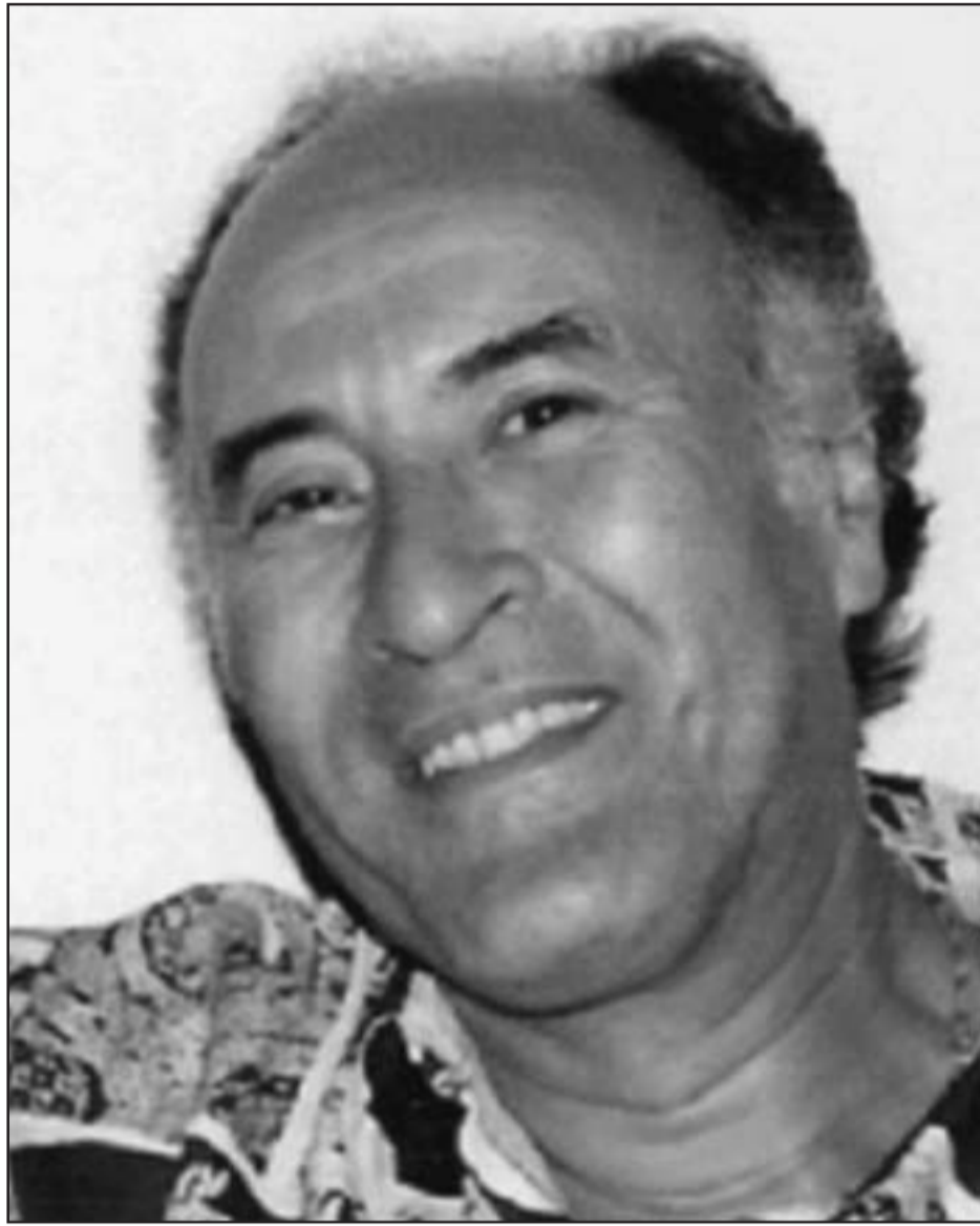
عبد الحميد الغرباوي (القدس العربي)

ليقترب التوتر من السخرية، وهو بناء ينسجم مع التوتر الناظم للقصة، فالمثل هو موضوع الواقع المزيف، فلما يحضر يغيب الواقع الحقيقي، إذ يقدم صورة خاطئة عن الواقع، في بداية القصة حضر تمثل سكان الحي للشخصية امرأة أنيقة ومحترمة، تثير انتباه شبان الحي يعطرها المنقطع النظير، تشتغل سكرتيرة في مؤسسة كبيرة، وتلاه إجلاءً بمتابعة الشخصية خارج الحي في عملها، يكشف الواقع الحقيقي لوضع التمثل من خلال المرأة نفسها لتظهر أنها امرأة متعنتة تشتغل في ماخو، تقول في نهاية القصة مجيبة صديقتها في العمل التي استغربت من كثرة رشها للعطر على عنقها وثيابها: «أفعلني مثلي أو أصمتي، إني استر به خزيتي...»