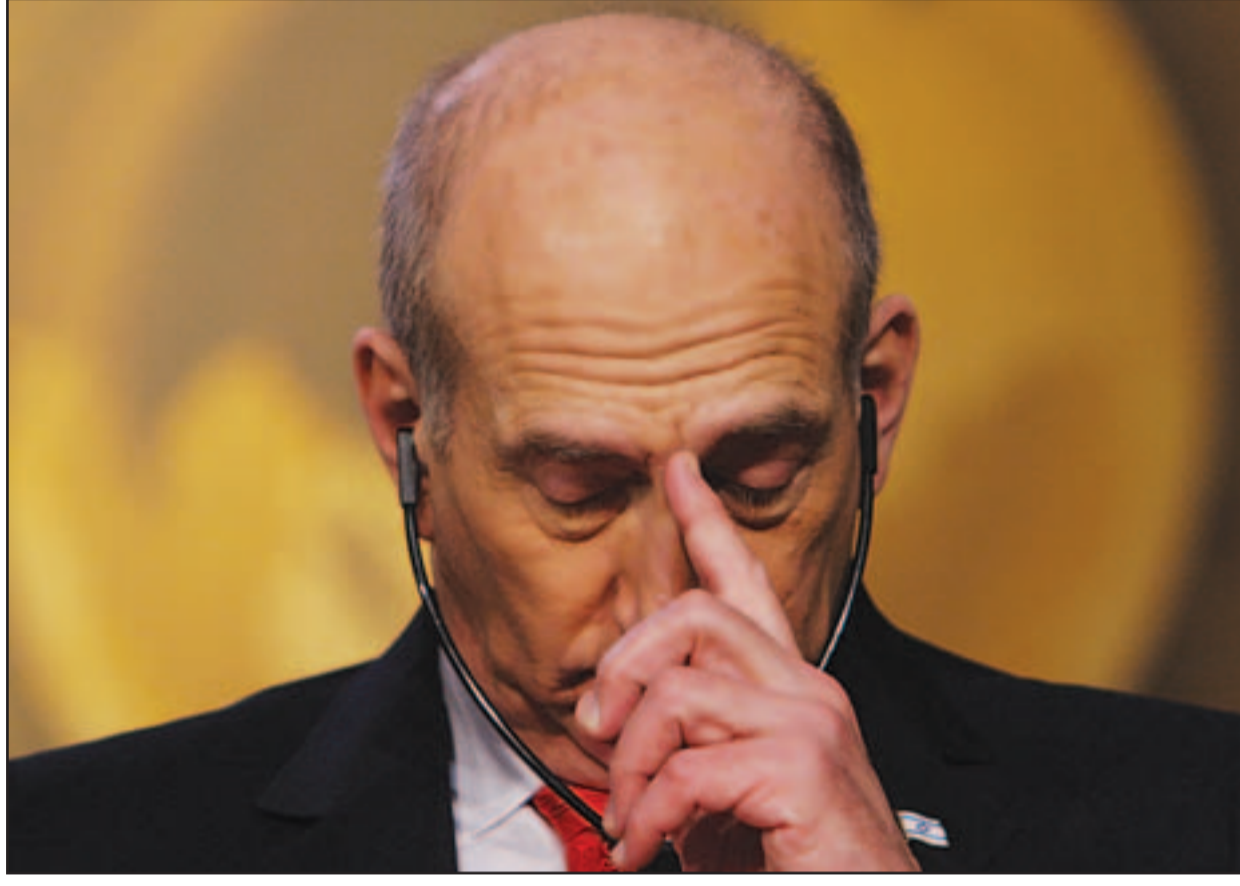
أولمرت كما بدأ أمس

■ الناصرة - "القدس العربي" - من زهير اندراوس: أعلن رئيس الوزراء الإسرائيلي إيهود أولمرت أمس الأربعاء أنه سيستقيل ما إن يختار حزب كديما الحاكم زعيما جديدا في الانتخابات الداخلية التي تجرى في 17 أيلول (سبتمبر) والتي لن يرشح نفسه فيها. وقال أولمرت في إعلان مفاجئ من مقر إقامته الرسمي في القدس "قررت الإرسخ نفسي في الانتخابات التمهيدية لحركة كديما ولا اعترّم التدخل في الانتخابات". وأضاف "عندما يقع الاختيار على رئيس جديد (لحزب كديما) سأستقيل من منصب رئيس الوزراء للسماح لهم بتشكيل حكومة جديدة على وجه السرعة وبطريقة فعالة". وأشار إلى أن أولمرت تورط في ست قضايا فساد، كانت أخطرها قضية تلقيه مئات آلاف الدولارات، حسب الشبهات، من رجل الأعمال الأمريكي موريس تالانسكي، بصورة مخالفة للقانون. وقال رئيس الوزراء في خطاب متلف للشعب الإسرائيلي "إنه منذ اليوم الأول لانتخابه تعرض لحملات تحقيق من قبل الشرطة الإسرائيلية، التي لم تتوقف عن هذا اليوم، الأمر الذي لم يمكنه من تلبية واجبه كما يجب". و زاد قائلا "إن الوضع في الدولة العبرية في جميع نواحي الحياة ممتاز". مشيرا إلى "أن تل أبيب تلقت وما زالت تتلقى الدعم الكامل من الولايات المتحدة الأمريكية"، ووجه الشكر الخاص للرئيس جورج بوش.