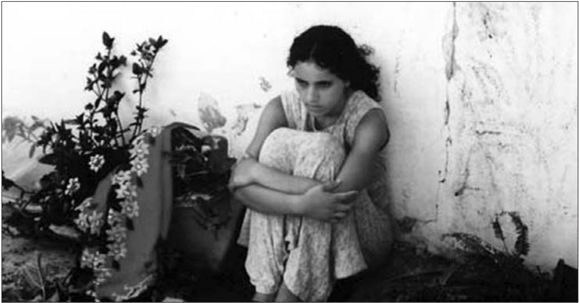
لقطة من فيلم «العصا والأفيون» لأحمد راشدي