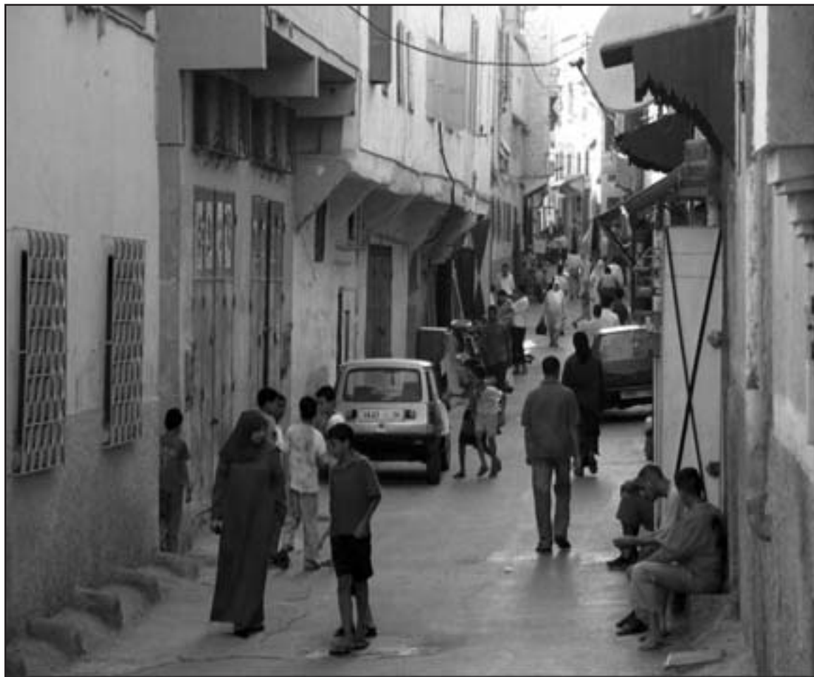
أحد أحياء مدينة مكناس

اسم الكتاب: تاريخ القرآن المؤلف: تيودور تولدك نقله إلى العربية: جورج تامر الناشر: منشورات العمل، بيروت، 2008 ما من دين من الديان العالم الكبير يسمى إلى مجابهة الأديان الأخرى أو يبريد «صراعاً بين الثقافات». فإن العدالة والحريه واحترام كرامة الإنسان قيم أساسية توجد في كل الأديان الكبرى بصياغة أو بأخرى. وكذلك التسامح والاستعداد للتوجه نحو الآخر من أتباع الأديان الأخرى بانفتاح وتجرد، وبذل الجهد من أجل أن نفهم علماً ونوضح ما يجمع بين أتاس آخرين. كل هذه قيم، ما زالت حية عندنا بهذا تجميع بين المؤمنين التابعين للديانات المختلفة.