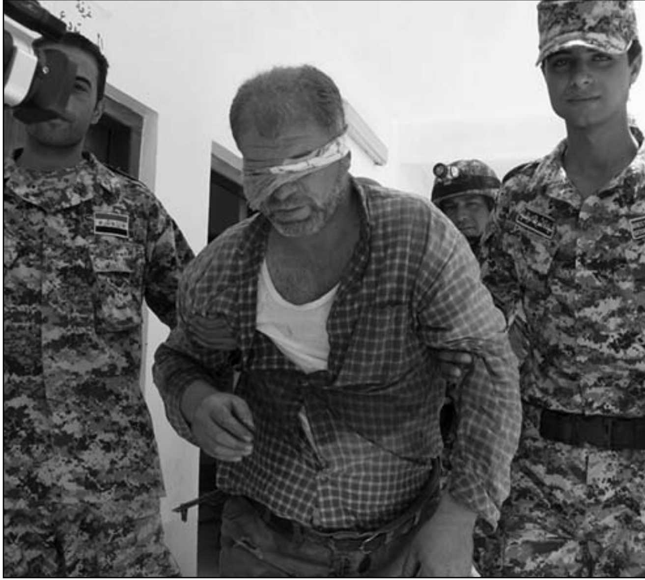
أحد المظلومين أثناء القبض عليه في بعقوبة أمس

في المقابل، كرر زيباري موقف الحكومة العراقية المعلن من أن مدينة كركوك هي مدينة عراقية وأن هناك آليات قانونية ودستورية يجري اتباعها لتسوية مشكلتها من دون الحاق الأذى بمصالح أي مكون من مكوناتها.