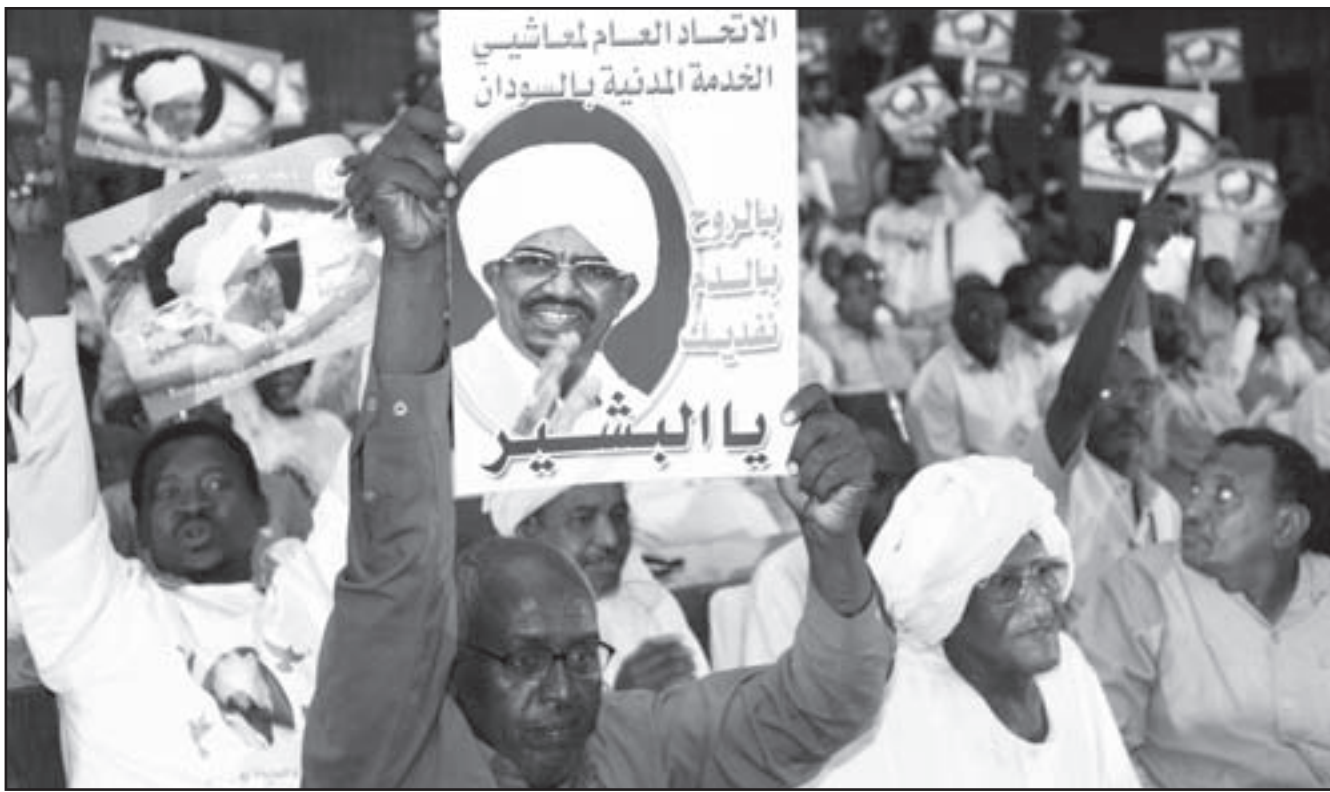
سودانيون يعلنون تأييدهم للرئيس عمر البشير في الخرطوم امس