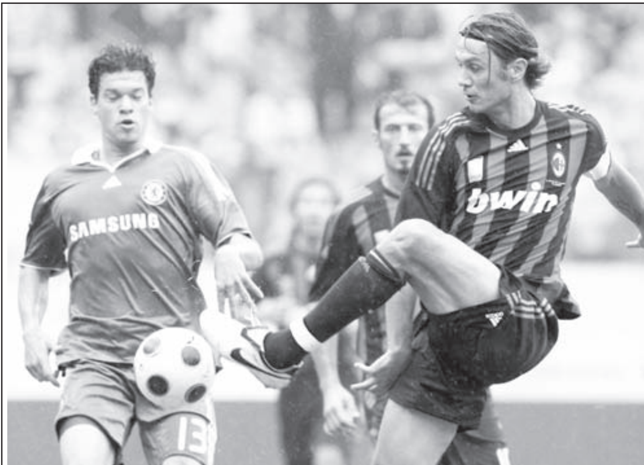
صورة لتشلسي خلال احدى المباريات

■ موسكو - ا ف ب: حقق تشلسي وصيف بطل الدوري الانكليزي فوزا كاسحا على ميلان الايطالي 5- صفر امس الاحد في دورة دولية لكرة القدم في موسكو ضمن استعداداتها لانطلاق الموسم الجديد.