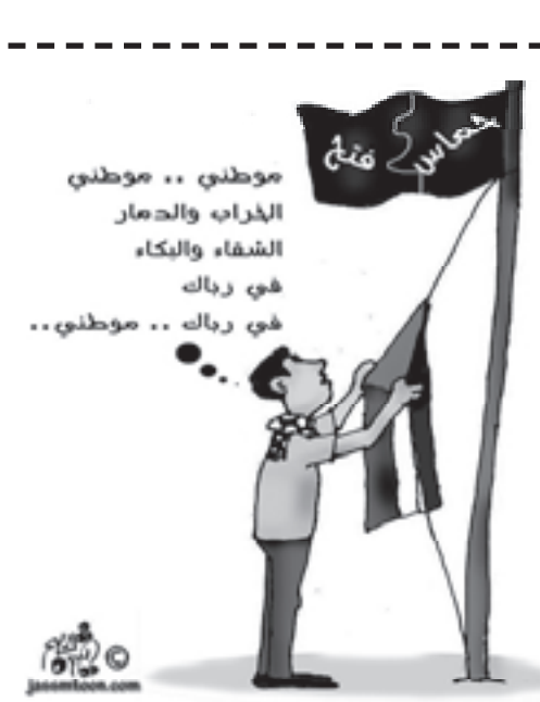
مع الامتياز للشهد الوشني الفلسطيني

ورسالتكم الالكترونية الى العنوان الالكتروني: menbar@alquds.co.uk