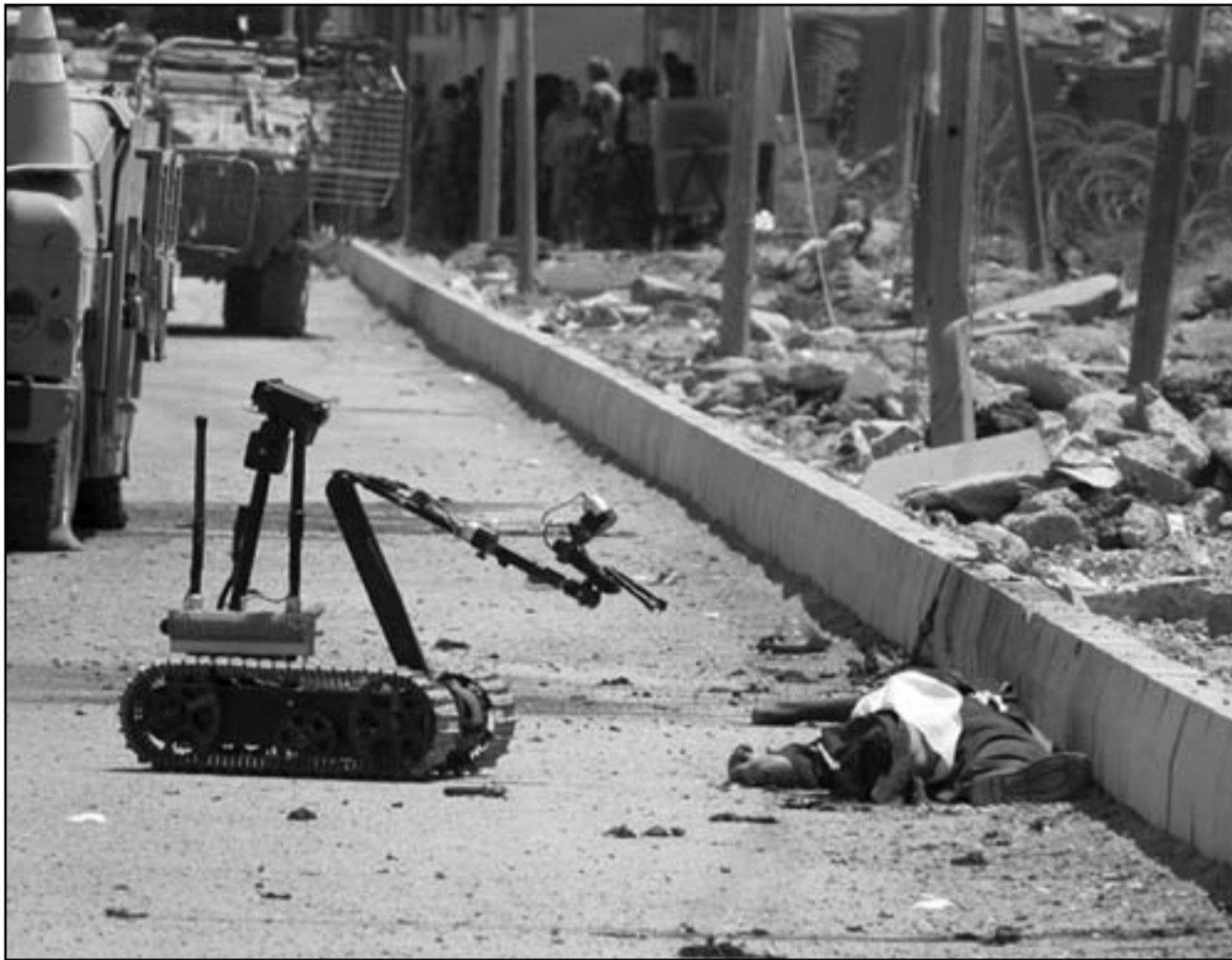
روبوت يقترب من اشلاء مهاجم انتحاري لفحصها بحثا عن متفجرات في ديالى امس (ا ف ب)

بغداد - «القدس العربي» - اشارت مصادر عراقية كندية الى ان مسعود البرزاني الذي غادر العراق في رحلة مفاجئة، هو الآن في واشنطن ليبحث ملف كركوك، وان الادارة الامريكيه هي التي قامت بدعوة رئيس اقليم كردستان مسعود البرزاني الى واشنطن من اجل احتواء الازمة وتطويقها، وضرورة اجراء انتخابات مجالس المحافظات في موعدا المحدد ومنها الدعوة لتقاسم السلطة في كركوك بالتساوي بين العرب والتركمان والاقلية الاخرى، وكان قد كشف السكرتير الاعلامي للبرزاني ان زيارة رئيس الاقليم هي للولايات المتحدة الأمريكية، ليلتقي كلا من رئيس الولايات المتحدة ووزير الدفاع الأمريكي اللذين طلبا حضور البرزاني بشأن مسألة تمرير قانون مجالس المحافظات في كركوك، كما سيعرض وزير الدفاع الأمريكي وروبرت غينس على البرزاني انسحاب قوات البشمركة من المحافظات التي تنتشر فيها خارج اقليم كردستان ومنها الموصل وكركوك وديالى وصلاح الدين والتي تثير مخاوف العرب والتركمان حول احتمال ضمها لاقليم كردستان.