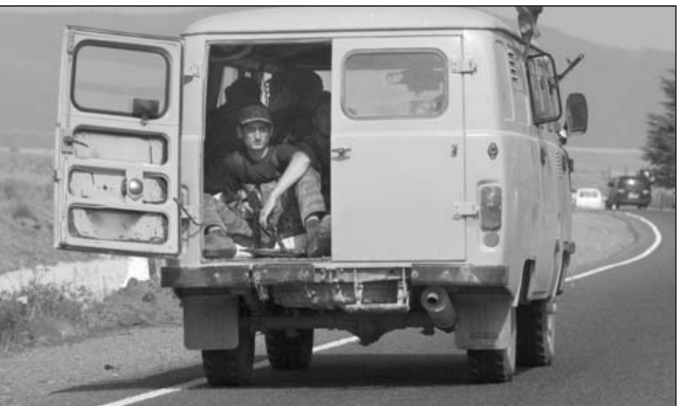
القوات الروسية تغادر مدينة غوري الجورجية أمس بعد انتهاء العمليات العسكرية

■ عاصم - وكالات: أعلنت هيئة اركان الجيوش الروسية خلال مؤتمر صحافي أمس الاربعاء سقوط 74 قتيلا و 171 جريحا و 19 مفقودا في صفوف القوات الروسية منذ بدء النزاع بين روسيا وجورجيا الجمعة. واعلن مساعد قائد هيئة اركان الروسية الجنرال اناتولي نوفو فوسين هذه الحصيلة خلال مؤتمره الصحافي اليومي. وكانت حصيلة سابقة اعلنها نوفو فوسين الاثنين افادت عن 18 قتيلا وازيد من 50 جريحا. من جهته اعلن وزير الخارجية الروسي سيرغي لافروف أمس ان التعزيزات العسكرية الروسية في جورجيا لن تسحب الا بعد عودة القوات الجورجية الى ثكناتها. وقال لافروف امام الصحافيين «بعد انسحاب القوات الجورجية الى ثكناتها، تعود (تعزيزات) القوات الروسية الى اراضي الاتحاد الروسي. وستبقى قواتنا لحفظ السلام في اوسيتيا الجنوبية..» وتنص خطة السلام التي طرحها الرئيس الفرنسي نيكولا ساركوزي ووافقت عليها تبيليسي وموسكو الثلاثاء، على عودة القوات العسكرية الجورجية الى مواقعها المعتادة وانسحاب القوات الروسية الى خطوط ما قبل بدء الاعمال الحربية. وتنشر روسيا منذ مطلع التسعينيات قوات حفظ سلام في اوسيتيا الجنوبية المنطقتين الانفصالية الجورجية الموالية لروسيا والتي تقع في صلب النزاع الحالي بين موسكو وتبيليسي. وتطالب موسكو الآن بابتعاد القوات الجورجية عن هذه المنطقة وعن ابخازيا، المنطقة الانفصالية الجورجية الثانية الموالية لروسيا. وشدد لافروف من جهة اخرى على ضرورة اعادة بحث «وضع» الاراضي الانفصالية في جورجيا على المستوى الدولي وهو مبدأ رفضته تبيليسي. وقال لافروف ان «وضع (المنطقتين الانفصاليتين) غير منكور، صراحة