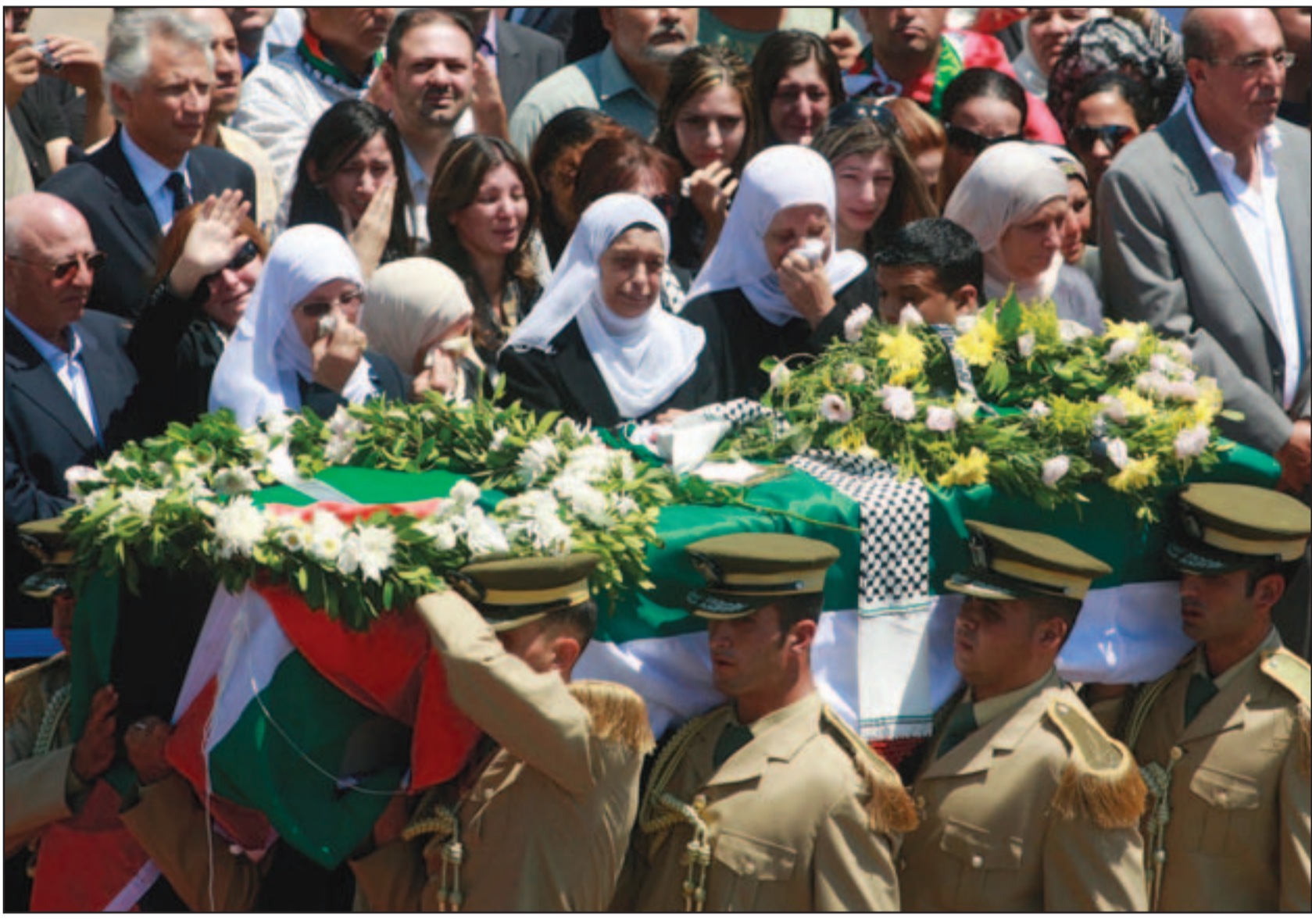
جثمان الشاعر العربي الكبير محمولا الى موأه الاخير وسط دموع المشيعين في رام الله

«تكلت فلسطين السليبية ملهما بين التوايح ذروة شماء»... لكن العدد الاكبر من المشيعين جاؤوا من منطقة 48 وتوجهوا من قرية الجديدة التي تعيش فيها عائلة الشاعر. واطلقت المدفعية احدى وعشرين طلقة عقب دفن الجثمان احتراماً وتقديراً للشاعر درويش. وادت ثلثة من حرس الشرف التحية امام النعش الذي لف بعلم فلسطيني وحمله ثمانية ضباط. وبعد ذلك وضع الجثمان في قاعة قام الرئيس الفلسطيني فيها براءة الشاعر الراحل الذي كان يجسد تطلعات شعبه الى الاستقلال ويريوي آلامه التي ولدتها النزوح والاحتلال. واكد عباس «ستظل معنا يا محمود لانك تركت لنا ما يجعلنا نقول لك الى اللقاء وليس الوداع».