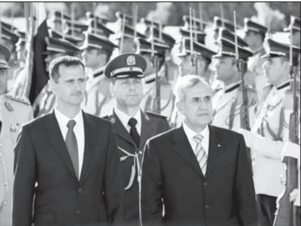
الرئيس السوري بشار الاسد مستقبلا الرئيس اللبناني ميشيل سليمان في دمشق امس

وقال مسؤول لبناني (فضل عدم الكشف عن اسمه) ان قمة سليمان والاسد ستناقش خمس قضايا رئيسية على رأسها اقامة علاقات دبلوماسية بين بيروت ودمشق، وفتح سفارتين في البلدين للمرة الاولى منذ تحررها من الاحتلال الفرنسي قبل أكثر من ستين عاما. ومن المنتظر أن تناقش القمة أيضا ترسيم الحدود بين البلدين ومزارع شعبا التي تحتلها إسرائيل على أنها أرض سورية تابعة للجولان المحتل، في حين يؤكد البلدان لبنانيتهما، وعلى جدول أعمال القمة أيضا مراقبة الحدود اللبنانية السورية وما يسمى تهريب السلاح إلى لبنان، وكذلك ملف المفقودين والمعتقلين اللبنانيين والسوريين في سجون البلدين.