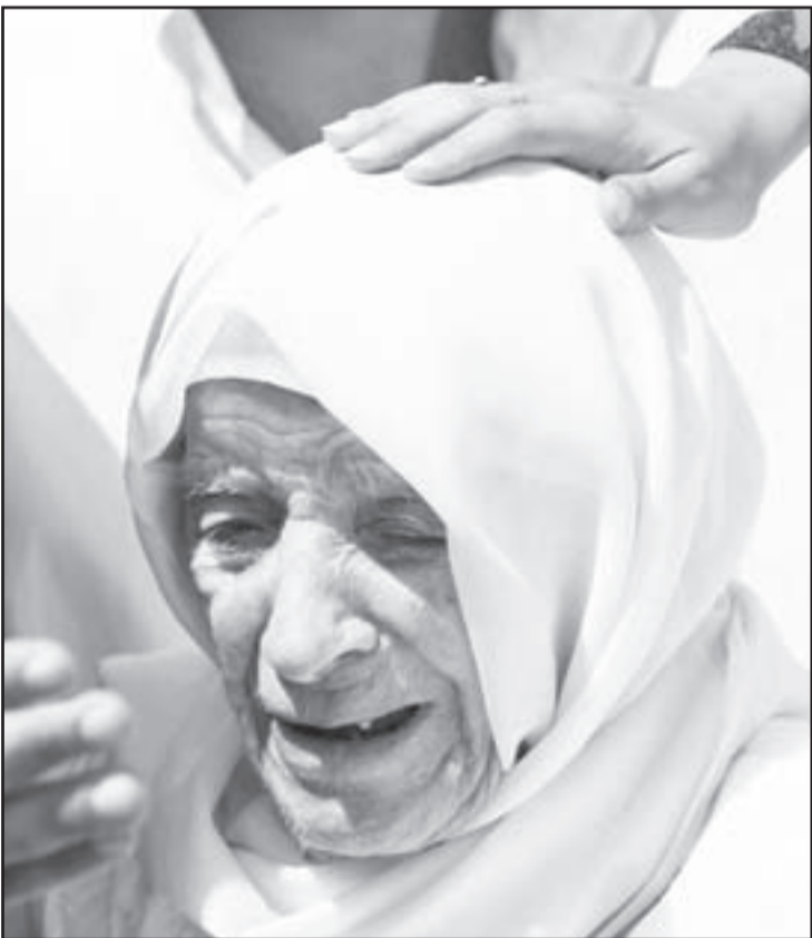
الحاجة حورية والدة محمود درويش تودع جثمان ابنها في رام الله