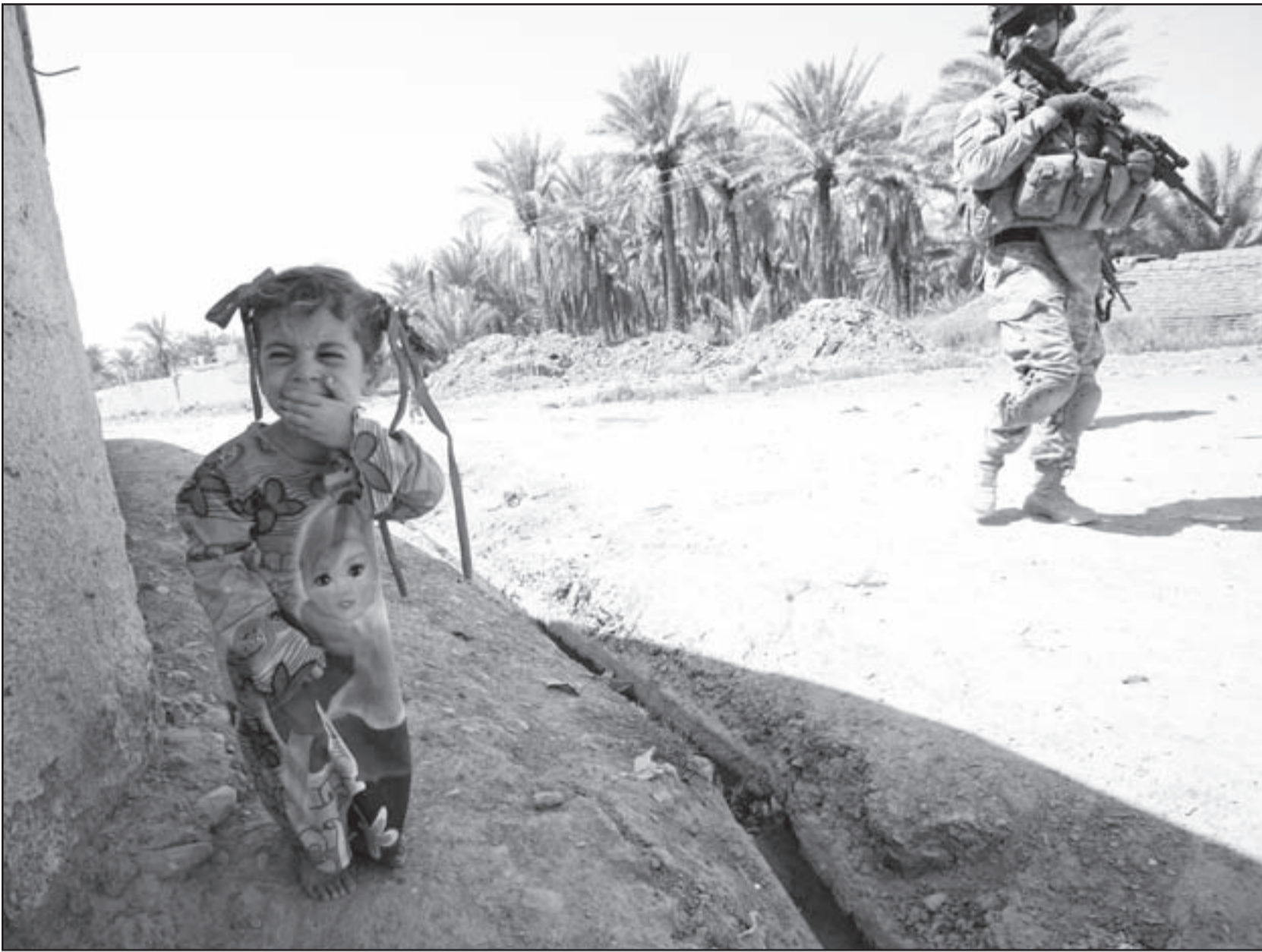
جندى امريكي يسير الى جانب طفلة عراقية تبكي ذعرا في محافظة ديالى