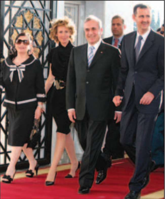
دمشق - بيروت «القدس العربي»:

اعلنت مسؤولة سورية رفيعة المستوى مساء الاربعة ان المحادثات بين الرئيسين اللبناني ميشال سليمان والسوري بشار الاسد اسفرت عن الاتفاق على تبادل العلاقات الدبلوماسية على مستوى السفارة على ان يبدأ «من تاريخه» بحث الاجراءات التنفيذية. وتلت الاستشارة السياسية للرئيس السوري بثينة شعبان على الصحافيين بيانها بعنوان «اعلان خاص لاقامة العلاقات الدبلوماسية بين لبنان وسورية في اطار تعزيز العلاقات الاخوية بين البلدين الشقيقين».