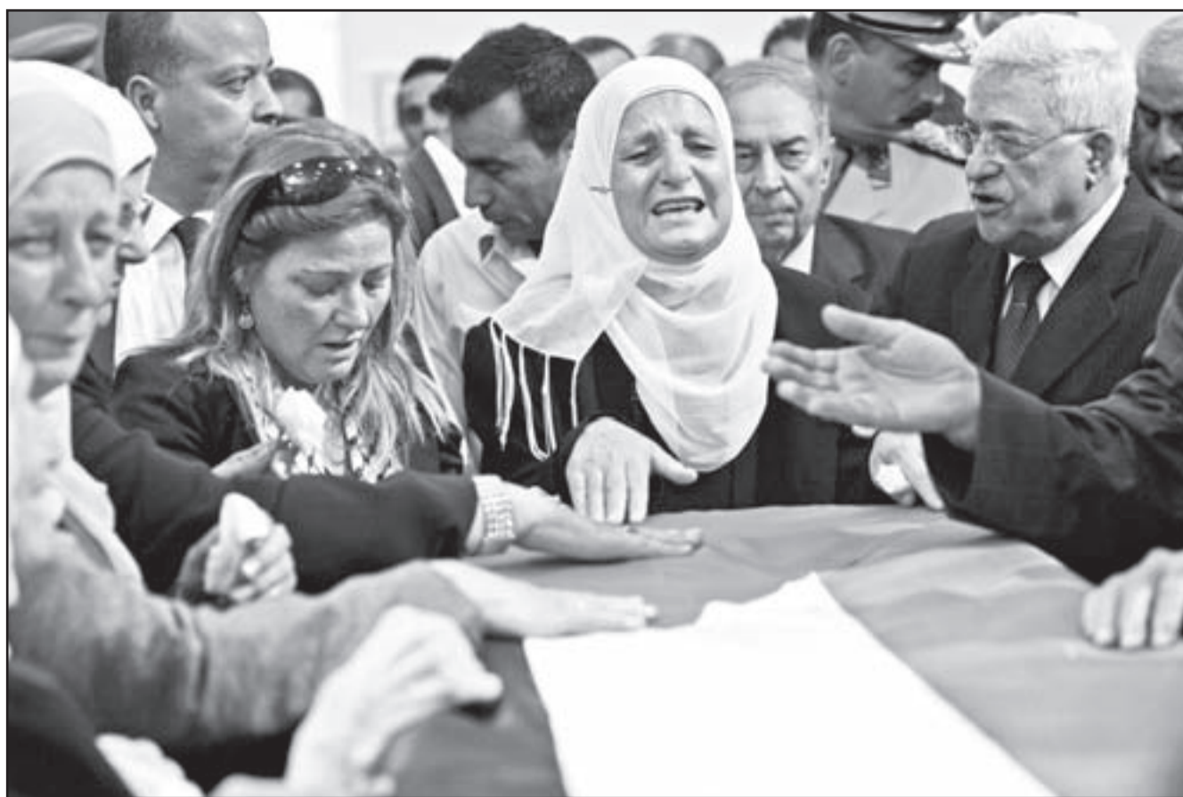
الرئيس الفلسطيني محمود عباس (يمين) وعائلة الفقيد يلقون عليه النظرة الأخيرة في رام الله أمس

اعلام سورية وذلك على بعد عشرات الامتار من وصول الجثمان الى مرقده الاخير في حين غابت اعلام الفصائل الفلسطينية. ولا بد من الذكر ان حضور الفلسطينيين من الاراضي المحتلة عام 1948 كان واسعاً في حين لوحظ غياب ممثلين عن حركة حماس والجهاد الاسلامي عن الجنازة.