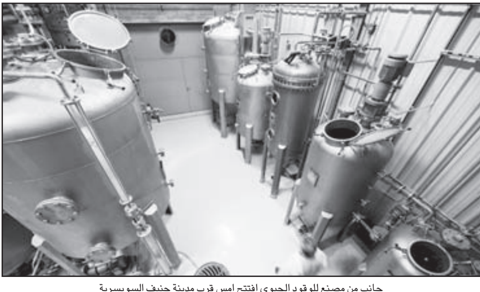
جانب من مصنع للوقود الحيوي افتتح أمس قرب مدينة جنيف السويسرية

ويخفض الاستهلاك الخاص الذي يمثل نحو 55 بالمئة من الاقتصاد الياباني 0.5 بالمئة في الربع الثاني بعد زيادات طرأ على أسعار الغذاء والبيززين أضرت بمعنويات المستهلكين بعدما دفع ضعف الأجور التسوقيين إلى الحد من الانفاق. وكان هذا أول انخفاض في نحو عامين. كما انخفض ائفاق الشركات وهو محرك آخر للنمو في اليابان في السنوات الأخيرة بنسبة 0.2 بالمئة للربع الثاني على التوالي.