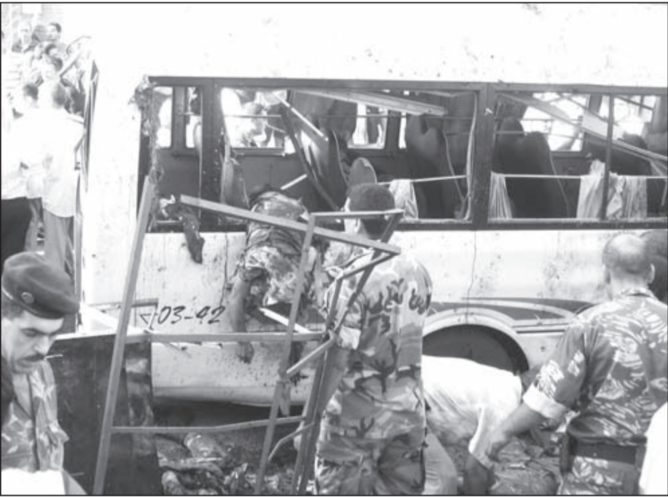
جنود من الجيش اللبناني يقومون بنقل جثث ضحايا تفجير الباص في طرابلس امس

وقال مصدر رسمي في وزارة الخارجية السورية في تصريح امس سورية «تدين بشدة العمل الاجرامي المروع» الذي وقع في طرابلس و«ذهب ضحيته عدد كبير من المواطنين الابرياء». واكد المصدر تضامن سورية مع لبنان الشقيق في مواجهة كل الالبي الذي تعبت بامتة واستقراره».