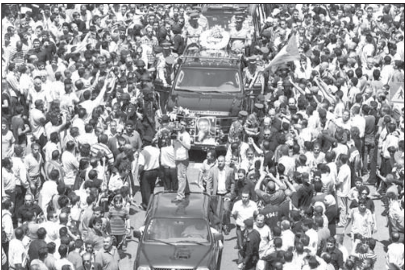
جانب من جنازة محمود درويش