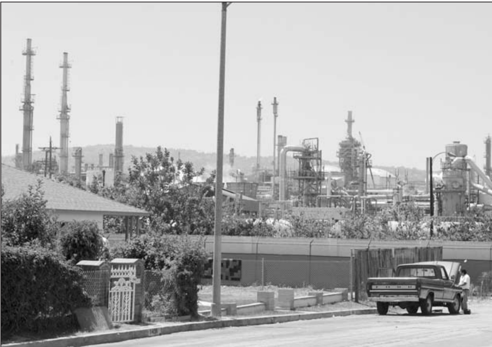
مصفاة لتكرير النفط في كاليفورنيا بأمریکا

عند مستوى 950 ألف برميل يوميا في العام المقبل. وقالت أوبك أن الطلب على خامها من المتوقع أن يبلغ في المتوسط 32.05 مليون برميل يوميا في عام 2008 أي أقل من إنتاج المنظمة في يوليو البالغ 32.64 مليون برميل يوميا. وقال التقرير مع ارتفاع إنتاج أوبك الراهن عن الطلب المتوقع لخامها هناك امكانية لزيادة كبيرة في مخزونات الخام».