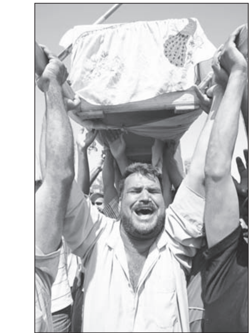
من تشجيع ضحايا الهجوم على زوار كربلاء الجمعة

ان القوى التي جاء بها المحتل تمثل أسوأ توليفة تؤول لمصلحها في العالم فلاهي من جنوب أوروبا ولاهي منتمية إلى وسط وشمال أوروبا ولاهي أصلا تنتمي إلى شمال الاطلسي وإنما هي ديمقراطية لتفكيك مجتم السنيين من بين الديمقراطيات في العالم لتطبيقه على أبناء العراق باسم الديمقراطية والحرية والعدالة والسواوة وغير ذلك مما يندرج تحت العناوين