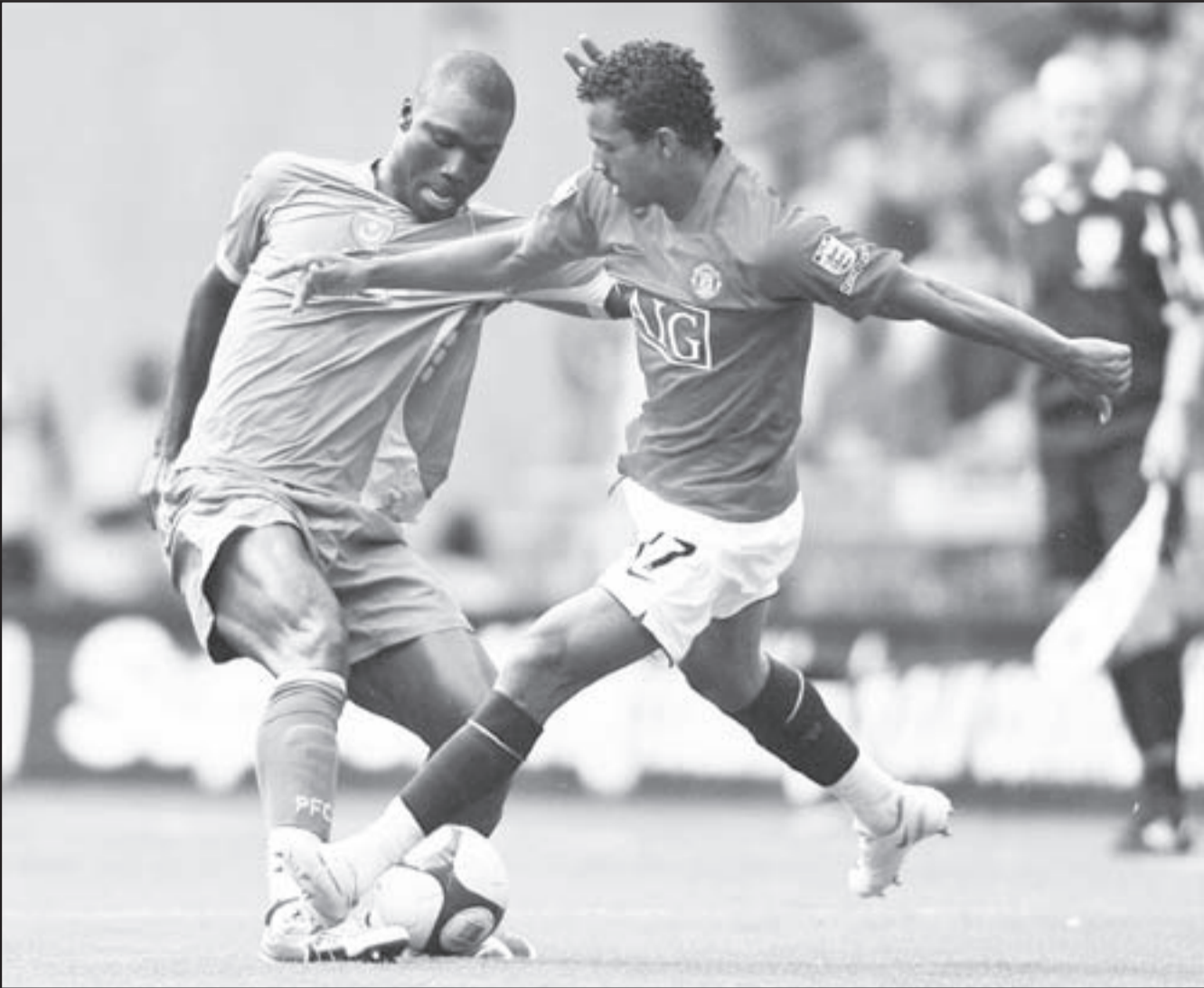
مانشستر يونايتد خلال إحدى المباريات

ضم الأرجنتيني فابريسيو كولوتشيني مدافع ديورتيغو كورونا الإسباني إلى صفوفه، وقال نيوكاسل بموقعه على الإنترنت إنه ضم كولوتشيني على مدافع المنتخب الأرجنتيني (26 عاما) مدافع المنتخب الأرجنتيني بناء على عقد لمدة خمس سنوات دون الإفصاح عن المقابل المالي للصفقة، وكولوتشيني هو ثالث لاعب ينضم لنيوكاسل قبل بداية الموسم الجديد بعد مواطنه الأرجنتيني يونايس جوتيريز المنتقل من ريال مايوركا وداني جوتري المنضم من ليفربول. ويستهل نيوكاسل الموسم الجديد بمواجهة صعبة خارج أرضه أمام مانشستر يونايتد بطل الدوري يوم الأحد المقبل. وبدا كولوتشيني مشواره مع كرة القدم في بوكا جونيورز ورغم توقيعه عقدا مع ميلانو الإيطالي عام 1999 استمر لخمس سنوات على التوالي إلا أن الإجراء ما بين الأرجنتين وإسبانيا قبل أن ينضم لديورتيغو عام 2004.