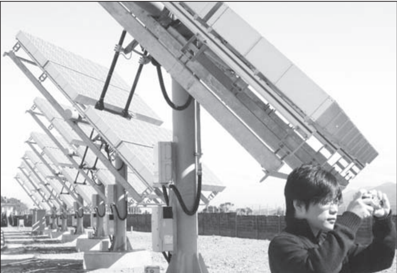
محطة تجريبية للطاقة الشمسية في تايوان التي طور معهد الأبحاث النووية فيها تكنولوجيا جديدة ترفع كفاءة اللواقح المحتوية على الخلايا التي تحول الطاقة الشمسية إلى كهرباء.

خلايا شمسية تكون مساحتها معقولة ولا تجعل شكل السيارة يبدو كمشخ ميكانيكي.