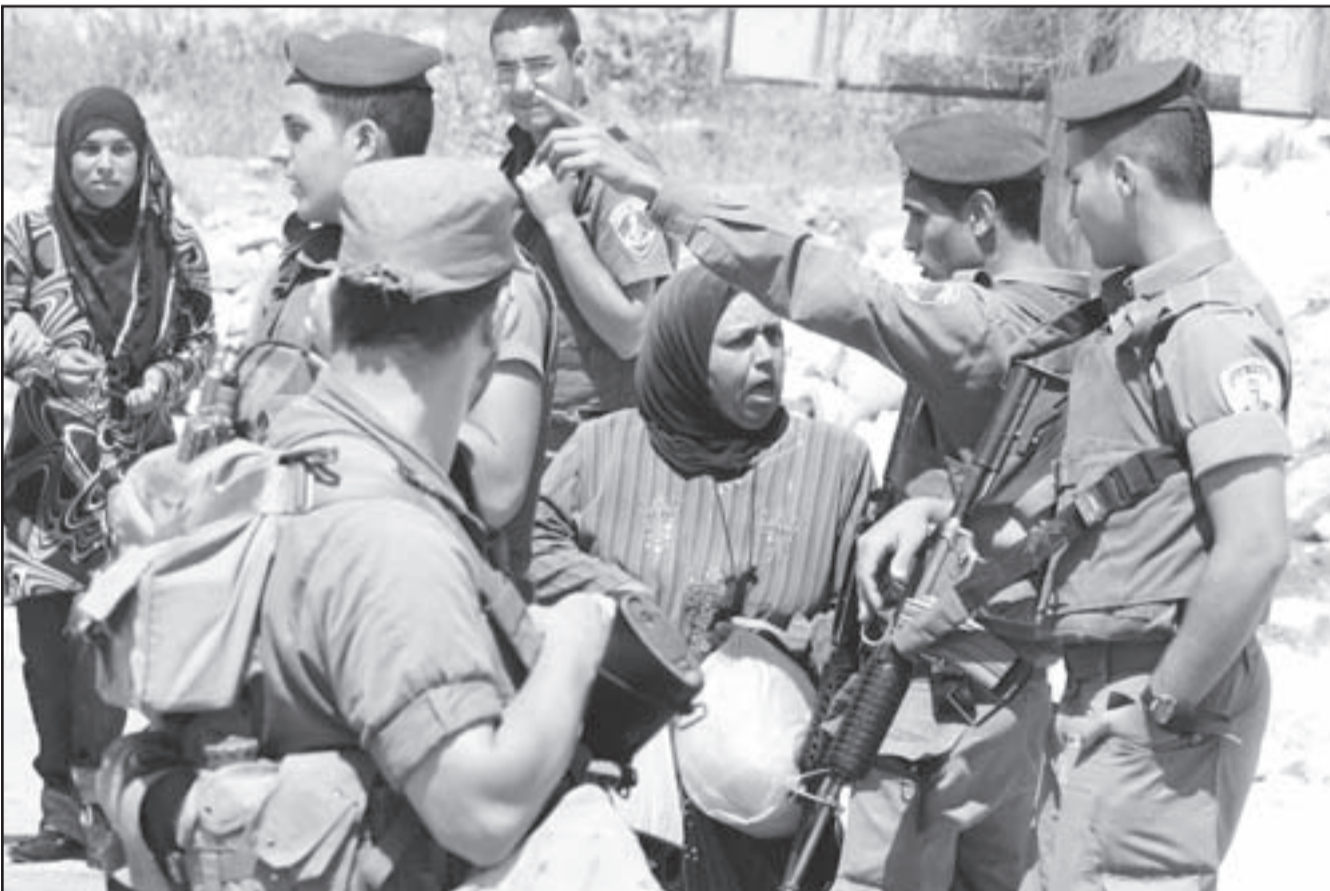
سيدة فلسطينية تصرخ في وجه جنود اسراييليين خلال تظاهرة احتجاجا على الجدار العازل في قرية معصرة في الضفة الغربية