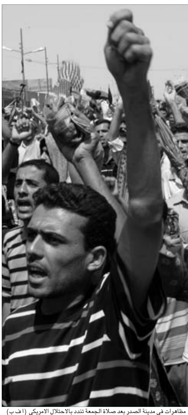
مظاهرات في مدينة الصدر بعد صلاة الجمعة تندد بالاحتلال الامريكي

وبذلك، يرتفع الى 4141 عدد العسكريين والعاملين مع الجيش الامريكي الذين قتلوا في العراق منذ اجتاح ربيع العام 2003 وفقا لارقام موقع الكرونيو مستقل.