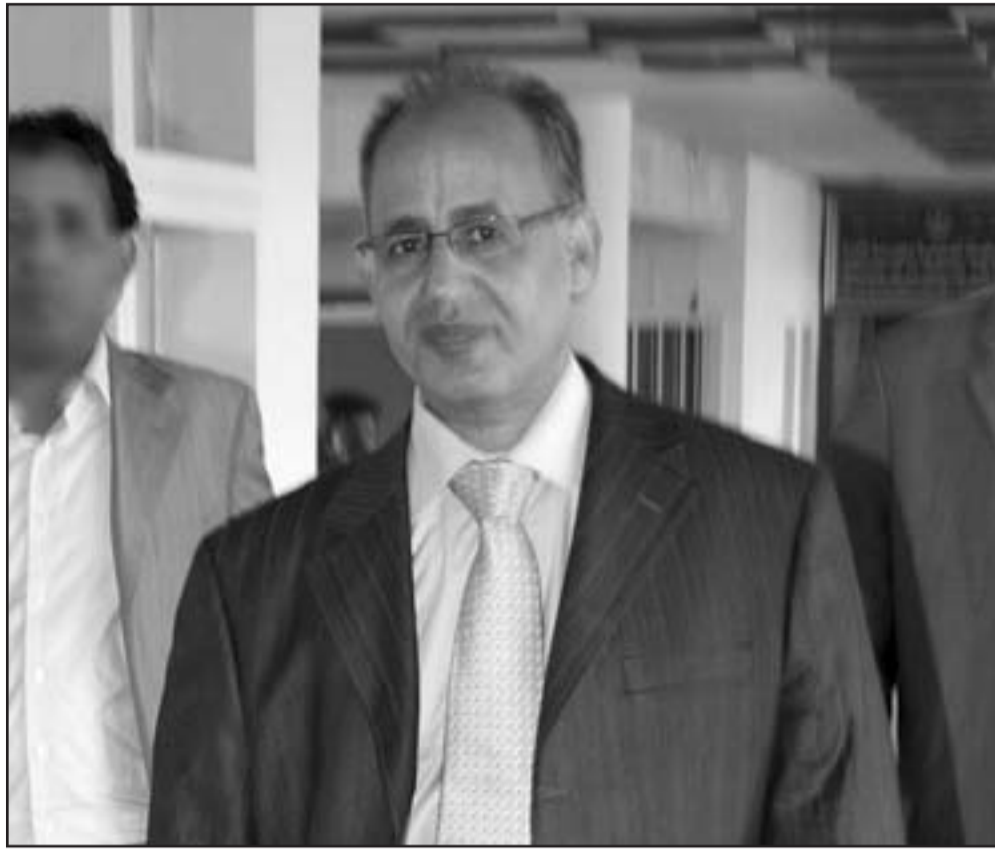
الوزير الاول الموريتاني الجديد، مولاي ولد محمد الأعظم، الجمعة بنواكشوط