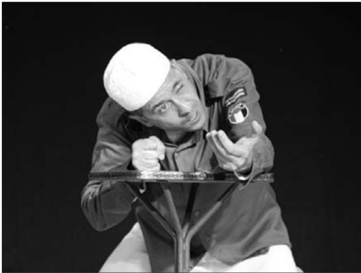
مشهد من المسرحية