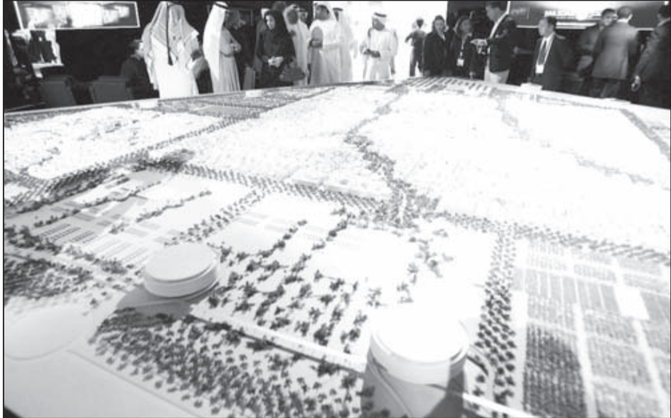
مسؤولون اماراتيون وزوار بيئالعملون في مجسم مدينة المصدر التي ستقام في ابو ظبي لتكون اول مدينة بالعالم لا تنتقل منها انبعاثات غازية كربونية لاعتمادها على مصادر الطاقة المتجددة وخاصة الشمسية.

ان عهدا جديدا للطاقة الشمسية يقترّب. فبعد زمن طويل من التشكك والتشكك اعتبرت فيه الطاقة الشمسية غير اقتصادية، تحسّن التقنيات وتزاد جاذبية هذا المصدر مع كل ارتفاع الاخرى. فخلال ما بين ثلاث وسبع سنون فان كلفة الطاقة الكهربائية المولدة من ضوء الشمس ستصبح في بعض الاسواق، مثل ولاية كاليفورنيا وايطالية، مساوية لكلفة الكهرباء المولدة من طرق الوقود الاحفوري (فحم وغاز ونظف) او من مصادر الطاقة البديلة الاخرى. وبحلول عام