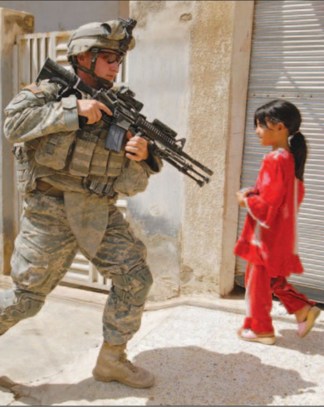
جندي أمريكي موجه سلاحه نحو طفلة عراقية الجمعة