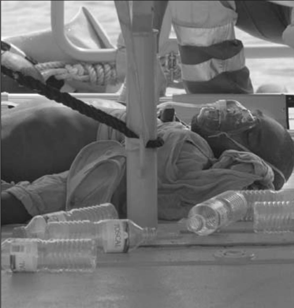
مهاجرون افارقة يتلقون الاسعافات بأحد مرافق جزر الخالدات التي وصلوها مساء الخميس في حالة يرثى لها

حقوق الانسان ومشرعين بالاتحاد الأوروبي. وفي وقت سابق من الشهر الحالي أرسلت الحكومة 3000 جندي إلى مدن إيطالية لمساعدة الشرطة في مكافحة الجريمة التي يلقى بالوم فيها على نطاق واسع على المهاجرين. وقال ماروني إنه من بين 37 شخصا اعتقلوا منذ نشر جنود الجيش في الرابع من آب (أغسطس) كان هناك 33 من غير مواطني الاتحاد الأوروبي. لكنه قال إن عدد الجرائم الجنائية في إيطاليا انخفض في الشهور الأخيرة. ولم يعط إحصائيات وقال إنه يريد تقييم ما إذا كانت سياسات الحكومة قد ساهمت في الانخفاض.