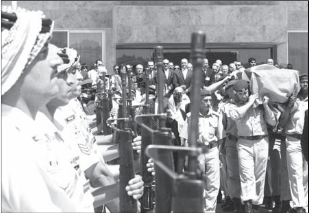
قوات حرس البادية الأردنية اثناء نقل جثمان الفقيد محمود درويش

ضيق الأفق في النقد وتعرض الكاتب جميل النمرى مجدداً للحديث عن أهمية العودة لربيع الإصلاح السياسي عبر إعادة فتح ملف قانون الإنتخاب قبل ظهور تقارير في الإعلام الإلكتروني عن قضية مرفوعة من شركة أمريكية ضد الحكومة الأردنية في القضاء الأمريكي تطالب فيها الشرطة بتعويض يصل إلى 70 مليون دولار بعد إلغاء الجانب الأردني لعقد معها له علاقة بالتحقيق عن النقط في منطقة قريبة من البحر الميت.