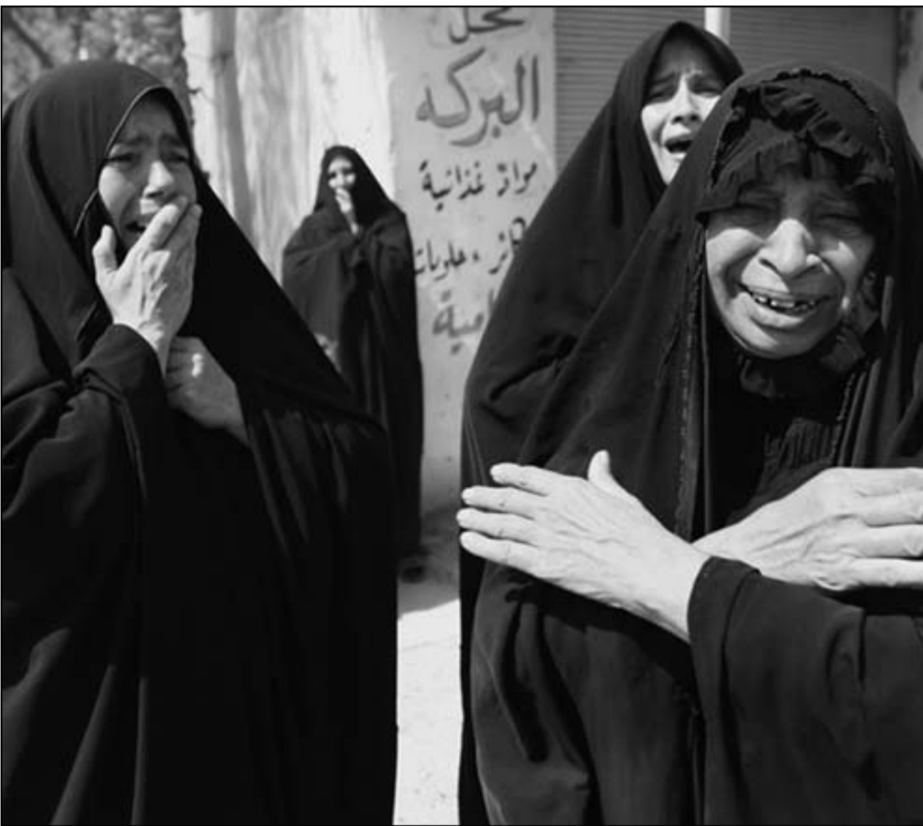
سيدات عراقيات يبينن ضحايا الهجمات على زوار كربلاء الجمعة