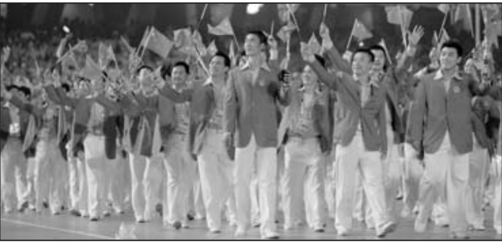
8-8 موعد ليزوع نجم دولتين عظميين

المطاف لم يقف في وجههم، رئيس رفع راية حشوق الانسان والديمقراطية مترفعة. لذلك ملتما قامت المانيا برزعة النظام والاستقرار الاوروبي القديم من قبل ظهور هتلر تقوم روسيا الان بزرعة النظام الاوروبي الجديد. عهد بوش لم يصل وحده الى نهايته في هذا الاسبوع بل عقدا ان اخران كانت فيها امريكا دولة عظمى وحيدة. انتهى عهد الفاكس - امريكا الذي قام الاستقرار العالني عليه في الجيل الاخير. آثار ذلك ستلتم سجيلا وقيل كل شي في الشرق الرئيس ميخائيل سكتشفيلي ارتكب حماقة، مثل الاسرائيلي ذي الراس