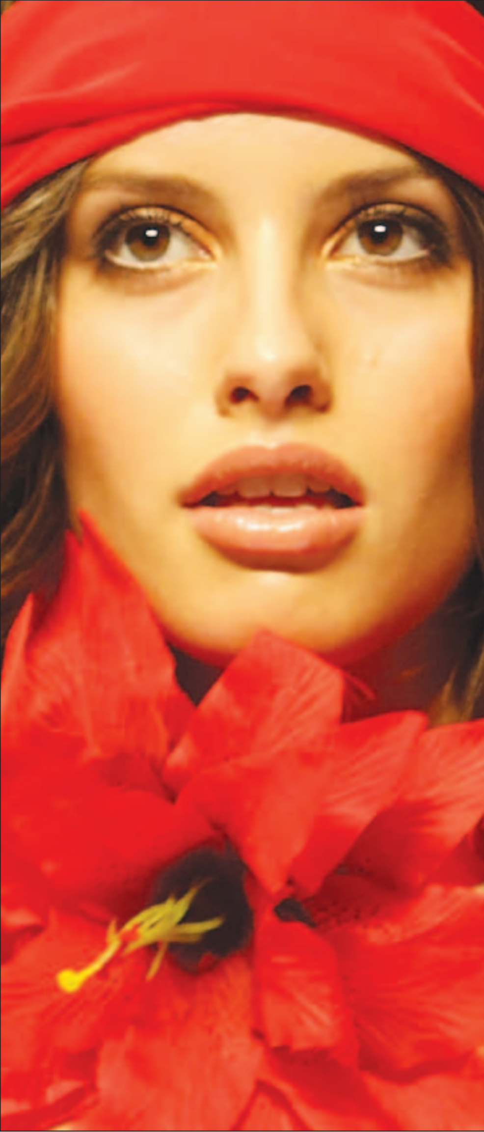
خلال اسبوع الازياء الاسترالية في سيدني، قدم هذا التصميم

لا يمكن أن يبقى خبزها طازجاً، بعد أن دفن الناس شاعرهم ودفنت ابنتها، لكنها نثرت فوقه حفنة من تراب اللجليل الأحن عليه من أي تراب، وكتبت بذلك قصيدتها الأخيرة.