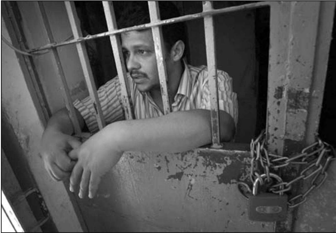
معتل عراقي في قسم للشرطة في محافظة ديالى