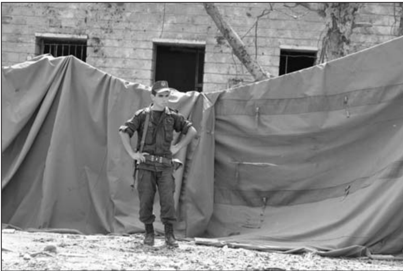
أحد مستخدمي فرق الاغاثة يجمع أغراض الضحايا.. وفي الصورة الثانية دركي شاب خارج أسوار المدرسة التي حُجبت عن أنظار المارة والفضوليين