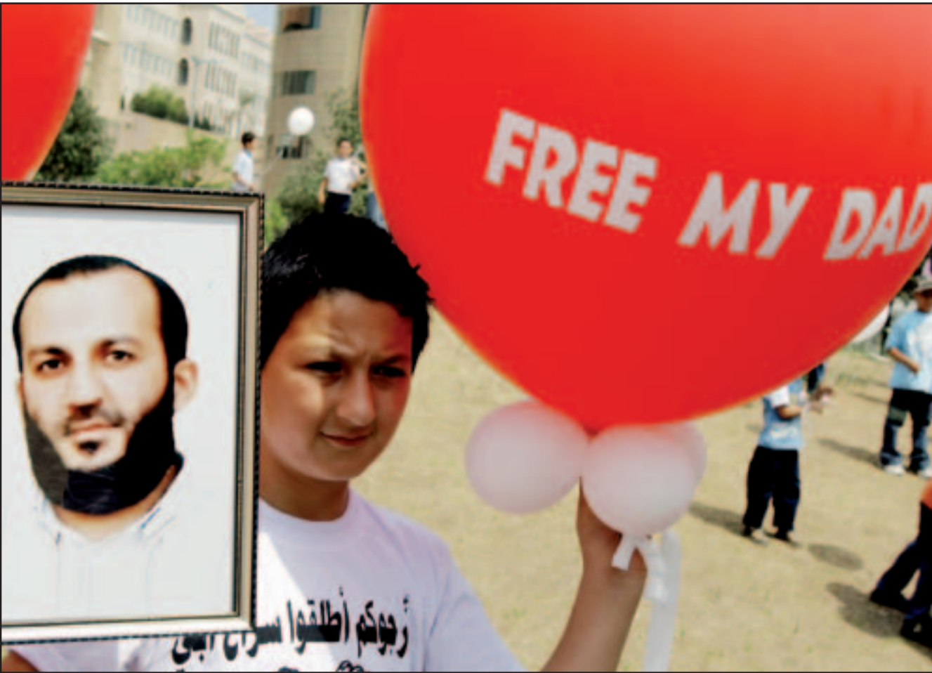
طفل لبناني يشارك باعتماد للمطالبة باطلاق سراح والده المعتقل بتهمة الانتماء لجماعة جيش الاسلام

من تعاون ودعم من العراق بما يساعده على مواجهة الضغوط التي تتسبب بها الارتفاعات الكبيرة في أسعار النفط العالمية على الخزينته، زيادة التبادل التجاري بين البلدين. ويرافق الرئيس السيورة وفد وزاري، مؤلف من الوزراء: الخارجية فوزي صلوح، الإعلام طارق متري، والناية محمد شطح، شؤون التنمية الإدارية إبراهيم شمس الدين. وقد رفضت مصادر السراي الحكومي الرد امس على ما طرحه رئيس كتل التغيير والاصلاح، النائب ميشال عون امس حول صلاحيات نائب رئيس الحكومة اللواء عصام اجمره المقرب منه وضرورة ترؤسه جلسات مجلس الوزراء في غياب السيورة كما حصل ايام رئيس الحكومة الراحل صائب سلام وان يكون له مقر في السراي الحكومي، واكتفت هذه المصادر بالقول إن «التيار الوطني الممثل بالحكومة وبالتالي فليطرح وزراً وهذا الأمر على مجلس الوزراء لكي يتم درسه».