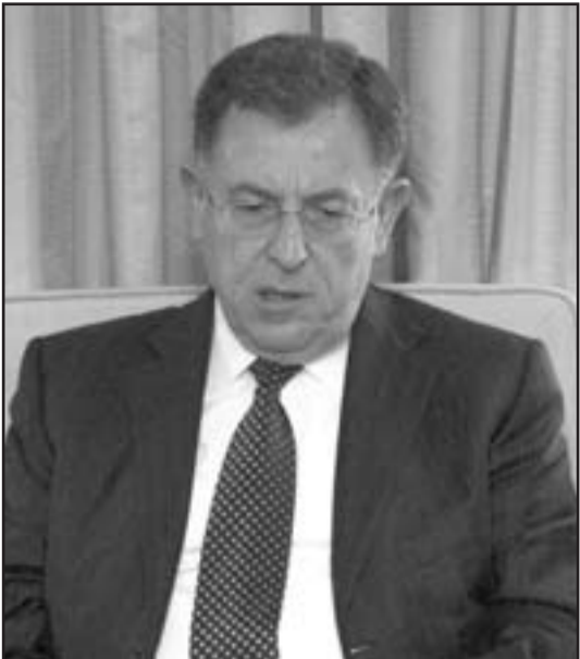
السنيرة في موقع مواز لساكاشفيلي

سورية ولبنان والفلسطينيين. الماضي العسكري المعتبر الذي يتمتع به يهود باراك يوفر له امتيازاً في المناقشة حول الهاتف الاحمر في الثالثة فجراً. مقابل تجربة المناصى تفيد بأنه عندما يتوجب على رئيس الوزراء ان يتخذ قرارات سياسية ذات آثار امنية، لا تكون تجربته العسكرية ذات صلة. رئيس شعبة الاستخبارات العسكرية الاسبق اللواء احتياط اوري سغيبه قال في مقابلة مع «هارتس» في تموز (يوليو) 2006 ان اسرائيل قد ضعبت في عام 2000 فرصة نادرة للتوقيع على اتفاق سلام مع سورية يحافظ الاعدس. هو يأسف لانهم يشكّلون عنادا لجان تحقيق فقط للتحقق من الاخفاقات العسكرية وتصاهلون الاخفاقات السياسية، ويتجاهلون ان الاتفاق مع سورية نجح في السابق- اية جدوى مفكر براغماتي مثل البروفيسور سري