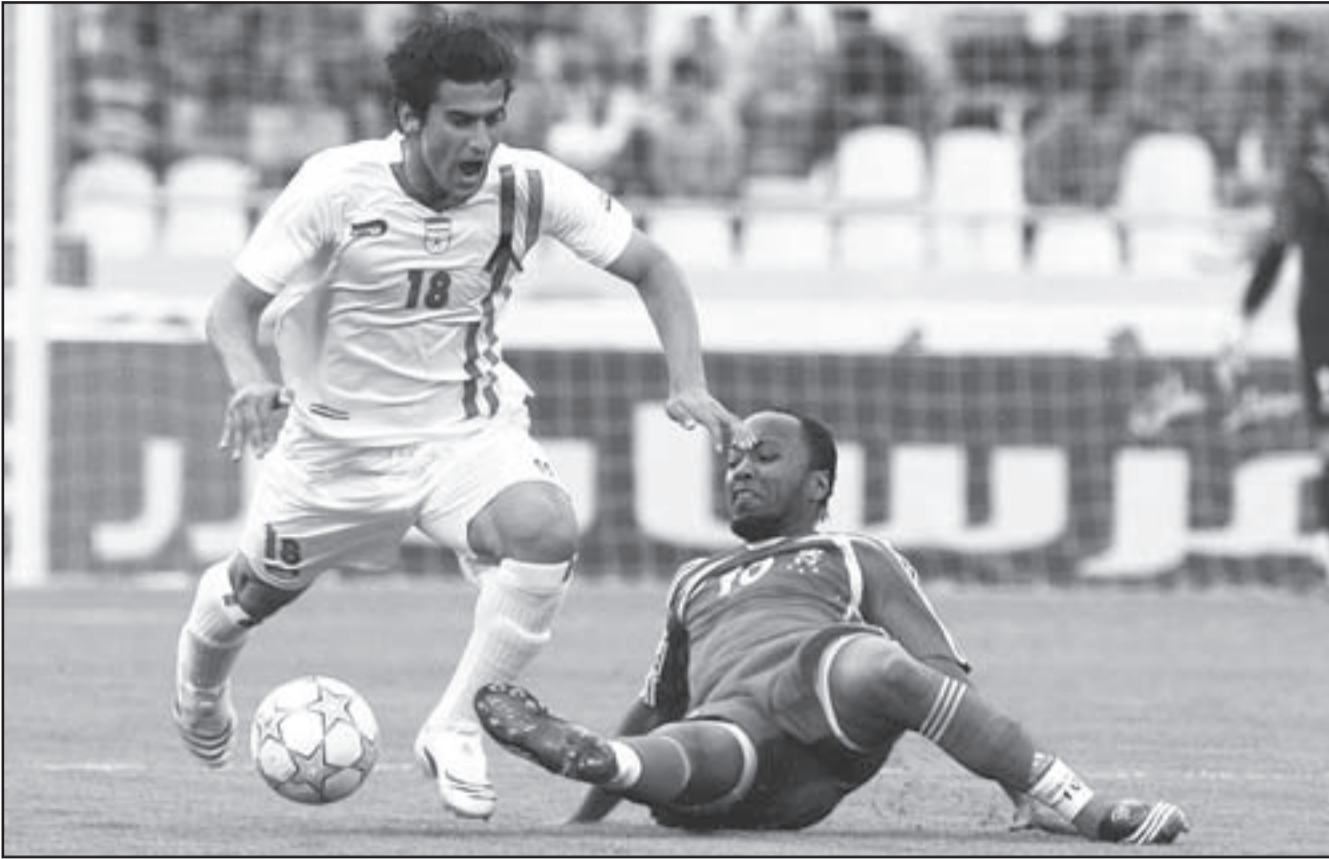
منتخب الامارات خلال احدى المباريات مع منتخب ايران