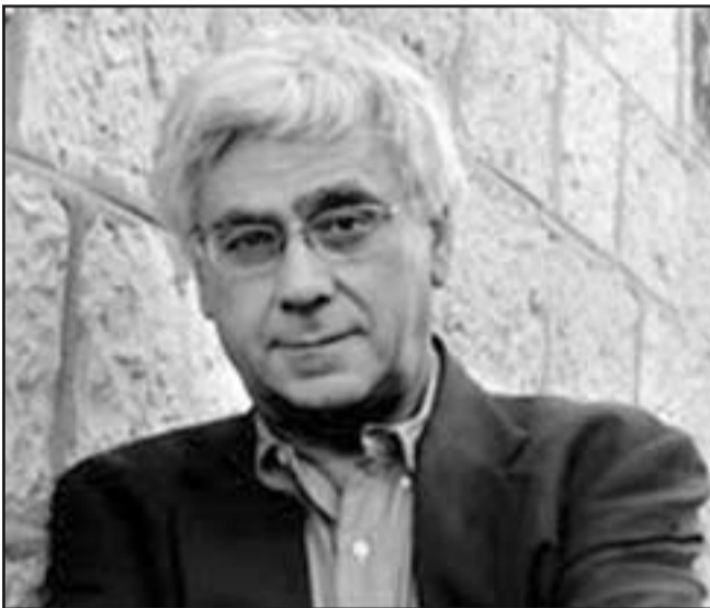
دعوة سري نسبية تهديد مستقبل إسرائيل

سورية ولبنان والفلسطينيين. الماضي العسكري المعتبر الذي يتمتع به يهود باراك يوفر له امتيازاً في المناقشة حول الهاتف الاحمر في الثالثة فجراً. مقابل تجربة المناصى تفيد بأنه عندما يتوجب على رئيس الوزراء ان يتخذ قرارات سياسية ذات آثار امنية، لا تكون تجربته العسكرية ذات صلة. رئيس شعبة الاستخبارات العسكرية الاسبق اللواء احتياط اوري سغيبه قال في مقابلة مع «هارتس» في تموز (يوليو) 2006 ان اسرائيل قد ضعبت في عام 2000 فرصة نادرة للتوقيع على اتفاق سلام مع سورية يحافظ الاعدس. هو يأسف لانهم يشكّلون عنادا لجان تحقيق فقط للتحقق من الاخفاقات العسكرية وتصاهلون الاخفاقات السياسية، ويتجاهلون ان الاتفاق مع سورية نجح في السابق- اية جدوى مفكر براغماتي مثل البروفيسور سري