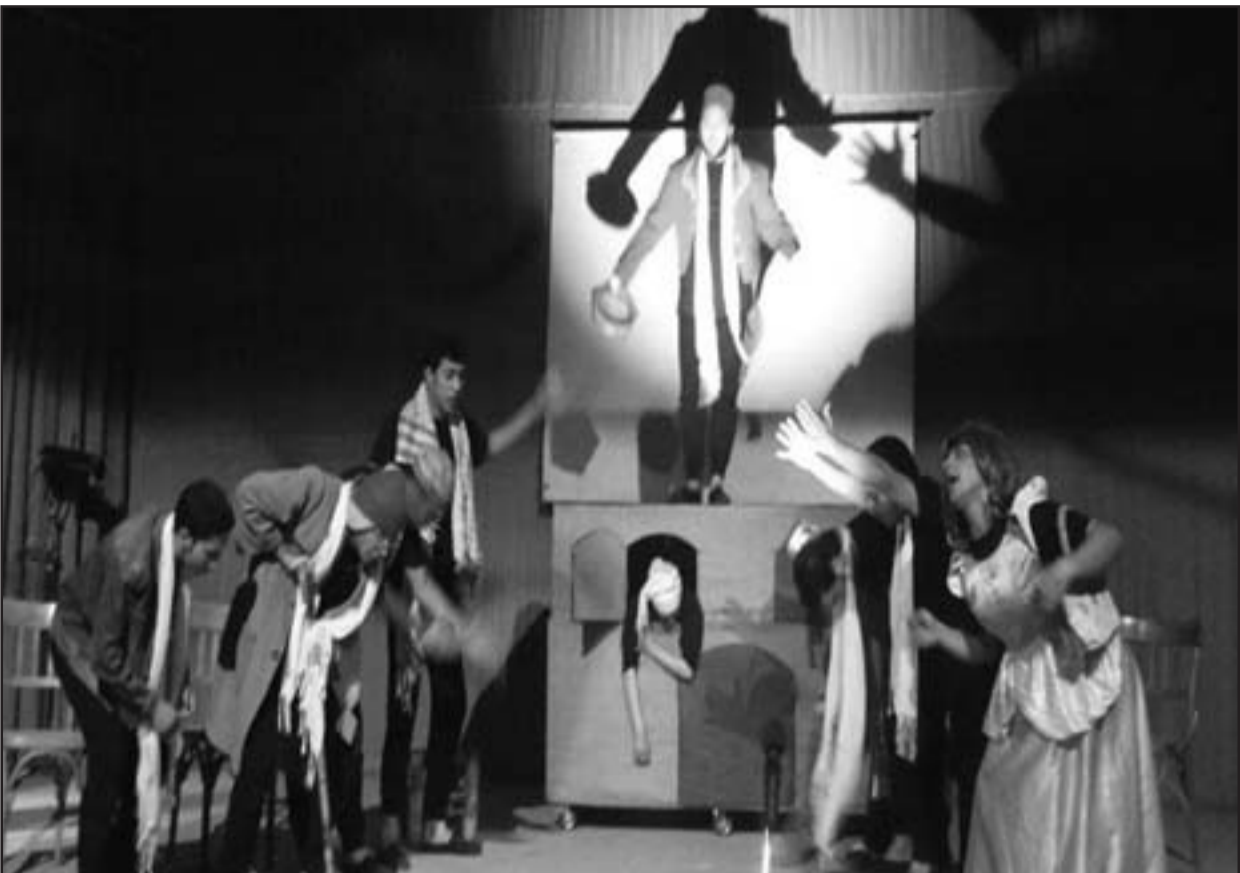
مشهد من مسرحية «المهراج»

انطلق مهرجان محمد الماغوط المسرحي الثاني في السلمية مؤكدا حضوره ضمن زحمة مهرجانات توزعت في العديد من محافظات القطر ومدته، دون أن تنجح في إخراج المسرح السوري من إشكالاته المزمنة، وهو ما يمتنع من تجاهل ذلك الإصرار العنيد على متابعة اللعبة باعتبارها من أخطر الألعاب التي اكتشفها الإنسان، ليس لأن المسرح فن راق فحسب، بل لأنه فن يموّج قراطي أيضا، فهو الفن الوحيد الذي يقوم على الحوار، بل ويعلمنا الحوار أيضا.