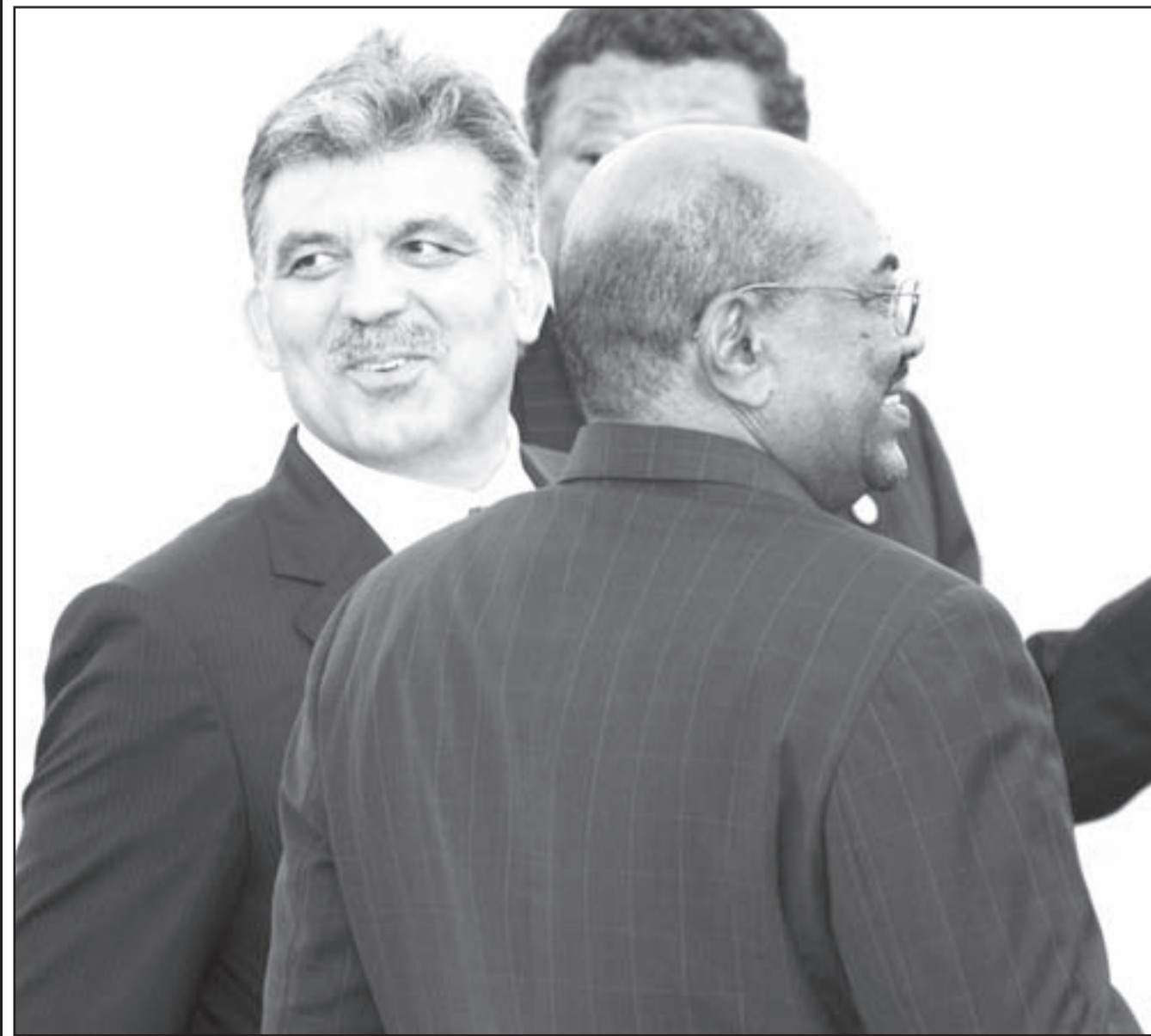
الرئيس السوداني عمر البشير مع نظيره التركي عبدالله غول في اسطنبول امس

ولفت البيان الى ان قضية مذبحه بورتسودان امر لا يمكن ان يغمره الزمن مطالبا بحاسبة المسؤولين فيها الى جانب تعويض اسر الضحايا.