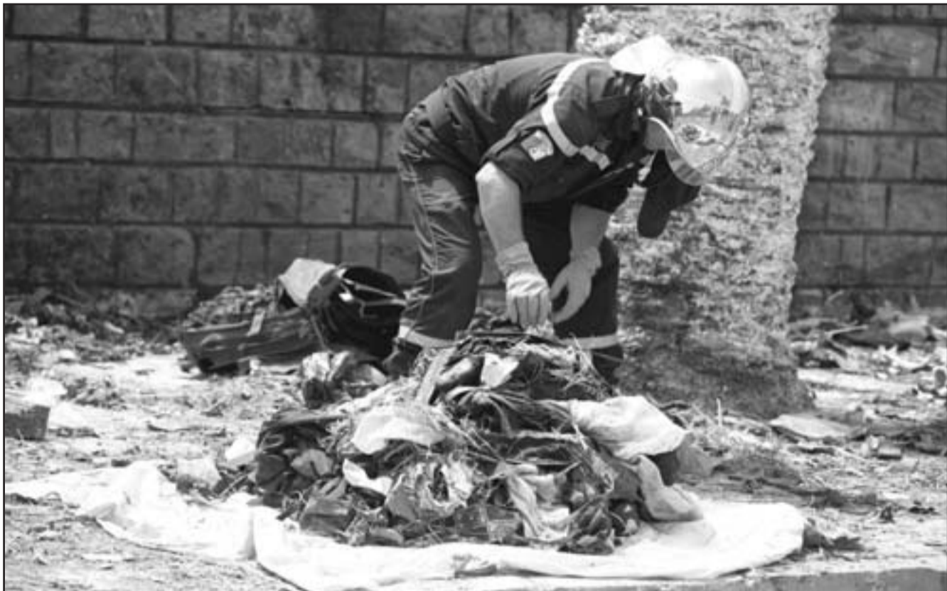
أحد مستخدمي فرق الاغاثة يجمع أغراض الضحايا.. وفي الصورة الثانية دركي شاب خارج أسوار المدرسة التي حُجبت عن أنظار المارة والفضوليين