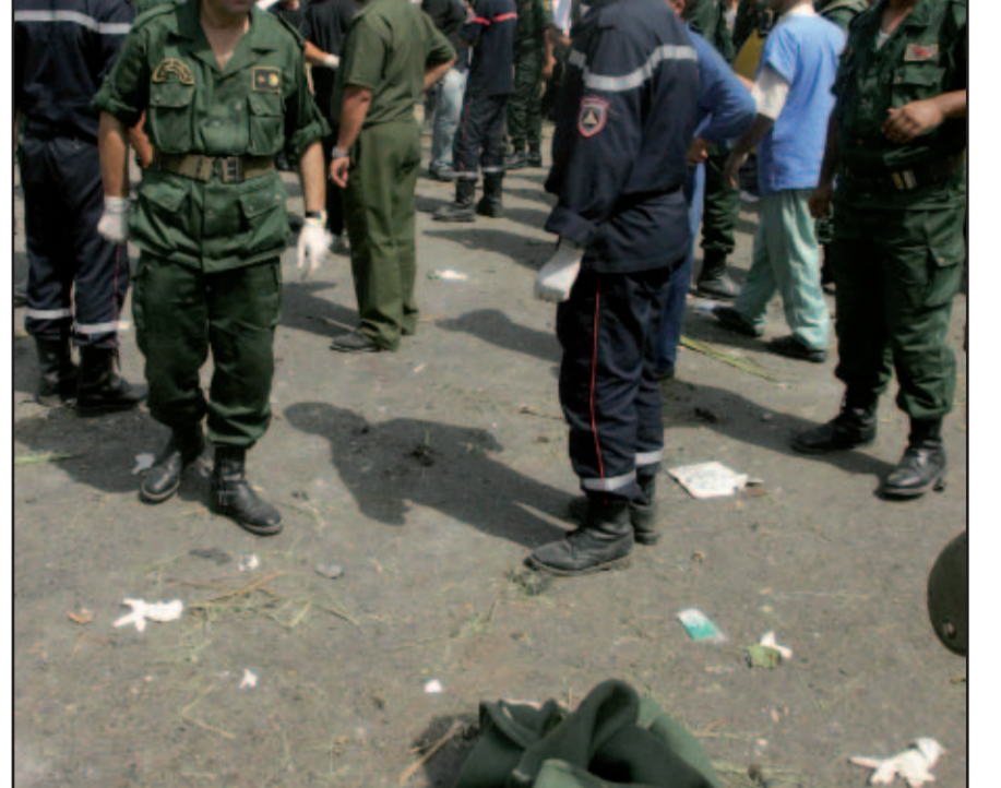
مسؤولون عسكريون يتحققون مكان التفجير في الجزائر أمس

وقد سادت حالة من الاستياء والحزن في العاصمة الجزائر منذ انتشار الخبر صباحا وطيلة النهار. والى غاية مساء أمس لم تبين أية جهة الهجوم