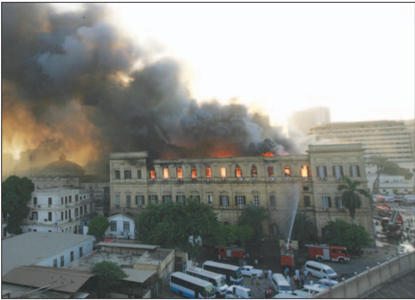
الدخان يتصاعد من مبنى مجلس الشورى في وسط القاهرة أمس