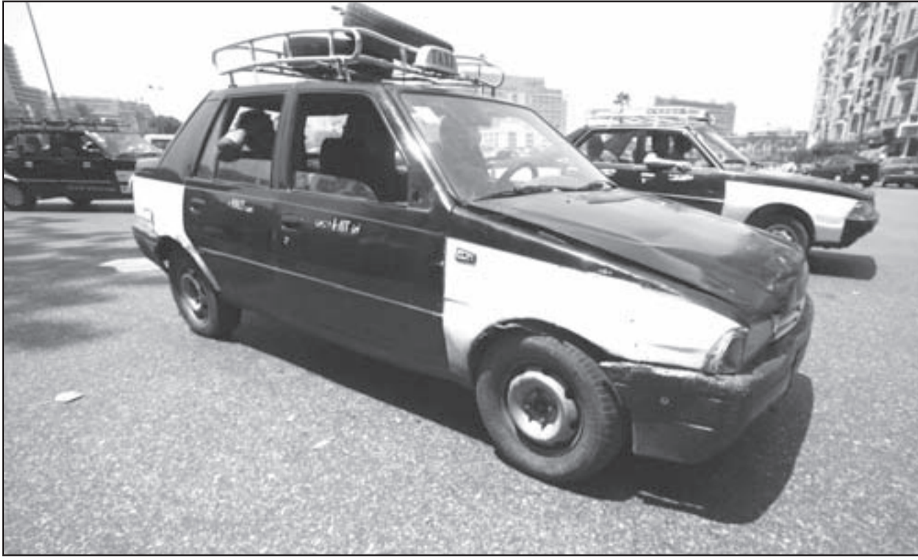
أحدى سيارات الاجرة القديمة في القاهرة امس