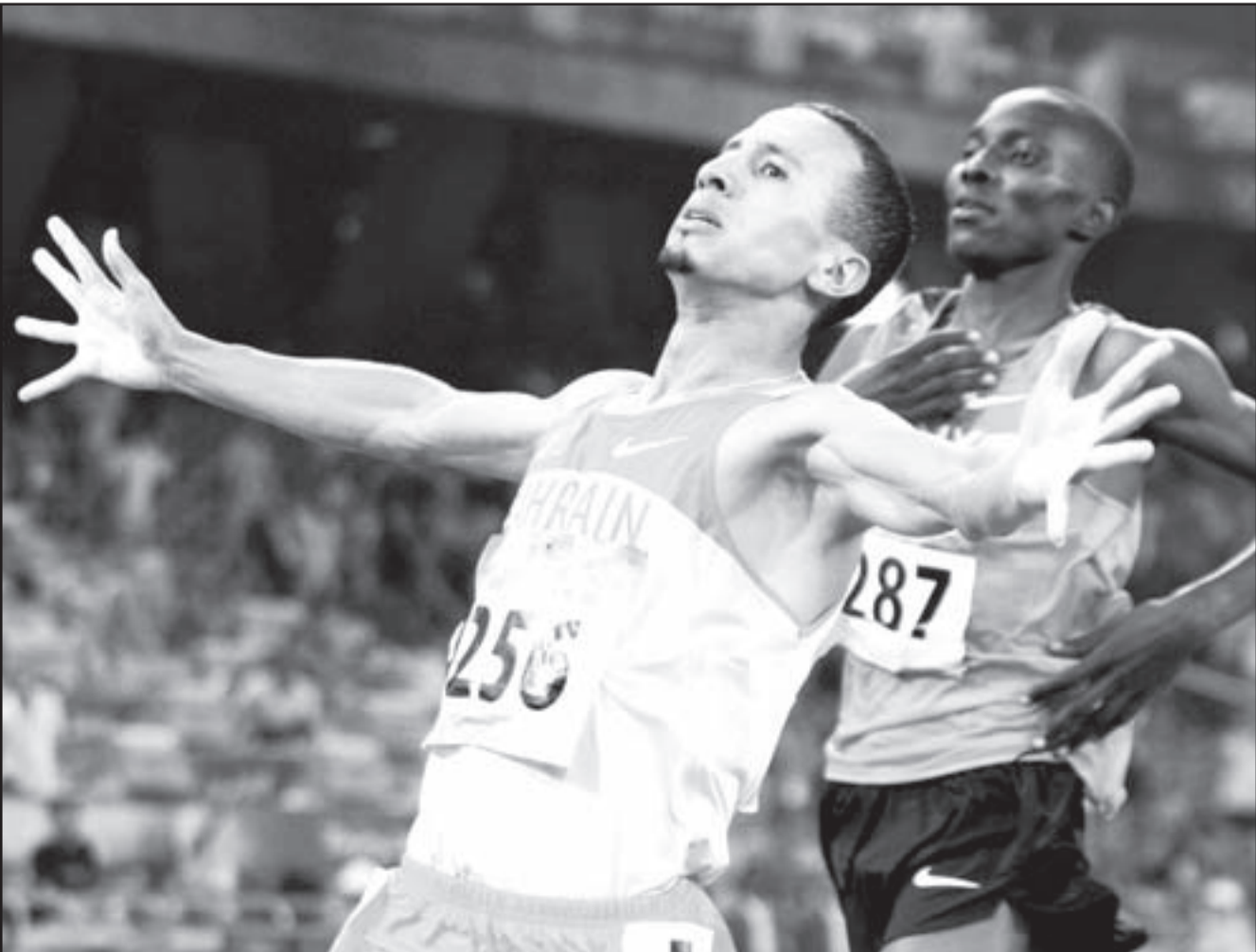
البحريني رشيد رمزي

■ بكين- رويترز: فاز البحريني رشيد رمزي بالميدالية الذهبية لسباق 1500 متر رجال ضمن منافسات العاب القوى في دورة الالعاب الاولمبية ببيكين امس الثلاثاء.