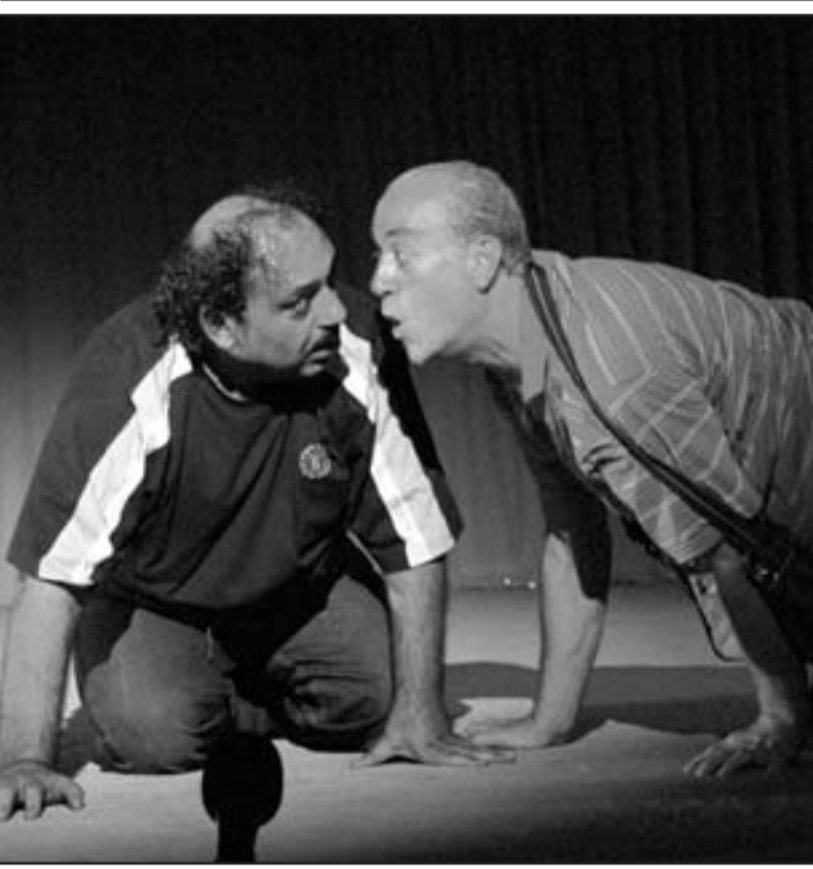
مشهد من مسرحية «تلك الراحه»

لوحظ غياب راعي المهرجان الدكتور رياض مسانح أغا وزير الثقافة، وغياب أي تمثيل لمدنية الأرض لبناء مسرح يستوعب طاقات هذا المدينة،