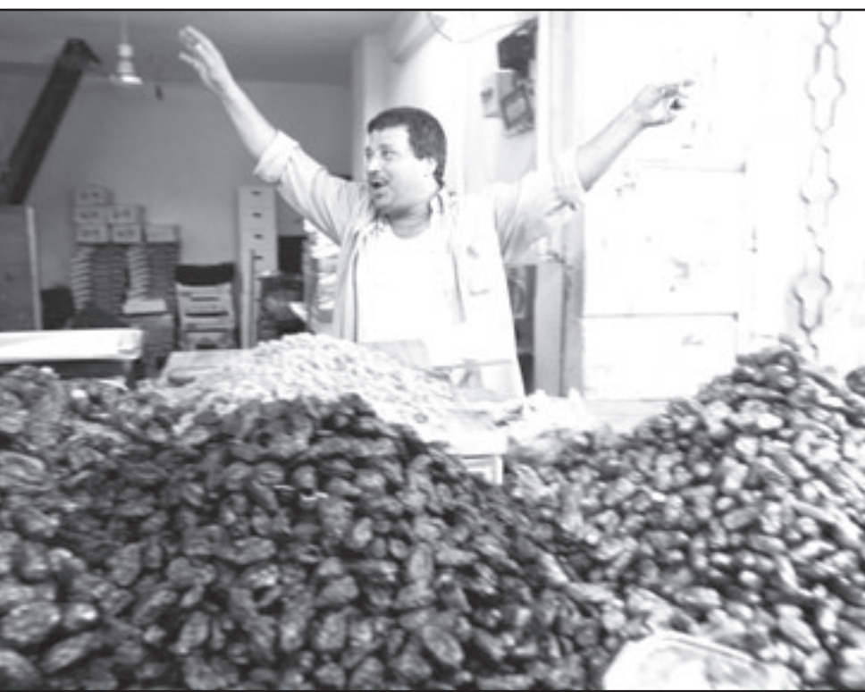
تاجر فلسطيني يعرض انواعا من التمور عينية بشهر رمضان المبارك

رام الله - «القدس العربي» من وليد عوض: أعلن مسؤول حكومي اسرائيلي كبير امس الاحد ان اسرائيل تريد التوصل إلى اتفاق سلام شامل مع الفلسطينيين بحلول نهاية السنة لكن مع تأجيل مسألة الوضع المستقبلي للقدس في هذه المرحلة. وقال المسؤول بعد انتهاء اللقاء بين رئيس الوزراء الإسرائيلي إيهود أولمرت والرئيس الفلسطيني محمود عباس ان «الطرفين مهتمان بالتوصل إلى اتفاق شامل بحلول نهاية العام 2008 وتعتقد ان ذلك ممكن»، وأضاف «لكن بما ان مسألة القدس لا يمكن حلها ضمن الجدول الزمني هذا، سيكون عليهم الاتفاق على تأجيل اتفاق حول هذه المسألة والاتفاق على آليات وجدول زمني لسلسلة القدس».