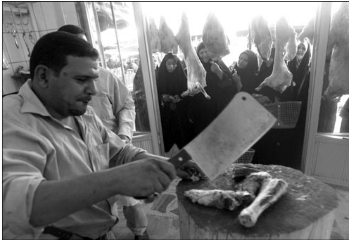
اقبال على شراء اللحوم عشية بدء شهر رمضان في العراق

وفي سياق آخر استرد سوق الشورجة الذي يعد أقدم أسواق العاصمة العراقية عافيتها وعاد لنشاطه السابق بعد أن طالته التفجيرات في أكثر من مرة، لكنه عاد