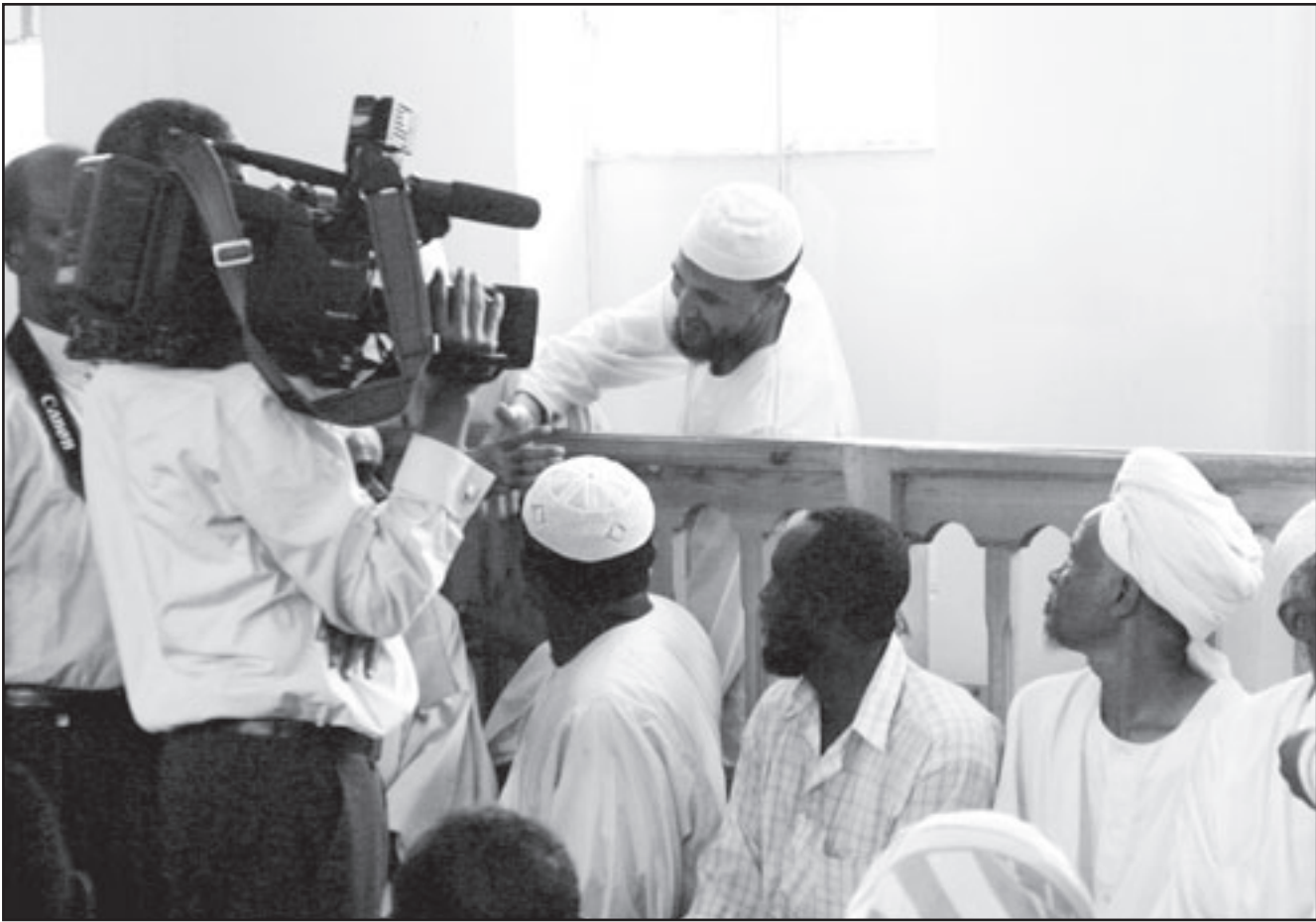
أحد المتهمين بمهاجمة الدبلوماسي الأمريكي أثناء المحاكمة في الخرطوم امس