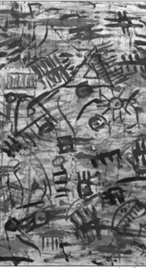
لوحة للفنان (القدس العربي)

■ أرسمه بلون حزين جداً لرحيل شاعر المقاومة الفلسطينية محمود درويش.