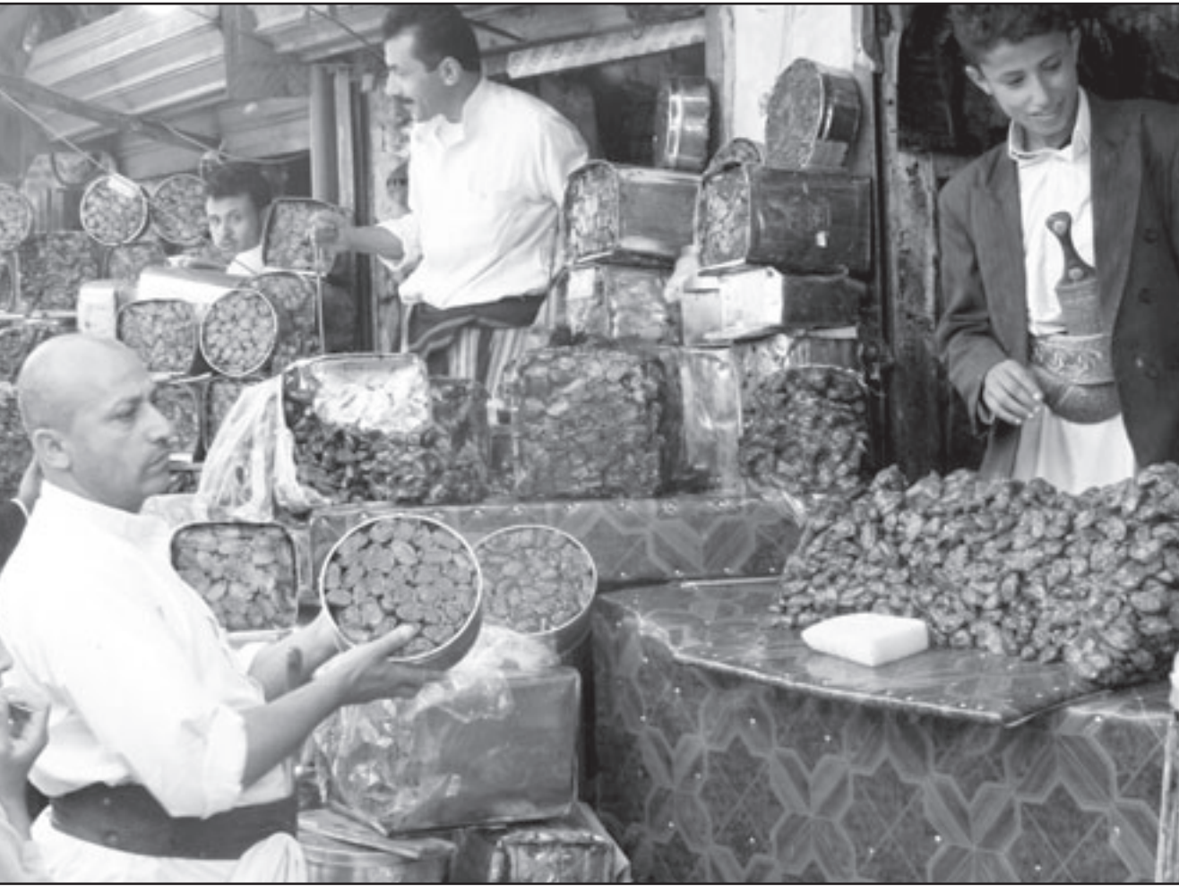
محل لبيع التمور في صنعاء

■ صنعاء - يوبي أي: اعتبرت أحزاب المعارضة اليمنية، ممثلة في «اللقاء المشترك»، بأن تصويت كتلة حزب المؤتمر الشعبي العام الحاكم على قانون الانتخابات بمثابة «نكثاب على الديمقراطية». وقال رئيس المجلس الأعلى لأحزاب المعارضة عبد الوهاب الأنسي في مؤتمر صحفي أمس الأحد في صنعاء «إن أحزاب المشترك لن تقاطع الانتخابات البرلمانية لتحقيق رغبة الحاكم، كما انه لن يخوضها وفق شروطه». وكانت اللجنة العليا للانتخابات في اليمن قد عقدت أول اجتماع لها السبت من دون مشاركة ثلاثة من ممثلي أحزاب المعارضة الذين امتنعوا عن المشاركة، واعتبروا تشكيلها «مخالفا للقانون والدستور اليمني»، وبحسب الأنسي، فقد اعتبرت المعارضة أن ما حدث من تعديلات لقانون الانتخابات في مجلس النواب يعد انقلابا على الهامش الديمقراطي المحدود، والذي يظهر بوضوح من خلال السياسة التي تنتهجها السلطة ممثلة بالحزب الحاكم. وشدد الأنسي، وهو رئيس المجلس الأعلى لأحزاب المشترك على موقف الأحزاب من اللجنة العليا للانتخابات، قائلا «لا يمكن للدخول في عملية مثل هذه لأنها انتهت بمشهد يوجي بالإشفاق، وأنتنا نتعامل مع الانتخابات كمنظومة سياسية، ولن نتعامل معها من خلال منظومة الأزمات التي يعيشها البلد». ويشار إلى أن أحزاب المعارضة انتعت عن المشاركة في لجنة الانتخابات التي شكلها الرئيس اليمني علي عبدالله صالح الأسبوع الماضي ويمثل المعارضة فيها 3 أعضاء.