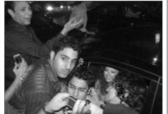
ميريام فارس محاطة بالمعجبين في رحلتها المصرية (القدس العربي)

وفي الختام تمتعت اللقاء القريب مع الشعب التونسي الذواق.