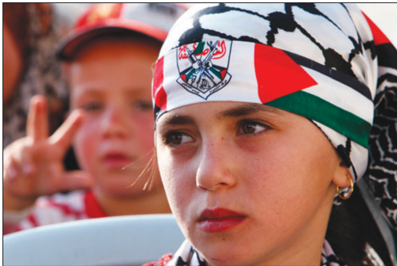
فتاة فلسطينية تشارك باحتفال في الخليل امس للمطالبة باطلاق المعتقلين في السجون الاسرائيلية