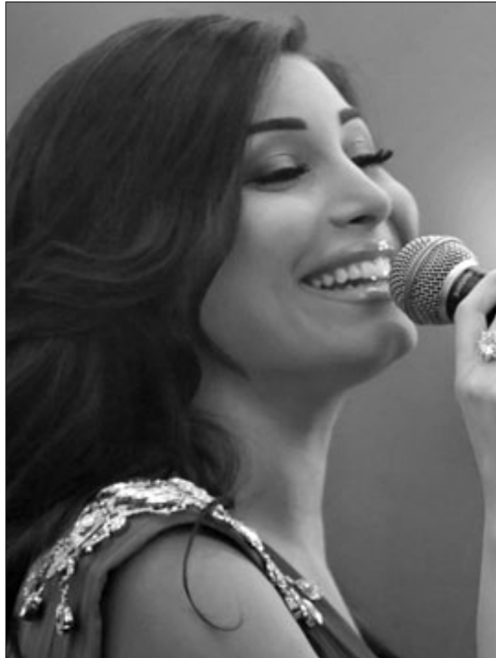
يارا (القدس العربي)