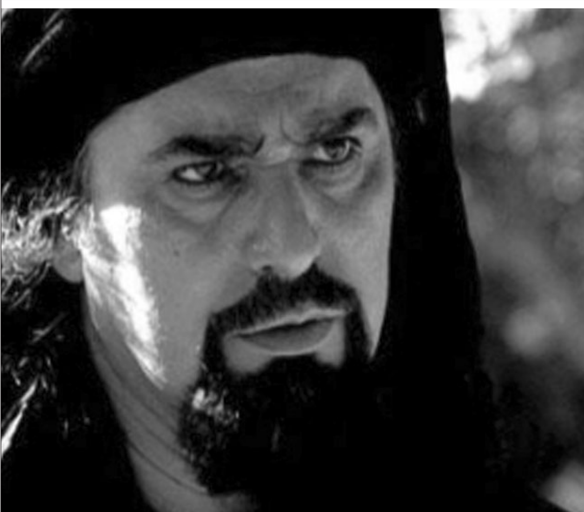
عباس النوري في دور «أبو جعفر المنصور»

اتجاه نفيه خارج دولته ووطنه وعصره وعصريته ليبقى الآخرون وحدهم في بؤرة الضوء، عفوا في هامش الظل.