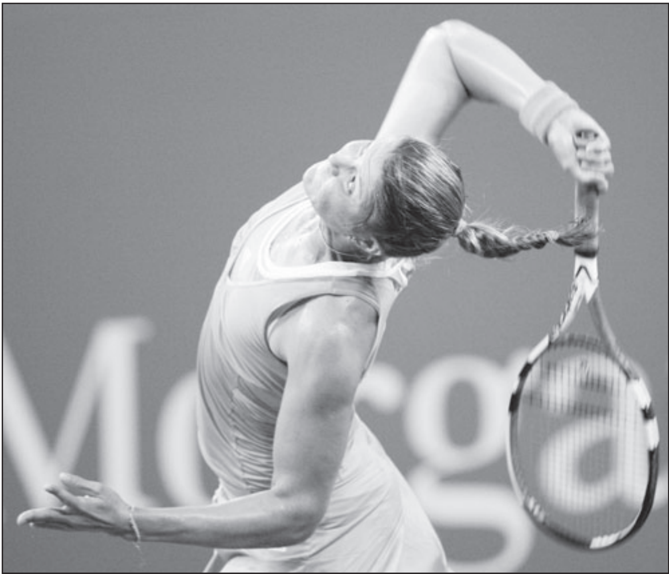
الروسية دينارا سافينا

الجديد 2008-2009 بفوز صعب على ضيفه بلد الوليد 1-صفر. وعاد شرف تسجيل اول اهداف الموسم الجديد الى لويس غارسيا في الدقيقة الاولى من الشوط الثاني (46). واستهل بلنسية مشواره في دوري الدرجة الاولى الاسباني لكرة القدم هذا الموسم بفوز كبير على ضيفه ريال مايوركا بثلاثة اهداف مقابل لا شيء. افتتح ديفيد بيا مهاجم منتخب اسبانيا اهداف بلنسية في الدقيقة 34 وأضاف خوان ماتا الهدف الثاني في