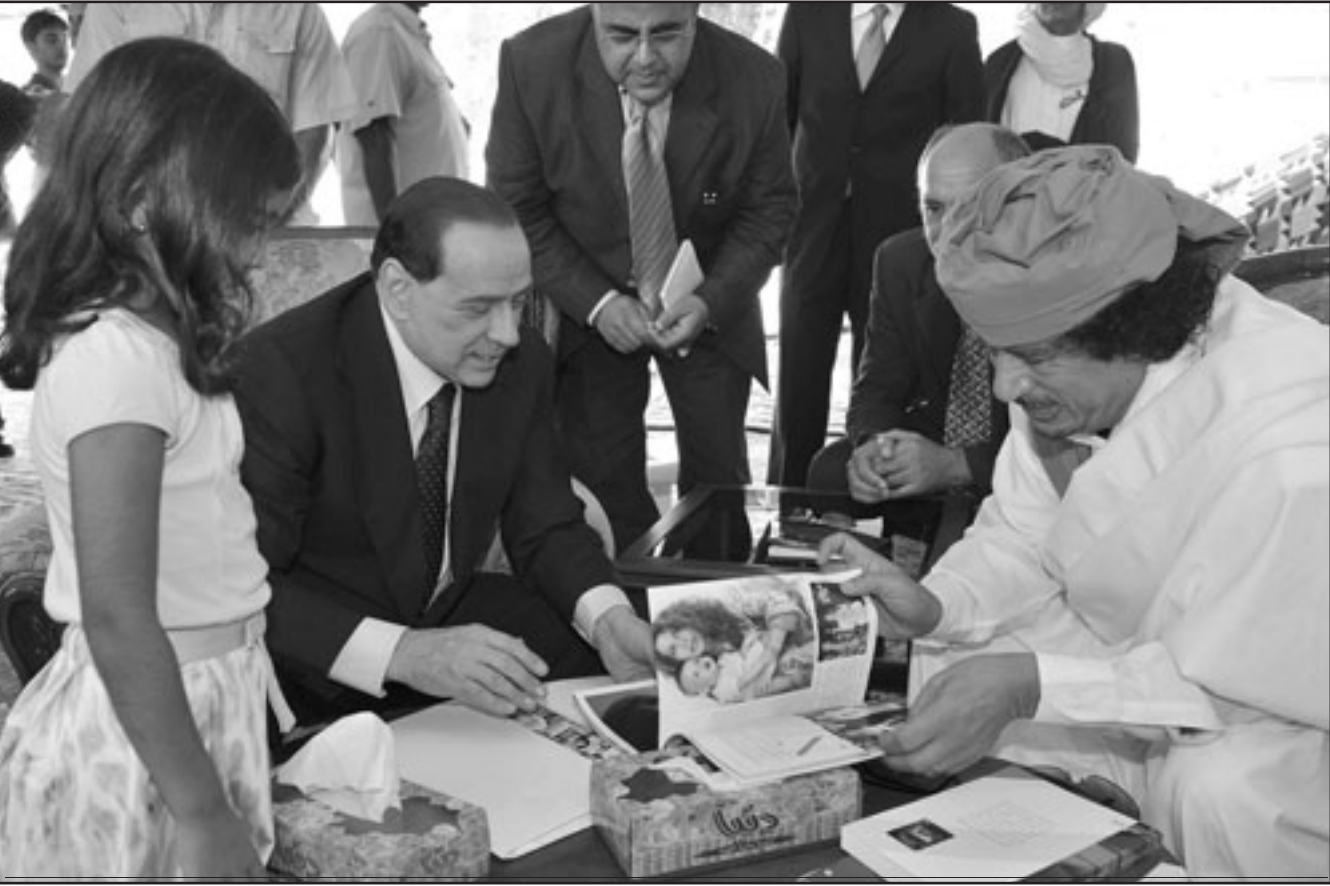
القذافي وبرلسكوني يتبادلان الهدايا بعد توقيع الاتفاق حول التعويضات بينغاري يوم السبت

وتزامنت زيارة برلوسكوني مع الاحتفالات بالذكرى التاسعة والأربعين للثورة الليبية في اول ايلول/سبتمبر 1969 التي وصلت القذافي الى الحكم، وتأتي الزيارة بعد اسبوعين من توقيع اتفاق حول دفع تعويضات للضحايا الاميركيين والليبيين جراء النزاع بين البلدين في الثمانينات، وبمهد هذا الاتفاق لتطبيع كامل للعلاقات بين ليبيا والولايات المتحدة، خصوصا وان وزيرة الخارجية الاميركية كوندوليزا رايس ستقوم الاسبوع المقبل بزيارة تاريخية لليبيا، وفي روما، ابدت جمعية الايطاليين المطرودين من ليبيا استيائها لدفع التعويضات. وطالب الجمعية منذ 38 عاما بيان تصدر الدولة الايطالية قانونا يقضي بتقديم تعويضات لالاف الايطاليين الذين طردهم الزعيم الليبي معمر القذافي من بلاده عام 1970.