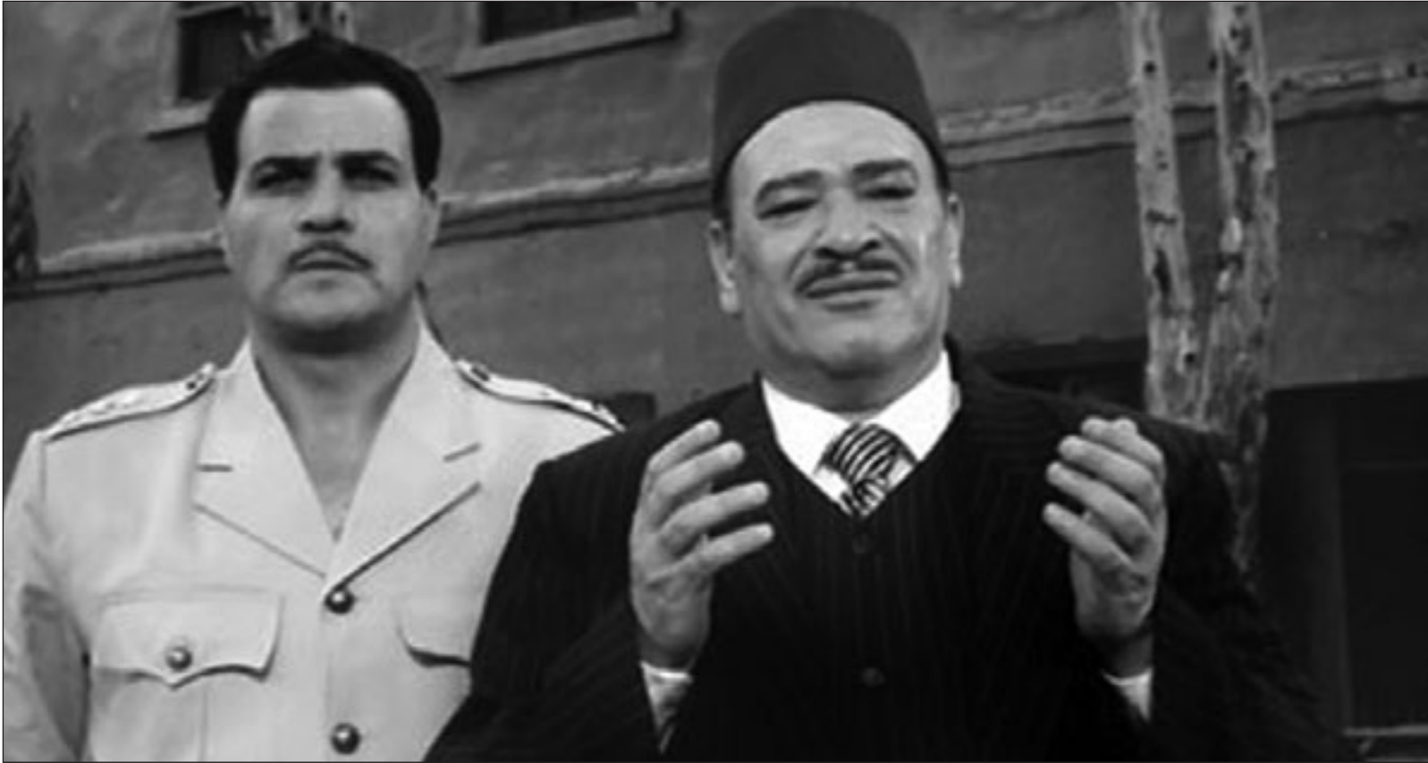
لقطة من مسلسل «ناصر»