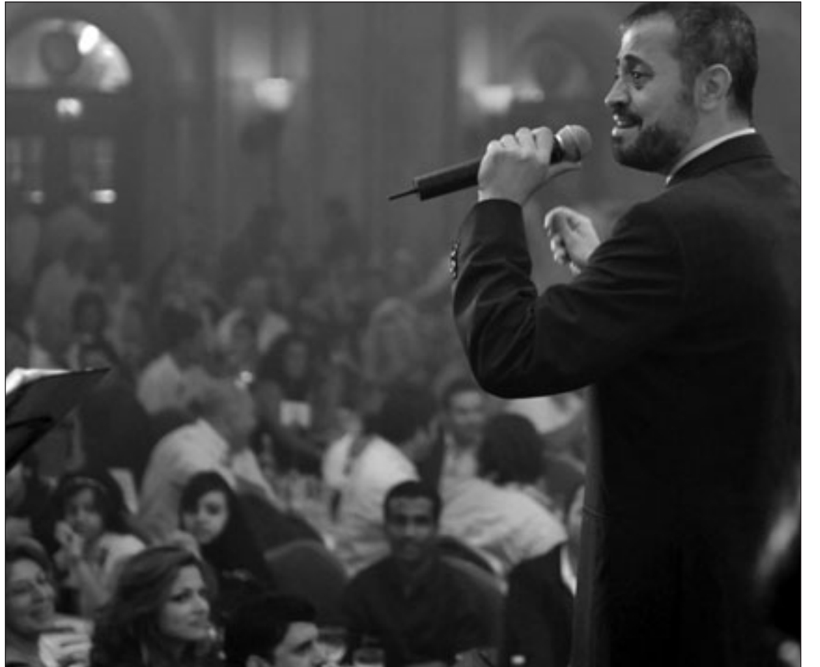
جورج وسوف