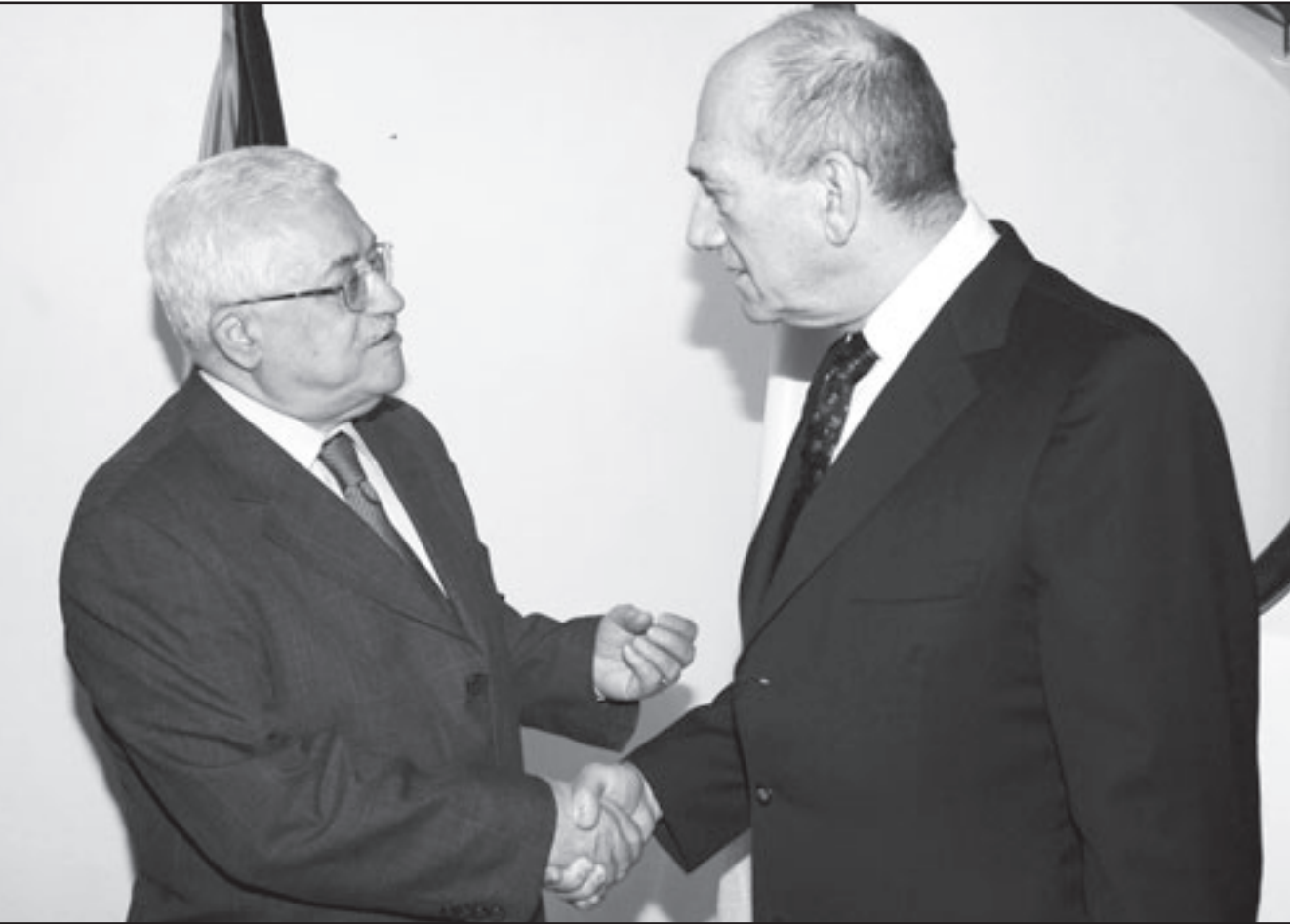
رئيس الوزراء الاسرائيلي خلال اجتماعه بالرئيس الفلسطيني في القدس امس

إرهابية لتحسين وضعيتها.. كما شدد يشاي على رفضه لإشراك أي جهة دولية في المفاوضات حول القدس حتى لو بصفة مراقب أو مستشار.