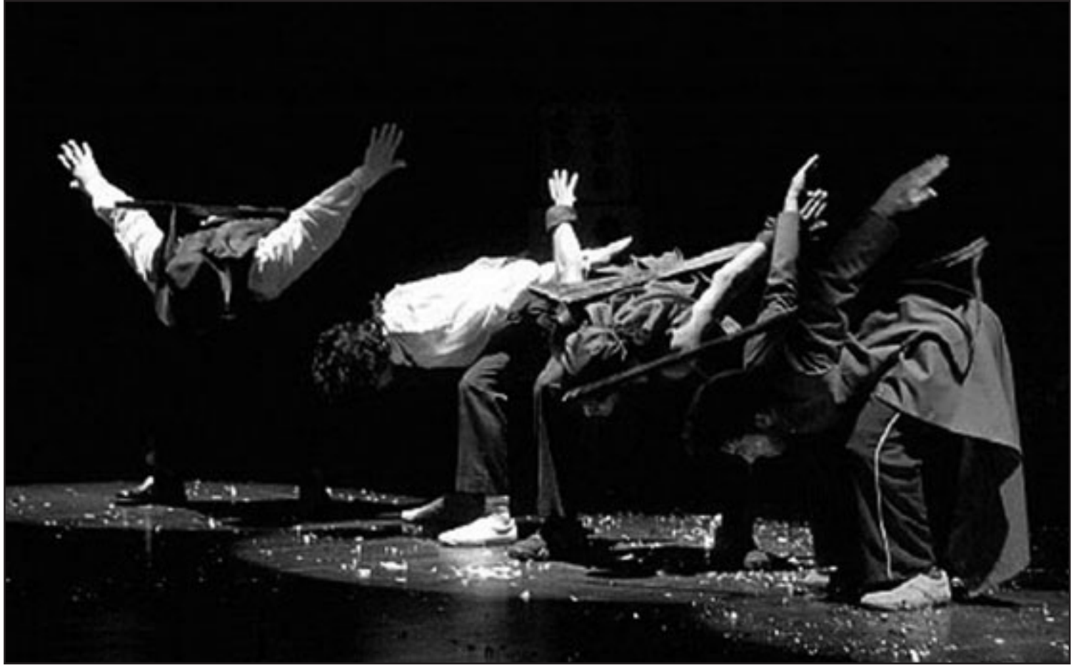
عسى عليها فهمها.

على صفحاتها كان يندب من شكل الحروف التي كتبتها الفتاة على صفحات الريل، وخافها ويخشي منها كغيبان مذعور، بينما كانت الكلمات بالسنسنة لها مثل زاد في هذه الرحلة للبحث عن الذات وتفعيل وجودها وترميم كيانها لتتورق على ما يقص من كراماتها وهي في آن ترفض كل ما يسببها إلى أديمها ويخشب إنسانيتها من سلفية المفاهيم وسكونية التقاليد التي كانت تسود قريتها، حتى أنها كانت تتعذب ببطء، وهي تستعز أن وراء ضوء الكلمات وشعلة العتب التي كانت أبتتها تقراها طاقة، وقوة كونية