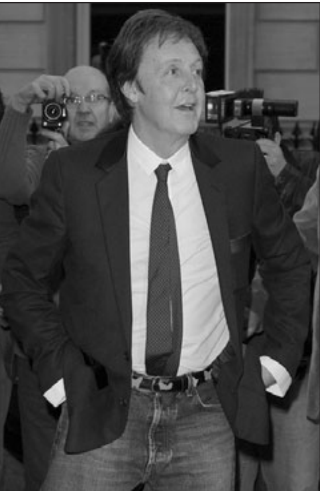
بول مكارنتي... وانتظار عمره 43 سنة

فان الحديث يدور عن نجاح دبلوماسي واعلامي اسرائيلي من الدرجة الاولى. والامر يبرز باضعاف على خلفية حقيقة ان مدينة مكارنتي، ليفربول، انتخبت هذا العام «عاصمة الثقافة الأوروبية»، وتشكل بؤرة جذب لمئات الاف السياح من العالم بأسره. زيارة مكارنتي والتغطية الناجحة لوجولاته في ارجاء تمل ايبيب ستمنحه، فرصة نادرة لان يري للعالم بأسره وجهها آخر- ثقافيا، مريحا، مدنيا، لا يرتبط بالسياسة والمواجهات، هذه فرصة محظور علينا التعاطي معها كامن