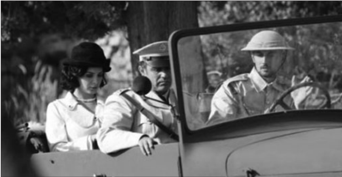
لقطة من مسلسل «أسهران»