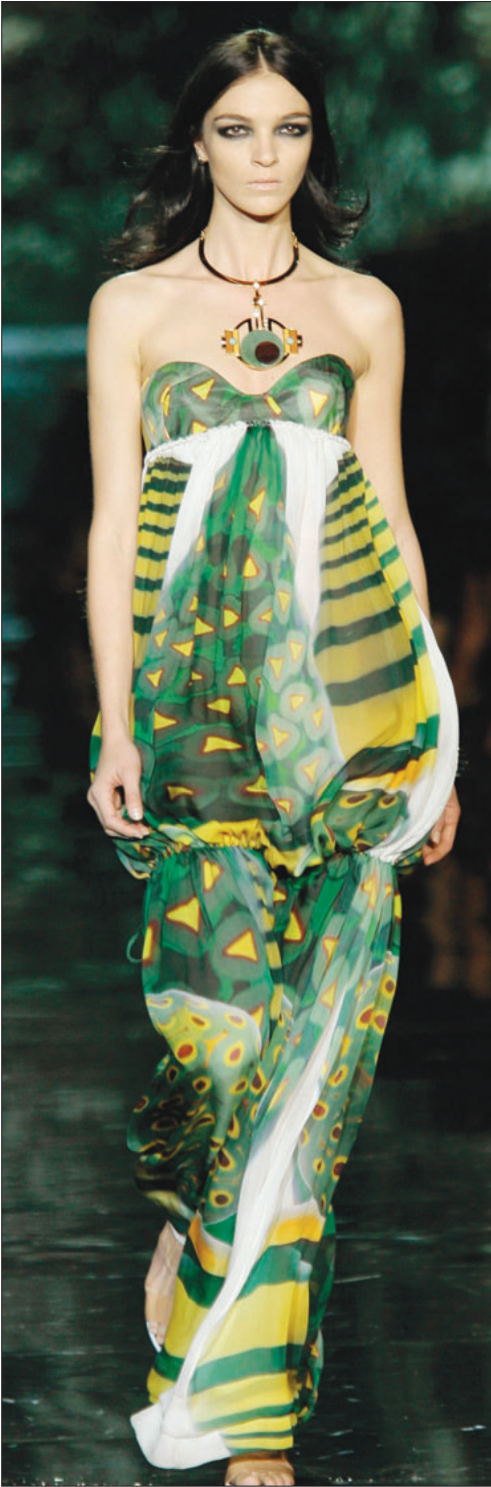
من مبتكرات مصمم الأزياء الايطالي روبرتو كافالي لموسمي ربيع وصيف العام المقبل عرض هذا الزي ضمن اسبوع الأزياء في ميلانو