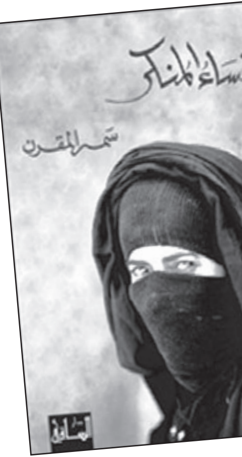
* كاتب من المغرب

انتابني إحساس بالخيبة، لكن من يلام هو: الإعلام، الذي يتغاضى عن الأعمال الجيدة، ويطلن لتنتاج دون المستوى. كتبت أفكر في الكتابة عن «بنات الرياض» من قبل، لكن ركابة أسلوها، جعلتني أترفع عنها، وكاني لم أقرأها. لا أدري لم تجرد دار الساقى نصوصا تغازل المجتمعات عشيقا...!