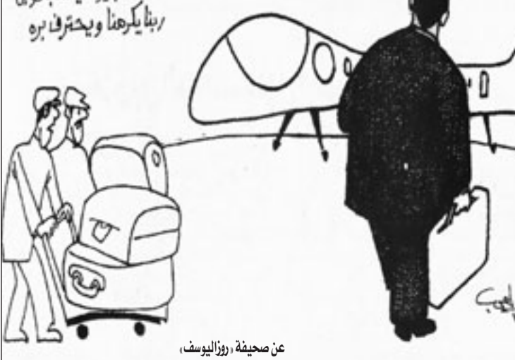
عن صحيفة روزاليوسف،

والى معركة شيخ الأزهر، وجريدة «ال فجر»، ورفضه وساطة نقيب الصحافيين لإنهايتها، وما تعرض له النقيب زميلنا لأنه ذهب مع أعضاء من المجلس ليرجو الشيخ طنطاوي التنازل عن الدعوى، وهو ما دفع مكرم لأن يوضح موقفه يوم الأربعاء بالقول في عموده اليومي بـ«الأهرام» - نقطة نور - «لا أرفع ما وجه الإهانة التي تقول بعض صحف المعارضة إن نقيب الصحافيين قد تعرض لها بذهابه على رأس وفد يضم غالبية أعضاء مجلس الصحافيين إلى شيخ الأزهر يسأله أن يلبع روح الصلح في خلافه مع جريدة «ال فجر»، على روح الغضب والرغبة في الشار والانتقام وأن يقبل اعتذار النقيب والمجلس إضافة إلى الاعتار الجريدة عن أن يرحج أو أهانة يكون الشيخ الجليل قد استشعرها، لقد ذهبنا إلى الشيخ بموافقة رئيس