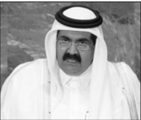
امير قطر الشيخ حمد بن خليفة آل ثاني

الدوحة- اف ب: أعلن مسؤول في الكنيسة الانغليكانية يزور الدوحة الخميس انه سيتم وضع حجر الاساس لكنيسة انغليكانية في قطر الاحد في 28 ايلول/سبتمبر لتكون ثاني كنيسة تقام في هذه الدولة الخليجية. وقال الاسقف مايكل لويس اسقف الكنيسة الانغليكانية في الخليج والعراق وقبرص للصباحين "سيتم بدء البناء صباح الاحد عند الساعة العاشرة صباحاً (07:00 غ) وذلك في مجمع الكنائس بقطر". وكان الاسقف مايكل لويس زار صباح أمس مركز حوار الاديان في الدوحة حيث التقى رئيسه ابراهيم التميمي وعلن عن بدء اشغال الكنيسة بعد اللقاء.