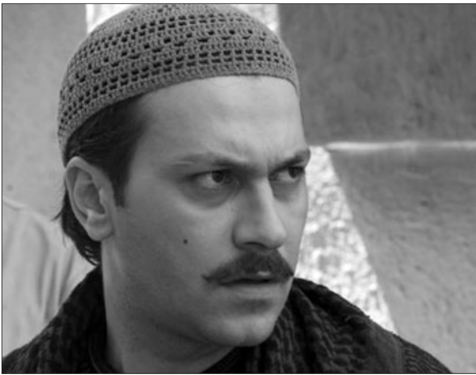
لقطة من مسلسل «باب الحارة 3»

تذكره أن الدراما والكوميديا والبرامج الدينية في رمضان على mbc1 لم تنحصر ضمن إطار شاشة التلفزيون ففصم، فقد بات بإمكان الراغبين بالإستفادة من الخدمات التفاعلية التي توفرها mbc، متابعة مختارات من الأعمال الدرامية والكوميدية والبرامج الدينية على أجهزة هواتفهم المحمولة، على شكل ملخصات بطول 4 دقائق، كما يمكنهم اختيار متابعة حلقة كاملة من هذه المسلسلات والبرامج المختارة، وقبل يوم من موعد عرضها على أجهزة هواتفهم وذلك من خلال إشتراكهم بيده الخدمة عبر إرسال رسالة نصية إلى الرقم المرافق لبلدهم.