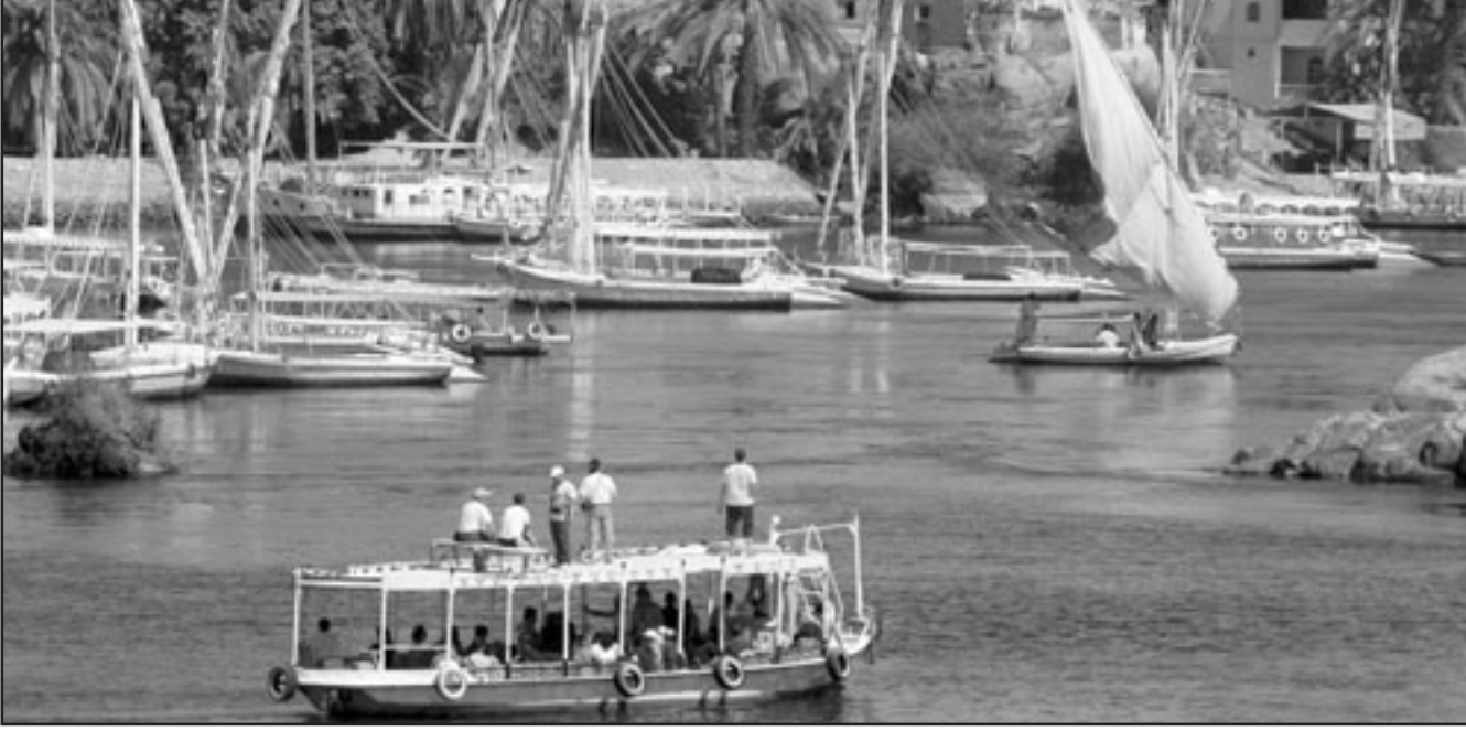
سفينة تقود سياحا في نهر النيل جنوب مصر امس