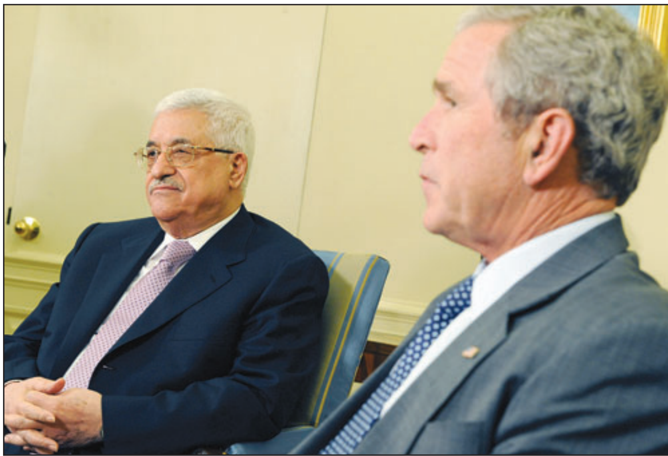
الرئيس الأمريكي جورج بوش لدى استقباله الرئيس الفلسطيني محمود عباس في البيت الأبيض