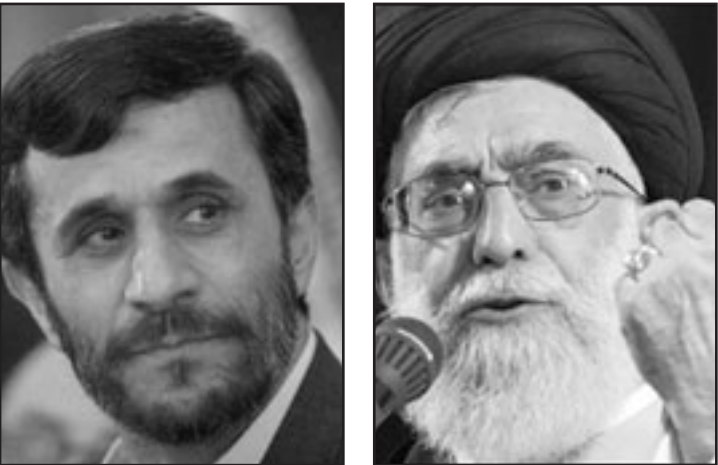
رباح موسكر تعشأ احمدي نجاد و علي خامنئي

ان يخاطر على البال، رغم ان العقوبات كانت لينة وانبطاحية، إلا انها بدأت تؤتي أكلها وتثير القلق في اوساط نظام رجال الدين في طهران- صحيح انها لم تصب بطن ايران اللينة- المنطف- مصدر الدخل الاساسي إلا انها أثقلت على اقتصاد ايران المتدهور. الركود في ايران في تزايد (أكثر من 30 في المئة) البطالة بالاساس في اوساط الشباب وخريجي الجامعات تتزايد، الجفاف في السنوات الاخيرة ألحق الضرر بالزراعة وامدادات المواد الغذائية لدرجة ان ايران اضطرت الى استيراد الفمح «من الشيطان الاكبر»، البطالة المتقدة - لا يمر اسبوع من دون انقطاع التيار الكهربائي في المنطقة الامر الذي يسب ايضا بامدادات المياه هناك نقص في الوقود لأن ايران منتجة النفط تصغر الى استيراد مشتقات الوقود. النتيجة هي ان الكثيرين من مواطني ايران بدأوا بانهازم