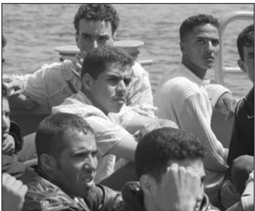
مهاجرون من شمال افريقيا في متن زورق للحرس المدني اعترض سيلهم قبيل رسو مركبهم بجزر الخالدات مساء الثلاثاء

وعلاقة بالنقطة الأخيرة، فأكثر الدول التي ستقتصر في حالة الانفتاح التام على أوروبا الشرقية هي دول المغرب العربي التي وجد شبيهاها خلال الأربعين سنة الأخيرة أوروبا كمنفذ للهرب من شبح البطالة.