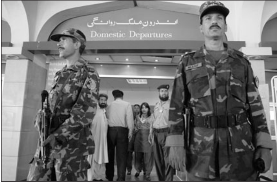
قوات امن باكستانية تقوم باخلاء مطار في اسلام اباد عقب تلقي تحذيرات بوجود قنبلة

ووضعت كافة المطارات الأخرى في باكستان في حالة من التأهب. وكانت الاستخبارات الباكستانية حذرت يوم الأربعاء من أن مسؤولين كباراً ومباني حكومية في مدينة كراتشي قد تكون هدفاً لهجمات إرهابية قبل عيد الفطر الذي يحل الأسبوع المقبل. وحذرت الاستخبارات في تقرير أرسلته إلى الحكومة من أن إرهابيين خططوا لاستهداف شخصيات ومبان حكومية في كراتشي. ومن بين الأماكن التي قد تكون هدفاً لهجمات عدد التقرير مكتب قائد الشرطة، والقنصلية الأمريكية وقنصليات أخرى، وفنادق من فئة خمس نجوم ومحلات أغذية أجنبية. وعلى ضوء هذا التقرير أمرت الحكومة الإتحادية الحكومات الإقليمية بتشديد الإجراءات الأمنية. وتقرر في اجتماع عقد بمشاركة مسؤولين كبار في الشرطة والاستخبارات تشديد الإجراءات الأمنية على الطرق السريعة الهامة، وعلى المباني الحكومية والخاصة، والمصارف ومحلات بيع الأغذية الأجنبية.