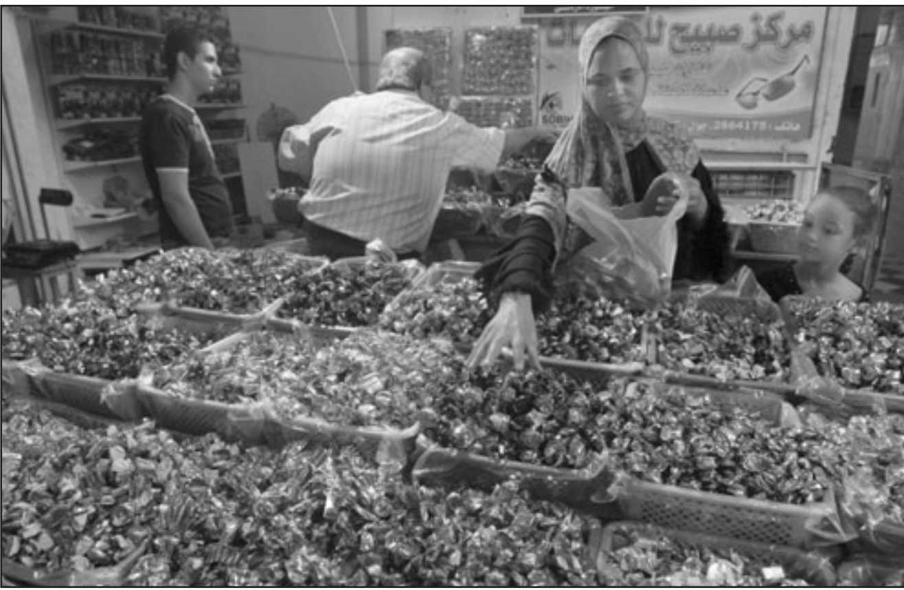
فلسطينية تتسوق تحضيرا لعيد الفطر المبارك في غزة

وعن وضع الانقسام الداخلي لفت عباس إلى أن مصر تبذل جهوداً كبيرة وجادة للمصالحة الوطنية الفلسطينية، لافتاً إلى أنها «تلتقي كل الفصائل الفلسطينية هذه الأيام من أجل إيجاد حل»، وأكد عباس على ضرورة الحل مع حماس «رغم النداء ورغم