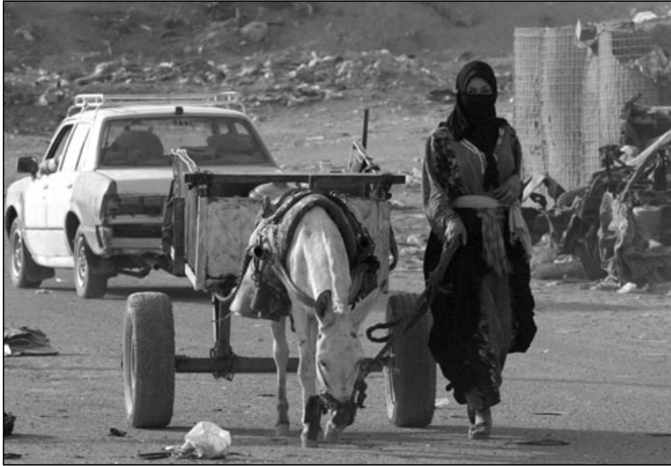
سيدة عراقية تجمع القمامة في بغداد امس