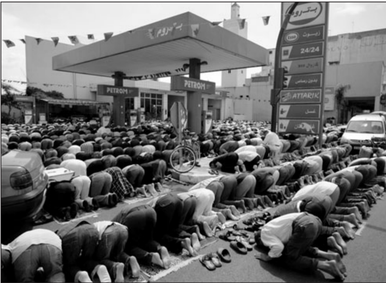
الاف المغاربة أدوا صلاة الجمعة في الشوارع وحيثما استمعوا في يوم الجمعة الأخيرة من شهر رمضان المبارك الذي يقرب من نهايته. والصورة من الرباط حيث تحولت الأرصفة وحتى أرضيات محطات البنزين إلى مصليات

واستغربت النقابات إقصاء باقي موظفي قطاع الوظيفة العمومية من الزيادات في الرواتب التي حصل عليها النواب دون غيرهم. واعتبرت نقابات التربية والصحة والتعليم العالي أن توزيع الأرباح والثروات على المواطنين ليس فيه «عدل»، وأنه لا يخضع للشفافية، كما أنه لا يستند إلى «مرجعية قانونية».