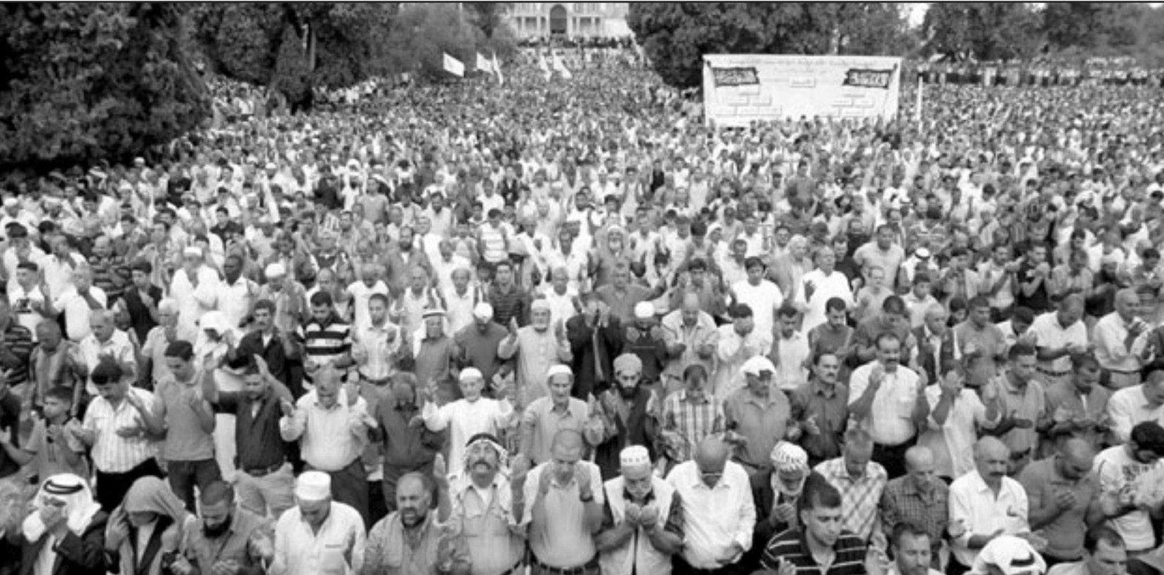
فلسطينيون يصلون في باحة قبة الصخرة المشرفة في القدس

■ غزة - رام الله - القدس العربي: أمّ قرابة 200 ألف فلسطيني المسجد الأقصى في القدس لأداء صلاة الجمعة الأخيرة «اليتمية» من شهر رمضان بينهم حوالي 100 ألف فلسطيني من سكان الضفة الغربية. وقدر رجال دين مسلمون عدد المصلين بأكثر من 200 ألف مصل تمكنوا من الوصول للمدينة رغم العراقيل والقيود الإسرائيلية على الحواجز. وقالت إذاعة فلسطينية محلية إن نحو 100 ألف فلسطيني من سكان الضفة الغربية نجحوا في الوصول للقدس عبر الحواجز الإسرائيلية فيما وصل الآخرون للمسجد من داخل المدينة ومن داخل المدن العربية في منطقة 48. وفي وقت سابق الجمعة أصيب جندي إسرائيلي بجروح طفيفة اثر تعرضه للرشق بالحجارة على حاجز عسكري على مدخل مخيم قلنديا جنوبي رام الله. وقالت الإذاعة الإسرائيلية إن الجندي تلقى الإسعاف الأولي في مكان الحادث ثم نقل إلى المستشفى للمعالجة. وذكر شهود أن آلاف الفلسطينيين تدفقوا نحو الحاجز بهدف المرور باتجاه القدس للصلاة في المسجد الأقصى، إلا أن الجنود الإسرائيليين منعوا من هم دون 45 عاماً ما دفعهم لرشق الجنود بالحجارة. وأطلق الجنود الإسرائيليون أعيرة مطاطية وقنابل مسيلة للدموع في المكان دون الإبلاغ عن وقوع إصابات. وفي وقت سابق، قالت الشرطة الإسرائيلية إنها ستسمح بدخول المسلمين الفلسطينيين من سكان الضفة الغربية إلى الحرم القدسي لأداء صلاة الجمعة الأخيرة من شهر رمضان مع فرض بعض