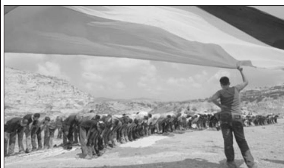
مظاهرون يصلون في قرية دير شرف احتجاجاً على إعادة فتح مكب للنفايات في المنطقة