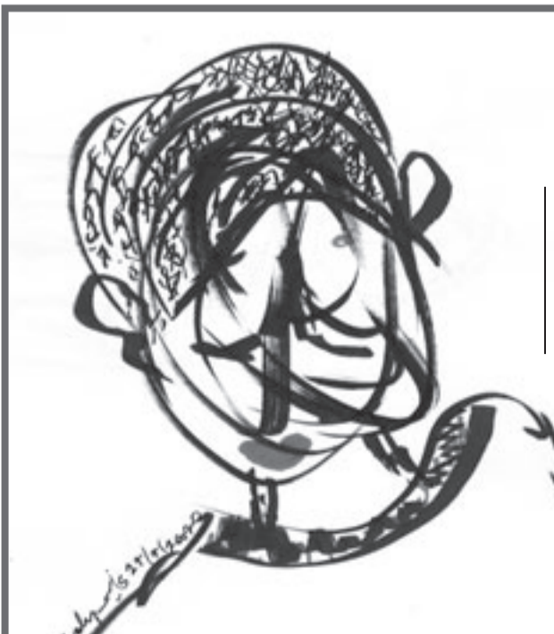
جماعة ابن زهر - أكادير

ويكفي أن نعود إلى الماضي لتأخذ العبرة، ألم يتنبأ شعراء المنتصف الأول من القرن الماضي بعوت الشعر بعد ظهوره في شكله الجديد؟ ألم يكتب التاريخ هذه النبوة الموجلة ليمتحننا بالمقابل أروع الأعمال في بداية النصف الثاني؟ ليس ما كتبه جيل الستينيات في الشعر العربي يعد نافذة عالية ومضيئة لهذا البهو العربي الشاسع الذي نسميه الشعر؟ ستحيا الرواية وسيحيا الشعر، لكن لا أحد منهما سيكون بمقدوره أن يبقى ديوان العرب.