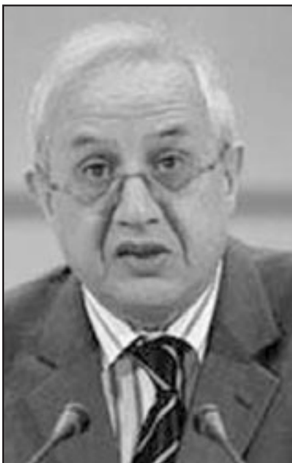
عبد العزيز زيارى رئيس البرلمان الجزائري

واعتبر منصاري ان الشارح الجزائري كان سيقبل هذه الزيادة لو كان النائب يمارس دوره كاملا وينقل مشاكل المواطن ومهمه ويدافع عن مصالحه بالوقوف في وجه الحكومة. وذكر منصاري أن القانون ينص على أن النائب يفتح مداومة في مقر دائرته الانتخابية ويوظف فيه سكرتيراً أو سكرتيرة، حتى يجد المواطن من يستقبلهم ويستمع لشكاواهم في حالة غياب النائب، لكن الأغلبية الساحقة من النواب لم يفتحوا تلك الدوامات وبعضهم لا يفتح تلك الدوامات إلا عند اقتراب موعد الانتخابات البرلمانية لضمان الحفاظ على مقعد بالبرلمان، كما قال.