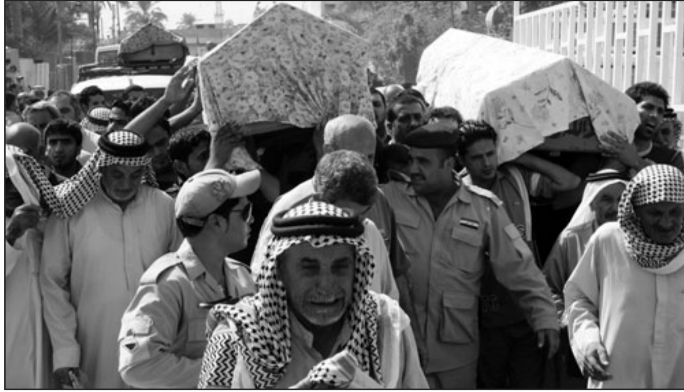
عراقيون يشيعون ضحايا أعمال عنف في بغداد الجمعة