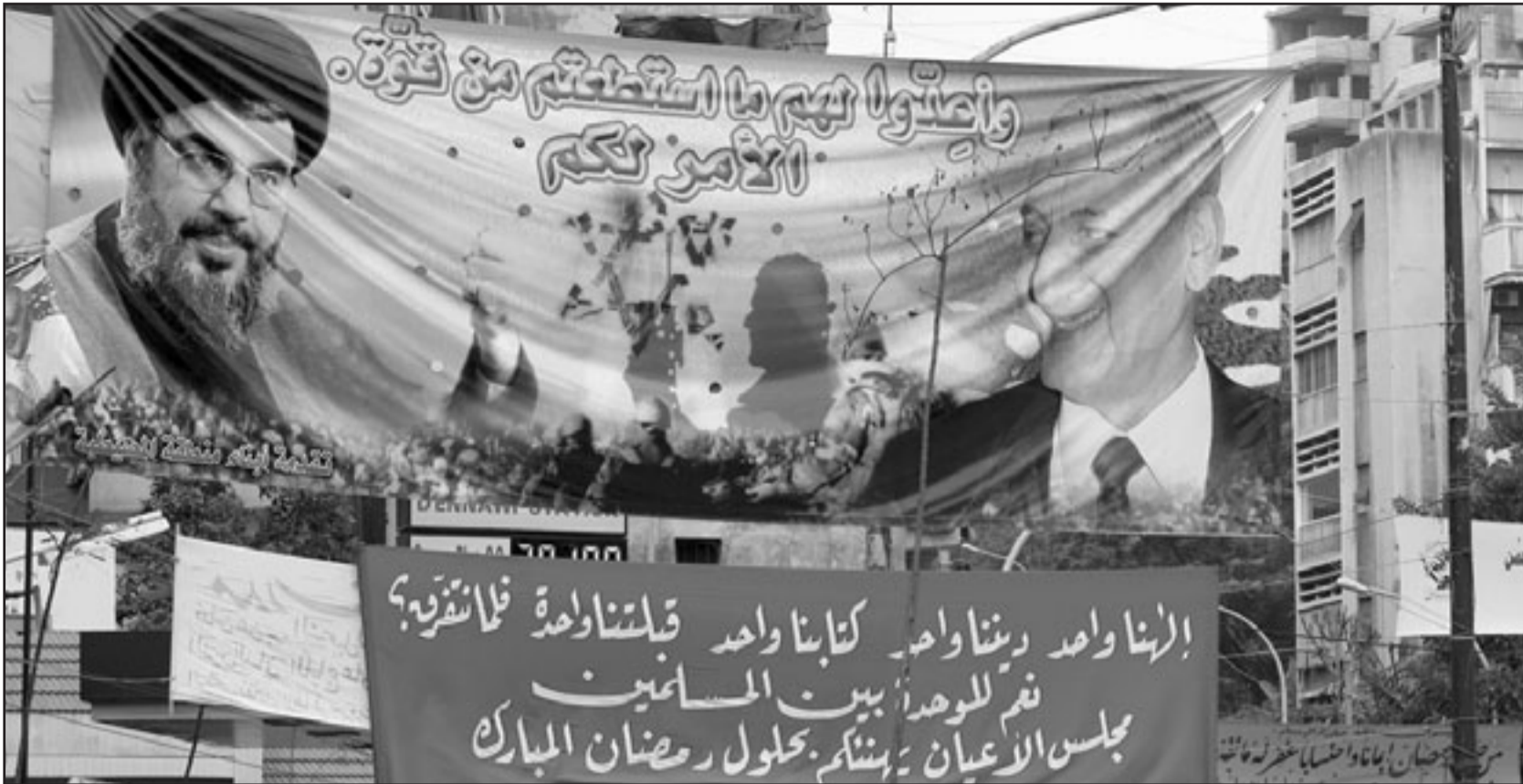
ملصق للامين العام لحزب الله الشيخ حسن نصر الله ورئيس البرلمان اللبناني نبيه بري ضمن المصالحات التي سيتم اذلتها لانجاح مشروع المصالحة بين الفئران اللبنانيين