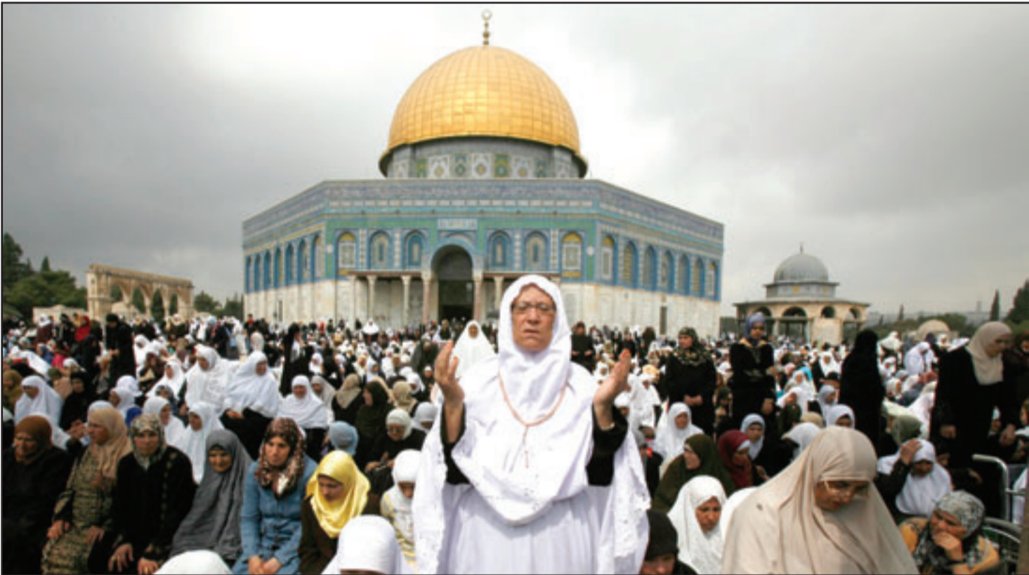
الاف الفلسطينييين يؤدون صلاة الجمعة اليتيمة في باحة المسجد الاقصى في يوم القدس

وشدد على ان «استمرار الاستيطان يحول الدولة الفلسطينية الى سراب».