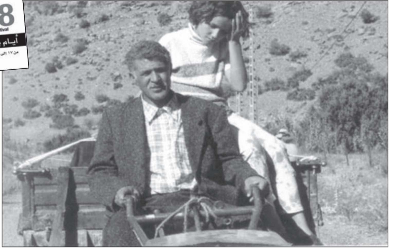
لقطة من فيلم «البيت الأصفر» للفرنسي الجزائري عمر كحار