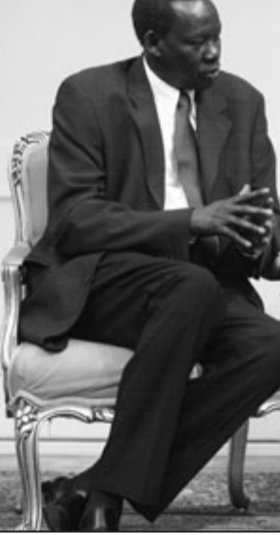
الرئيس الإيراني احمدي نجاد خلال لقائه مع وزير خارجية السودان دينغ اليور أمس في طهران