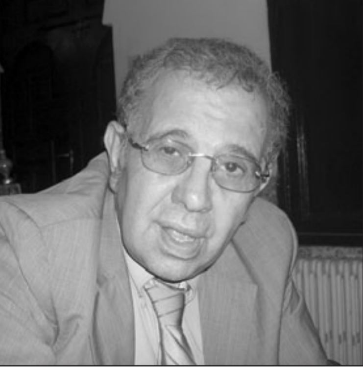
الحامي فاروق قسنطيني رئيس اللجنة الاستشارية لحقوق الانسان

وأخيل المهاجرون الـ 28 الذين ينتمون إلى مدن القنيطرة وبني ملال والخميسات، على الجهات المعنية، التي تكلفت بهذه القضية، وأوضح أفراد من الفرق الإنقاذ أن مجموعة المهاجرين أفلتت بالكاد من براثن مصير مأساوي، مؤكداً أنه تم العثور عليهم وإنقاذهم في الوقت المناسب قبل هبوب رياح الشريكي وتشكل كتل من الضباب كانت تعوق عمليات البحث وتعرض القارب للخطر، الذي كانت المياه قد بدأت بالتسرب إليه.