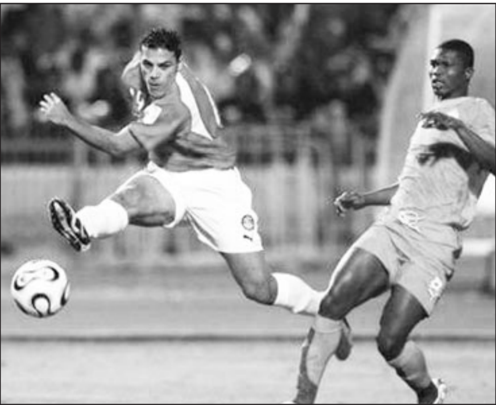
صورة من الأرشيف لعمرو زكي خلال إحدى المباريات