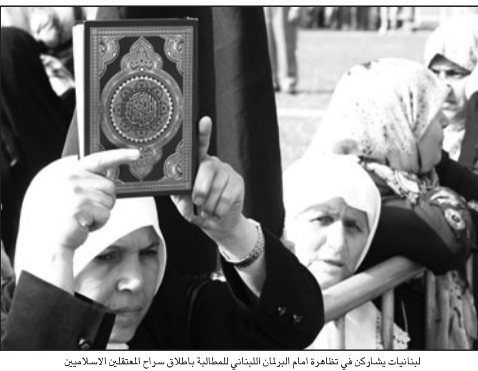
لبنانيات يشاركن في تظاهرة أمام البرلمان اللبناني للمطالبة بإطلاق سراح المعتقلين الإسلاميين

وأشارت المجموعة أيضاً إلى أن الأمير تركي دعا خلال اللقاء الجامعة العربية للرد على طلب (الرئيس الإسرائيلي) شمعون بيريس لقاء أي زعيم عربي مناقشة مبادرة السلام العربية، كما دعا الرئيس الجديد الذي سيُنتخب الشهر المقبل في الولايات المتحدة إلى القيام بزيارة إلى الشرق