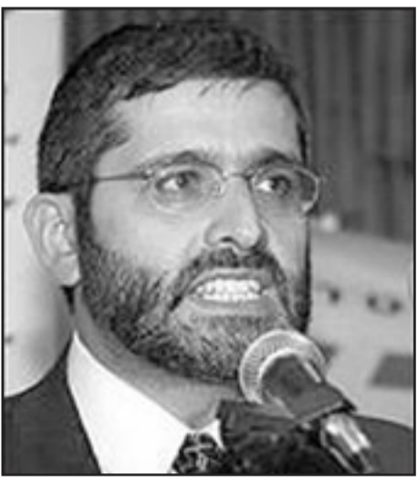
أيلي يشاي... انعدام المسؤولية

يحول العملية الى امر أكثر خطورة. نفس درجة انعدام المسؤولية تظهر عند قائد شاس ايلي يشاي، هو يتحدث عن القدس بين الحين والآخر الا ان ما يهيمه بالفعل هو مخصصات الاطفال. في عام 2003 قلص بنيامين نتنياهو مخصصات الاطفال بنسبة كبيرة، الاصوليون ادعوا ان هذا الامر لن يؤدي الى تخفيض الولادات عندهم ذلك لانها امر واجب دينياً، الا ان المعطيات تشير الى ان لاصوليين اعتباراتهم الاقتصادية، يتبين ان عدد الاطفال في العائلة الاصولية قد انخفض مؤخراً بكثير من طفل في الاسرة الواحدة بينما كان الانخفاض عند العرب والبدو أكثر حدة، اضافة الى ذلك هناك مزيد من الاصوليين الذين ينضمون لدائرة العمل. وهذا امر مقلق جداً ليشاي، هو ليس مكثرًا للعائلات الاصولية الاكثر عددا التي يعمل اعضاؤها اكثر من غيرهم والتي تحسن وضعها الاقتصادي وقد تعبر عن بعض الاستقلالية، ولأنه معني بجمهور ناخبين فقير يعتمد عليه في معيشته فانه يريد اعادة الوضع الى سابق عهده