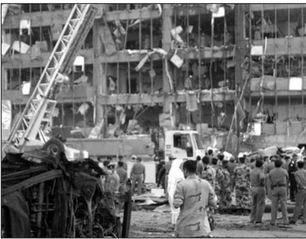
احد المباني الامنية التي تم تفجيرها على يد «القاعدة» في السعودية

انتحارية استهدفت تجمعات سكنية في الرياض عام 2003 إلى محاولة اقتحام أكبر محطة لعلاج النطق في العالم في أربيق عام 2006 وهي آخر عملية كبيرة قام بها المتشددون. وأضاف البيان أنه تم إحباط أكثر من 160 هجوما مزعما وأن القتلى يشملون 74 من قوات الأمن و90 من المواطنين السعوديين والسكان الأجانب. ولم يذكر البيان عدد المتشددين الذين قتلوا خلال الحملة، وذكر أن غاز السيانيد كان من بين الأسلحة المصادرة خلال الحملة الأمنية التي استهدفت المتشددين. وبدأ القضاء في المحاكمة العامة بالرياض النظر في القضية أمس ولكن لم يتضح وقت بدء المحاكمات. وقالت منظمة «هيومن رايتس ووتش»، (مراقبة حقوق الإنسان) ومقرها نيويورك إن المحاكمات ربما لا تطبق المعايير الدولية. وجاء في بيان للمنظمة «ما زالت الاتهامات لبعض رجال الدين أيوا علنا للمتشددين من بينهم ناصر الفهد وعلي الخضير وفارس الشويل. وبدأ «تنظيم القاعدة في جزيرة العرب» حملة لزعزعة استقرار الحكومة المحلية للولايات المتحدة عام 2003 ولكن قوات الأمن منعت من وقف العنف بالتعاون مع خبراء أجنبي، وظهر الفهد والخضير في التلفزيون الحكومي السعودي بعد احتجازهما عام 2003 مطالبين بإنهاء العنف. وتحدث بيان أمس عن وقوع 30 هجوما من تفجيرات