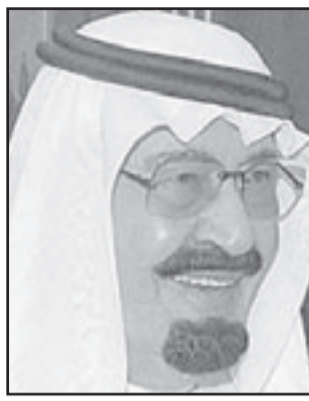
الرئيس محمود أحمديني

الإسدي الذي توفي عام 2000. ويعت الأسد بمزيد من الاشارات للقوى الغربية استعجاب الماضي حين أصدر مرسوما يسمح بإقامة علاقات مع لبنان للمرة الأولى منذ حصلت الجارتان على استقلالهما عن فرنسا في الأربعينيات. وتفتحت اسرائيل وسورية قناة للتفاوض عن طريق وساطة تركية تهدف إلى التوصل إلى اتفاق للسلام. وحصل اسرائيل مرتفعتا الجولان منذ حرب عام 1967. وتعتقد قوى غربية أن عقد اتفاق للسلام بين سورية واسرائيل يمكن أن يفك ارتباط دمشق بإيران الشيعة التي يؤثر نفوذها المتزايد قلق الولايات المتحدة والسعودية وحكومات عربية أخرى يقوؤها السنة في المنطقة. لكن الرياض تعتقد أن سورية القربة