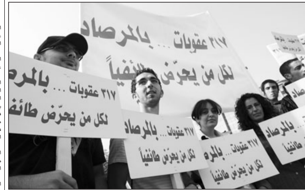
لبنانيون يطالبون بتطبيق العقوبات على المحرضين الطائفيين في احتجاج وسط بيروت

وشهدت جلسات الانتخاب تهجماً على رئيس مجلس النواب عبد الهادي المجالي من قبل النائب محمود العدوان، الذي اتهمه بأنه يدفع النواب للتصويت لصالح البعض وحجب أصواتهم عن البعض الآخر وهو يجلس في مكتبه.