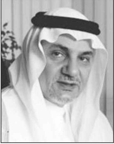
الأمير تركي الفيصل

■ لندن - يو بي اي: قالت مجموعة أبحاث أوكسفورد أن الأمير السعودي تركي الفيصل حضر اجتماعاً مغلقاً بالقرب من مدينة أوكسفورد البريطانية التقى خلاله شخصيات إسرائيلية وعربية بحث طرق إحياء عملية السلام على المسار الفلسطيني.