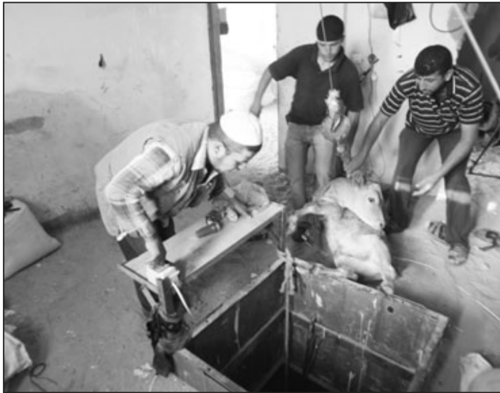
شبان فلسطينيون يهرون ماشية من خلال اتفاق غزة استعدادا للعيد الاضحى

ويعض النقاط تحتاج الى استفسار من القيادة المصرية».