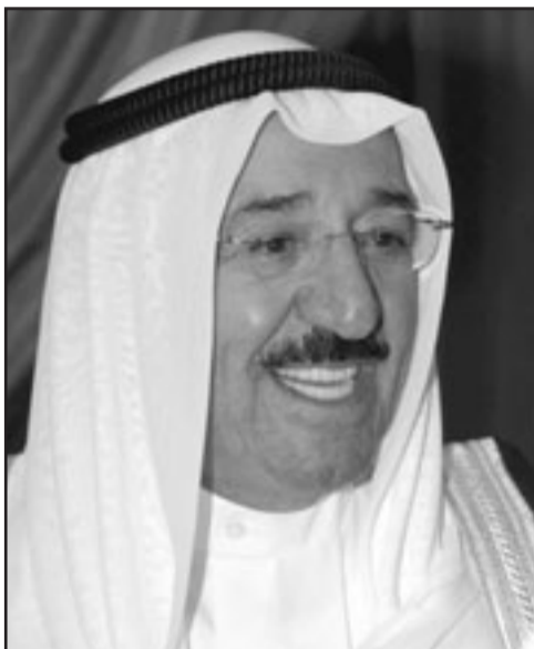
امير الكويت الشيخ صباح الاحمد الجابر الاحمد الصباح