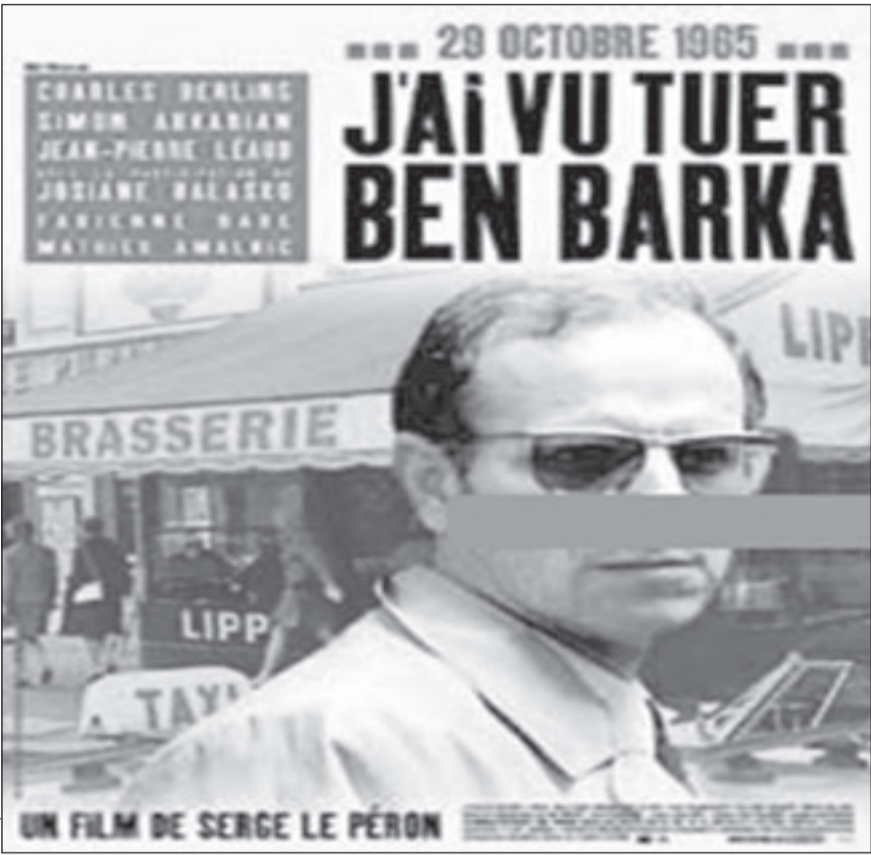
ملصق فيلم «لقد شاهدت اغتيال المهدي بن بركة»

لقد تناول الفيلم وفي جرأة نادرة في تاريخ السينما المغربية، مرحلة اعتقال هذا العميد والمدة التي قضاهما في السجن قبل تنفيذ حكم الإعدام الصادر في حقه.