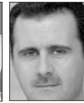
الملك عبد الله بن عبد العزيز

في العلاقات التقت وزيرة الخارجية الأمريكية كوندوليزا رايس بوزير الخارجية السوري وليد المعلم على هامش جلسات الجمعية العامة للأمم المتحدة أواخر الشهر الماضي وهو ثاني اجتماع لهما خلال 18 شهرا. لكن دبلوماسيا غربيا قال إن من غير المرجح أن تؤدي هذه الخطوات إلى تغيير في التفكير في الرياض. وأضاف الدبلوماسي الذي يتمتع بخبرة في الشؤون اللبنانية والسورية الكراهية التي يتكونها في السعودية لسورية هائلة، الملك عبد الله يقول إن بشار حثت بقسمه على الرغم من أننا لا نري ما هو هذا القسم. وتابع أن الحكومات العربية والأجنبية «بخست تقدير» الأسد طبيب العيون الذي جيء به من عالم الجهول في لندن إلى حد ما ليخلف والده حافظ