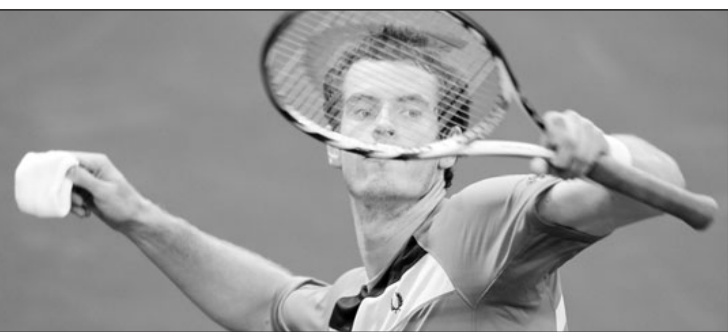
لاعب التنس البريطاني اندي موري