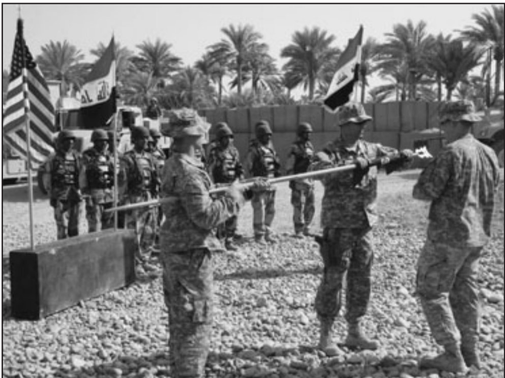
جنود امريكيون يسلمون قاعدة عسكرية في اليوسفية جنوب بغداد للجيش العراقي

ويعتبر تصريح جمودي وهو احد اعضاء وفد الائتلاف الشيعي الموحد في المباحثات التي تجري الان داخل المجلس السياسي للامن الوطني أول تصريح من نوعه يتحدث فيه عن موقف رئيس الحكومة من الإتفاقيه حتى الان.