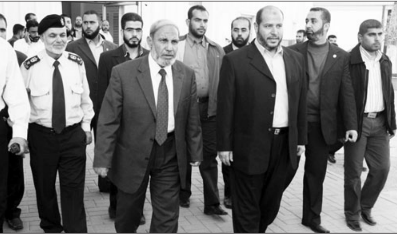
وفد حماس لدى مغادرته الى القاهرة امس