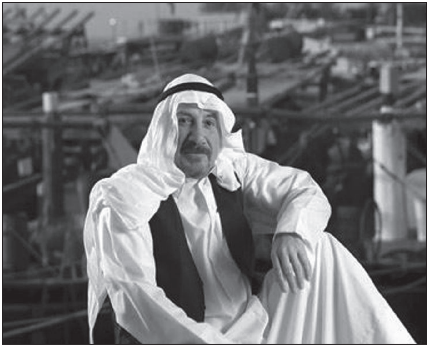
لقطة من مسلسل "الصلال"