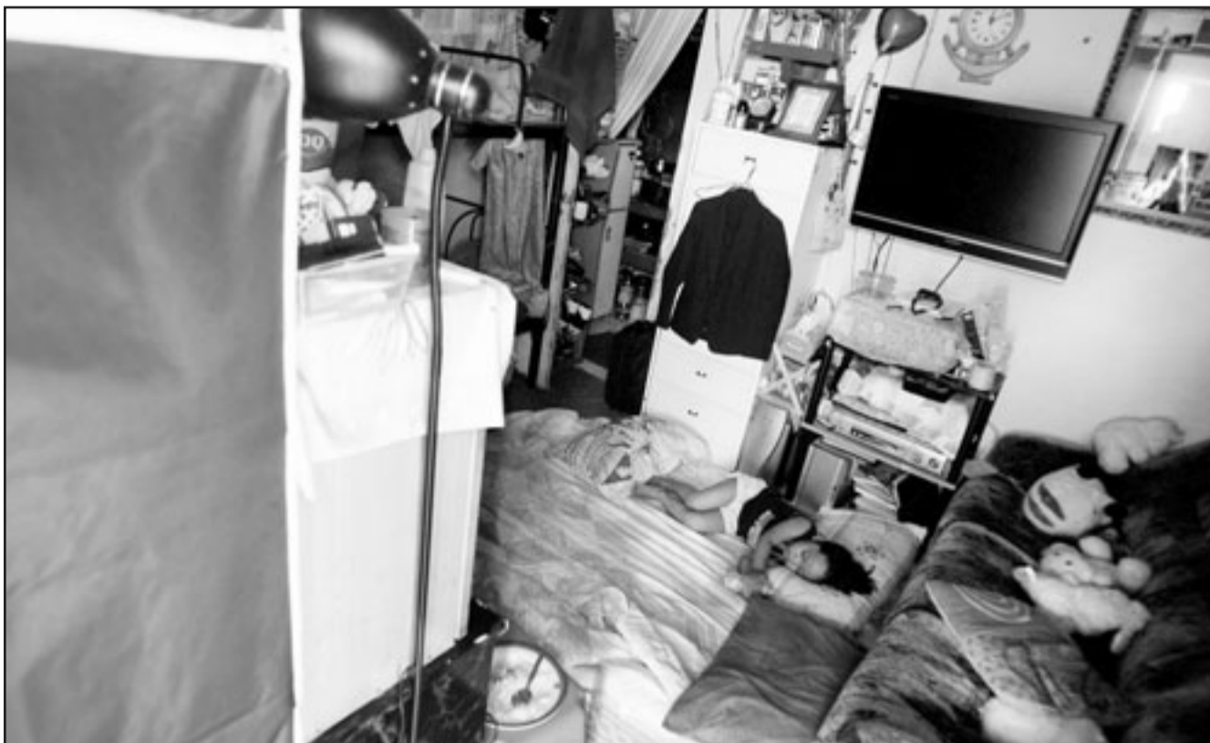
غرفة لعائلة اسبوية تعمل وتسكن في دبي ضمن منزل تتشارك فيه خمس عائلات

■ أبو ظبي - رويترز: قال مسؤول كبير بشركة كونوكو فيليبس يوم الاثنين إن بدء تشغيل منشأة لتصدير الغاز في قطر سيتأجل من 2009 إلى 2010. وقال ريان لانس مدير كونوكو لأعمال التنقيب والإنتاج في أوروبا وآسيا وأفريقيا والشرق الأوسط للصحافيين على هامش مؤتمر للطاقة في أبو ظبي إن منشأة ثانية ستأخر أيضا لكنها ستبدأ الإنتاج في العام المحدد لإنجازها وهو 2010، ويضفي عدد المشاريع الجاري تنفيذها بالنظر من في قطر أكبر بلد مصدر للغاز الطبيعي المسال في العالم إلى نقص في المواد والعمالة ويتسبب في تأخيرات. وقال لانس «الشروعان متأخران قليلا مثل كل المشاريع في قطر»، وأوضح أن خط قطر غاز 3 سيدخل الخدمة في 2010 بدلا من تشرين الثاني/نوفمبر 2009 كما كان مقررا من قبل. وأضاف أن قطر غاز 4 سيتأخر أيضا لكنه سيدبدأ الإنتاج في 2010. وتنتج المنشآت الغاز الطبيعي المسال للتصدير إلى الخارج بطاقة 7.8 مليون طن سنويا.