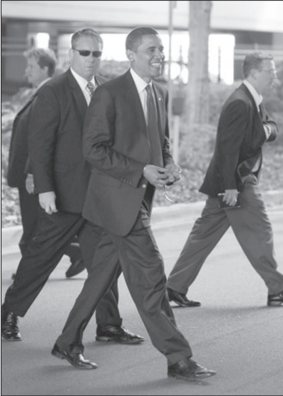
المرشح الديمقراطي باراك اوباما خارج مقر اقامته في طريقه لحملته الانتخابية في فلوريدا