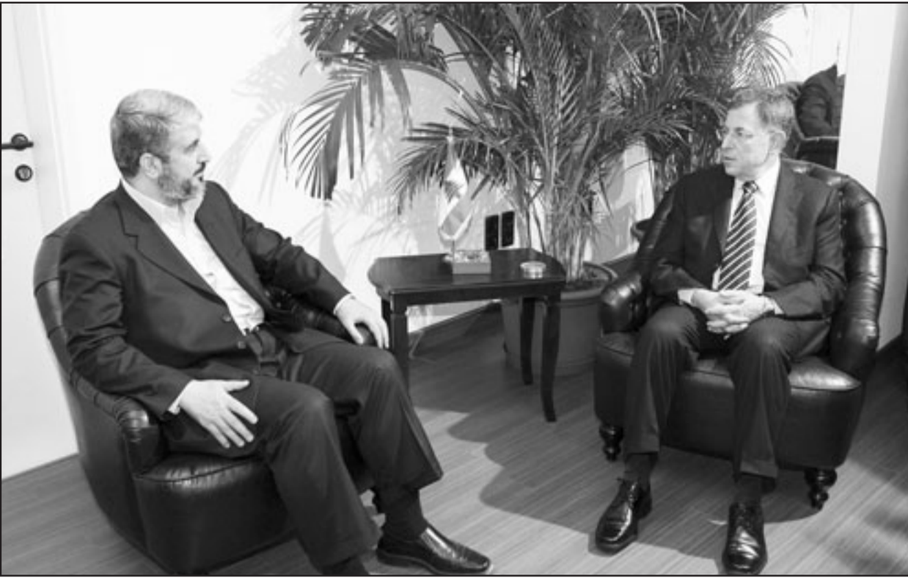
رئيس الحكومة اللبنانية فؤاد السنيورة لدى اجتماعه مع رئيس المكتب السياسي لحركة حماس خالد مشعل

غلبية في المجلس التشريعي، ونحن بحثنا ليس عن محاصصة، ولكن عن توحيد العنوان الفلسطيني في الداخل والخارج ونطلب من العرب أن يتعاملوا مع واقع الحقائق الفلسطينية على الأرض.. وفي برنامج خالد مشعل لقاء مع الأمين العام لحزب الله السيد حسن نصرالله.