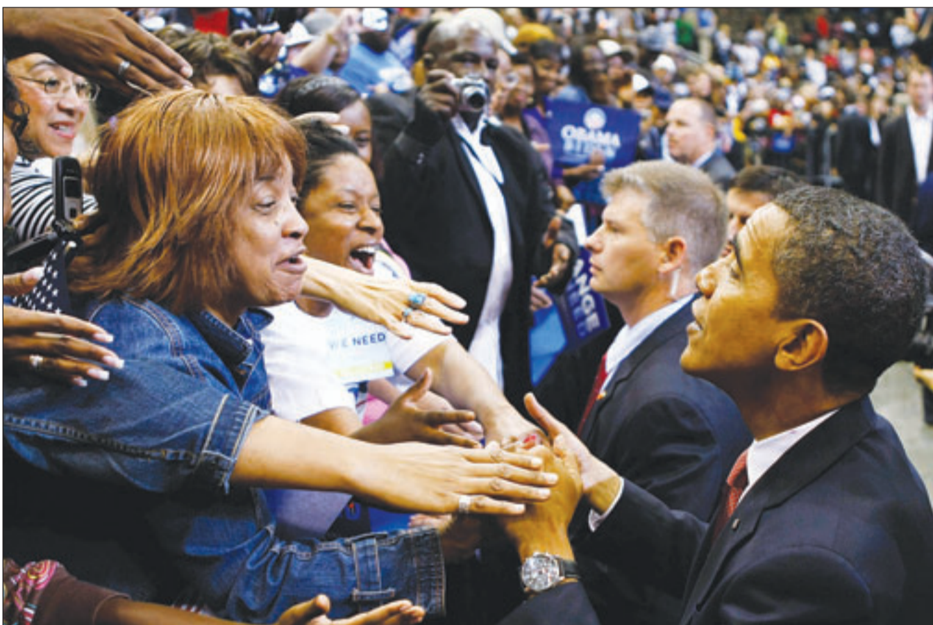
المرشح الديمقراطي باراك اوباما يصافح مؤيديه اثناء حملته الانتخابية في فلوريدا امس

لندن - «القدس العربي»: وكتب اوباما (47 عاما)، الذي قد يصبح بعد ساعات اول امريكي اسود يحتل المكتب البيضاوي في واشنطن، في مقال نشرته الاثنين «ول ستريت جورنال» اننا نعيش لحظة فارقة في تاريخنا (...). وعاء، اطلب منكم ان تكتبوا فصلا مقبلا هاما في تاريخ امتنا». واضاف المرشح الديمقراطي اننا اعطينومي اصواتكم فاننا لن نكسب فقط هذه الانتخابات معا بل اننا سنغير هذا البلد وسنغير العالم». ويحاول ماكين جاهدا اللحاق باوباما بعد ان كشفت سلسلة استطلاعات تقدم المرشح الديمقراطي في ست ولايات من بين ثماني ولايات رئيسية في معركة الوصول للبيت الابيض، ومن المقرر ان يفتح اول مكتب اقتراع الثلاثاء في الساعة الخامسة بتوقيت غرينتش في قرية ديكسفيل نوتش نيوهامشير (شمال-شرق) التي يقطنها 75 الف مواطن، وتفتح غالبية مكاتب الاقتراع على الساحل الشرقي بين العاشرة والثانية عشرة بتوقيت غرينتش. وساعدت الأزمة الاقتصادية التي قاومت من انتشار شعبية الرئيس جورج بوش في رفع اوباما ورسالته عن «التغيير» من سياق شديد التقارب في آب