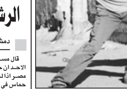
شباب فلسطينيان يرفشان جنود الاحتلال بالحجارة خلال توغلم في مخيم الفارعة قرب مدينة جنين

من أشرف الهور: بدأت الدولة العبرية تعمل بشكل واضح بهدف إفشال مؤتمر الحوار الفلسطيني الشامل المزمع عقد أوائل الأسبوع المقبل في العاصمة المصرية القاهرة، وديانت دوائر صناع القرار في تل أبيب بتسريب المعلومات لإعلام الجبري حول الموقف الرسمي الإسرائيلي من المفاوضات التي ستجري في القاهرة لراب الصدع داخل البيت الفلسطيني. وقالت المصادر الإسرائيلية الرسمية أن الاتفاق بين حركة المقاومة الإسلامية (حماس) وبين حركة فتح بزعامة الرئيس الفلسطيني محمود عباس (أبو مازن) يتناقض مع المفاوضات الجارية الآن بين الطرفين الإسرائيلي والفلسطيني. ونقلت وسائل الإعلام العبرية عن مصادر مقربة من ديوان رئيس الوزراء الإسرائيلي المستقيل إيهود أولمرت قولها أن توحيد الفصائل الفلسطينية التي ستجتمع في القاهرة على أساس توحيدها وتشكيل حكومة تكنوقراط فلسطينية، كما طرح المبادرة لإعلام هي عليا وقد انفجرت بين السلطة الوطنية الفلسطينية وبين الدولة العبرية، وزادت المصادر قائلة إن الحوار سيعتبر ناجحاً بالنسبة لأقطاب الدولة