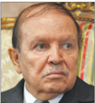
الرئيس الجزائري عبد العزيز بوتفليقة

واضاف البيان المعنون بـ«في شهر الثورة لا بد من ثورة سياسية عامة» والذي حصلت «القدس العربي» على نسخة منه ان «بيت القصيد من التعديل هو المادة 74 والبقية إنما هي حيلة وخدعة وانصتبا للارادة الشعبية بقباز من حريز لا يقل خطورة عن الانقلاب على اختيار الشعب في 1992». وقال بلحاج في بيانه: «التعديل عن طريق البرلمان الحالي سوف يتسبب بالبطالان لأنه برلمان فاقد للشعبية الشعبية... وهو برلمان سخر نفسه لخدمة السلطة الفاسدة عوض خدمة مصالح الشعب». وذكر: «أن الطريقة الماكرة التي سوف يتم بها التعديل والتي تصعد إلى الانتعاف على الإرادة الشعبية واغصاب حقها في الاختيار الحر سوف تكون لها آثار وخيمة لا تحمد عقباها لأن غلق ابواب التغيير السياسي السلمي يدعو إلى ثورة عارمة تطيح برموز الاستبداد والفساد بجميع أنواعه لاسيما ونحن في شهر الثورة ثورة نوفمبر الجيدة والجزائر تحتاج إلى رئيس قوي الشبكية صادق العزم وافر الصحة والعافية غير خاضع لمراكز القوى المتصارعة بخدات قرارات ثورية جذرية لإصلاح أوضاع البلاد».