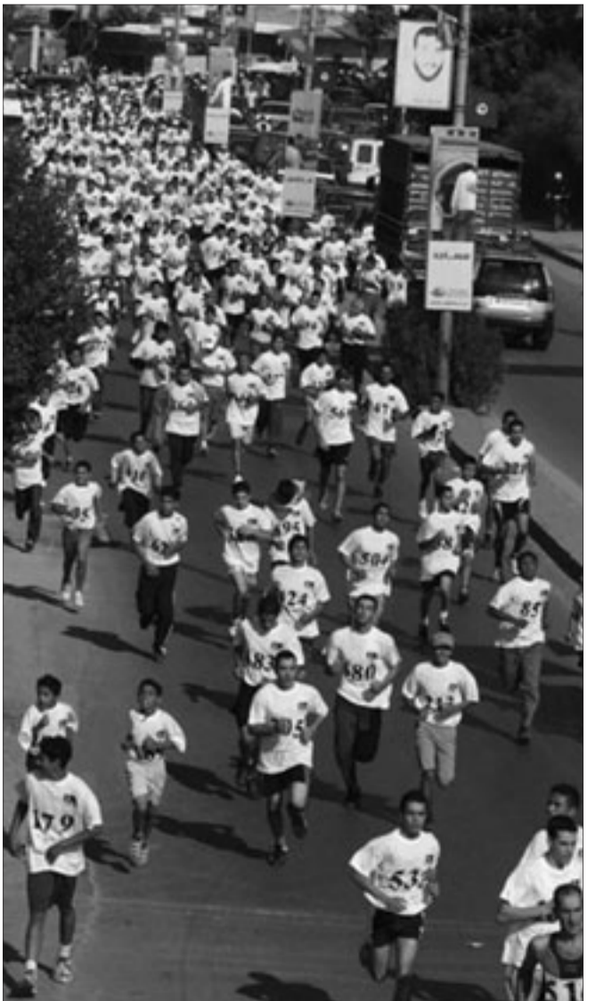
ماراثون لحياء الذكرى 60 للثورة الفلسطينية