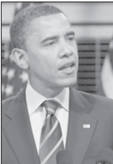
الرئيس الجديد باراك أوباما

كل اتفاق دولي يرمي الى ان يضائل مضاعلة كبيرة اطلاق الغازات الدقيقة؟ وماذا سيحدث لازمة في دارفور وكيف سيبنى الرئيس الجديد نظام العلاقات بروسيا والصين؟