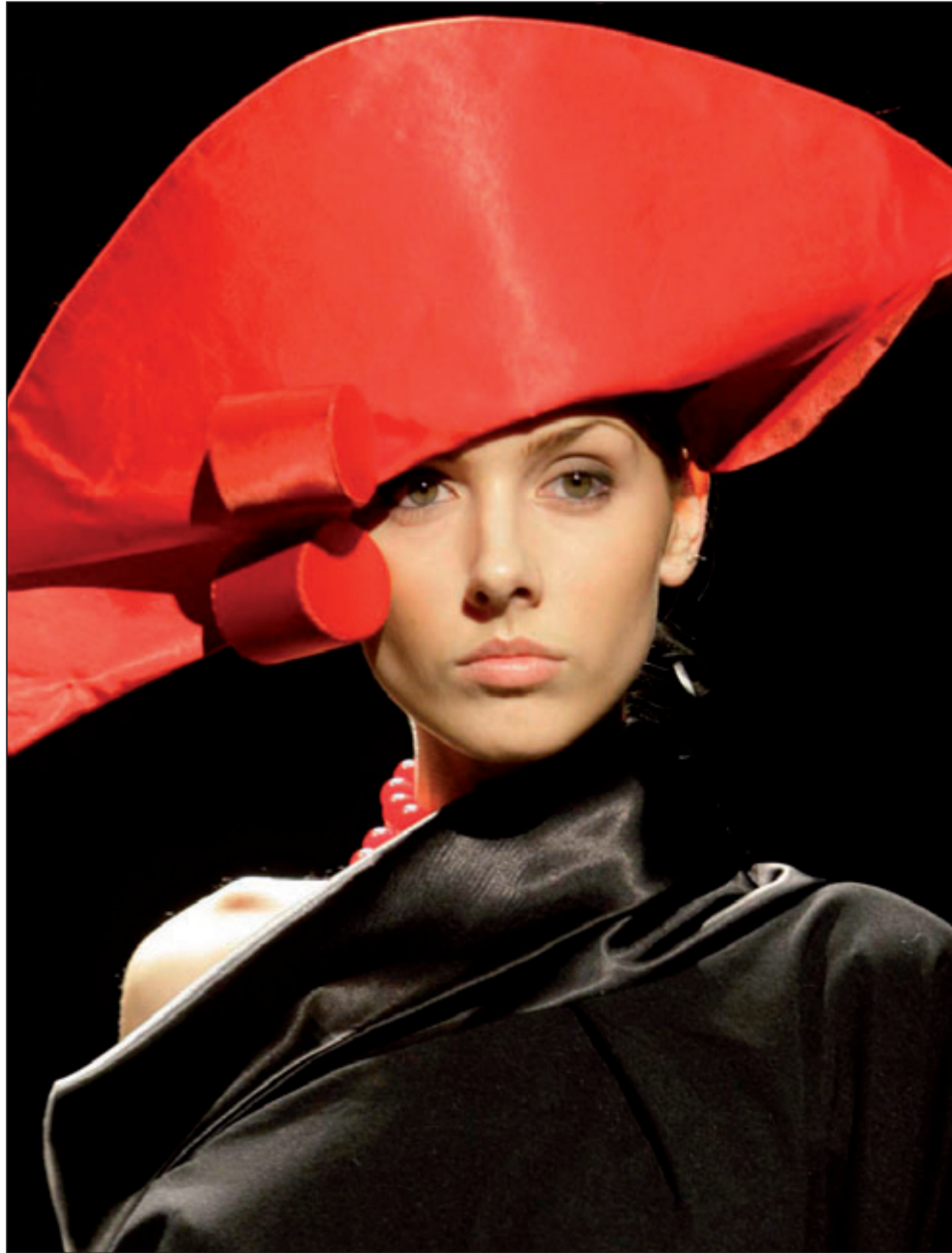
من مبركات مصممة الازياء الروسية ديانا رازدورسكايا قدم هذا التصميم امس في عرض دولي اقيم بمدينة سان بطرسبرغ

من كتاب الصلوات المُحرّف: (يكشف الله ما نعجز عن فهمه في سطوح تام، أما ما يمكننا فهمه، فيُخفيه وراء الغاز). غالباً ما تراودني مثل هذه الفكرة: إن الإنبطاع (المزيّف) الذي تعطيه مكاشفاتنا الساخنة لن تحب، يجعله لا يُصدق أن الخيار أمامه مفتوح على مكاشفته لنا بالمثل. أقول لنفسي (أنا رقيقة بطبعي، وعاطفية، لكن يُساء فهمي في عقل آخر، في مكان آخر، وعلى أن أكتب بشكل مُختلف). كما لو أنني أقول: (يمكنني أن أكون عاطفية، لكنني في الرسائل يجب أن أكون إنسانة أخرى).