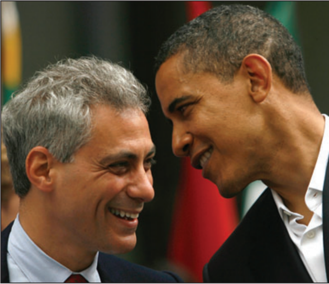
الرئيس المنتخب باراك اوياما مع رام ايمانويل الذي اختاره رئيساً لهيئة موظفي البيت الابيض