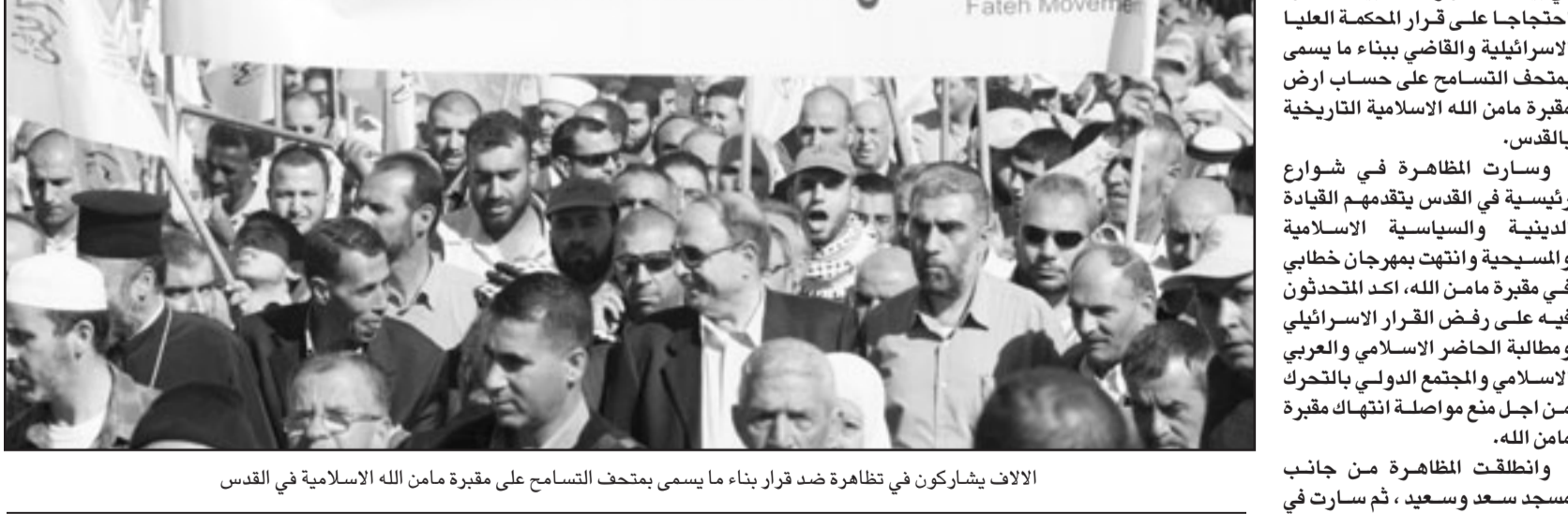
الالاف يشاركون في تظاهرة ضد قرار بناء ما يسمى بمخيم التسامح على مقبرة مامن الله الاسلامية في القدس

المعاملة المفترضة، من هنا صعوبة اجراء احصاءات موثوق بها». وأكد ان «معظم الاشخاص الذين كانوا ضحية تعذيب يخشون الالراء بشهادتهم». ولاحظت هذه المنظمات غير الحكومية ان لبنان الذي وقع ميثاق الامم المتحدة المناهضة للتعذيب والمعاملة غير الانسانية العام 2000، لم يقدم منذ سبعة اعوام اي تقرير حول الاجراءات التي كان ينوي اتخاذها للتعذيب لهذه الظاهرة. وأضافت ان «عدد الشهادات حول اعمال تعذيب مفترضة ازداد بوضوح خلال معارك مخيم نهر البارد العام