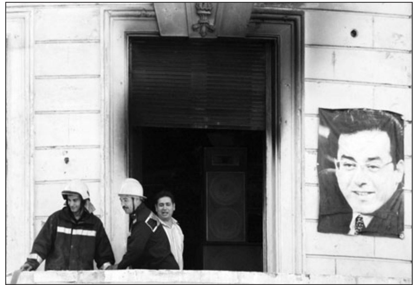
عمال اطفاء امام مبنى حزب الغد المصري المعارض الذي شبت فيه النيران امس اثر مصادمات عنيفة بين اعضاء متنازعين في الحزب استخدمت فيها الزجاجات الحارقة والحجارة