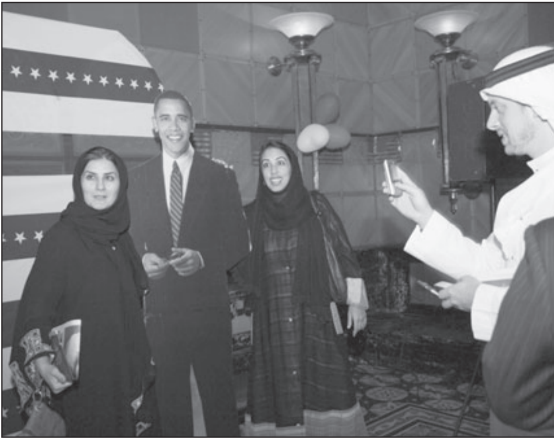
سعوديتان في صورة تذكارية مع مجسم للرئيس الامريكى القادم براك اوباما خلال حفل للسفارة الامريكية بجدة