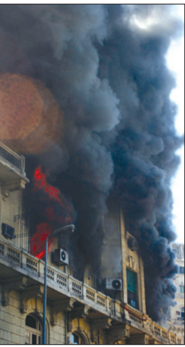
النيران تلتهم مقر حزب الغد في وسط القاهرة امس

واكدت ان مدينة القدس ستبقى العاصمة الابدية للدولة العبرية، بجذورها العبرية والشرقية، مذكرة بتصريح اوياما في مؤتمر ايباك مؤخرا بأنه يؤيد هذا الطرح.