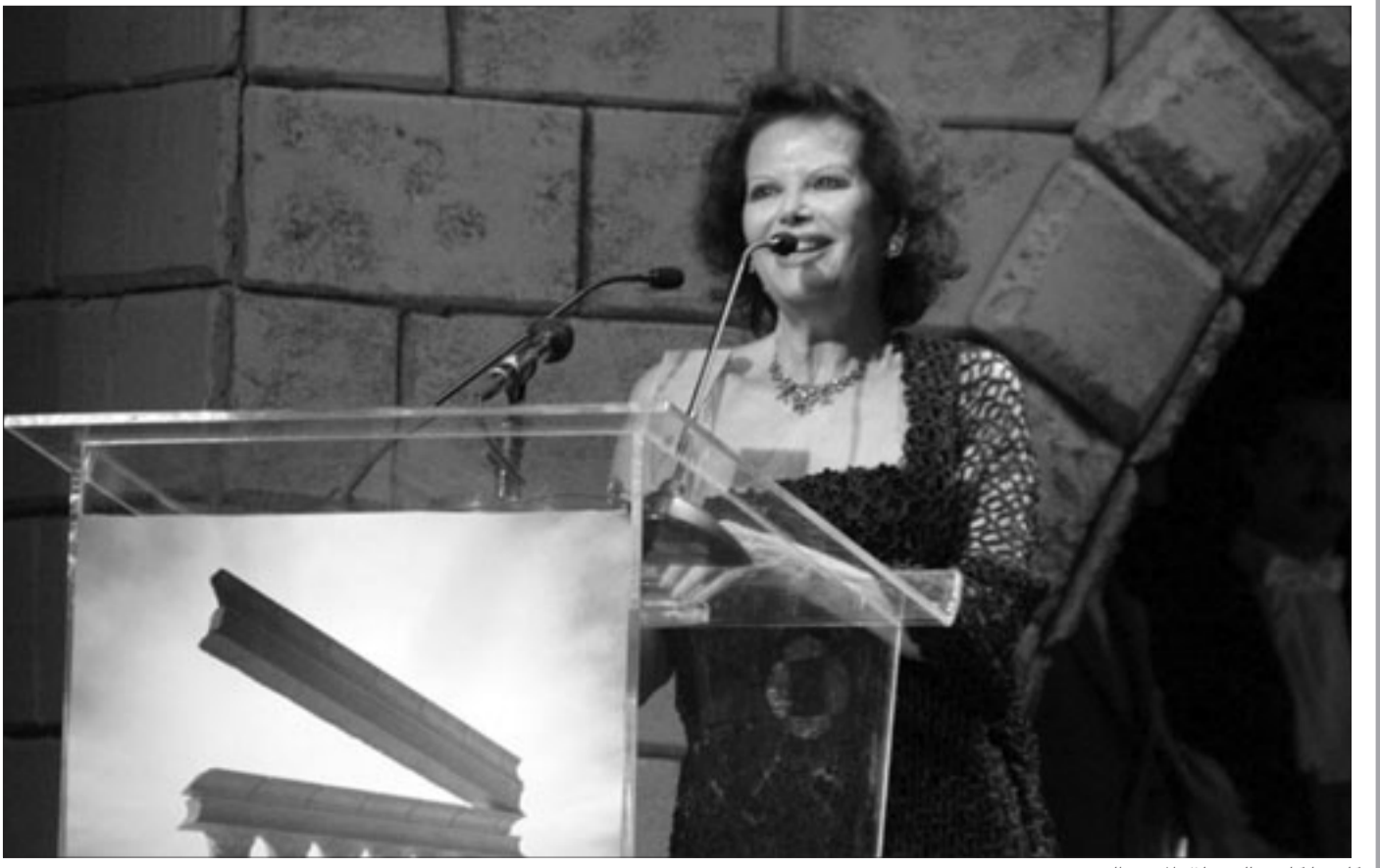
كلوديا كاردينالي خلال المؤتمر الصحفي

كما رفضت فكرة العمل في الإنتاج السينمائي لأنها ممثلة فقط، وتحب التمثيل. وحول السؤال ما إذا كانت تحب أن تلعب دوراً محمداً أو تمثيل شخصية تاريخية معينة، أكدت أنها لا تتدخل في اختيار الشخصيات، فالممثل يبحث عن فرصة عمل، وعليه أن يؤدي كل الأدوار، فهي لعبت أدوار الأميرة كما لعبت أدوار المومس، هكذا هي الحياة.