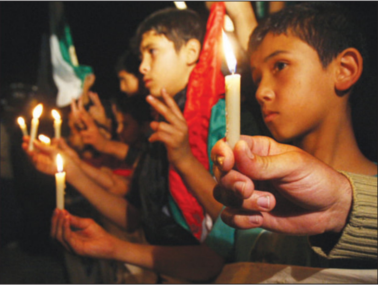
اطفال فلسطينيون يحملون الشموع اثناء اعتصام امام محطة توليد الكهرباء في غزة احتجاجا على وقف امدادات الوقود في القطاع