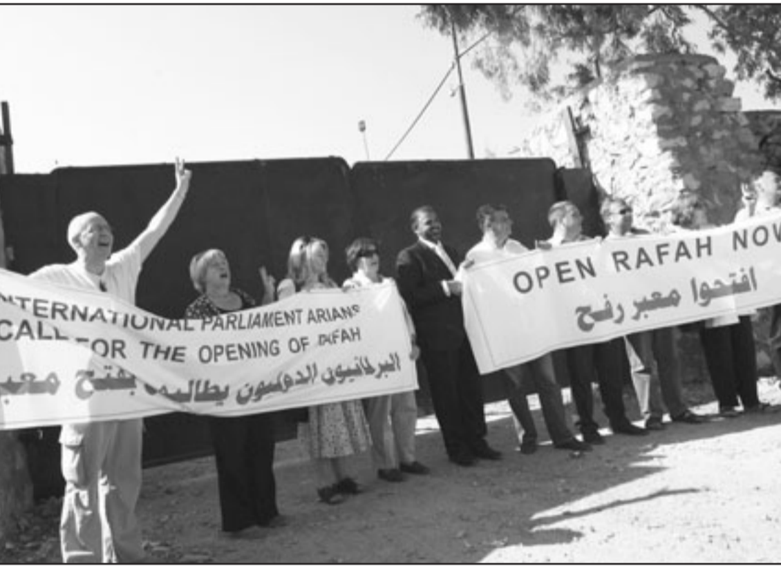
متظاهرون اجانب يطالبون بفتح معبر رفح