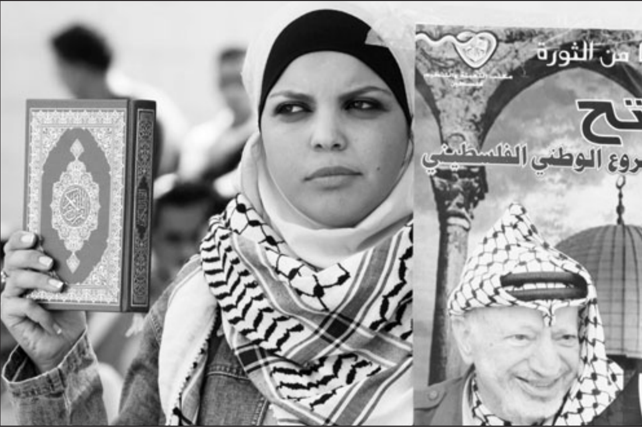
فلسطينية تحمل مصفقا للرئيس الراحل ياسر عرفات والقرآن الكريم خلال مسيرة لحركة فتح في مخيم العروب قرب الخليل