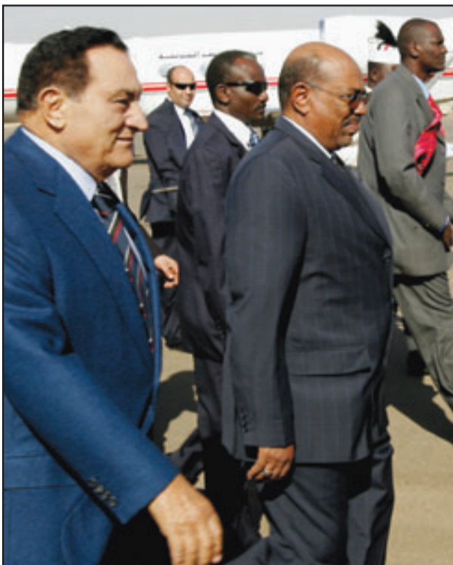
الرئيس مبارك لدى وصوله مطار الخرطوم امس حيث كان البشير في استقباله

وذكرت وكالة انباء الشرق الاوسط المصرية الرسمية ان مبارك اجتمع في وقت سابق مع الرئيس السوداني عمر حسن البشير في الخرطوم حيث اجريا