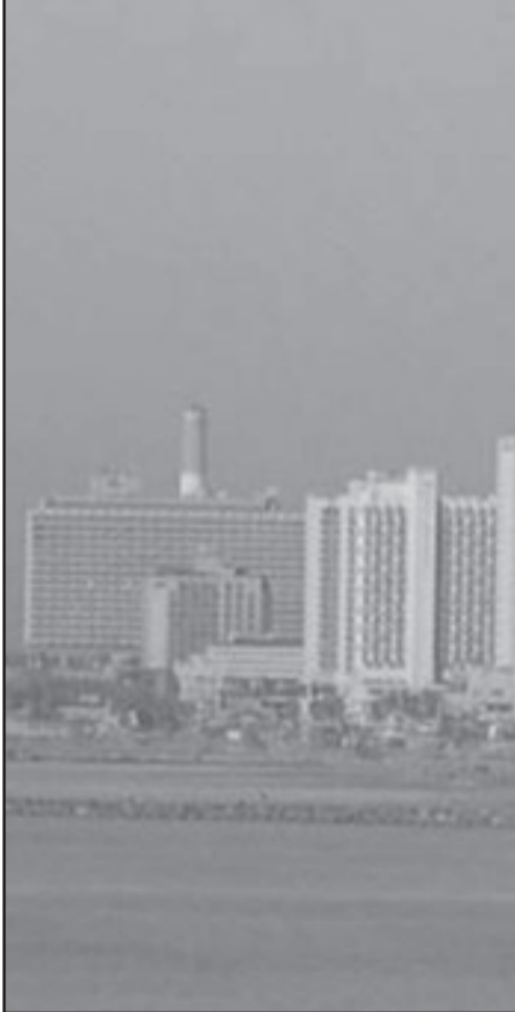
مدينة تل ابيب

على المحك ليس تحول اسرائيل الى دولة لكل مواطنيها وانما ان تكون تل بيب- يافا مدينة لكل سكانها. حنين من ناحيته برهن على ثقائه عندما ضم الي قائمته من ائتباع الليكود واصحاب القبعات من التدينيين. لذلك ليس هناك مبرر للحملة البائسة القبيحة التي تشن ضده. هو والحركة التي يترأسها سبب الافتخار الوطني والاعتزاز وليسا سببا للملاحقة الكارثية.