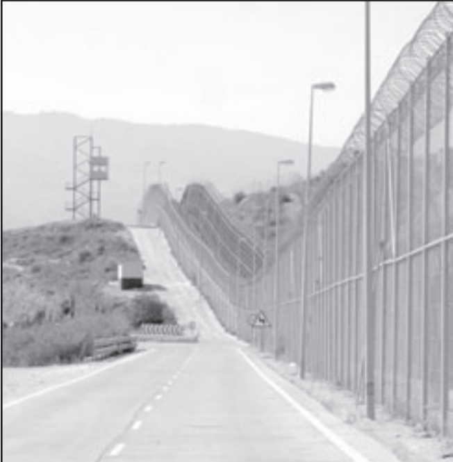
السياج الفاصل بين الأراضي المغربية ومليلية والتي يحاول الافارقة اجتيازها