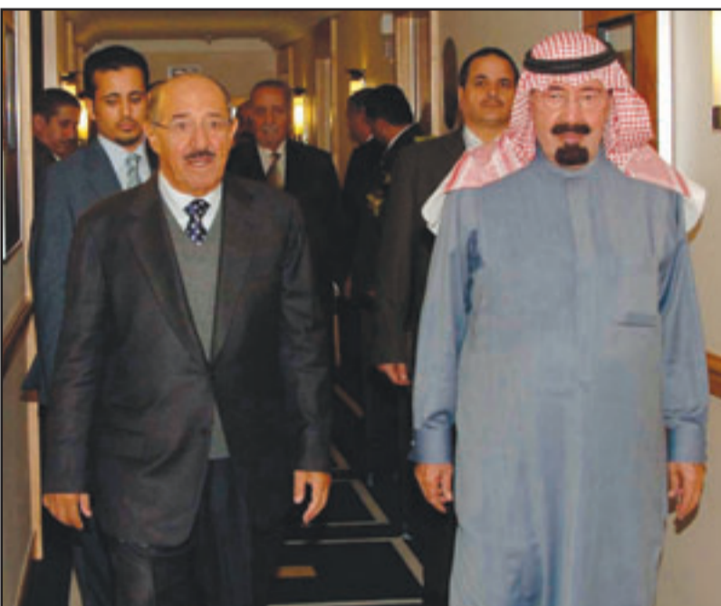
الملك عبد الله بن عبد العزيز لدى استقباله امير الكويت الشيخ صباح الاحمد الصباح في نيويورك امس

ومن المتوقع ان يستغل القادة الإسرائيليين المؤتمر للاجتماع مع زعماء من العالم العربي والإسلامي، وكان الملك السعودي عبد الله بن عبد القلق إزاء تزايد مشاعر عدم التسامح والكرهية التي تتعرض لها الأقليات الدينية في كافة الدول. وقالت صحيفة «عكاظ» السعودية امس انها علمت ان مشروع الاعلان يؤكد على أهمية تشجيع الحوار والتفاهم والتسامح بين شعوب العالم مع احترام تنوع الأديان والثقافات والمعتقدات. ووصفت حركة الجهاد الإسلامي «حوار الأديان» بأنه «غلاء للتطبيع وتعميت على الاستيطان وتهوديد القدس»، وانتقدت حركة الجهاد في بيان لها الحضور العربي والإسلامي للربع لهذا المؤتمر، وقالت «يلتقي الثلاثة وعدد من الرؤساء والملوك العرب في مؤتمر حوار الأديان، الذي يقام بمشاركة زعماء وقادة الاحتلال الصهيوني فيما تتواصل الجرائم والاعتداءات على أرض فلسطين». وأعلن البيت الأبيض ان الرئيس الأمريكي المنتهية ولايته جورج بوش سيشترك في المؤتمر، بعد ان قبل الدعوة الشخصية التي وجهها اليه المهال السعودي الملك عبد الله، وأعلنت إسرائيل أن كل من الرئيس شمعون بيريس، إضافة إلى وزيره الخارجية تسيبي ليفني، سيشركان في المؤتمر.