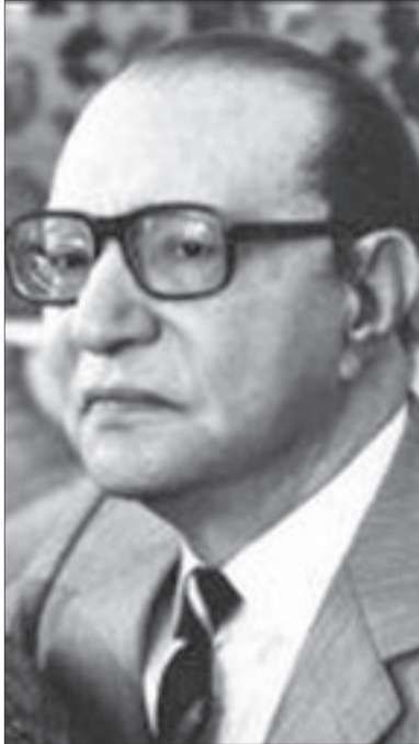
محمد عبد الوهاب

تغيرت ايجابية وجدت معبرا لها لدى عبد الحليم، حتى أن الكاتب الصحفي الكبير أحمد بهاء الدين قال عنه «كانت أمانا فيه كبيرة» فقد كان عبد الحليم قريبا جدا من جمال عبد الناصر حتى أن الزعيم أمر في إحدى المرات بتاجيل سفره إرضاء للفنان الذي غنى أغنية المسؤولية، أما الفنان إذ كان مدركا إلى حد بعيد مكانة هذا الزعيم وثورته التي كانت ثورة للشعب العربي كله، حتى سمي عبد الحليم بابن الثورة.