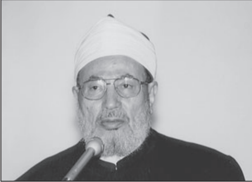
العلامة الشيخ يوسف القرضاوي

الدين العرب والافارقة والاسويين. ولفت مراقبون شيعية إلى ان رجال الدين «الوهابيين، باتوا يلعبون في الوقت الضائع خصوصا بعد التفاهم الذي وضع حدا للجدل في وجه الشيعة ونذر عليه دموع التماسيح وهم اول من أشبعه إساءة وتشويهها على مدى عقود طويلة».