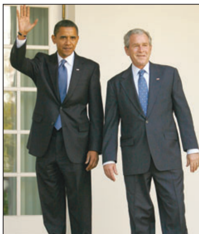
الرئيس أوباما والرئيس جورج بوش

احتمال عودة تنظيم القاعدة الى الحياة في العراق. ونقلت الصحيفة عن هاموند قوله ان هناك «احتمالا بعودة القاعدة الى الحياة في حال اساءة التعامل مع هذه المرحلة الانتقالية». و رأى هاموند ان هذا الامر يمكن ان يحدث من دون قصد بسبب فقر الدعم اللوجستي، او في حال عدم ابداء الحكومة العراقية الحساس المطلوب لاضفاء الشرعية على عناصر الصحوات. وذكرت الصحيفة ان هاموند ابغ موقعا للصحافة في بغداد في اثناء اجتماع عقد مؤخرا مناقشة الدعم اللوجستي مع تولى السلطات العراقية دفع المرتبات التي تبدأ اليوم ان «من المحتمل ان يكون هذا الامر آخر فرص القاعدة هنا في بغداد لحاوله تدمير عنصر اساس من عناصر امتنا».