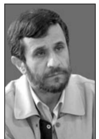
الرئيس الإيراني احمدى نجاد

طهران - اف ب - يو بي آي: قالت ايران الاثنين انها لا تتوقع فرقا كبيرا في سياسة واشنطن تجاه طهران عند تسلم باراك اوباما الرئاسة في كانون الثاني (يناير) المقبل. وصرح حسن قشقوي المتحدث باسم وزارة الخارجية الإيرانية للصحافيين في مؤتمره الصحفي الاسبوعي «يجب الا نتوقع الكثير من التغيير او التطور في السياسات الاستراتيجية للسياسة الامريكية الخارجية». وجاء تصريحه ردا على سؤال حول ما اذا كانت ايران تتوقع ان يتخذ اوباما مع الحكومة الحالية برئاسة محمود احمدى نجاد الانتظار حتى الانتخابات الرئاسية الإيرانية المقبلة في حزيران/يونيو المقبل. وسارع احمدى نجاد نفسه الى توجيه التهنئة الى اوباما عقب فوزه الكاسح في الانتخابات الاسبوع الماضي في خطوة غير مسبوقة لزعيم إيراني منذ قطع العلاقات الدبلوماسية بين البلدين قبل 30 عاما. وقال قشقوي ان استراتيجيات ايران لا تغيرها الحكومات المتغيرة. وأوضح ان السياسات الكبرى للجمهورية