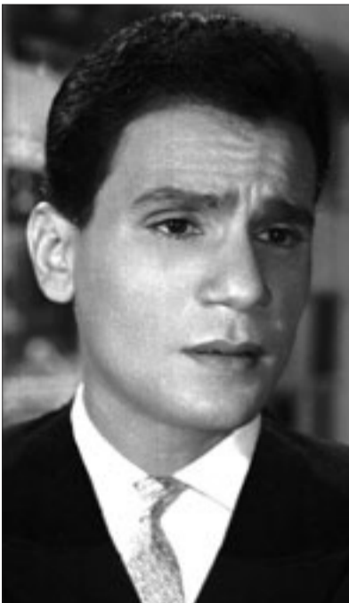
عبد الحليم حافظ