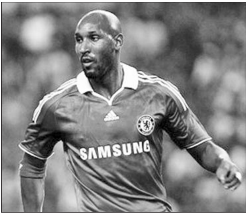
الفرنسي نيكو لانيلكا مهاجم تشيلسي