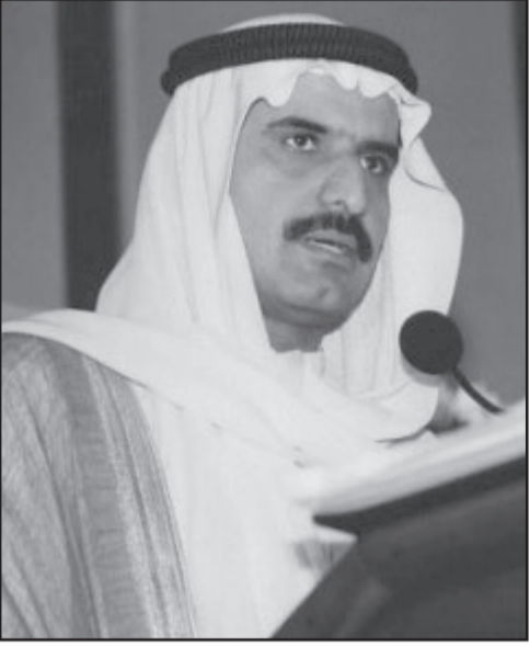
الوزير الاماراتي السابق خليفة الفلاسي

وقال الجزيري ان «هذه وقائع وموضوع حساس في سنة 2005 عندما فض الشركاء الشركة في ما بينهم وقاموا بتوقيع اتفاقيات» ويتم استجواب عدد من كبار الاسماء في عالم الاعمال في دبي في قضايا فساد الا ان الجزيري قال ان قضية الفلاسي «لا علاقة لها بقضايا الفساد هي قضية خاصة».