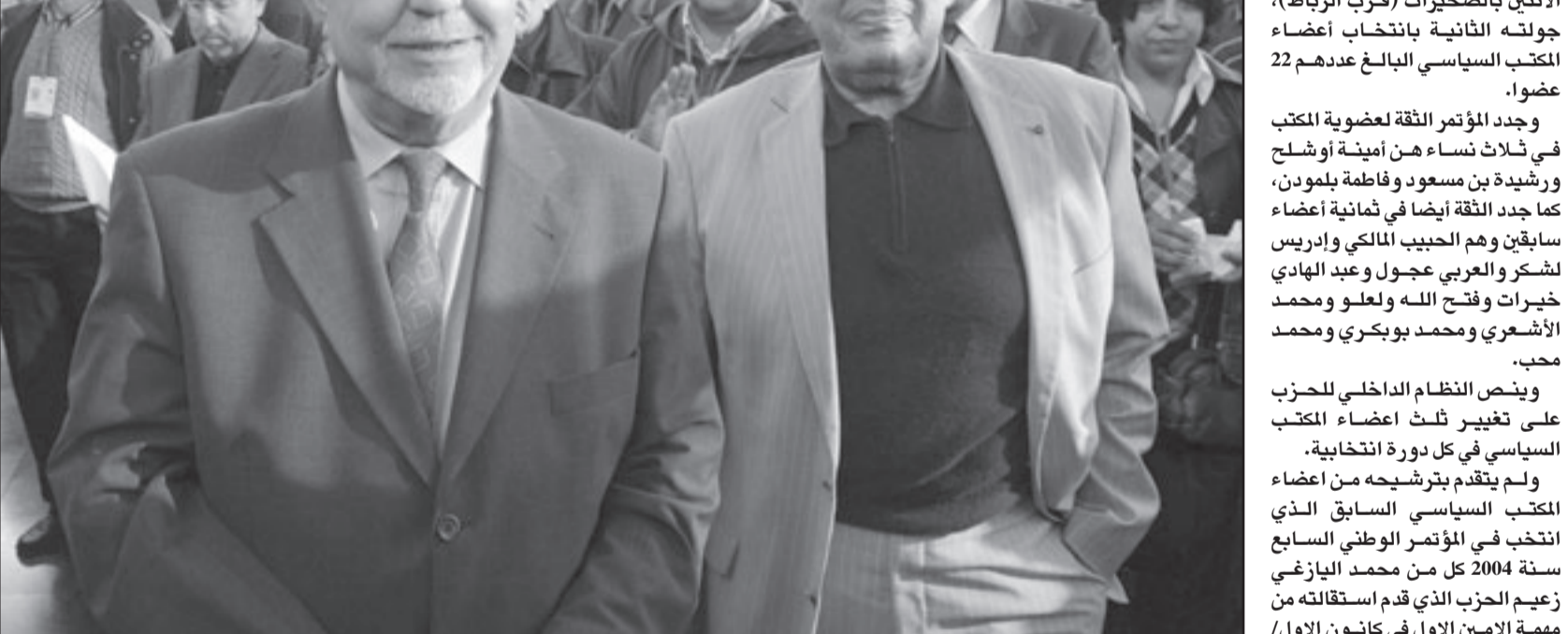
الامين العام الجديد للاتحاد الاشتراكي للقوات الشعبية، عبد الواحد الراضي (يمين) برفقة سلفه محمد البيازغي الذي شهد الحزب في عهده انتكاسات كبيرة

كما انتقد العاهل المغربي أيضاً الخميس «رفض» الجزائر تطبيق علاقاتها مع بلاده وإعادة فتح الحدود المشتركة بين البلدين المغلقة منذ 1994 اثر اعتداء اسلامي في مراكز نسبته السلطات المغربية للاجهزة السرية الجزائرية.