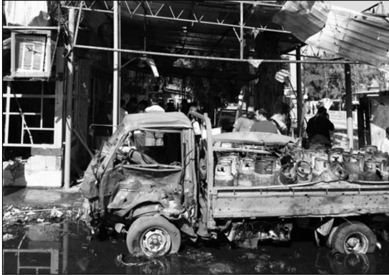
من آثار الهجوم في الاعظمية امس

وأوضح المسعودي أن التعديلات التي أُرِيدتها الحكومة شكلية، ولا تنس جوهر الاتفاقية، كما أن الحكومة لم تكشف ما تريد تعديله، وذكر: «أن الشعب العراقي يعي ما يحصل، ولن يقبل بالاتفاقية لأنها استعمار وانتداب جديد».