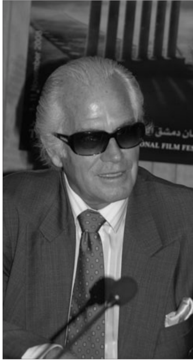
ريتشارد هاريسون خلال المؤتمر الصحفي

ثم تطرق في حديثه مع الوزير للشأن السياسي، فهو يحب السياسة باعتبارها حياة، مع أن الكثير من الناس لا يدخلون معتبركها ومع ذلك يعانون من نتائجها، بل قد يكونون ضحاياها.