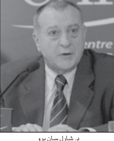
د. شارل سان برو

الاسلام والشرق الأوسط. وقال انه نتيجة سياسات غربية عدائية تحولت بعض الجماعات في العالم الإسلامي إلى التطرف في وجهها من تعبير عنه. وعلى الجانب الآخر تلتقت بعض الدوائر السياسية والفكرية في الغرب، خصوصا في الولايات المتحدة، هذه الحقبة، وروجت لها لتبرير سياسات توسعية تتستر خلف مزاعم الحرب على الإرهاب، لغزو الدول والسيطرة على مواردها، وتكريس واقع التفوق والهيمنة الامريكية. وقال ان أفضل شيء يجب عمله في أوروبا هو شرح حقيقة الاسلام من خلال اكتوبريات ومعاهد متخصصة وانا اقوم حاليا بتدريس الإسلام في الجامعة باريسيس وقمت بتأليف كتاب «الاسلام بالفرنسية» مؤخرا في محاولة لإيقاف الهجوم الغربي على الدين الإسلامي. وأكد الدكتور سان برو على ضرورة ابلاغ الغرب عموما بان الاسلام ليس دين التطرف بل التسامح والسلام والتوحيد مثل المسيحية ويجب ان يفهم الغرب انه بجانب الجماعات الإسلامية، تمكن المتطرفون من استغلال حالة العجز أصاب الفكر الإسلامي، وجهل العديد من المسلمين بثرأ مدارسهم الفكرية، لتشويه بعض المفاهيم الإسلامية، والحيد بها عن عادية عززت حالة متطرفة على الجانبين، في العالم