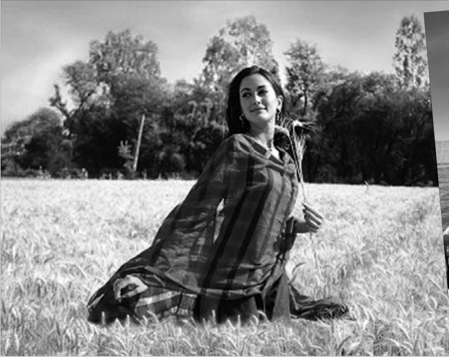
لقطة من فيلم «نحن الشعب»