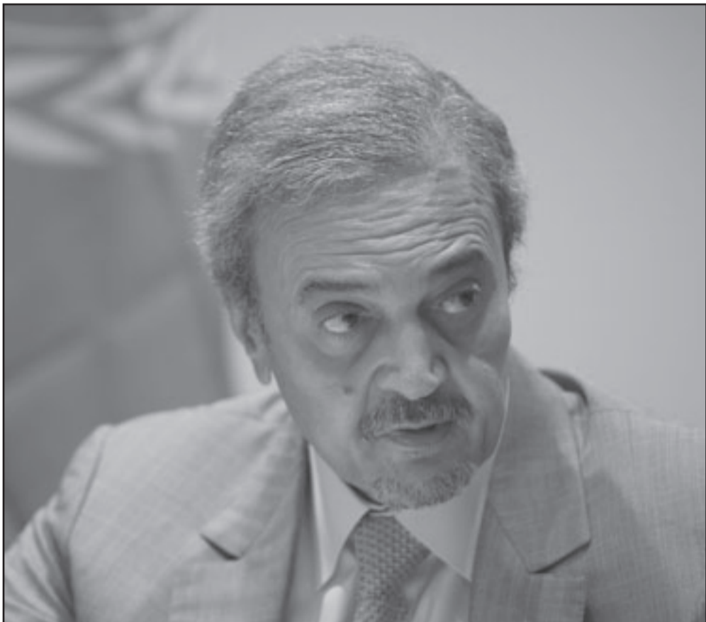
الامير سعود الفيصل

أكثر من 70 رئيسا ورئيس حكومة من الإبرياء وأفعال الإرهاب والعنف والقهر» وقال الأمين العام للامم المتحدة بان كي مون في مؤتمر صحفي إن المؤتمر كان «رسالة قوية إلى العالم».