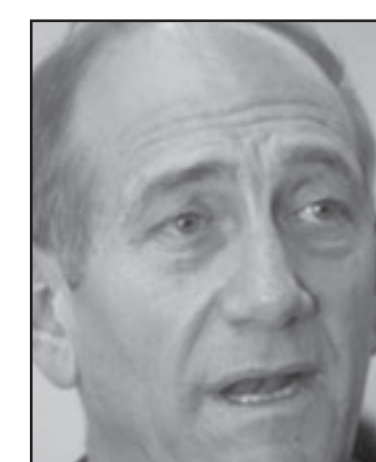
أولرت وهنية.. تقارب في يوم واحد