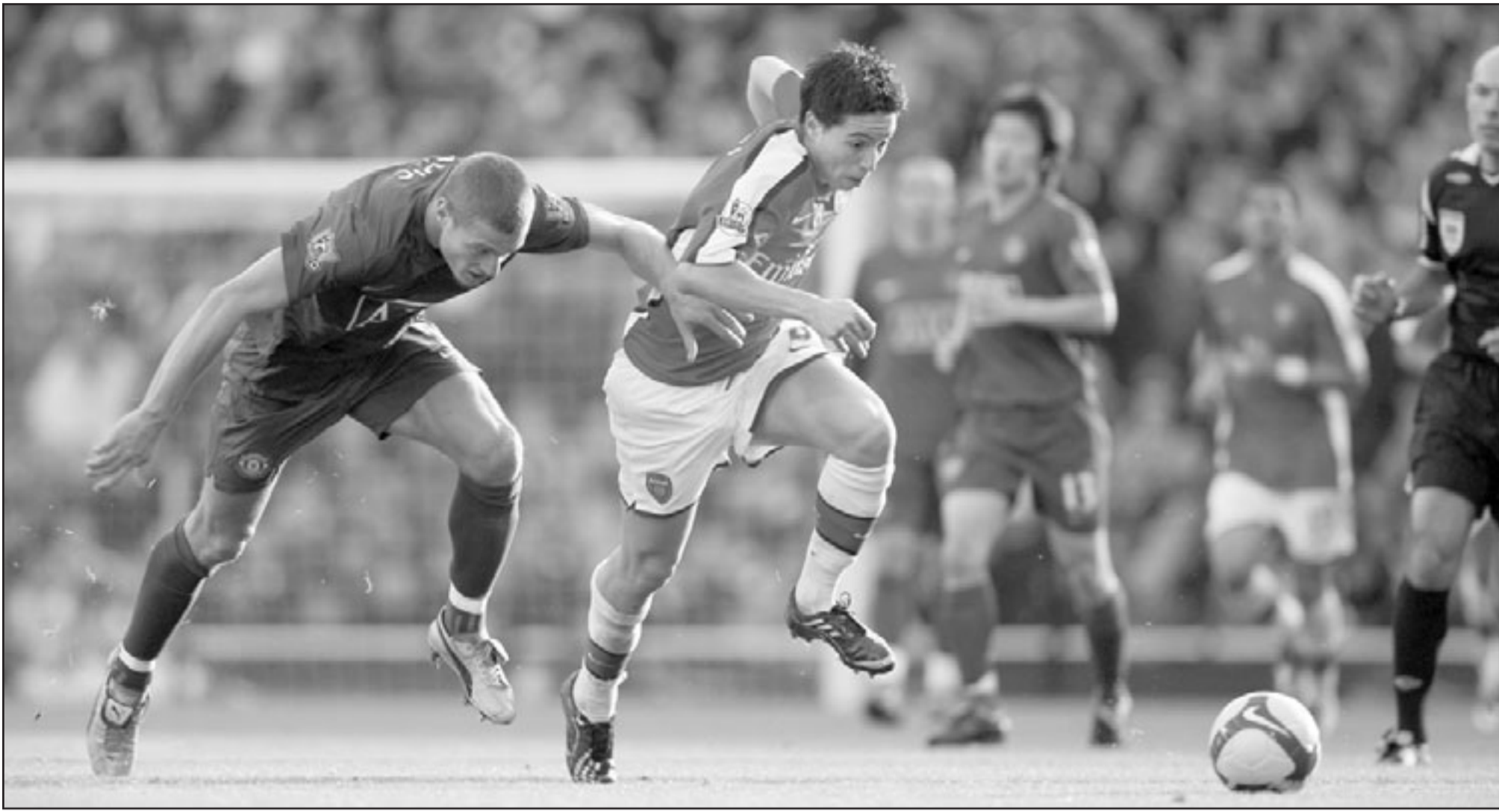
سمير نصري نجم ارسنال ينفرد بالكرة خلال مباراة مع مانشستر يونايتد

■ نيقوسيا - ا ف ب: تعتبر مباراة بلد الوليد وريال مدريد مصيرية بالنسبة للاعب حتى نهاية الموسم الحالي بسبب عملية جراحية في ركبته، وافاد ريال مدريد في بيان على موقعه على شبكة الانترنت: «خضع فان نيستلروي لعملية جراحية في الولايات المتحدة وسيغيب حتى نهاية الموسم».