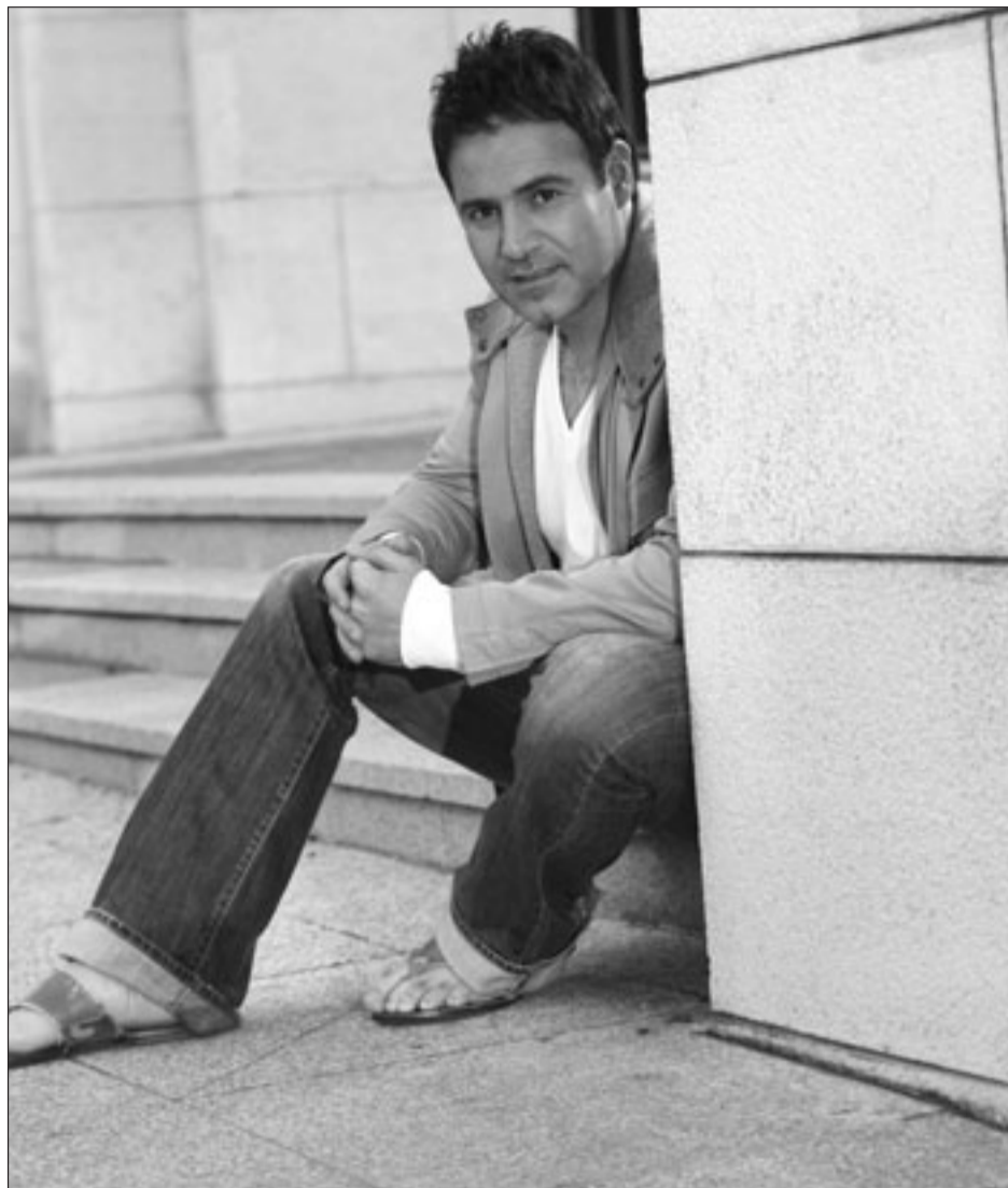
عاصي الحلاني

وطلب من عاصي التحدث عن صداقته مع جورج وسوف فقال: هذا أمر خاص جداً رغم أنها صداقة قديمة. حضرت حفله قبل أيام تضامناً معه بعد الهجمة التي تعرض لها في الأسبوع الماضي. ورد جورج وسوف بالقول: عاصي محب وقد جدت لشاركته هذه المناسبة الجميلة. وإن شاء الله تاتون في الأسبوع المقبل لحضور فسح «الكويترا» الخاصة بي مع روتانا. اللها مزامحاً.