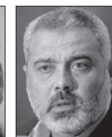
أولرت وهنية.. تقارب في يوم واحد

تروي قصة القديتين «الورديتين» اللتين تخافان من ظلهما ولهذا تتشغلان فقط بالتشويش والبقاء الاوراق قريبة من الصدر، تسببي ليفني، في مقابلة مع تالي ليبيكين شاكح في صوت الجيش طلب اليها ان تعقب على خطاب رئيس الوزراء المنصرف - القائم، ودون ان احصي، اخذت الاطباع بان ليفني وتزرع في كل جملة تقريرا عبارة «المصالح الامنية والوطنية لدولة اسرائيل»، صلحة عامضة واخرى غير مفسرة، بحيث ان اقولها تبدو