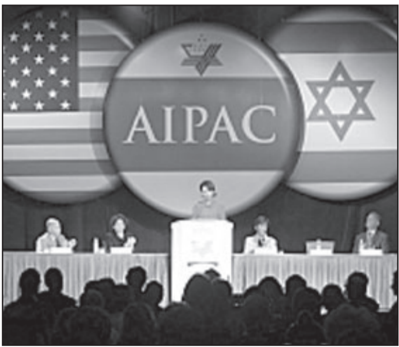
إيباك خلقت وهم الصوت اليهودي الامريكى الواحد

مثل هذا الفهم يهين ايضا الادارة الامريكية إن بموجبه، لا تعرف في الخلاف في اسرائيل، وكيدليل، الادارة تطرح كتهدية ينبغي تجاهه عرض جبهة موحدة، لا ينبغي لاسرائيل ان تحسم في مسألة اي لوبي يمثلهما، ويهود الولايات المتحدة لا ينجحون الى إذن اسرائيلي كي يسامعوا جملة صواتهم، في نهاية المطاف، سياسة حكومة اسرائيل، التي انتخبت من مواطنها، هي التي يفترض بها أن تقر شبكة علاقاتها مع جيرانها ومع الادارة الامريكية، ومع ذلك حسن ان نسمع صوتا جديدا من يهود امريكا.