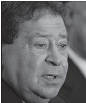
بنيامين بن البيعير... والإفلاس