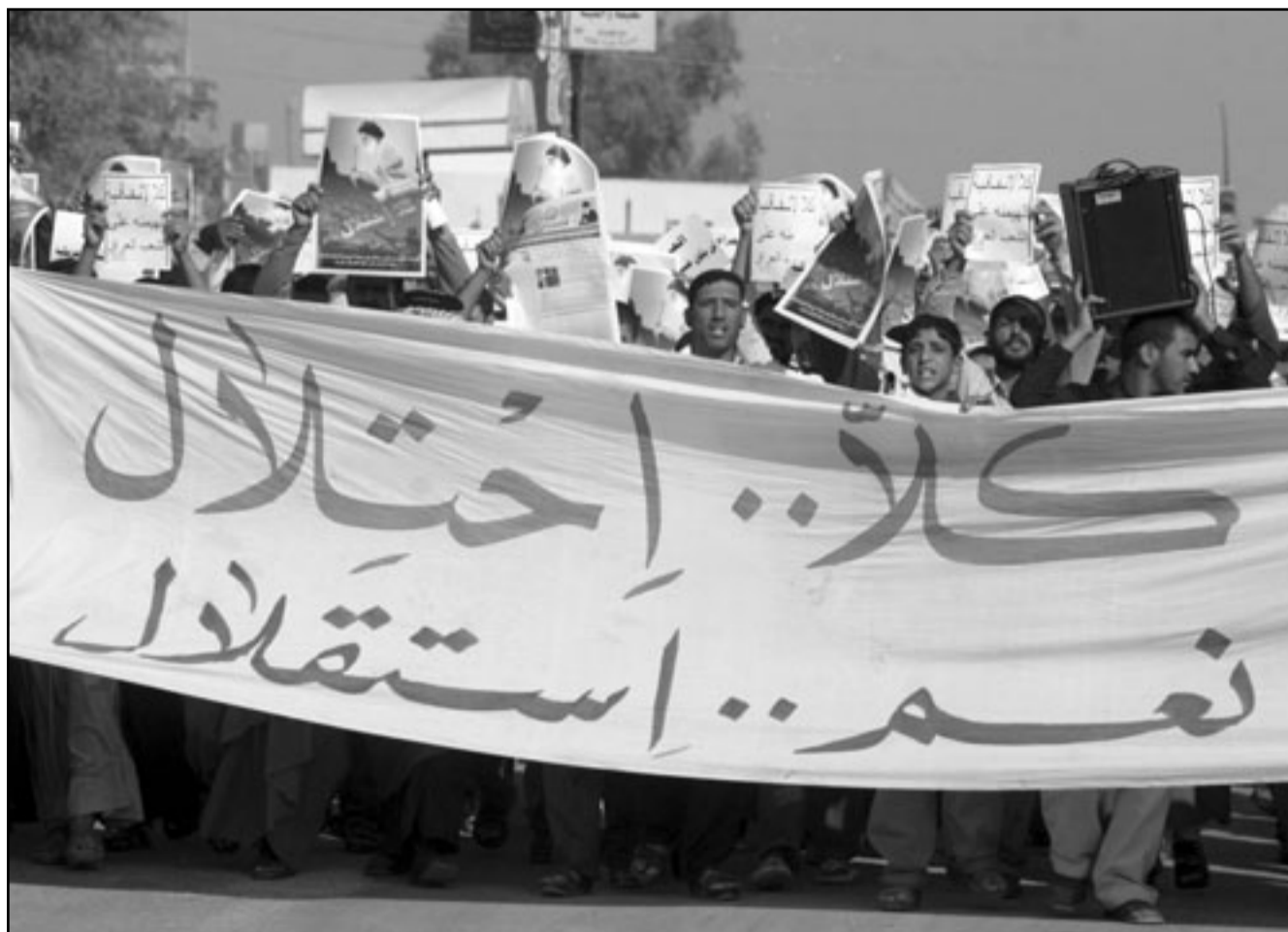
مظاهرون من انصار التيار الصدري في مسيرة احتجاج على الاتفاقية الامنية