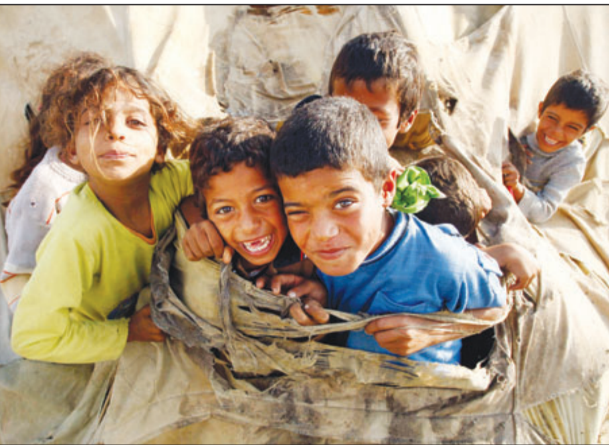
اطفال يهلون في احد مخيمات قطاع غزة الذي يعاني من وقف المساعدات الانسانية

أطلق نشطاء حركة حماس صواريخهم الاطول مدى على مدينة في جنوب اسرائيل الجمعة بعد ان هاجم سلاح الجو الاسرائيلي معقل الحركة في غزة في اليوم الحادي عشر من مناوشات تهدد هتديها ببدء سرياتها قبل خمسة اشهر. وقالت مصادر أمنية اسرائيلية الجمعة ان عددا من الاسرائيليين اصابوا بحالات هلع جراء سقوط خمسة صواريخ «غراد» روسية الصنع أطلقت من قطاع غزة على جنوب اسرائيل، فيما دعت قيادة الجبهة الداخلية سكان القرى الاسرائيلية المحاذية لغزة للبقاء في الغرف المصانة حتى إشعار آخر.