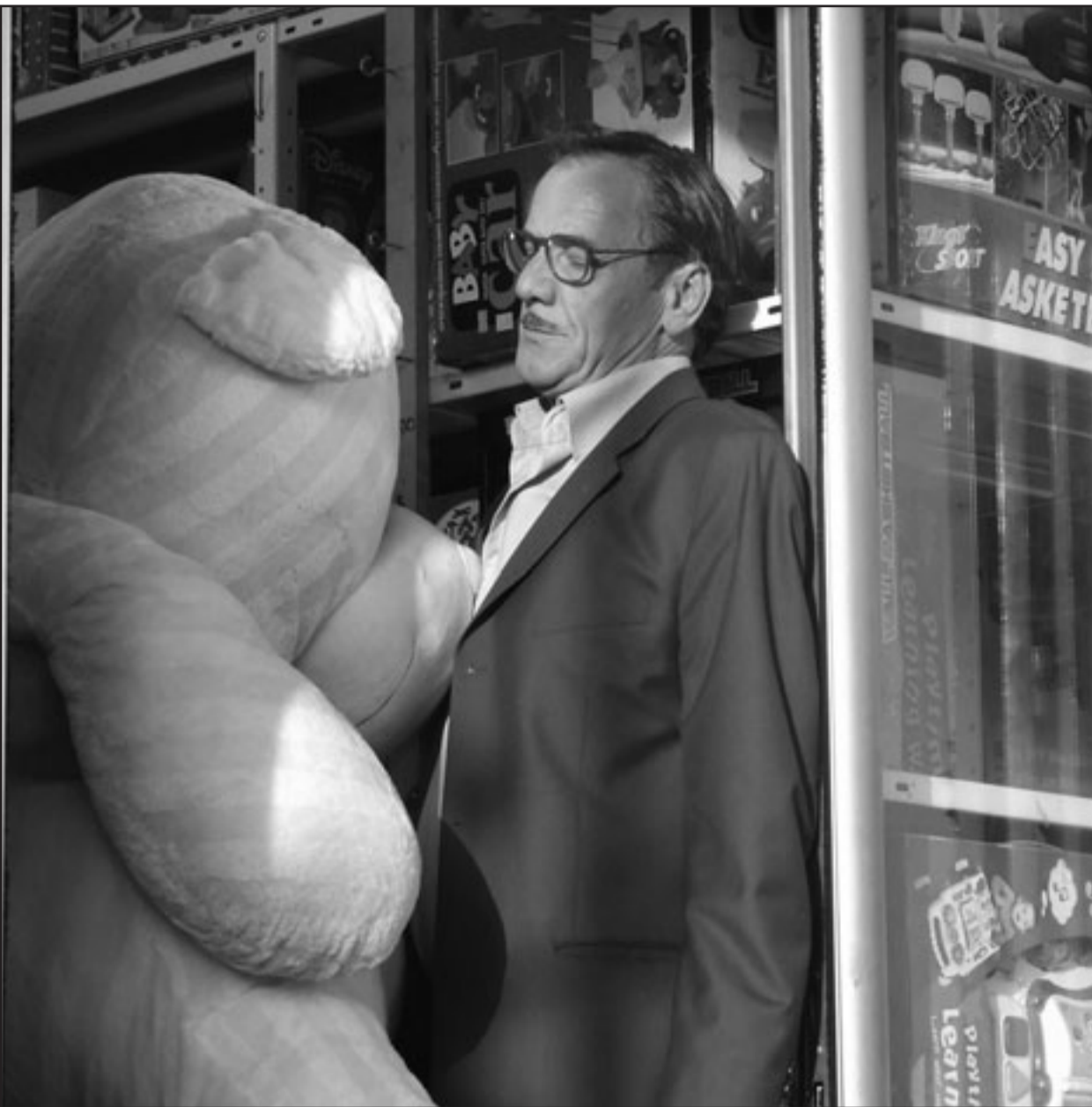
محمد بكري في لقطة من فيلم «عيد ميلاد ليلي»

في بحثنا الطول تحدثت الدكتورة منى حجاج عن قاعات الدرس في كوم الملكة بالإسكندرية، وأشارت في البداية إلى أنه في عام 1980 كشفت البعثة الأثرية الهولندية، التي تعمل في منطقة كوم الملكة الأثرية بالإسكندرية منذ أوائل الستينيات من القرن العشرين، عن مجموعة من ثلاث حجرات متجاورة تطل على الرواق الشمالي للحمام الإمبراطوري الكبير بالمنطقة، وتتميز هذه الحجرات بتخطيط لم تعرف أمثلة أخرى له في مصر، وتحتوي هذه الحجرات المستطيلة على مصابو أو درجات حجرية تدور حول الحجره من ثلاثة جوانب، وتتخذ شكلاً منحنيًا عند الجانب القصير منها مع وجود مقعد متميز يحجمه وأرفاقه عند وسط الحجره، وهذا المقعد وجدته للخير ما يتصل بذلك من تقسيم أبيقور للرباط