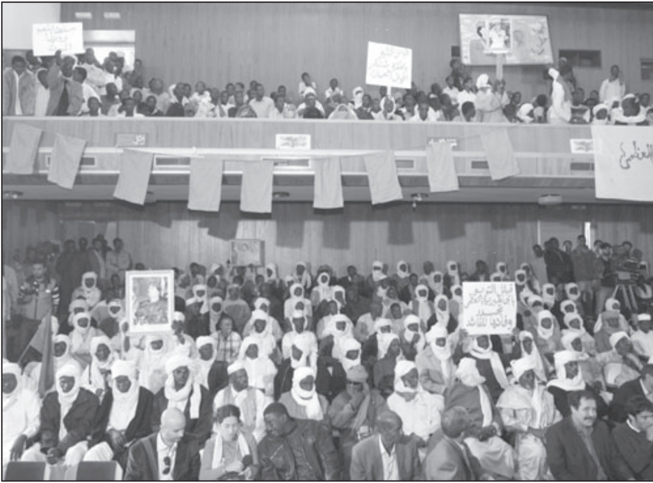
تجمع لسكان منطقة الكفرة نظمه الجبان الشعبية مساء الخميس لتكذيب اخبار المواجهات وإعلان الولاء للعقيد القذافي