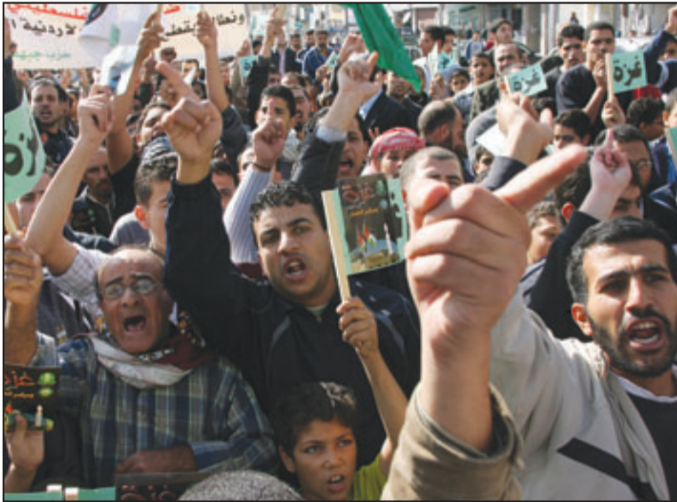
آلاف المتظاهرين يحتجون في العاصمة الأردنية عمان على استمرار الحصار على قطاع غزة

وعلمت إسرائيل أيضا تسليم القود الذي يموله الاتحاد الأوروبي لحطة الطاقة التي تولد نحو ثلث الكهرباء التي يستهلكها سكان غزة. ويأتي باقي الكهرباء من إسرائيل