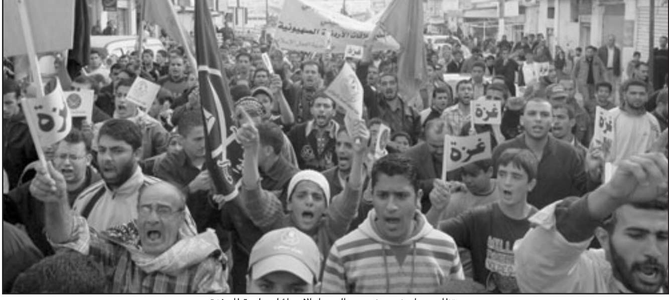
مظاهرات اردنيين يتدنون بالحصار الاسرائيلي على قطاع غزة