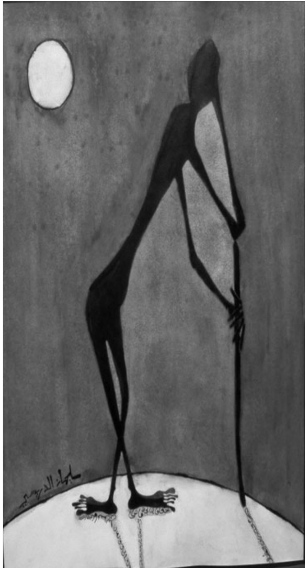
لوحة للفنان (القدس العربي)