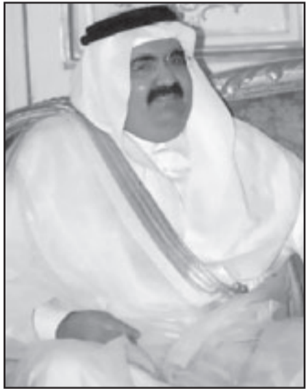
امير دولة قطر الشيخ حمد بن خليفة ال ثاني

الوجه النجار انه «سيتم عرض 120 صورة التقطها ثمانية مصورين قطريين خلال ثلاث سنوات من بناء المتحف». وسيكون مصمم المتحف الأمريكي الحاصل على جائزة بريزكر ايم باي صيف شرف في حلقة نقاش ستجري يوم الاحد تحت عنوان «العمارة الاسلامية بين التقليد والحداثة».