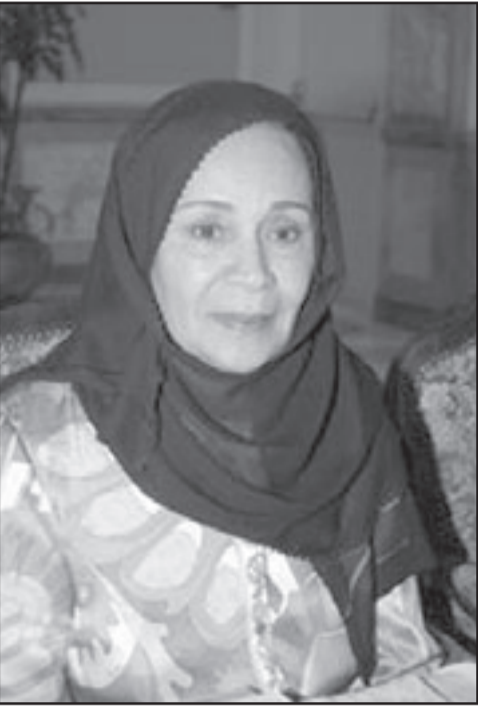
الشيخة لطيفة الفهد الصباح