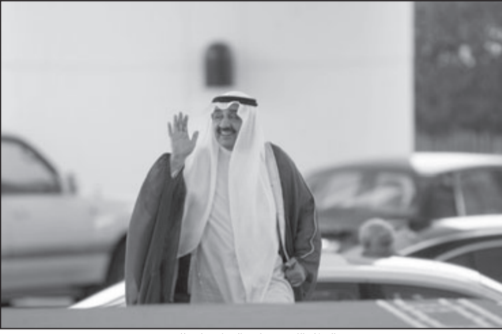
رئيس البرلمان الكويتي جاسم الخرافي يلوح للمصورين

فلن اقاضي احدا، والامور كلها لله فهو نعم الحكم، في اشارة الى انه لن يقاضي النائب محمد هايف. عنده «سنصر قضيتيه في جلسة استئناف قضيتيه في 15 كانون الاول (ديسمبر).. واذا رفضت وزارة الداخلية دخوله، فسأطلب اثبات دفو عنا». ووضح الفالي في بيانه «ان الكويت الشعب الكويتي في دفاعه عن اساءه الى.. عزيزة علي.. وغفوت عن اساءه الى..