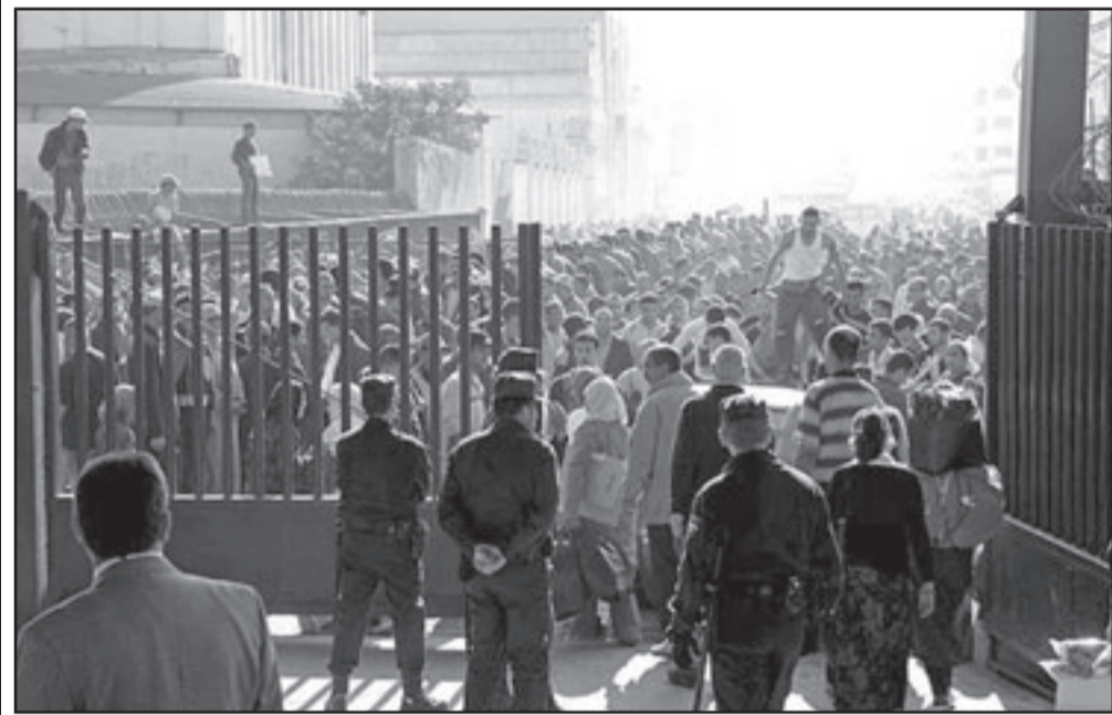
أحدى نقط العبور بين المغرب ومليلية المحتلة

يذكر أن صادرت مدينتي سبتة ومليلية من التهريب نحو المغرب سنويا تتجاوز مليار يورو، وعجزت الدولة المغربية عن مكافحة هذه التجارة غير المشروعة بحكم أن آلاف