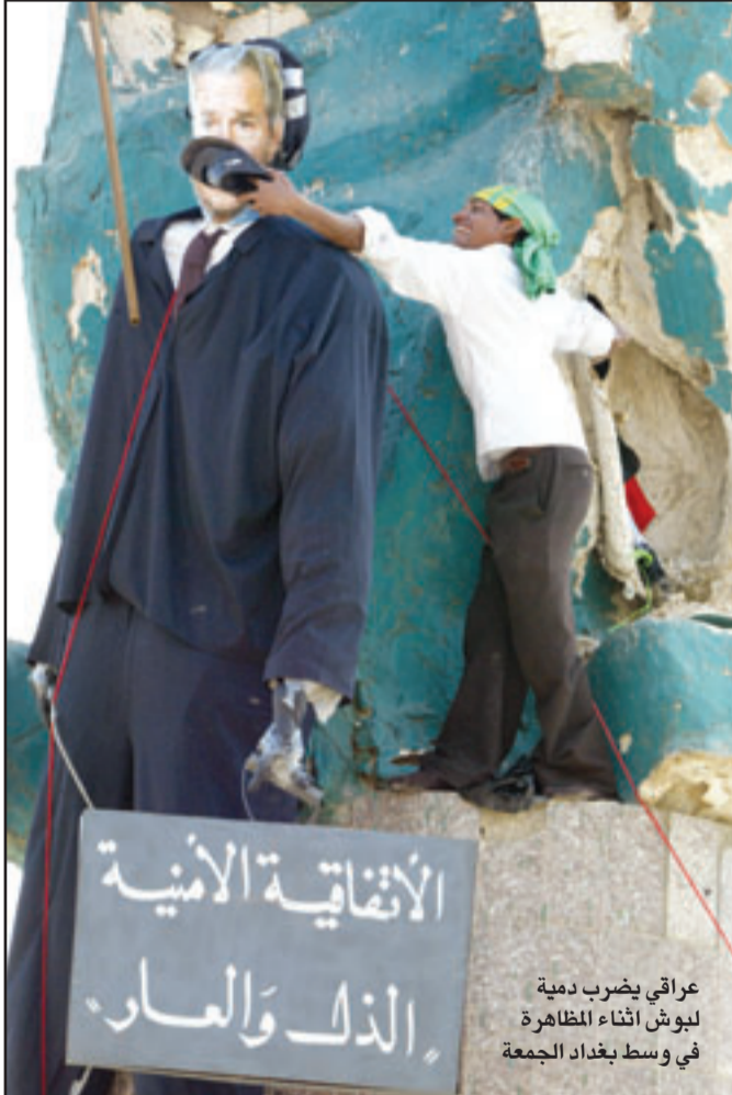
عراقي يضرب دمية لبوش أثناء المظاهرة في وسط بغداد الجمعة

وقالت: نحن في جبهة التوافق لسنا ضد الاتفاقية والاتفاقية وضعت مجموعة من التعديلات عليها، وقدمتها إلى رئيس الوزراء والسفارة الأمريكية، ويعد وصول الاتفاقية إلى مجلس النواب اتضح انه 90م مقترحاًتنا لم يأخذ بها. وأكدت: ان جبهتها ما زالت لديها تحفظات على الاتفاقية الأمنية. (تفاصيل ص 3)