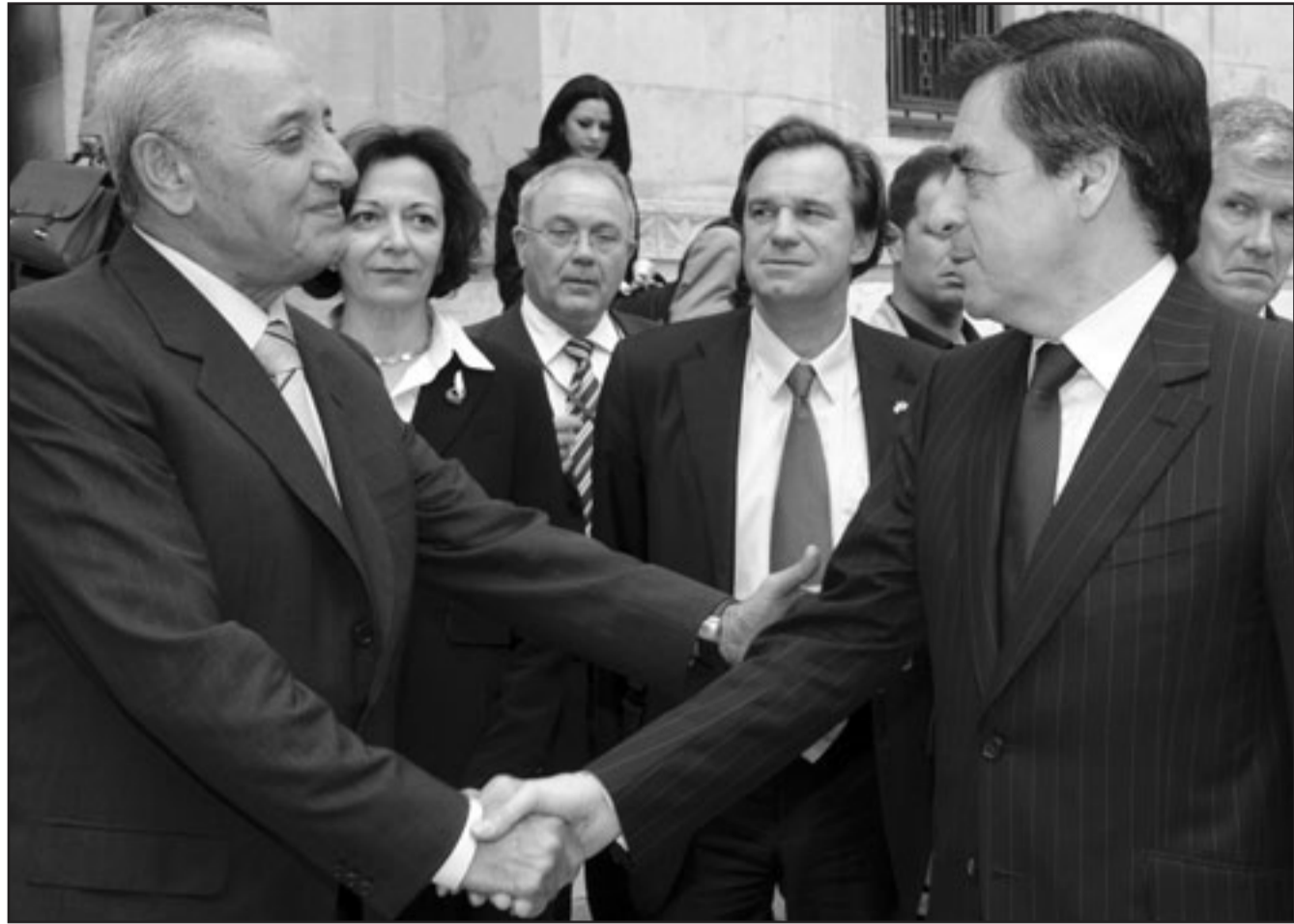
رئيس البرلمان اللبناني نبيه بري لدى اجتماعه مع رئيس الحكومة الفرنسية فرانسوا فيون في بيروت الجمعة

وأه أكثر أمناً وأهلاً لاستقطاب الاستقرار من بلدان كثيرة، ولا نعتبر أن ما تحقق هو كل ما نضبو اليه ونذكر أن الطريق لا تزال طويلة، لكننا نعمل بجد ومتأبيرة على صعد عدة منها سياسية من خلال تفعيل عمل المؤسسات والعودة إلى طاوله الحوار والتحضير للانتخابات النيابية المتوقعة في الربع المقبل والتي نعمل من أجل توفير كل الشروط التي تسمح لها أن تكون انتخابات حرة ونزيهة ومعبرة عن إرادة اللبنانيين بعيداً عن العنف والضغط، وكذلك على الصعيد الأمني عبر تحديث قرارات الجيش والقوى الأمنية بالتعاون مع القوى الفرقة فرقة الصديقيعه وأطان على الصعيد الاقتصادي والاجتماعي من خلال تطبيق التزامات باريس التي أكدت عليها حكومة الوحدة الوطنية في بيانها الوزاري».