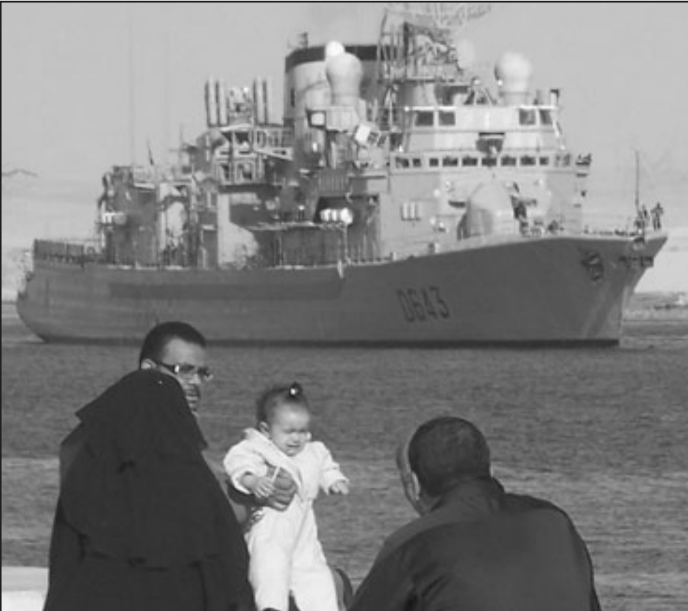
عائلة مصرية تجلس الجمعة قبالة حاملة طائرات فرنسية في قناة السويس متجهة إلى الصومال للمشاركة في عملية مكافحة القرصنة التي يجريها الاتحاد الأوروبي وتبدأ في كانون القادم

الذين يربط بينهم وبين «شبكات إجرامية» خارج الصومال. ويقول مايكل وينشتاين الخبير في شؤون الصومال واستاذ العلوم السياسية في جامعة بورديو في الولايات المتحدة إن مثل هذه الشبكات تعمل من الإمارات العربية وليس من اليمن. وقال وينشتاين «مصالح الاعمال الكبرى التي تتركز القرصنة وتسيطر عليها تتمركز بدرجة كبيرة في الإمارات» ووصفهم بأنهم رجال أعمال صوماليون مهاجرون دون صلات معروفة بأي جماعات سياسية أو تيارات إسلامية متشددة. وقال إن عصابات القرصنة تتمركز أساسا في بلاد بنط وأرجح تزايد أعداد الهجمات إلى انهيار السلطة في الاقليم الذي أعلن استقلاله عن الصومال في عام 1998». وأضاف «إقليم بلاد بنط الذي كان يعتبر مستقرا نسبيا انهار فعليا». وتابع «الإدارة هناك مليئة بالمسؤولين الذين تربطهم علاقات بالقرصنة». وبالمناسبة لليمن فإن الأثر الرئيسي للمشكلات الصومالية كان حتى الآن تدفق خضوف من اللاجئين هربا من الفوضى والحرب والاضطرابات. وتقول المفوضية لشؤون اللاجئين التابعة للأمم المتحدة إن نحو 32 ألف نجوا من مياه البحر العاتية في الأشهر العشرة الأولى من هذا العام في حين قتل 230 على الأقل واعتبر 365 في عداد المفقودين. وهذه العائمة التي يقبلون عليها للوصول إلى شواطئ اليمن تعد دليلا على سبهم في بلد يبلغ معدل التضخم فيه 27 بالمئة ومعدل البطالة 40 بالمئة ونسبة حالات سوء التغذية بين الأطفال 46