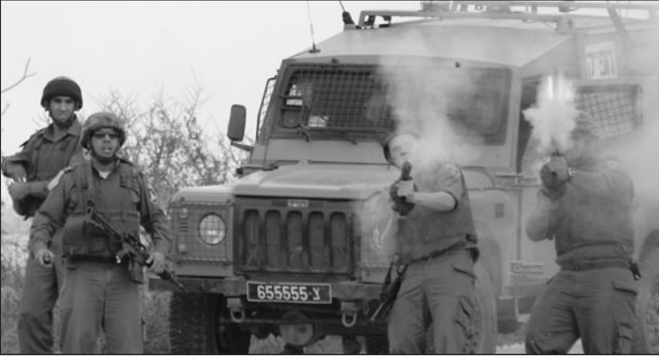
جنود اسراييليون يطلقون الغاز السيليل للمدوع على المتظاهرين الفلسطينيين في قرية تلعين