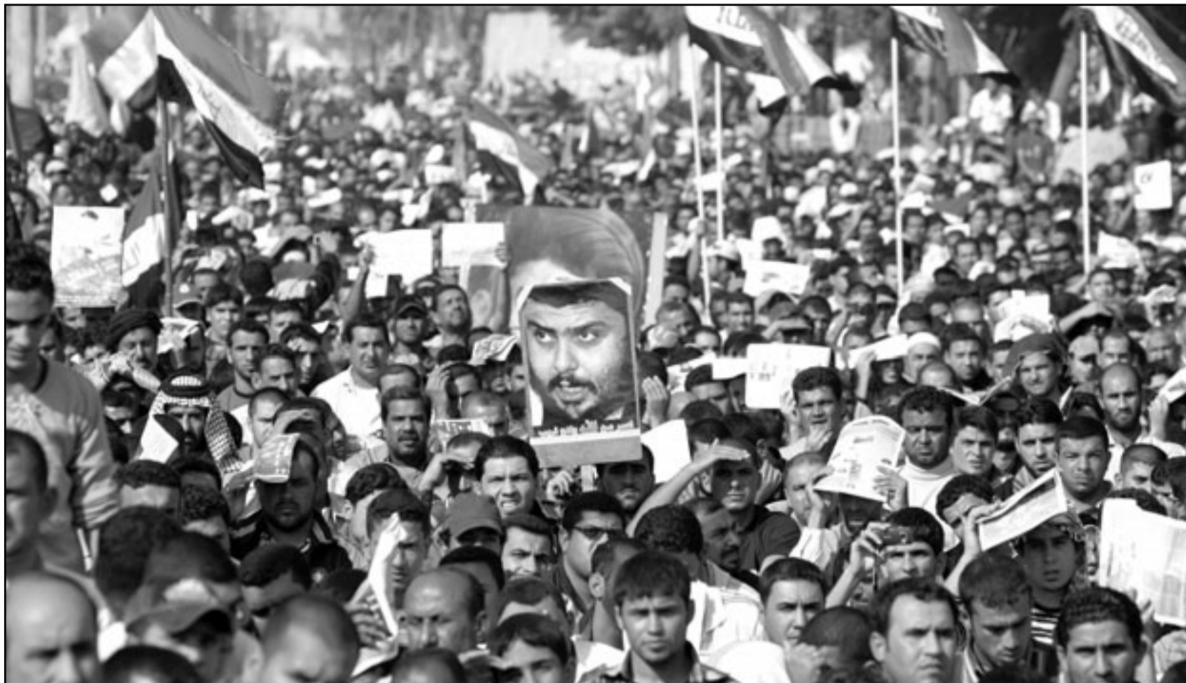
عشرات الآلاف من مؤيدي التيار الصدري يهتفون ضد الاتفاقية والتواجد الامريكى في بغداد الجمعة

بغداد- رويترز: نظم اتباع رجل الدين الشيعي العراقي مقتدى الصدر الجمعة مسيرة ضد الاتفاقية الامنية التي وقعها الحكومة وتسمح للقوات الامريكية بالبقاء ثلاث سنوات اخرى في العراق.