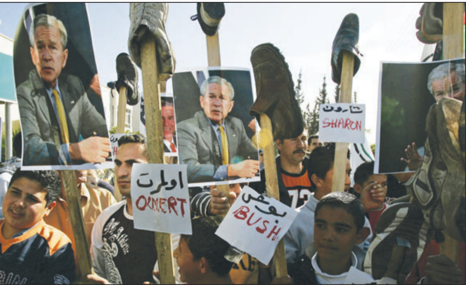
فلسطينيون يرفعون احذية في مظاهرة للتنديد بشارون وبوش وأولرت في الضفة