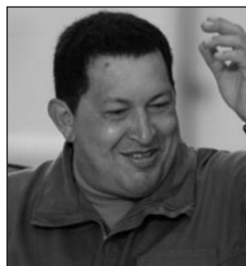
الرئيس الفنزويلي هوغو تشافيز

ويحسب ونيس بلدية كراكاس خورخي رودريغيز مدير الحملة البروجية لهذا التعديل، فقد تم جمع اكثر من 7 ملايين توقيع كدعم رمزي للتعديل الذي يطمح اليه تشافيز. ويحظر الدستور الفنزويلي على الرئيس الترشح لكثر من ولايتين وعليه يتوجب على تشافيز الذي انتخب في