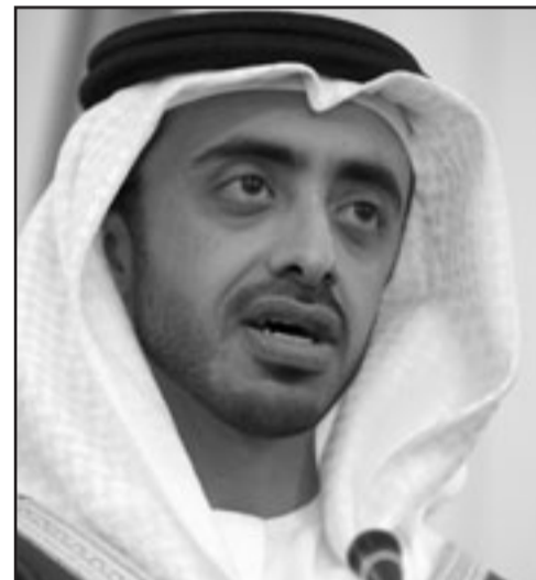
وزير الخارجية الاماراتي الشيخ عبد الله بن زايد

مؤكدا «ان مصلحة البلدين تقتضي تطوير اية اسباب لسوء التفاهم وحلها».