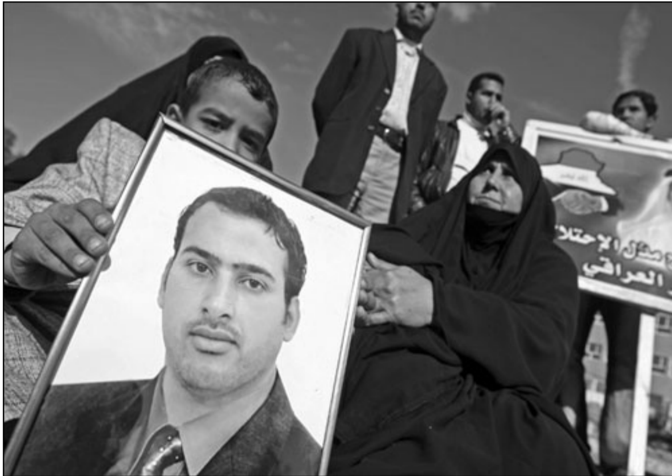
اقارب ومؤيدون لمنظر الزيدي أثناء مظاهرات في بغداد الجمعة للمطالبة بإطلاق سراحه