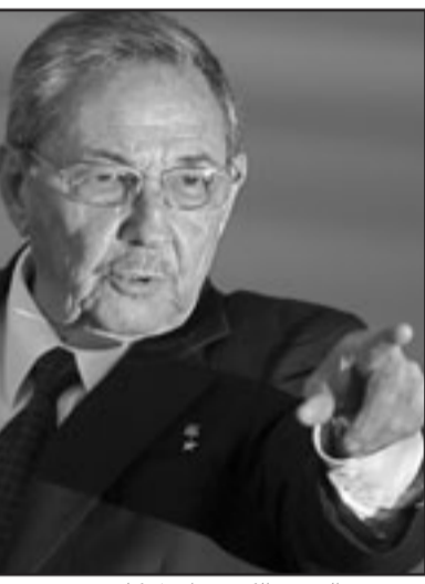
الرئيس الكوبي راؤول كاسترو

والعشرين في هذا المنتدى السياسي الامريكي اللاتيني حصرا الذي انشئ عام 1986.