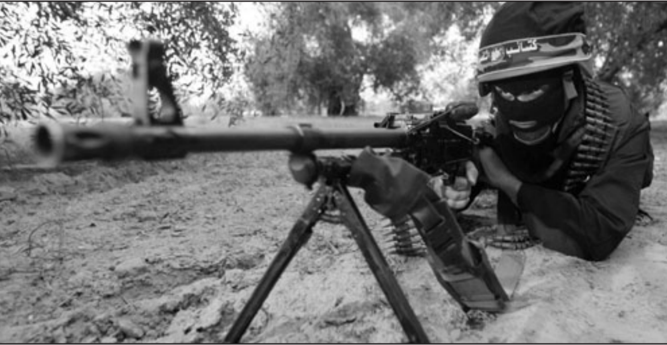
عضو من كثائب القسام يستعد للمواجهة مع إسرائيل