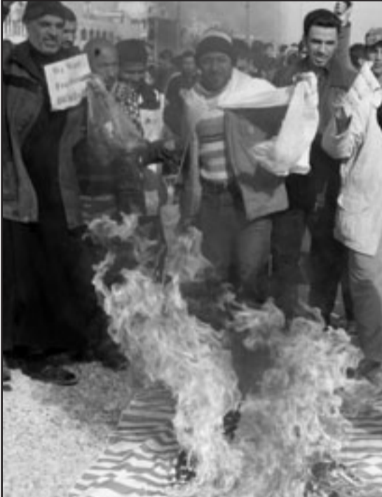
عراقيون يضربون بالاحذية جسما للعلم الأمريكي في بغداد أمس

وفي السياق نفسه، قال باسم الشيخ نشرته صحيفة «الشرق» (يومية مستقلة) بعنوان «حذاء.. من صنع صحافي» كانت مفاجأة غير متوقعة أن يقوم صحافي عراقي (من المقتربين) في المنظمة الخضراء بتهريب الرئيس بوش أمام كل العالم وبطريقة دراماتيكية لم تحرك للمشاهد العاديين الا «الدول». وأضاف الكاتب «لم يكن متوقفا على يبادر صحافي عراقي من (ضيوف) المنطقة الخضراء ومعتمد بطريقة دقيقة ومحكمة إلى يضرب أقوى رجل في العالم بالحداء.. لا يمكن أن تقتل عراقيا من صنع صحافي عراقي ممن يسع لهم بالدخول هكذا مؤتمرات على مستوى عال جدا إلا أن يكون قد خضع لـ (غسيل مخ) وموثوق به إلى درجة كبيرة غير أن الذي جرى تخفي تلك المقاييس والمعايير الامنية الأمريكية والعراقية معا». وتطرق الكاتب إلى تصريحات بوش حول الاساءة لولده وقال كان بوش قد أعلن أكثر من مرة قبل غزو العراق أنه مستاء من تصميم الرجومة الثالثة لليلى العطار لوحة لاييه على ارضية الباب الرئيس لفنذ الرشيد وصارت صورة بوش الاب يرتحون بوش وقوه بوش الاب.. وكقرن في واشنطن اطلاق عدد من صواريخ كروز من إحدى البوابج الحربية باتجاه منزل القنطة العطار وخلال ثوان تحول منزلها الانيق إلى اكوام من الحجارة واشلاء انسانية بينما جثث القتيلة العطار نفسها ... وتساءل الكاتب قائلا: لا دري لماذا يتخبر المغطاء والستيدون وقباصرة هذا الزمان في مقدمتهم البرابوا الامريكي السيد جورج بوش الذي يعتقد ان جميع العراقيين على شاكلة المؤيدين للحكم العراقي الرهن ولا يسمح بفسحة من التعارض والمعارضة». وقال الكاتب شامل عبد القادر «إذا كان حذاء الرجوم ابو القاسم الطنبوري هو الاشهر في كتابات ليلي وليلة العراقية الساحرة خلال القرون الماضية فإن حذاء منتظر الزيدي سيبقى الأكثر خلودا في القرون المقبلة».