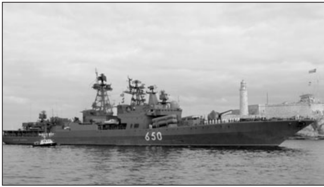
دمدرة روسية خلال دخولها لينا هافانا بكوبا الجمعة

الاستراتيجية اذا اوقفت واشنطن نشر درعها الصاروخية. وقال سولوفتسوف لوكالة الانباء الروسية «انترفاكس» انه «اذا تخلى الامريكيون عن خطط نشر الموقع الثالث (درع اوروبا الشرقية) وعناصر اخرى في الدفاع الاستراتيجي المضاد للصواريخ، فستتحرك بالتأكيد بطريقة مناسبة». وأضاف «نحن بحاجة ببساطة الى سلسلة من البرامج وهذه البرامج مكلفة». وتابع الجنرال سولوفتسوف «لا نملك اليوم اسسنا عقائدية للمواجهة، لا نسعى الى اخافة احد بتطبيق خطط تطوير القوات المسلحة الروسية ولا نتحرك سوى بما يتطابق مع الواقع». وتأتي الولايات المتحدة نشر اول عناصر درعها الصاروخية في الجمهورية التشيكية وبولندا مما يثير استياء روسيا التي ترى في ذلك تهديدا مباشرا على ابوابها. وتشعر موسكو بالقلق ايضا من امكانية نشر عناصر من الدرع في الفضاء. وكان سولوفتسوف صرح الاربعة ان روسيا ستمتلك بحلول 2015-2020 صواريخ استراتيجية جديدة قادرة على اختراق اي نظام مضاد للصواريخ. لكنه لم يوضح كيف ستكون هذه