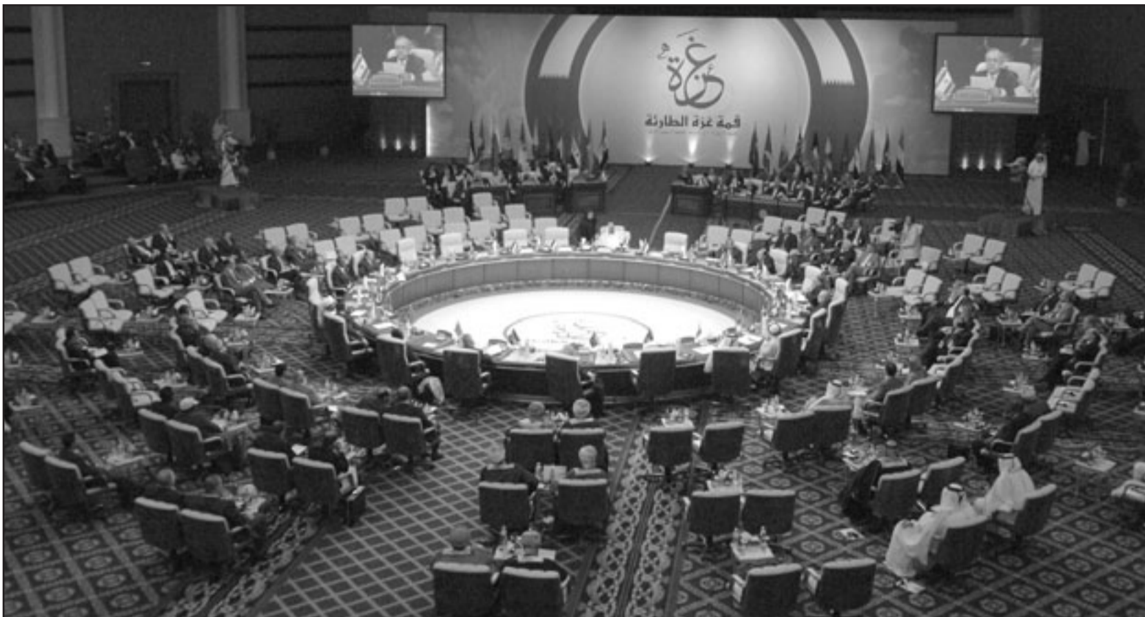
جانب من قمة غزة الطارئة بالدوحة الجمعة