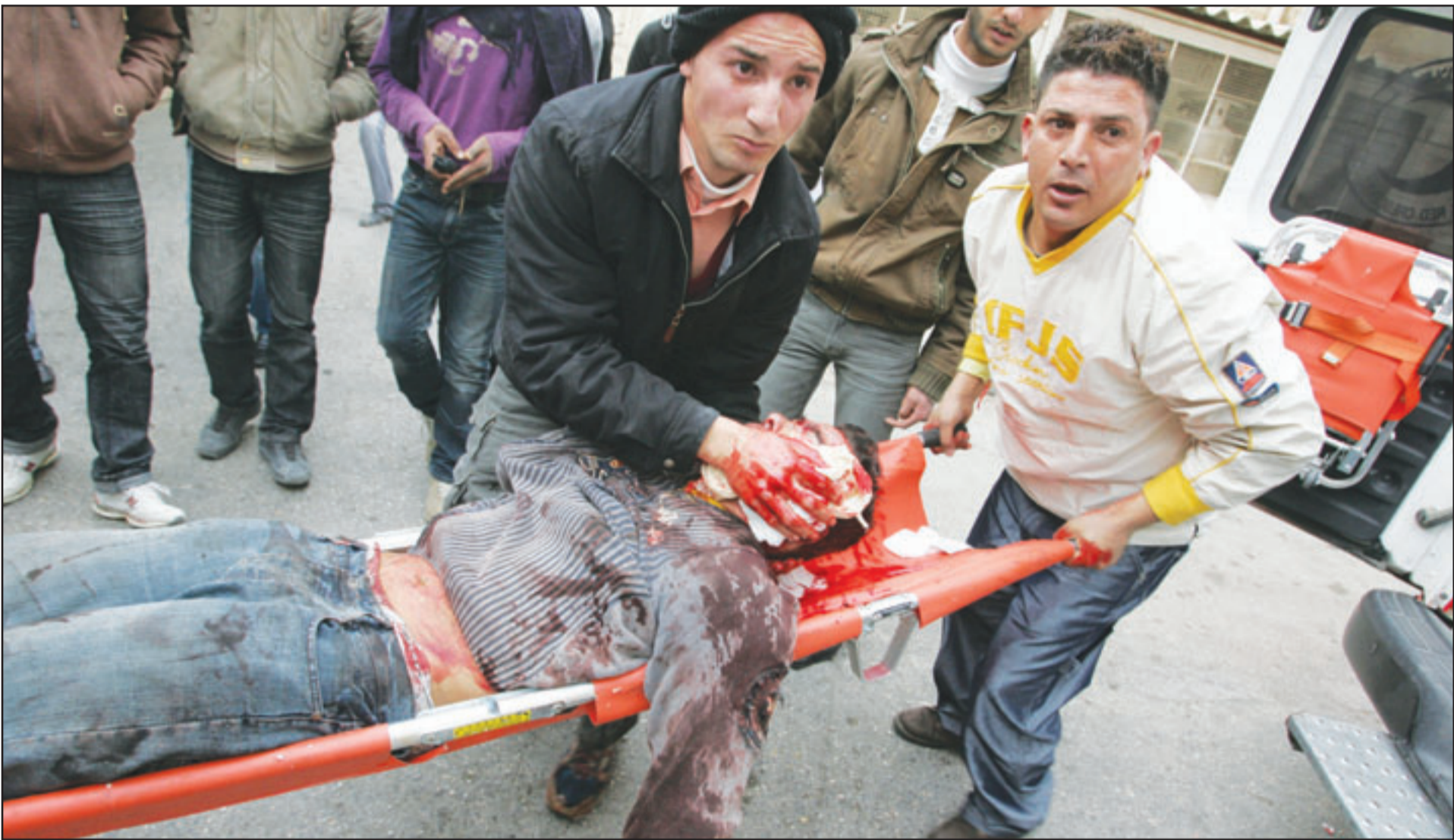
مسعفان فلسطينيان ينقلان جريحا اصيب اثناء القصف الاسرائيلي العشوائي لمدينة غزة الجمعة