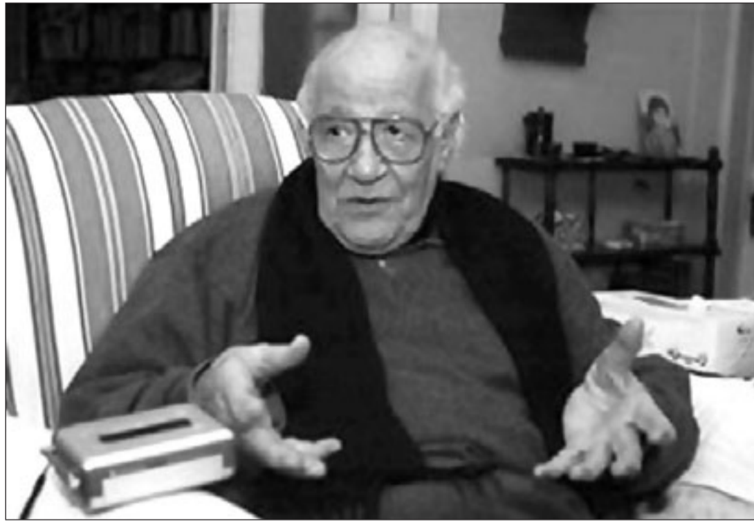
محمود أمين العالم

كذلك كان من بين أهم الموضوعات التي شغلت الفكر الراحل محمود أمين العالم في معظم مؤلفاته الجانب الأثر اتصالا بموضوع المثقف وانتمائه وهو تعريف الثقافة والايديولوجيا والعلاقة بينهما. يرى العالم أن الثقافة ليست ردفا لايديولوجيا، وقد يكون مفهومها أكثر من مفهوم الايديولوجيا، حيث تعني الثقافة لديه المعرفة بالمعنى الشامل، أي الامتلاك النظري أو التقني أو الوجداني لحقائق الواقع الطبيعي والاجتماعي والانساني عامة، وما يضمنه هذا الامتلاك -حسب العالم- من إنتاج وإبداع، كذلك «الإبداع النظري أو التقني أو الوجداني، أيما كان مستوى هذا الإنتاج والإبداع، لأن هذا الامتلاك والإنتاج العرفي-نقلا عن العالم -يتعرض دائما في الممارسة الاجتماعية الى توجيه وتوظيف صليحي-بطيقي»