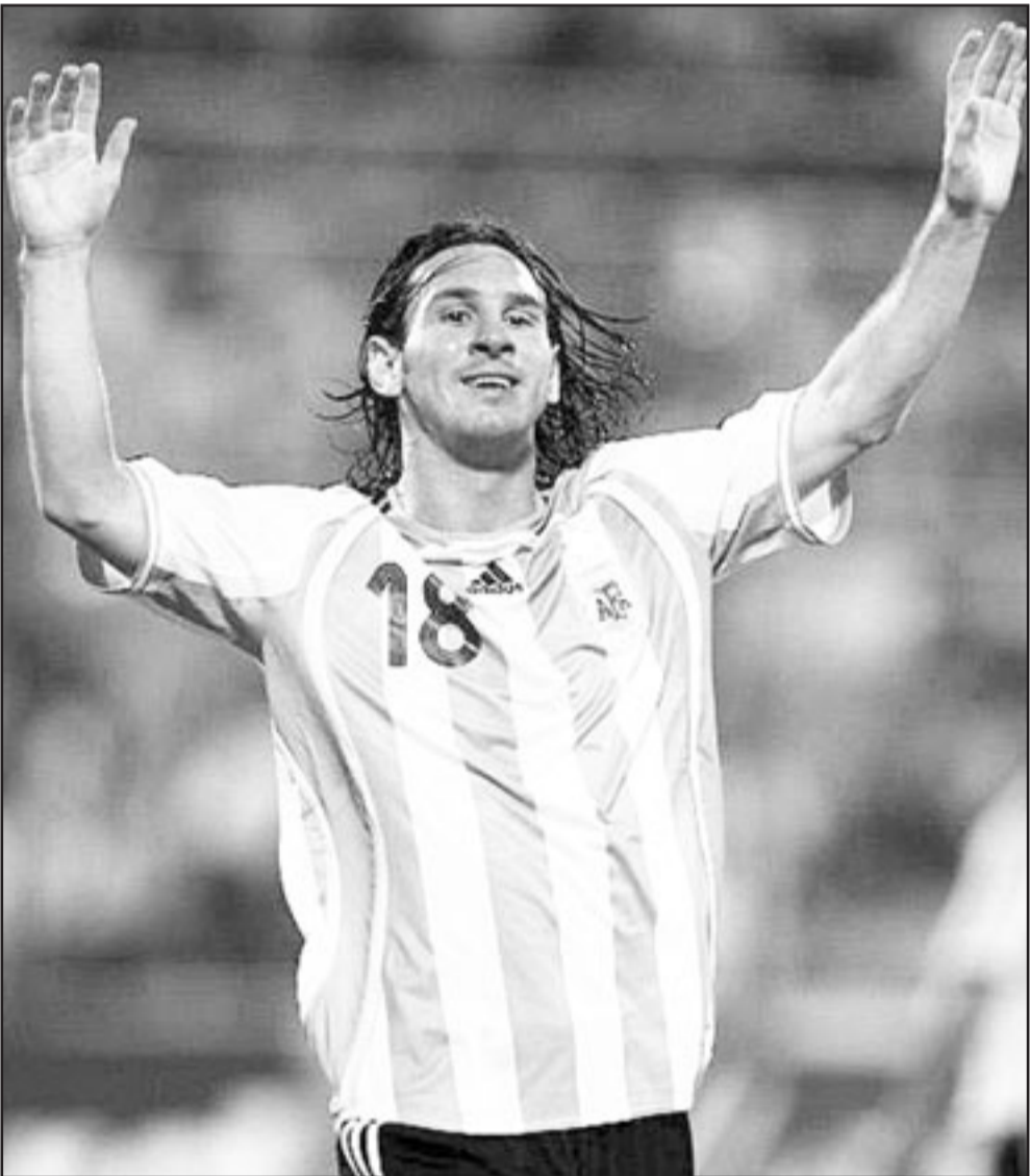
الارجنتيني ليونيل ميسي

■ نفوسيا - أ ف ب: يتطلع مانشستر يونايتد حامل اللقب في العامين الأخيرين إلى انتزاع الصدارة من ليفربول عندما يحل ضيفا على بولتون السبت في المرحلة الثانية والعشرين من الدوري الانكليزي لكرة القدم. ويسعى مانشستر يونايتد إلى استغلال المباراة الساخنة التي سيخوضها ليفربول المتصدر أمام