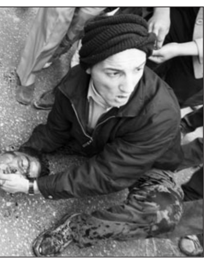
فلسطيني يحاول اسعاف الشاب معظمم دعنا بعد اصابته برصاص الاحتلال خلال تظاهرة في الخليل وقد استشهد في وقت لاحق

الثلاثة الاف «من رام الله اعلناها الوحدة نجمة في سماها»، «يا هنية ويا عباس وحدتنا هي الاساس»، و«يا فتح ويا حماس الوحدة هي الاساس»، «وحدة وحدة وطنية فتح وحماس وشعبية»، و«نظمنا التظاهرة على بعد امتار من الاجتماع الذي ضم الرئيس الفلسطيني محمود عباس والامين العام للأمم المتحدة بان كي مون. وكان بان كي مون اعلن خلال لقائه رئيس الوزراء الفلسطيني سلام قياض «انه لا يوجد امام الفلسطينيين مفر من تحقيق وحدتهم الداخلية».