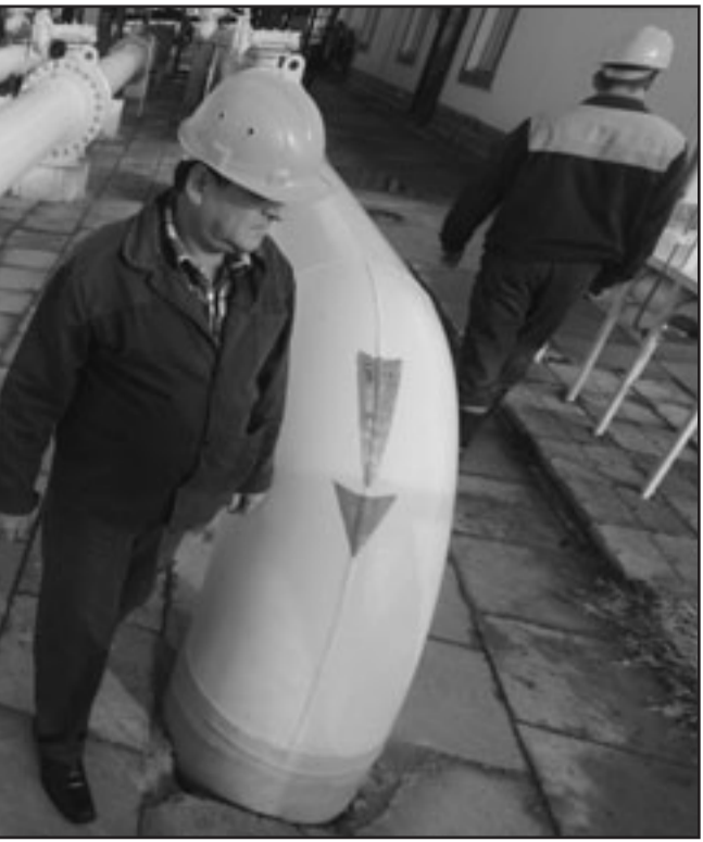
مستخدمان يتفحصان انابيب في محطة اولفكالاخض الغاز الروسي بمنطقة ازمايل على الحدود الأوكرانية الرومانية

وقالت الوكالة إن إنتاج هذه الدول انخفض 150 ألف برميل يوميا عام 2008 إلى حوالي 49.5 مليون برميل في يوم مسجلا أول انخفاض منذ عام 2009.