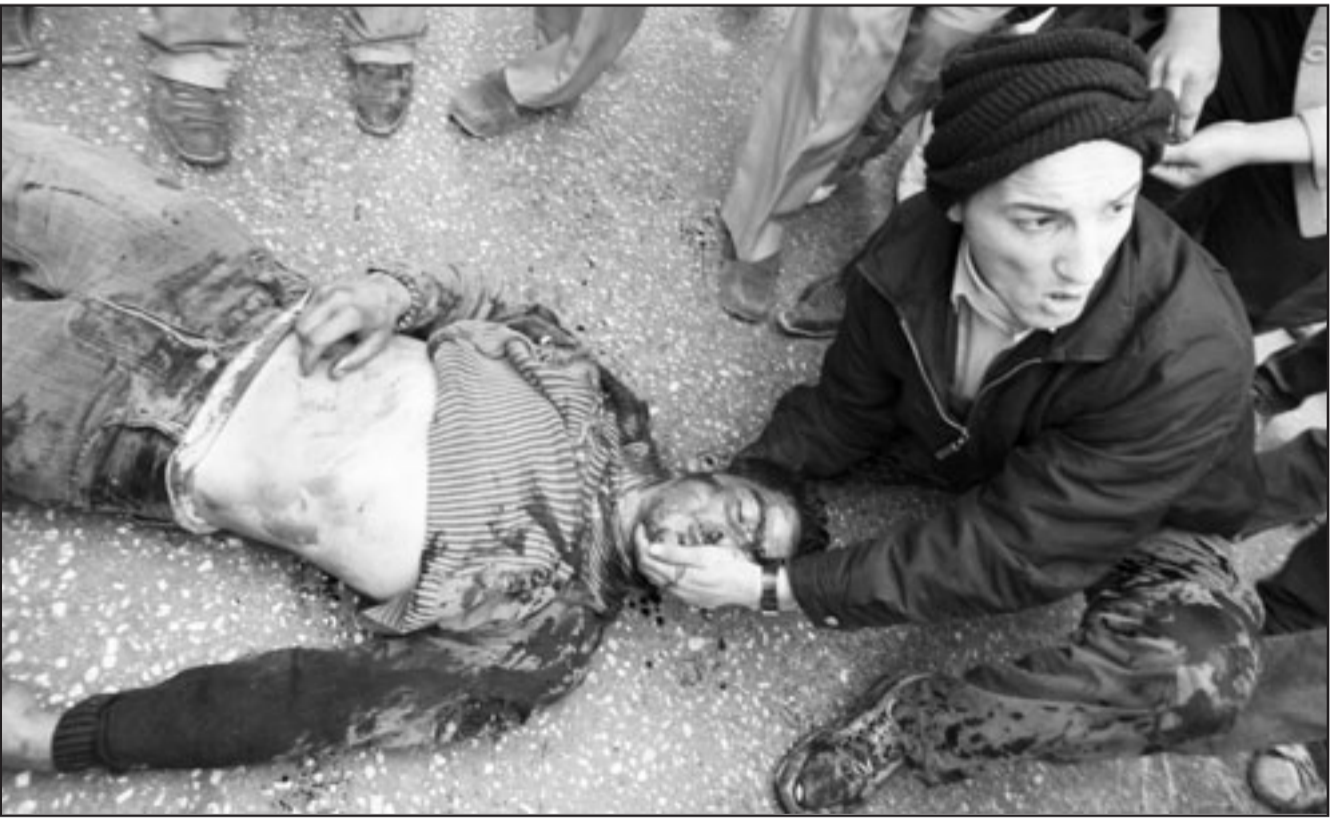
فلسطيني يحاول اسعاف الشاب معظمم دعنا بعد اصابته برصاص الاحتلال خلال تظاهرة في الخليل وقد استشهد في وقت لاحق

الثلاثة الاف «من رام الله اعلناها الوحدة نجمة في سماها»، «يا هنية ويا عباس وحدتنا هي الاساس»، و«يا فتح ويا حماس الوحدة هي الاساس»، «وحدة وحدة وطنية فتح وحماس وشعبية»، و«نظمنا التظاهرة على بعد امتار من الاجتماع الذي ضم الرئيس الفلسطيني محمود عباس والامين العام للأمم المتحدة بان كي مون. وكان بان كي مون اعلن خلال لقائه رئيس الوزراء الفلسطيني سلام قياض «انه لا يوجد امام الفلسطينيين مفر من تحقيق وحدتهم الداخلية».