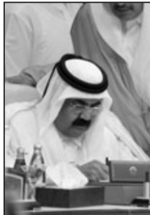
الشيخ حمد بن خليفة آل ثاني

متابعاً: «ان فلسطين دائما في الازمة، فالكيان الصهيوني يريد ان يوجد عدم الاستقرار واتعدام الامن في المنطقة لانه يريد ان يخلق فجوة بين الشعوب ودول المنطقة». وأضاف: «ان الكيان الصهيوني نظرا لفتكرته الليبرالية العلمانية لا يمكن ان نتوقع منه ان يأتي لنشر السلام والعدل لان فلسفة انشاء هذا الكيان تمكن في الاحتلال وارتكاب الجرائم وظهر جليا للجميع بغض النظر عن اي منطقة جغرافية فان الشعوب شاهدت ان الاحتلال يسحق الحقوق والأعراف الانسانية».