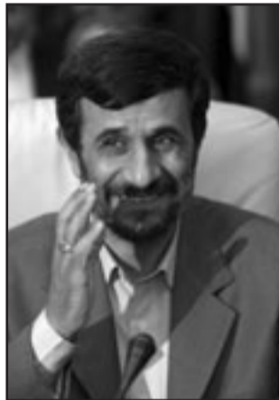
الرئيس احمدى نجاد