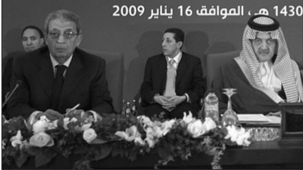
وزير الخارجية السعودي الامير سعود الفيصل (يمين) والامين العام لجامعة الدول العربية عمرو موسى في الكويت الجمعة

العربية عمرو موسى قبيل بدء الاجتماع ان «الوضع العربي اصبح فوضى كبيرة جدا وموسفة جدا ومؤذية جدا». وكان موسى صرح ليل الخميس ان وزراء الخارجية سيقامون بقرار يدعو الى وقف فوري لإطلاق النار في غزة ووضع حد للحصار. وحضر الاجتماع عدد من وزراء خارجية الدول العربية الكبيرة بما في ذلك مصر والسعودية فيما غاب وزير الخارجية السوري وليد المعلم وتمثل عدة دول على مستوى اذنى من وزير خارجية. وقال مصدر في الامانة العامة ان الوزراء درسوا في اجتماعهم هذا وتحت عنوان «التشاور حول الخطوات التي ينبغي القيام بها بعد رفض الامتثال لقرار مجلس الامن 1860». كما ناقش الوزراء بند «اقترح انشاء صندوق لإعادة اعمار غزة بالإضافة الى