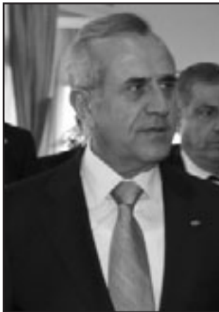
الرئيس ميشال سليمان

وأضاف «ان العدوان ليس ضد حماس كما تصور إسرائيل، وانما هو عدوان ضد الشعب الفلسطيني، الأمانة وإسرائيل أيقنت انه لن يكون هناك تفاوض دون حق العودة والقدس وهو ما ترفض إسرائيل تقديمه للمفاوض الفلسطيني فترغب في فرض شروط جديدة وسحق المقاومة لفرض شروطها في التسوية». واكد مشعل: «ان هذا العدوان ليس