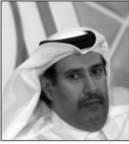
الشيخ حمد بن جاسم بن جبر آل ثاني

عباس اعتذر بسبب ضغوط مورست عليه. وقال إن عباس ابغته في اتصال هاتفي بينهما «ان حضور القمة يعني أنه سيذبح من الوريد إلى الوريد». وقال الشيخ حمد انه اتصل مساء الخميس بالرئيس عباس الذي اخبره بعدم انعقاد القمة، وانه اصبح الآن من الصعب الحصول على تصريح للخروج، فقال الشيخ حمد انه مستعد لحضار تصريح له، وقال الشيخ حمد ان الرئيس عباس اعتذر بسبب ضغوط. وأوضح الشيخ حمد ان عدم حضور عباس دفع قطر إلى الطلب من قادة الفصائل الفلسطينية الحضور لتعيل فلسطين في القمة، ذلك ان القمة اقيمت من أجل غزة. وحول غياب دولة الامارات العربية المتحدة عن القمة أوضح حمد بن جاسم ان الامارات اشترطت عدم حضور الرئيس الايراني للقمة. وحول تراجع دول عربية عن قرارها الحضور للقمة الطارئة بعد ابلاغ قطر بحضورها مما ادى لعدم تحقيق نصاب، علق الشيخ حمد بالقول «لو دعنانا وزيرة الخارجية الامريكية كوندوليزا (رايس رغم انه لم يبق الفلسطينية، محمود عباس، قال الوزير القطري ان