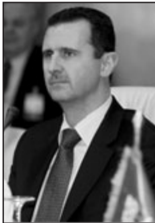
الرئيس بشار الاسد