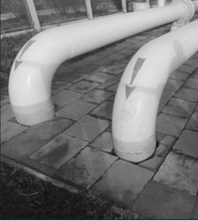
مستخدمان يتفحصان انابيب في محطة اولفكالاخض الغاز الروسي بمنطقة ازمايل على الحدود الأوكرانية الرومانية

ستكون شركتا غاز دو فرانس واي.اوان الالمانية اعضاء في الكونسورسيوم، وفق سكاروني، واتفقت الثلاثا محاولة لامداد أوروبا بالغاز الروسي بعد توقف الشاحنات في السابع من كانون الثاني/يناير، والنتيجة ان سيف