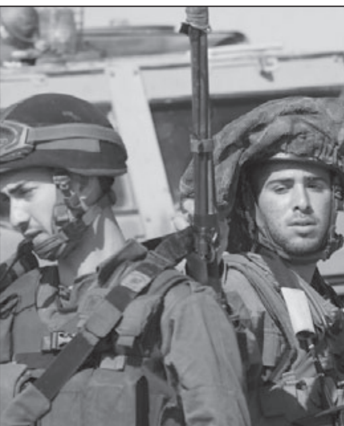
الحرب القادمة على الطريق

في منظومات الحكم، والسياسة الخارجية والداخلية، سأسهد، بعد انكم على نفسي، كتبت في الماضي ان ليفني عديمة التجربة المناسبة لتكون منذ الان رئيسة للوزراء، وان كانت خدمت - الاصح القول فحزت - في عدة وزارات حكومية، ذات الامور بالضبط كتبتني عن اوفير بيغن، وزير قديم الوقت السابق في عدة وزارات، حين عرض نفسه في مرحلة معينة كمرشح لرئاسة العمل وبالتالي لرئاسة الوزراء، لست محامي الليكود، انا بعيد عن ذلك، ولكن يا عيل التي تربط الشعار، بالتعصب رجولي في نظرها، بالحملة في غزة فقط، تتجاهل حقيقة أن الليكود بدأ يستخدم «كبير عليها» ضد ليفني حتى قبل العملية، وليس بالذات في السياق الأمني - العسكري، بل في موقفه من ثقل وزن وتعقيد منصب رئيس الوزراء بشكل عام.