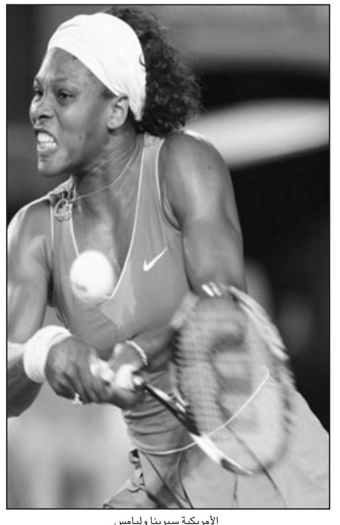
الأمريكية سيرينا وليامس

■ مليون (استراليا) - اف ب: حقق الاسباني راڤال نادال المصنف اول تاهلا سهلا الى الدور نصف النهائي من بطولة استراليا المفتوحة، اولى البطولات الاربعة الكبرى لكرة المضرب، بفوزه على الفرنسي جيل سيمون السادس 6-2 و 7-5 و 7-5 امس الاربعاء على ملاعب ملبورن. ويلتقي نادال في دور الاربعة مع مواطنه فرناندو فيرداسكو الرابع عشر والذي تغلب على الفرنسي جو يلفريد تسونغا الخامس 7-6 (2-7) و 6-3 و 6-6 و 6-3 في اليوم ايضا. وكان نادال وصل الى نصف النهائي في العام الماضي ايضا قبل ان يخسر امام تسونغا.