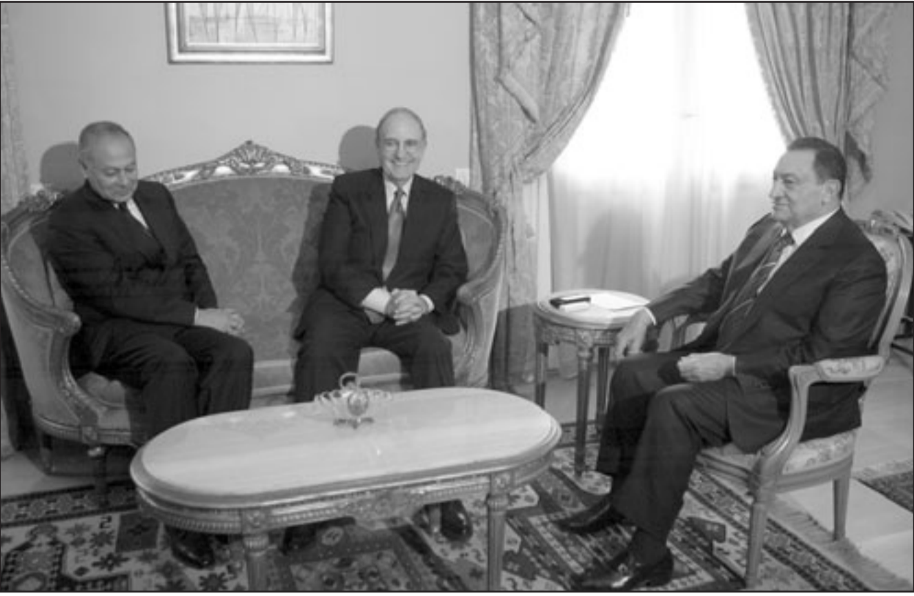
الرئيس المصري حسني مبارك مع المبعوث الأمريكي جورج ميتشل ووزير الخارجية المصري أحمد أبو الغيط خلال لقاء في القاهرة أمس

القرار العمل به بأثر رجعي منذ تاريخ القاء القبض على المتهم الثالث من حزيران/ يونيو العام الماضي. وأشارت المحكمة في حثييات الحكم التي أن الألف التي استندت إليها المحكمة وأدلتها البيئات تؤكد أن الأفعال التي قام بها المتهم تضر بموقف البلاد سياسياً ووجود وحدتها وإستقرارها وأن التخابر بلغ مداه هذه الأيام ولذا راعت المحكمة إيقاع عقوبة السجن بدلاً من الإعدام وفقاً لنص المادة 53 من القانون الجنائي وأمرت بتسليم المستندات للشريعة الشعبية ومصادرة العروضات لصالح حكومة السودان. ونكر القاضي في حثييات القرار أن المتهم قد خالف نص المادة 53 من القانون الجنائي بقياضه بالتجسس ضد البلاد وعقوبتها السجن عشرة أعوام أو الغرامة أو العلويتين معا وأن شاهد الإتهام الثالث أفاض أن المتهم نقل وثائق لجهات بالخارج مما يبين