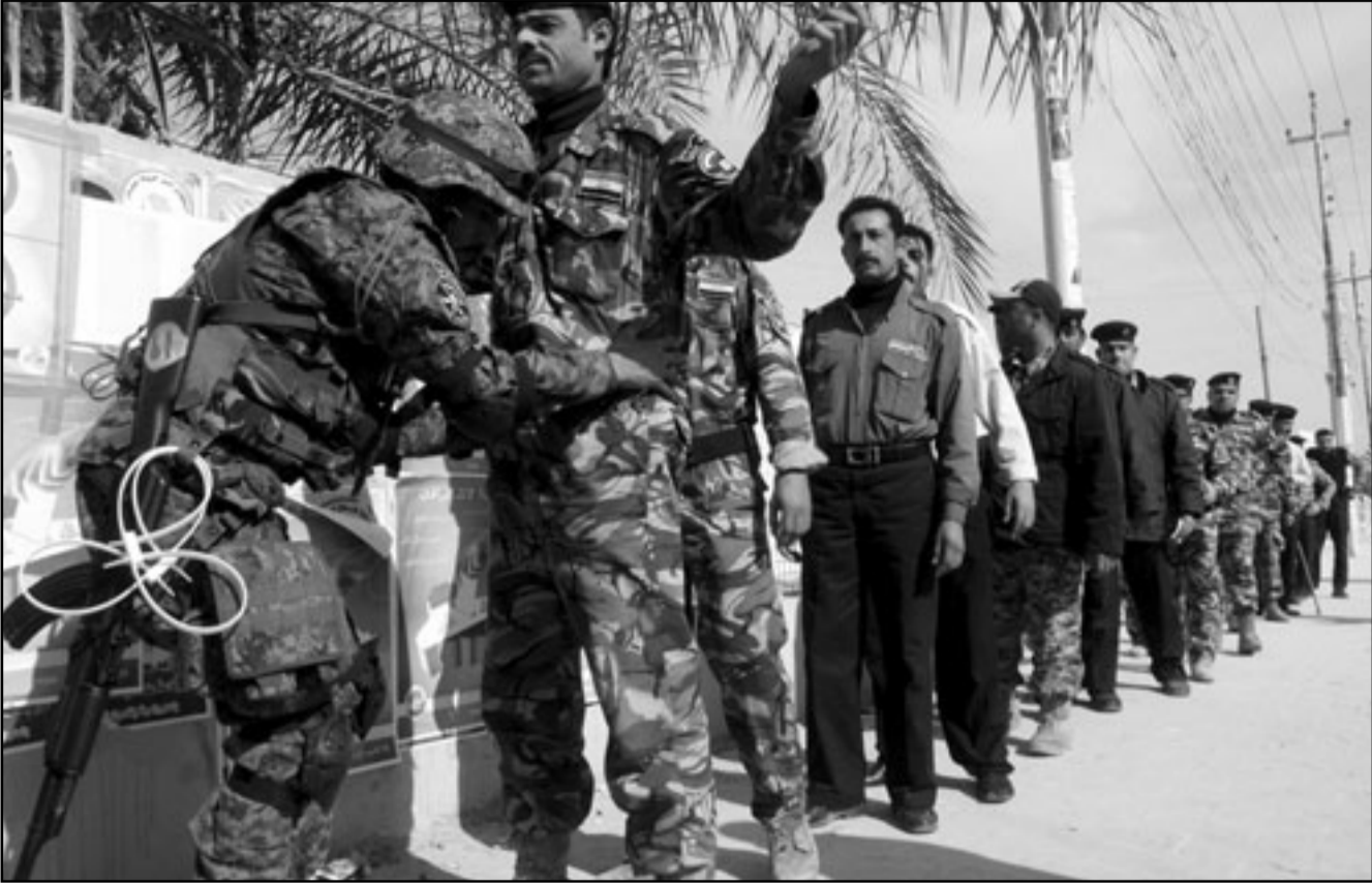
رجال شرطة عراقيون عند نقطة تفتيش تابعة لقوات الجيش عند مدخل أحد مراكز التصويت في الجلوجة امس

يبدأ 140 ألف جندي امريكي في الانسحاب. ويريد الرئيس الامريكى باراك اوباما الاسراع بايقاع الانسحاب بعد ان وعد سلفه جورج بوش بسحب القوات بحلول نهاية عام 2011. و الحملة الانتخابية لم تشهد حتى الآن اي تصاعد في اعمال العنف كان يخشاها القادة الامريكويون والعراقيون، واغتيل اثنان من المرشحين على الاقل لكن الهجمات في مجملها بقيت في اطار المستويات المنخفضة منذ بدء الحرب. وعزز رئيس الوزراء قبضته خلال العام الماضي بعد ان كان ينظر اليه على انه زعيم ضعيف وشن حملة على المتشددين وفاز بالترام امريكي بالانسحاب خلال ثلاث سنوات. لكن قاعدة سلطته ما زالت محدودة في المحافظات. وسيسيطر منافسوه الشيعة في المجلس العراقي الاسلامي الاعلى على معظم المحافظات في الجنوب وهم يأملون في تشديد قبضتهم. ويأمل القادة الامريكويون في ان تؤدي الانتخابات