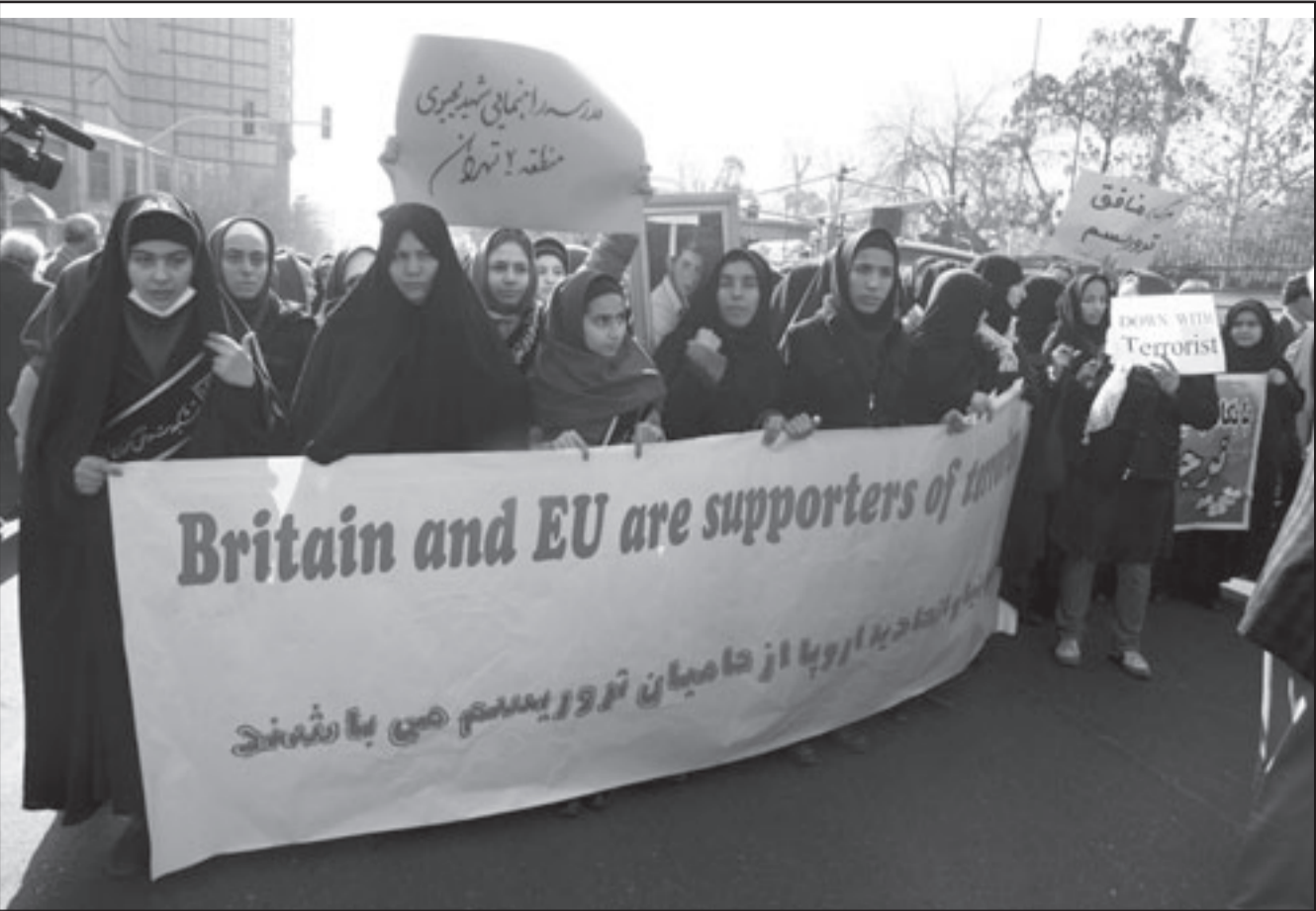
تظاهرة نسائية تنهت بريطانيا والاتحاد الأوروبي بالارهاب في طهران امس

■ طهران - اف ب: طلب الرئيس الإيراني محمود احمدي نجاد امس الاربعاء من الرئيس الأمريكي باراك اوباما الاعتذار عن «الجرائم» التي ارتكبتها الولايات المتحدة على حد قوله في حق إيران. ورأى ايضا ان على الإدارة الأمريكية الجديدة ان تسحب قواتها من العالم لإثبات «التغيير» الذي وعد به اوباما خلال حملته الانتخابية. وقال احمدي نجاد في خطاب القاها في كرمشاه (غرب) ونقله التلفزيون «على الذين يتكلمون عن التغيير ان يقوموا باعتذارات للشعب الإيراني ويسعوا للتعويض عن افعالهم الماضية السيئة وعن الجرائم التي ارتكبوها في حق ايران». و بعد بعدها قائمته من المآخذ على الولايات المتحدة بدءا بالانقلاب الذي دبرته عام 1953 لإطاحة رئيس الوزراء آنذاك محمد مصدق. كما اشار الى معارضة واشنطن للثورة الإسلامية ودعمها للعراق في حربها مع ايران. واعرب اوباما الذي تولى مهامه في 20 كانون الثاني (يناير) عن استعداده لبدء حوار مع ايران