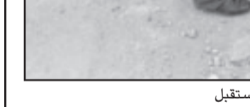
حماس ستقتل على نحو افضل في المستقبل

عصبة الارهاب لحماس اكتسبت الان تجربة قتالية واغلب الظن ستقتل على نحو افضل في المستقبل، ولكن لا يزال معظم أعدائنا أقوى من حماس، وعليه