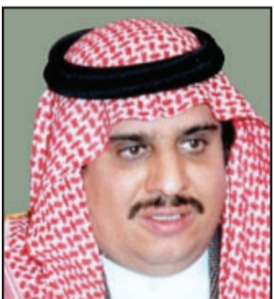
الامير سلطان بن فهد

الرياض - يو بي اي - لندن - «القدس العربي»: أطلق عدد من الشباب السعودي حملة لمقاطعة مباريات الدوري السعودي ردا على تصريحات الامير سلطان بن فهد الرئيس العام لرعاية الشباب عقب هزيمة منتخب بلاده في نهائي «خليجي 19» في سلطنة عمان. واطلق معقلون غاضبون على تصريحات الامير سلطان بن فهد حملة تدعو لمقاطعة جميع مباريات الدوري السعودي ومباريات المنتخب كذلك تحت شعار «خلوها ننتهم». وتدعو حملة «خلوها ننتهم» إلى مقاطعة حضور مباريات الدوري السعودي في الملاعب بهدف إخماد مديريات المباريات من المنقرضين، كما دعت إلى مقاطعة الاشراق في جولات الأندية، ومقاطعة الاشراق في قناة الجزيرة السعودية على باقة ART، ومقاطعة شاملة لكل ما يخص الرياضة. من جانبها اكدت إمارة الرياض مساء