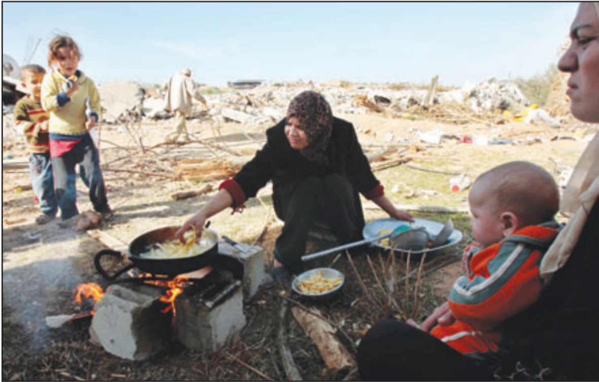
سيدة فلسطينية تعد الطعام لاطفالها في العراء بعد ان دمرت اسرائيل الحي الذي تقطنه في قطاع غزة