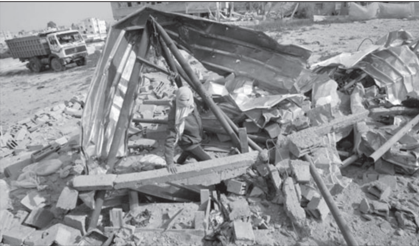
الأمريكيون سينفذوننا من كل وحل ندخل فيه أنفسنا

سلام فارغة أخرى، باختصار، لا تقلقوا... العم سام عندما في الجيب، يخيل أن هذا الترتيب الممتاز انتهى، في السياسة الإسرائيلية ربما ميرتس وحدها مبنية حسب قوانين اللعب الجديدة، وغيرها؟ لا أحد آخر، الملعبين غيروا القواعد، ولكنهم أعلنوا عن ذلك بالذات، ولكن من يستمع؟ أيام صعبة بانتظارنا.