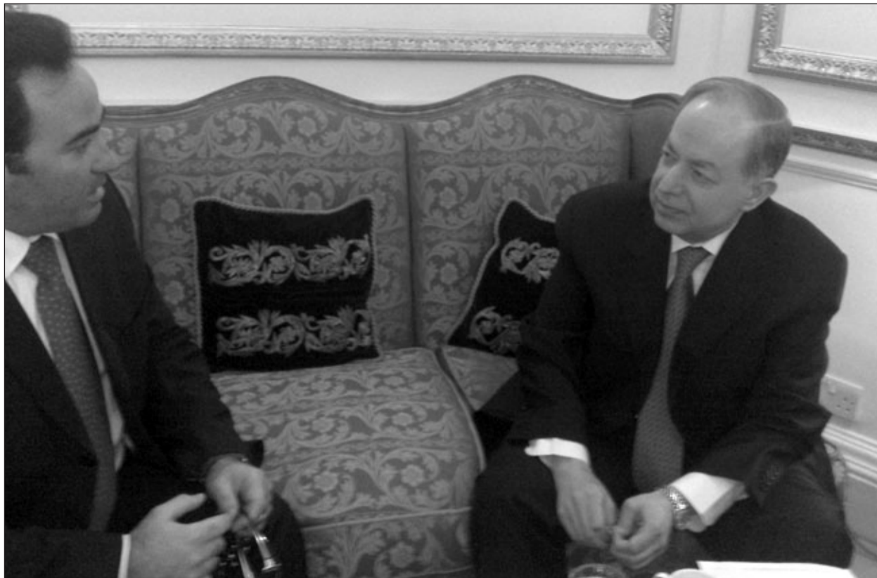
وزير السياحة السورية خلال اللقاء

الاستثمارات للمنشآت السياحية في الخدمة 198.388 مليار ليرة في نهاية 2008 مقابل 192.952 مليار ليرة بنهاية 2007 بمعدل زيادة 3% وكذلك بلغت قيمة الاستثمارات قيد الإنشاء وفي نهاية عام 2008 حوالي 218.664 مليار ليرة مقابل 162.422 مليار ليرة نهاية عام 2007 بمعدل تزايد 34.6%. وقد ارتفع تدفق الاستثمار السياحي السنوي للمشاريع قيد الإنشاء من 39 مليار ليرة سورية في عام 2007 إلى 52.8 مليار ل.س في عام 2008 بمعدل نمو 35% بين عام 2007 و2008. حيث تركزت الاستثمارات السياحية للمنشآت الموضوعه بالخدمة في ست محافظات (دمشق، ريف دمشق، حلب، حمص، اللاذقية، طرطوس) بنسبة 87.6% وباقي المحافظات (درعا - السويداء - دير الزور - الرقة - الحسكة - ادلب - حماه - القنيطرة) بنسبة 13.4%. وقال وزير السياحة إن هناك 12 مشروعاً سياحياً بقيمة 13.9 مليار ليرة في مختلف المحافظات تقدمت 31 شركة استثمارية بعروضها الفنية والمالية لتنفيذها حيث سيتم تشكيل لجان مشتركة مع الجهات المالكة للبدء بعمليات لبن العروص تمهيداً لإنجاز التعاقد الاستثماري مع الشركات الاستثمارية التي يرسو عليها العرض لكل موقع. وختم وزير السياحة - الذي بدأ جولته مكثفاً بالمقابلات - أنه سينقل من لندن إلى إسبانيا ثم ألمانيا ففرنسا بعد أن جال في إيطاليا وبعض الدول الأوروبية قبل فترة وجيزة. وقال إن الحلم الذي صار حقيقة هو النظر للسياحة في سورية على أنها حوار إنساني بين الشعوب يسهم في إبراز الصورة الحضارية لسورية ووضع خطة متكاملة للترويج والتسويق تكفل رسم هوية جديدة للسياحة وجذب السياح والاستثمارات وتوظيف العائلات السياحية في الحفاظ على المواقع الأثرية والسياحية وصيانتها وزيادة مساهمة السياحة بالدخل القومي.