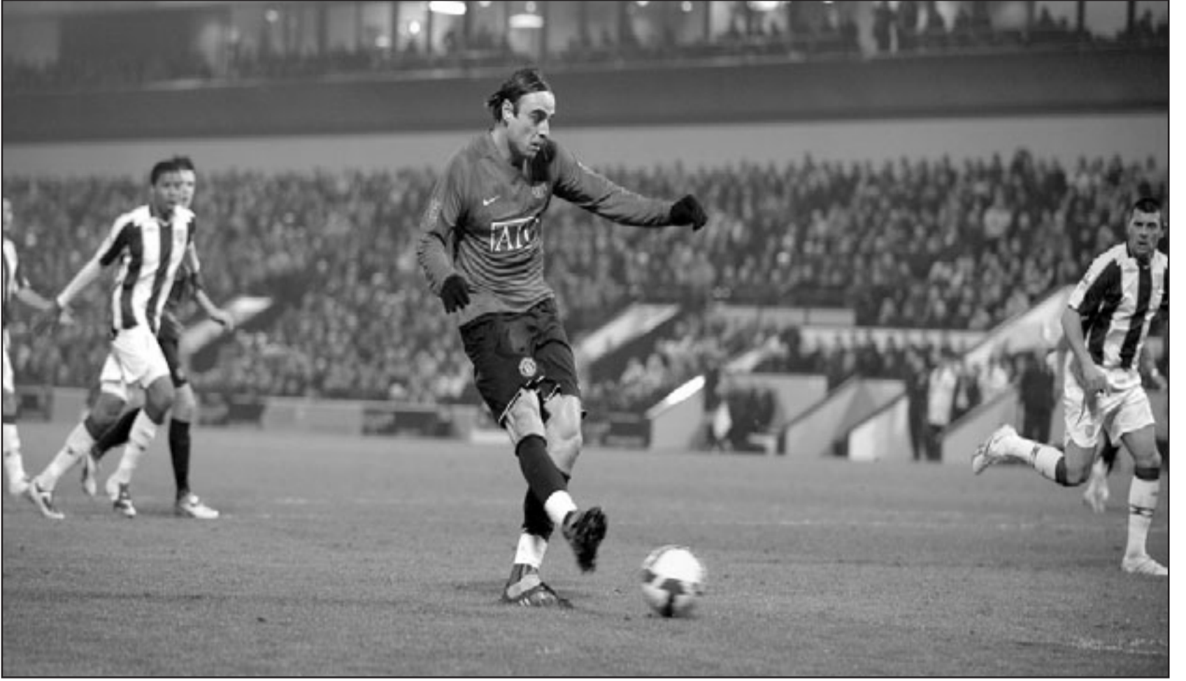
بيراتوف لاعب مانشستر يونايتد ينفرد بالكرة

بهذا الفوز رفع مانشستر يونايتد رصيده الى 50 نقطة من 22 مباراة وسجل رقما قياسيا جديدا في الدوري الممتاز الانكليزي بعد ان خاض 11 مباراة دون اي يدخل مرماه اي اهداف ليتفوق في هذا الصدد على رقم تشيلسي في موسم 2004 - 2005. وصعد استون فيلدا الى المركز