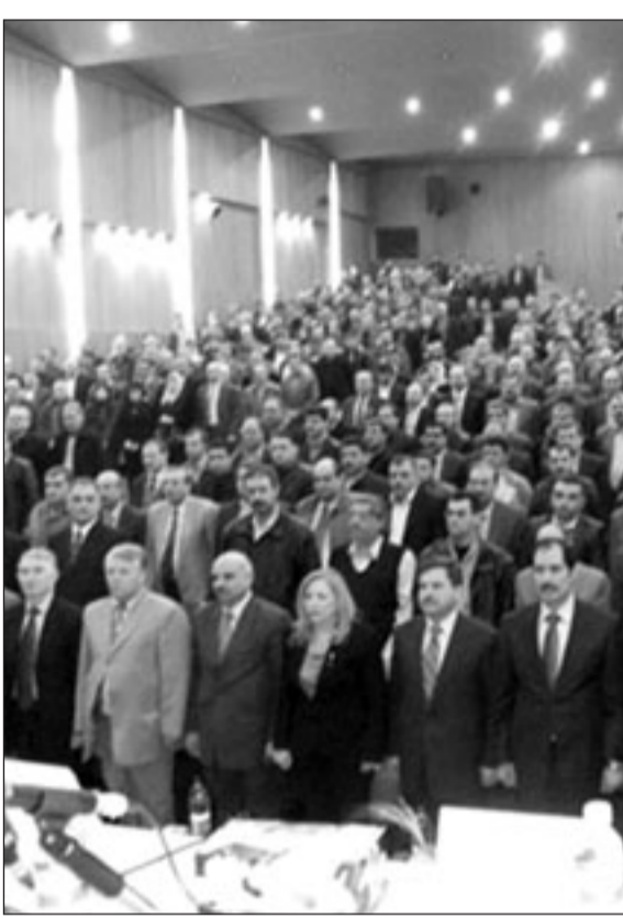
من افتتاح مهرجان «العزة لغزة» (القدس العربي)

ولكن هذه الرسالة سوف تصل إلى هذا العنوان، لأن شعب فلسطين صامد، ولأن جميع المضطهدين ومؤيدي السلام في العالم يقفون إلى جانب فلسطين