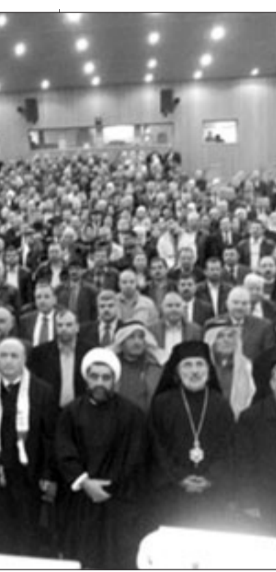
من افتتاح مهرجان «العزة لغزة»