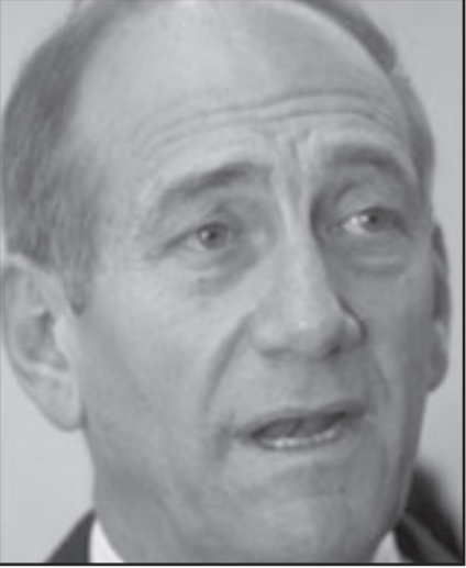
اولرت التزم ببحث جميع القضايا الشائكة

مع السلطة الفلسطينية وتناول قضية القدس من دون تخشى من قيام ابلي يشاي باسقاط حكومتها. ان كان يعترضها جسر الهوى بين الجانبين فلتقم بصياغة مسودة التسوية الدائمة. هذا هو الطريق الوحيد لتفاد السلام وتحويل الانتخابات القادمة الى استفتاء حول مستقبل اسرائيل كنولة يهودية وديقراطية. من يعرف ربما كان هذا هو السبيل لاحت ننتياهو - اربيل شارون قال بان خطة قف الارتباط كانت رده على مبادرة جنيف التي طرحها يوسي بيين.