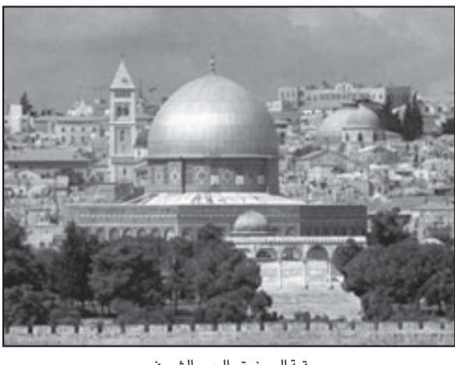
قبة الصخرة والحرم الشريف

للتربية والثقافة والعلوم الفلسطينية اسماعيل تلاوي ان اتحاد اذاعات الدول العربية الذي يضم 51 فضائية عربية منح الفلسطينيين حيزا فضايليا مفتوحا للجمعة للحديث عن مدينة القدس. وأشار تلاوي الى ان الموجة المفتوحة ستستمر لمدة 10 ساعات من خلال ستوديو خاصة تم اعداده لهذه المناسبة التي تأتي تحضيرا لاحتفاليات القدس عاصمة الثقافة، منوها الى ان مقابلات وصورا وبرامج والاملا وثائقية عن مدينة القدس وعن الامان الحضارية والتاريخية فيها ستبث خلال الموجة المفتوحة. وقال تلاوي في تصريحات صحافية «ستخرج بهذه الموجة الفتوحة التي حملت شعار القدس توحدا ولا تفرق» التزام من نشر أكثر من 20 صحيفة عربية صفحة خاصة عن مدينة القدس. وقال رئيس وحدة القدس في ديوان الرئاسة، مقرر اللجنة الوطنية العليا لاحتفالية القدس عاصمة للثقافة العربية عام 2009، الحامي أحمد الرويضي ان 20 صحيفة عربية خصصت اليوم الجمعة إحدى صفحاتها للقدس عاصمة للثقافة العربية. وأفادت الرئاسة الفلسطينية، عقب توقيع اتفاقية مع 20 مؤسسة مقدسية لتنفيذ مشاريع تتعلق بالثقافة القدس عاصمة للثقافة العربية، بأن الصحف العربية إضافة إلى صحفتي «الأيام» و«الحياة الجديدة» الفلسطينية،