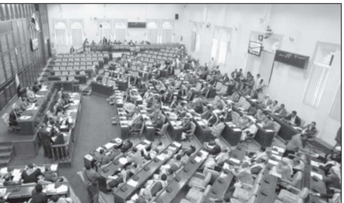
البرلمان اليمني خلال جلسة التصويت على تمديد دورته امس في صنعاء

اللامركزية وتمنح البرلمان صلاحيات اوسع. وجاء الاتفاق بين الحزب الحاكم، الذي كان ينوي اجراء الانتخابات منفردا، والمعارضة، اثر وساطة للاتحاد الاوروبي ومن العهد الديموقراطي الامريكي نتج عن حوار مستمر منذ حوالي عام بين الطرفين. ومن شأن هذا الاتفاق ان يضمن مشاركة المعارضة في الانتخابات المقبلة بعدما لوتحت بالمقاطعة ونظمت تظاهرات خلال الاشهر الماضية للدعوة الى عدم المشاركة في الانتخابات ورفض «اللتزوير» في اللوائح الانتخابية. وكانت احزاب المعارضة الرئيسية في اليمن حذرت في 12 شباط/فبراير الجاري من ان الاستعدادات التي تجري لاجراء الانتخابات التشريعية في نيسان/ أبريل المقبل لن ينتج عنها سوى ما أطلقت عليه «اقتراع مزور» وليس انتخابات حرة ونزيهة.