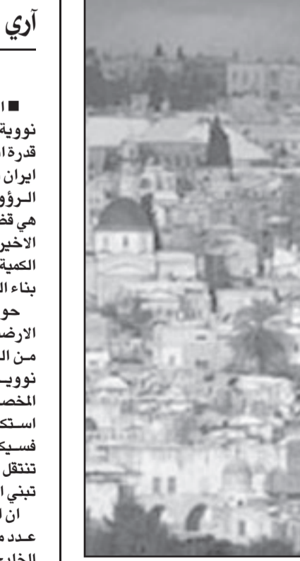
تسوية النزاع ستقلص الذرية العدوانية الايرانية

معدى الامر واضح: حتى ان لم تستخدم ايران سلاحها النووي، فمجرد امتلاكها لهذا السلاح سيغير وجه العالم. عالم ثلث مصادر طاقته موجودة تحت مظلة طهران هو عالم آخر. عالم خاضع لنزوات شرق اوسط نووي