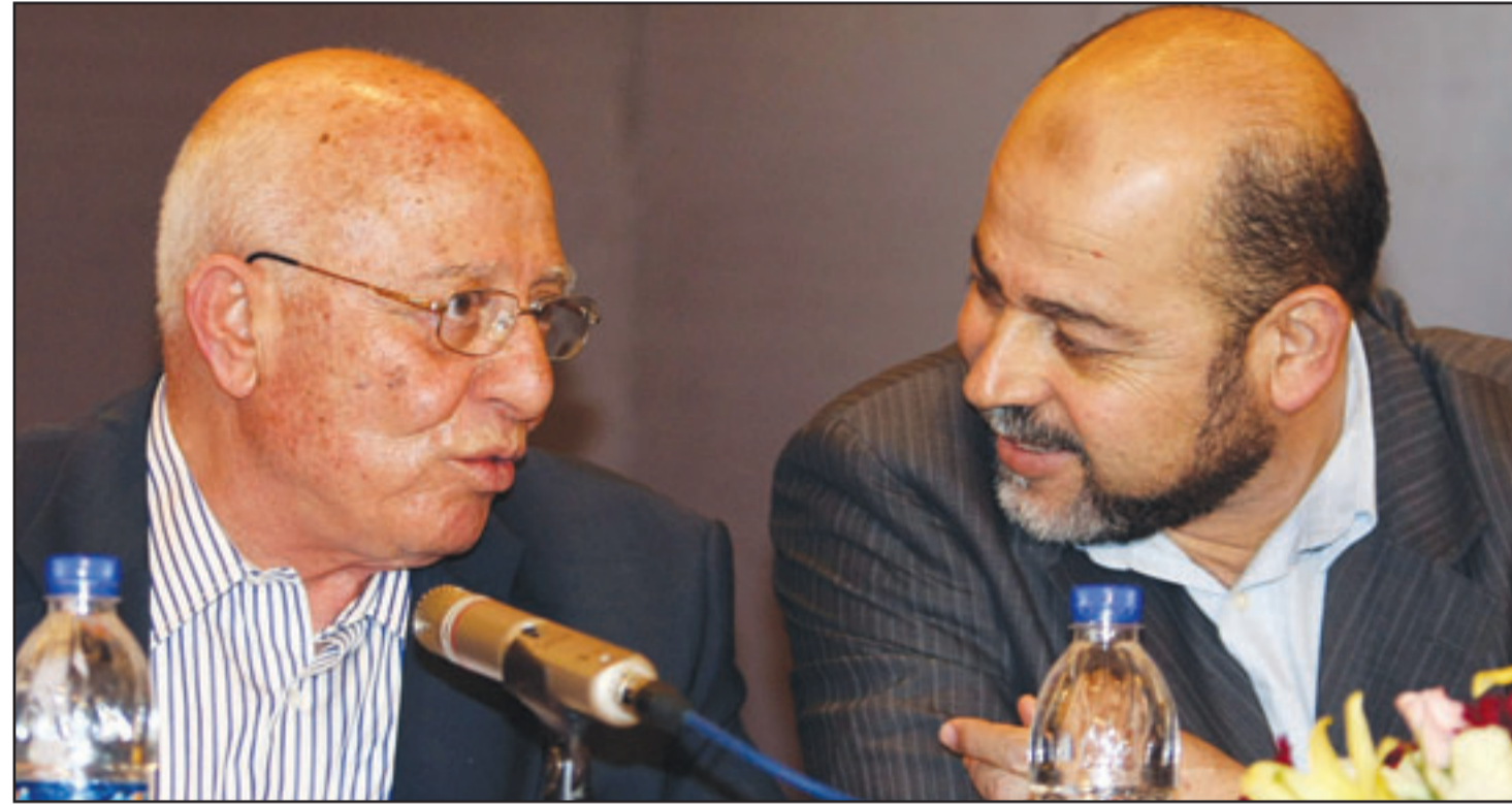
رئيس وفد فتح للحوار الفلسطيني احمد قريع (يسار) يتحدث مع رئيس وفد حماس موسى ابو مرزوق أثناء مؤتمر صحفي في القاهرة في نهاية جلسة الحوار امس

وترتيبات و موعد الانتخابات الرئاسية والتشريعية المقبلة واعادة هيكله الاجهزة الامنية على اسس مهنية وليس فصائلية واعادة هيكله منظمة التحرير لضم حركتي حماس والجهاد الاسلامي اليها، ولجنة المصالحة الداخلية. وقال القيادي في الجبهة الشعبية لتحرير فلسطين جميل الجدلوي انه تم الاتفاق كذلك على «ان تنتهي اللجان من اعمالها وعلى تشكيل حكومة توافق وطني قبل نهاية اذار (مارس) المقبل، وهو ما اكده كذلك نائب الامين العام لحركة الجهاد الاسلامي محمد الهندي ومشاركون آخرون. واكد القيادي في حزب الشعب وليد العوض ان لجنة سادسة يطلق عليها «لجنة التسيير» ستضم ممثلين عن مصر والجامعة العربية وقيادات الفصائل الفلسطينية وستكون مهمتها تدليل العقبات التي قد تنشأ أثناء عمل اللجان. وكان مسؤول مصري رفيع قال لوكالة انباء الشرق الاقليمية، (تفاصيل ص 5)