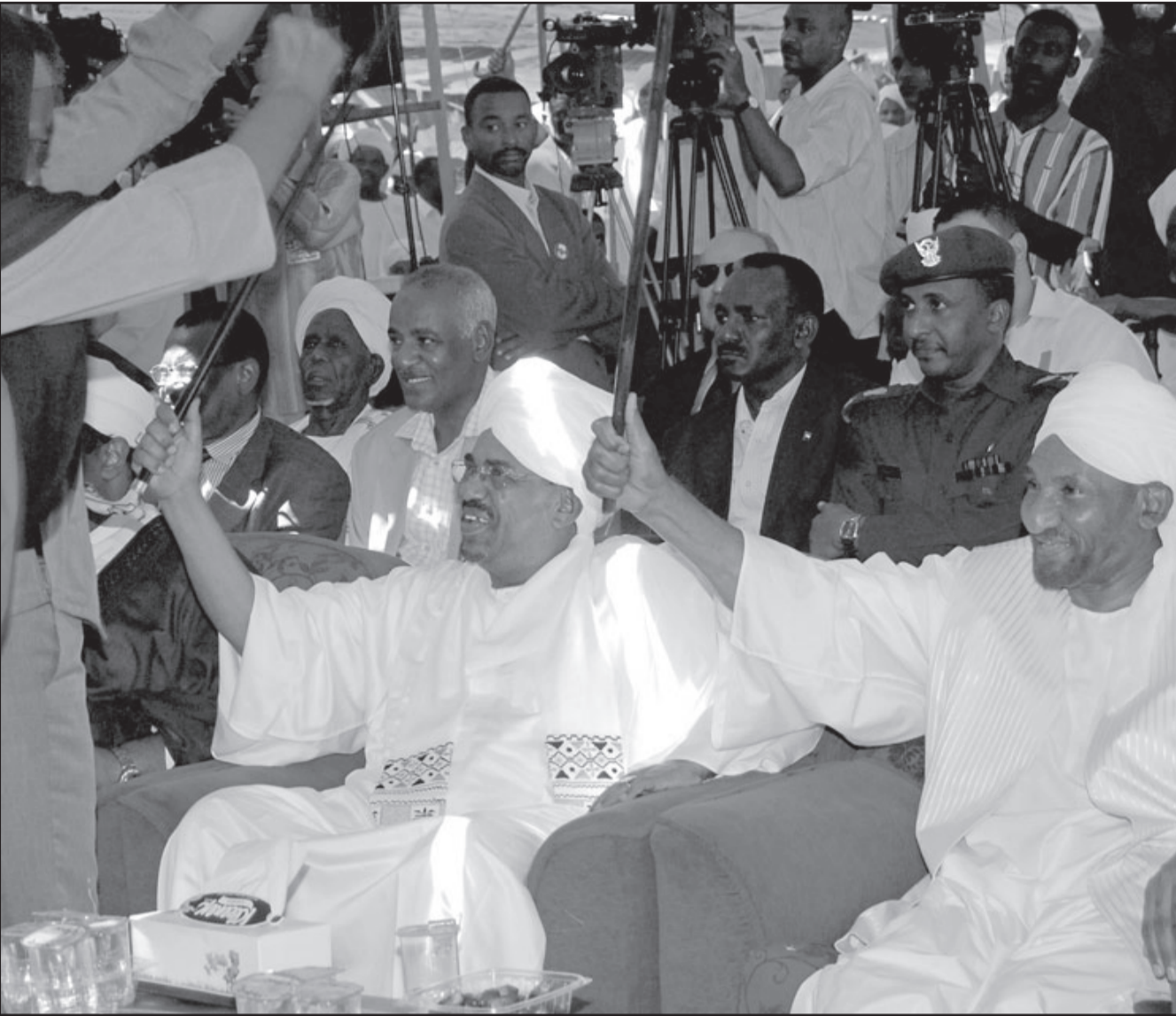
الرئيس السوداني عمر البشير مع رئيس حزب الامة الصادق المهدي خلال حفل على هامش اعمال المؤتمر السابع لحزب الامة امس في الخرطوم

واضاف «كيف لنا التحدث عن تحول ديمقراطي وقانون الامن الوطني يتيح له اعتقال الاشخاص واحتجازهم دون اذن من احد والصحافة المحلية تشكو من الرقابة القبلية وحريتها مسلوبة...» ويصنف اتفاق السلام الشامل الذي وقّعه الحكومة السودانية والحركة الشعبية لتحرير السودان في العام 2005 على اجراء تعديلات على قوانين الامن الوطني والصحافة. وبموجب الاتفاق يفترض ان تجرى انتخابات عامة في الفترة ما بين ايار/مايو وايلول/سبتمبر 2009 اي قبل عامين من اجراء استفتاء تقرير المصير لجنوب السودان.