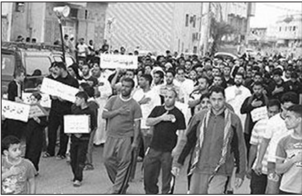
جانب من تظاهرات الشيعة السعوديين في بلدة العوامية بالقطيف في المنطقة الشرقية

بها إيران. التي تأسف على أوضاع الإثني عشري على السلطة هناك». واختتم العمر بيانه بتأكيد أن «السلمين» تسامحوا مع الشيعة «إلى حدود التفريط والصليبين عليها تحت ذلك هو «ما يفسر بقاياهم في المدينة النبوية مثلا».