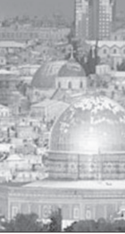
تسوية النزاع ستقلص الذرية العدوانية الايرانية

على اسرائيل ذو مغزى ولكنه ليس جوديبا كما قضي ايضا بان «دولة اسرائيل غير قابلة للابادة». هذا التشخيص يجب ان يقف امام ناظر الجمهور حين يأتي لحاكمه سلوك متخذيبه بعد الايام. العقل السليم يؤيد تقدير هليفي: سلاح نووي ايراني، اذا ما وعندما ينتج، مخصص لتعظيم المكانة الاستراتيجية لطهران حيال دول الخليج اكثر مما هو لتهديد اسرائيل مباشرة.