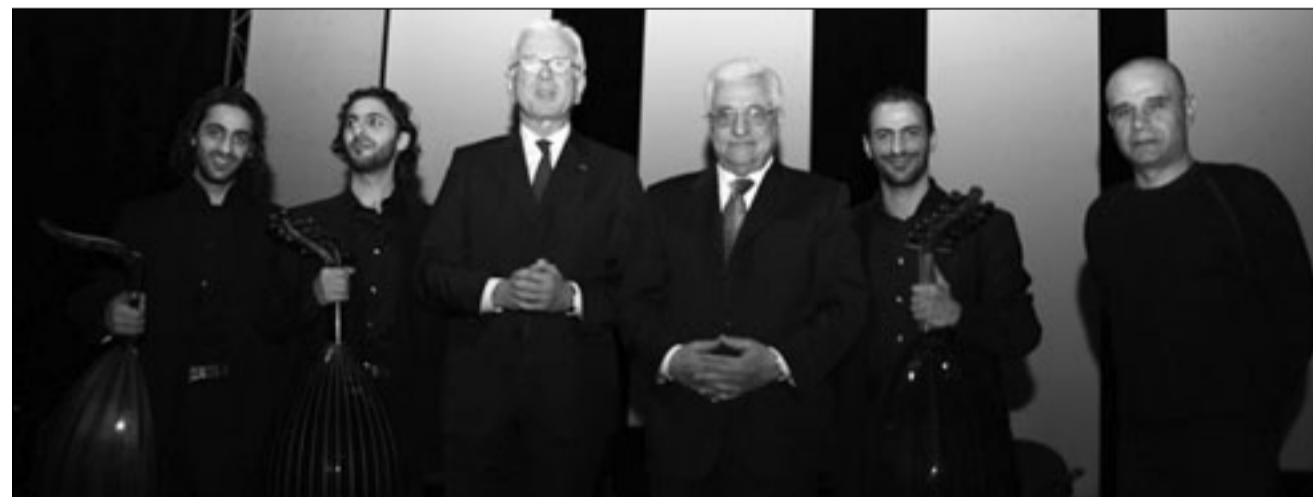
الثلاثي جبران في البرلمان الأوروبي بحضور محمود عباس وهانيس غبرت بوتريغ (القدس العربي)

■ باريس - «ثلاثين» - استحضر الثلاثي جبران: سمير، ووسام، وعدنان، بعملهم الفني «في ظل الكلام»، وسبق أن قدموه بنجاح في رام الله، والناصرة، والقاهرة، والشاعر الراحل محمود درويش، صوتاً، كما لو كان يقسم معهم المنصة التي صممت خصيصاً لتكريم «لاعب النرد» في البرلمان الأوروبي، مطلع الشهر الجاري، في مدينة ستراسبورغ الفرنسية، بحضور الرئيس محمود عباس، ورئيس البرلمان الأوروبي هانيس غبرت بوتريغ، وعدد من رؤساء البرلمانات وأعضائها، والشخصيات السياسية والفنية في أوروبا.