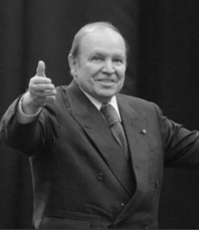
الرئيس الجزائري عبد العزيز بوتفليقة

من النجوم التي يعيشها الجزائريون لأصوله التي تعود إلى ولاية «بجاية» (240 كيلومتراً شرق العاصمة الجزائرية). كما زار صاحب ألقاب «طلحة» في تاريخ كرة القدم مناطق سياحية وأثرية، خاصة تلك التي توجد بمدينة «جانت» الواقعة بولاية «اليزي» (2300 كيلومتر جنوب العاصمة الجزائرية) وقد أبدى إعجاباً وإعجاباً بما رآه عيناه، مغرباً عن أمه في العودة مرة أخرى، خاصة وأن الحراسة الأمنية المشددة التي أحيطت بها أعطت الزيارة طابعاً رسمياً يسعى إلى