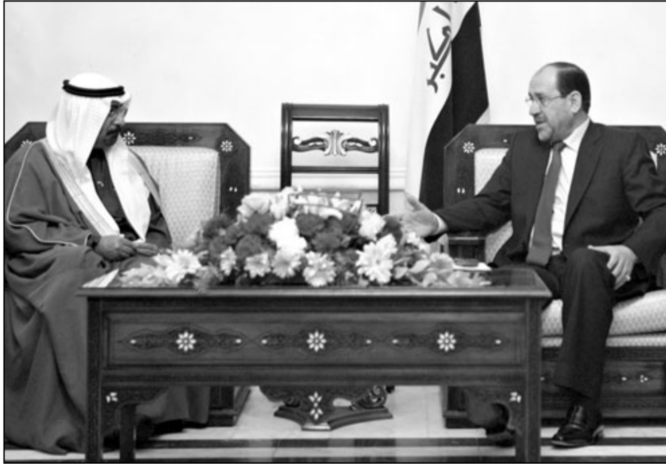
رئيس الوزراء المالكي اثناء استقباله وزير الخارجية الكويتي الشيخ محمد الصباح في بغداد امس (رويترز)