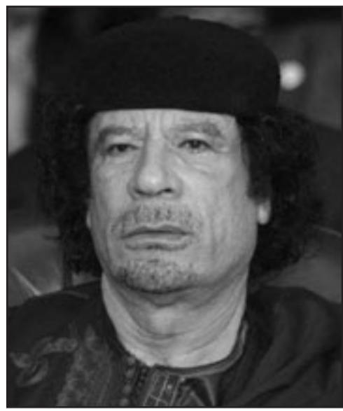
الزعيم الليبي معمر القذافي

■ طرابلس-رويترز: قالت وسائل إعلام ليبية رسمية أمس الخميس إن الزعيم الليبي معمر القذافي التقى محمد ولد عبد العزيز زعيم المجلس العسكري الحاكم في موريتانيا في إطار جهود وساطة لإنهاء الأزمة السياسية في الدولة الإسلامية الصحراوية بعد انقلاب. وتولى عبد العزيز وهو قائد سابق للحرس الجمهوري السلطة في آب/أغسطس وأطاح في انقلاب سلمي بأول رئيس ينتخب ديمقراطياً في موريتانيا. وذكرت وكالة الأنباء الليبية بعد الاجتماع أن عبد العزيز عبر عن تقديره للقذافي لدوره في سبيل تحقيق مصالحة شاملة واستعادة الاستقرار والسلام في موريتانيا. وأضافت الوكالة أن «الجنرال عبد العزيز أكد ثقته وثقة الشعب الموريتاني في حكمة القذافي لتحقيق هذه المصالحة. ودعت مجموعة الاتصال حول الأزمة في موريتانيا الأسبوع الماضي في باريس، الجهات المعنية إلى «حوار سياسي» برعاية الزعيم الليبي. وكان القذافي انتخب رئيساً للاتحاد الأفريقي لسنة واحدة. وأعربت مجموعة الاتصال عن بدء هذا الحوار «في أقرب فرصة» على أن يتم تحديد تاريخ عقده ومكانه وكيفية تنظيم أعماله من قبل الاتحاد الأفريقي بالاتصال مع الأطراف الموريتانية.