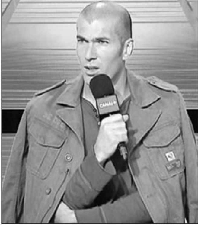
النجم زين الدين زيدان

وقد فوجئت السلطات الجزائرية والرأي العام كذلك بإذاعة خبر تواجد النجم زين الدين زيدان في الصحراء الجزائرية منذ أيام، وهي الزيارة التي تمت بشكل سري، على اعتبار أن «زيرو» رفقة عائلته بكثير من التكرم، بعيداً عن أضواء وعن مطاردة وسائل الإعلام. غير أن انتشار الخبر جعل السلطات ترسل فرقاً أمنية للإشراف على حماية اللاعب وأفراد عائلته الذين يرافقونه في هذه الرحلة، وهم الداه وأبناؤه الثلاثة ومدير أعماله، وقد وضعت تحت تصرفه طائرة رئاسية ينتظر أن تنقله الأحد القادم إلى العاصمة الجزائرية للقاء الرئيس بوتفليقة. وكان زيدان قد حظي أيضاً باستقبال السلطات المحلية في المناطق الصحراوية التي زارها، بعد أن نقلت هذه السلطات أوامر بالسفر على راحة اللاعب الفرنسي الدولي الكاسي الفائز لكأس العالم وأوروبا عامي 1998 و2000، والذي يعتبر