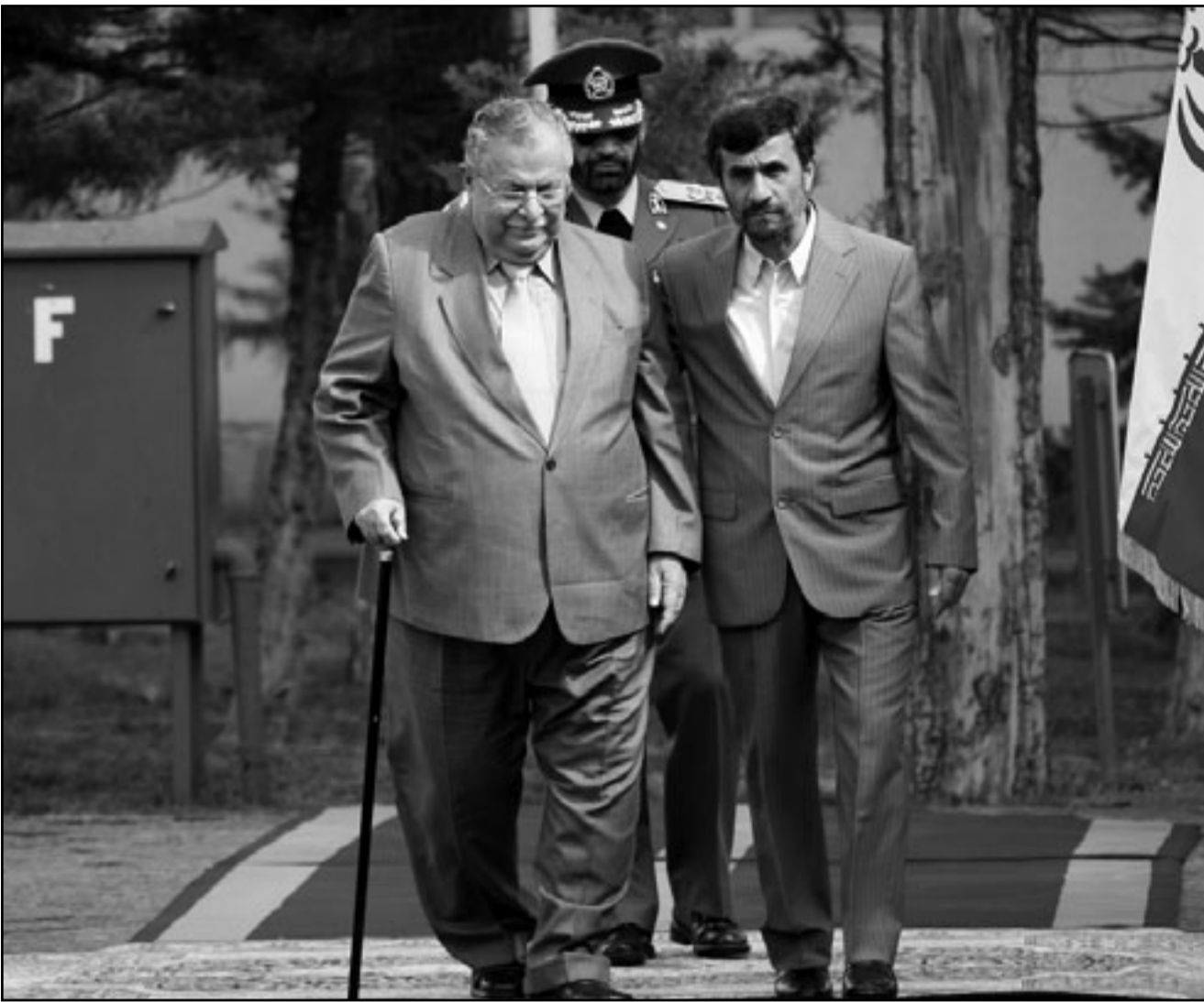
الرئيس الإيراني احمدي نجاد لدى استقباله الرئيس العراقي جلال طالباني في طهران

وقال المحافظ: «طلب من مجلس المحافظة تشكيل لجنة في موضوع تسلّم وتسليم الحكومة المحلية