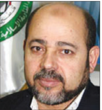
موسى أبو مرزوق