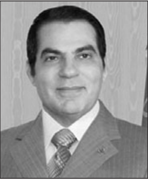
الرئيس زين العابدين بن علي

■ تونس - يو بي اي: وصف الرئيس التونسي زين العابدين بن علي اتحاد المغرب العربي بأنه خيار لشعوب المنطقة وصمام أمن لها، مؤكداً أنه حتمية تاريخية وضرورية حيوية ومصيرية.