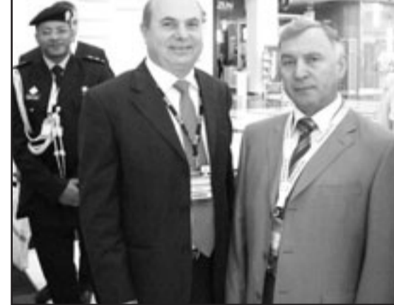
رئيس اركان القوات المسلحة الروسية نيكولاي ميخالكوف (يمين) والزميل جمال المجايدة

لندن - «القدس العربي»: توصل تحقيق قام به محقق خاص للأمم المتحدة وضمن نتائجه في تقرير صدر أمس الجمعة أن مفتي الوكالات الامنية الأجنبية التي تسمح لها بمقابلة المشتبه بملاقتهم بالإرهاب والمحتجزين في قاعدة غوانتانامو قاموا بانتهاك قوانين حقوق الإنسان الدولية. ونقلت صحيفة «واشنطن بوست» عن التقرير الذي أعده الدبلوماسي الفنلندي مارتن شينين، بصفته المفوض الخاص لحقوق الإنسان من الأمم المتحدة. وقال أن المحققين الأمنيين الأجانب الذين زاروا قاعدة غوانتانامو أو السجن السرية الأمريكية الأخرى قاموا بمعاملة لراقية لعمليات التحقيق.