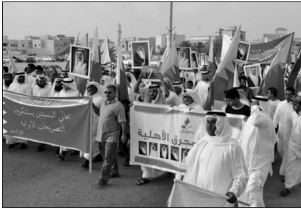
مظاهرة في البحرين تنديدا بالتصريحات الإيرانية الأخيرة

الطويلة، مع طهران. وأضاف «يتوجب على إيران والبحرين أن لا يسمحا للأعداء باستغلال العلاقات بين البلدين».