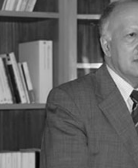
خالد الناصري وزير الاتصال الناطق الرسمي باسم الحكومة المغربية

المبذولة في هذا الاتجاه. وأشادت وزارة الخارجية الأمريكية في تقريرها أن المغرب أبدى تعاوناً مع منظمات حقوق الإنسان الوطنية لسنة 2008، بما وصفته بـ«التقدم» الذي حققه المغرب في مجال حقوق الإنسان والتزامه واستعداده مناقشة هذا الملف بحرية وصراحة».