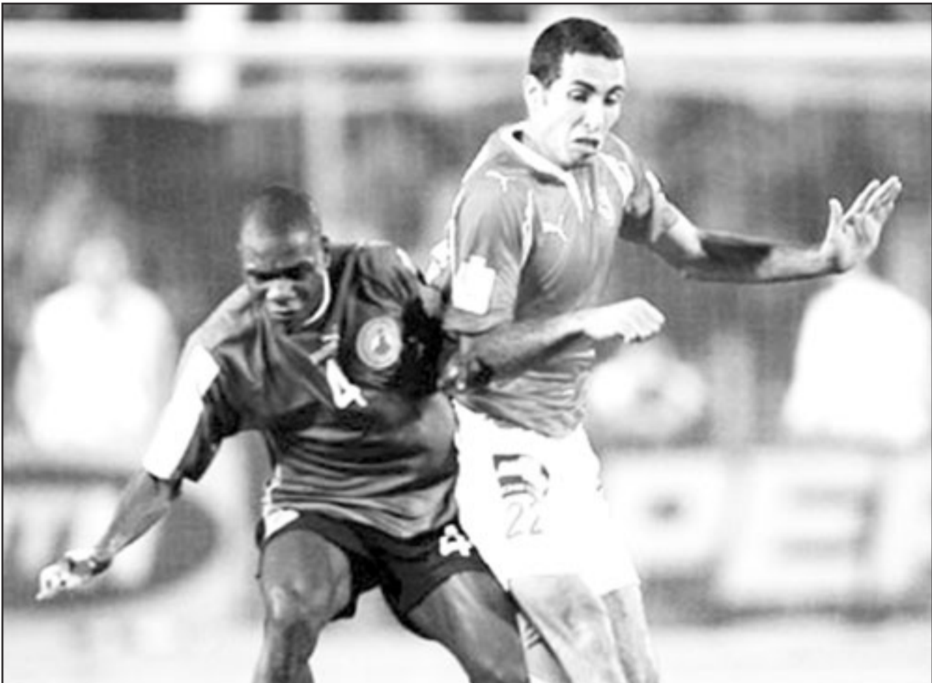
الأهلي المصري خلال إحدى مبارياته مع القطن الكاميروني بذهاب أبطال أفريقي

البرازيلي رافائيل يغيب عن مانشستر يونايتد لمدة شهر لندن - أ ف ب: أعلن مدرب مانشستر يونايتد بطل الدوري الإنكليزي لكرة القدم في المواسم الماضية ومتصدر الترتيب الحالي، الاسكتلندي اليكس فيرغوسون واللاعب البرازيلي رافائيل دا سيلفا سيجيب عن الملاعب لن تكون قبل مطلع نيسان/أبريل المقبل. وسيجيب رافائيل بالتالي عن نهائي كأس رابطة الاندية المحترفة الاحد المقبل بين مانشستر يونايتد وتوتنهام على استاد ويمبلي بسبب إصابة في الكاحل. وأكد فيرغوسون ان عودة الشاب البرازيلي (18 عاما) الى الملاعب لن تكون قبل مطلع نيسان/أبريل المقبل.