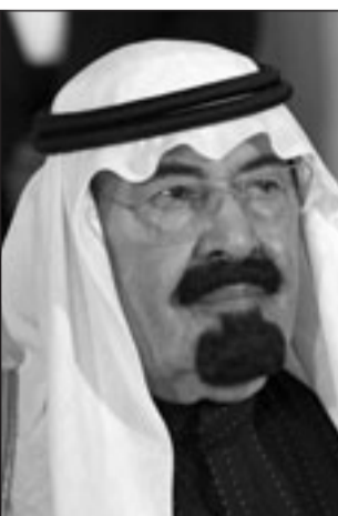
الملك عبد الله

وتابع الملك عبدالله «لم يعرف الملل ولا النكل ولا الضعف درب إلى عقل