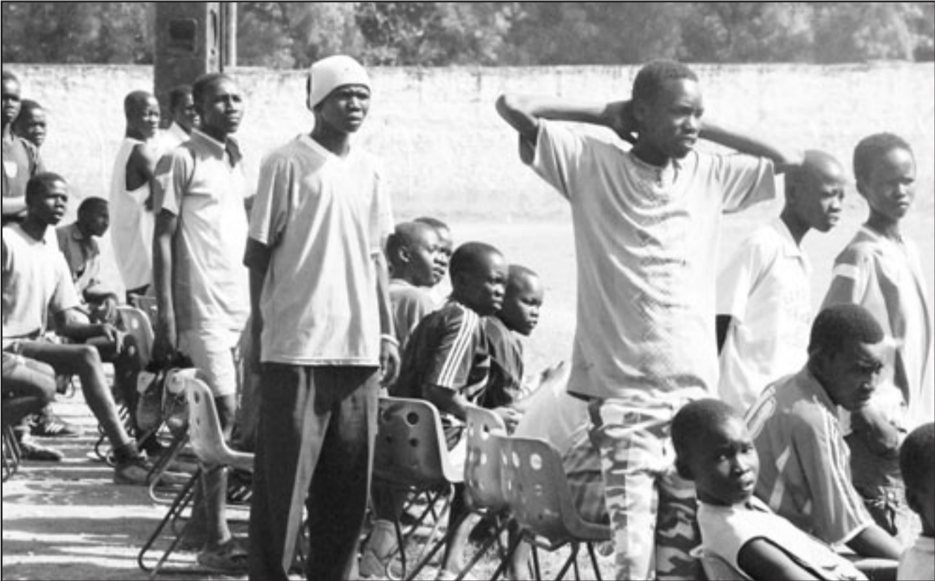
صبيان سودانيون يشاهدون مباراة كرة قدم في جوبا في وقت سابق من الشهر الجاري كجزء من مشروع يهدف الى استخدام الالعاب من اجل علاج الاطفال الذين تضروا من الحرب المدنية الطويلة في جنوب السودان

وفي سياق متصل، اتهمت الحركة الشعبية الجيش السوداني بحرق 100 قنصل، وتبادل الجيش السوداني والجيش الشعبي الاتهامات في احداث ملكال التي ادت الى مقتل وجرح اكثر من (150) شخصاً، ونفى العميد عثمان الأغيش الناطق الرسمي باسم الجيش السوداني تدخل الجيش في احداث مدينة ملكال وحمل قوات الحركة الشعبية مسؤولية حوادث القتل والحرق والدمار الذي طال المدينة، وقال إن اي حديث عن وجود ميليشيات تتبع لقوات اللواء غبريال تاغ في ملكال لا اساس له من الصحة.