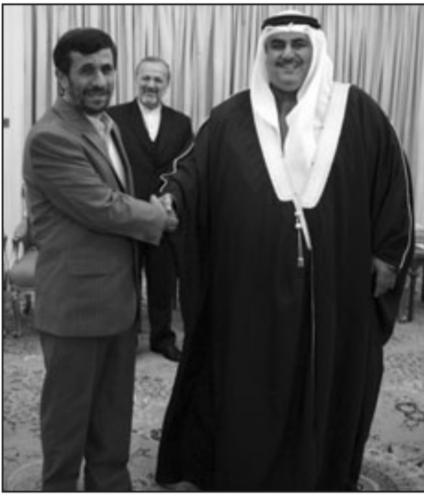
الرئيس الإيراني أحمدوي نجاد يصافح وزير الخارجية البحريني الشيخ خالد بن أحمد آل خليفة