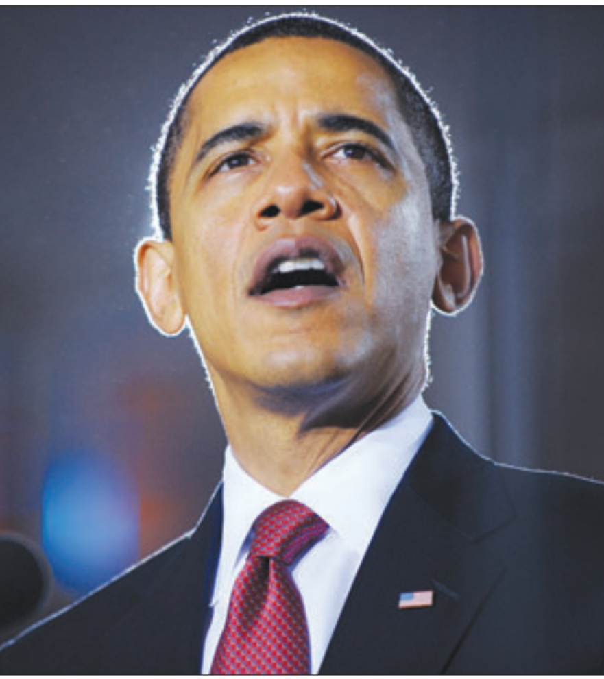
الرئيس الأمريكي باراك أوباما