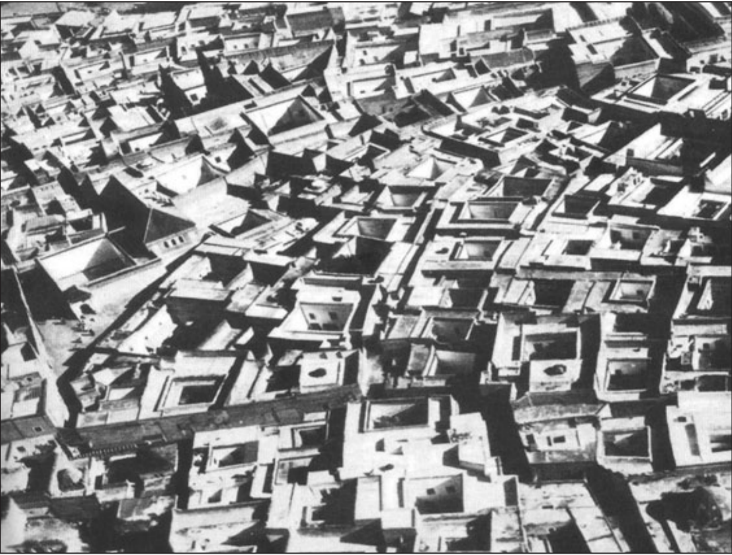
صورة من كتاب بسيم حكيم لحي في مدينة مراكش بالمغرب

محتوى كتاب ابن الرامي، وهو بلا شك وثيقة تاريخية مهمة تعكس وتسجل أبرز ما كان يدور في أوساط البناء والبيئان في أوج الحضارة العربية الإسلامية، إلا أنها لا تفك رموز الإبداعات التي تشهد بها في العمارة، إنما تسجل وقائع اجتماعية وخبرات مهنية تعكس مرحلة زمنية يمكن الاستفادة من دروسها كإلية لا كطريقة أو نظرية يمكن تطبيقها وتقليدها. وتبين مسجلات قانونية لمعالجة أوضاع قائمة لا لتقديم نظرية مسبقة للتخطيط كما هو الحال في المدن العربية اليوم، وهذه المشكلات المتفاقمة التي حفلت بها المدينة العربية الإسلامية والتي شغلت القضاء ودواوين الدولة آنذاك لا يمكن لها بحال أن تحل أي حيز في الدواوين القضائي اليوم، فهناك مراقبة صارمة من قبل النقابات المهنية قبل إعداء أنذونات الترخيص، بل ويتم مسبقا تخيل ما سيكون عليه المبني، والنسبسية لعلاقته بما يجاوره من أبنية وموقع من التسنج الحضري ككل. أما الرجوع لوثيقة ابن الرامي فهذا يدعم الأطروحة المناهضة لمثل هذه الدراسات التقليدية بعدم نجاعة وقصور هذا التخطيط الرجالي والعشوائي للمدينة.