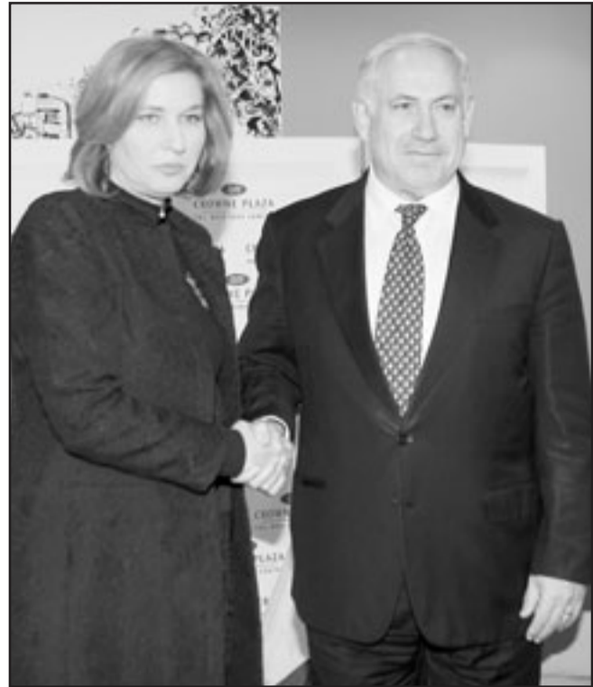
تنتياهو لدى لقائه ليفني الجمعة