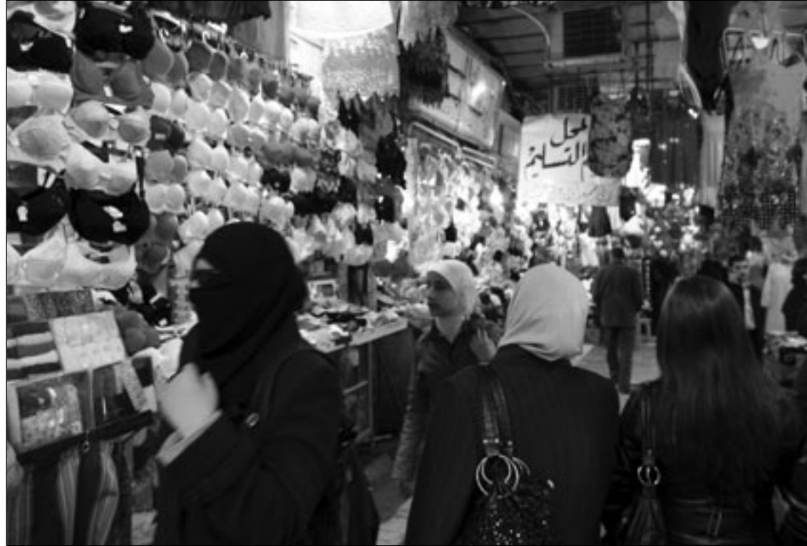
سوق الحميدية في دمشق

دمشق - (ا ف ب) - سراويل داخلية رقيقة بطعم الشوكولا، اخرى تزدان بصافير مفردة، او صديريات مزينة بالريش او بالاضواء، كل هذه الملابس الداخلية وغيرها من منتجات الاشارة الجنسية تباع في سوق الحميدية الشعبي في وسط العاصمة السورية.