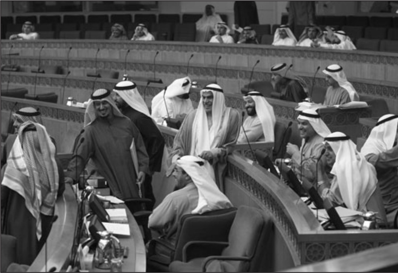
جلسة للبرلمان الكويتي امس

ناصر وهو ابن شقيق أمير الكويت. والتغيير المتكرر للحكومات عادة لا يؤثر على السياسات النفطية لدولة الكويت عضو منظمة أوبك وسابع أكبر مصدر للنفط في العالم وهي سياسات يحددها المجلس الأعلى للبحرول. وقالت قناة «الجزيرة» الفضائية في وقت سابق ان أمير الكويت سيمسرح مرسوما بحل البرلمان خلال يومين وإجراء انتخابات خلال شهرين. ويمك مجلس الأمة الكويتي حق استجواب الوزراء وقبول أو رفض ميزانيات الحكومة ومشروعات القوانين التي تتقدم بها. ويشكل الإسلاميون والعشائر المختلفة أقوى التكتلات داخل المجلس. وحل الشيخ صباح البرلمان الكويتي آخر مرة قبل عام لانهاء نزاع بين نواب مجلس الأمة والحكومة. وتسبب تحرك لاستجواب رئيس وزراء الكويت وهو ابن شقيق أمير الكويت في استقالة الحكومة السابقة في تشرين الثاني (نوفمبر). لكن أمير الكويت أعاد حينها تعيين ابن شقيقه رئيسا للوزراء ليشكل الحكومة الجديدة في أحدث حلقة للسجل الطويل المتواصل بين البرلمان والأسرة الحاكمة الذي لازم البلاد لسنوات. وقال علي البغلي المحلل السياسي ووزير النفط الكويتي الأسبق «اعتقد انه سيحل» وستوجه دعوة لاجراء انتخابات مبكرة لاعطاء نواب البرلمان درسا هو ان وضع البلاد في أزمة دائمة قد يصبح مكلفا. وكثيرا ما يستجوب البرلمان الكويتي الوزراء لكن استجواب رئيس الوزراء يعتبر خطأ أحمر يجب عدم تجاوزه في العلاقة غير المرحة بين الحكومة والبرلمان المنتخب. وتقدم ثلاثة نواب اسلاميين الاثنين يطلب جديد