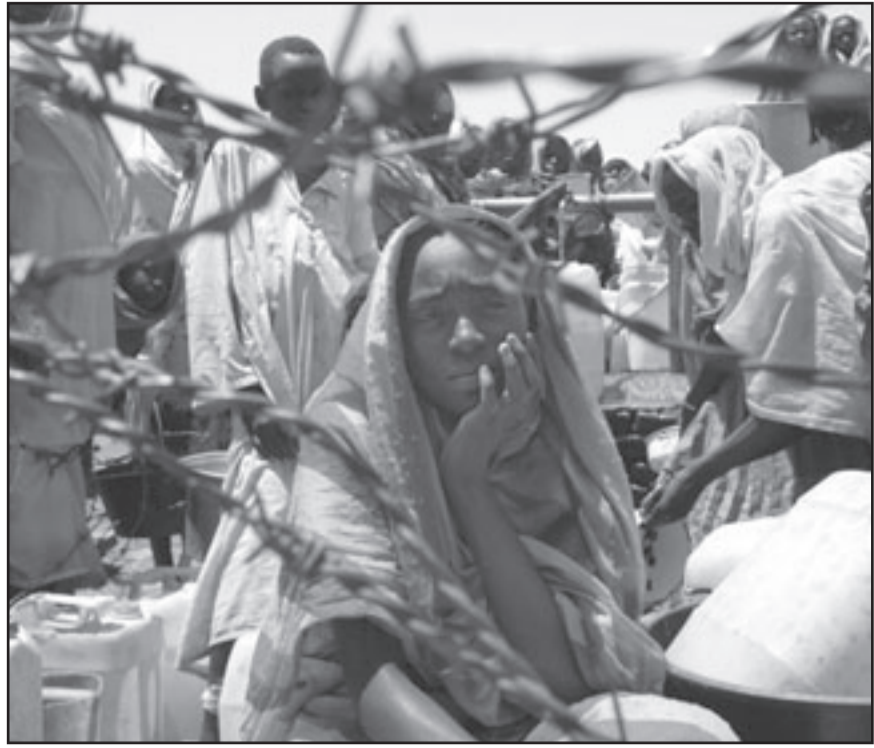
صورة ارشيفية لسيدة من دارفور حيث وقع آلاف ضحايا للعنف في الاقليم منذ اندلاع الحرب في العام 2003