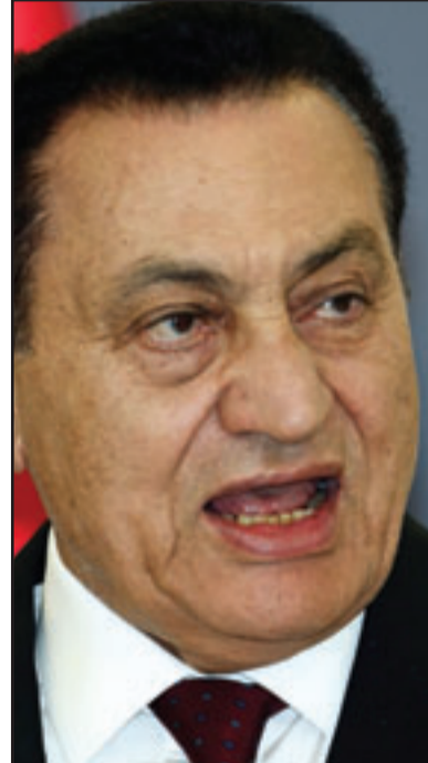
الرئيس المصري حسني مبارك