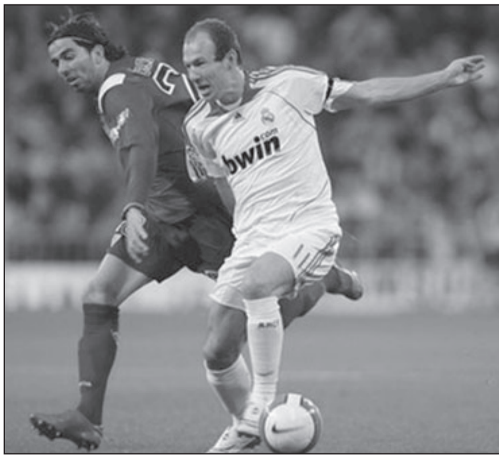
روبين لاعب ريال مدريد (يمين)

لاعب أجنبي. وأسفرت صافرة الحكم بنهاية المباراة عن ثورة فرح عارمة في جميع أنحاء الأستاد. ونفى مدرب بيلباو خواكين كايروس أن تكون المسيرة الناجحة في مسابقة الكأس أحد إنجازاته، موضحاً «هذا كله يرجع للاعبين». وأهدى كايروس الفوز للمدينة وللجامهير التي كانت رائعة اليوم.