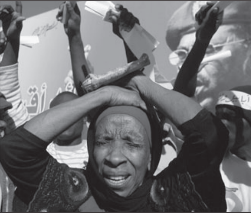
أحدى السيدات السودانيات في تظاهرات الامس