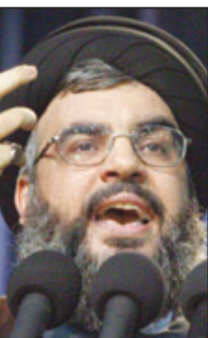
السيد حسن نصر الله

امس الخميس ان هذا القرار لن يشكل سابقة لاجراء محادثات مع حماس التي تسيطر على قطاع غزة.