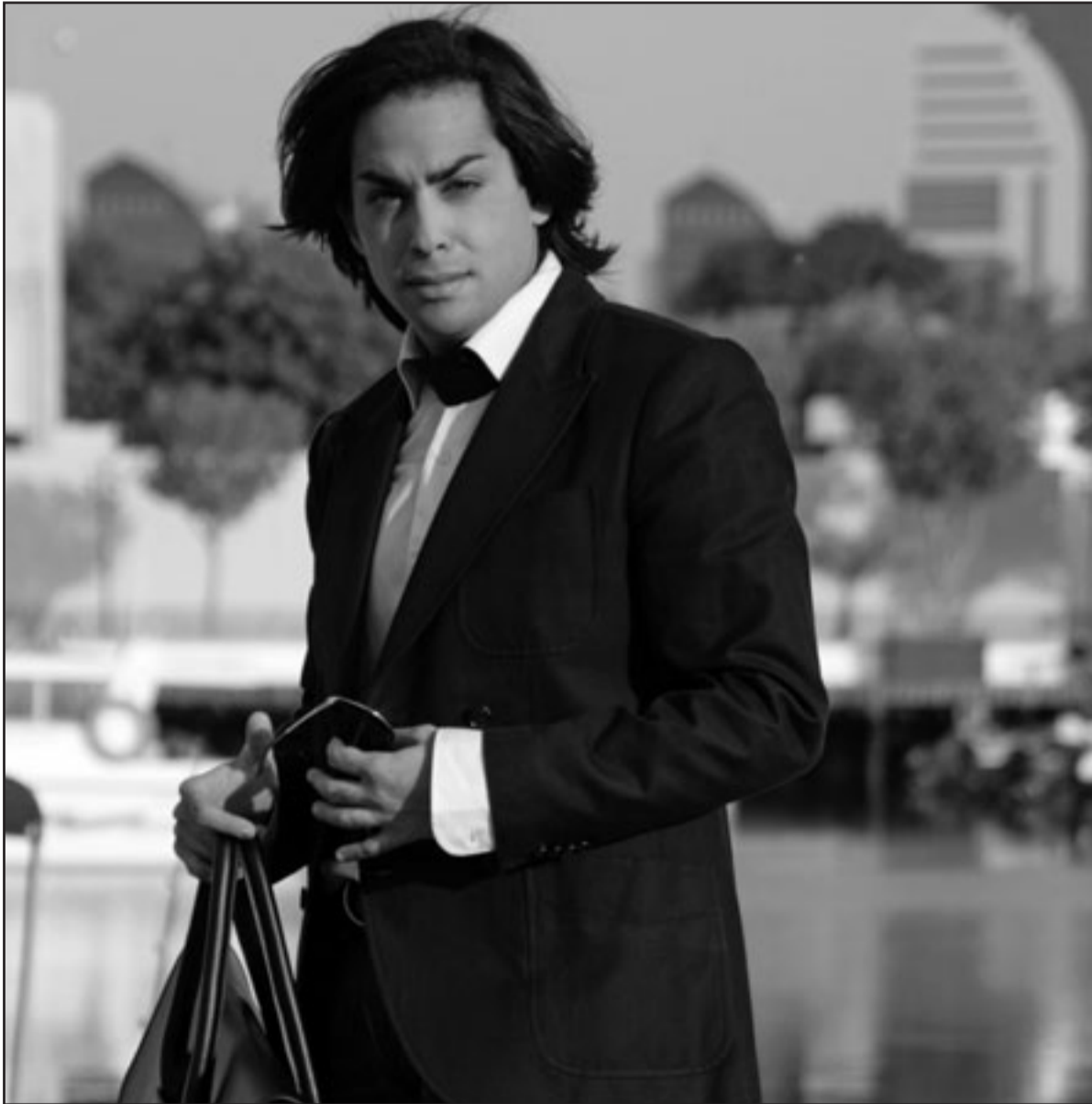
حكم الزعبي (القدس العربي)