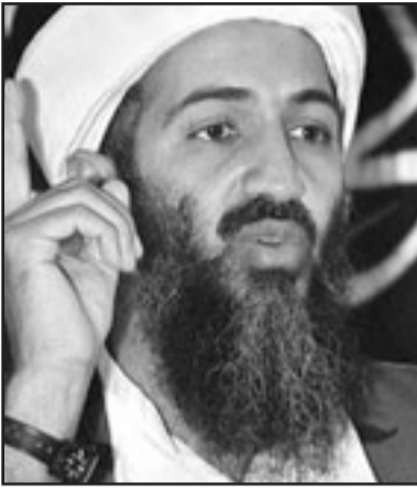
الشيخ اسامة بن لادن

■ صنعاء - ا ف ب: بعد نجاح السلطات السعودية في تقويض القاعدة على ارضها، يبدو التنظيم وكأنه التفتت انفاسه في اليمن المجاور، في حين يعبر بعض الخبراء عن خشيتهم من تحول هذا البلد العربي الفقير في جنوب الجزيرة العربية الى معقل جديد لشبكة اسامة بن لادن. وقال دبلوماسي اجنبي طلب عدم ذكر اسمه لشأنه بشأن باقي الدبلوماسيين الذين تحدثوا مع وكالة «فرانس برس» حول الموضوع ان «جميع المؤشرات تدل على ذلك». ويعد سنوات من الهوء النسبي، شهد اليمن منذ صيف 2007 وخصوصا خلال 2008، سلسلة من الهجمات التي استهدفت مباني دبلوماسية بما في ذلك السفارة الامريكية مرتين ومنشآت نفطية وسياحا اجانب. والهجوم الاكثر دموية نفذ في ايلول (سبتمبر) الماضي ضد السفارة الامريكية واسفر عن مقتل 19 شخصا بينهم سبعة مهاجمين. ومنذ ذلك الهجوم، حظيت القاعدة مجددا بتغطية اعلامية كبيرة لا سيما مع الاعلان عن اندماج ما تبقى من القاعدة في السعودية مع الفرع المحلي للتنظيم تحت اسم «القاعدة في جزيرة العرب»، وذلك في شريط مصور بث على شبكة الانترنت في كانون الثاني/يناير. ويرى محللون ان اعلان عناصر القاعدة السعوديين ولاءهم للفرع اليمني يعني عمليا ان التنظيم قد تلاشى في المملكة. وذكر دبلوماسي اخر انه «من شبه المؤكد ان هناك تدفقا للارهابيين على اليمن». واضاف «ان الارهابيين الذين طردوا من افغانستان يميلون الى اللجوء الى هنا حيث يجدون ملأذا آمنا، او على الاقل مكانا يمكنهم الاختباء فيه». وفصلا عن الطبيعة الجبلية التي تغطي جزءا كبيرا من الاراضي اليمنية، يمكن للهابيين ان يستفيدوا من عدم وجود اي