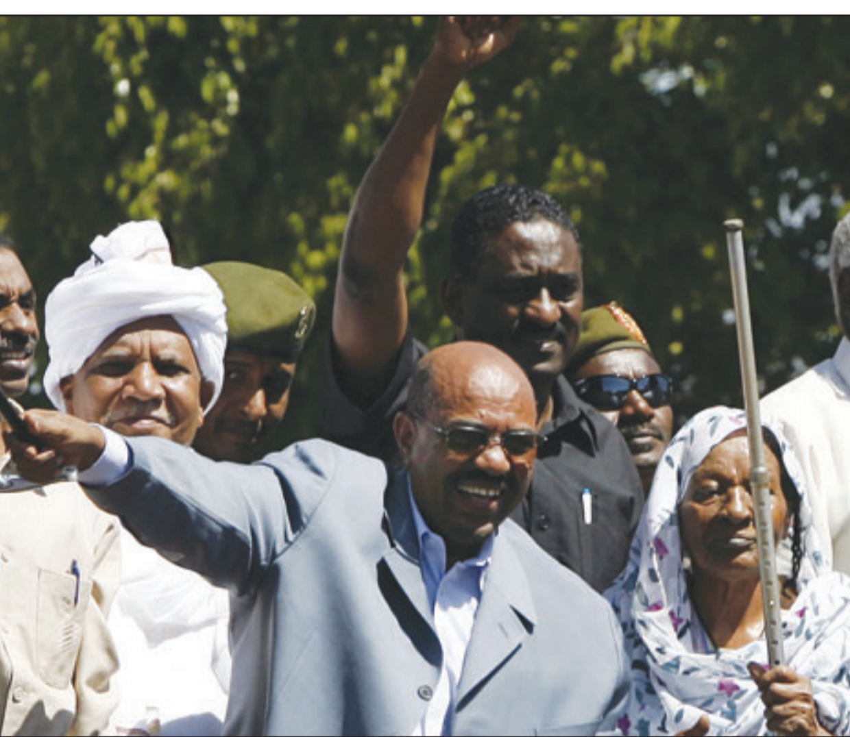
الرئيس السوداني عمر البشير يشارك بتظاهرات احتجاجية على قرار اعتقاله

وسنراعي جميع التعهدات بهذا الخصوص طالما التزمت جادة السبيل واحترمت سيادة البلاد»، الا انه عاد وأكد ردة فعل السودان الأولية على القرار والتي قضت بطرد عشر منظمات اغتاشة على الاقل من المنظمات العاملة في السودان والتي يبلغ تعداد العاملين فيها نحو 300 موظف وموظفة وذلك بزعم تعاونهم مع المحكمة الجنائية.