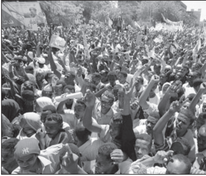
آلاف المتظاهرين السودانيين امس في شوارع الخرطوم تأييدا للرئيس البشير