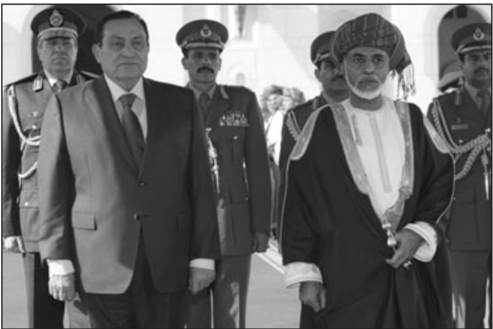
سلطان عمان قابوس بن سعيد مستقبلا الرئيس المصري محمد حسني مبارك في مسقط امس

مسقط-يوبي بي: تلقى السلطان قابوس بن سعيد امس الاربعاء رسالة شفوية من الرئيس الإيراني محمود أحمدني نجاد قلها اليه وزير الخارجية الإيراني منشور من مكتبه. وقالت وكالة الأنباء العمانية الرسمية ان الرسالة تتعلق بهالعلاقات الطيبة بين البلدين الصديقين والأمور ذات الاهتمام المشترك. وتم خلال لقاء سلطان عمان والوزير الإيراني استعراض العلاقات الثنائية، الوطيدة التي تربط البلدين الصديقين وسبل دعم وتفعيل التعاون المشترك بينهما في مختلف المجالات».