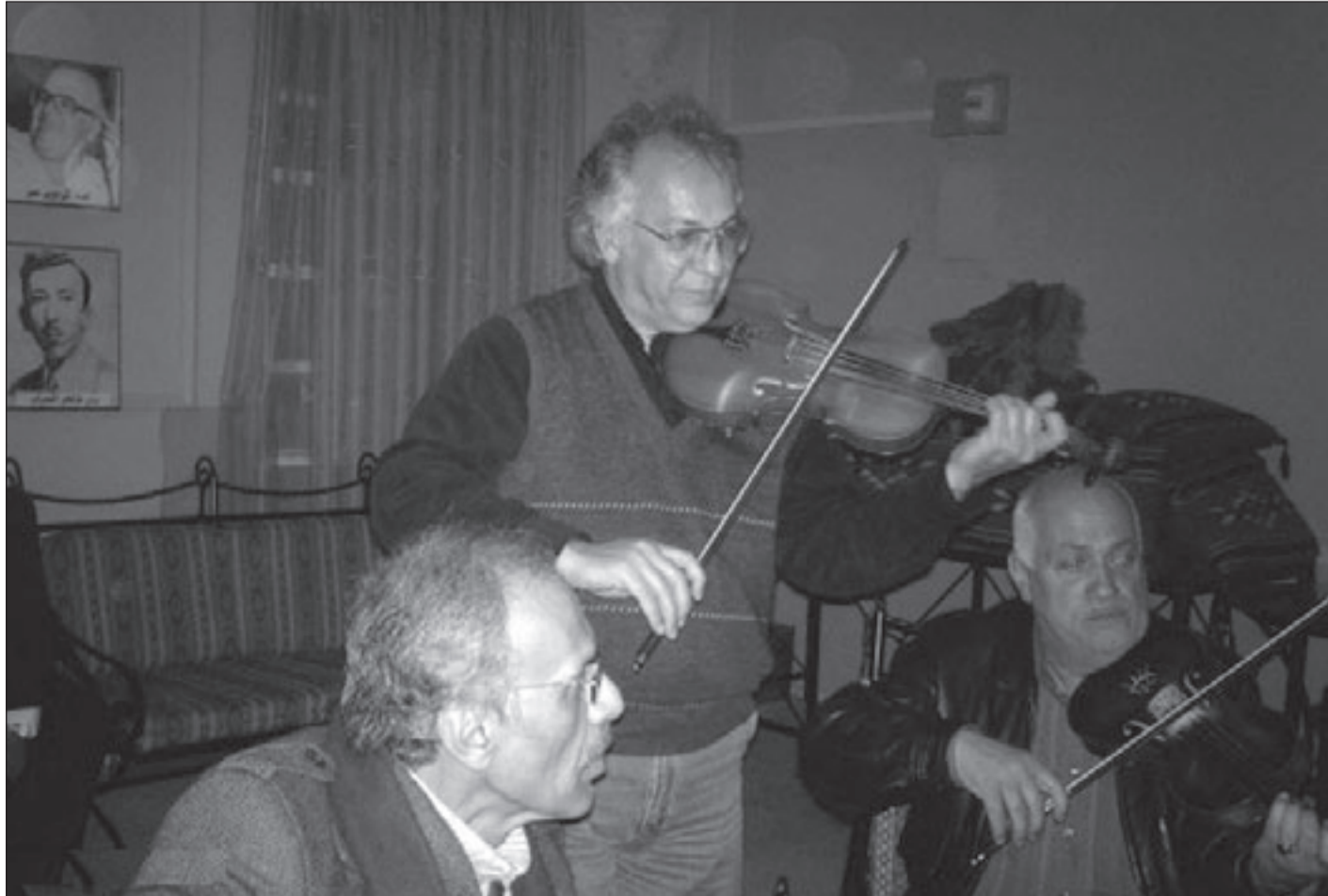
أحدى نشاطات «بيت الرواد»