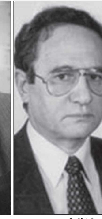
أسامة الغزالي حرب