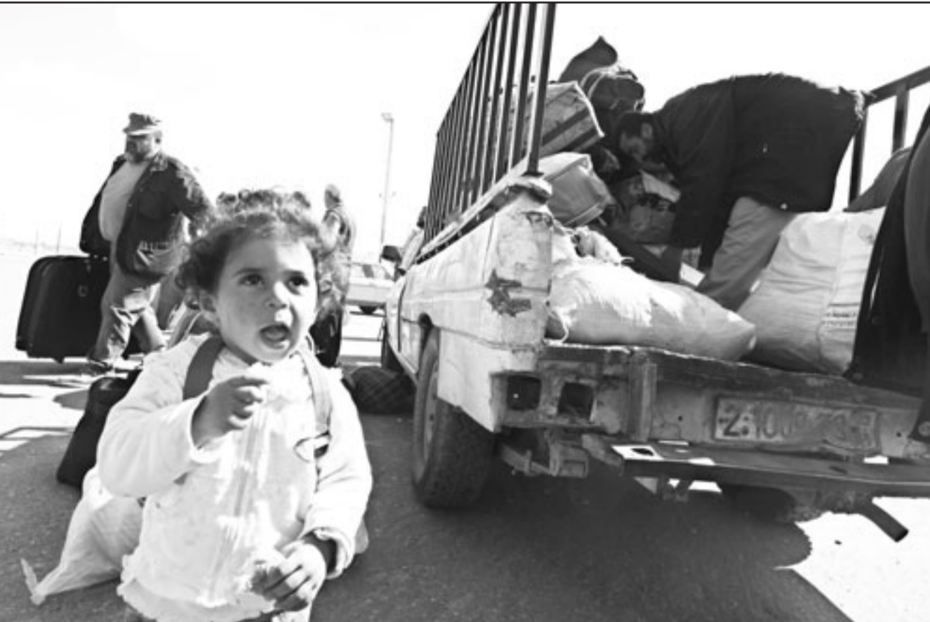
طفلة فلسطينية تصل مع عائلتها إلى غزة من خلال معبر رفح

وقال «امامنا ننتهاهو، لذلك يجب ترتيب البيت