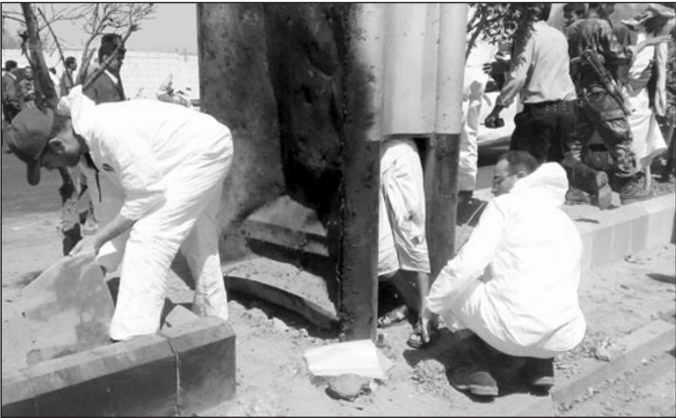
رجال شرطة يعمون خلال البحث الميداني عن ادلة في منطقة المطار امس حيث جرت عملية انتحارية ضد وفد كوري