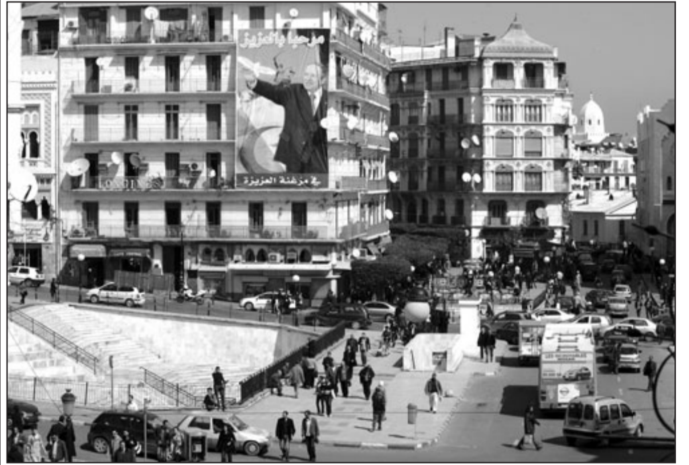
ساحة البريد المركزي بوسط الجزائر العاصمة ظهر أمس، عشية حملة انتخابات الرئاسة التي تبدأ اليوم الخميس وتستمر ثلاثة أسابيع

نظرا للإمكانات الضخمة التي يتوفر عليها مقارنة بخصومه، كما أن عدم دخول منافسين من الحجم الثقيل في هذه الانتخابات، يجعله في وضع أكثر ارتياحا من غيره.