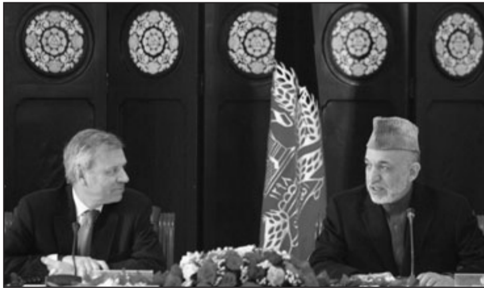
الرئيس الافغاني في مؤتمر صحفي مع السكرتير العام لحلف شمال الاطلسي ياب دي هوب شفر

المحافظ ليخ كاتشينسكي زيادة عدد القوات البولندية البالغ 1600 جندي في اطار القوة الدولية للمساعدة على ارساء الامن في افغانستان (ايساف) بحسب ما اشار وزير الدفاع بوغدان كليتش. وقدم رئيس مكتب الامن القومي في الرئاسة الكسندر شتشيغلو اقتراحا في هذا المعنى الى وزير الدفاع بوغدان كليتش بحسب ما اوضح لوكالة فرانس برس الناطق باسم الوزارة روبرت ورتشوفيتز. ويأتي هذا الاقتراح بدافع حماية جنود الوحدة البولندية وسط اوضاع غير مستقرة في افغانستان ولا سيما في ولاية غزني (شرق)، حيث مقر القوات البولندية. ورفض ورتشوفيتز التعليق على اقتراح الرئاسة تاركا هذه المهمة للحكومة. وكان كليتش اعلن خلال زيارة الى افغانستان بداية آذار (مارس) ان «القرار السياسي» حتى الساعة هو بالحفاظ على العديد الحالي. كما اعلن الوزير خلال الزيارة ان الجنود البولنديين المكلفين حتى الساعة اجراء دوريات في ولاية غزني، سيتولون تنفيذ «عمليات