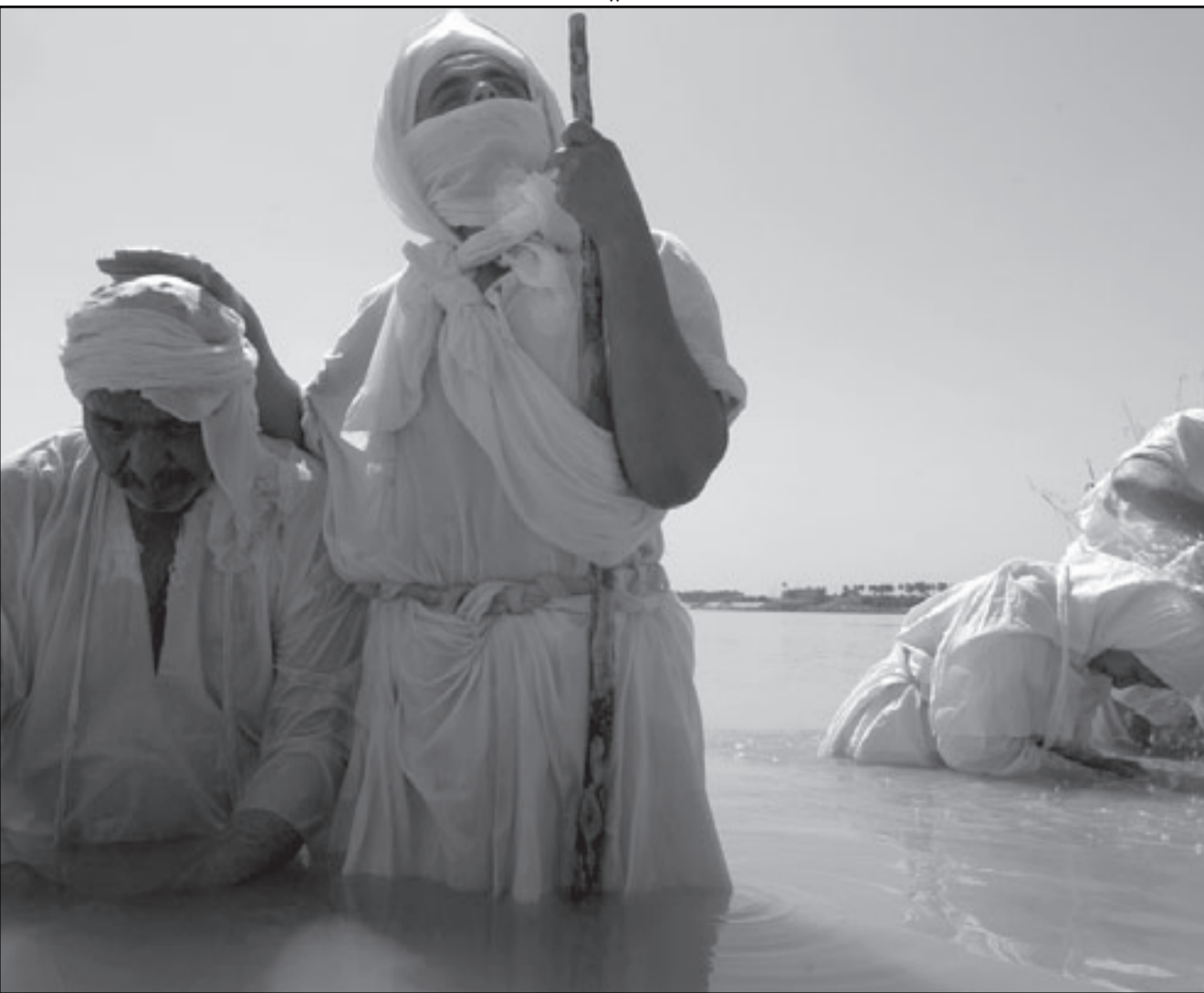
مندايون أثناء تادية شعارتهم الدينية في نهر دجلة في بغداد امس

وتابع منوها بأن «الجمعيين لم يمانعوا بانضمام البعثيين في قيادة قطر العراق لحزب البعث الى عملية المصالحة باعتبارهم كانوا لسنوات ضمن قوى المعارضة الناضحة لنظام صدام»، وقال «أحد أعضاء هذه القيادة قد زار بغداد بناء على دعوة من وزارة الدولة لشؤون الحوار الوطني وتم التباحث معه حول هذه