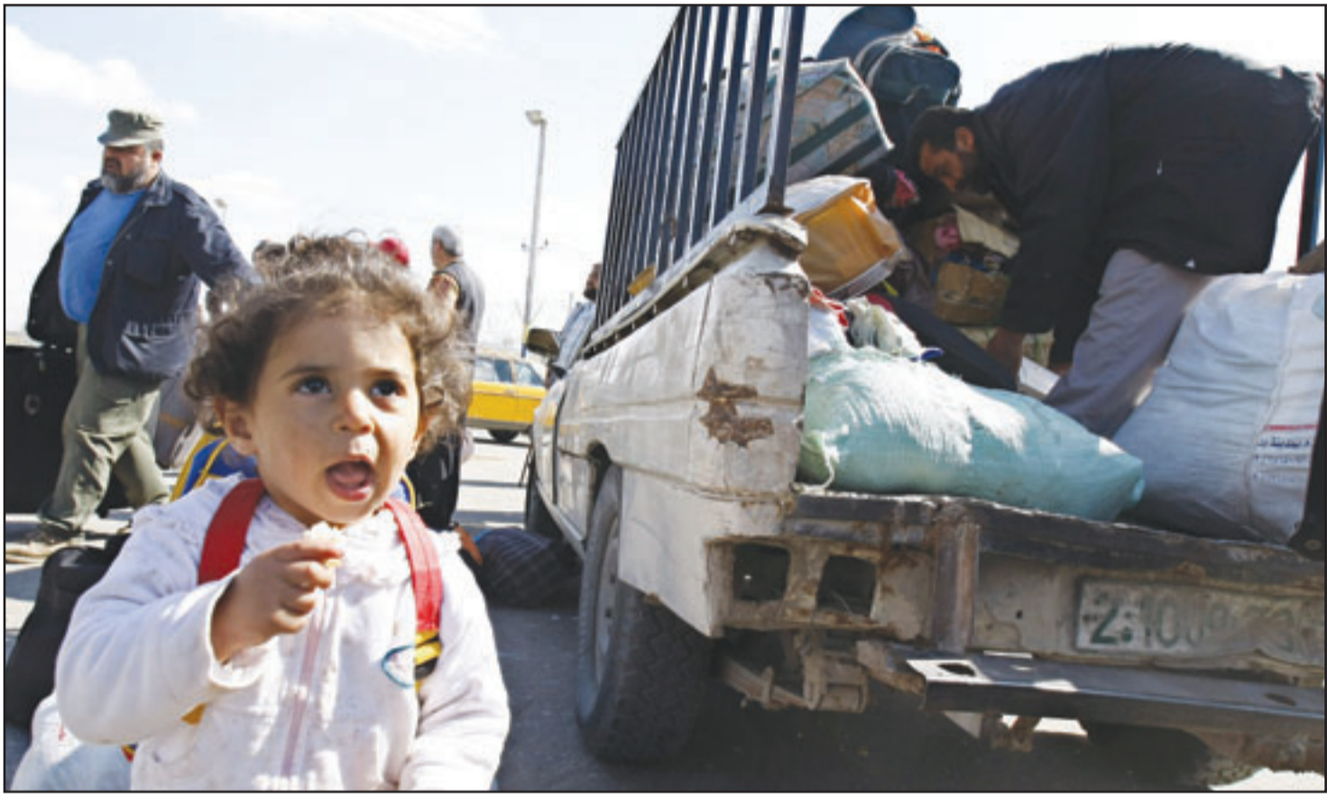
عائلات فلسطينية تستعد لتجاوز معبر رفح الحدودي الذي فتحته السلطات المصرية أمس لمدة يومين وسيسمح للفلسطينيين العالقين في الجانب المصري والمرضى الذين انتهى علاجهم في المستشفيات المصرية بالعودة إلى قطاع غزة

القاهرة - رويترز - حجزت محكمة جنايات القاهرة أمس الأربعاء قضية مقتل الغنية اللبنانية سوزان تميم المتهم فيها رجل أعمال مصري بارز للحكم. وقال القاضي محمدى قصوه رئيس المحكمة في ختام الجلسة أن الحكم سيصدر يوم 21 ايار (مايو) المقبل. وتقلت تميم (30 عاما) في مسكنها بدبي في أواخر تموز (يوليو) الماضي واتهم بالتحريض على قتلها رجل الأعمال والناشط السياسي المصري البارز هشام طلعت مصطفى (49 عاما).