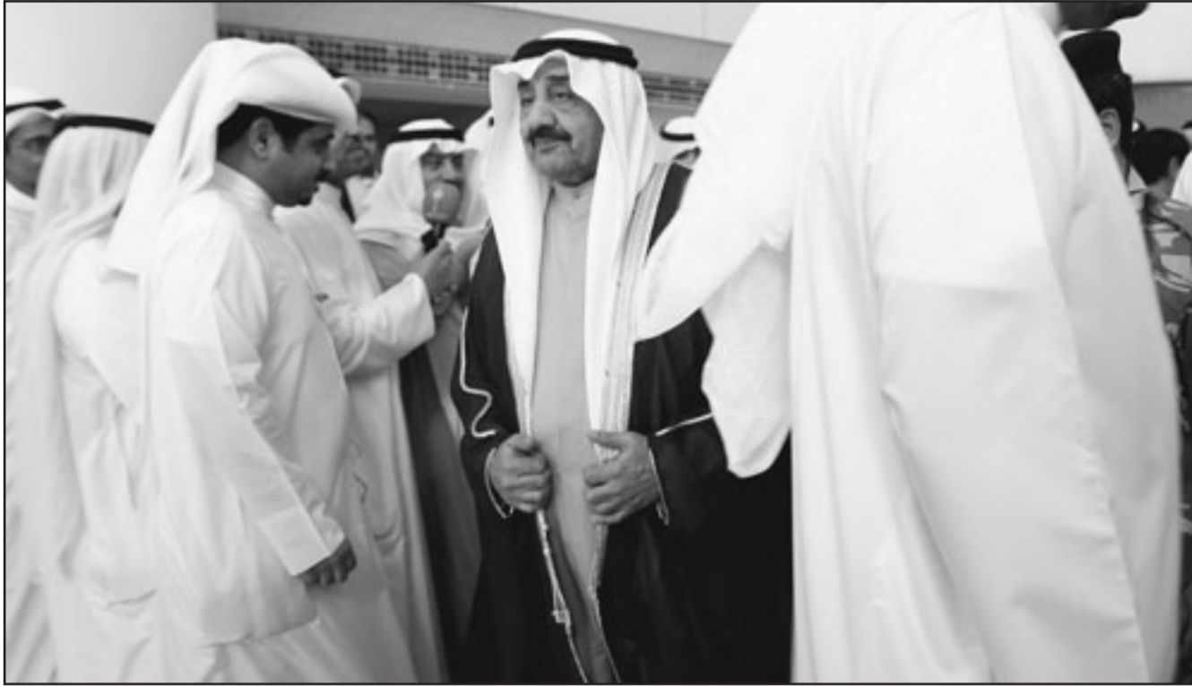
رئيس مجلس النواب الكويتي جاسم الخرافي مغادرا مبنى البرلمان امس

الحكومة السابقة في تشرين الثاني (نوفمبر) الماضي قبل أن يكلفه أمير البلاد مرة أخرى بتشكيل حكومة جديدة قدمت استقالته الثلاثاء،