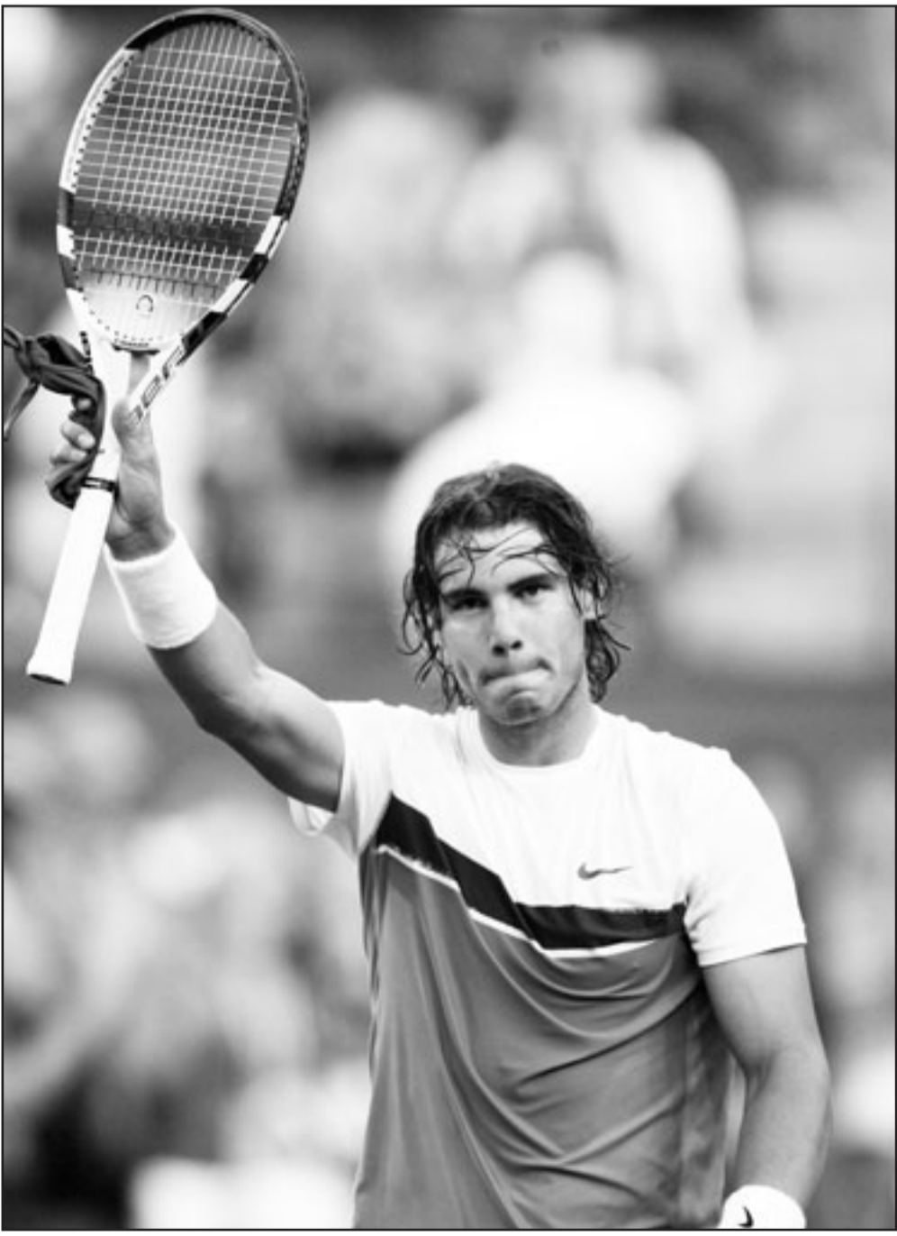
الاسباني رافائيل نادال

■ الدوحة - د ب أ: وصل إلى العاصمة القطرية الدوحة امس الاربعاء المدرب الروماني كوزمين اولاريو للتفاوض مع مسؤولي نادي السد حول تدريب الفريق الأول لكرة القدم خلفا للمدرب البوسني جمال الدين موسى فيتش الذي يتولى تدريب السد حاليا بشكل مؤقت حتى نهاية الموسم المحلي بعد اقالة البرازيلي إيمرسون لياو منذ فترة. ووصل كوزمين إلى الدوحة ظهر الأربعاء قادما من الرياض بعد اقالته مؤخرا من تدريب نادي الهلال السعودي.