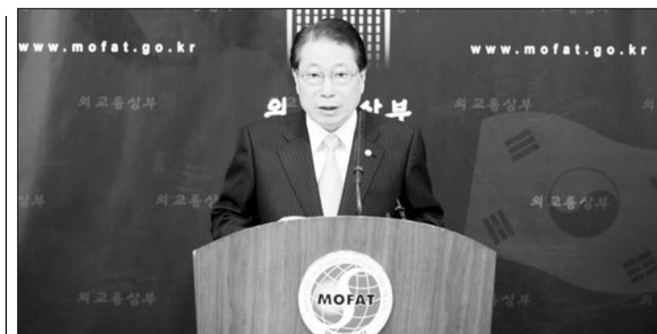
وزير الخارجية الكوري الجنوبي يو ميونغ هوان خلال المؤتمر الصحافي الجمعة

■ سول-يو بي أي: حذ وزير الخارجية الكوري الجنوبي يو ميونغ هوان الجمعة مواطنيه على تجنب السفر إلى الدول الأجنبية المعرضة لهجوم ارهابي، بسبب مخاوف متزايدة من أن يتحول الكوريون الجنوبيون لهدفاً لتنظيم «القاعدة». ونقلت وكالة «يونهاب» الكورية الجنوبية الجمعة عن يو قوله في مؤتمر صحافي إن الحكومة تبذل جهوداً لتقصي حقائق الهجمات الأخيرة التي تعرض لها كوريون جنوبيون بالتعاون الوثيق مع الحكومات اليمينية والامريكية والبريطانية ودول أخرى، مضيفاً أنه «يتعين على الكوريين الجنوبيين التقط والحذر من الإرهاب واتخاذ كل إجراءات السلامة الممكنة». وأوصت وزارة الخارجية الكورية الجنوبية الأربعاء الماضي بتشديد الإجراءات الأمنية وتعزيز نظام التحذيرات الأمنية على المسافرين الكوريين الجنوبيين ومرافقها الحكومية وجالية البلاد في الخارج. بعد استهداف مواطني لها في اليمن. وكان انتحاري فجر نفسه الأربعاء أمام موكب لفريق أمني بحثت به الخارجية الكورية الجنوبية للمشاركة في التحقيق بمقتل أربعة سياح كوريين الأحد الماضي، ولم تسجل إصابات. ويعد هذا الحادث الثاني من نوعه في أقل من أسبوع يقدم عليه تنظيم «القاعدة» الذي أعلن الثلاثاء مسؤوليته عن التفجير الانتحاري الذي أقدم عليه عنصر لم يتجاوز سن الـ18.