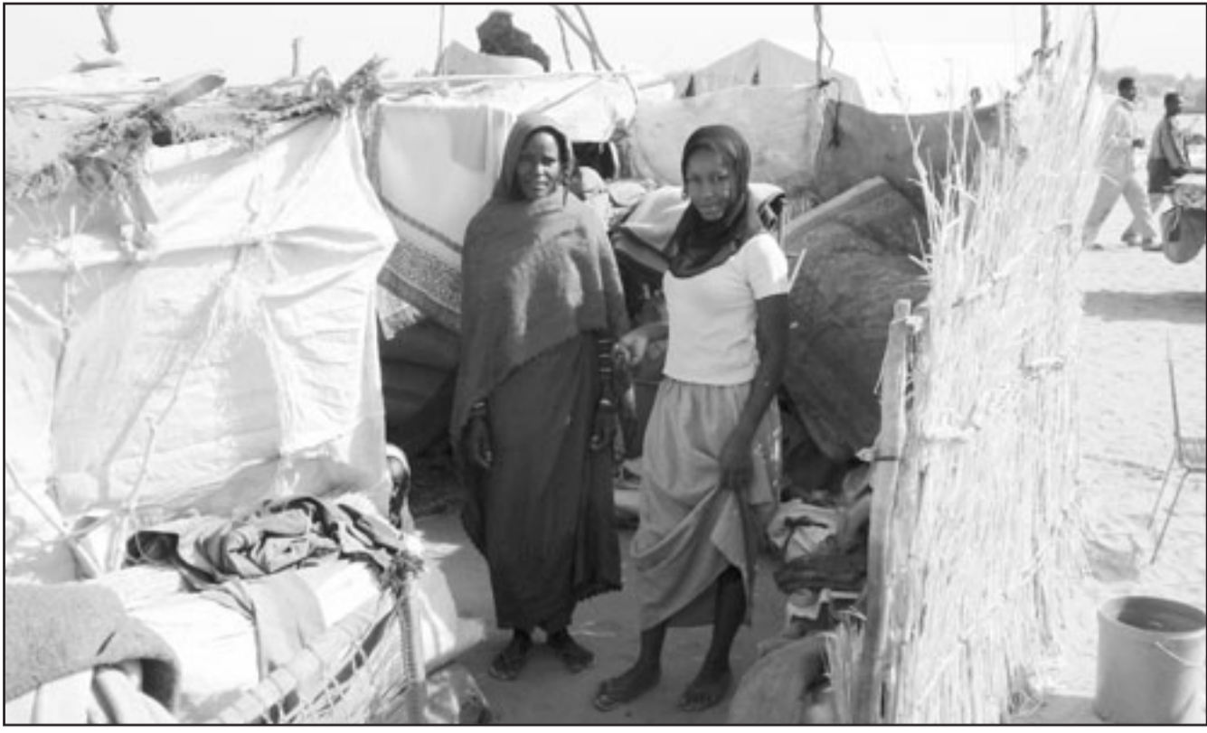
نساء من مخيم زمزم في الفاشر (شمال دارفور) حيث يعاني اللاجئون هناك اوضاعا معيشية صعبة للغاية