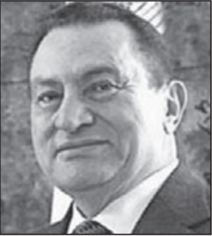
مبارك وعد أولرت بإعادة شليط

من ذلك كانت الاتصالات طوال يوم الاثنين حقيقية. طاقم حماس كان يجمع لمداوات داخلية بعد كل رسالة اسرائيلية اربع او خمس ساعات، يتوجب ان نتذكر ان محادثات الصالحة بين فتح وحماس كانت تجري في القاهرة في موازاة ذلك، خمس لجان تعكف على الصياغات، اعضاء طاقم حماس في دمشق موجودون هناك الى جانب الغزاوين والجميع يتحدث مع الجميع، موسى ابو مرزوق نائب مشعل موجود في القاهرة تري في غزة عشية المحادثات، هو لم يجلب من غزة بشرط مسجل مع غلعاد شليط خلافا لما نشر، وانا اشرفي