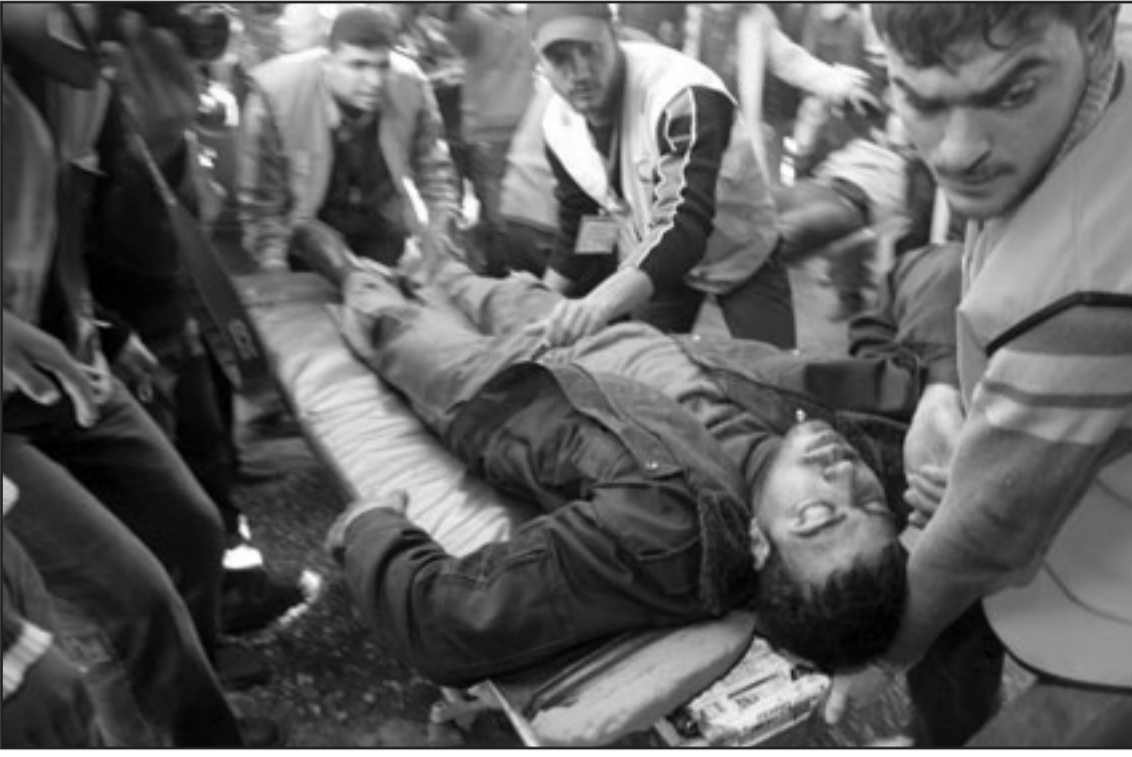
المحاكمية العسكرية: يتوجب علينا ان نخوض القتال حتى تطرد الغرباء

الاول الذي تموقنا فيه للحماية، بعد ذلك مكثنا فيه يومين الى ثلاثة ايام. في الصباح الاول من العملية كانت هناك عائلة. عندما دخلنا وجد احدهم كومة من كراسات تعود للجهاد الاسلامي، رأينا صور القسام على الجدران التي رسمها الصبي والجندي الذي كان يجانبني سعدا لىعلى «الم تكن هناك وامر يطلب تصريح لاطلاق النار؟»