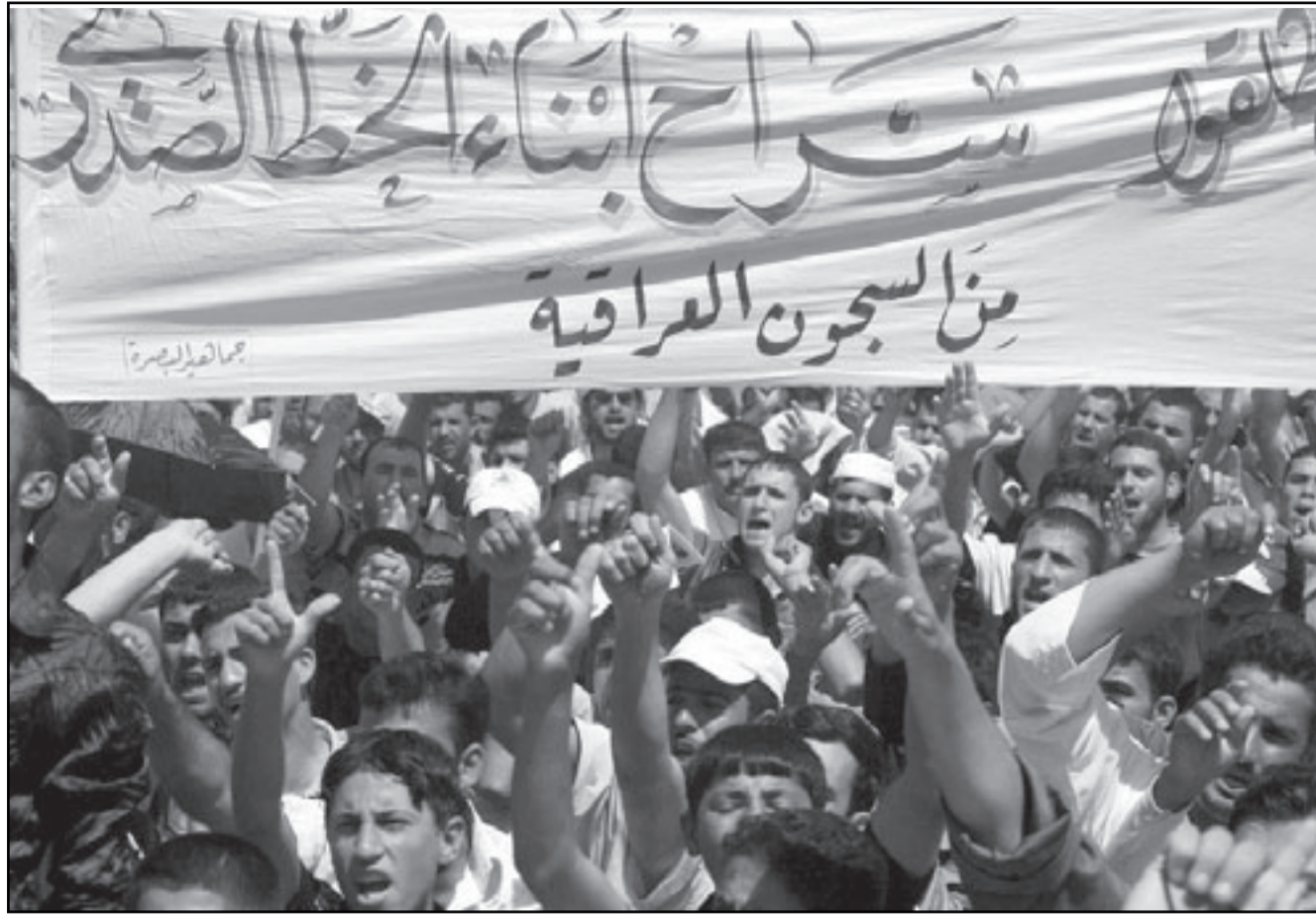
انصار التيار الصدري يتظاهرون مطالبين باطلاق المعتقلين الجمعة (أ ف ب)