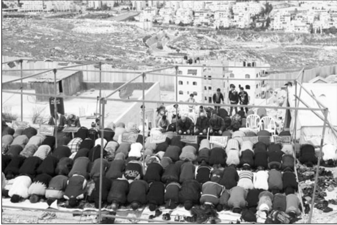
فلسطينيون يصلون في منطقة راس خميس في القدس حيث تهدد اسرائيل بدم خمسين منزلا في الحي

وكان وزراء الثقافة العرب اختاروا مدينة القدس لتكون عاصمة الثقافة العربية لعام 2009، وذلك عقب اختتام احتفالات التسوية بالبحرين بدمشق عاصمة الثقافة العربية للعام 2008. واطلق المؤتمر العالمي للسياسات