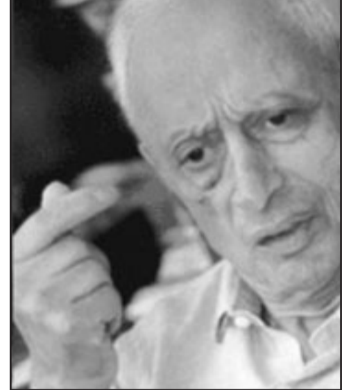
الراحل عبد اللطيف الفيلالي

غيب الموت صباح الجمعة بمستشفى «نطوان ببسيلير» بكلامار بضواحي باريس، الوزير الفيلالي، عن عمر يناهز 81 عاما. وتلقب الراحل الفيلالي بنسب العائلة الملكية المغربية العديدة من المناصب الوزارية الهامة باليمن الشعبية، قبل أن منذ الاستقلال.