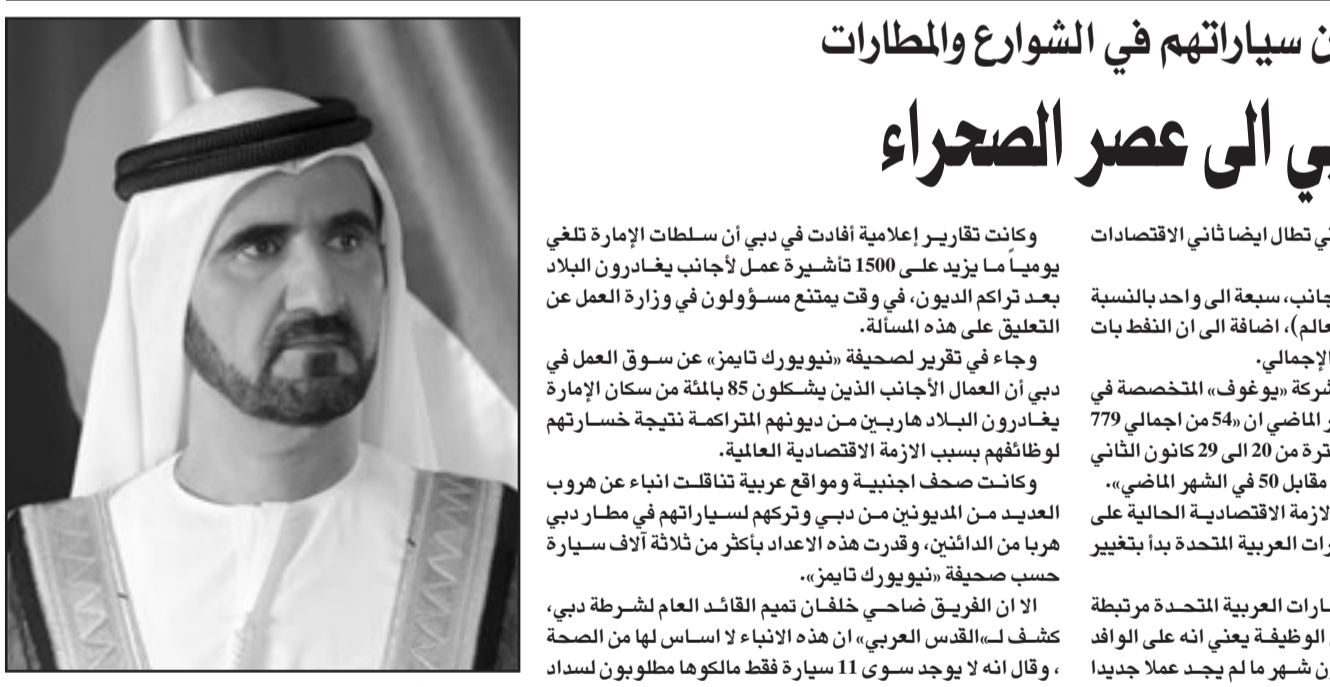
الشيخ محمد بن راشد آل مكتوم حاكم دبي

وطالب البيان السلطات البحرينية بـ«وقف استخدام الأسلحة النارية بجميع أنواعها والكف عن استخدام