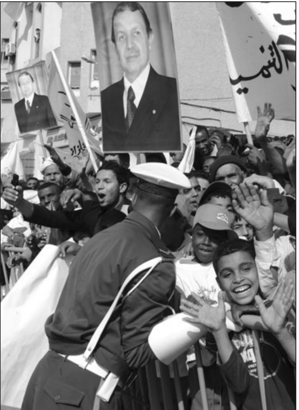
من حملة بوتفليقة ببشار (أقصى الجنوب الغربي) يوم الجمعة

مشيرا إلى أن توليه المسؤولية خلال السنوات الماضية «لم يكن تشريفا بقدر ما كان تكليفا» من أجل إنقاذ الجزائر من الممارس والجامعات التي فاق عددها ما أنجز من 1962 إلى غاية 1999، كما قال.