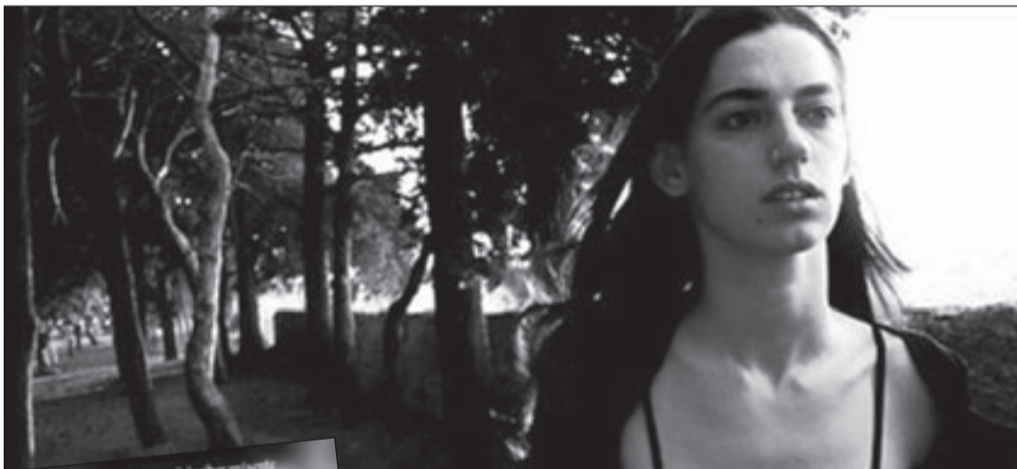
لقطة من فيلم لعنار البليك

رام الله - رويترز: ينظم مسرح وسيمناكات القصبه في رام الله «اسبوع السينما السورية» لأول مرة في الأراضي الفلسطينية ويعرض خلاله مجموعة من الافلام الروائية والوثائقية وعدد من القصير.