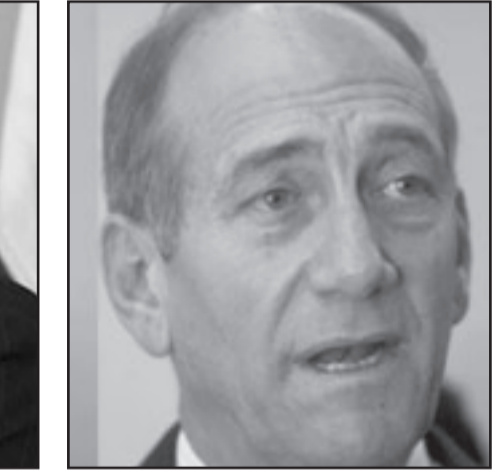
أولرت كان متزدا وخائفا

يتحدثون مع المصري بالانكليزية لأن اثنين من ثلاثة اعضاء في وفد ديكل لا يتحدثون العربية، ولكن ديكل وديسكن يتخلفان بعربية شاباكية طليقة وبين الحين والحين يتكلمون للعربية.