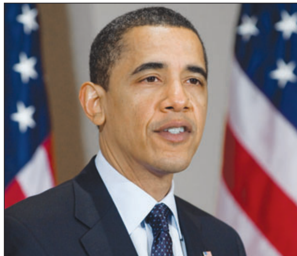
الرئيس الأمريكي باراك أوباما يتحدث في مؤتمر صحفي في واشنطن الجمعة