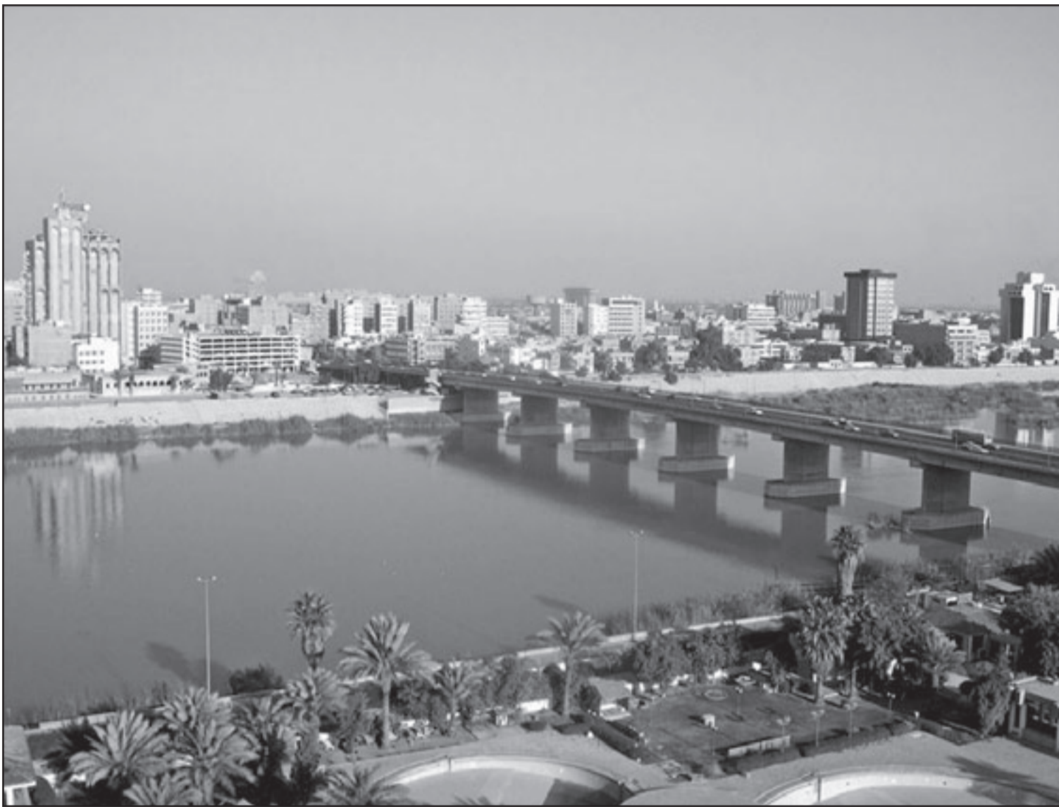
جانب من منظر عام لمدينة بغداد

ملا الشاعر خزائنه حوريات واقطعة أطفال. الأزهار الاصطناعية تورث الضجر وتجلب النحس. كان يعد يده ليحفظ زهرة لا مرئية راما مقبلة في الهواء من وراء النهر. يومها كان الشعر ممكنا والحب قريبا. الزهرة التي يملأ عطرها عينيه كانت أشواكها تربكتنا. ما ينسل منها الينا يفتح أبوابا تقود إلى أرض شتى. ذلك الخيط الذي ابتلت خطى الشاعر بمياه ينابيعه ينتقل مستقيما إلى أعصابنا. حماسة الشاعر تعدي. كيف يطيق الإقامة في جسد واحد؟ كنت أود أن أسأله عن بلد المحبوب لأراه وقد انتقل إلى حالته السائلة. طفولته التي تركض هناك. غزائه التي تنام تحت زيتونة. على أي الأبواب تركت أثر من يدك؟ النجمة التي حملك نورها على جناحيه من هناك انطفأت وما أنت ترى الليل وقد أصبح بلدا، فيما البلد لم يعد متناسبا. كانت أوتة العراق تناسبك وانت العاشق الثالث. كان في إمكانه أن يدلنا إلى الدروب التي تقود إلى بلد المحبوب، ولكن لم يكن في إمكانه أن يقودنا إلى تلك البلد. لأنه يعرف أن ما يتم أكثر عمدة من خسارة الوطن. خيرة شفاقه تقول ذلك. حينها فقط تفصح شجرة المنسيات عن خوائها لتنتدخ أن خالد علي مصطفى كان في ارتجاله الابهي لعني الحياة منقيا. هل كنا نحتاج إلى أن نمشي آلاف الكيلومترات لكي نعرف تلك الحقيقة؟ كانت تقول لي: الحديقة ليست بعيدة. وما من حديقة. غير أنها لم تكن تكذب. وأقول: البلد ليس بعيدا. وما من بلد. وأنا لا أكتب. تعريف الجغرافيا لا يقع على الأرض دائما. تطوي الأم بومتها صفحة الوطن بما لا يستطيع الجراد فعله حين يسد الطرق بحشود حراسه الخائفين. كان علينا أن نقتش عن ذلك البلد في أعماق أفواه الأمهات، تحت اللسان، في ما وراء الإستان، قريبا من