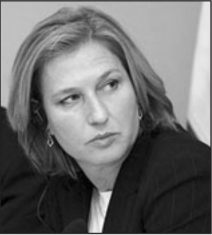
ليفني أقتعت الوزراء بالصمت في جلسة الحكومة

بالجبري، والاسرائيليون يقدرون انه ضغط عليه لبدء امرة وثيقة.