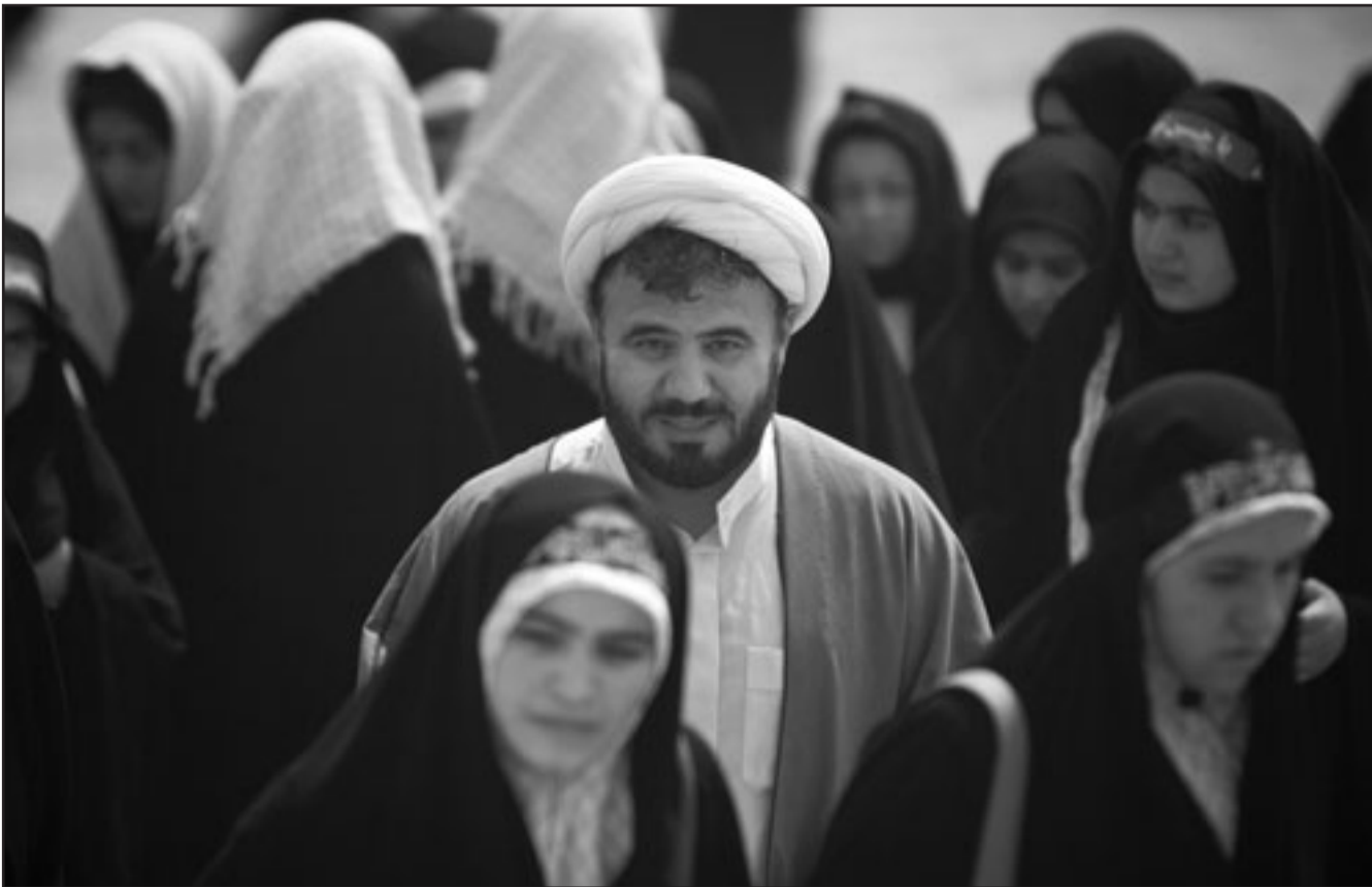
ايرانيون يقومون بزيارة قبور اقرباء لهم سقطوا في الحرب العراقية- الايرانية

الايروبي الرسمي الساعة الثانية بعد الظهر بالتوقيت المحلي رغم أن وكالات انباء ايرانية بينها وكالة انباء الجمهورية الاسلامية الايرانية الرسمية تطرقت اليه.. ومع ان اوباما لم يصل الى حد تقديم عرض محددة فانه قال انه يسعى إلى «مستقبل يتميز بعلاقات جديدة بين شعبينا وفرص أكبر للشراكة والتجارة».