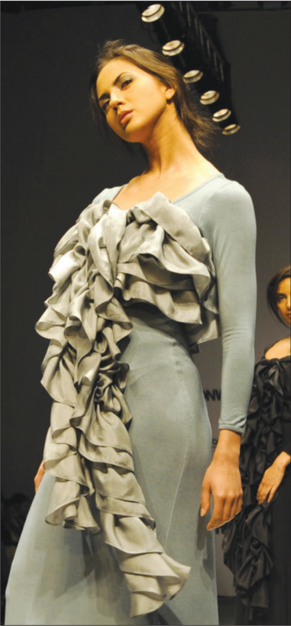
من مبتكراتا المصممة الهندية اليسا كارانو هذا الزي الذي عرض امس خلال اسبوع ازياء دلهي (ا ف ب)

وقال بير بيترسن احد واضعي الدراسة «يلعب محفز النخاع الشوكي دور صلة الوصل بين الدماغ وشبكة