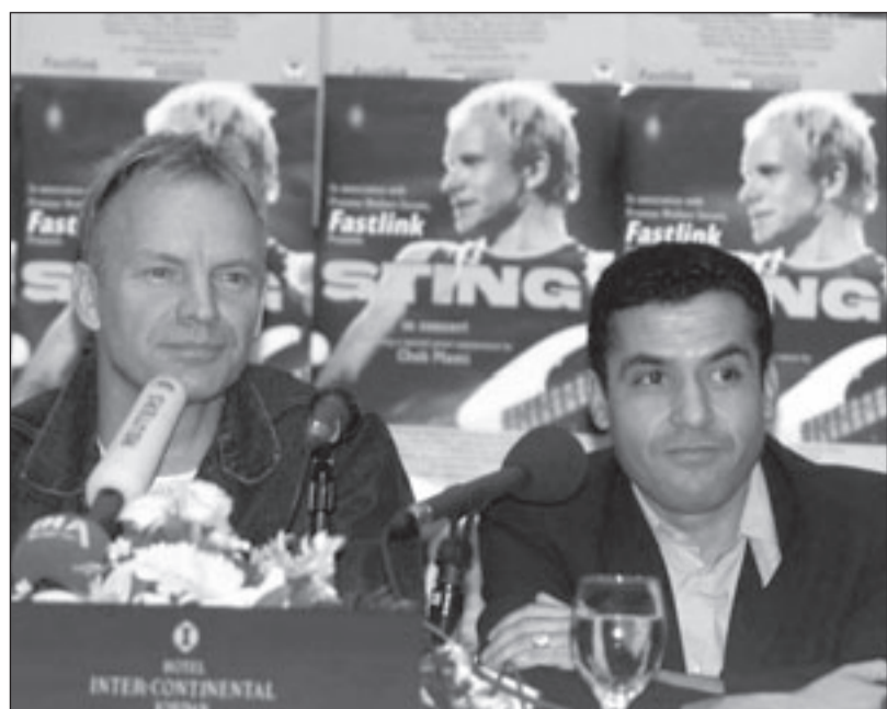
الشاب مامي مع المغني الانكليزي ستينغ

ولا يتكفي المؤلف بالحديث عن دمشق في ذروة الفتوح الإسلامية، أو في عهد الوليد بن عبد الملك فحسب، بل يمتد إلى الحديث عن الأمويين في الشام، والأمويين في الأندلس، وعن الخلفاء الأمويين، وأمهم الخلفاء الأمويين، كما يترجم لولادة بني أمية، ولقادة فتوحاتها، أمثال: (الحجاج بين يوسف الثقفي - قتيبة بن مسلم الباهلي - محمد بن القاسم الثقفي - مسلمة بن عبد الملك) طرفاً ذلك فصولاً للحديث عن القضاء في العصر