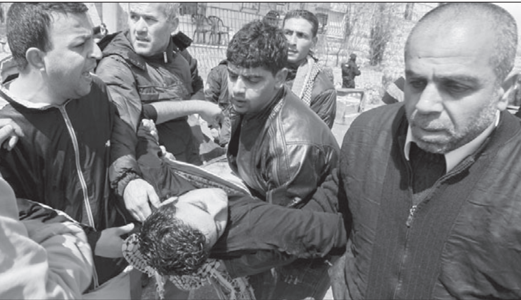
فلسطينيون في ام الفحم ينقلون جرحيا اصيب باشتباكات مع المستوطنين المتطرفين

في جر المجتمع الاسرائيلي والنظام السياسي اليه. وزعمت الشرطة أن نائب القائد العام للشرطة وثلاثة من افراد الشرطة اصيبت خلال المواجهات مع المواطنين الفلسطينيين.