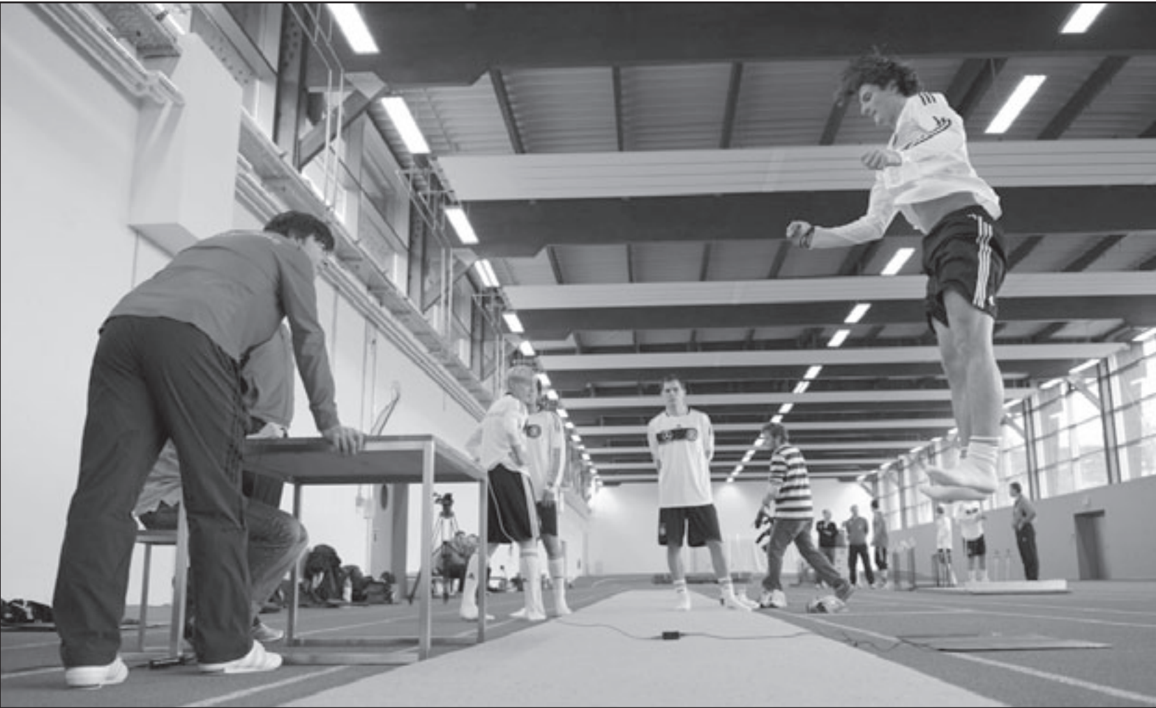
ماريو جوميز نجم منتخب ألمانيا (يمين) خلال تدريبات اللياقة تحت إشراف المدرب جوشيم ليو

وتابع «قلت لهم بأن ماكغديدي هو من أبرز عناصر منتخب جمهورية أيرلندا حالياً، ويملك هامشاً كبيراً للارتقاء بمستواه».