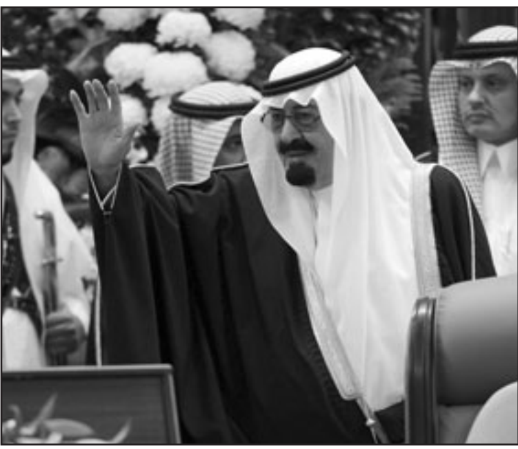
العاقل السعودي الملك عبد الله بن عبد العزيز خلال افتتاح جلسة مجلس الشورى في الرياض امس

الرياض - ا ف ب: أكد العاقل السعودي الملك عبد الله بن عبد العزيز استمرار المملكة في بذل الجهود من اجل تحقيق المصالحة العربية الكاملة، وذلك خلال افتتاحه الدورة الجديدة لمجلس الشورى امس الثلاثاء. وعلى الصعيد الاقتصادي، أكد الملك عبدالله ان المملكة تمكنت من تجنب الاسوأ من تداعيات الازمة المالية العالمية وهي تشارك ضمن مجموعة العشرين في التصدي للازمة على المستوى العالمي. وأشار الملك عبدالله الى «التحديات» التي يواجهها العرب قبيل القمة العربية التي ستعقد في 29 و30 آذار (مارس) في قطر ومنها «عدوان اسرئائلي عاث بالارض فسادا» وخلاف فلسطيني بين الأشقاء هو الاخطر على قضيتنا العادلة من عدوان اسرئيل يوازيه خلاف عربي واسلامي يسر العدو ويؤلم الصديق، وفوق هذا كله طموحات عالية واقليمية، لكل منها اهدافه الشبوهة». واضاف «سوف نستمر بانأث الله حتى يؤول كل خلاف (بين العرب) مدركين بان الانتصار لا يتحقق لامة تحارب نفسها وأن العالم لا يحترم الا القوي الصابر». وأشار الملك عبدالله الى ان المملكة «قامت بدورها في هذه الانتفاضة المباركة على الشقاق والهوان» في إشارة الى الخلافات العربية ودعوة العاقل السعودي شخصيا الى تخطيها في مبادرة قدمها امام قمة الكويت العربية الاقتصادية في كانون الثاني (يناير) الماضي.