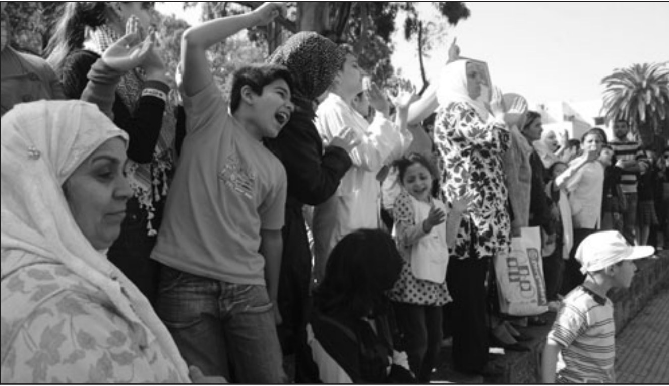
تلاميذ المدرسة العراقية بالرباط وأولياءهم تظاهروا الاثنين احتجاجا على قرار الحكومة اغلاقها