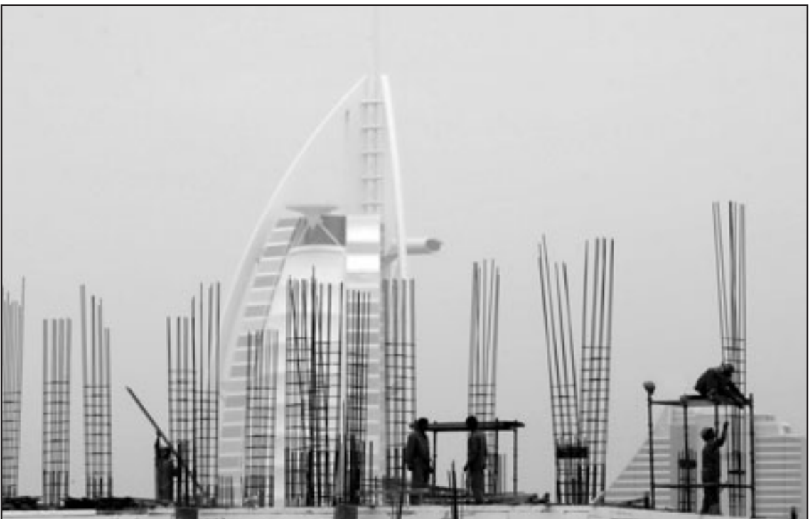
عمال اجانب في احد المواقع الانشائيةبديبي

حكومة دبي للاستغناء عن اي من موظفيها وفي جميع مؤسساتها». واضاف ان «حكومة دبي متمسكة بموظفيها». وذكر الشيخ الذي يدير مؤسسة دبي للاعلام التابعة لحكومة دبي والتي تضم عددا من القنوات التلفزيونية البارزة مثل قناة دبي وسما دبي و«دبي وان» وقنوات الرياضة والفروسية، ان هذه المؤسسة التي تضم مئات الاعلاميين والموظفين «لم ولن تستغني عن احد على الاطلاق». وتابع «يمتسك امنا تسألوا كل مديري المؤسسات التابعة لحكومة دبي لتتأكدوا ان احدا لم يتم الاستغناء عنه». ودعا الشيخ الى التفريق بين الشركات التابعة لحكومة دبي والشركات التي يملكها افراد او مسؤولون في الامارة او تلك الحكومة حصص فيها، مع العلم ان عددا من هذه الشركات قامت بتسريح عدد من موظفيها. يأتي ذلك فيما قدر نقابي أردني كسيف الضرير بتقليص الراتب إلى النصف كوسيلة للضغط على الموظفين لتقديم استقالاتهم أو الرضا بالوضع الجديد. أكد مسؤول في اماره دبي امس الثلاثاء ان حكومة الامارة لا تنوي الاستغناء عن اي من موظفي مؤسساتها بالرغم من الازمة المالية العالية. وقال احمد الشيخ العضو المنتدب لمؤسسة دبي للاعلام والرافق الاعلامي نائب رئيس الامارات رئيس الوزراء وحاكم دبي الشيخ محمد بن راشد آل مكتوم «لا نخطط لدى