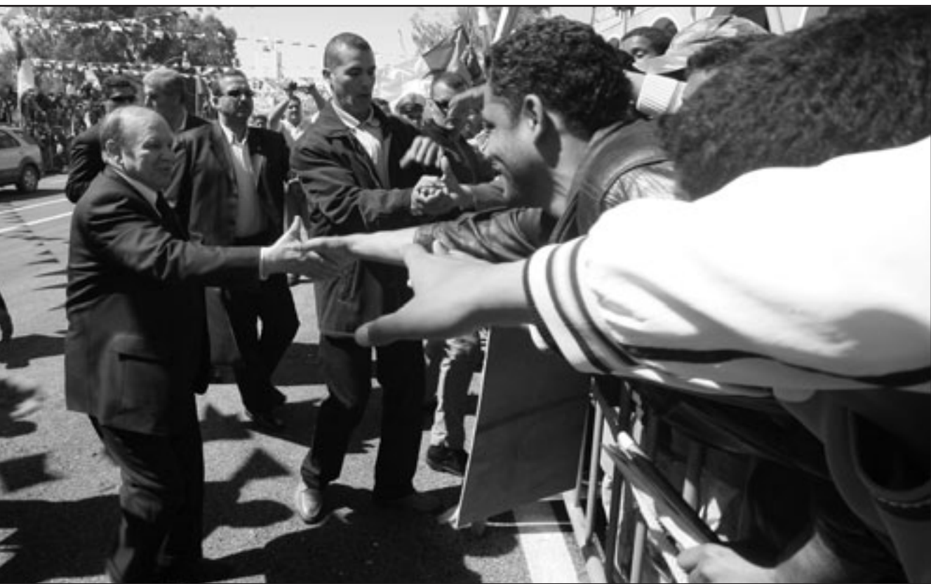
بوتفليقة في مدينة ورقلة (800 كلم جنوب العاصمة) امس في اطار حملته الانتخابية

من جامعة الدول العربية على الإسهام في تعزيز المسيرة الديمقراطية وانطلاقا من قرارات القمة العربية». وأشار في هذا الصدد إلى أن الجامعة العربية شاركت في مراقبة الانتخابات الرئاسية الجزائرية السابقة. من ناحية أخرى قال بن علي، «مستشارك الجامعة العربية أيضا في مراقبة الانتخابات الرئاسية في موريتانيا التي سنجري في شهر حزيران/يونيو المقبل وذلك حرصا من الجامعة العربية على مساهمة الموريتانيين على تجاوز هذه المرحلة والعمل على تعزيز التجربة الديمقراطية في موريتانيا».