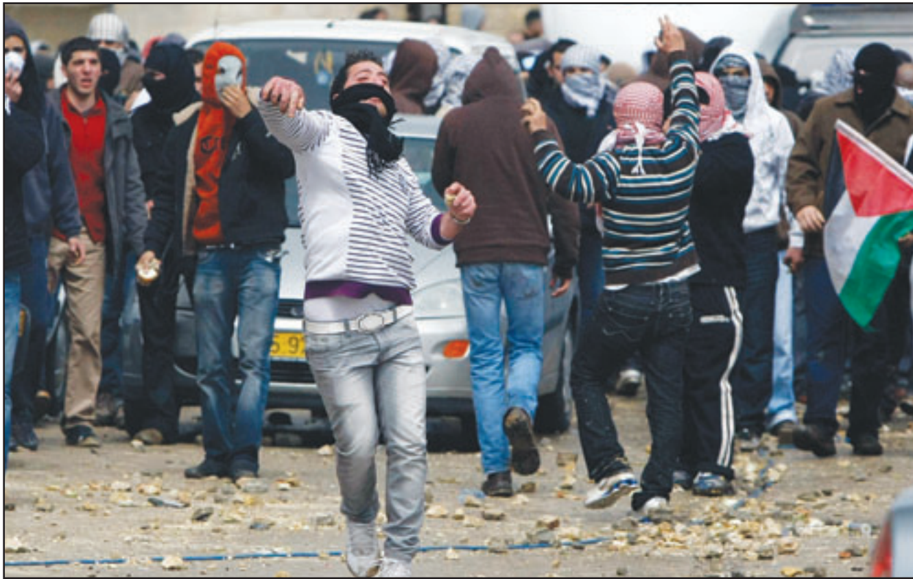
شبان مدينة ام الفحم يرشقون الشرطة الاسرائيلية بالحجارة امس