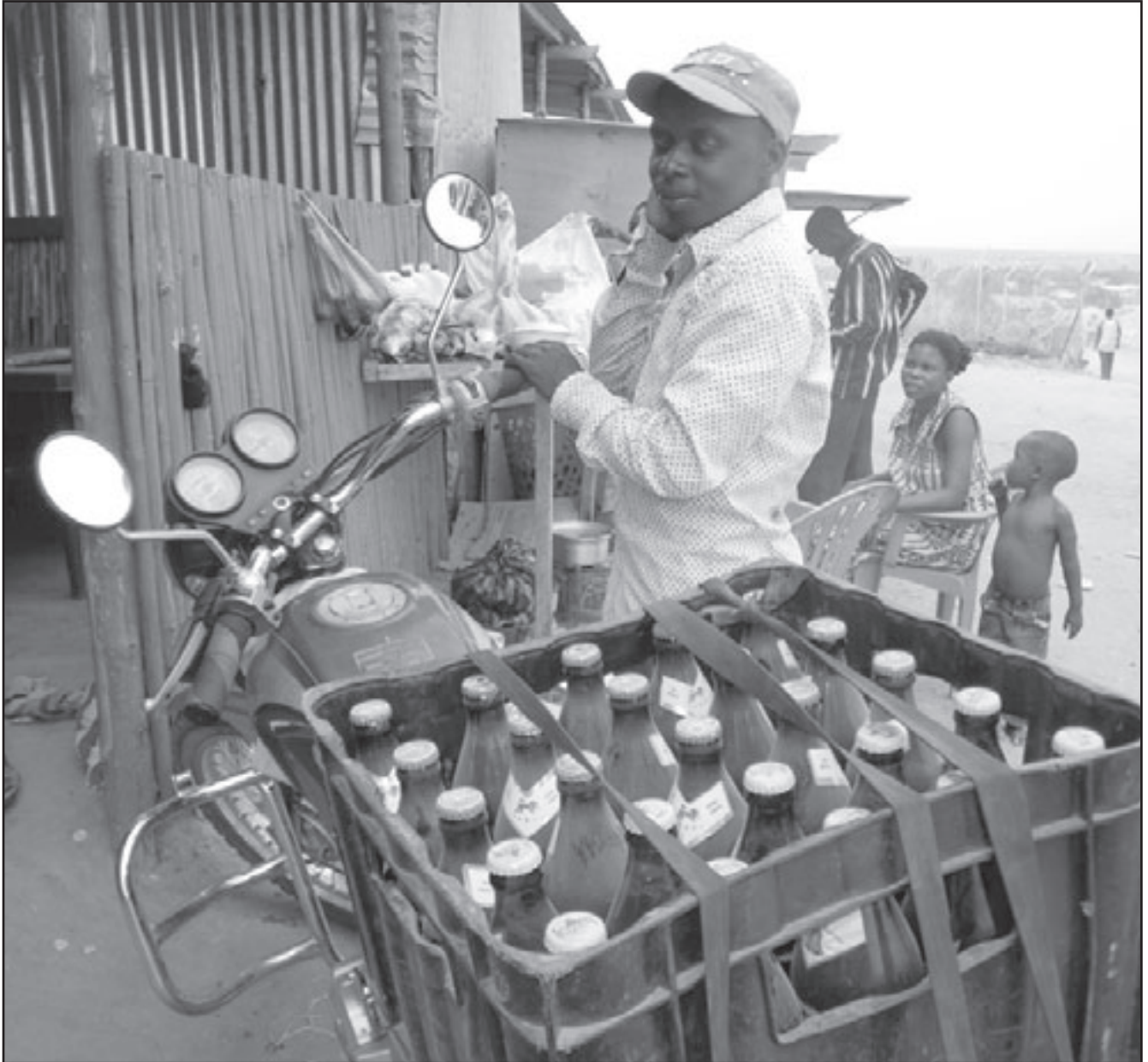
احد العمال يستعد لتوصيل صندوق من زجاجات الجعة الى السوق

الوارد - وخصوصا مياه الشرب - في مخيم زرمع مع وصول 360 ألف شخص على مدى الشهرين الماضيين فرارا من القتال بين الجماعات المسلحة وقوات الحكومة السودانية في دارفور. وقالت وزارة الخارجية ان الامم المتحدة والمنظمات غير الحكومية الباقية في السودان تدرسان سبل تقديم المساعدة لسد الفراغ الناتج عن رحيل وكالات المعونات وأنه يتعين على السودان ان يساعد ايضا. وأضافت الوزارة قائلة في بيان «نحث حكومة السودان - بالتعاون الوثيق مع الامم المتحدة والمنظمات غير الحكومية - على التحرك بسرعة لمعالجة مشاكل المياه والارض وغيرها من المشاكل المتخلفة». وامرت الخرطوم منظمات المعونات بمغادرة السودان بعد ان اصدرت المحكمة الجنائية الدولية في لاهاي امر اعتقال بحق البشير عن فطائع اريكيت في دارفور. واتهمت الحكومة السودانية منظمات المعونات بمساعدة المحكمة الجنائية الدولية. وقالت الولايات المتحدة التي لا تنتمي الى المحكمة