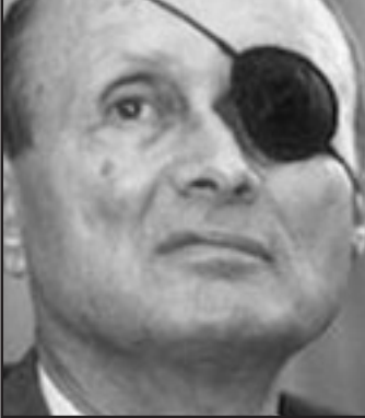
دايان تبني مبدأ الرؤية لمسافات بعيدة