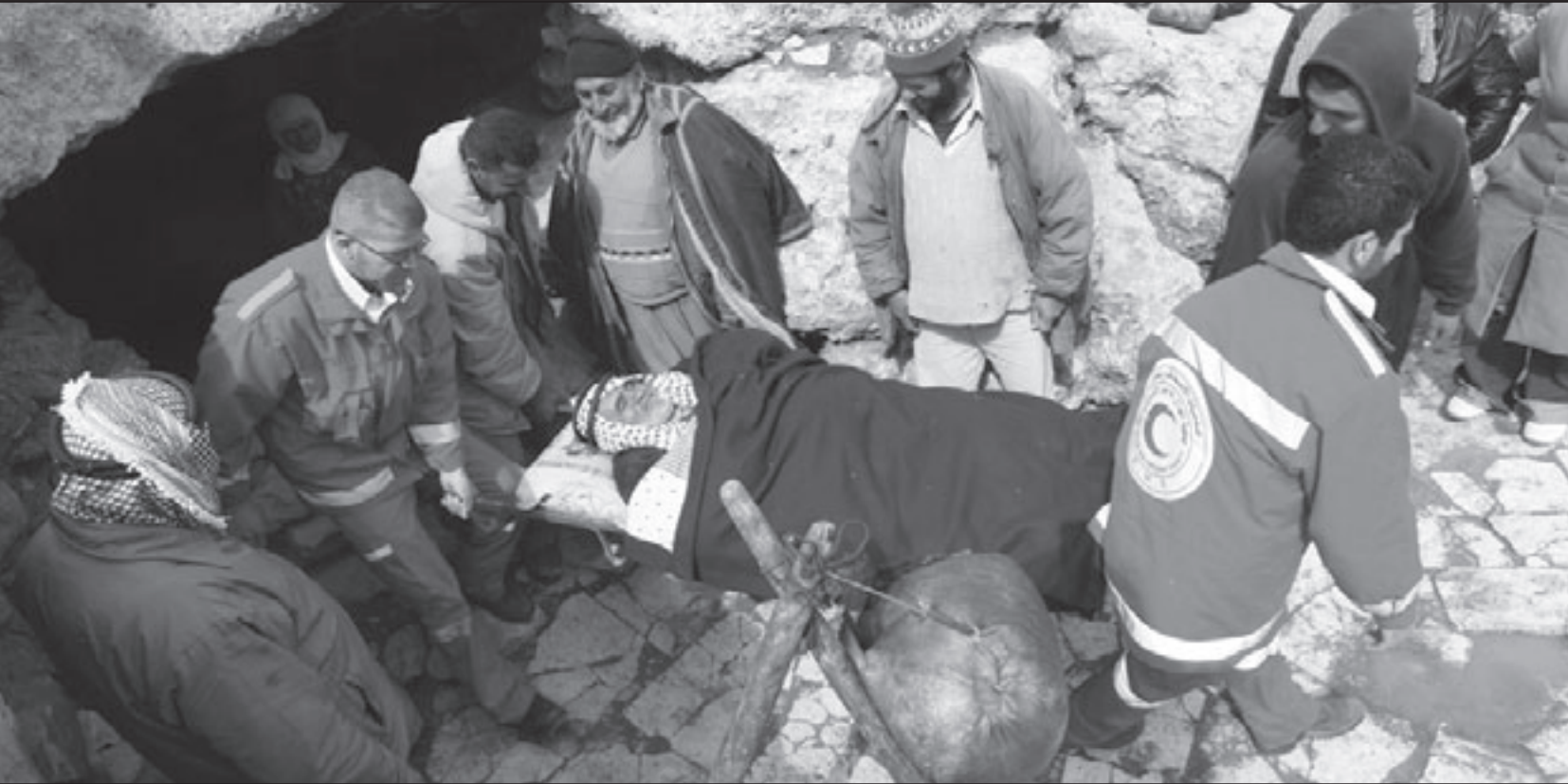
تدريبات لجمعية الهلال الاحمر الفلسطيني حول تقديم المساعدات الاولية في قرية قرب الخليل

تطبيق ميثاق الشرف الذي توافق عليه القوى الفلسطينية المتحاربة، لهيئة الاجراء الايجابية لانجاح الحوار. وأشار الى ان هيئات الجبهة «على وشك الانتهاء من تدارس نتائج الحوار وتحديد الخطوات المستقبلية الزمعة اتباعها وشدد على ضرورة ان يكون الحوار يخدم القضية ويمسك بالثوابت وشك الانتهاء من تدارس نتائج الحوار وتحدد الخطوات المستقبلية الزمعة اتباعها، مؤكداً على ضرورة ان تجري الانتخابات التشريعية القادمة كما انتخابات المجلس الوطني على اساس التعديل التسيبي الكمال بنسبة حسم لا تزيد عن 1.5 بالمئة».