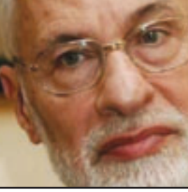
علي صدر الدين الدبائوني

■ لندن - يوبي اي: اعتبر الإخوان المسلمون في سورية التصريح الذي صدر عن وزير خارجية بلدهم وليد المعلم حول قرار الجماعة تعليق أنشطتها المعارضة، بأنه لا يمثل رداً رسمياً على مبادرتنا، وذكرنا الأخير بأن الجماعة كانت دائماً متفقة مع سورية الدولة ومناصرة لمعالمها، وأكدوا بأنهم سيحسمون عضويتهم في جبهة الخلاص المعارضة خلال أسابيع. وقال زهير سالم الناطق الرسمي باسم جماعة الإخوان المسلمين المعارضة المحظورة في سورية «نعتقد أن التعامل الموضوعي مع مبادرتنا لا يمكن أن يتم عبر وسائل الإعلام.. ونحن دائماً، لعلم الوزير المعلم، وفي كل سياساتنا ومواقفنا نميز بين سورية (الدولة) وسورية (النظام) وكنا دائماً متفكرين مع سورية الدولة منحاينز لها ولقضاياها ومناصرين لمعالمها». وكان الوزير المعلم قال خلال مقابلة تلفزيونية السبت الماضي وفي أول رد رسمي للحكومة السورية على قرار جماعة الإخوان المسلمين تعليق