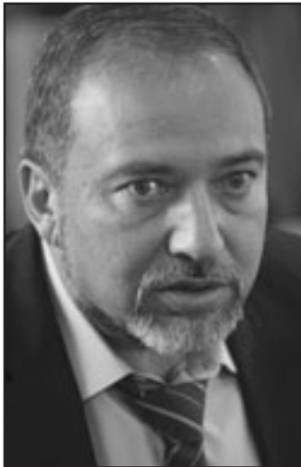
كلمة ليرمان هي التي ستقرر الامور