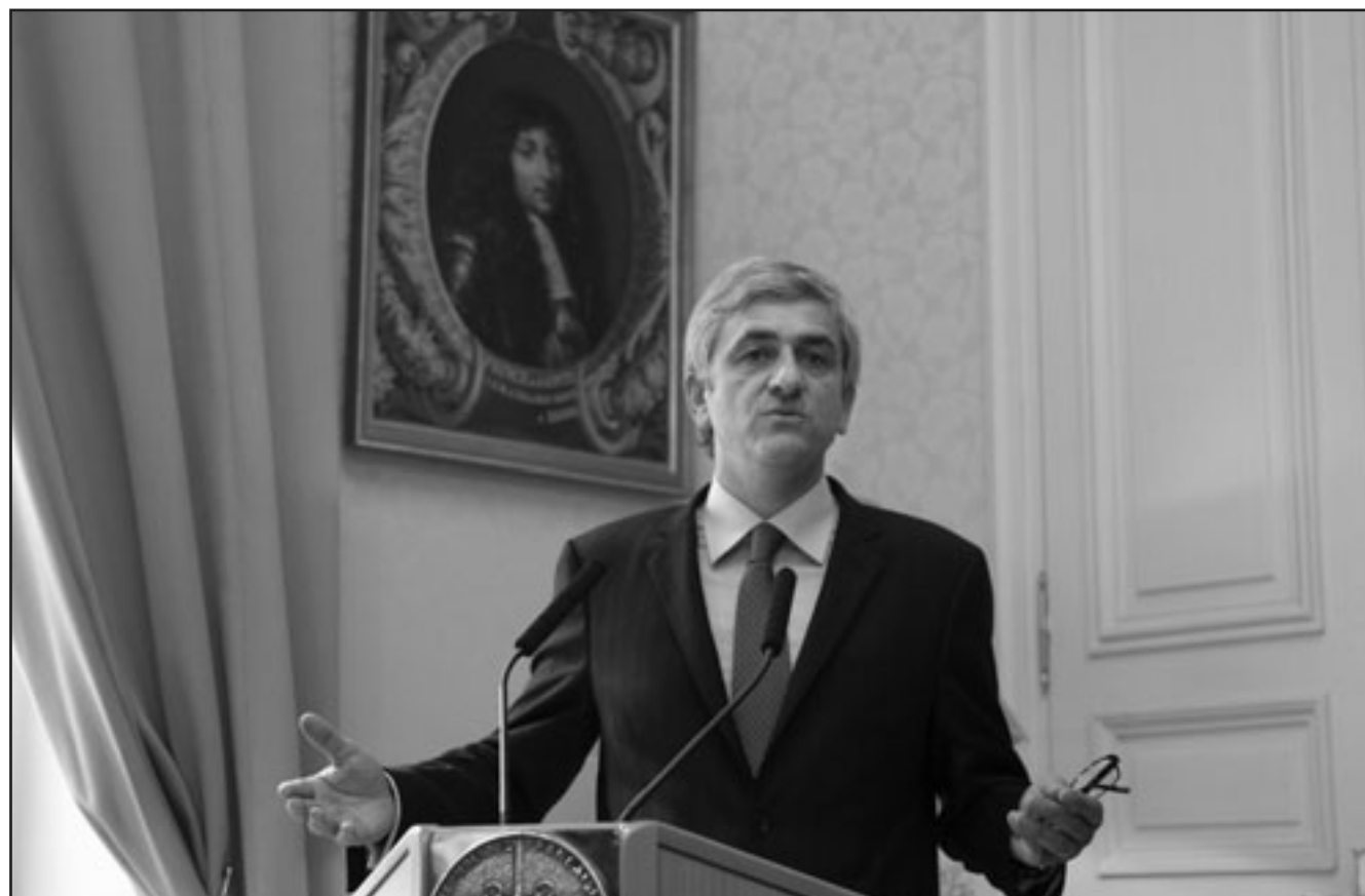
وزير الدفاع الفرنسي إيرفي موران في مؤتمر صحفي بباريس امس

جدير بالذكر أن فرنسا فجرت أول قنبلة ذرية في الصحراء الجزائرية في عام 1960 واستمرت تلك التجارب بعد استقلال الجزائر وإلى غاية عام 1966، وقد قامت فرنسا طوال تلك السنوات بـ17 تجريبا نوويا، وتشير المعلومات المتداولة إلى أن فرنسا استعملت 42 ألف جزائري ككفنان تجارب في تلك التفجيرات.