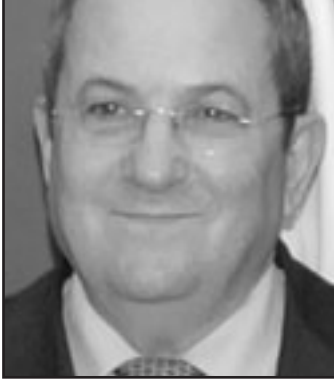
باراك يقارن نفسه بموشيه دايان

يوافق حزب العمل على ذلك فسخرج منه ويعين وزيراً للدفاع لدى بيبي. فقط بعد ان ترك المجال للاشاعة، صرح بان «استقالته من حزب العمل ليست مطروحة على الملح الآن»، ماذا تعني كلمة «الآن»؟ الآن لا، ولكن بعد حين نعم. هل هذا ما يقصد؟ باراك يقارن نفسه بموشيه دايان الذي انضم لحكومة بيغن. ولكن الفرق يكمن في ان دايان لم يكن حينئذ في حزب العمل وشعر بالترام شخصي بالتكفير عن اخفاقاته في حرب يوم الغفران، من خلال التصل الى اتفاق السلام مع مصر. رغم انه امتلك عينا واحدة الا انه كان القادة الوجوديين الذين تبنوا مبدأ الرؤية لمسافات بعيدة. ان انضم باراك للحكومة كوزير دفاع، مع شق حزب العمل، فانه سيحتول لوزير مهني، او لسؤول بارز تابع لبيبي، هذا