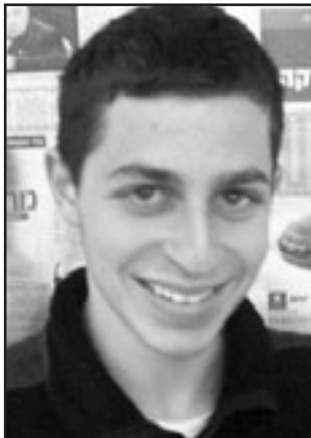
الحرب على غزة لم تحرر شليط

■ الادعاءات القائلة بأن جزءاً من وحدات الجيش الاسرائيلي التي شاركت في عملية «الرصاص المصهور» قد خربت الشيفرة الاخلاقية التي يؤمن بها الجيش الاسرائيلي بحاجة للخضوع للتحقيق طبعاً. ولكن أن الأوان لأن نسلان انفسنا من الذي تم انجازها فعلاً في هذه العملية، وان كان هناك تناسب منطقي بين الانجازات وبين الثمن. في البداية شعر الجمهور الاسرائيلي بالارتياح للبدء في عملية الجيش الاسرائيلي هذا الجيش الذي كان مدرباً ومزوداً بالعتاد بصورة جيدة خلافاً لوضع في حرب لبنان الثانية وفي ظل تبيد النبوءات السوداوية المتكررة التي توقع سقوط المئات من الجنود في العملية البرية في غزة. كان هذا دليلاً آخر على ان الجيش الاسرائيلي قد اعد جيداً للعلة. ولكن ما الذي تخضعت عنه هذه العملية؟ هي لم تضع حداً لاطلاق صواريخ القسام ولم تؤد إلى اطلاق سراح غلعاد شليط في المقابل دفعت اسرائيل ثمنها باهظاً عندما انارت ضدها الراي العام في العالم بسبب الدمار الكبير الذي خلفته في قطاع غزة والاضافة السكانية المدنية هناك. هذه الامور سلاحتها لزمين طويل وستصعب عليها بالتأكيد الرد على استفزازات حماس القادمة. بالقارنة مع الثمن الانجازات تبدو معذومة. العملية توقفت رغم ان الصواريخ ظلت تنسقط على الجنوب، بسبب الذرية الواهية بأنه لم يعد