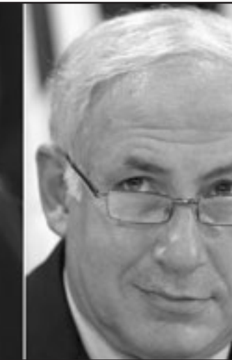
نتتياهو مستعد لدفع الميز لباراك

ليس له حق وجود، حزب غير قادر على ان يعيش خارج الائتلاف، حزب يشكّل منذ سنتين ورقة تين لسياسة تتناقض ومباينة المعلنه، حزب غير مستعد لان يتعاضد بجديّة مع رسائل عدم الراحة التي يبثها المخترعون، حزب غير قادر على ان يجيب بصدق على سؤال ما الذي ساهم فيه حقاً لتواجده في الحكومة للمجتمع في اسرائيل، هو حزب جدير بايود باراك وايود باراك جدير به. خلافاً لمزاعم جوقة المتضمين، لا يدور الحديث عن صالح حزب العمل حيال صالح الدولة، مع كل الاحترام للعمل فان الريح والفرح سيأتيان لاسرائيل من مكان آخر ايضاً. الصراع هو لمنع الهامة لكل ما هو جدير ونبييل في السياسة الديمقراطية الحقيقية، السؤولية، الاستقامة، الديمقراطية، وليس عقوبة الدفاع، هي الضمانة الافضل لوجودنا، اكثر مما ينبغي من المرات لقمّ نعم، قولوا لا اخيراً.