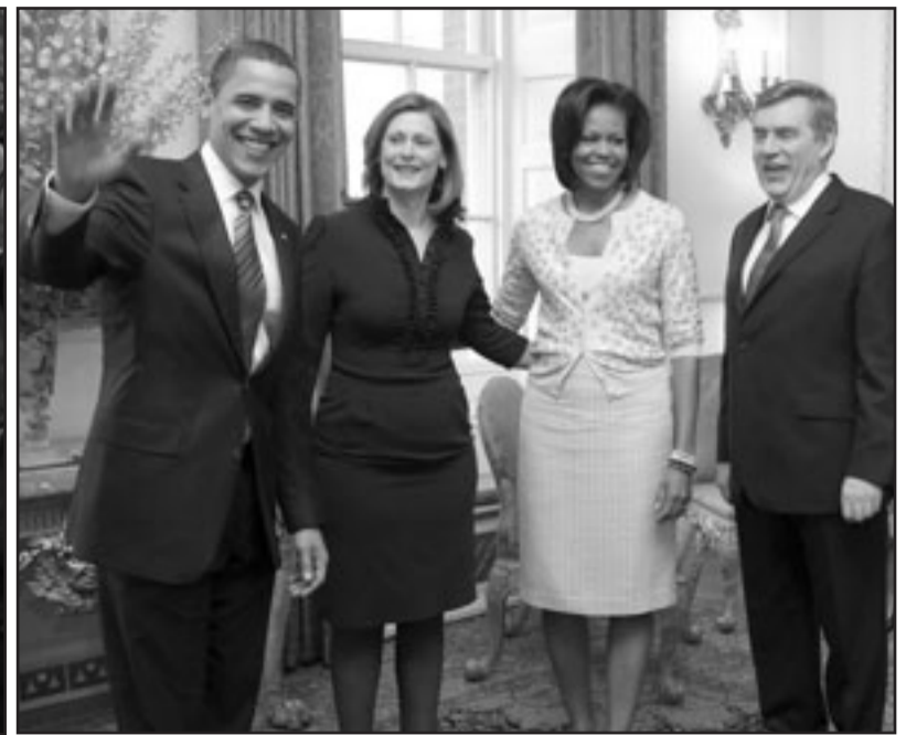
رئيس الوزراء البريطاني غوردون براون والرئيس الأمريكي باراك أوباما ورفيقتاهما في داوونج ستريت امس