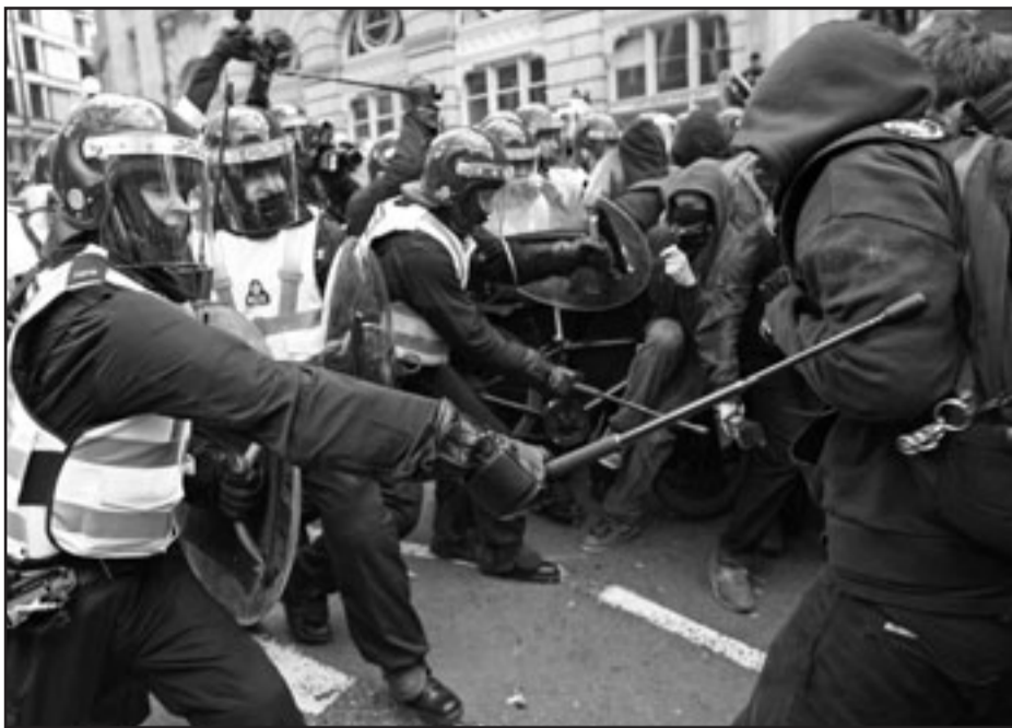
صورة من مظاهرات الاحتجاج على قمة العشرين في لندن