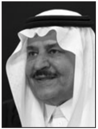
الامير نايف بن عبد العزيز

وفي حين جاء التهديد النادر من خطاب واحد يقول دبلوماسيون إن السلطات شعرت بالقلق بسبب عدم إدانة شخصيات بارزة من شيعة السعودية له خاصة وأن هذا جاء بعد بضعة أيام من إفراج الملك عبدالله عن النقيب الذين اعتقلوا في المدينة. وأضاف الدبلوماسي الاسيوي «كان هذا مثل صفة مزدوجة على الوجه أثبتت صحة وجهة نظري من يدافعون عن اتباع نهج لا ينطوي على حل وسط للمشكلة والأمير نايف سعودي محافظ حتى الآن اذا تولى العرش».