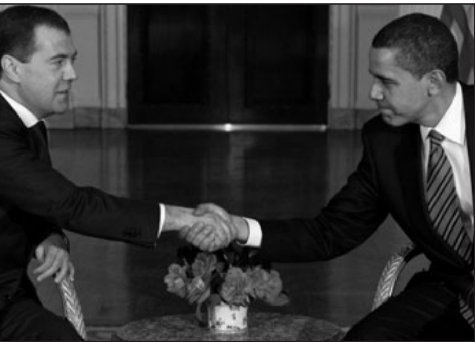
الرئيس الأمريكي باراك أوباما يصافح نظيره الروسي ديميتري ميدفيديف