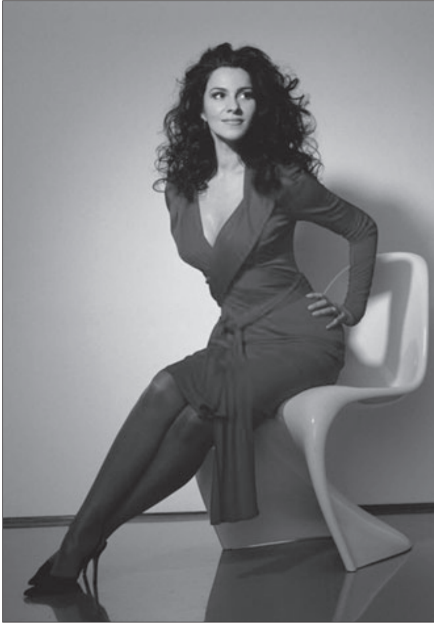
انجيلا جيورجيو (القدس العربي)

التذكار التي تبعتها مجموعة أبوظبي للثقافة والفنون إلى الهلال الأحمر لدعم الأعمال الإنسانية في غزة.