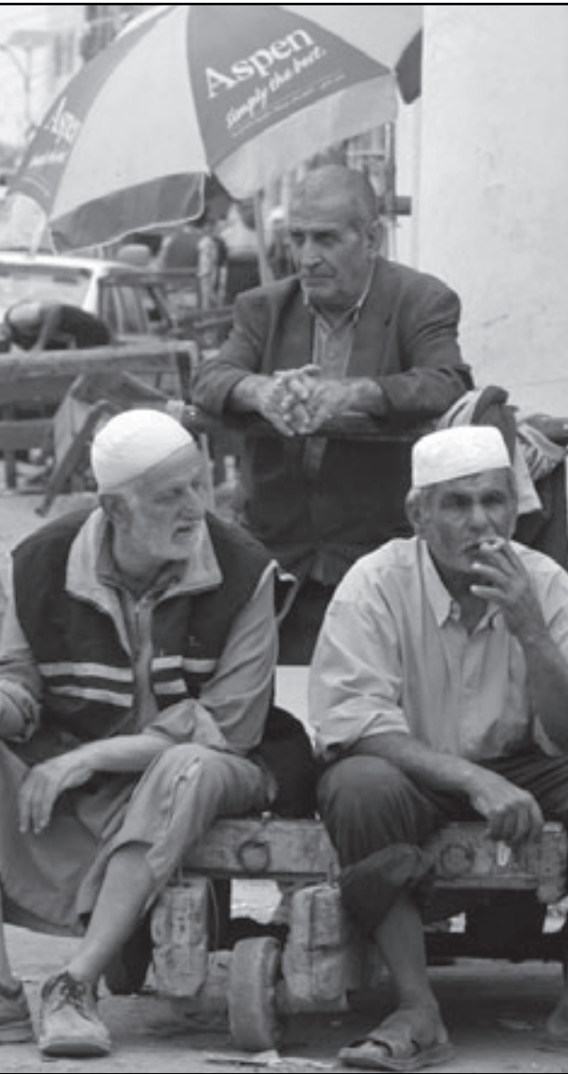
عمال عراقيون يرتاحون في بغداد امس

وأضاف أحمد في حديث هاتفني مع رويترز من واشنطن التي يزورها حاليا، أنه في حال أقر البرلمان التمويل اللازم فسيتم شراء نحو 96 طائرة من طراز F-16 بحلول سنة 2020.