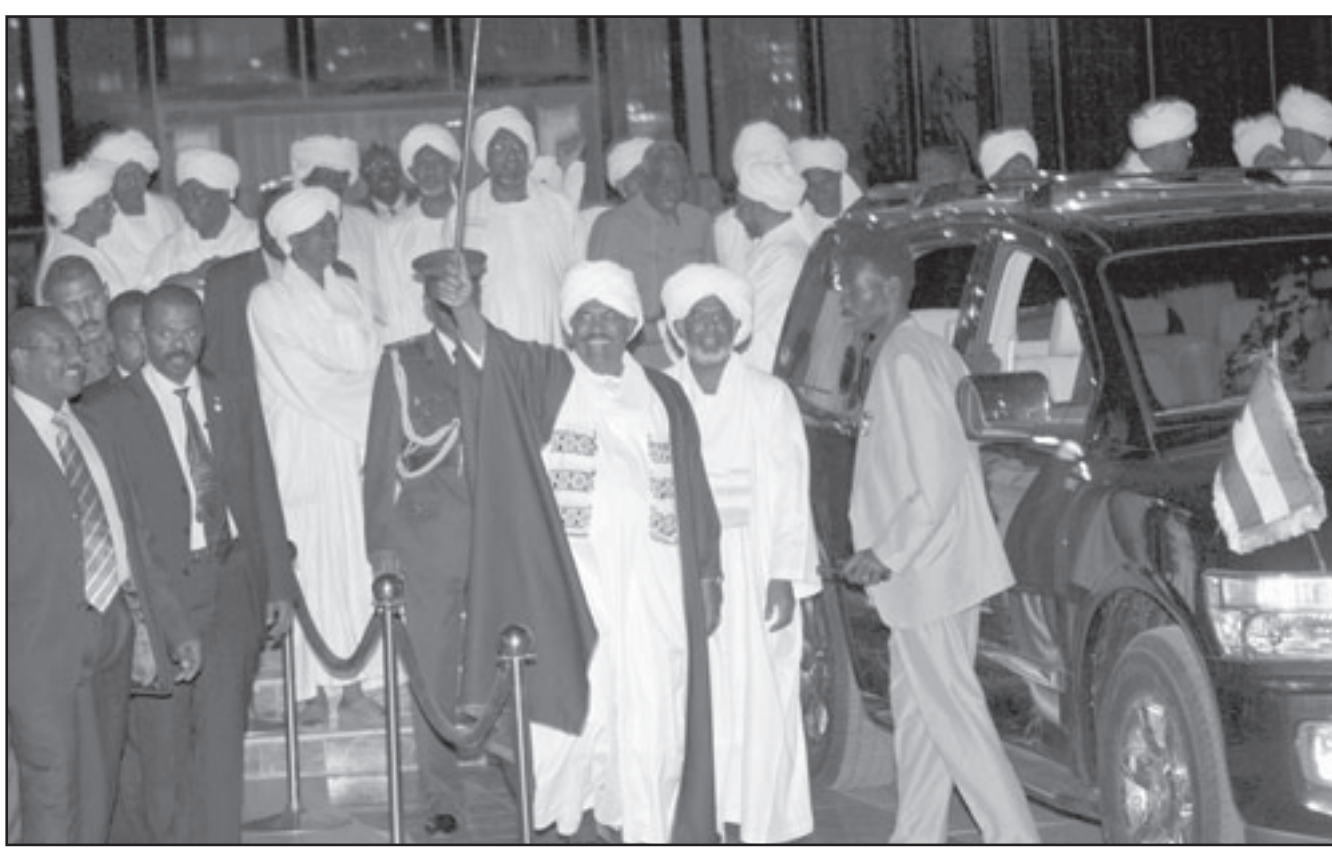
الرئيس السوداني لدى وصوله الخرطوم أمس عائدا من السعودية التي عرج عليها بعد ان أنهى مشاركته في قمة الدوحة الاثني الماضي

القادمة وربما حتى لعام. لكن على المدى الطويل كلنا خاسرون». وأضاف «اذا لم يحدث تغير وإذا استمر البشير فحسب دون تسوية الوضع في دارفور ستكون الأمور سيئة جدا في السودان». او باما بعد تفاصيل عن الطريقة التي سوف يتعامل بها مع نظام البشير. وعلق احد الشخصيات البارزة من المعارضة قائلا «البشير قوي على المدى القصير ربما للأشهر الستة او السبعة