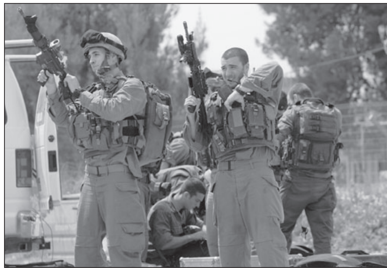
استفزاز لقوات الاحتلال الاسرائيلي بعد مقتل مستوطن في بيت لحم

دخل المناطق المصنفة (ايه) في الضفة الغربية، اي مناطق السلطة الفلسطينية. وقالت الازاعة ان سلطات الاحتلال ستقوم بنصب لافتات في مشارف المدن الفلسطينية للتعبية بعدم دخولها من قبل الاسرائيليين حفاظا على ارواحهم.