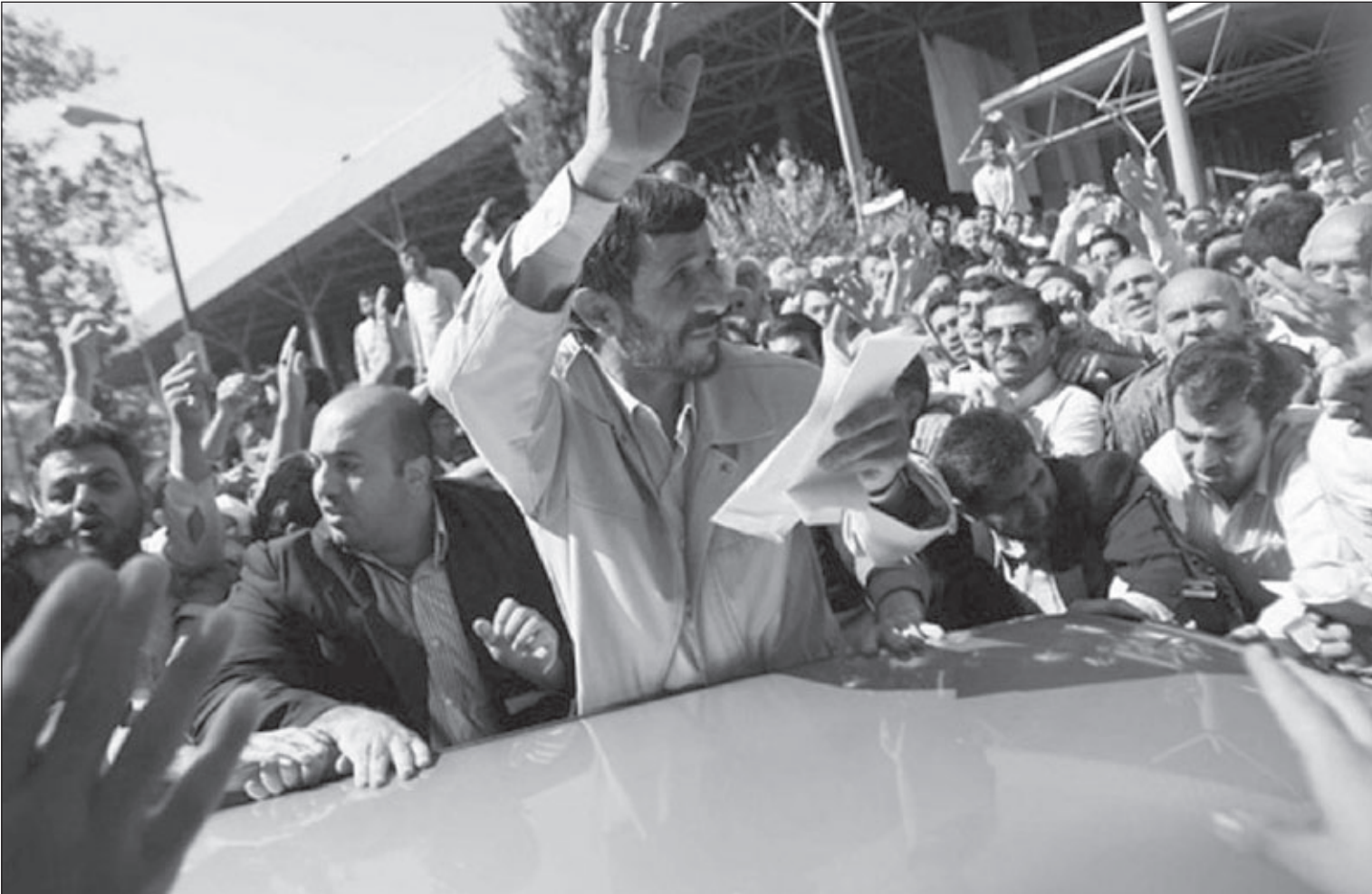
الرئيس الإيراني أحمدى نجاد

الباثوناما التسجيلية أنها أغفلت المشروع النووي الضخم، وتلك الجزئية رد عليها بيتر لوم موضحاً أن التركيز على القرى لم يكن بهدف فضح الفكر الإيراني وإنما كان محاولة لنقل صور مختلفة للحياة الريفية البسيطة وإبراز المفارقة بين ما تعانيه البلاد من تحديات وما تطمح في إنجازه من مشروعات استراتيجية عملاقة تغير موازين القوى في المنطقة، مشدداً على أن العناية بموقف الرئيس نجاد الإيجابي تجاه شعبه وحرصه على تأمين مستقبل بلاده العسكري لا يخرج باي حال عن فكرة التأييد لوقفه ضد المشروعات الاستعمارية المتربصة، بيد أن ثمة إتهام آخر واجهه المخرج الأمريكي بعد عرض فيلمه «خطابات للرئيس»، بمهرجان برلين من معارضي النظام الإيراني مفاده أنه لم يشر من قريب أو بعيد لديكتاتورية صديقه الرئيس الإيراني في تلميح له أن الفيلم لا يبدو كونه فيلماً دعائياً مستقراً لأمريكا ودون الغرب، الأمر الذي أوقع بيتر لوم المسكين في حيرة بين إتهامه من قبل الإيرانيين بفضح الفكر الذي يشي به الواقع القروي وبين المزاعم الأخرى بأن الفيلم مجرد دعاية لبيتر لوم المسكين ورئيسها دفع تكلفتها الصندوق من الاستحسان والاستنكار والآراء المتضاربة من جانب المؤيدين والمعارضين الأمريكي لدعم السنيما، ولكن على الرغم من شاهد عيان في قضية لها اعتبارها السياسي المهم ويبقى نجاد بطلاً في معركة لم يسبقه إلى ميدانها أحد.