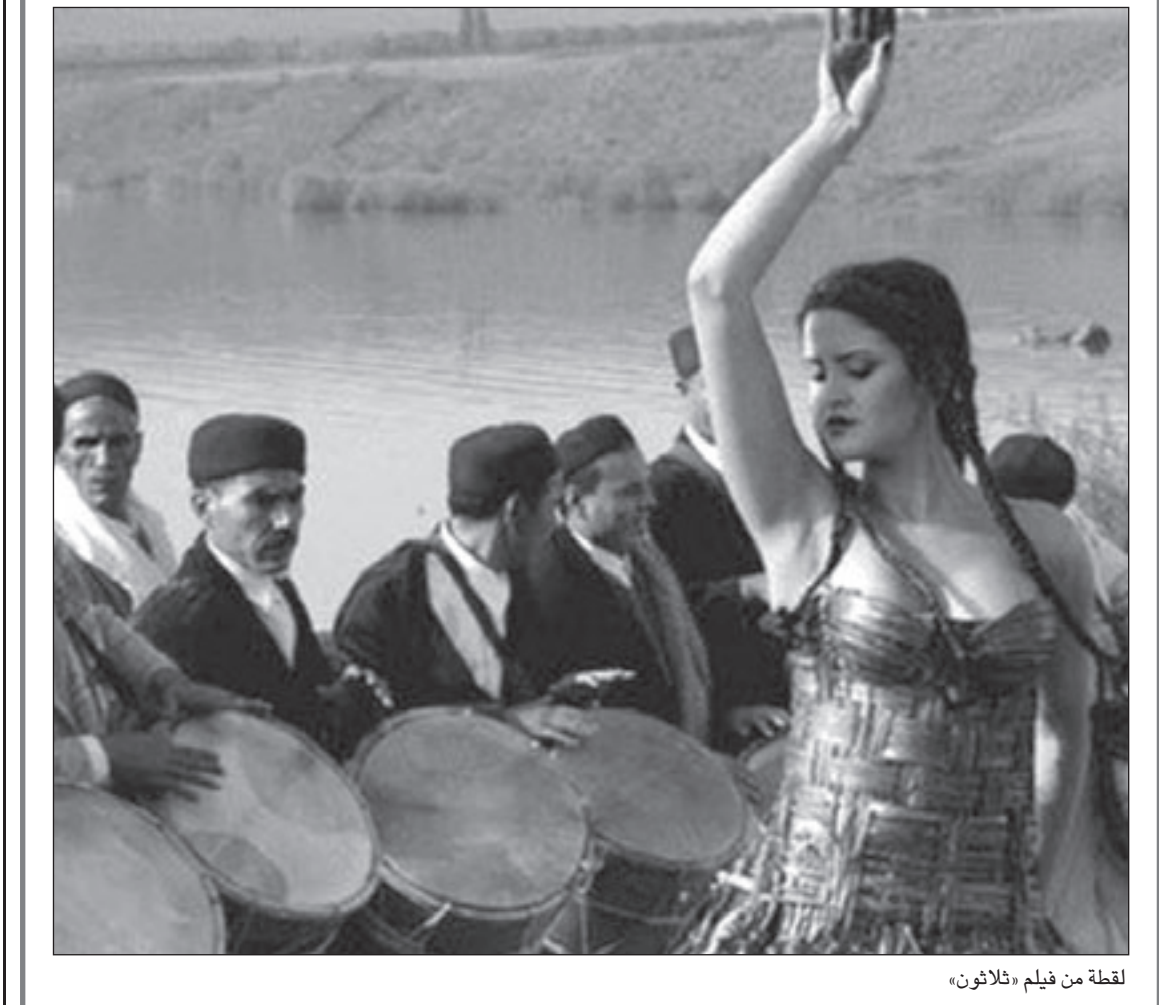
لقطة من فيلم «ثلاثون»