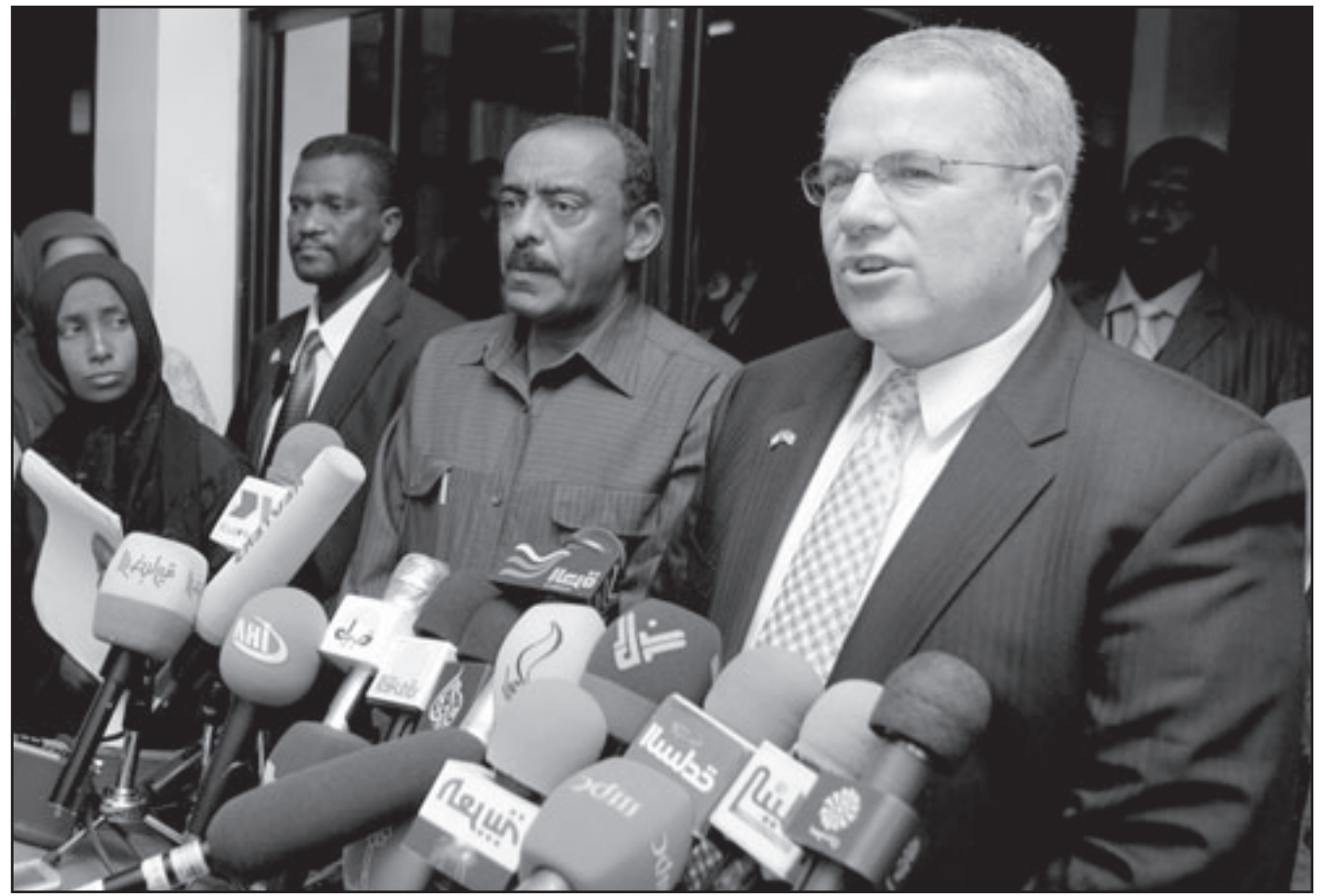
المبعوث الامريكي للسودان سكوت غريشبن يتحدث في مؤتمر صحافي أمس في الخرطوم

دفع رواتبهم بسبب تراجع اسعار النفط. وجرح الف. وقدر الامريكيون في حينه ان نصف منازل المدينة (39 الفا) تم تدميرها بشكل كامل واستخدم الامريكيون في العملية الفسفور الابيض حيث نفوا استخدامه في بداية ثم عادوا واعترفوا بانهم استخدموه كسلاح للدفاع. وياتي الحديث عن الفلوجة في ضوء الجدل حول مصير جماعات الصحوة التي تخلت عن المقاومة وتخلت عنها الامريكيون وقررت الحكومة العراقية حلها وضمها الى وزارة الداخلية في خطوة يرى الكثيرون انها قد تؤدي الى احياء الحرب الطائفية التي اشتعلت في عام 2006 وادت لقتل الالوف وتهجير مئات الالوف وتغيير طبيعة الاحياء. ويعني نقل عناصر الصحة لسؤولية الحكومة انتهاء راتب 300 دولار كانوا يتلقونه من الامريكيين ويخشى الكثيرون ان الحكومة لن تكون قادرة على