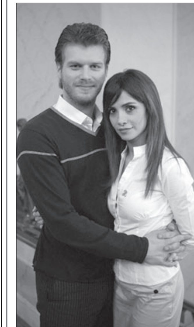
لقطة من مسلسل «نور»

في خضم الزخم السياسي الذي تخلقه إيران والأحداث الصعبة التي يواجهها رئيسها أحمدى نجاد لإصراره على ضرورة إحترام الولايات المتحدة الأمريكية لسيادة الدولة الإسلامية الكبرى، ومشروعها النووي القائم كان طبيعياً أن تقترب السينما من الأحداث الساخنة وتتابع عن كتب ما يدور على الساحة السياسية من صراعات وترصد وتسجل رأي الشعب الإيراني في رئيسه العنيد المقاتل وتوضح التباينات والفوارق في آراء غالبية عظمى وتعتبره زعيم القرن وقلة قليلة تراه على النقيض من هذا الوصف، ولأن السينما الوثائقية معنية بالأساس بعملية التأريخ فإرساء التي تبدأ باكتشاف أسرار مرعبة للبيت المسكون الذي انتقلت إليه مؤخرًا.