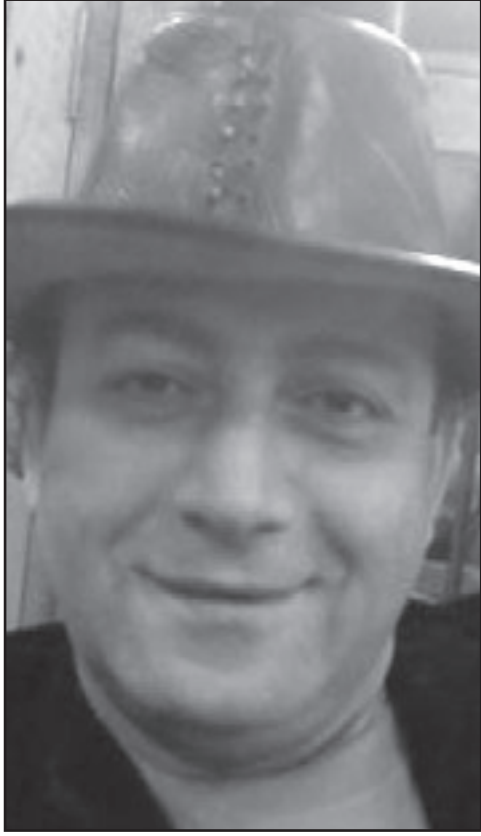
وحيد الطويلة (القديس العربي)