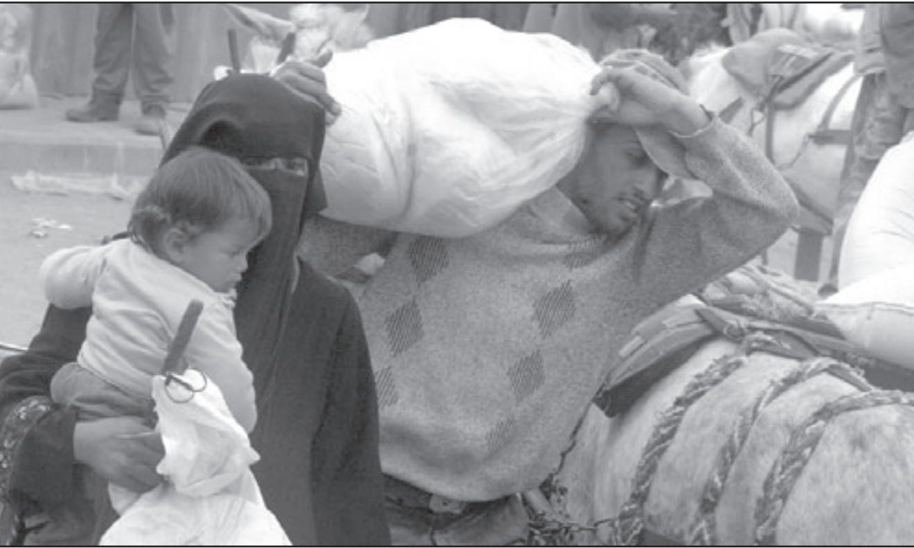
فلسطينية تتلقى المساعدات في غزة

واوضح ان هذه الجهات تتمثل في مصر وكل من يدعم وحدة الشعب الفلسطيني وخصوصا الجامعة العربية، بالإضافة الى مؤتمر القمة الاخير الذي دعم موقف مصر في الصلحة الفلسطينية الداخلية. وأشار القيادي في حماس الى انه بعد انهاء نقاط الخلاف «ستتم دعوة كل الفصائل للتوقيع على الاتفاق الفلسطيني الشامل».