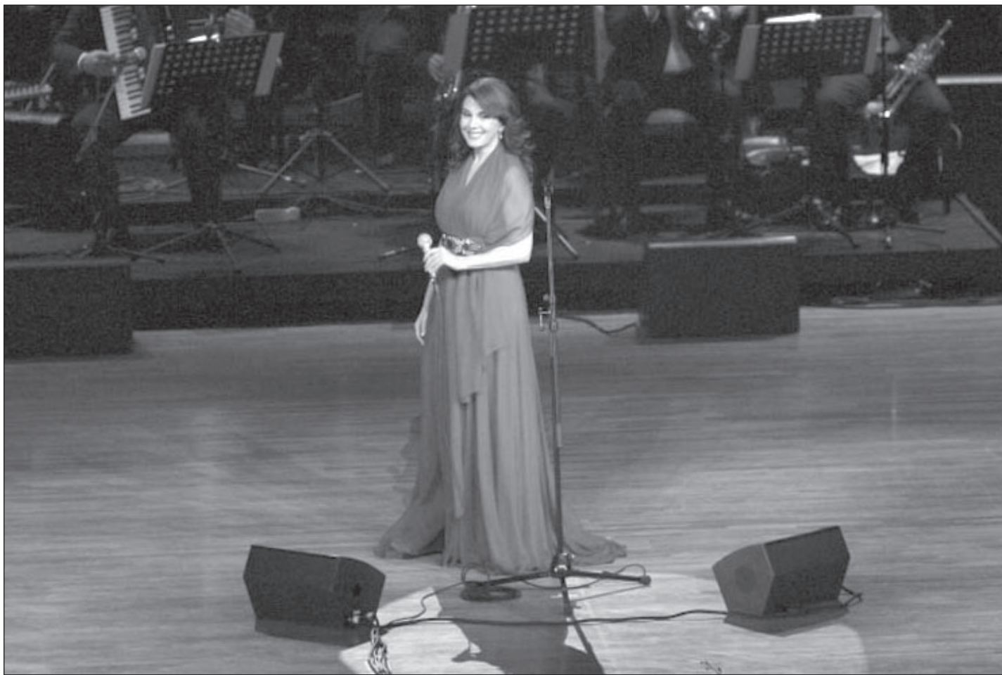
ماجدة الرومي (القدس العربي)

■ أتمنى أن نضرب الزمن تجربتنا لأنها غير منصفّة. كان دائماً الرهان على أيام قادمة بأن تكون أكثر جمالا. لا أريد أن أقول أن هناك رهان على حصان خاسر، لكن هناك أمل جميل. فكما يقول سميح في كلمات لأحدى أغانيه الجميلة «لوما الأمل شو يتنكسر لروح، فلولو الأمل لا تنكسر أرواحنا منذ زمن.