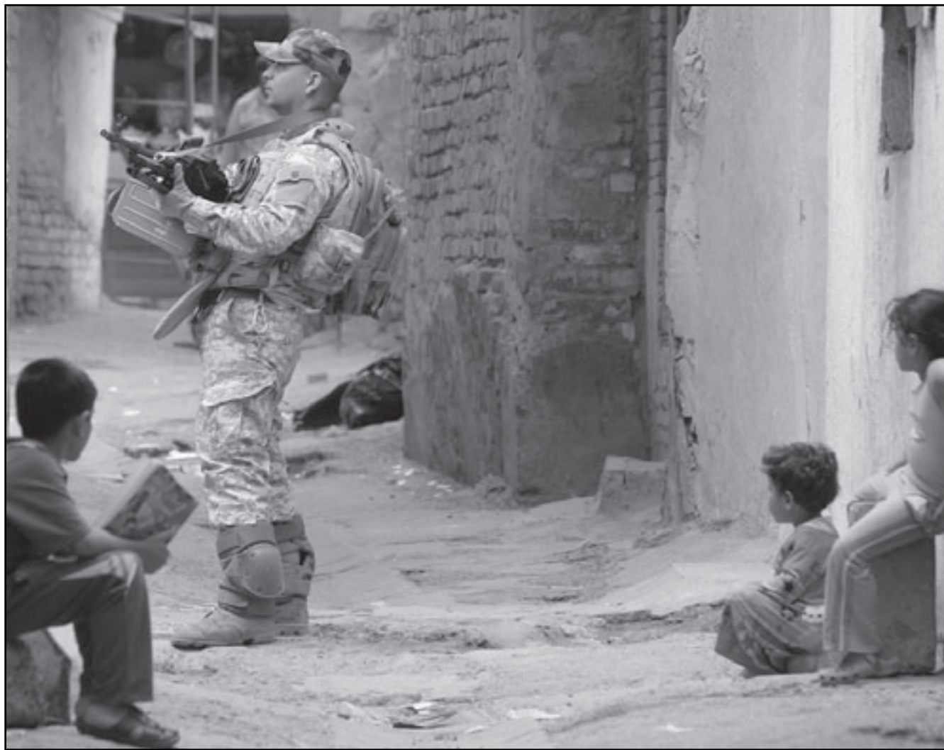
اطفال عراقيون يراقبون جندياً في منطقة الغضيل ببغداد امس