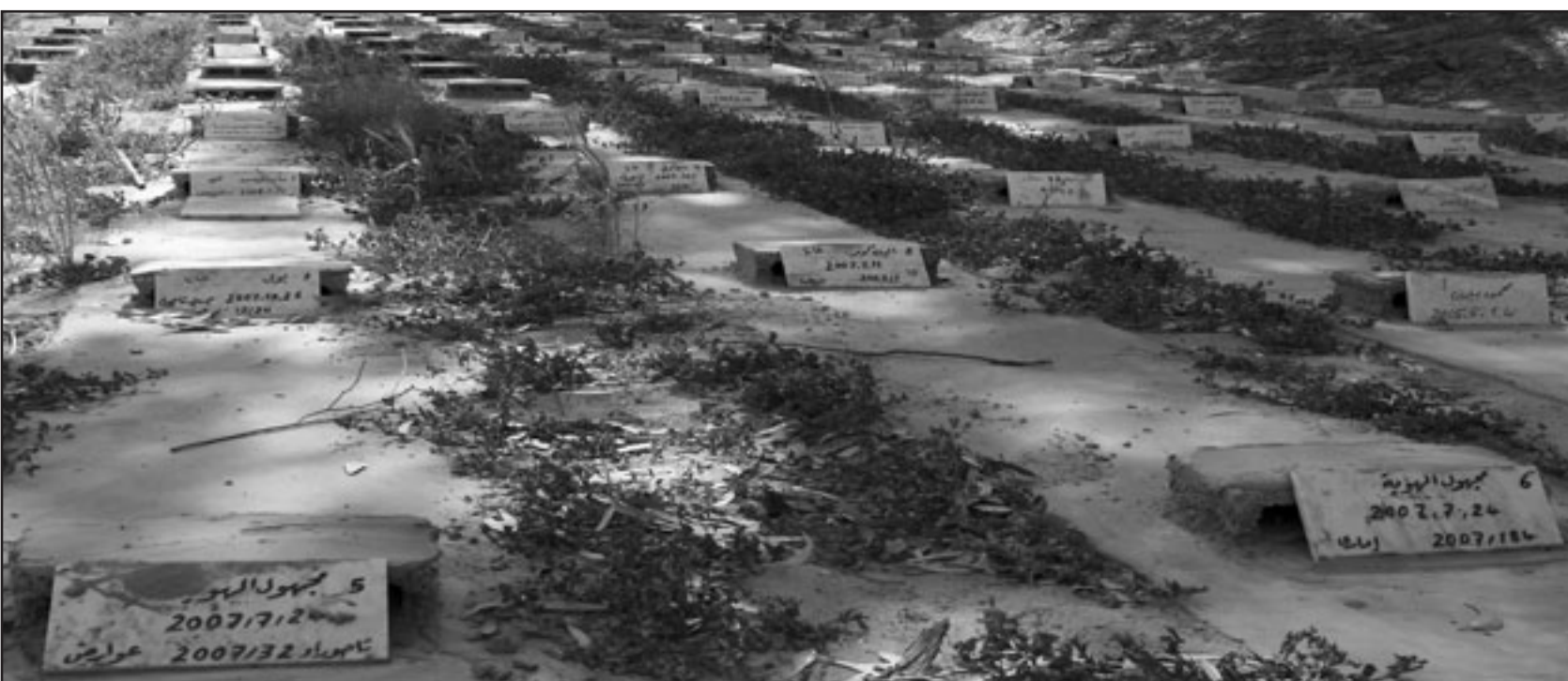
هنا يرقد مئات الشبان الافارقة.. عاشوا في سرية وماتوا مجهولين

■ طرابلس - ف ب: تنتشر في مقابر العاصمة الليبية طرابلس مئات القبور التي تحمل شواهد كتب عليها «هوية مجهولة» أو «موطن أفريقي» أو «سلطة الموطن» تحوي جثثا لفظها المتوسط ودفنت دون مواكب تشييع ودون أن يتعرف على أصحابها أحد.