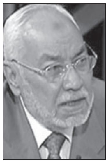
الشيخ مهدي عاكف