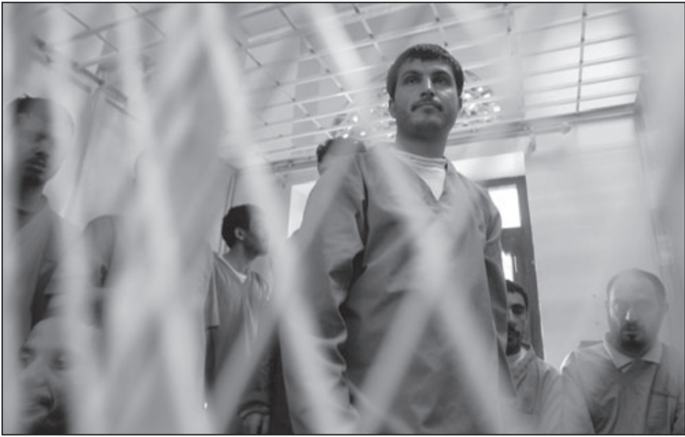
المتوردون امام الحكمة الانمينة في صنعاء امس

وقال مسؤول إغاثة طلب عدم نشر اسمه «إذا كانت هذه هي بداية اتجاه جديد فإن وكالات الإغاثة الدولية ستفكر فيما إذا كان يتعين عليها الإبقاء على طواقمها الدولية خارج المدن الرئيسية في دارفور خاصة في مواقع العمل الميداني حيث يكونون معرضين للخطر».