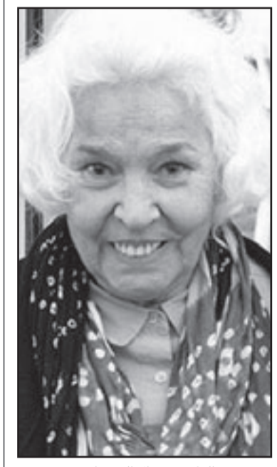
الدكتورة نوال السعداوي

■ الجمعيات والمؤسسات الخيرية حاليا تقدر بالألاف، أنها تخدم المرأة ولكن بشكل محدود على كل حال وأغلبهم لا يقدمون فكرا جديدا في خصوص تحرير المرأة لأن القائمين عليها يخافون من ظاهرها الحكومات أو يتعاونون مع التيارات الدينية والبعض حتى يؤيد الاستعمار الأمريكي ويعمل لصالحه، كي لا نلظم أحدا بتوجب علينا تقييم كل جديتي حد. الأمر أيضا يعتمد على المنهج الذي يستخدمونه في الدفاع عن حقوق المرأة وما إذا كانوا يريدون ذلك بالحقوق السياسية والاقتصادية والاجتماعية، والجماعية...هناك مثلا جمعيات متخصصة في الدفاع عن النساء ضد ما يسمى جرائم الشرف أو الفهر الجنسي أو ختان الاناث ولكن عمل هذه الجمعيات لا يكون ذي معنى إذا لم يتم ربط هذه القضايا بأبعادها الاقتصادية والسياسية وغيرها من القضايا، وأن الجنس منفصل عن الحياة والمجتمع، أنا أعطي محاضرات حاليا عنوانها «ختان الانثى وسياسات جورج بوش في مصر»، فالعلاقة بين ظاهرها ختان الاناث متصلة بالسياسة الدولية لأريكا التي تسهم في صعود التيارات الاصولية الدينية التي بدورها تشجع استمرار التقاليد البالية مثل الختان أو الحجاب، ختان الاناث زاد في