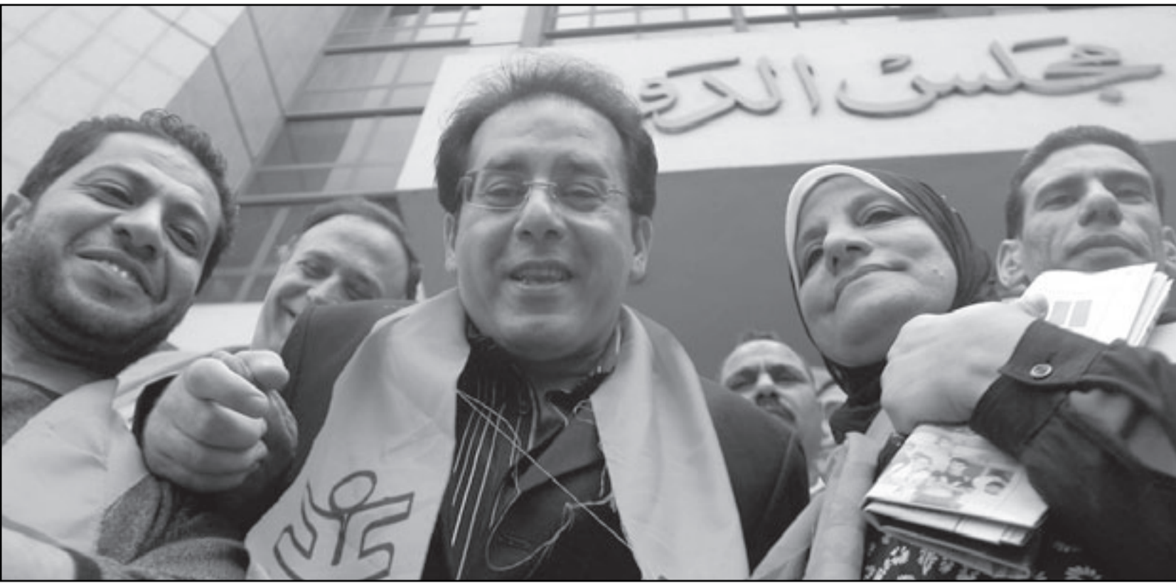
زعيم حزب الغدايمن نور يشارك في مظاهرة أمام مجلس الدولة بوسط القاهرة أمس