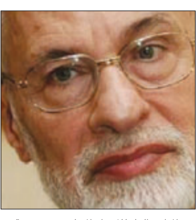
دمشق - «القدس العربي»

دمشق - «القدس العربي» من كامل صقر: فيما لم يحد حتى الآن أي موقف رسمي سوري بشأن إعلان جماعة الإخوان المسلمين السورية انشقاقها عن جبهة الخلاص الوطني المعارضة، قاطعت آراء أغلب المتابعين في سورية حول عدم إعطاء القيادة السياسية في سورية للحدث أهمية ما. وأكد مصدر سوري لـ«القدس العربي» أنه من المهم أن نسال أنفسنا على ماذا التقى الإخوان وحكام، لنصل إلى أن التقاهم كان بالأصل مخالفا للمنطق. واعتبر المصدر أن الطرفين ليس لهما أية أرضية في الداخل السوري، وأن انشحاب الجماعة من جبهة الخلاص كما كان انضمامها من موقف الإخوان لا يعقل كثيرا من الأهمية بالنسبة لسورية من منطلق أن جبهة الخلاص بما تضمه من قوى لا تمثل سوى نفسها حسب تعبيره. وأكد المصدر أن سورية ليس لديها مشكلة مع التيارات الإسلامية وخاصة ذات المواقف المؤيدة للمقاومة، بل المشكلة هي من تنظيم أساءه وأخطأ بحق أبناء سورية، في إشارة إلى تنظيم الإخوان المسلمين. وقال المحلل السياسي ايمن عبد النور إن دعم سورية لكل من حماس وحزب الله الإسلاميين والمقاومة عموما، والعلاقة الطيبة جداً التي تربط سورية بالجليل العلي لعلماء المسلمين ورئيسه الشيخ يوسف القرضاوي أفرغ الورقة التي كانت تحدثت بجماعة الإخوان المسلمين، متسائلا ماذا يمكن أن يطالب به الإخوان المسلمون أكثر مما فعلته سورية في دعمها للمقاومة؟ ولقت إلى أن انقراض عقد جبهة الخلاص ليس منذ أيام حيث صدر بيان الإخوان المسلمين الأخير بل منذ عدة أشهر حيث أعلنت الجماعة في السابع من الشهر الأول من هذا العام، لتعلق كافة نشاطاتها المعارضة، مشيرا إلى أن المصالحة السورية السعودية ليست هي التي دفعت الإخوان المسلمين إلى هذه الخطوة، بل يمكن