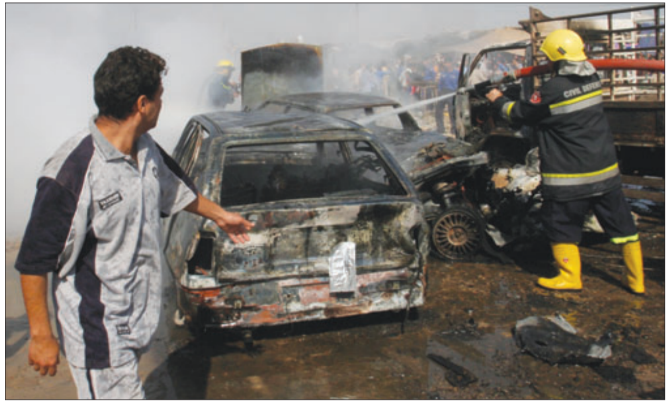
عمال اطفاء في موقع أحد الانفجارات في بغداد أمس