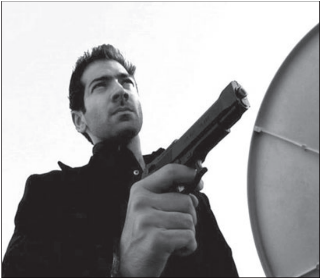
لقطة من فيلم «مطر»