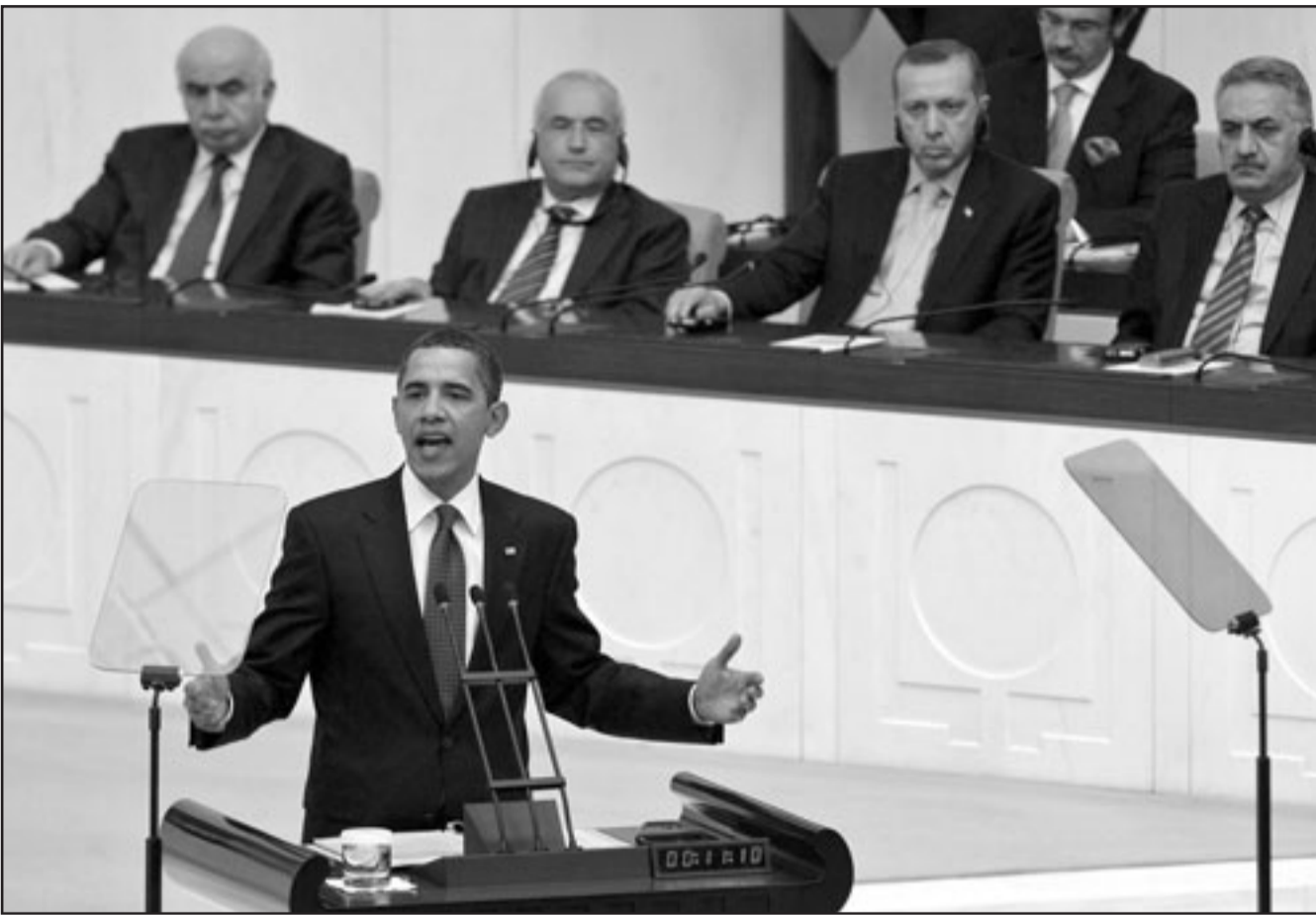
أوباما يلقي خطابه امام أعضاء البرلمان التركي امس

«اسمحوا لي بان اكون واضحا: الولايات المتحدة تدعم بحزم ترشيح تركيا للاتحاد الاوروبي». وتحدثت أوباما الذي يقوم بأول زيارة له الى بلد مسلم حليف عضو في الحلف الاطلسي، عن «قرون في التاريخ وعن ثقافة وتجارة مشتركة (بين أوروبا وتركيا) تجمع بينهما». واعتبر ان دخول تركيا إلى الاتحاد الأوروبي سعتزج الكتلة الأوروبية.