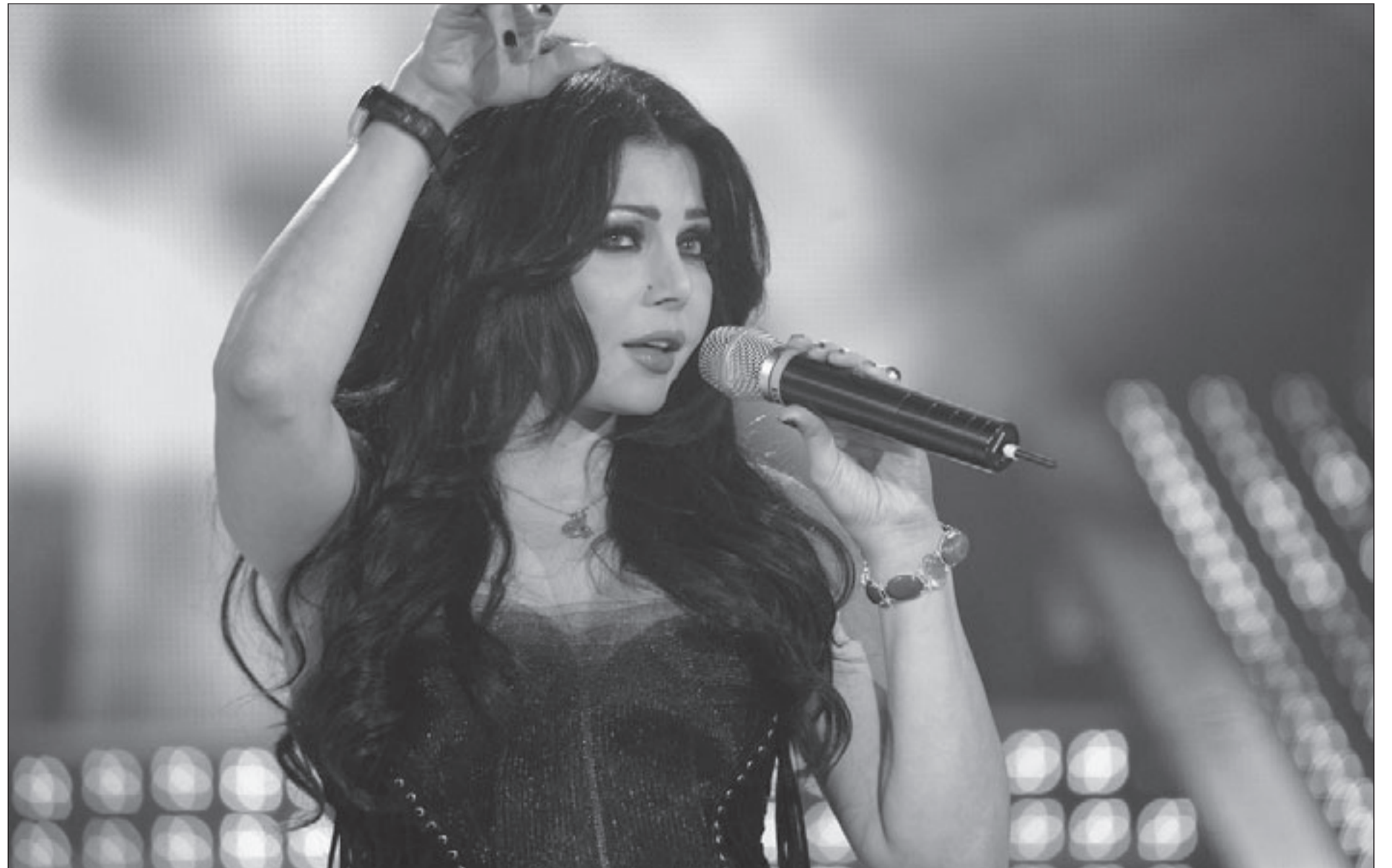
هيفاء وهبي في ستار أكاديمي