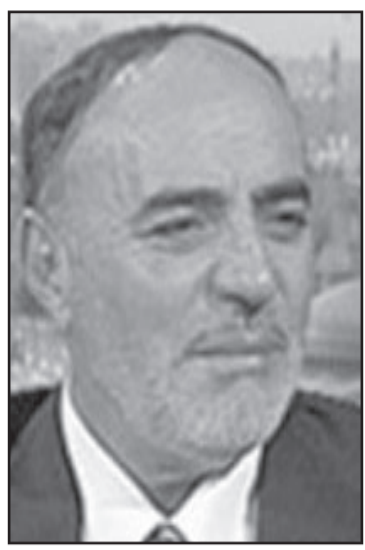
الشيخ عبدالمجيد الذنبيات