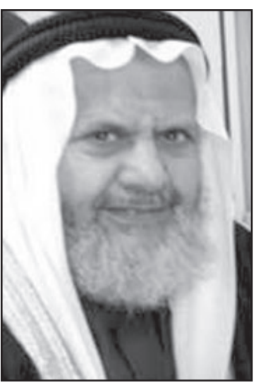
الشيخ همام سعيد

الاخوانية في العالم تحترم الخصوصية المصرية حيث ان مصر هي بلد المؤسس منذ عام 1928 الشيخ حسن البنا رحمه الله كما انها اكبر الاقطار العربية ومن اكبر الاقطار الاسلامية اضافة للمكانة التي تتمتع بها بنيتها التنظيمية وحجم هذه البنية.