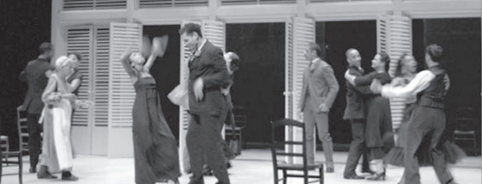
لقطة من المسرحية

وتؤسس الرواية، في هذا الإطار للقول، والتعبير عن هوية الذات للفنونة بصيغ جديدة، وهي «لا الهدم والبنات المتراكمة هندسياً بلعبة لا يعرف أسرارها سوى الروائي الذي يقدم تأويلاته وتفسيراته حول جزء من هذه العملية حينما يوصي بمرجعياته أو يوهم ببعض عناصرها الملثقي، ما دام كل قول وتعبير أو