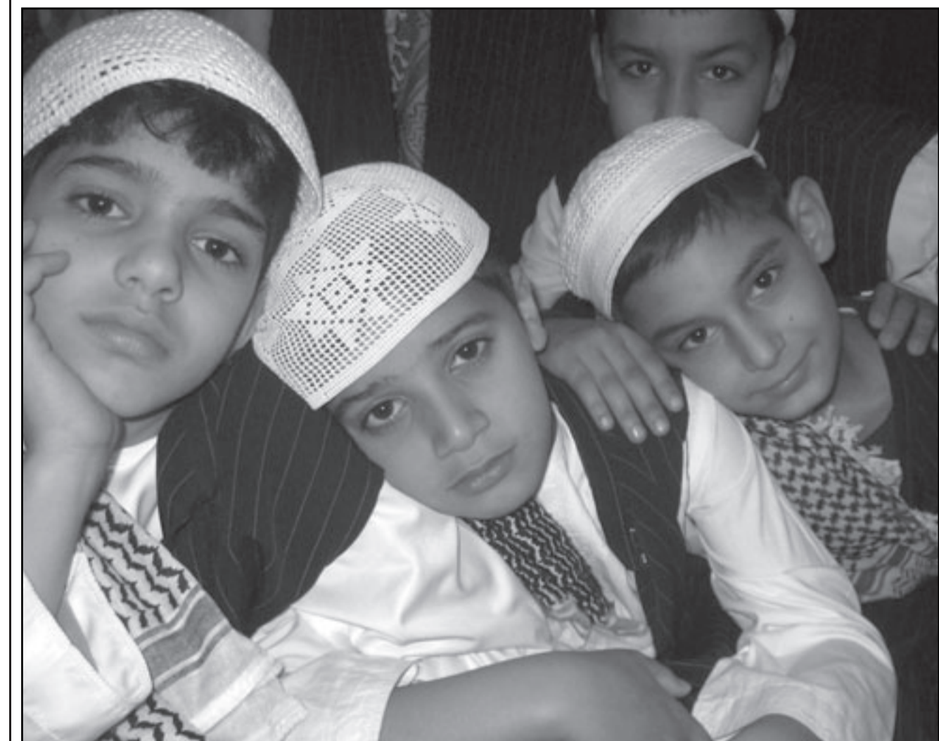
اطفال عراقيين في ملجأ لايتام ببغداد