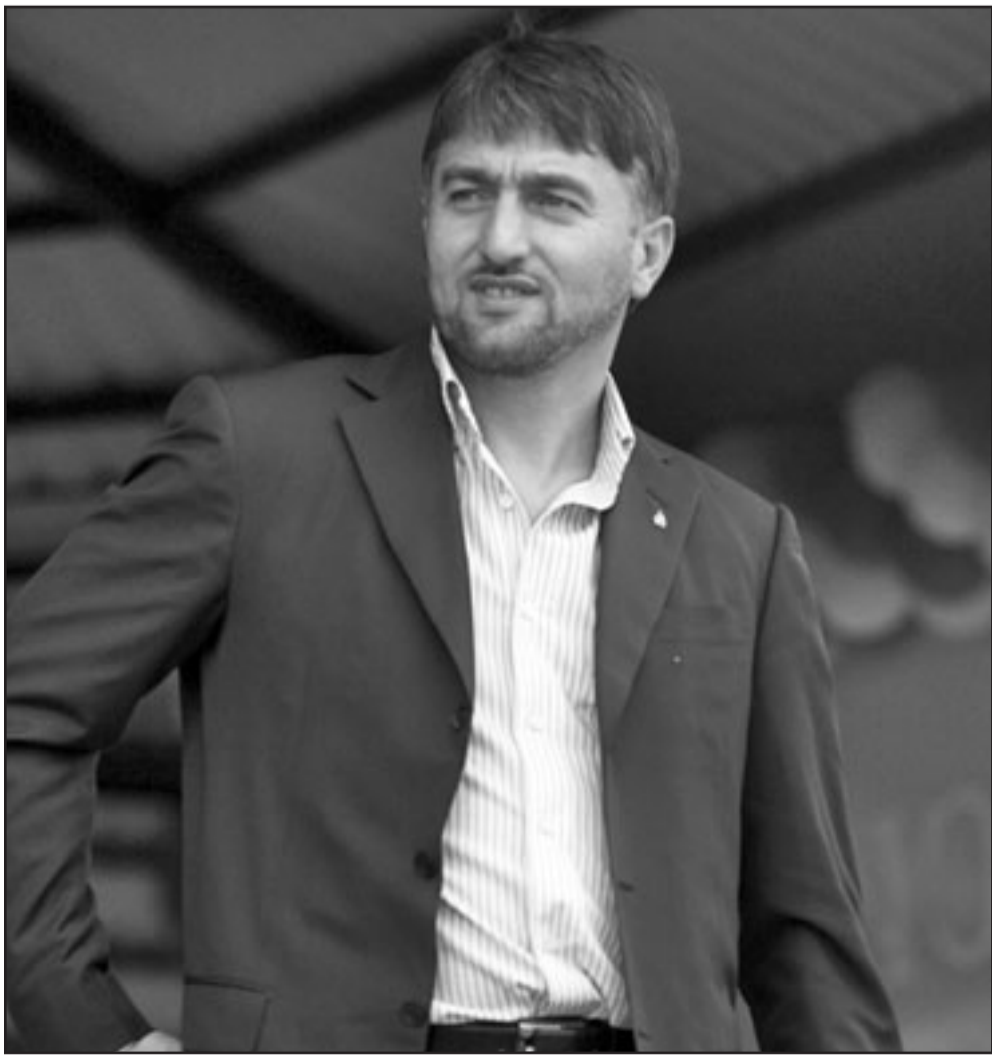
آدم ديلمياخونوف الذي اتهمه شرطة دبي بالوقوف وراء اغتيال الزعيم العسكري السابق في الشيشان سليم عمادديف

■ موسكو - ا ف ب: وصف النائب الاول لرئيس الوزراء الشيشاني آدم ديلمياخونوف تصريحات قائد شرطة دبي الذي اتهمه بالوقوف وراء اغتيال الزعيم العسكري السابق في الشيشان سليم عمادديف (36 عاما) بأنه «تحريض» معربا عن استعداده للتعاون. ونقلت وكالة انباء ريا نوفوستي عنه قوله ان «تصريحات قائد شرطة دبي هي ذات طابع تحريضي وتهدف الى زعزعة التجمع الشيشاني». وأضاف ديلمياخونوف الذي هو ايضا نائب في مجلس الدوما الروسي، لوكالة انترفاكس «انا مستعد للتعاون في اطار هذا التحقيق ومستعد للرد على اسئلة موضوعية ومحددة في حال كانت لشرطة دبي مثل هذه الاسئلة». وقال قائد شرطة دبي في حال خلال مؤتمر صحافي ان «مسؤولا كبيرا في الحكومة الشيشانية هو آدم ديلمياخونوف، نائب رئيس الوزراء، تشير خطوط القضية الى انه الرجل المدير لعملية اغتيال سليم عمادديف». وأوضح الفريق ضاحي خلفان تميم ان «الجريمة صناعة شيشانية وعملية تصفية حسابات قدرة وحلقة من حلقات الصراعات في جمهورية الشيشان التي امتست تصفياتها الى الخارج». وشدد المسؤول الاماراتي على ان ديلمياخونوف «مطلوب في الامارات» واسمه سيذكر في «تقرير المطولين وستمعها على انتربول».