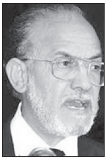
الشيخ عبداللطيف عربيات