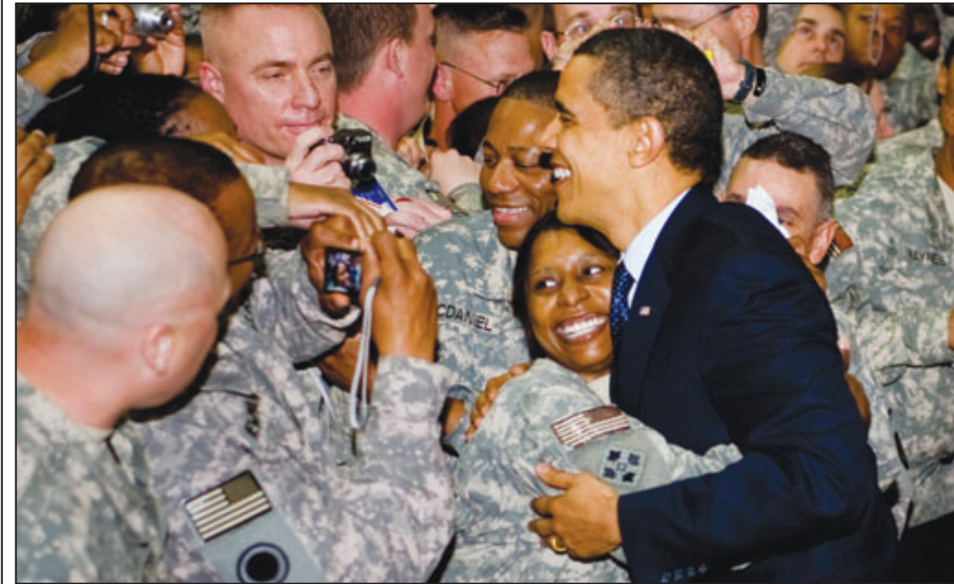
الرئيس الامريكي باراك اوباما خلال لقائه الجنود في معسكر «فيكتوري» في بغداد امس

يجب القيام بالزيد،. يشار الى ان اوباما والمالي التقي في مقر قائد قوات التحالف في العراق الجنرال الامريكي راي اودينون في قصر الفاو الواقع وسط معسكر فيكتوري قرب مطار بغداد. وقد التقى اوباما الرئيس جلال طالباني ونائبه عادل عبد المهدي وطارق الهاشمي. والتقى اوباما المسؤولين قرب مطار بغداد نظراً لتعذر انتقاله الى وسط بغداد بواسطة الروجات نظراً لسوء الاحوال الجوية، وغادر اوباما بغداد بعد زيارة استغرقت ما زاد قليلاً على اربع ساعات، وهذه اول زيارة له للعراق وهو رئيس للبلاد. في ذلك قالت الشرطة العراقية ان انفجار سيارة ملغومة اسفر عن سقوط تسعة قتلى واصابة 20 شخصاً في حي الكاظمية الشيعي في شمال غرب العاصمة بغداد امس الثلاثاء بعد يوم من مقتل 37 شخصاً في انفجار سبع سيارات ملغومة في شتى أنحاء العاصمة العراقية.