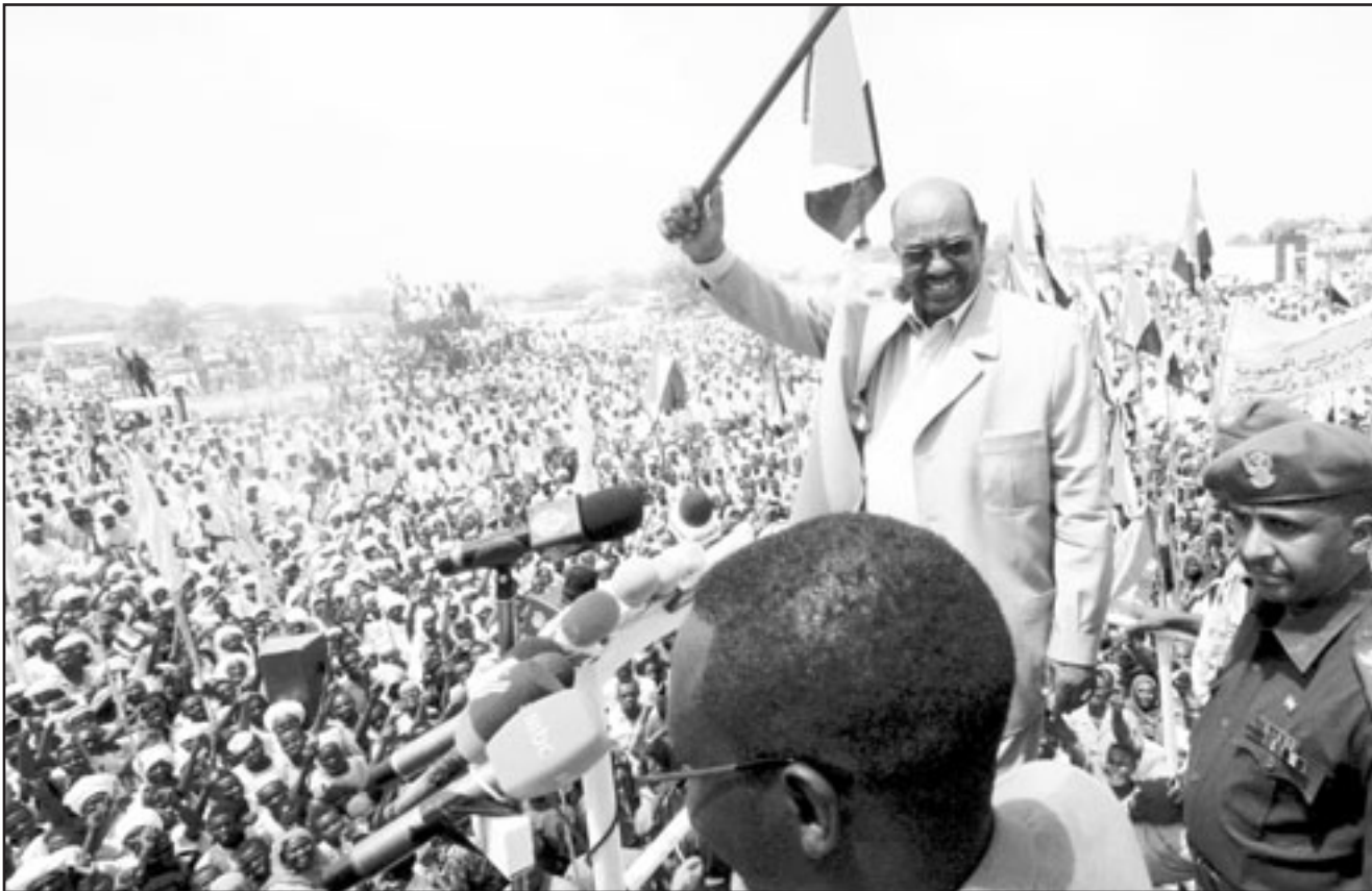
الرئيس السوداني عمر البشير خلال زيارته لغرب دارفور امس

القانون الدولي لتسييس العدالة، وقال إن مشكلة دارفور ظهرت في وقت يحتاج فيه الغرب لتغطية كوارثه الانسانية والجرائم التي ارتكبت في العراق وافغانستان، مضيفا أن الاستخبارات الدولية لعبت دورا كبيرا في تصعيد الازمة، لكنه أكد ان كل المحاولات لن تغير وجهة السودان، وتكشف في ذات الوقت عن ضغوط تتعرض لها بعض الحركات التي أبدت رغبتها في الانضمام الى مفاوضات الدوحة لاثباتها عن المشاركة، وأشار الى الآثار السلبية لقرار محكمة الجنائيات الدولية التي تمثلت في رفض زعيم حركة العدل والساواة الموجود حاليا في تشاد المشاركة في مفاوضات الدوحة وإعلانه بأنه سيكون أحد أليات تنفيذ قرار الجنائية، وفيما يتعلق بأحد الافكار التي طرحها احد المشايخ والخاص بتشكيل محكمة عربية إسلامية افريقية بمشاركة