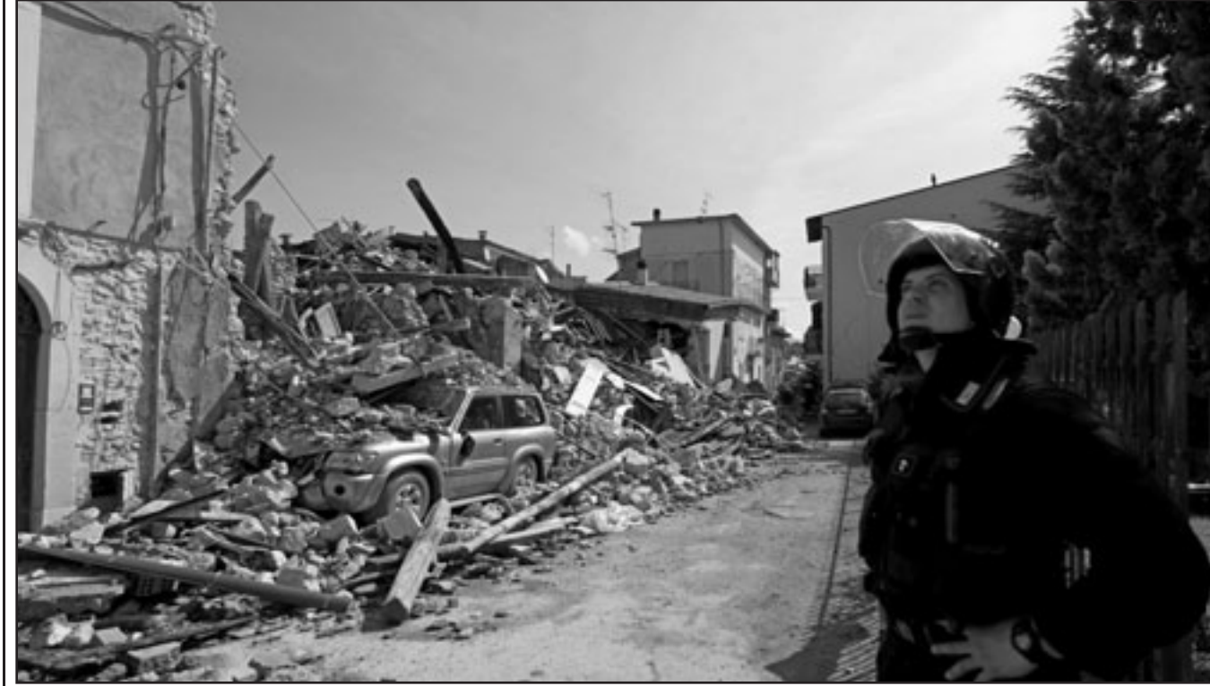
عامل بفرق الاغاثة يتأمل الخراب بعد الزلزال

على هوياتهم و17 لم يتم التعرف على هوياتهم بعد، موضحاً ان سبعة الاف مسعف ينشركون في عمليات الاغاثة اضافة الى متطوعين. وقال ان البحث عن ناجين محتملين سيستمر 48 ساعة. وبخصوص الجرحى قال رئيس الحكومة الإيطالية ان «الحصيلة أكثر بقليل من ألف شخص بينهم 500 ادخلوا المستشفيات ومنهم 100 في حال الخطر».