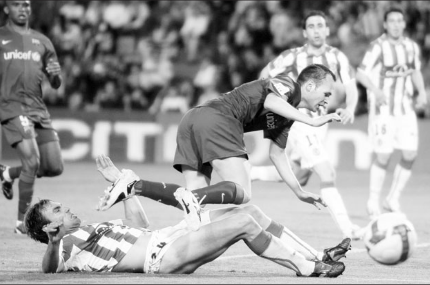
لاعب برشلونة اندريس انيستيا يسقط ارضا خلال صراع على الكرة في المباراة مع بلد الوليد

بسبب أمور عائلية وعاد إلى ميونيخ قبل عدة أيام لكنه سرعان ما سافر مرة أخرى إلى بلاده قبل مغادرة الفريق إلى إسبانيا.