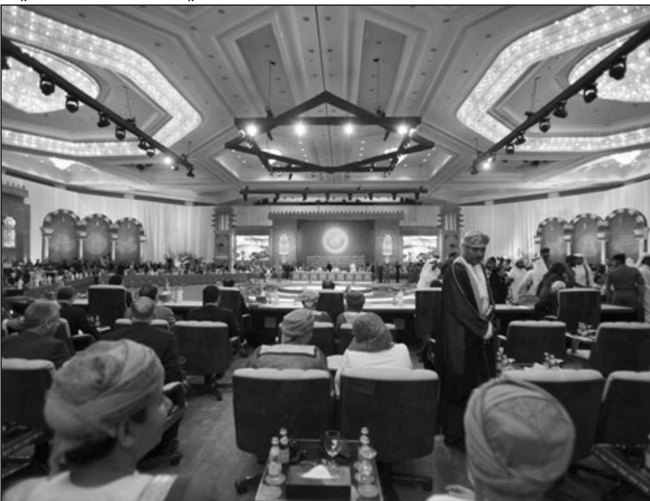
قمة الدوحة وضعت العرب في مواجهة الرأي العام العربي