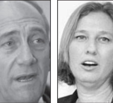
اولمرت الحق ضرراً باسرائيل

ادعاء ليفني بان على حكومة نتنياهو ان تكون ملتزمة بالسياسة التي وضعتها حكومة اولمرت، هذه السياسة الديمقراطية هي مهزلة لان سياسة التي تجسدت في عملية انابوليس قد رفضت من قبل الشعب في اسرائيل في الانتخابات الاخيرة. اولمرت استغل حفلة الوداع التي نظمه حزب كاديما على شرفه ليدعي ان عملية انابوليس قد حظيت باعتراف دولي باسرائيل وانه بفضل هذه العملية اصبح ملايين الناس في العالم يعترفون اسرائيل حقيقة قائمة. هناك حاجة للتذكير بان الاعتراف الدولي باسرائيل قد تحقق قبل 61 عاما من خلال حكومة نافدين بين غوريون وان شجاعة جنود اسرائيل هي التي حولت اسرائيل الى حقيقة مفروضة قائمة؟ المفاوضات الوهمية التي اجراها اولمرت وليفني لم تحدد هذا الاعتراف بالسياسة التي حاول ليفني القيام به في المفاوضات التي اجريها في السنة الاخيرة مع محمود عباس. ولكن بينما كان بإمكان باراك ان يدعي بدرجة معينة