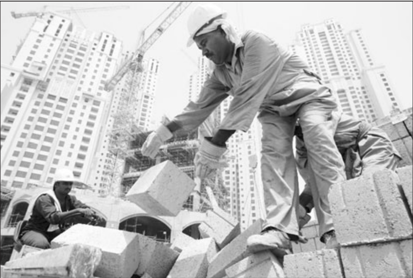
صورة أرشيفية لحد العمال الاجانب في احد مواقع البناء في دبي خلال العام 2006

والعمال من الدرجة الثالثة يقومون بمهام الاجانب ويتلقون اجورا اقل، وما يجلب الاجانب الغربيين لدبي انها توفر لهم حياة غير موجودة في بلادهم، ولكن الحياة هنا تعتمد على الهيكل الاجتماعي، ويرى الكاتب ان دبي شهدت مشاريع موححة وعملقة ومجنونة والان بعضها يواجه خطر الانهيار، ومع مخاطر وأثار الازمة العالمية تحدثت الكاتب في نهاية رحلته عن ان ما حدث في دبي هو شيء مزيف وذلك نقلا عن فتاة فلبينية تعمل في المطار.