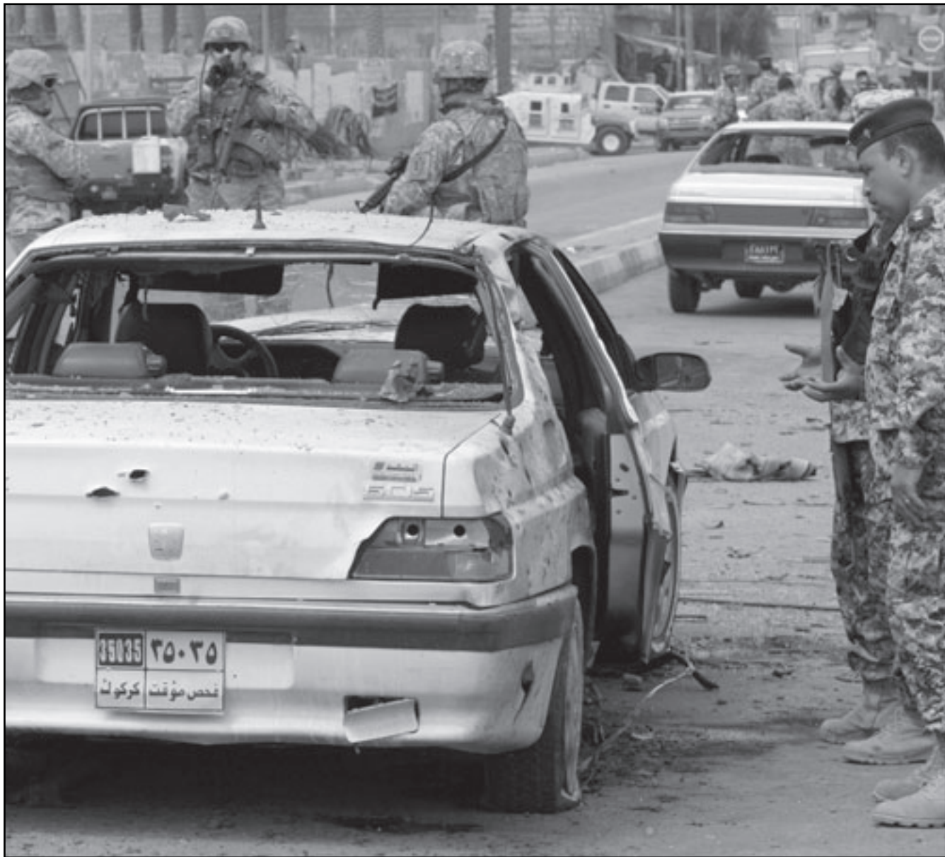
رجال شرطة عراقيون يعاينون موقع انفجار في بغداد امس