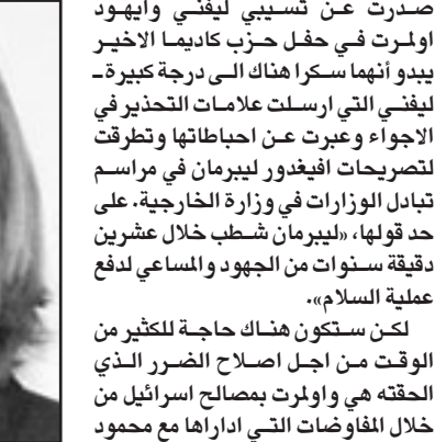
ليفني ارسلت اعلامات تحذير