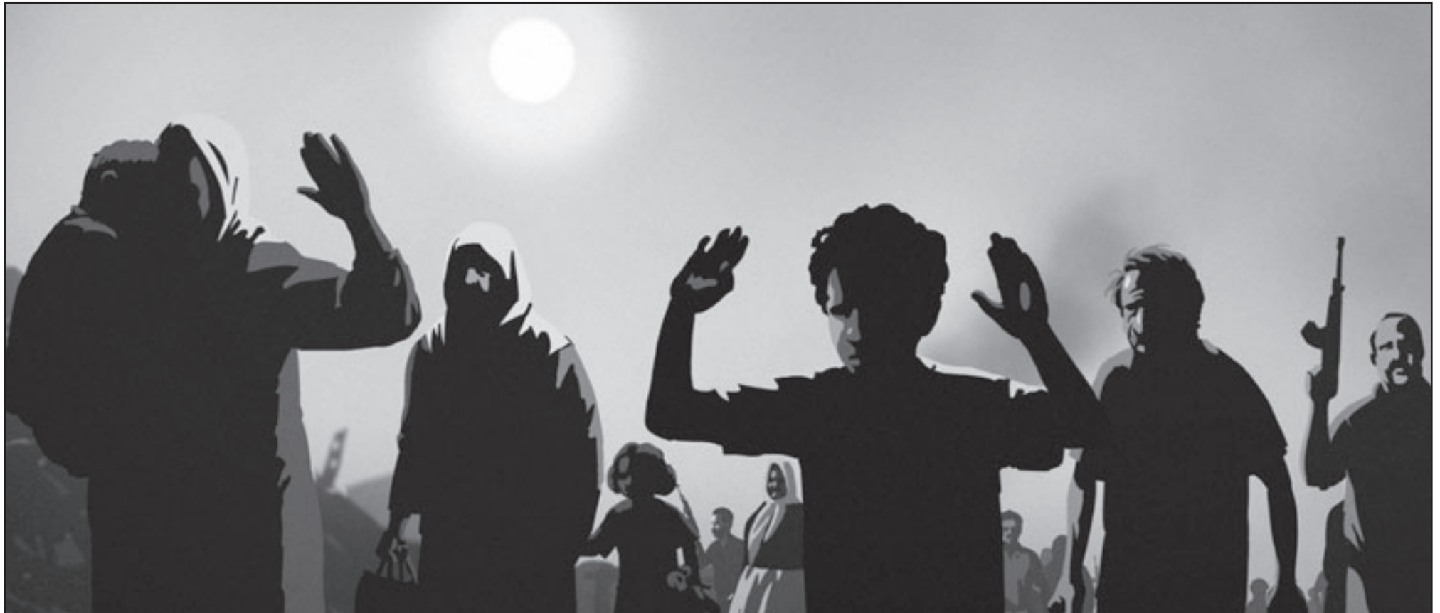
لقطعتان من الفيلم