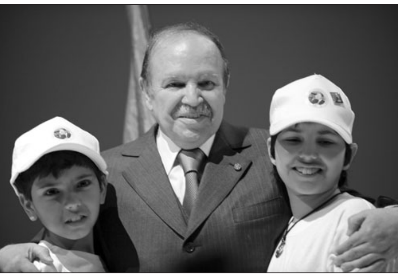
فتيات في قلب حملة بوتفليقة الباحث عن الغوز بأغلبية ساحقة

رابعين (54 عاما) مؤسس حزب «سد 54»، (إشارة إلى سنة اندلاع الثورة الجزائرية 1954) للمرة الثانية. وقد حصلوا في 2004 على التوالي على 1% من الأصوات و63.0%. وعلى غرارهما حاول كل من زعيم الجبهة الوطنية الجزائرية موسى تواتي (56 عاما) ومحمد أوسعيد بلعيد، المدعو محمد السعيد (62 عاما) زعيم حزب الحرية والعدالة الإسلامي المعتدل ومحمد جهيد بونيسي (48 سنة) أمين عام حركة الإصلاح الوطني (الإسلامية)، فرض أنفسهم على الساحة السياسية لكن تصفهم الامكانيات مقارنة ببوتفليقة. عبر الرئيس عن رغبته في أن ينتصر الفائز «بأغلبية ساحقة». وتبدو إعادة انتخاب بوتفليقة المرشح لولاية ثالثة، محسومة إلى حد كبير لا سيما أن أبرز قوى المعارضة التقليدية وهما تجمع الثقافة والديموقراطية وجبهة القوى الاشتراكية وأحد القياديين الإسلاميين المتشددين عبد الله جاب الله (02.5% خلال 2004) قرروا مقاطعة الاقتراع معتبرين أنه محسوم سلفا. وعد بوتفليقة الذي استدل بحصيلة السنوات العشر التي قضاها في السلطة، بالاستقرار والاستمرارية في «جزائر قوية تسودها السكينة»، عبر خطة تنمية جديدة تقدر تكاليفها بنحو 150