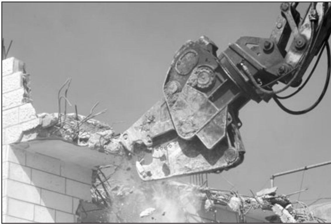
جرافة اسرائيلية تهدم منزلا في صور باهر