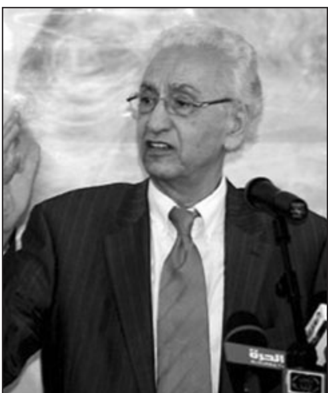
الزعيم التاريخي حسين آيت أحمد

والعدالة، ولا يعفينا من القيام بتقييم وتحمل نصيبنا من المسؤولية في الاستمرار الطويل لكل مسلمات السيطرة هذه. ووصف الزعيم التاريخي انتخابات الخميس بالاعتصاب، قائلا «عشية هذا الاعتصاب الجديد لحق الجزائريين في تقرير الصيغ، هذا الاعتصاب الجديد لوعود الاستقلال، وهذه الأكتوبية الجديدة المنتمية في انتخابات رئاسية تهدف إلى استمرارية نظام النهب من المفيد التذكير بأن النظام العالمي الذي سمح لنظام أو ليفاغري فاسد أن يجد تحالفات مفيدة لاستمراره هو يصعد التغيير اليوم تحت ضغط مجتمعات أصبحت ترفض الأكاذيب والعجرفة والتي حملها وكبرها القذرة التي أتت بوتفليقة لتزيينها في شكل سلم قدر منذ 1999. كما أوكلت لبوتفليقة مهمة تزيين الفضل السياسي والأخلاقي للنظام على بترديد مقولة لا السلم عام، في حين أن الغزاة التي تقلصت في ميدان الحرب دون أن تندثر تحولت إلى إجماع في كل الاتجاهات وإلى عطف اقتصادي». إلا أن مسؤولية الحكم لا تحلّي مسؤولية المعارضين والنشطاء، وفي هذا السياق قال آيت أحمد: «هذا لا يجب أن يقلل من مسؤولياتنا كجزائريين بكل الاتجاهات والذين يملكون حرصا مشتركا على البحث عن الديمقراطية