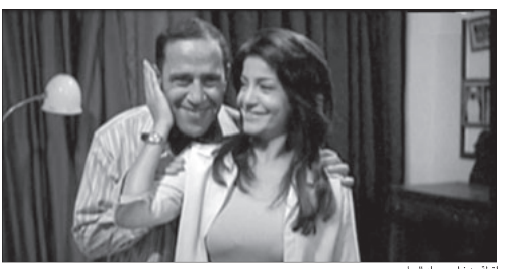
لقطة من فيلم «صياد اليمام»