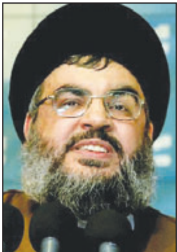
السيد حسن نصر الله

وأكد أن هذه المهام تتضمن «تلقين العناصر الإجراءات الامنية» و«اعداد العيوات المفرقة»، و«تأسيس مشروعات تجارية (..) لاتخاذها ساترا لتنفيذ المهام» ومراقبة «القرى والمدن الواقعة على الحدود المصرية الفلسطينية وارسال النتائج إلى كوادر الحزب بلبنان». وتضمن المهام أيضاً بحسب البيان «استنجاز بعض العقارات المملوكة على الجري الملاحي لقادة السويس لرصد السفن التي تعبر القناة» و«رصد المنشآت والقرى السياحية بمحافظتي شمال وجنوب سيناء»، و«تزويد جوازات السفر وبطاقات التحقيق الشخصية». كذلك تضمن الاتهام «استنجاز شقق مفروشة ببعض الاحياء الراقية بالبلاد واستخدامها للقاء عناصر الحزب وكذلك عقد الدورات التدريبية لبعض عناصر التنظيم الموجودين في البلاد». من جهة أخرى اتهم النائب العام المصري حزب الله بالعمل على «نشر الفكر الشيعي داخل البلاد»، في هذا البيان الذي صدر بعنوان «المستشار عبد المجيد محمود، النائب العام، يتابع سير التحقيقات في قضية الانضمام والترؤيع لحزب الله اللبناني والدعوة إلى ارتكاب جرائم في مصر».