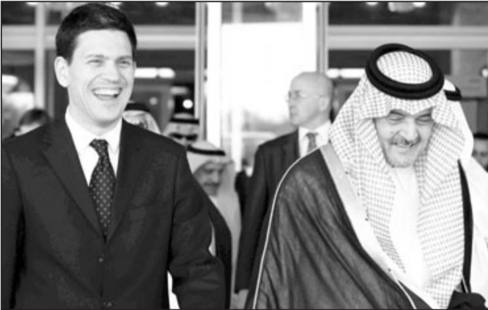
وزير الخارجية السعودي لدى استقباله نظيره البريطاني في الرياض امس

ويعتقد المستوطنون الاسرائيليون انهم يكفرون عن خطاياهم تجاه الرب في عيد الفصح من خلال الاعتداء على الفلسطينيين