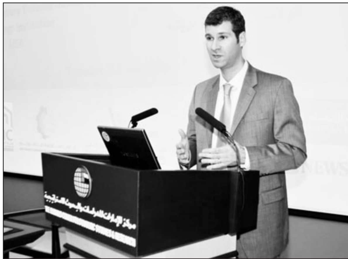
د. بيتر سنجر مدير المبادرة الدفاعية للقرن الحادي والعشرين يتحدث خلال المحاضرة

لغريق السياسة الدفاعية الخاص بالحملة الانتخابية ليبارك اوباما، وقد سبق أن شغل منصب المدير المؤسس لمشروع «السياسة الأمريكية في القرن الحادي والعشرين»، وله مؤلفات في هذا الميدان، وقد عمل أيضاً منسقاً