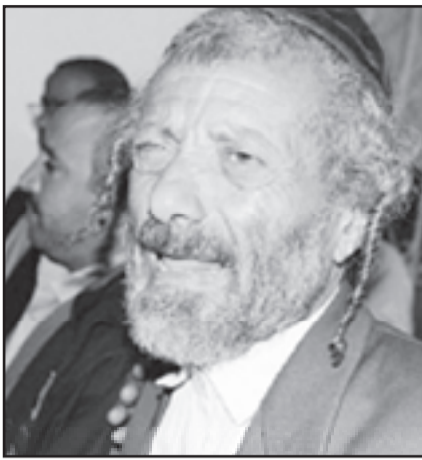
يعيش النهارى زعيم الطائفة اليهودية في اليمن

على الاحتفال بعيد الفصح بعد أن انقطعت المعونات الحكومية المقررة لهم منذ 3 أشهر. وقال الحاخام يحيى يعيش للصحافيين «طلعت إعتناشاً المقررة من رئيس الجمهورية منذ 3 أشهر وعلى الرغم من اعتصامنا أمام مقر الحكومة لأكثر من أسبوع، لكننا لم نجد أننا صاغية لمطالبنا المتواضعة».