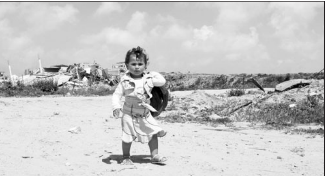
طفلة فلسطينية تسير في مخيم جباليا

الطبيعي داخل اطرها رغم انها شاركت في صنع واقع الحركة وحاضرها من خلال قيادة التفاوضين وتحملها عبء محطلات تاريخية، اهمها تاسيس السلطة الوطنية الفلسطينية ككيان يحكم الفلسطينيين بشكل ذاتي لأول مرة في التاريخ وما تبعه من التزامات دولية وإقليمية أثرت في الحركة وعليها.