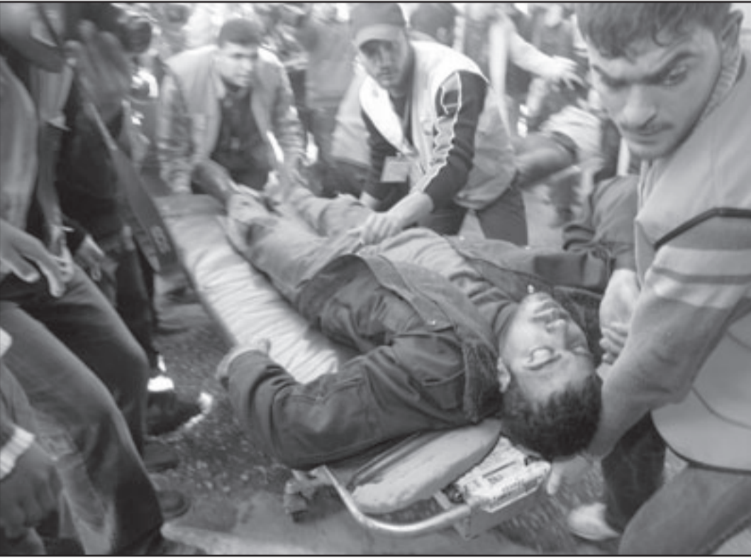
حرب وقائية أم جرائم حرب؟

غربية لمن يأخذون على انفسهم في هذه الايام بالذات التعليمات العليا، «في كل جيل وجيل ملزم الانسان بان يرى نفسه وكأنه هو الذي خرج من مصر». الاسرائيليين؟ * مايكل فلتسر هو بروفيوسور في معهد الدراسات المتقدمة في جامعة برنستون وواضع كتاب «حروب عادلة وغير عادلة». * افيشاي مرغليت هو بروفيوسور في كلية جورج كيتان في معهد الدراسات المتطورة في برنستون وفي الجامعة العبرية في القدس. مآرّس 2009/4/8