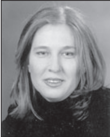
ليفني تصارع الرجل

غير فاسدة، يجدر بها أن تتعلم من نتنياهو، الذي في الولايات السابقة تنازل عن انجازات فورية في صالح احتلال السلطة لاحقاً. نتنياهو كان «رسمياً»، امتنع عن اطلاق الهجمات على يهود اولمرت، اعطى اسناداً للحريين في الشمال وفي الجنوب، وبنى نفسه كمن سيهدىء المخاوف الامنية والاقتصادية للجمهور. ليفني تصرفت هكذا حين عرضت فشلها في تشكيل الحكومة وسيدها الى المعارضة كتعبيرين عن اصرارها على المبادئ، عليها أن تتمسك بهذا الخط.