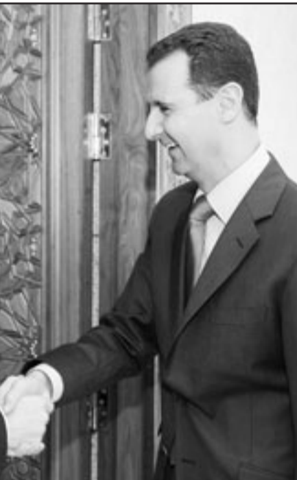
الرئيس السوري لدى استقباله وزير الخارجية الايطالي في دمشق امس

بحث الرئيس السوري بشار الاسد امس الاربعة مع وزير الخارجية الايطالي فرانكو فراتيني علاقات التعاون بين البلدين وبين سورية والاتحاد الأوروبي. ونقل بيان رئاسي سوري امس ان جهات النظر «متطابقة حول ضرورة تطوير هذه العلاقات في كلا الاتجاهين بما يساعد في تحقيق المسمى السوري - الأوروبي لإرساء الاستقرار في المنطقة وتحقيق التنمية المستدامة على ضفتي المتوسط». و اضاف البيان ان الجانبين بحثا ايضا الأوضاع في الشرق الأوسط. وكشف وزير الخارجية الايطالي ان بلاده ستقوم خلال وقت قصير بدور «عاجل» لاعادة اطلاق المفاوضات المباشرة بين سورية واسرائيل، دون ان يحدد ماهية هذا الدور، واكد فراتيني ان بلاده ستستبح من اسرائيل ازالة الاحتلال ايشكل اكبر عقبة امام عملية السلام حسب تعبيره. كلام فراتيني جاء في خلال مؤتمر صحافي مقتضب عقد في مقر الخارجية السورية مع وزير الخارجية السوري وليد المعلم الذي اوضح بدوره ان بلاده يمكن ان تعاد المفاوضات غير المباشرة مع تل ابيب وفق الاسس التي جرى الاتفاق عليها مع حكومة اولمرت المنصرفة وهي التزام اسرائيل بالانسحاب حتى خط الرابع من حزيران وبشرط الا تؤثر على المحادثات التي تجري على المسار الفلسطيني، والاهم ان تستخدم حتى المفاوضات بين سورية واسرائيل كخطوة للقيام بعوان على غزة او لبنان. وبين المعلم ان الوزير فراتيني بحث مع الرئيس السوري بشار الاسد