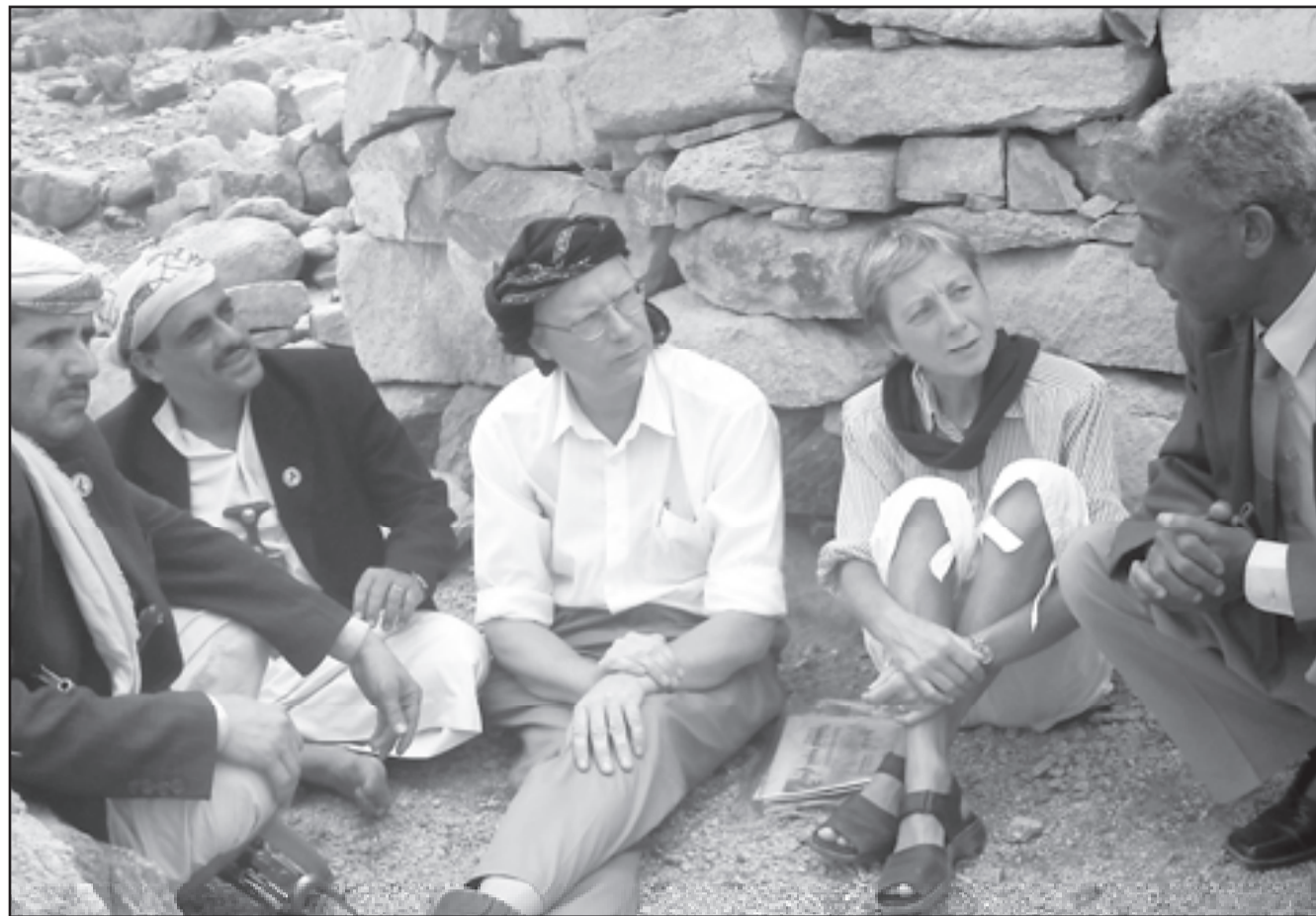
الزوجان الهولنديان الخلفان يتحدثان الى عضو في فريق الفاضين لاطلاق سراحهما. والتقطت الصورة لهما في الخامس من الشهر الجاري في منطقة احتفاهما الجبلية شرق اليمن