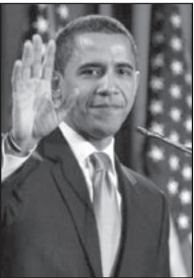
اوباما ذكر نتنياهو من هورب البيت الابيض

مايكل مان والعلوم التي ادلى بها للصحافة الامريكية. ولكن الحكومة الاسرائيلية التي تنتشد السلام هي وحدها القادرة على اقناع الجمهور بان امر الجيش الاسرائيلي لتترك بخلو محادثات رئيسها ميثا الاركان جابي اشكنازي في واشنطن وفي شتراسبورغ. في فترة تجدل القيادات السياسية مع استقرار القيادة العسكرية العليا، تولي اجهزة الامن الامريكية مصادقة عالية لاشكنازي والذي يعتبر شخصاً مهتماً في نهجه. تقديراته بصدد شدة التهديد الايراني والقدرة على معالجته وجدت اصداءها في تعليمات رئيس الطواقم الامريكية