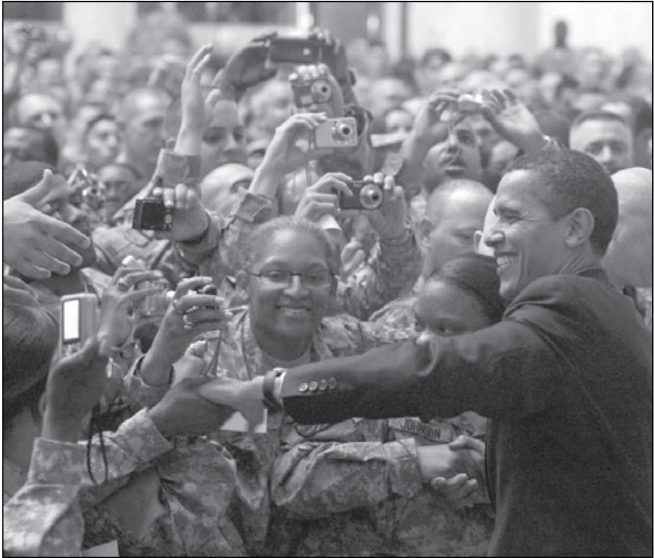
الرئيس الأمريكي باراك أوباما مع الجنود الأمريكيين في بغداد أمس

فشل أمريكي، أوباما بالتحديد، لأنه لم ينجح بتعيين سفير في العراق خلفا لرايان كروكر، وهذا الفشل هو بمثابة رسالة غير واضحة من الإدارة بحسب مسؤول سابق في وزارة الخارجية الأمريكية عمل في بغداد. فقد كان أوباما يامل بتعيين اثنتي عشرة زعيما قبل أن يغير رأيه بطريقة مخرجة ويعين كريستوفر هيل، الذي عمل معها سابقا في إدارة بوش كوزيرا الشمالية، ولا يزال تعيينه يصطدم بعوائق على الرغم من الحاجة الملحة لوجود سفير أمريكي في بغداد. والسؤال المطروح هو أن كانت مجالس الصحوة في الأنبار ومحافظة بغداد ستواصل عملها بعد انسحاب القوات الأمريكية وأن كانت تتواصل دعم الحكومة حيث ستقوم الأخيرة بدمجها في قوات الأمن. ويعتقد المسؤول الأمريكي أن السياسة العراقية الداخلية معقدة وتزداد تعقيدا مع اقتراب تخفيض الوجود الأمريكي. فقامت القضاة طيلة منها التوتر العربي - الكردي، وعدم وجود قانون توزيع حصص الثروة النفطية في مدينة كركوك، والقوات الأمنية الطائفية الطابع وغياب حقوق الإنسان للمعتقلين، وهذه مجمل القضايا التي ظلت حاضرة طوال سنوات