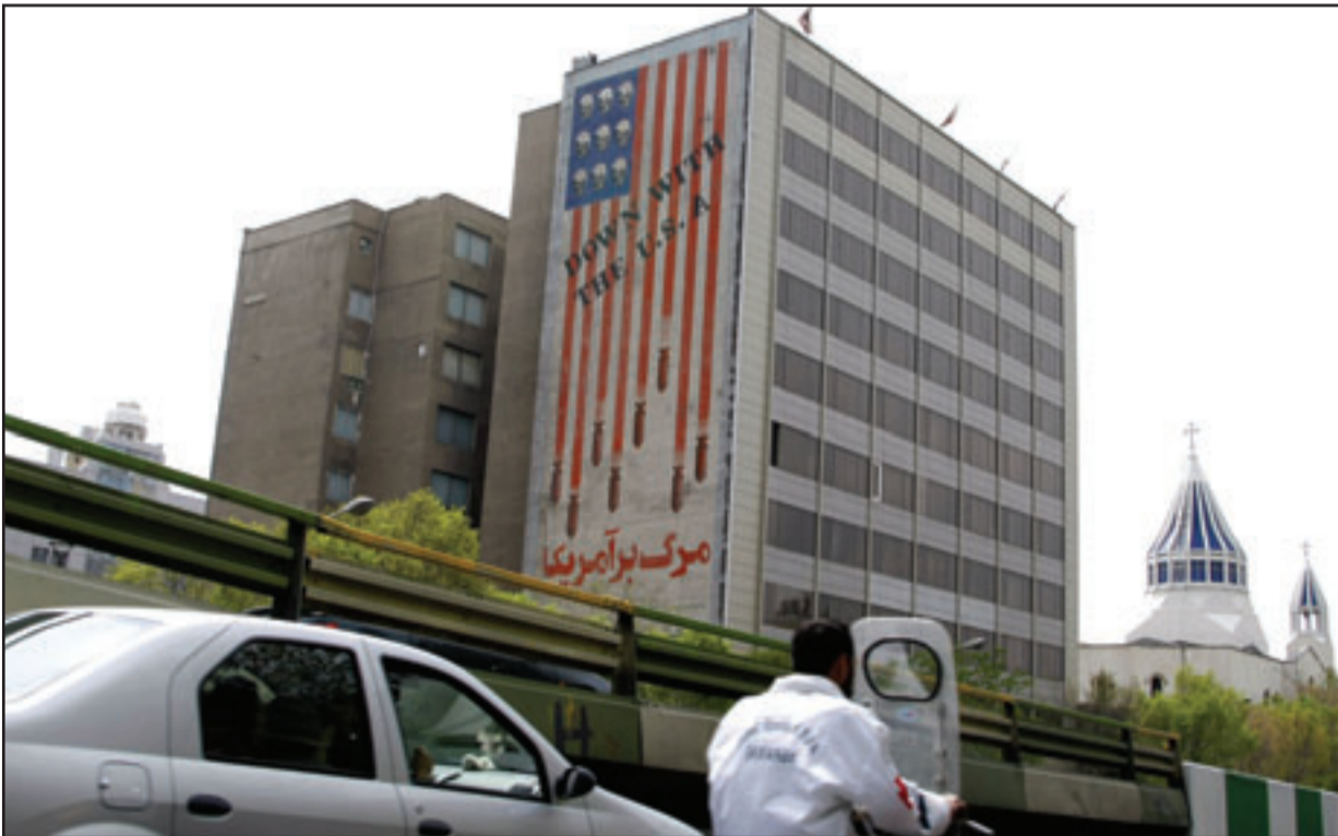
صورة جدارية رسمت على إحدى بنايات طهران تظهر العلم الأمريكي وقد استبدلت نجومه بجماجم وحملت خطوطه قتالين

وتأتي هذه المبادرة من جانب القوى الست قبل يوم من احتفال إيران باليوم النووي الوطني الذي يتوقع المحللون أن يعلن فيه أن إيران اكتفت المرحلة الأخيرة من إنتاج الوقود النووي. وفي إسرائيل كشف النقيب امس أن نتنياهو، تلقى عرضاً مفصلاً أثناء ثلاثة لقاءات مع الأمين العام، الجنرال غابي اشكنازي، وقادة الأجهزة الامنية الاسرائيلية المختلفة، بشأن الخيار العسكري الذي تبنيه اسرائيل حيال البرنامج النووي الايراني، ونقل المحلل البارز في صحيفة «معاريف» الاسرائيلية بين كاسبيت عن مصادر مقربة جداً من رئيس الوزراء قولها ان نتنياهو فوجئ بشكل ايجابي من تقدم الاستعدادات وما جرى حتى الآن، على حد تعبير المصدر، وتابع المحلل الاسرائيلي قائلًا أنه بحسب مصادر امنية رفيعة المستوى في تل ابيب، فإن جهاز الامن الأمريكي مطلع ايضا على الاستعدادات والتدريبات والاجراءات التي يتخذها الجيش الاسرائيلي كي يعرض على الحكومة خياراً عملياً نجحاً لنشل فعالية البرنامج النووي الايراني. وزادت الصحيفة الاسرائيلية قائلة أنه في اثناء الاسابيع الاخيرة، التقى رئيس الوزراء نتنياهو ثلاث مرات على الاقل مع رئيس الاركاز الجنرال غابي اشكنازي، وكذلك مع مسؤولين آخرين في جهاز الامن ومع وزير الدفاع الاسرائيلي ايهود باراك، الذي هدد بعبادة ايران الاف السنين الى الورا، في حال اقدمها على ضرب الدولة العبرية. وحسب المصادر التي وصفها الصحيفة بالمطلعة فإن الدولة العبرية تبني خياراً عسكرياً واسعاً وفعالاً ضد البرنامج النووي الايراني، لافتة الى أنه اذا ما تبين أن العالم يعززم التسليم بالتحول النووي ليران، فسيتكون بوسع اسرائيل اتخاذ خطوات مانعة بذاتها، في اشارة واضحة الى الخيار العسكري.