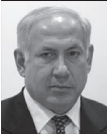
نتنياهو بنى نفسه من اخفاقات اولمرت

■ انقضت تسببي ليفني على منصبها الجديد كرئيسة المعارضة بحماسة مميزة، ولكن جدر بها أن تبطيء الوتيرة وأن تركز على الأهم: بناء كاداميا كحزب الوسط السياسي وكجديل وحيد لسلطة الليكود. خطاب ليفني في الكنيست الاسيوع الماضي، في النقاش حول ترسيم حكومة بنيامين نتنياهو، كان مفعماً بالذخ لخصومها السياسيين وعلى رأسهم يهود باراك، الرجل «الذي حقق رأسماله السياسي عبر تجنيدات مالية للجمعيات ورأساله السياسي عبر العلاقات السياسية»، على ليفني أن تمتنع عن صراعات الوحل بهذا النمط، خشية أن تنصهر مصداقيتها، ففي الصيف فقط كانت عرضت على باراك اياه منصب «النائب الكبير»، في حكومة حاولت تشكيلها. وإذا ما اقتربت من حافة الحكم، فستعين عليها أن تشارك في الائتلاف جزءاً على الأقل من الأحزاب التي جلدتها من على منصة الكنيست. لا ينبغي لرئيس المعارضة أن يعبر عن رأيه في كل موضوع يرجه او في كل سلوك اشكالي للحكومة ورئيسها، من أجل هذا توجد المقاعد الخلفية، التي يجلس عليها النواب العالاشي للاكتشاف والنشر. فلتترك لهم حرب الخنادق وتعتبر فقط عن نفسها في مواضيع وطنية هامة.