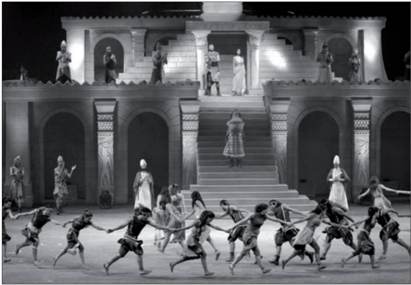
عرض راقص من مسرحية «عودة الفينيقي»

■ الأخوين رحباني تجربة سينمائية رائعة في «بياع الخواتم» وسفر برلك، و«بيت الحارس»، ماذا لم نرى تجربة بالنسبة للجيل الجديد؟ ■ هذه الأفلام الثلاثة أنتجت بين عامي 64 و68 وتعتبر قمة الأفلام العربية، قبل أن تسال لماذا لم يبدأ الجيل الجديد في هذه التجربة، يجب أن تسال لماذا لم بدأ يكمل. بسبب الحرس في لبنان وتراجع السينما والصناعة، لم يحيا أن يعملا أي فيلم لا يتقدمنا فيه، ذلك لأنهم لم يستطيعوا يؤمناتنا متاسبا لعل أفلام ثمانية يتخطان من خلالها ذاتها كما فعلنا في الموسيقى والمسرح، ففضلنا الابتعاد بالنسبة للجيل الثاني، اتكلم عن نفسي لأنني الوحيد