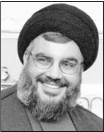
السيد حسن نصر الله