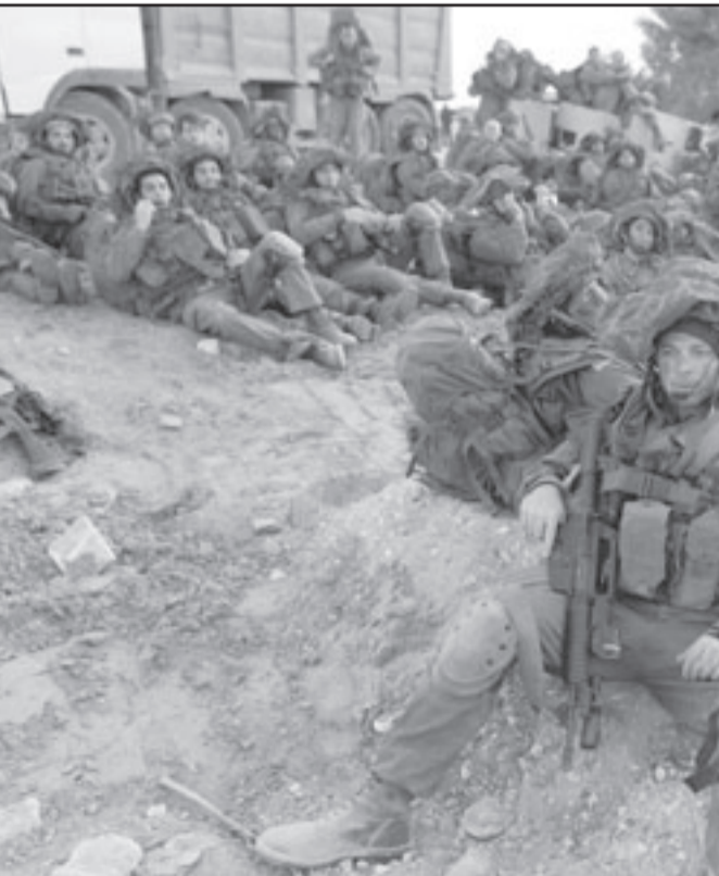
الجيش لا يكتنز للأزمة الاقتصادية

وبالفعل يمكن القول، ان التهديد الايراني قائم وملتق ولكن قرار مهاجمة ايران لا يعتمد بالرء على مشرتبات عسكرية جديدة من هنا لا يتوجب مراقب الدولة، المراقب وجه عبرات واضحة في تقريره الاخير في قضية مليارات الشواكل المخصصة لاجزة الدفاع ضد الصواريخ؛ وان لا تكون هناك حاجة لتكريس المزيد من المليارات في هذه السياسة. ولكن المال رخيص في الجيش الاسرائيلي، هذا الجيش لا يحصر على 4مليارات شيكل اخرى،