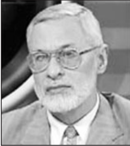
علي صدر الدين البيانوني

وقال البيانوني في مقابلة مع «يونيبيدي برس انترناشيونال»، «نحن لا ننظر إلى الحوار مع النظام والمفاوضة معه على أنها تهمة ندفعها أو أمر معيب نخفيه، بل كنا نعلن دائماً أننا مستعدون لأي حوار وطني جاد يخرج البلاد من أزمتها وقد فاضنا النظام مرات عديدة وأعلننا عن تلك المفاوضات في حينها، ولم مشاركين في التحالف الوطني لتحرير سورية ولا يهتز ذلك التحالف، وكان شركاؤنا في التحالف سياسيين مختصين يركزون على الحركة السياسية ومقتضياتها، فلم يستطع أحد علينا موقفاً أو يزعم أننا خرقتنا ميثاق التحالف».