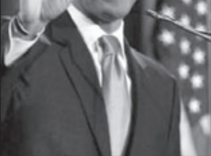
اوباما يحاول ان يقفي بما وعد به

القادمة من افغانستان وقد تمد الباكستان والهند بالنفط من خلال انبوب بمدت لهذه الدول المؤيدة للغرب.