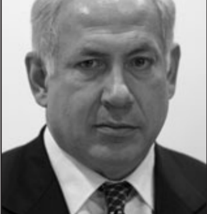
حكومة نتنياهو لا تعارض الحوار الامريكى مع ايران

سيردون بهزة رأس من منصفهم، شكرا جزيلًا، حقًا، شكرا جزيلًا.