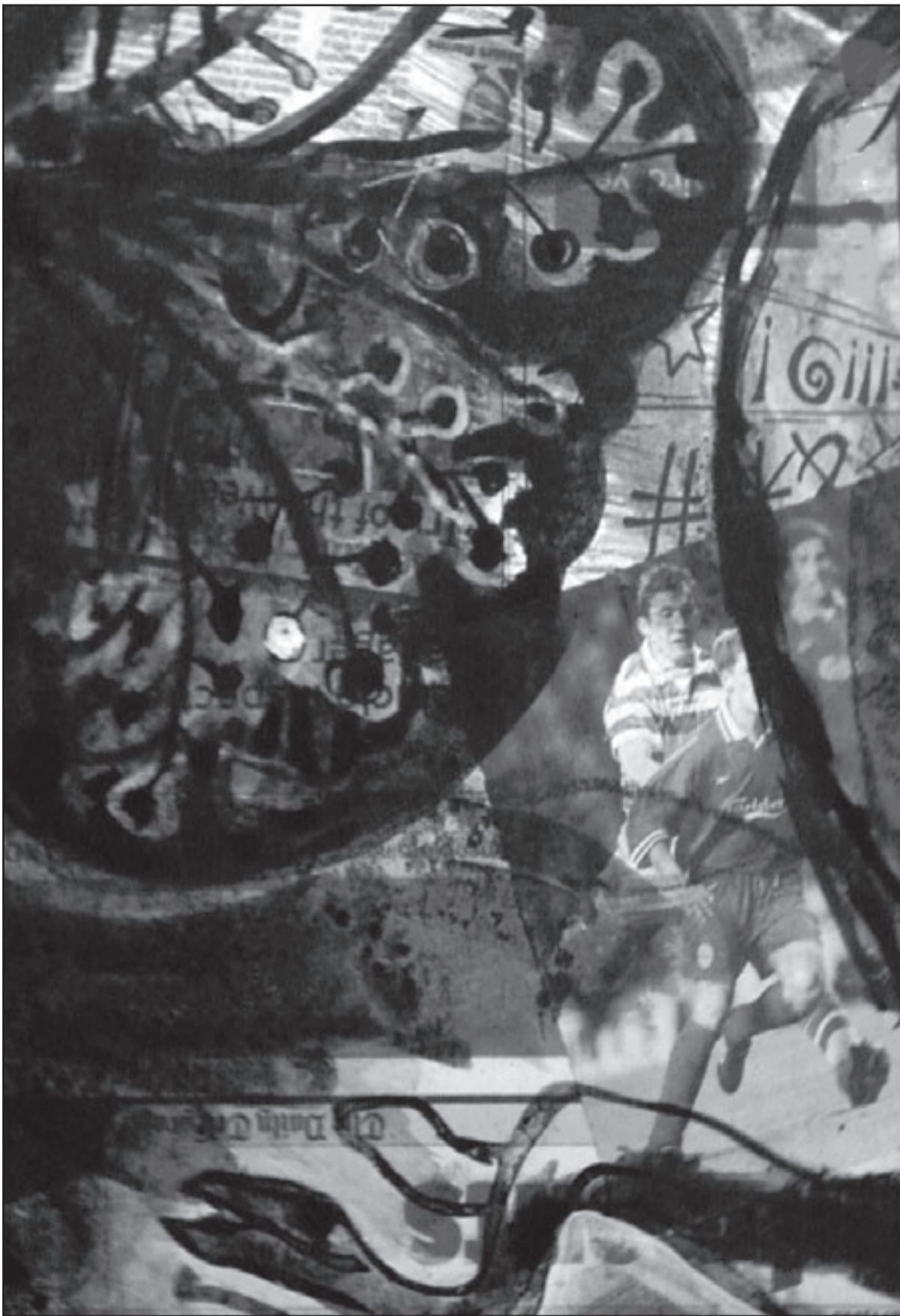
لوحة للفنان (القدس العربي)

حين رأيت جزءاً صغيراً من تجربة (مطر أسود) للفنان العراقي (المقيم في لندن) يوسف الناصر ملأني شعور غامض باتي أعيش لحظة اصطدام كوكبين ببعضهما. وهذا ما كتبه إلى الرسام مياشرة. شيء من هذا القبيل الذي يبدو عصيا على الحواس المباشرة والذي لا ينتج القبول أو الرضى، يقع مثل التوتير الذي ينتج لغة لا يمكن استعادتها مرة أخرى، من خلال تلك الرسوم سعى الناصر إلى أن يمزج ما بين عيه وعاطفته، بين عقله وقلبه، بين رغبته في التعبير عن مزاجه المحطم ومحاولته تجسيد ما جرى لبلده الذي يعيش بعيداً عنه منذ أكثر من ثلاثة عقود. رسوم تختصر موقفا إنسانياً أقل ما يقال عنه أنه فجائعي على المستويين العام والخاص، غير أنها في الوقت نفسه لم تكن مجرد مرث، على الأقل على مستوى الذات الجريحة. كان سؤال الفجيرة أكثر دهاءً ومكراً، فمن خلال تفكيك منا، هو أشبه بعملية طيبة أقدم الناصر على وضع الألم والرسم على طاولة تشريح واحدة، في اللحظة عينها اكتشف الرسام أن النقد الصارم والحكم هو ما يجب أن يقوم به لكي يتحور من عجزه العاطفي؛ نقد الألم الذي يحيط به من كل الجهات الختملة ونقد الرسم الذي عاش حياته كلها من أجله مقاماً الخوض لذلته المسيرة. تفكيك تلك اللحظة المهمة هو ما أعان الرسام على أن يجمع كونا من الشظايا المتناثرة ليصنع منها عجيبة متماسكة، صار يستل منها الخيوط التي تنمهي مع حركة أعصابه، صار الرسم بالنسبة له امرأة لأم لا يمكن تفاديه، فذلك الألم لا يأتي من جهة بعينها بل تعد الطبيعة موضوعاً حين صار التفكير بالألم مزوجاً بالرسم نوعاً من الحل ويداها خلاصاً، تخيل الرسام وهو يباشر الرسم كمن يفكر بالحقاق الهزيمة بالألم أو على الأقل